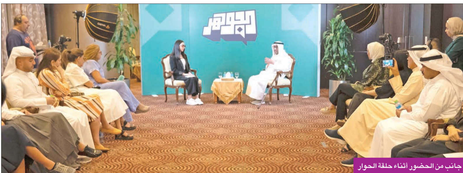
جانب من الحضور أثناء حلقة الحوار

بالجامعة، واستذكر سؤال أحد الصحفيين يومها عما ستضيف إليه الجامعة، وكان جوابه: «أنا من أضيف إليها» واستعرض محطات عمله في المجلس الوطني منذ نشأته كفكرة، وحتى اختياره مقراً لإحدى اللجان، ولاحقاً تأسيسه الأمانة العامة للمجلس، كما تحدث عن عمله لنحو 20 عاماً في مؤسسة عبدالعزيز سعود البابطين الثقافية، حيث أقاموا دورات تدريبية في أكثر من دولة، وأنجزوا عدداً كبيراً من المؤلفات والإصدارات الأدبية والدواوين الشعرية.