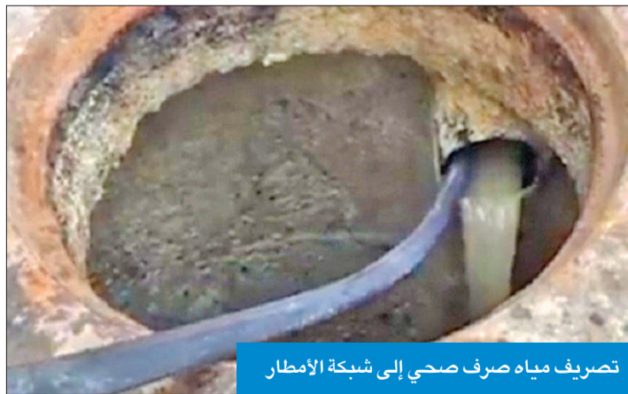
تصريف مياه صرف صحي إلى شبكة الأمطار

ما بين وزارة الأشغال العامة والهيئة العامة للطرق والنقل البري بالقرار رقم 1538 لسنة 2022 حيث تناولت اللجنة قانون حماية البيئة رقم 42 لسنة 2014 وتعديلاته ولوائحه التنفيذية بشأن تحديد تبعية شبكات الأمطار والمجارير، وانتهت اللجنة بان الجهة المعنية بتصميم وإنشاء مخارج الأمطار والشبكات الرئيسية، ومنح القراخيص للربط على الشبكة حالياً هي الهيئة العامة للطرق والنقل البري بعد تأسيسها، وانتقال قطاع هندسة الطرق بكامل مهامه إليها، وهو ما يتعارض مع قانون إنشائها.