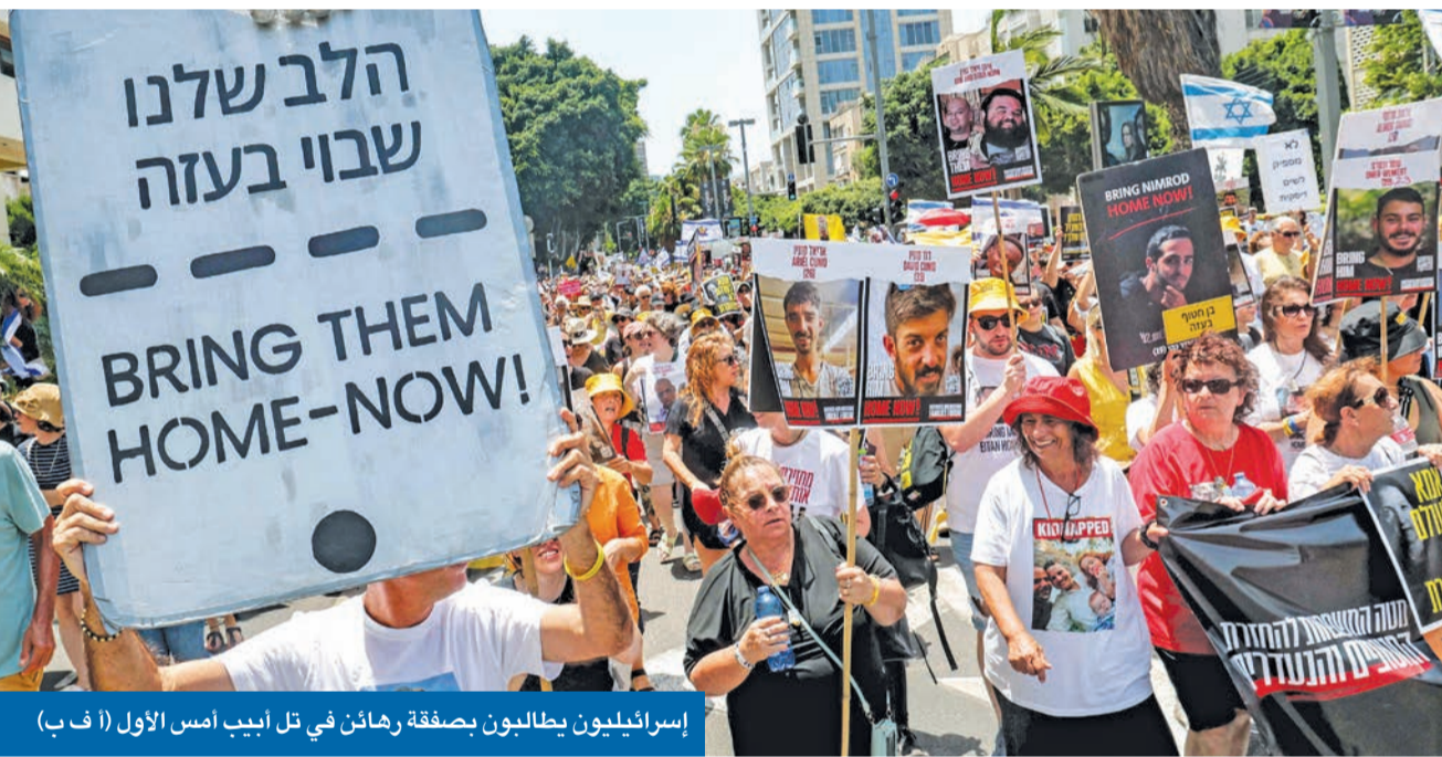
إسرائيليون يطالبون بصفقة رهائن في تل أبيب أمس الأول

نتنياهو يطلب دعم معتدلي «الكنيست» لتمير الاتفاق بعد تهديد بن غفير وسموتريتش بترك حكومته ● التعديلات على مقترح بايدن تتضمن إطلاق 32 محتجزاً في 16 يوماً ضمن المرحلة الأولى ● «حماس» تتشاور مع حلفائها لتحديد تصورها لـ «اليوم التالي» دون حل جناحها العسكري