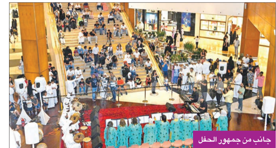
جانب من جمهور الحفل

كما تميزت أزياء الفرقة النسائية باللون الفيروزي المبهج، والنقشات القديمة،