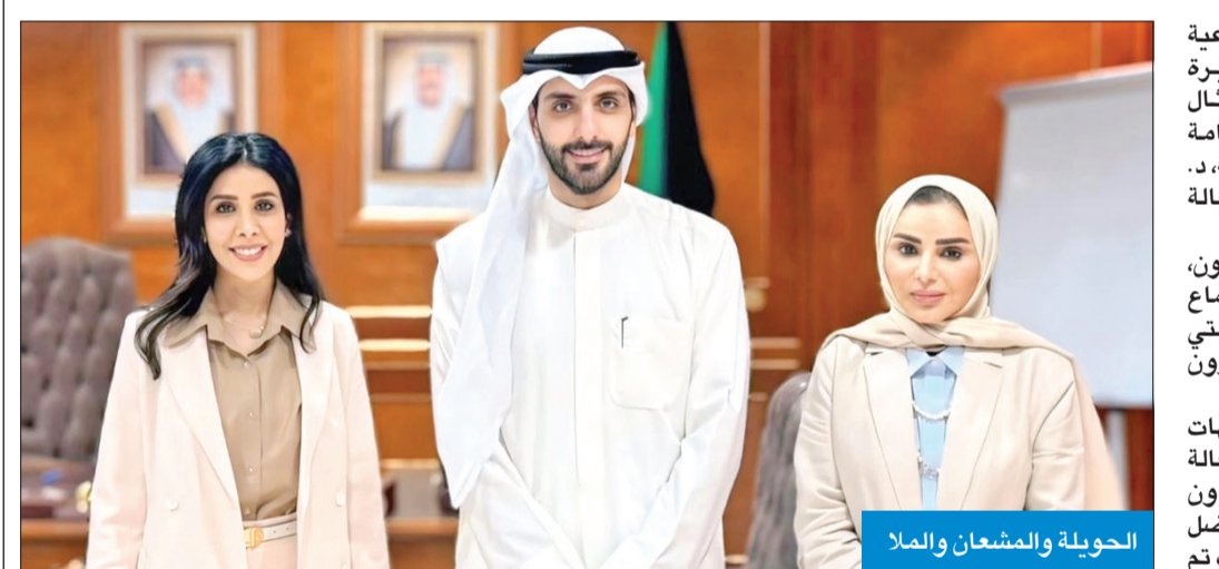
الحويولة والمشعان والملا

الفرق توفير فرصة للفرق التطوعية بالتعاون والعمل المشترك من أجل تحسين المحيط السكني بالتعاون مع وزارة البلدية والجهات ذات الصلة، لتعزيز المسؤولية المجتمعية والتعاون بين أفراد.