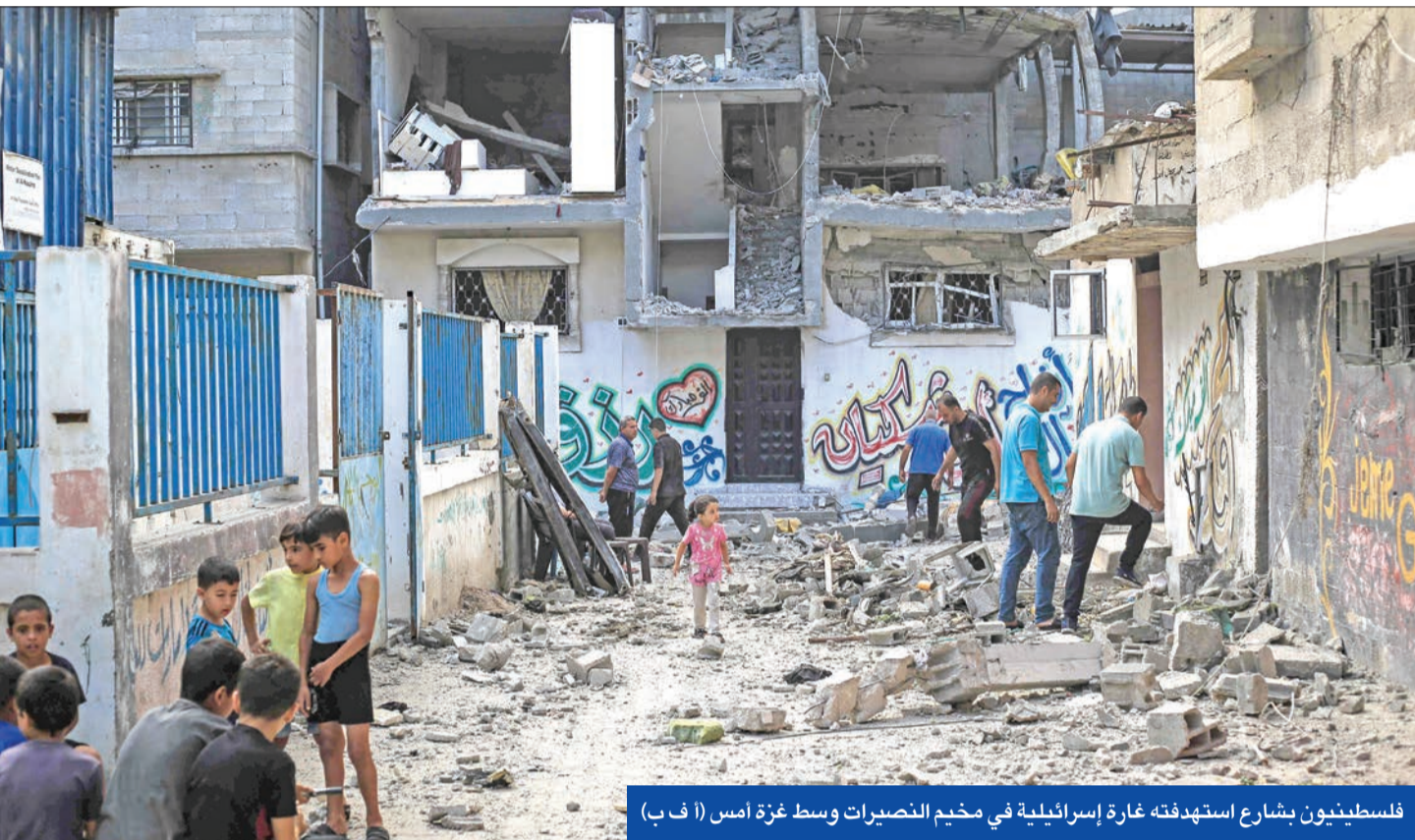
فلسطينيون يشارعون استهداف غزة إسرائيلية في مخيم النصيرات وسط غزة أمس

● تل أبيب ترفض منح ضمانات مكتوبة ● غانتس وأيزنكوت يشجعان نتنياهو على إبرام اتفاق مؤلم