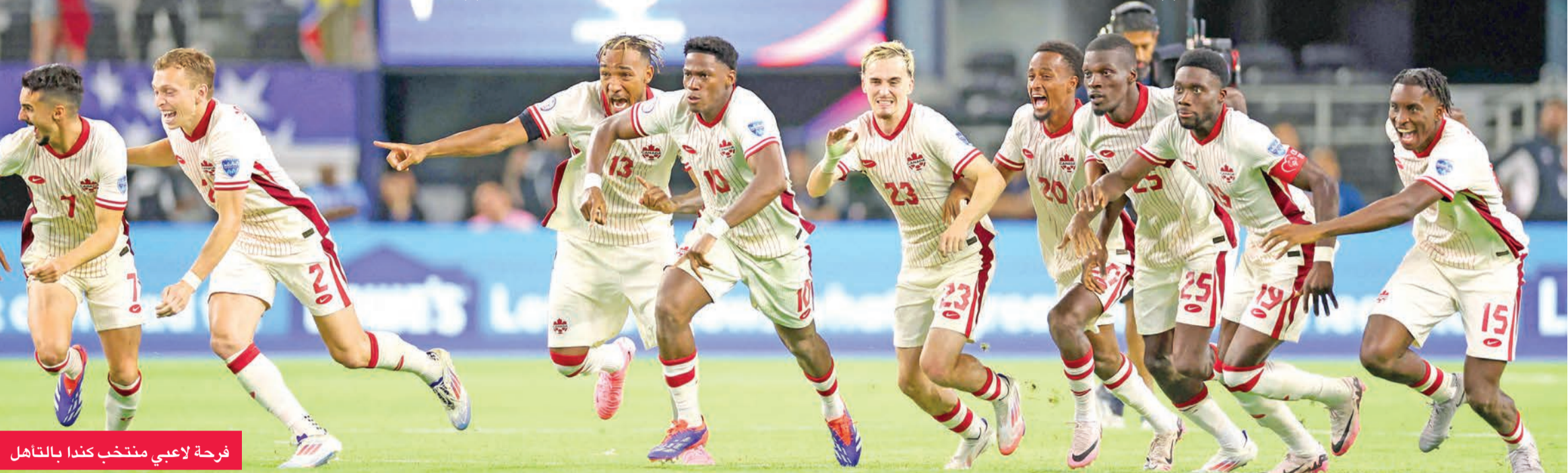
فرحة لاعبي منتخب كندا بالتأهل