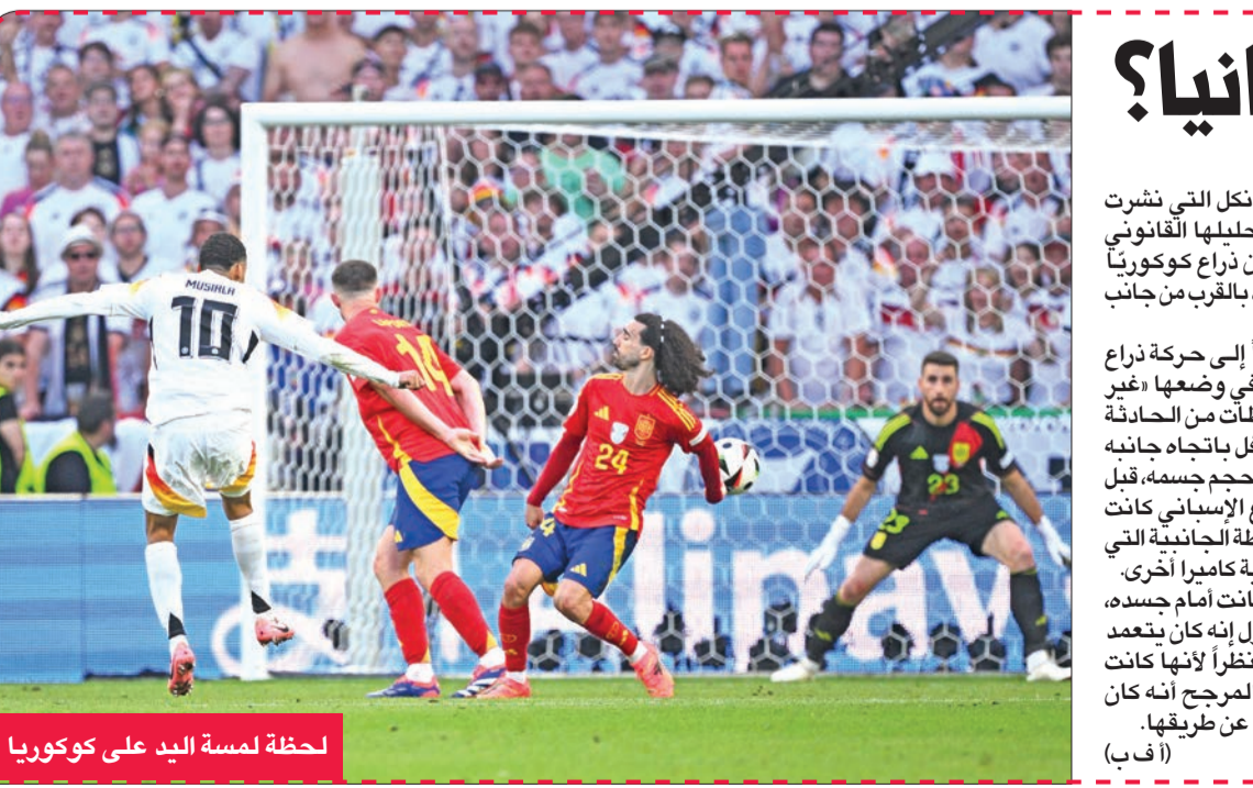
لحظة لمسة اليد على كوكوريا

التي شهدت تتويج المنتخب صاحب الضيافة ببطولة أمم أوروبا، منذ أن أصبحت بطولة كاملة في 1980. وكان المنتخب البرتغالي قريباً من تحقيق