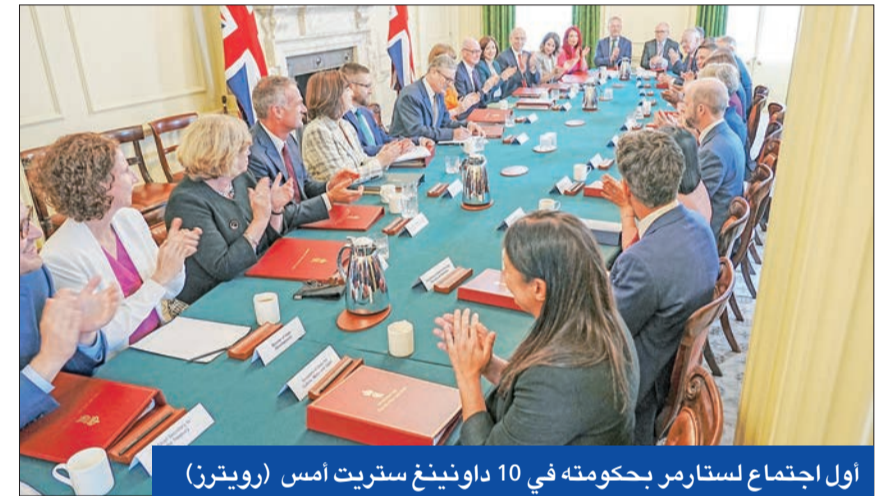
أول اجتماع لستارمر بحكومته في 10 داوونينغ ستريت أمس

تغيير البلاد بل يتطلب عملاً شاقاً وصبوراً وحازماً». وفي أول مؤتمر صحفي له، قال رئيس الوزراء البريطاني، إنه سيحضر قمة حلف الناتو في واشنطن لأنها ستكون من أجل مساندة أوكرانيا. وقال: «واجبنا الأول هو الدفاع عن الوطن وتأكيد مساندتنا للناتو»، وأنهى ستارمر خطبة سلفة ريك سوناك الخاصة بترحيل طالبي اللجوء إلى رواندا قبل حتى إقلاع أي رحلات جوية. بقوله: «مخطط رواندا مات ودفن قبل أن يبدأ. لم يشكل رادعاً أبداً مستعداً للقوارب الصغيرة»، ولست مستعداً لمواصلة حيل لا تشكل رادعاً».