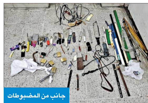
جانب من المصبوطات

استنفرت أجهزة الأمن في محافظة الأحمدية، صباح أمس، إثر تلقيها بلاغاً من مواطن أفاد من خلاله بأن زوج شقيقته غادر معها إلى مملكة البحرين عن طريق البرّ خلال عطلة نهاية الأسبوع، إلا أنه عاد وحده إلى البلاد، ولا يعلم شيئاً عن شقيقته. وقال المبلغ في شكواه، إن ابن