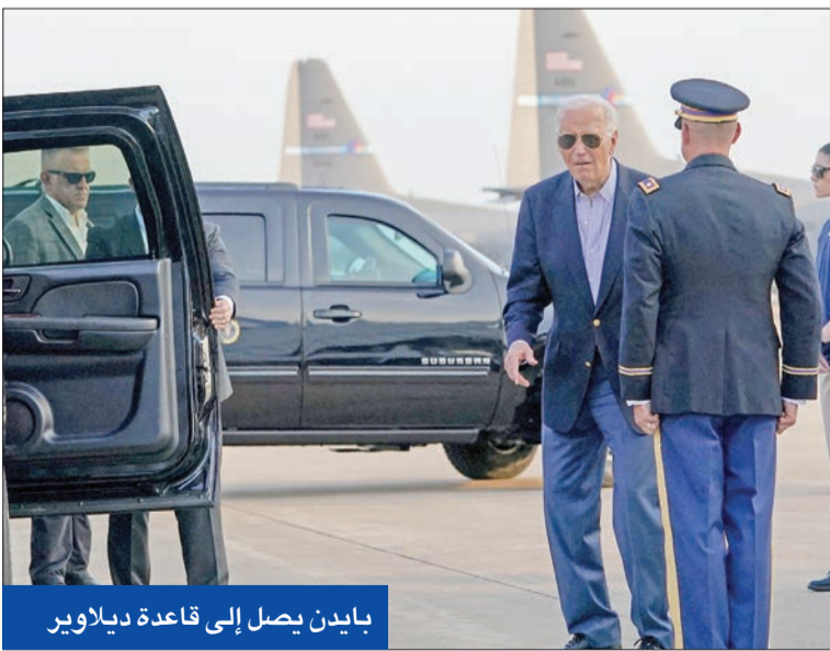
بايدن يصل إلى قاعدة ديلاوير

وصفت وكالة فرانس برس رئيس وزراء بريطانيا الجديد، كير ستارمر، بأنه براغماتي أكثر منه أيديولوجي، تشير إلى أنه على العكس من أغلبية السياسيين في هذا العصر، خاض مسيرة مهنية طويلة ومتميزة، قبل أن يصبح عضواً في البرلمان، حيث تولى العديد من المسؤوليات، بدءاً من محام في مجال حقوق الإنسان إلى مدع عام للدولة. ويعد الزعيم ذو الـ 61 عاماً الشخصية الأكبر سنًا التي تتولى المنصب منذ أكثر من نصف قرن، علماً بأنه عضو منتخب في البرلمان منذ 9 سنوات فقط. في المقابل، يصفه منتقدون بأنه انتهازي، غالباً ما يبذل مواقفه، ويشدون على أنه لا يملك رؤية واضحة للبلاد. وتقول «فرانس برس» إنه في بعض الأحيان، يبدو مشجع فريق أرسلان الذي جاء إلى السياسة في وقت متأخر من حياته، غير مرتاح في دائرة الضوء، ويكافح من أجل التخلص من صورته العامة باعتباره شخصية مملّة. وتضيف أن انتصاره بعزفون بأنه يفكر إلى الكاريزما التي كان يتمتع بها أسلافه، لكنهم يقولون إن نقطة قوته تكمن في أن حضوره يوحي الاطمئنان، في أعقاب سنوات مضطربة من حكم المحافظين. ويعد ستارمر الذي سُمّي على اسم مؤسس حزب العمال، كير هاردي، الأكثر انتماءً إلى الطبقة العاملة من بين الذين تعاقبوا على رئاسة الحزب المعارض منذ عقود. وقال ستارمر للمخابرين مراراً خلال جولته الانتخابية «والذي كان يعمل في مصنع للادوات، وأمي كانت ممرضة»، رفضاً لتصوير منافسيه له أنه ينتمي إلى نخبة لندن الليبرالية المتعجرفة. ويسلط فصل يساريين من الحزب خلال زعامته الضوء على جانب قاس