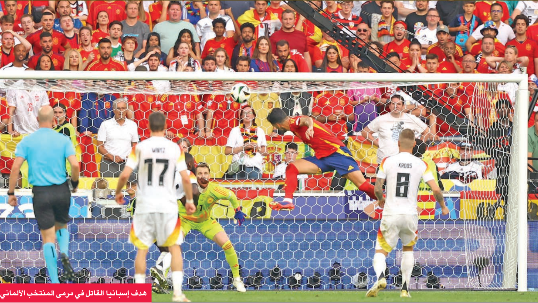
هدف إسبانيا القاتل في مرمى المنتخب الألماني

بلغ المنتخب الإسباني الدور نصف النهائي لبطولة كأس أوروبا 2024 لكرة القدم، بعد فوزه على نظيره الألماني (صاحب الضيافة) 2-1 بالوقت الإضافي، بعدما انتهى الوقت الأصلي للقاء بالتعادل بهدف لمتله، أمس الأول، في الدور ربع النهائي للبطولة.