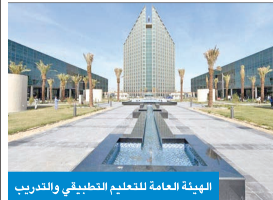
الهيئة العامة للتعليم التطبيقي والتدريب

تعبئة وإرسال نماذج «E-Form» حتى يتسنى لمكاتب التسجيل حل مشكلاتهم.