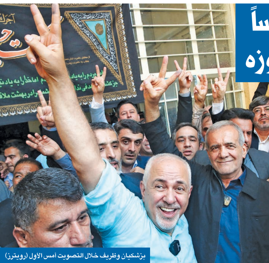
بزشكيان وظريف خلال التصويت أمس الأول

وحسب المصدر، فإن وزير الخارجية الإيراني السابق محمد جواد ظريف، الذي يمكن أن يُعيّن نائبا للرئيس، شق هذا اللقاء مع صديقه القديم وزير الخارجية السابق 02