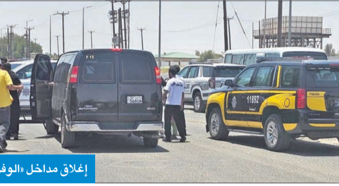
إغلاق مداخل «الوفرة الزراعية»

علق اللواء عبدالله سفاح على بعض المقاطع التي نُشرت على مواقع التواصل، والتي تُظهر القوات الأمنية وهي تدقق على الأوراق الثبوتية للعمال في فناء أحد المساجد، بأن رجال الأمن ارتأوا أن يتم التفتيش بعد صلاة الجمعة مباشرة، وأن يكون داخل الفناء الخارجي للمسجد، حرصاً على سلامة العمال من حرارة الجو تحت الشمس.