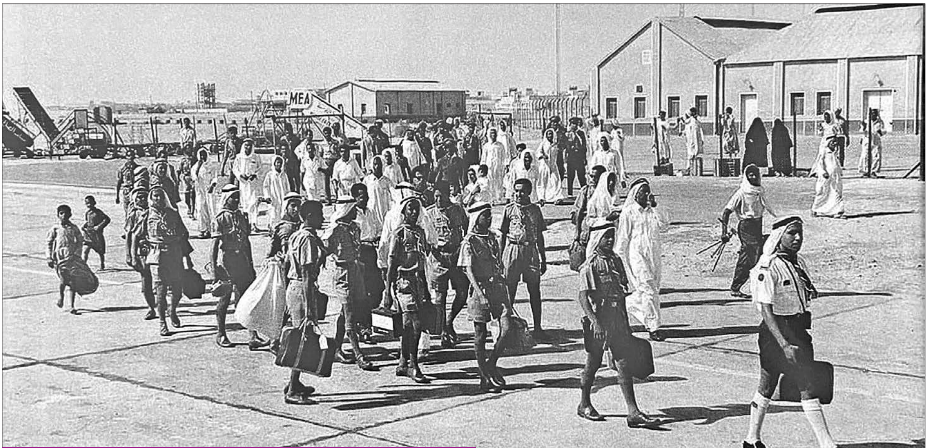
أعضاء فريق الكشافة الكويتي يستعدون لبعث الطائفة بكويت بمنطقة الزهامة عام 1959

وأضاف: «من الأعمال الحكيمة ضمن البرنامج التعليمي إنشاء مطبخ مركزي كبير يقدم 14000 وجبة في منتصف النهار كل يوم. أعتقد أنه أحد أكبر المطابخ في العالم، عندما يتم تشغيله،