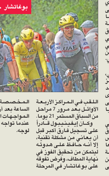
بوغاتشار خلال السباق

نجح السلوفيني تادي بوغاتشار في الحفاظ على صدارته لطواف فرنسا بصعوبة، بعد المرحلة السابعة المخصصة للسباق ضد الساعة أمس الأول، والتي توج بها مطارده البلجيكي ريمكو إيفينديبول بين نوي-سان جورج وجيفري-شامبرتين في بورغوندي. وحقق الدراج البلجيكي، البالغ 24 عاماً والفائز ببطولة العالم للسباق ضد الساعة، فوزه الأول في إحدى مراحل الطواف، متقوفاً على بوغاتشار الذي حل ثانياً بفارق 12 ثانية. وحل المخضرم الكرواتي بريموز ووليتش ثالثاً بفارق 34 ثانية، والدنماركي يونس فينغيفارد حامل اللقب رابعاً بفارق 37 ث. وادت نتيجة المرحلة إلى بقاء الدراجين الأربعة المنافسين بقوة على