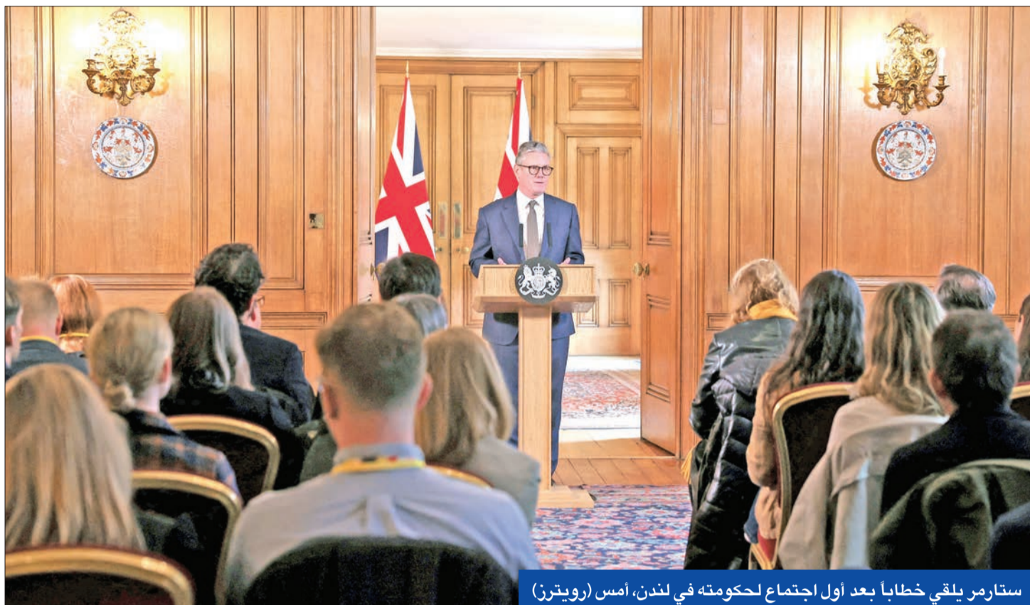
ستارمر يلقي خطاباً بعد أول اجتماع لحكومته في لندن، أمس

وحصل حزب العمال على نحو 34 في المئة من الأصوات، في تراجع عن 2019، والأدنى على الإطلاق في الحصول على أغلبية. وفي الوقت ذاته، بلغت نسبة المشاركة أقل بقليل من 60 في المئة، وهي الأدنى منذ عام 2001، ما يشير إلى لامبالاة على نطاق واسع. ويرى كريس هوبكنز، مدير الأبحاث السياسية في مؤسسة سافانقا لاستطلاعات الرأي أنه «على الرغم من أن هذا لا ينبغي أن يطغى على فوز حزب العمال اليوم، فإنه قد يشير إلى بعض التحديات التي قد يواجهها حزب العمال». وأوضح «ببساطة، من المحتمل ألا يتمكنوا من إعادة أكثر من 400 نائب في الانتخابات المقبلة بأقل من 40 في المئة من الأصوات».