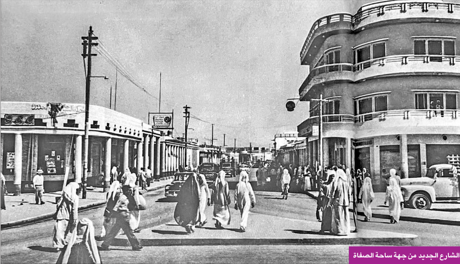
الشارع الجديد من جهة ساحة الصفاة

مشاهدات ضابط مهندس بريطاني بالجمعية الملكية لوسط آسيا خلال فترة الخمسينيات