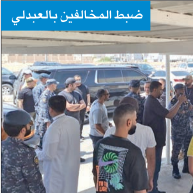
ضبط المخالفين بالعبدلي

حملات بالجهراء والوفرة والعبدلي في عطلة الأسبوع ضبطت 115 مخالفاً