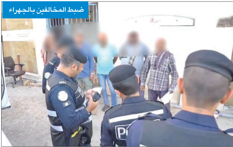
ضبط المخالفين بالجهراء

وبدأت الحملات مساء الخميس بحملة تفتيش على مخالفي قانون الإقامة في محافظة الجهراء، أسفرت عن ضبط عدد منهم، وتمت إحالتهم إلى جهة الاختصاص لاتخاذ الإجراءات