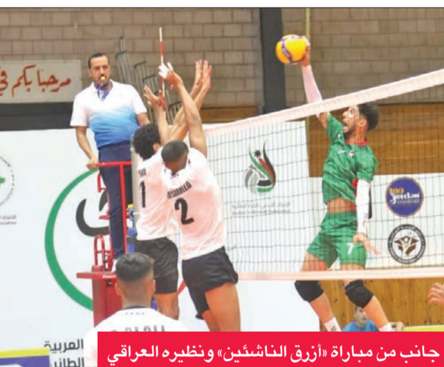
جانب من مباراة «أزرق الناشئين» ونظيره العراقي