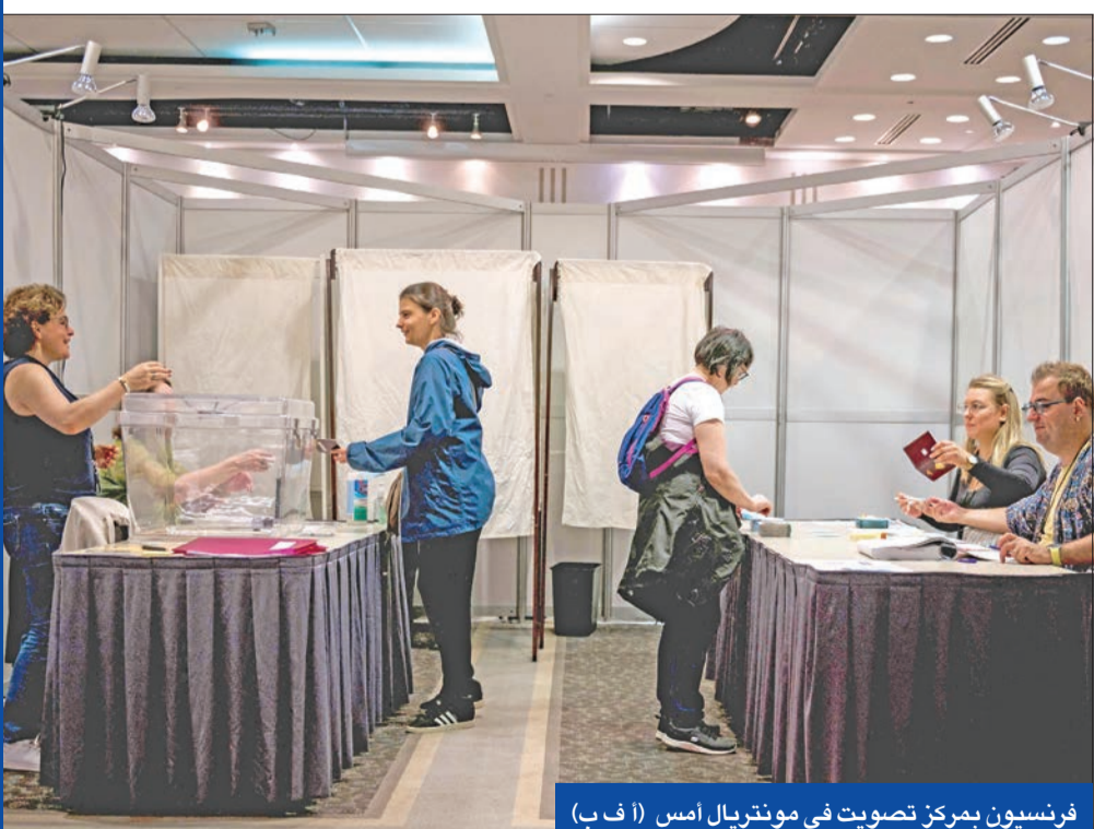
فرنسيون بمرکز تصويت في مونتريل أمس (أ ب ف)

3 سيناريوهات أمام ماكرون للحكومة: ① وحدة وطنية ② أغلبية متحركة ③ تكنوقراط