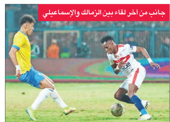
جانب من آخر لقاء بين الزمالك والإسماعيلي

بعدما تعادل مع فاركو بهدف لكل فريق في المباراة السابقة، ونفس الأمر بالنسبة للإسماعيلي، الذي خسر أمام سيراميكا بهدف دون رد. ويغيب أكثر من لاعب عن الزمالك أمام الإسماعيلي، أبرزهم أحمد سيد «زيزو»، الذي سينضم إلى منتخب مصر الأولمبي، استعداداً للمشاركة