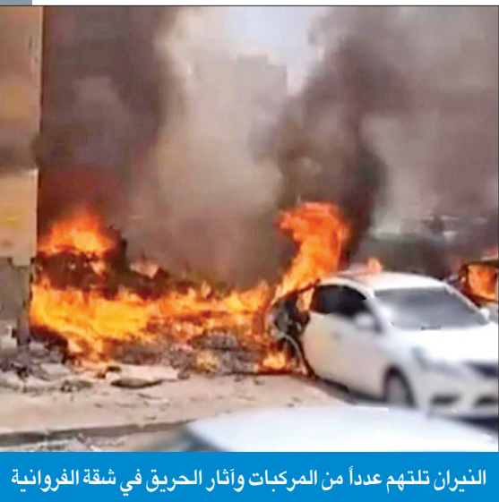
النيران تلتهم عدداً من المركبات وأثار الحريق في شقة الفروانية

فرق الإطفاء تنقذ شخصاً علق في مركبته في بر الوفرة