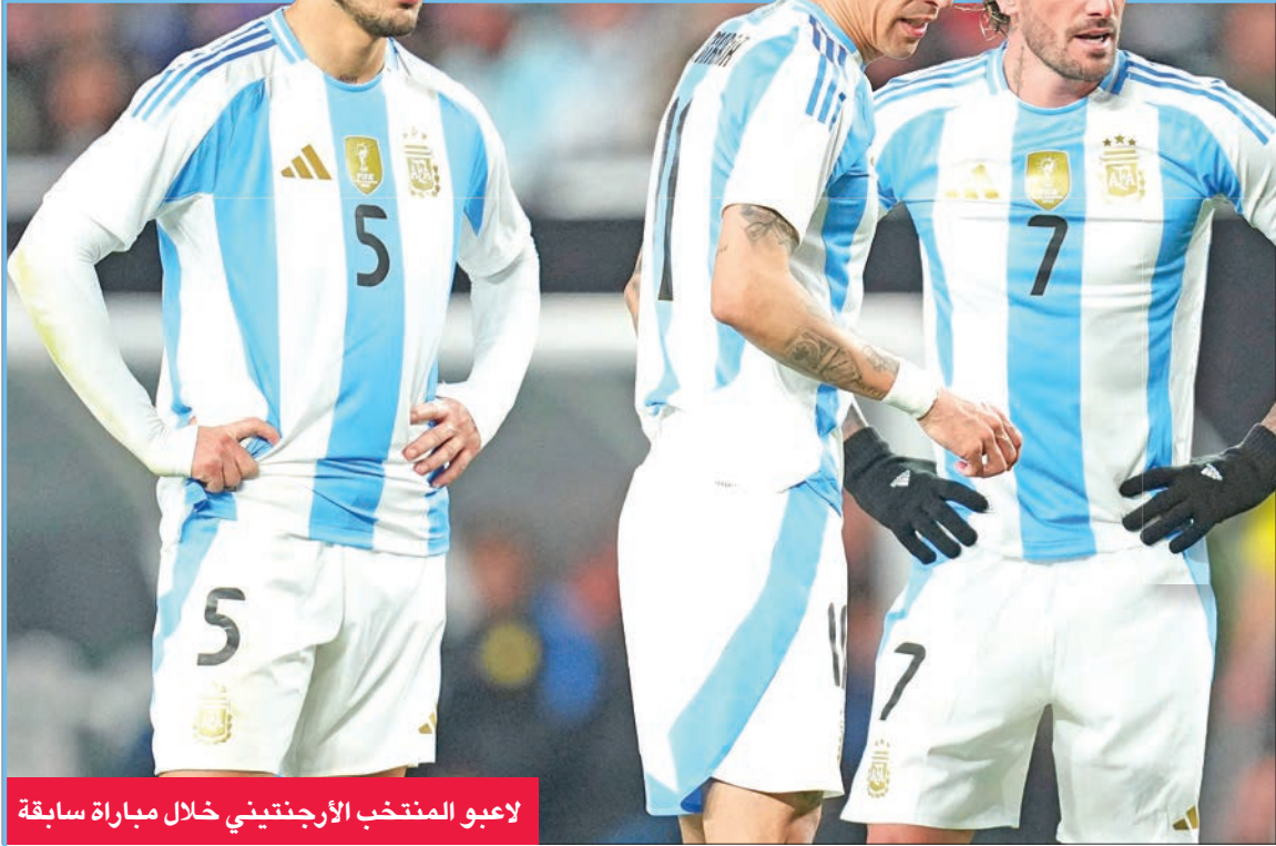
لاعبو المنتخب الأرجنتيني خلال مباراة سابقة

في كوبا أميركا 2024، التي ستعقد في كولومبيا، حيث ستشارك فيها 16 منتخباً من أمريكا الجنوبية، بالإضافة إلى منتخب الأرجنتين. المباراة ستعقد في مدينة كالي، وهي واحدة من المدن التي ستستضيفها البطولة. المباراة ستعقد في الساعة 19:00 بتوقيت مكة المكرمة. المباراة ستعقد في الساعة 19:00 بتوقيت مكة المكرمة. المباراة ستعقد في الساعة 19:00 بتوقيت مكة المكرمة.