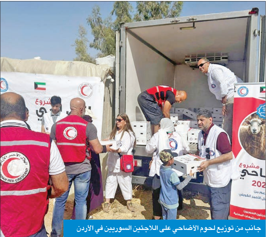
جانب من توزيع لحوم الأضاحي على اللاجئين السوريين في الأردن

ولفت إلى أن الجانب الإيراني أبلغ الأميركيين أن الانسحاب إلى شمال الليطاني لم يعد مطلباً مقبولاً من الحزب، وأن إقامة منطقة آمنة يقتضي ابتعاد القوات الإسرائيلية عن الحدود، وأن عمليات الحزب ضد إسرائيل مكفولة بالقوانين الدولية، لأنها تحتل مزارع شيعا اللبنانية، وأنه لا يمكن الموافقة على تعزيز قوات اليونيفيل مادامت هذه القوات غير موجودة في شمال إسرائيل.