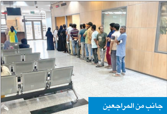
جانب من المراجعين

ومبارك الكبير، مشيراً إلى أن هناك إقبالاً كبيراً من المخالفين لإنجاز معاملاتهم لمغادرة البلاد، مشيراً إلى أن هناك تعاوناً كبيراً أيضاً من قبل سفارات بلدان المخالفين التي أخذت بإصدار الجوازات المنتهية لرعاياهم، حتى يتمكنوا من تعديل أوضاعهم.