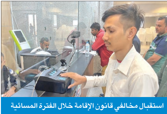
استقبال مخالفات قانون الإقامة خلال الفترة المسائية

وقال مصدر أمني لـ «الجريدة» إن المعاملات التي استقبلتها الإدارة في اليوم الأول للدوام بعد إجازة عيد الأضحى هي إصدار جوازات السفر للمواطنين، وكذلك بعض المعاملات المتعلقة بإضافات الجنسية، أو مراجعة إدارة مباحث الجنسية والجوازات، لافتاً إلى أن فترة العمل الصباحية لم تشهد أي ازدحامات من قبل المراجعين، وكانت الأغلبية منهم في قسم