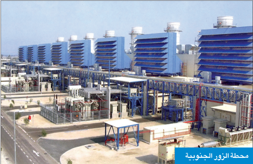
محطة الزور الجنوبية

محطات للطاقة تستوعب تلك التوسعات، الأمر الذي وضع وزارة الكهرباء في أزمة نقص طاقة حقيقية تزداد خلال السنوات القادمة بشكل تدريجي. وأشارت إلى أنه بالإضافة إلى عدم وجود مشاريع لمحطات جديدة أدخلت خلال السنوات السابقة، تعاني الوزارة عدم إدخال نحو 2000 ميغاواط، بسبب تعطل مناقصات الصيانة خلال الفترة الماضية، الأمر الذي دفعها إلى اللجوء للربط الخليجي لشراء 500 ميغاواط تم الإعلان عنها أخيرا، واستعانت بها الوزارة أمس، حيث أدخلت للشبكة 400 ميغاواط. وعقدت الوزارة اجتماعا موسعا أمس، لمناقشة وضع الشبكة الكهربائية في البلاد، وآلية التعامل مع أزمة نقص الطاقة الكهربائية مع ارتفاع الأحمال وتخطيها 16 ألف ميغاواط، في ظل وجود عجز للطاقة، ويتوقع أن تصل الأحمال خلال الصيف الجاري إلى 17600 ميغاواط.