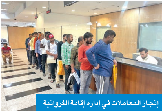
إنجاز المعاملات في إدارة إقامة الغروانية