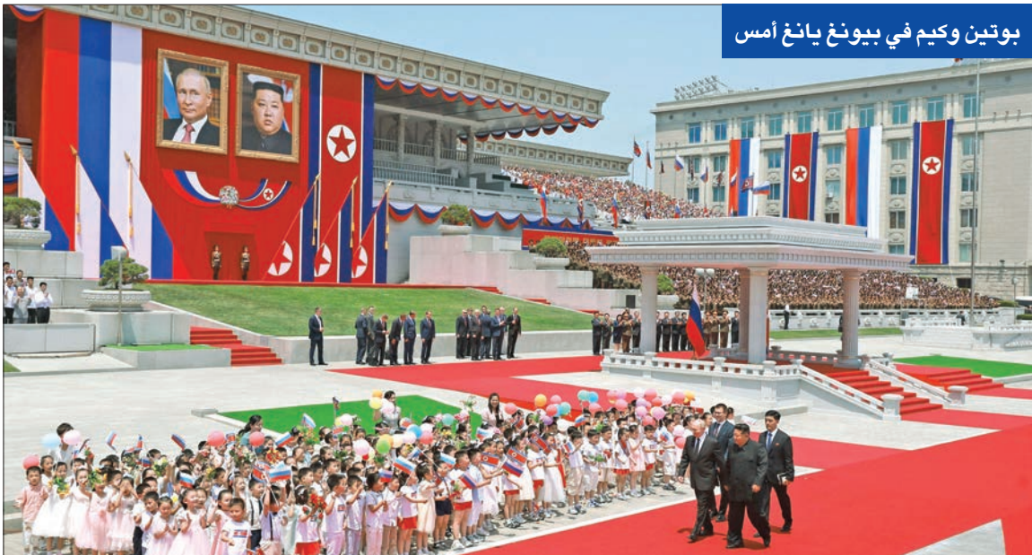
بوتين وكيم في بيونغ يانغ أمس