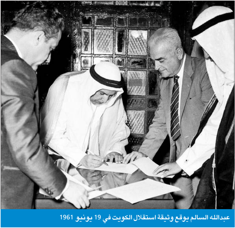
عبدالله السالم يوقع وثيقة استقلال الكويت في 19 يونيو 1961

بعث رئيس مجلس الوزراء سمو الشيخ أحمد عبدالله ببرقية تهنئة إلى رئيس جمهورية جنوب إفريقيا الصديقة سيريل رامافوزا، ضمنها سموه خالص تهانيه بمناسبة إعادة انتخابه رئيساً لجنوب إفريقيا لولاية رئاسية جديدة.