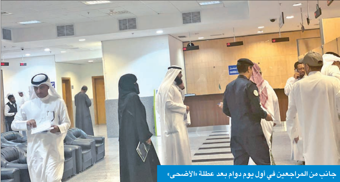
جانب من المراجعين في أول يوم دوام بعد عطلة «الأضحى»

● «الشؤون»: 21% إجازات رسمية وطارئة و7% غيابات... ولا مرضيات