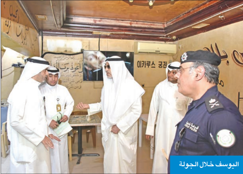
اليوسف خلال الجولة

استقبل صاحب السمو أمير البلاد، الشيخ مشعل الأحمد، بقصر بيان صباح أمس، سمو ولي العهد الشيخ صباح الخالد. كما استقبل سموه، رئيس مجلس الوزراء سمو الشيخ أحمد عبدالله. من جهة أخرى، بعث سموه، ببرقية تهنئة إلى رئيس جمهورية جنوب إفريقيا الصديقة، سيريل رامافوزا، عبر فيها سموه عن خالص تهانيه بمناسبة إعادة انتخابه رئيساً لجمهورية جنوب إفريقيا لولاية رئاسية جديدة. وتمنى سموه له كل التوفيق والسداد وموفور الصحة والعافية، ولجمهورية جنوب إفريقيا وشعبها الصديق المزيّد من الرقي والأزدهار.