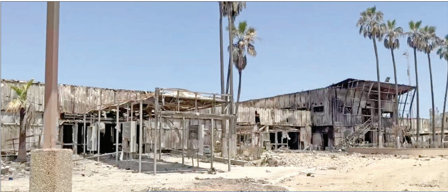
مشهد عام يُظهر تدمير صالة ومرافق الجانب الفلسطيني من معبر رفح بشكل كامل أمس

تسبب فيديو نشره رئيس الوزراء الإسرائيلي، بنيامين نتنياهو، ينتقد فيه إدارة الرئيس الأميركي جو بايدن، بسبب ما وصفه بـ«تأخير إرسال شحنات أسلحة» لبلده، في إغضاب البيت الأبيض الذي ردّ بإلغاء اجتماع استراتيجي لبحث تطورات حرب غزة والتهديدات الإيرانية. في حين حذّر الجيش الإسرائيلي من صعوبة التحديات التي تواجهه في عملية رفح.