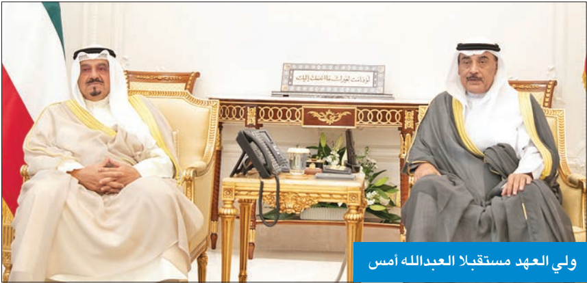
ولي العهد مستقبلاً الأمير

الصديقة، سيريل رامافوزا، ضمنها سموه خالص تهانيه بمناسبة إعادة انتخابه رئيساً لجمهورية جنوب إفريقيا لولاية رئاسية جديدة، متمنياً سموه له كل التوفيق والسداد.