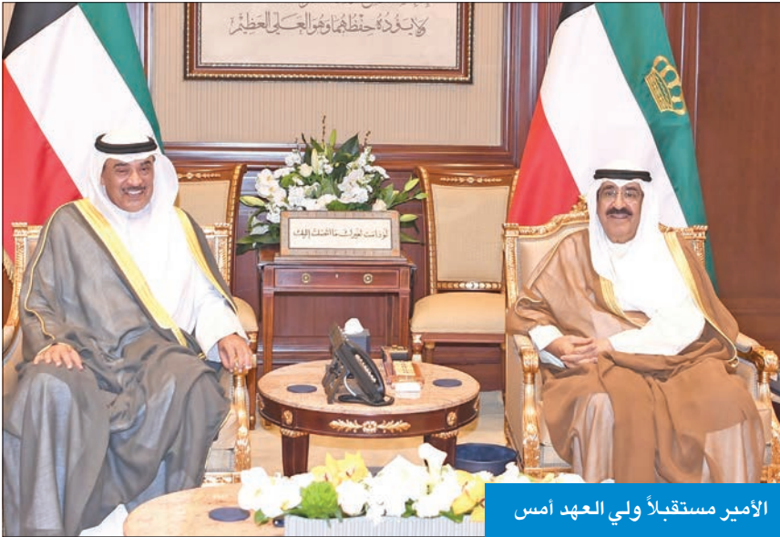
الأمير مستقبلاً ولي العهد أمس

الصديقة، سيريل رامافوزا، ضمنها سموه خالص تهانيه بمناسبة إعادة انتخابه رئيساً لجمهورية جنوب إفريقيا لولاية رئاسية جديدة، متمنياً سموه له كل التوفيق والسداد.