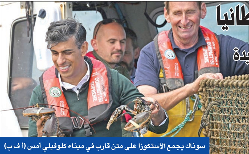
سوناك يجمع الاستكوزا على متن قارب في ميناء كلوفيلي أمس (أ ف ب)

وفي حين تمثل تصريحات المسؤول الإسرائيلي حلحلة بموقف حكومة نتنياهو التي عارضت خطة بايدن بشكل علني دون أن تصل إلى حد رفض الخطة التي يراهن البيت الأبيض عليها لاختتام الحرب، التي تسببت بمقتل 37372 فلسطينياً حتى الآن، ذكرت صحيفة «واشنطن بوست» أن مسؤولين ديمقراطيين بارزين في «الكونغرس» اتفقا على توقيع صفقة تمنح إسرائيل 50 طائرة من طراز «إف-15»