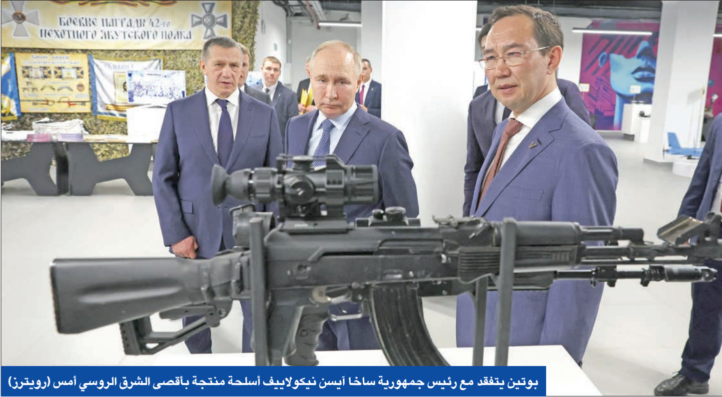
بوتين يتفقد مع رئيس جمهورية ساخا آيسن نيكولايف أسلحة منتجة بأقصى الشرق الروسي أمس

على وقع توتر عسكري فوق العادي بين الكوريتين، استبق الرئيس الروسي فلاديمير بوتين زيارة استثنائية لكوريا الشمالية بالتصديق على مسودة اتفاقية للشراكة الاستراتيجية الشاملة، سيتم توقيعها في لقائه المرتقب مع الزعيم كيم جونج أون. وقيل لقائه الزعيم كيم، كتب بوتين، في مقال بصحيفة «رودونغ شينمون» الرسمية ونشرت وكالة الأنباء الكورية الشمالية وموقع الكرملين: «نحن نقدر عالياً دعم كوريا الشمالية الثابت والقوي للعمليات العسكرية الروسية الخاصة بآوكرانيا، وتضامنها المستمر معنا في القضايا الدولية الكبرى»، مضيفاً: «نحن نعمل بنشاط على تطوير شراكة متعددة الأوجه وتوسيع تعاوننا المتبادل والمتساوي وتطوير آليات الدفع التي لا يسيطر عليها الغرب».