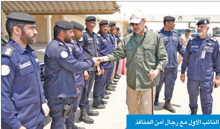
النائب الأول مع رجال أمن المنافذ