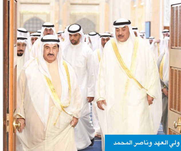
ولي العهد وناصر المحمد

الأضحى المبارك بمختلف محافظات البلاد، وقد توافد المصلون إلى المساجد والمصليات والساحات ومراكز الشباب والملاعب الرياضية النموذجية بالدولة التي حددها وزارة الأوقاف والشؤون الإسلامية لأداء الصلاة، مهنيين بعضهم بحلول عيد الأضحى المبارك. العهد ببرقية تهنئة إلى رئيس أيسلندا، غودني جوهنسون، ضمنها سموه خالص تهانئه بمناسبة العيد الوطني لبلاده، راجياً له دوام الصحة والعافية.