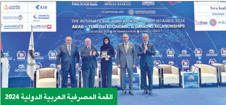
القمة المصرفية العربية الدولية 2024

المناخية والأمن الغذائي، وتطور النمو الاقتصادي العالمي والسياسات النقدية، والخدمات المصرفية الرقمية. أشار إلى أن «KIB» يسعى إلى المساهمة في تعزيز ونيرة التنمية الاقتصادية بالكويت والعالم العربي، ومن أجل تحقيق هذا الهدف، يواصل البنك المشاركة في المحافل الاقتصادية ورعاية الفعاليات الحيوية، خاصة تلك التي ينظمها اتحاد المصارف العربية على مدار العام.