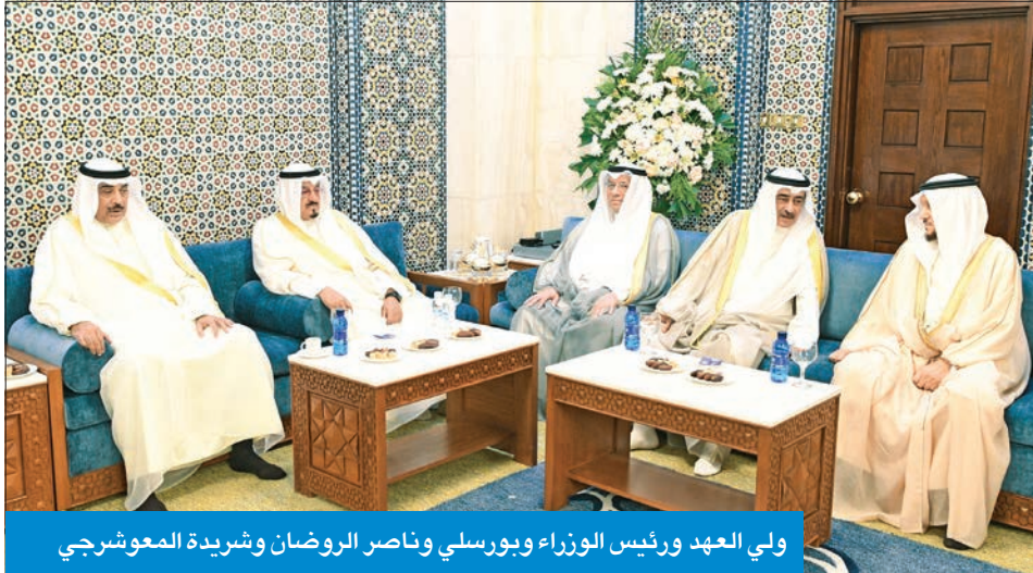
ولي العهد ورئيس الوزراء وبورسلي وناصر الروضان وشريدة المعوشي

سموه ثمن الخطوات الوثابة للتوسعة والتقنيات الحديثة في المشاعر لتيسير أداء المناسك