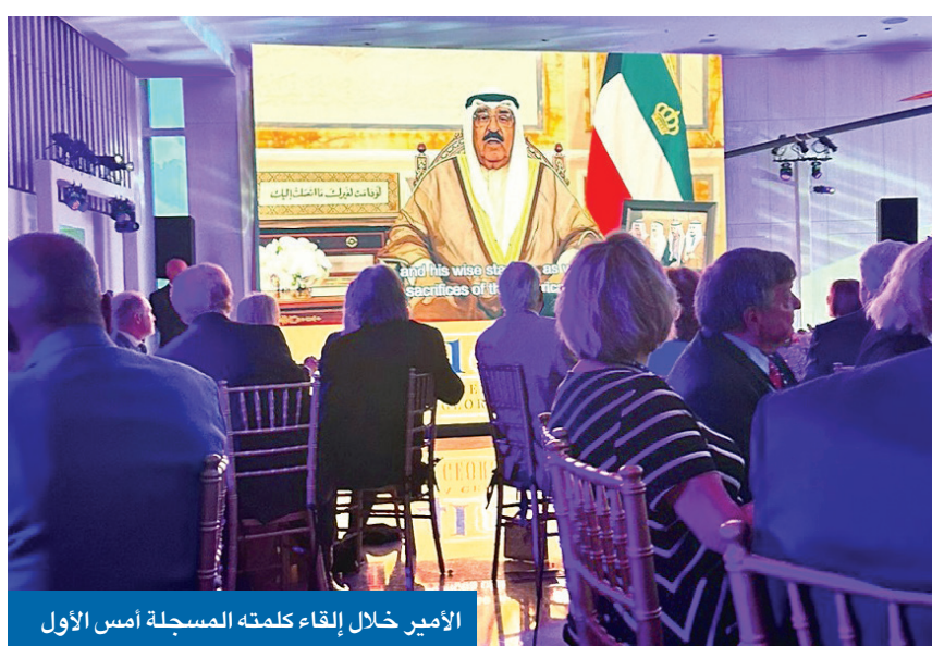
الأمير خلال إلقاء كلمته المسجلة أمس الأول

سموه شكرها على دعوة الكويت لمشاركتها إحياء الذكرى المئة لميلاد بوش الأب • مواقف الرئيس الراحل وتضحيات الجنود الأميركيين من أبرز الصفحات في تاريخ العلاقات بين البلدين