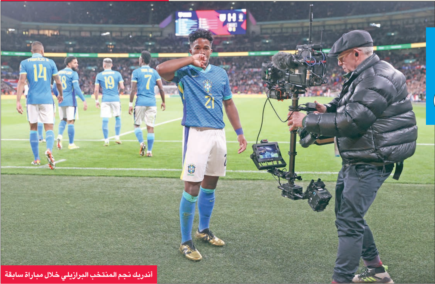
أندريك نجم المنتخب البرازيلي خلال مباراة سابقة