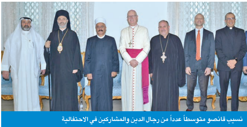
نسب قانصو متوسط عدداً من رجال الدين والمشاركين في الاحتفالية

قاصو: العيد رسالة لتهديب النفس وتنقية القلب وتعزيز الروحية