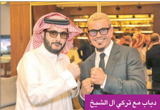
دياب مع تركي آل الشيخ

(الرياض)، بحضور أكبر عدد من نجوم الفن في مصر والوطن العربي.