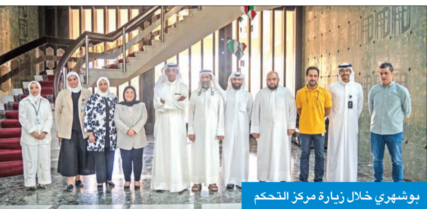
بوشهري خلال زيارة مركز التحكم

إزالة جميع العقبات لإنجاز المشاريع التنموية