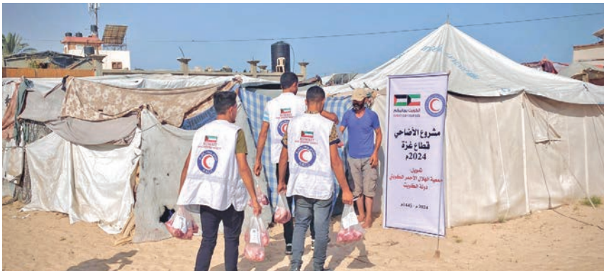
متطوعو الجمعية يوزعون لحوم الأضاحي على النازحين في غزة

شملت أكثر من 50 ألف فلسطيني في قطاع غزة و3 آلاف نازح