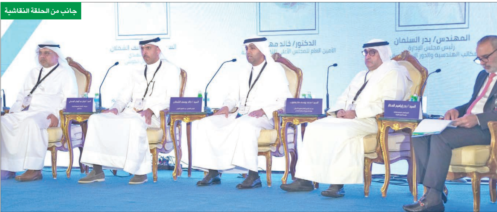
جانب من الحلقة النقاشية