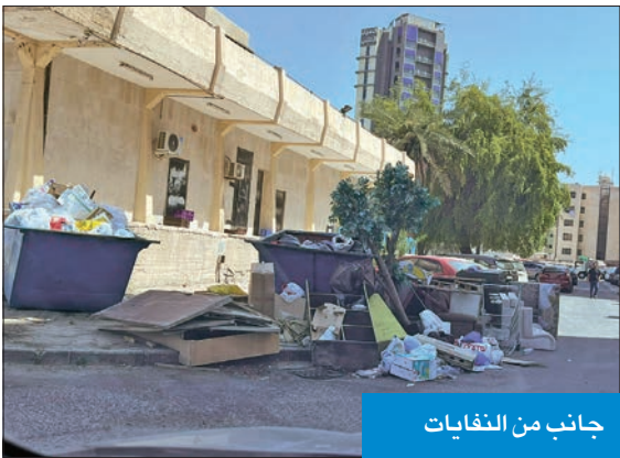
جانب من النفايات

وأوضحت أن أنواع المخالفات تمثلت في إلقاء المواقف واستغلال السرداب في غير