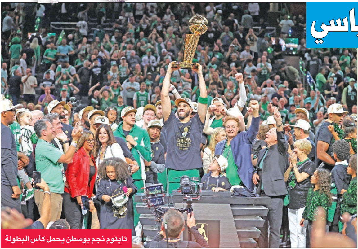
تايتوم نجم بوسطن يحمل كأس البطولة

وتفوّقت كينغ على إيمان (1:06.10 د) وخاصة على بطلة أولمبياد طوكيو 2021 ليديا جاكوبي التي حلت ثالثة، وبالتالي لن تتمكن من الدفاع عن لقبها في باريس، وهو مثال جديد على المنافسة القوية في السباحة الأميركية وتصفياتها.