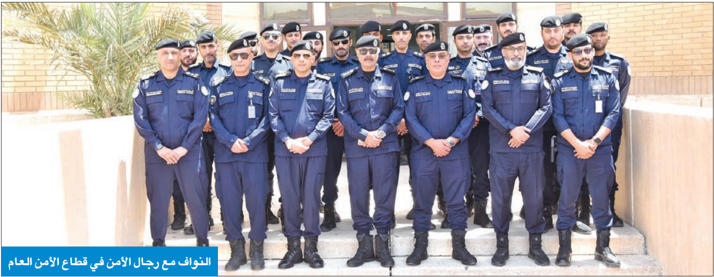
النواف مع رجال الأمن في قطاع الأمن العام

بن شوق عاين الزوارق البحرية والحدود البرية الشمالية