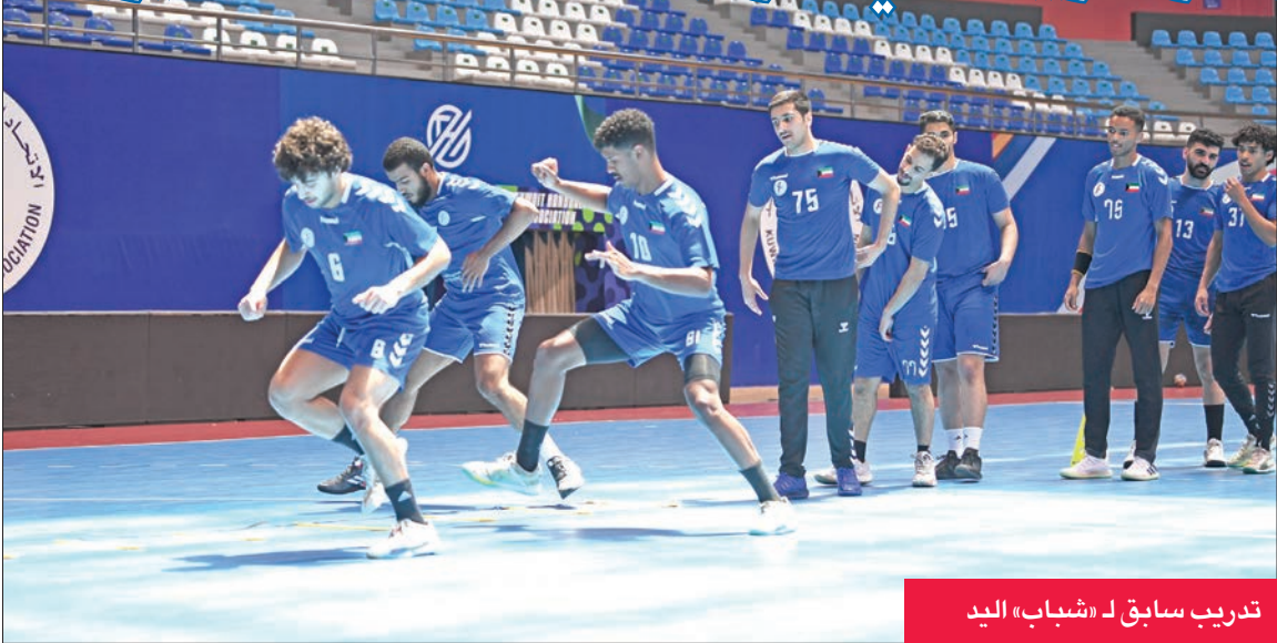
تدريب سابق لـ «شباب» اليد