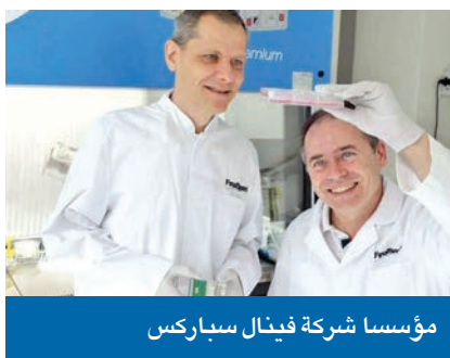
مؤسسا شركة فينال سباركس

لا شك في أن الخيال العلمي يلهم العلماء كثيراً، بحيث إن الكثير من التقنيات والتكنولوجيا ظهرت أولاً في أفلام ومسلسلات الخيال العلمي قبل أن تصبح واقعاً شائعاً، مثل الروبوتات واتصالات الفيديو والهواتف الذكية. وقالت «سكاى نيوز»، أمس، إن الأخطر، هو ما عمل علماء سويديون من شركة فينال سباركس - وهي شركة ناشئة تركز على إيجاد حلول للشبكات العصبية البيولوجية - أخيراً على ابتكاره، ألا وهو «أول كمبيوتر حي»، حيث ابتكروا جهاز كمبيوتر تم صنعه من أنسجة المخ البشرية، وهو الكمبيوتر الذي ظهر في عديد من الأفلام والمسلسلات العلمية، وفي كثير من الرسوم الكوميكس. ونشرت صحيفة ديلي ميل البريطانية أخيراً، تحقيقاً خاصاً حول أول «كمبيوتر حي» في العالم مصنوع من أنسجة المخ البشري. ووفق الصحيفة، فإن الكمبيوتر الحي يتألف من 16 جزءاً عضوياً، أو كتل من خلايا الدماغ التي تمت زراعتها في المختبر، والتي ترسل المعلومات فيما بينها، وهي تعمل بشكل يشبه