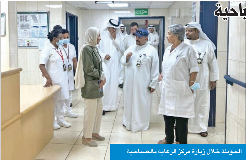
الحويلة خلال زيارة مركز الرعاية بالصباحية