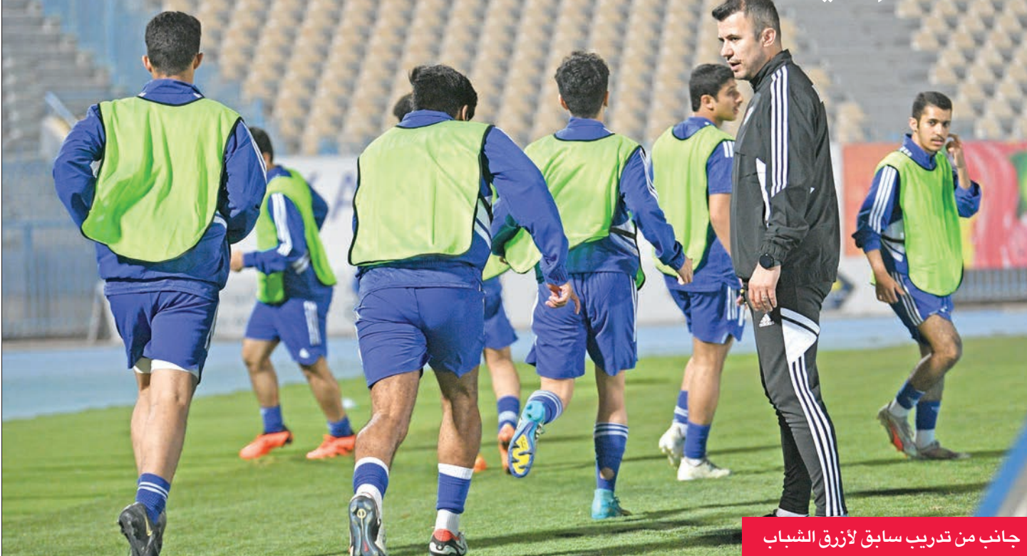
جانب من تدريب سابق لأزرق الشباب