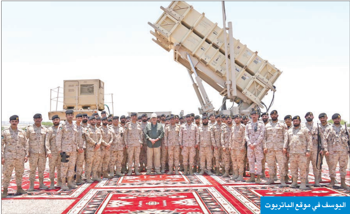
اليوسف في موقع الباتريوت

جولته، على ألية سير العمل ومستوى التنفيذ لمختلف المهام والواجبات خلال فترة الأعياد والعطلات الرسمية، كما أكد في تصريحه أن منتسبي القطاعات العسكرية يدركون حجم المسؤولية الملقة على عاتقهم في المحافظة على أمن واستقرار الوطن وحمايته، بفضل ما يتمتعون به من كفاءة وقدرة واستعداد دائم.