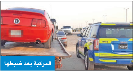
المركبة بعد ضبطها

تمكنت الإدارة العامة للمرور ممثلة في إدارة العمليات المرورية- قسم مباحث المرور من تحديد هوية شخص ظهر بمقطع فيديو تم تداوله على بعض مواقع التواصل الاجتماعي، ويتضمن قيامه بعمليات الاستهتار والرعونة على الطريق العام، ومعرضاً حياته وحياة الآخرين للخطر.