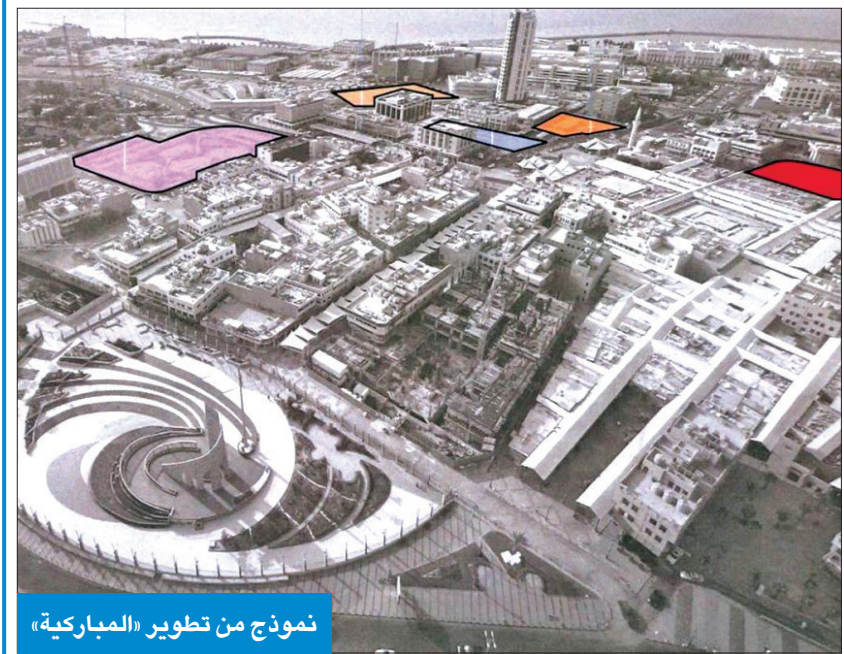
نموذج من تطوير «المباركية»