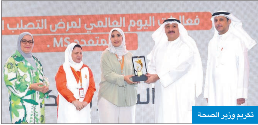
تكريم وزير الصحة