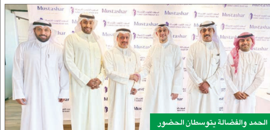
الحمد والفضالة يتوسطان الحضور

في مبادرة هي الأولى من نوعها في القطاع الخاص لتتقيد وتوعية المواطنين في مجال البناء، وفي إطار دورهما المتميز في مجال المسؤولية المجتمعية، وتعزيزاً لثقافة البناء بالكويت وتوعية المواطنين، وقعت شركتا مستشار البناء للمقاولات، وأسمنت الكويت، اتفاقية شراكة استراتيجية بينهما، تستهدف في أحد جوانبها العمل على تثقيف المجتمع من الملاك والمقاولين على البناء بأهمية ثقافة الجودة في التنفيذ.