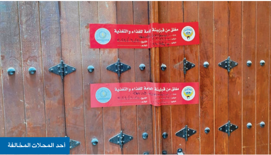
أحد المحلات المخالفة

على بعد أيام معدودة من عيد الأضحى المبارك، داهمت الهيئة العامة للغذاء والتغذية بالتعاون مع عدة جهات حكومية سوق اللحوم في منطقة المباركية، بحملة تفتيشية أمس، كشفت عن تجاوزات تقترب إلى حد الكوارث، حيث عثرت على أكثر من نصف طن من اللحوم الفاسدة معروضة للبيع رغم تغير خواصها الطبيعية، مع وجود نوعية أخرى ممنوع إخراجها من المسالخ، فضلاً عن عمالة غير نظيفة دون شهادات صحية. وفور ضبط تلك اللحوم الفاسدة، عمد مفتشو الهيئة إلى إغلاق أكثر من 10 محلات للجزارة في السوق، ووضعوا عليها ملصقات مبيّناً بها المحضر ونوع المخالفة وعبارة «معلق من قبل الهيئة العامة للغذاء والتقنية»، فضلاً عن إحالة المخالفين إلى النيابة العامة