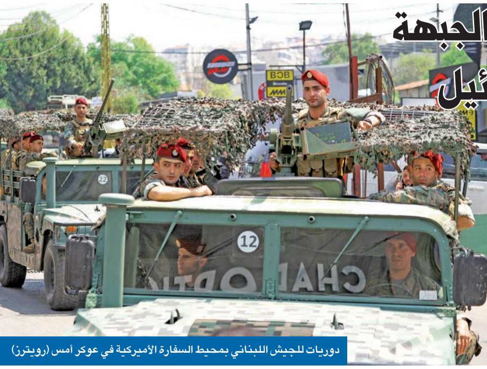
دوريات للحيش اللبناني بحميط السفارة الأميركية في عوكر امس