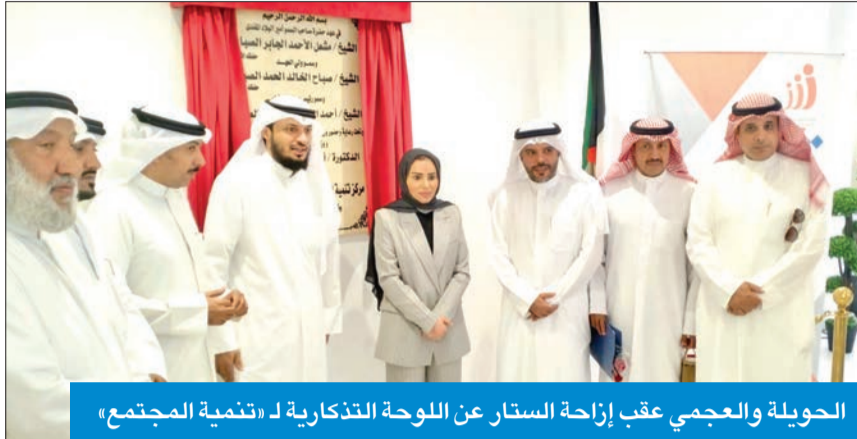
الحوية والعجمي عقب إزاحة الستار عن اللوحة التذكارية لـ «تنمية المجتمع»

● تأكيداً لخبر الجريدة. على خلفية شبهة تجاوزات مالية جسيمة ● العجمي: جادون في مكافحة الفساد وملاحقة من يمسّ المال العام