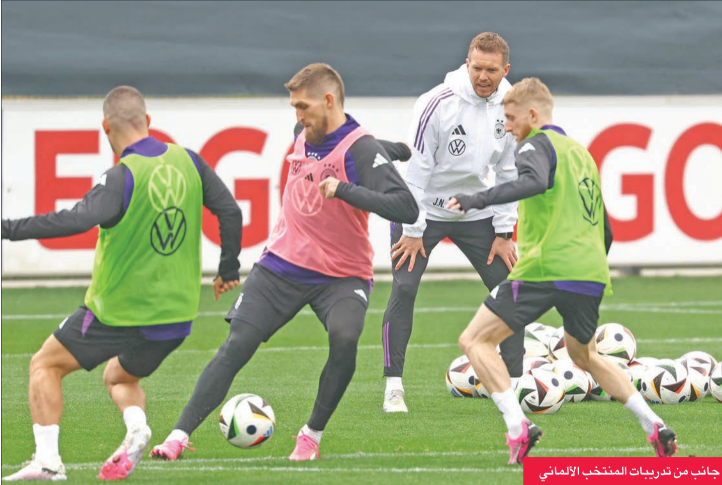
جانب من تدريبات المنتخب الألماني

الهدف الأسمى هو خلق الإثارة في البلاد، والأفضل أن يكون ذلك مباشرة منذ المباراة الافتتاحية، وتقام المباراة الافتتاحية في 14 يونيو في ميونخ ضد اسكتلندا.