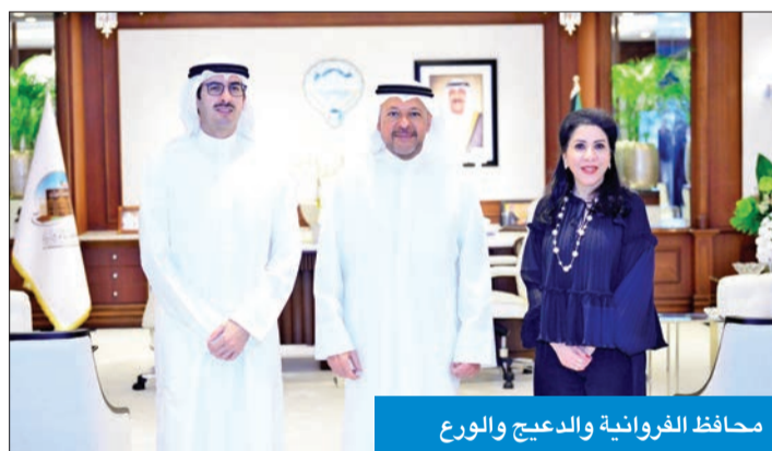
محافظ الفروانية والديعيج والورع

ولفت الديعيج خلال اللقاء إلى أن الشركة بين البنك التجاري والعديد من الجهات الأهلية ومؤسسات المجتمع المدني تأتي لتأصيل أوجه المسؤولية المجتمعية للبنك، مؤكدة استمرار البنك في دعم كل ما من شأنه أن يعود بالفائدة