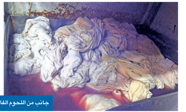
جانب من اللحوم الفاسدة المضبوطة