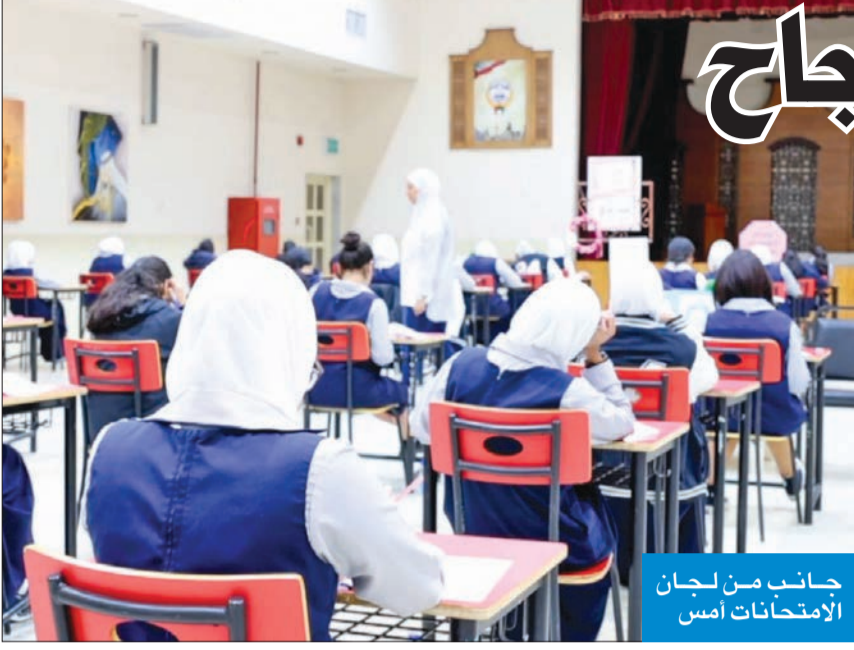
جانب من لجان الامتحانات أمس

لم تسجل أي اختراقات جديدة والطلبة أكدوا سهولة الامتحانات