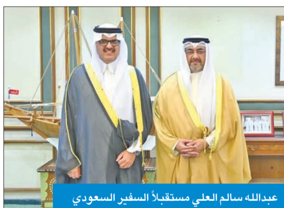
عبدالله سالم العلي مستقبلاً السفير السعودي

استقبل محافظ العاصمة الشيخ عبدالله سالم العلي في مكتبه بديوان عام المحافظة سفير المملكة العربية السعودية الشقيقة لدى دولة الكويت الأمير سلطان بن سعد آل سعود، وجرى خلال اللقاء استعراض العلاقات الثنائية المتميزة بين البلدين الشقيقين، وسبل تعزيزها في المجالات كافة.