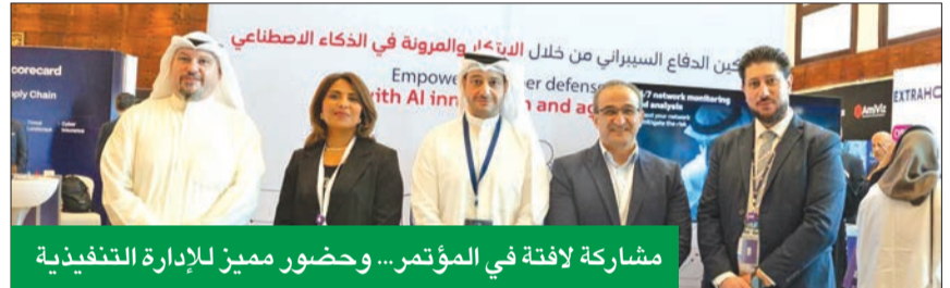
مشاركة لافتة في المؤتمر... وحضور مميز للإدارة التنفيذية