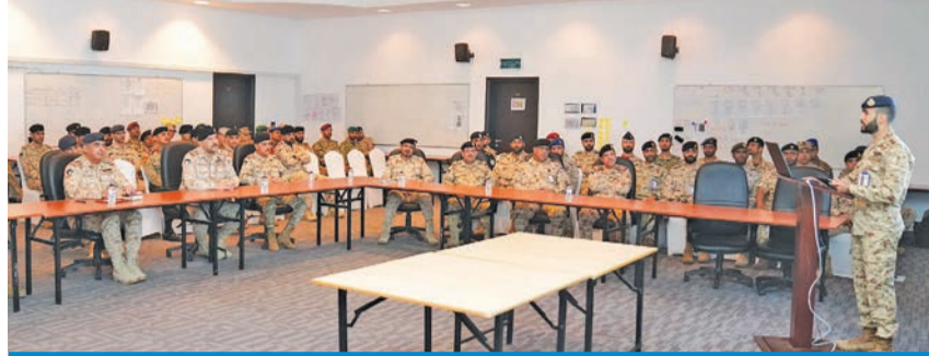
رئيس الأركان خلال حضوره اختتام التمرين النهائي المشترك لدورة القيادة والأركان

وقع وزير الكهرباء والماء والطاقة المتجددة وزير الدولة لشؤون الإسكان د. محمود بوشهري، صباح أمس، عقد تحديث 8 وحدات لإنتاج الطاقة الكهربائية في محطة الزور الجنوبية لتوليد القوى الكهربائية وتقطير المياه، والتي تشمل أعمال إطالة العمر الافتراضي للغلايات واستبدال نظام التحكم للغلايات والتوربينات البخارية والمساعدات، وذلك يأتي لتلبية لاحتياجات