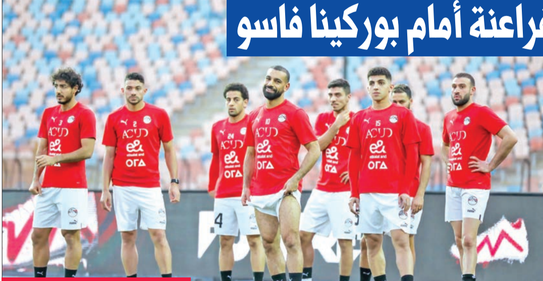
محمد صلاح في مران منتخب مصر

تدريب المنتخب في الفترة الحالية، وبشكل عام يمتلك منتخب مصر لاعبين راعين، ولكن نحن أيضاً نمتلك القوة والشجاعة، وحننا للناز والانتقام من منتخب مصر بعد الخسارة منهم في كأس الأمم الإفريقية في الغابون 2027».