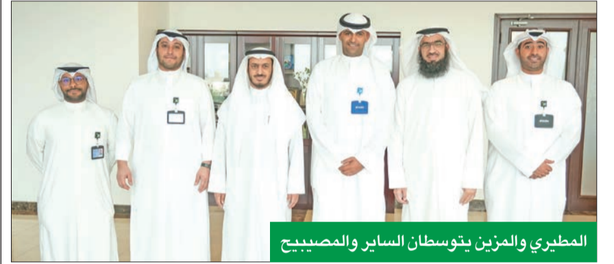
المطيري والمزين يتوسطان السائر والمصبيح

أعلنت شركة زين استمرار تعاونها السنوي مع وزارة الأوقاف والشؤون الإسلامية لتقديم عرضها المجاني الخاص بصيف رمضان، حيث تقدم من خلاله أعلى باقاتها للتجوال (باقة التجوال بلس) مجاناً لجميع عملاء الدفع الأجل والمسبق المسجلين في الحملات المعتمدة من الوزارة لأداء فريضة الحج هذا العام.