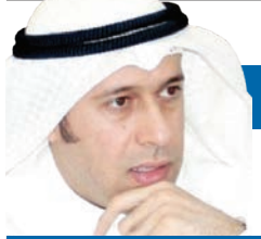
بحر خالد البحر