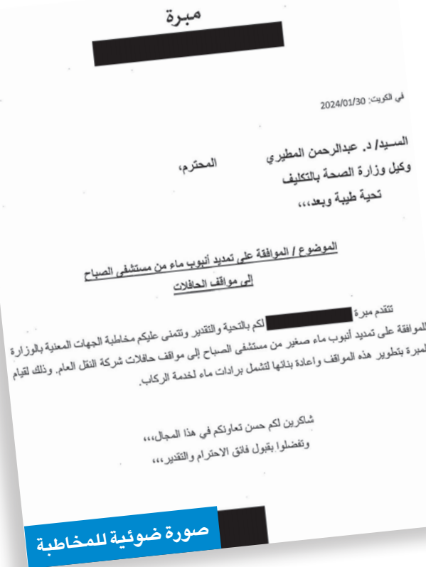
صورة ضوئية للمخاطبة

المبرة في القيام به لخدمة الركاب البسطاء، والذي لا يستغرق سوى ساعات بسيطة للموافقة على تنفيذ، فإن الوزارة ومنذ يناير الماضي حتى كتابة هذه السطور لم ترد على كتاب المبرة بالإيجاب أو السلب، خصوصاً مع دخول موسم الصيف وارتفاع درجات الحرارة، وحاجة الركاب إلى شرب مزيد من الماء للحفاظ على صحتهم من حرارة الشمس المرتفعة.