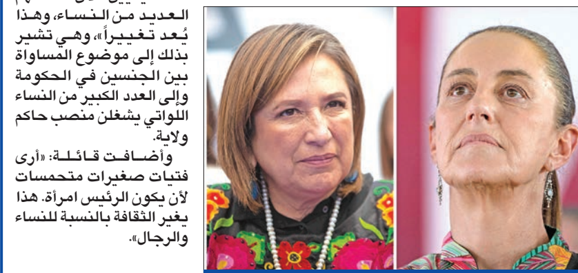
شينباوم وغالفيز في صورة مركبة

تشهد المكسيك اليوم انتخابات رئاسية تتنافس فيها امرأتان على منصب أول رئيسة للبلاد، هما كلوديا شينباوم، مرشحة حزب «مورينا» اليساري الحاكم، وسوشيتل غالفيز مرشحة المحافظين اليمينيين، فيما يحتل الرجل الوحيد، الذي يخوض السباق الرئاسي، المركز الثالث. وترجح استطلاعات الرأي أن تقوّن شينباوم (61 عاماً) العمدة السابقة لمكسيكو سيتي، بالمنصب، لتصبح أول امرأة تترأس المكسيك، وأول شخص يتحدّر من أصول يهودية يقود المكسيك التي تعيش فيها أغلبية كاثوليكية. واستفادت شينباوم من دعم كبير من قبل الرئيس اليساري الحالي أندريس مانويل لوبيز أوبرادور المعروف بـ AMLO، والذي تجمّع انتخابي وتنازه في المئة بينما تنتهي ولايته الأخيرة في ديسمبر المقبل. وتخصّصت شينباوم بالفيزياء، وهي حاصلة على درجة الدكتوراه في الهندسة. وتعود أصول شينباوم إلى اليهودية، حيث جاء أجدادها من طرف والدها إلى المكسيك من ليتوانيا في بداية القرن العشرين لأسباب اقتصادية وسياسية. كان جدّها يهودياً وشيوعياً، وعائلة والدتها تنتمي ليهود بلغاريا، الذين فروا إلى المكسيك هرباً من النازيين. ودعي أكثر من 99 مليون مكسيكي لاختيار الرئيس وممثلهم من النواب وأعضاء مجلس الشيوخ والسلطات المحلية في انتخابات وصفت بأنها الأكثر دموية في تاريخ المكسيك بعد مقتل 37 مرشحاً في سلسلة اغتيالات، أخرجها قتل فيها بالبرصاص أمس الأول خورخي هويرتا كاريرا، بولاية بويبلا خلال تجمع انتخابي. وأولت شينباوم اهتماماً