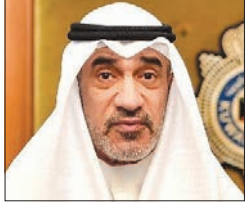
اليوسف يصدر الهيكل التنظيمي لقطاعات المرور والعمليات وقوات الأمن الخاصة