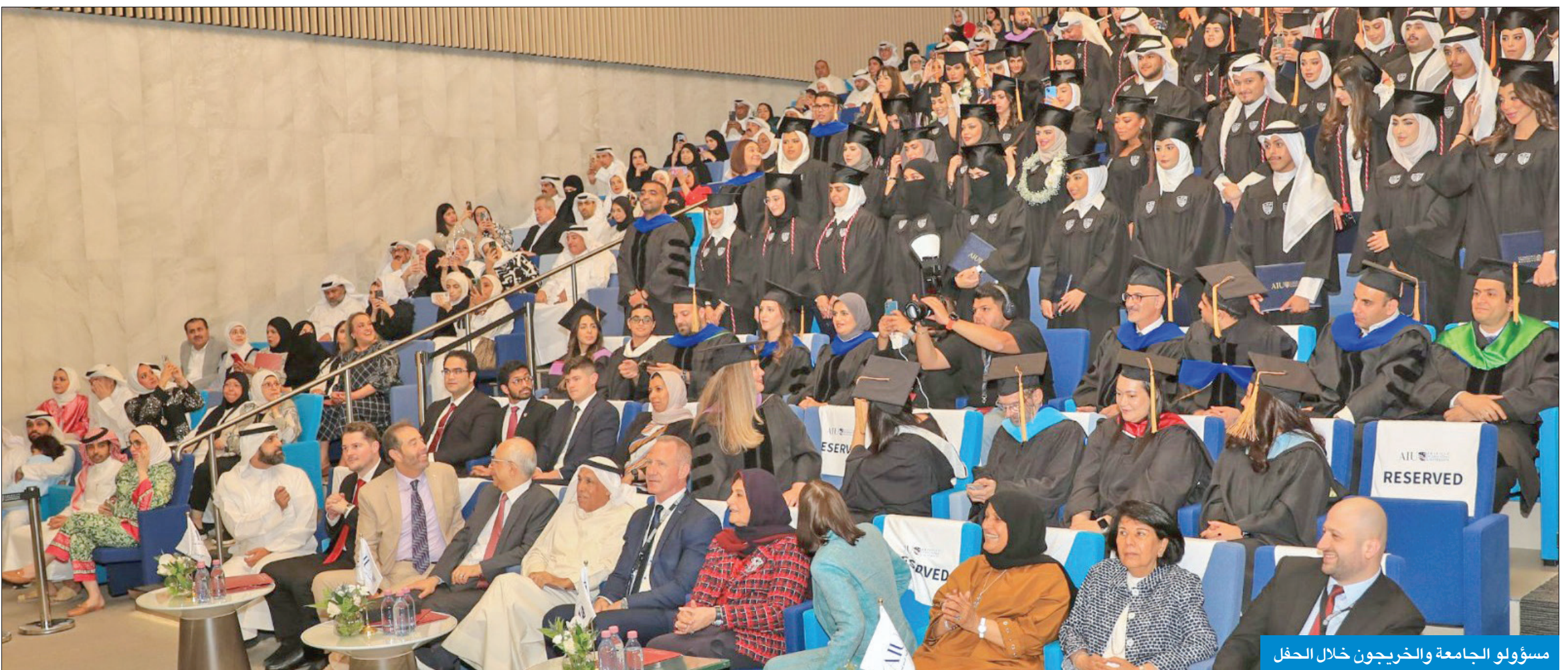
مسؤولو الجامعة والخريجون خلال الحفل