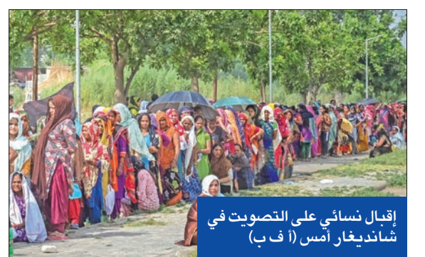
إقبال سائتي على التصويت في شانديغار أمس