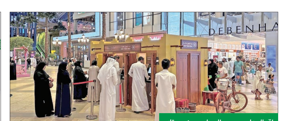
إقبال على سحب العيادي من «بيتك»

أوراق النقد بالدينار الكويتي، اعتباراً من 2 إلى 13 يونيو.