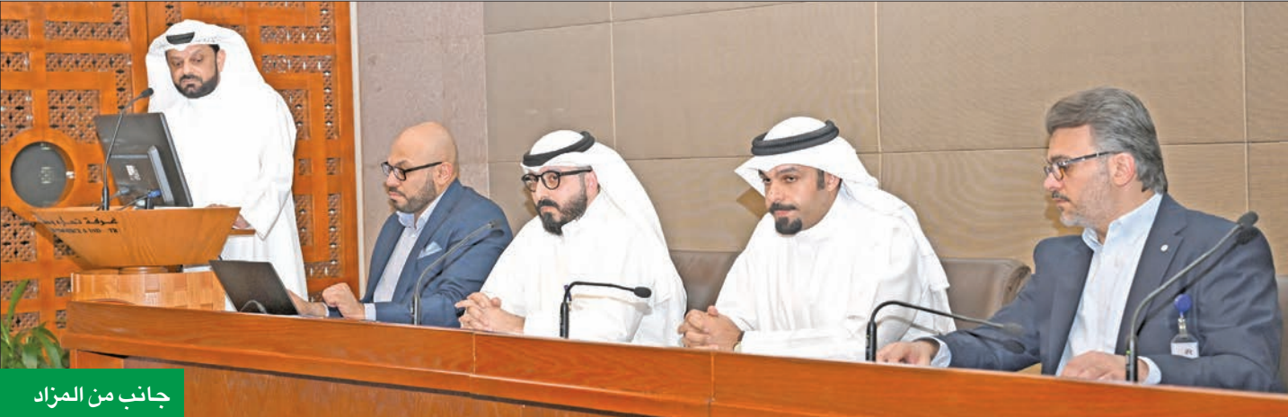
جانب من المزاد

● بارتفاع 11.1% عن السعر الابتدائي وبيع كل الأراضي المطروحة ● الصغير: المزاد أطلق شرارة عودة الحياة للسوق وأعاد صياغة الأسعار