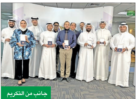
جانب من التكرم