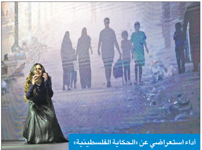
أداء استعراضي عن «الحكاية الفلسطينية»

وإياكم تحرير فلسطين وعودة الحق لأصحابه في القريب العاجل بإذن الله». وعن أهداف المسابقة، قالت: «لتلقي معكم في (من خلال عدستك) لسبيين، أولهما التذكير بأن لدينا قضية لن ننساها أبداً، وإن قصرنا تجاهها بشكل مياشر، إلا أننا سنظل نعمل لتكريس حضورها في كل عمل نقوم به. أما السبب الثاني