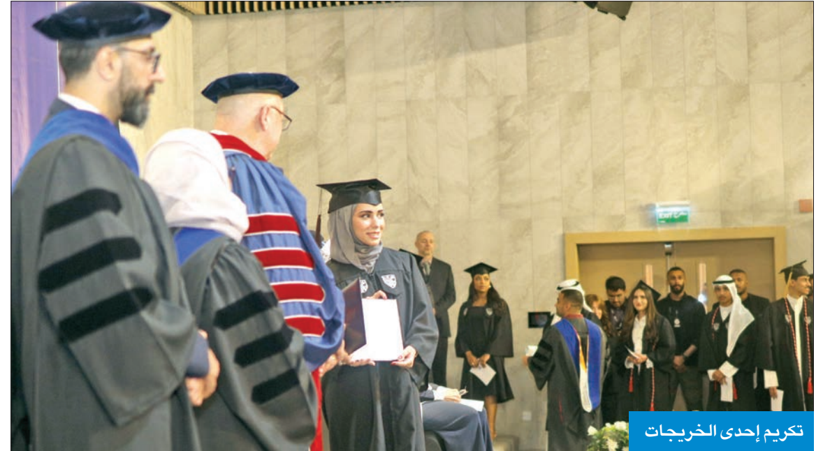
تكريم إحدى الخريجات