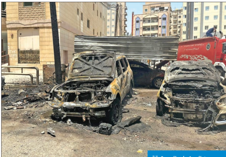
عدد من المركبات المحترقة

وقالت الإدارة في بيان صحافي «إنه مع ارتفاع درجات الحرارة في الصيف واستخدام البعض لمعدات الإطفاء الموجودة في البنايات من قبل البعض في غسل المركبات أو مساحات في البنايات، وصولاً إلى المحال، وذلك بالمخالفة للقانون،