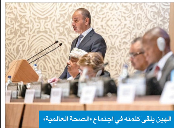
الهيئ يلقي كلمته في اجتماع «الصحة العالمية»

قال المنسوب الدائم لدولة الكويت لدى مكتب الأمم المتحدة والمنظمات الدولية الأخرى في جنيف، السفير ناصر الهين، إن جائزة المغفور له، بإذن الله، سمو أمير الكويت الراحل الشيخ صباح الأحمد للبحوث في مجال الرعاية الصحية للمسنين وتعزيز الصحة لعام 2024 تمثل حافزا إيجابيا للنهوض بأهداف التنمية المستدامة، وتعزيز الصحة العامة، وضمان توافرها مع الأولويات وضمنها في كلمته وأضاف السفير في كلمته بمناسبة تسليم الجائزة للفائزين خلال مشاركته في اجتماعات الدورة الـ 77 لجمعية الصحة العالمية المنعقدة حاليا في جنيف أن «منح الجائزة يأتي في إطار دعم كبار السن في مجتمعاتنا، وتقديرا لجهودهم الدؤوبة وما قدموه لنا من مساهمات ثمرة وعطاء مخلص طول مسيرة حياتهم. وقالت السفارة، في بيان لها، إن مكتب القنصلية الصحية العالمية، الذي يبرع جذوره لأكثر من 6 عقود منذ انضمام الكويت لعضوية