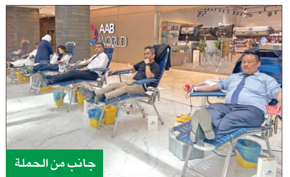
جانب من الحملة

انطلاقاً من دورها الريادي في مجال المسؤولية الاجتماعية وتحت شعار «نحن نهتم»، نظمت الشركة التجارية العقارية عدة حملات للتبرع بالدم بعنوان «كل قطرة تفرق... تبرع بالدم»، والتي أقيمت في برج التجارة وجمع سيمفوني ستايل. تكللت هذه الحملات بالنجاح الباهر، بمشاركة عدد كبير من موظفي الشركة، إضافة إلى عدد كبير من المستثمرين وموظفي وزوار المجمع وترعاتهم التي أسهمت بدعم احتياجات بنك الدم المركزي. وقد صرح فريق إدارة التسويق والاتصال في «التجارية العقارية»، بأن هذه الحملة يتم تنظيمها بشكل سنوي في مختلف العقارات التابعة للشركة،