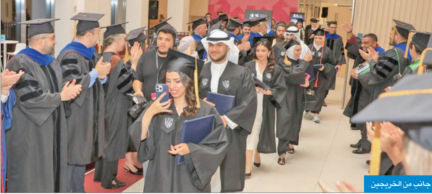
جانب من الخريجين