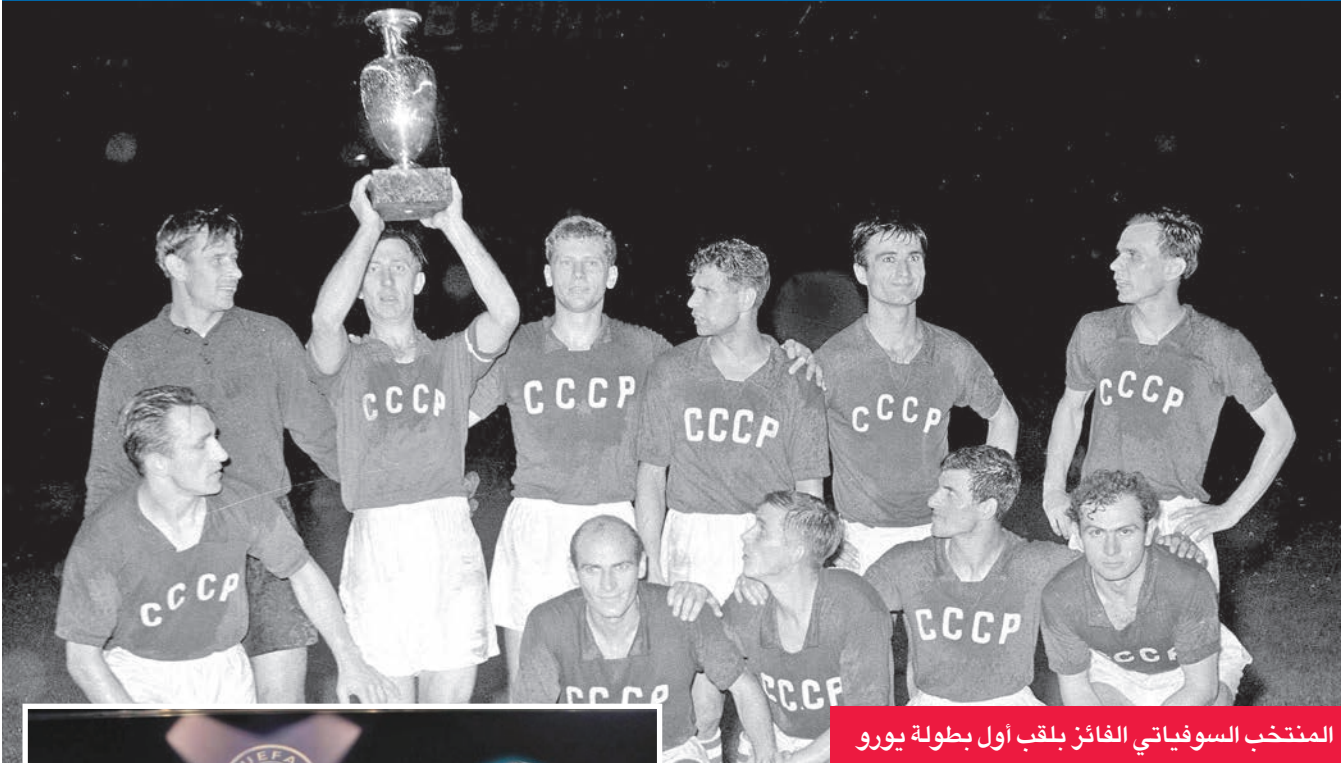
المنتخب السوفياتي الفائز بلقب أول بطولة يورو

واحدة، وليس بنظام الذهاب والإياب. صوّت 14 اتحاداً في مصلحة هذا الاقتراح، وعارضته سبعة اتحادات، في حين امتنعت خمسة اتحادات عن التصويت.