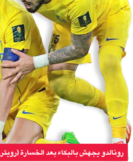
رونالدو يجهد بالبكاء بعد الخسارة

وحدث اللقاء طرد الكولومبي دافيد أوسينا حارس النصر (56).