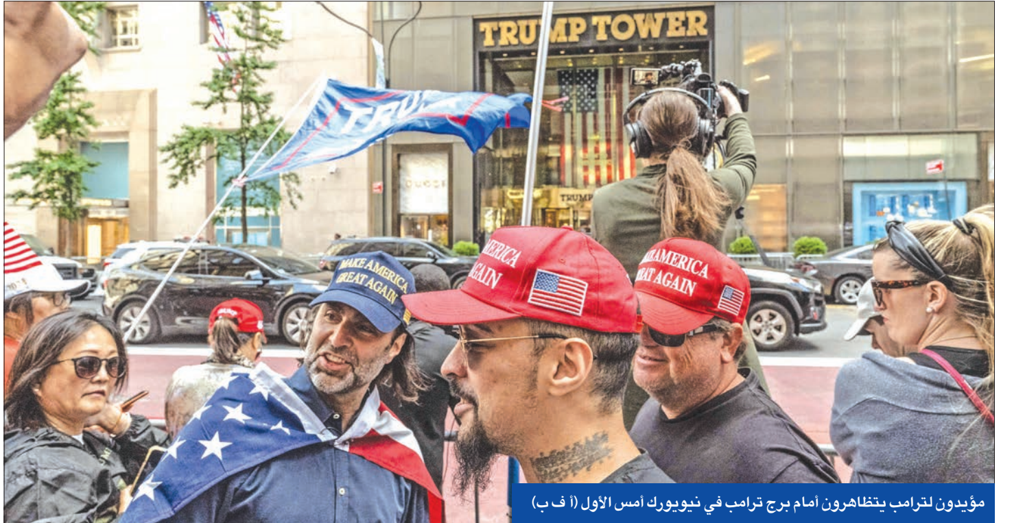
مؤيدون لترامب يتظاهرون أمام برج ترامب في نيويورك أمس الأول (أ ف ب)

أصبح الرئيس السابق ومرشح الجمهوريين الحالي للانتخابات الرئاسية دونالد ترامب أول رئيس أميركي يدين بجرime جنائية، في خطوة قد يكون تأثيرها محدوداً على الحملات الانتخابية ونتائج السباق إلى البيت الأبيض، لكنها تعكس الانقسام السياسي المتزايد بالولايات المتحدة والذي يقترّب من التحول إلى أزمة نظام. رغم أن الإدانة الجنائية في نيويورك للرئيس الأميركي السابق، دونالد ترامب، تظهر أنه «لا أحد فوق القانون» بالولايات المتحدة، فإنها قد تعمق الأزمة في الداخل الأميركي، وفق ما ذكره تحليل لمجلة فورين بوليسي. وذكرت المجلة أن المحاكمة «التاريخية» التي يخضع لها ترامب، تكشف نظرة منقسمة في الولايات المتحدة تجاه مجموعة الحقائق، فيما يراقب العالم «بدهول مروع» القوة العظمى «وهي تنقلب على نفسها». وشبه التحليل ما قد يحدث في أميركا «بحرب غير أهلية»، فيما يصف ترامب المحاكمة «بغير العادة والزائفة»، بعدما أدانته هيئة المحلفين في المحكمة بتهمة في قضية تزوير سجلات محاسبية للتغطية على تسديد مبلغ قدره 130 ألف دولار لإسكات ممثلة الأفلام الإباحية، ستورمي دانييلز، التي أقام معها علاقة جنسية، قبل انتخابات 2016. واعتبرت الحملة الانتخابية للرئيس الأميركي جو بايدن، أن هذا الحكم، وهو الأول من نوعه بحق رئيس أميركي، دليل على أنه «لا أحد فوق القانون»، فيما حاول ترامب تسخير الإدانة في صالحه، فكتب «إنني سجين سياسي».