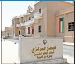
«جهاز البدون» للحويلة: عدم السماح بإنجاز معاملات المسحوبة جناسيهم