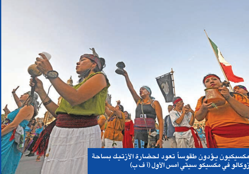
مكسيكون يؤدون طقوساً تعود لحضارة الأزتك بساحة زوكالو في مكسيكو سيتي أمس الأول

متحدرة من أصل يهودي الأوفر حظاً لخلافة «معلمها» اليساري