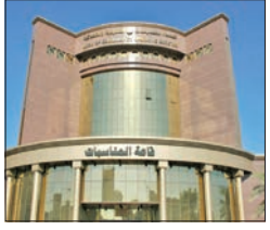
إجراءات قانونية ضد 12 تعاونية لمخالفات مالية وإدارية جسيمة