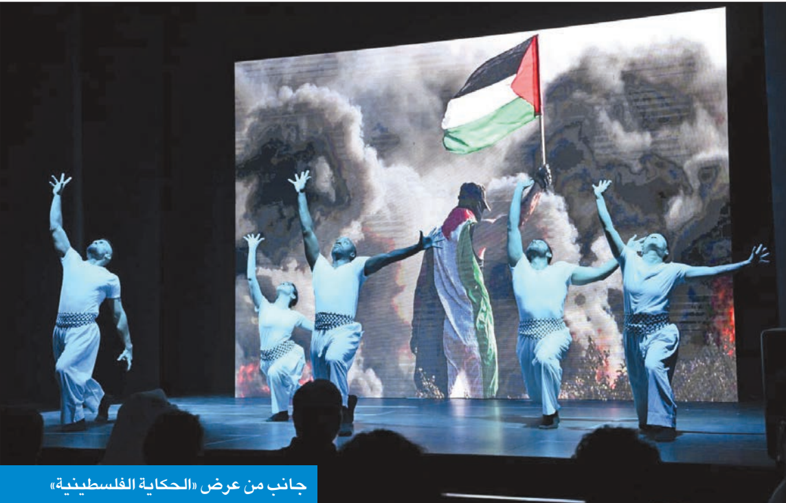
جانب من عرض «الحكاية الفلسطينية»

في حفل «أكاديمية لويك للفنون» بختام مسابقة «من خلال عدستك» وإعلان الفائزين الخمسة