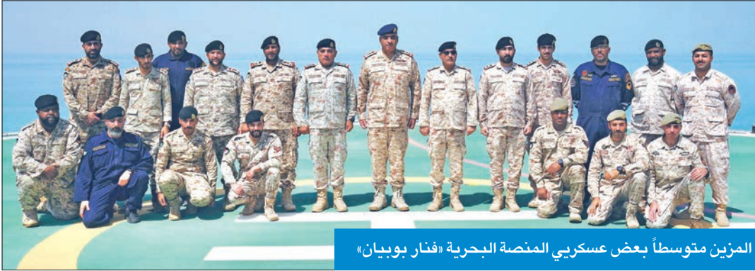
المزين متوسطاً بعض عسكري المنصة البحرية «فناز بوبيان»

دعا رئيس الأركان العامة للجيش، الفريق الركن طيار بندر المزين، إلى تحقيق أقصى درجات اليقظة والجاهزية والاستعداد لحفظ أمن الوطن وسلامة مياهه الإقليمية، مؤكداً أهمية استمرار التعاون والتنسيق بين القطاعات العسكرية، لحفظ أمن البلاد واستقرارها.