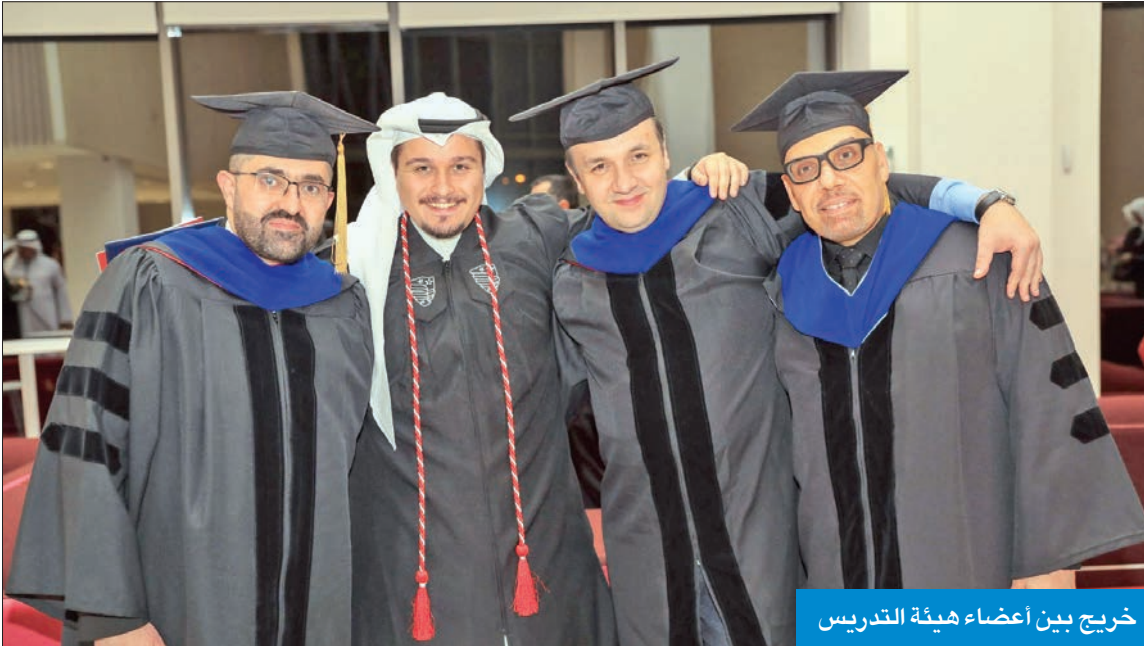
خريج بين أعضاء هيئة التدريس