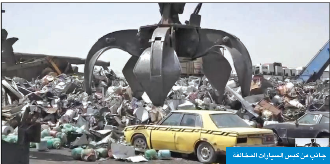
جانب من كبس السيارات المخالفة

بالحاسب الآلي فيتم بيعها بالسكراب، مع اشتراط إدارة الفحص الفني ضرورة قطع المركبة الى نصفين من قبل كراجات السكراب التي قامت بشراؤها.