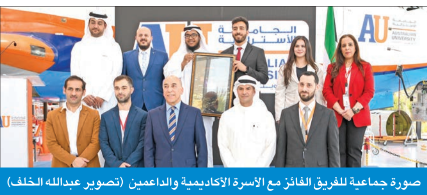
صورة جماعية للفريق الفائز مع الأسرة الأكاديمية والداعمين

«أوريدو»: فخورون بحصول الطلبة على نتيجة رفعت اسم الكويت عالياً