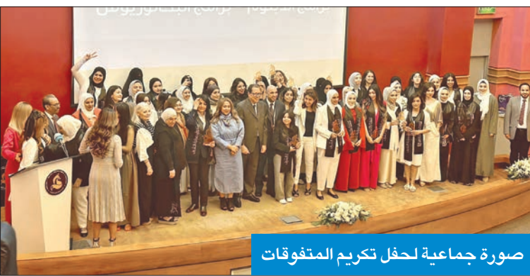
صورة جماعية لحفل تكريم المتفوقات

استقبال طلبات الالتحاق للفصل الدراسي الأول 2024/2025