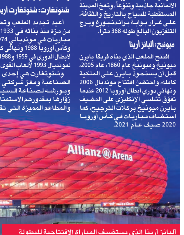
أليانز أرينا الذي يستضيف المباراة الافتتاحية للبطولة

• بلغت الكازاخستانية إيلينا ريباكينا، المصنفة رابعة عالمياً، ثمن نهائي بطولة فرنسا المفتوحة، ثانية البطولات الأربع الكبرى لكرة المضرب، بفوزها السهل على البلجيكية إيلين ميرتنز السابعة والعشرين 4-6، 2-6. أسس. وتأهلت الروسية فارقارفا غراتشيفا (88) لثمن النهائي للمرة الأولى، بعد تغلبها على الرومانية إيرينا كامبيليلا بيغو 5-7، 3-6.