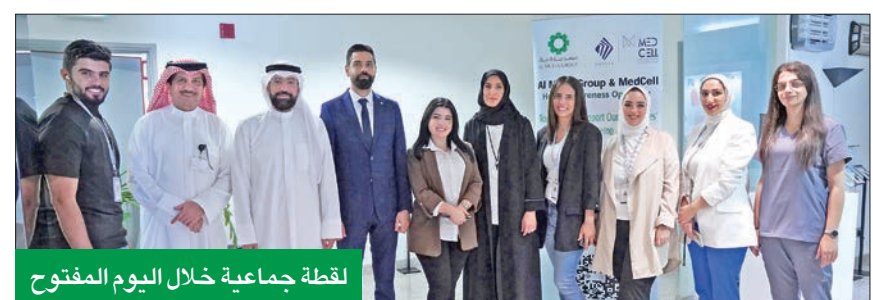
لقطة جماعية خلال اليوم المفتوح

وتواصل مجموعة الملا حرصها على دعم المبادرات المجتمعية التوعوية التي تعزز بيئة عمل صحية لموظفيها.