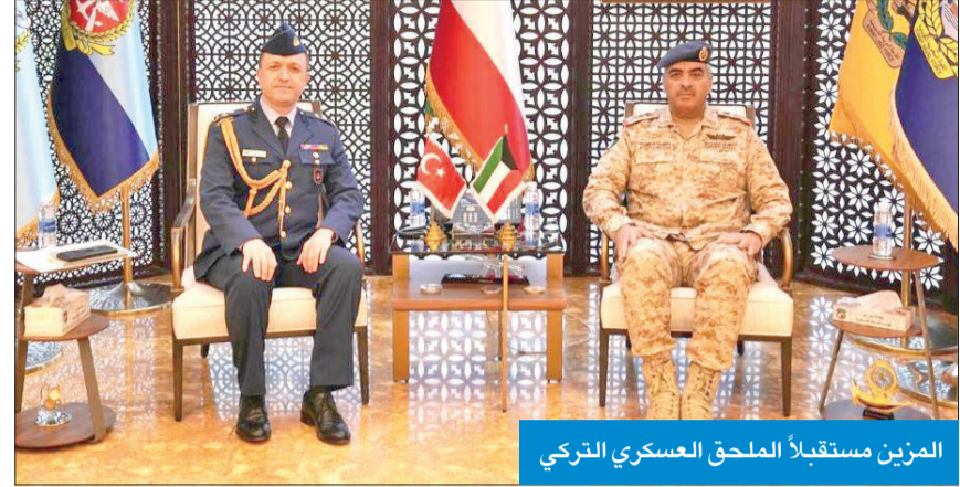
المزبن مستقبلاً الملحق العسكري التركي

استقبل رئيس الأركان العامة للجيش الفريق الركن بندر المزبن، صباح أمس، الملحق العسكري لجمهورية تركيا المقدم جوكهان تكين. وتم خلال اللقاء مناقشة أهم الأمور والمواضيع ذات الاهتمام المشترك، لاسيما المتعلقة بالجوانب العسكرية والمضي قدماً في تعزيز أوجه التعاون بين الجانبين. كما استقبل رئيس الأركان