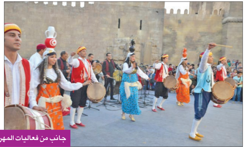
جانب من فعاليات مهرجان العام الماضي