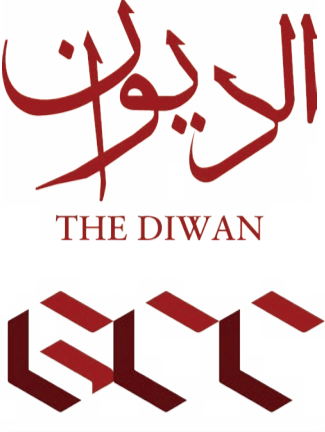
GCC at Harvard Gulf Creatives Conference at Harvard 2024