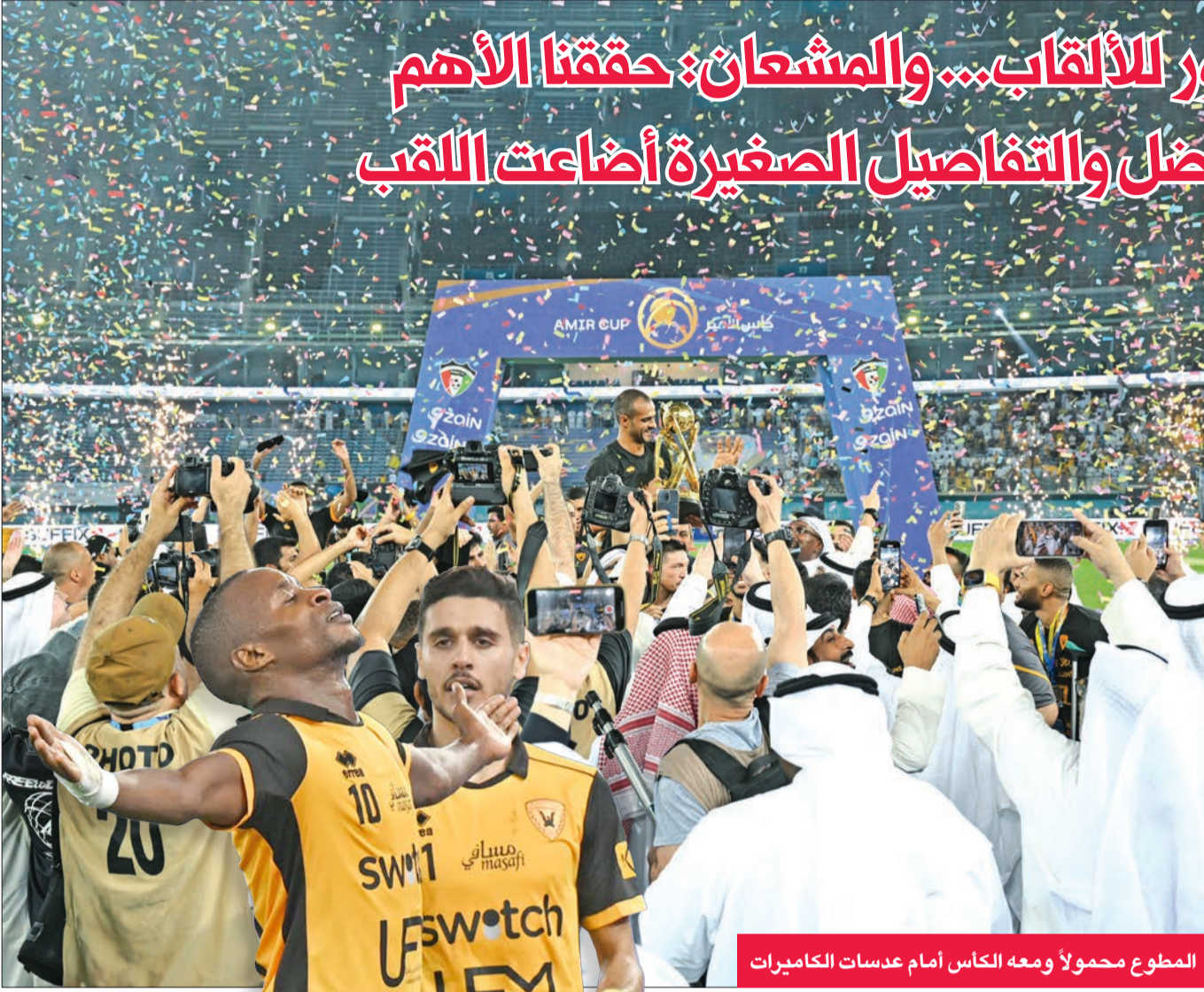
المطوع محمولاً ومعه الكأس أمام عدسات الكاميرات

● نجوم الأصفر: كأس الأمير بوابة العبور للألقاب... والمشعان: حققنا الأهم ● السنوسي الهادي: السالمية كان الأفضل والتفاصيل الصغيرة أضاعت اللقب