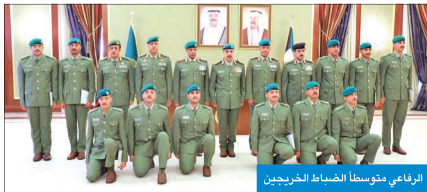
الرفاعي متوسطاً الضباط الخريجين

الوطن، والتضحية بالنفس والتفيس، وفي الختام قام وكيل الحرس الوطني بتكريم أوائل الخريجين.