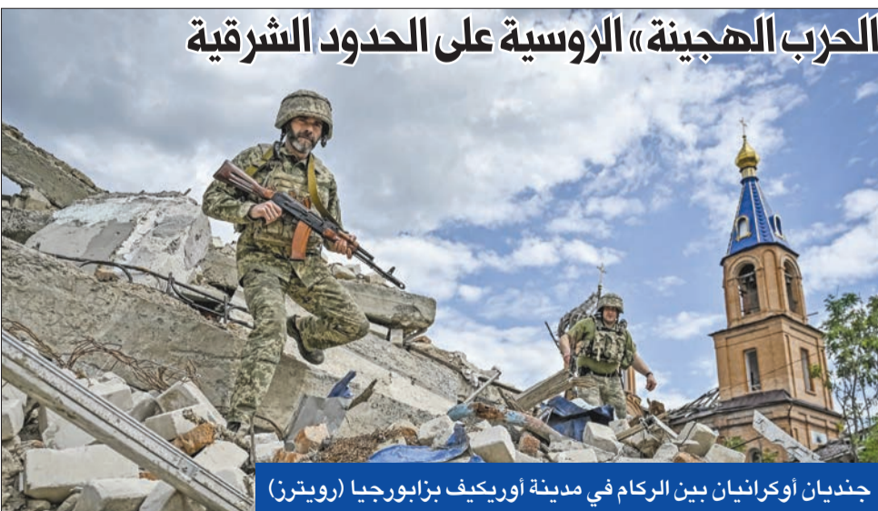
جنديان أوكرانيان بين الركام في مدينة اوريكيف بزابورجيا

بينما يقبل عضوية صربيا تحت زعامة الكسندر فوتشيتش، وهي أيضاً مرشحة للانضمام إلى الاتحاد رغم أنها تدعم موسكو علناً وتسلمها إعلان مشترك بدين قانون النفوذ الأجنبي باعتباره يتعارض مع قيمهم. وكما كان متوقعا، عارضت المجر، بدعم من سلوفاكيا ذلك، وقالت إن الاتحاد الأوروبي لا ينبغي له أن يتدخل في السياسة الداخلية لدولة ثالثة. إن محاولة الإغتيال التي تعرض لها رئيس وزراء سلوفاكيا روبرت فيكو تعزز الارتباك الذي تعيشه أوروبا بحرم الاتحاد الأوروبي لتبليسي مما تتحمله من بلغراد وتمنحه ليوباشيت؟ هذه التساؤلات تعكس بالضبط