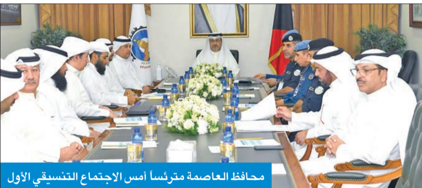
محافظ العاصمة مترئساً أمس الاجتماع التنسيق الأول

العدواني، وعدد من المسؤولين بالمحافظة، ووزارة الداخلية، ووزارة الأشغال العامة، ووزارة الكهرباء والماء والطاقة المتجددة، وبلدية الكويت، والهيئة العامة للزراعة والثروة السمكية، والهيئة العامة للبيئة.