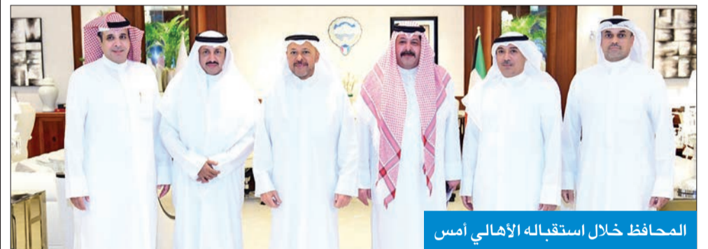
المحافظ خلال استقباله الأهالي أمس

وقال العلي، في تصريح له أمس، عقب ترؤسه الاجتماع التنسيق الأول بحضور عدد من مسؤولي الجهات الحكومية بالمحافظة، إن العمل المشترك والتنسيق الدائم بين المحافظة والجهات الحكومية المعنية يدفع باتجاه تحقيق طلعنا إنتاج حلول واقعية وملموسة، مضيفاً أن ذلك يأتي انطلاقاً من إيماننا بأهمية الشراكة والتعاون في سرعة الإنجاز والتطلع للمستقبل. وأشار إلى «أننا أمام تحديات كبيرة وعلينا التمسك بروح الفريق الواحد للنهوض بعاصمتنا الكويت إلى المكان الذي نستحق» موجهاً الشكر إلى ممثلي الجهات الحاضرة كافة على ما أبدوه من استعداد دائم لترجمة ما تم استعراضه إلى