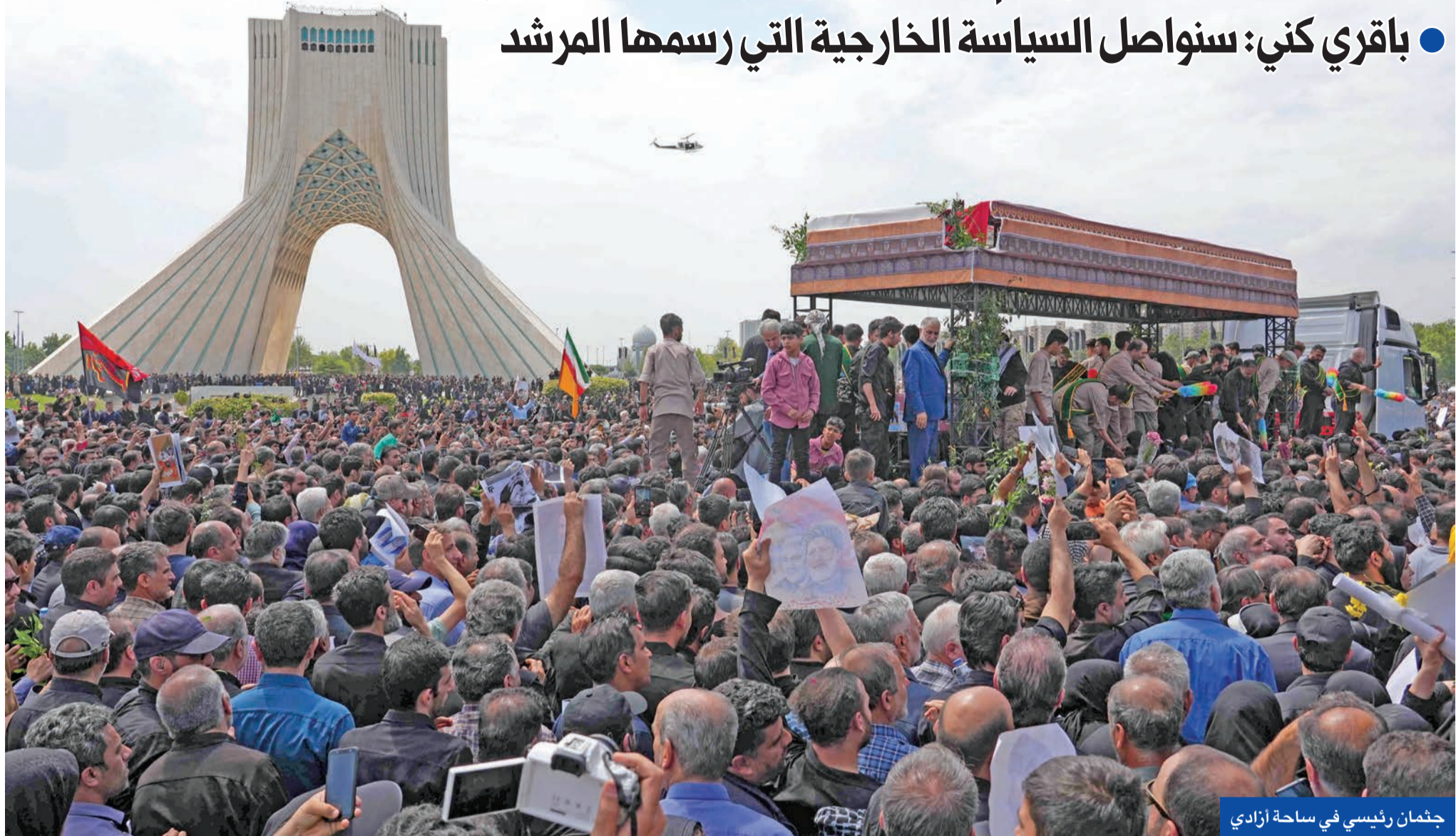
جثمان رئيسي في ساحة آزادي

● اليعيا يمثل أمير البلاد... وتميم بن حمد ووزيرا خارجية السعودية والإمارات يشاركون ● باقري كني: سناول السياسة الخارجية التي رسمها المرشد