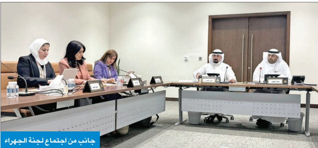
جانب من اجتماع لجنة الجھراء

الخرسانة (إن حدث)، وسيقادي بالتالي تحملاً للخسائر المستقبلية المترتبة على ذلك الفشل، وسيوفر على نفسه الجهد والوقت والمال، كما سيجنب الشركة المورد للخرسانة استكمال صب خرسانة قد تكون غير مطابقة للمواصفات.