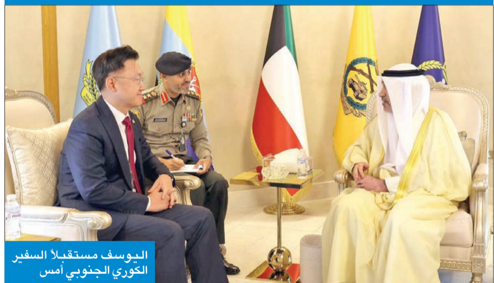
اليوسف مستقبلاً السفير الكوري الجنوبي أمس

استقبل النائب الأول لرئيس مجلس الوزراء وزير الدفاع وزير الداخلية، الشيخ فهد اليوسف، صباح أمس بمقر وزارة الدفاع، كل على حدة، سفراء العراق، وطاجيكستان، وأذربيجان، وفرنسا، وإسبانيا، وهنغاريا، وكوريا الجنوبية، وتركيا.