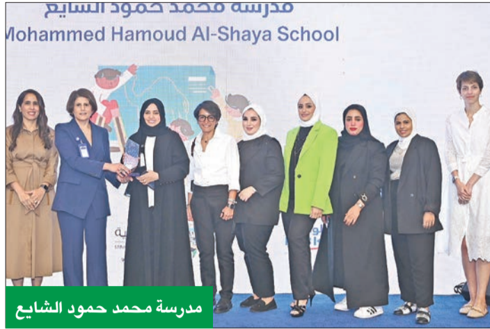
مدرسة محمد حمود الشايح