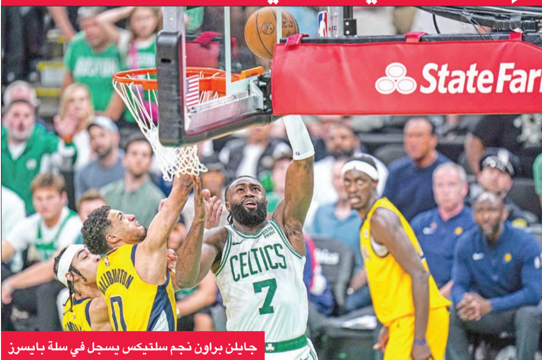
جايلن براون نجم سلتيكس يسجل في سلة بايسرز

بالدور السابق في سلسلة استمرت حتى المباراة السابعة، وانتهت الأحد الماضي.