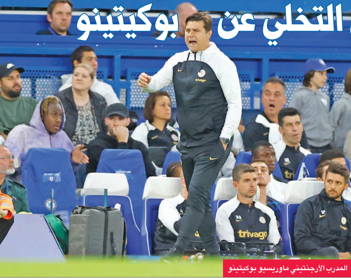
المدرّب الأرجنتيني ماوريسيو بوكيتينو

فاجأ قرار تشاسي التخلي عن المدرب ماوريسيو بوكيتينو، أمس الأول الثلاثاء، الكثير من اللاعبين السابقين الذين يعتقدون أنه قد ينسف مساعي النادي للعودة إلى القمة في الدوري الإنجليزي الممتاز لكرة القدم.