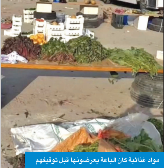
مواد غذائية كان الباعة يعرضونها قبل توقيفهم

استمراراً لجهود قطاع الأمن العام في ضبط الخارجين عن القانون، نفذت مديرية أمن محافظة الأحمدية، ممثلة في إدارة العمليات والدوريات، حملة أمنية بمنطقة المهبولة أسفرت عن ضبط 5 باعة متجولين يقومون ببيع مواد غذائية وملابس مستعملة، وتم إحالتهم إلى جهة الاختصاص، لاتخاذ الإجراءات القانونية اللازمة بحقهم.