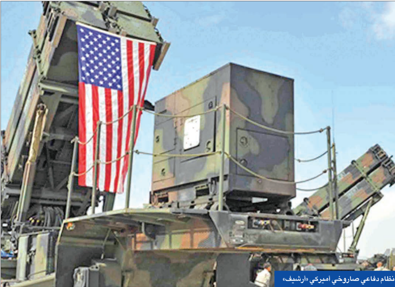
نظام دفاعي صاروخي أميركي «ارشيف»

والصين ودول أخرى. ويثير ذلك خلافات مع واشنطن التي تحذر من أنه لا يمكن دمج الأنظمة الروسية أو الصينية مع صاروخي متكامل.