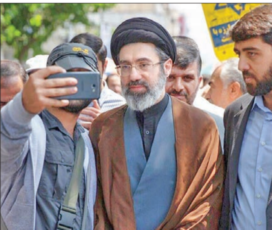
إيراني يلتقط صورة مع مجتبي خامنئي (أرشيف)

المرشد الأعلى وأقوى من مجتبي خامنئي اليوم، يدير شؤون البلاد إلى جانب علي خامنئي، والرئيس آنذاك أكبر هاشمي رفسنجاني. لكن أحمد الخميني اختلف معهما بعد وفاة والده، قبل أن يتوفى هو الآخر في عام 1995، عن عمر يناهز 49 عاماً، بسبب سكتة قلبية.