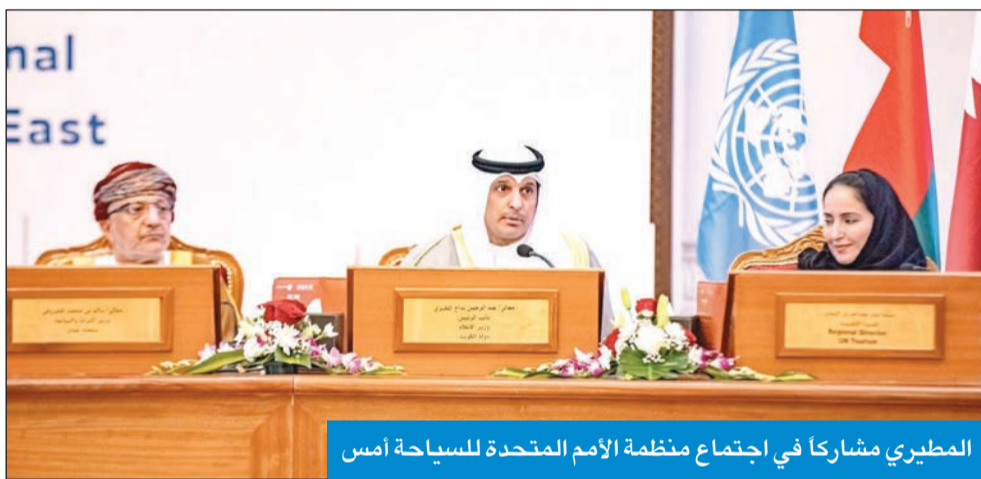
المطيري مشاركاً في اجتماع منظمة الأمم المتحدة للسياحة أمس

أكد وزير الإعلام والثقافة عبدالرحمن المطيري اهتمام الكويت بدعم ومساندة منظمة الأمم المتحدة للسياحة لتعزز السياحة وتطويرها، للإسهام في التنمية الاقتصادية المستدامة التي تشكل فرصة حقيقية واعدة للاستثمار في الإنسان والاقتصاد والبيئة.