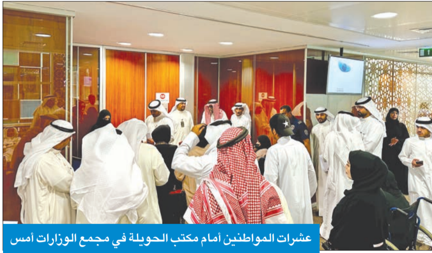
عشرات المواطنين أمام مكتب الحويلة في مجمع الوزارات أمس

ووفقاً لمصادر «الشؤون» فإن ما يزيد على 70 مواطناً تجمّعوا، منذ التاسعة والنصف صباحاً، قبل الموعد المحدد لبدء اللقاءات بنصف ساعة) أمام مكتب الوزارة طلباً لمقابلتها، «حيث تم تخصيص مكتب صغير أمام باب غرفة اجتماعات الحويلة وفرز مؤلفات لتسجيل أسماء المواطنين راغبي لقاءها»، موضحة أنه كانت تتم المناذرة على المراجعين بالإسم للدول، وذلك حسب تأخر كبير في دخول الكشوف، إذ إنه تمت الاستعانة