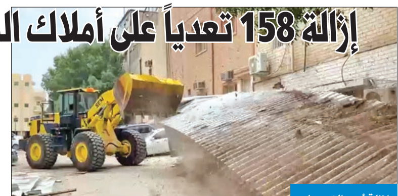
إزالة أحد التعديات