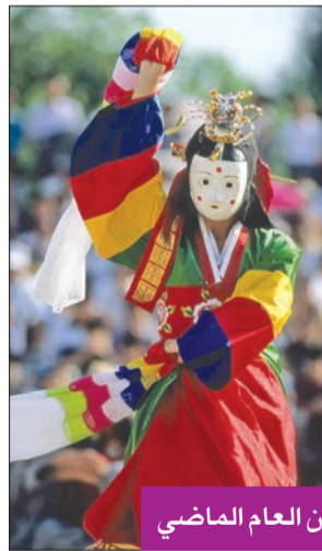
جانب من فعاليات مهرجان العام الماضي