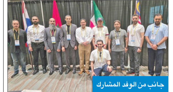
جانب من الوفد المشارك