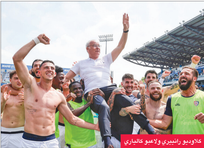
كلاوديو رانيري ولاعبو كاليفاري

قرر المدرب الإيطالي المخضرم كلاوديو رانيري اعتزال مهنة التدريب في كرة القدم، عقب تنحبه عن منصبه كمدير فني لفريق كاليفاري. وذكّرت وكالة الأنباء البريطانية «بي إيه ميديا» أن عدة تقارير إعلامية أكدت قرار رانيري (72 عاما)، الذي قاد