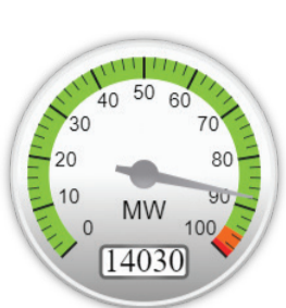
مؤشر الأحمال ظهر أمس