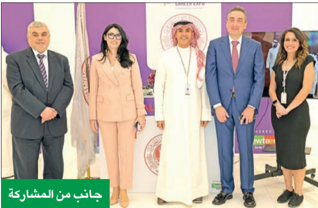
جانب من المشاركة

الطلاب في مرحلة البكالوريوس أو الماجستير أو الدكتوراه، والتي تشجع على البحث العلمي، كذلك تقدم المبادرة برامج أخرى يمكن الاطلاع عليها من خلال زيارة الموقع الإلكتروني (www.kafaakw.org).