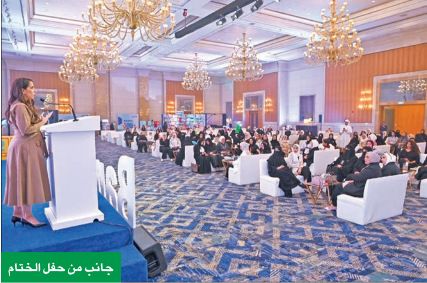
جانب من حفل الختام

كرم 250 معلماً ومعلمة ومديري المدارس المشاركة في تطبيقه