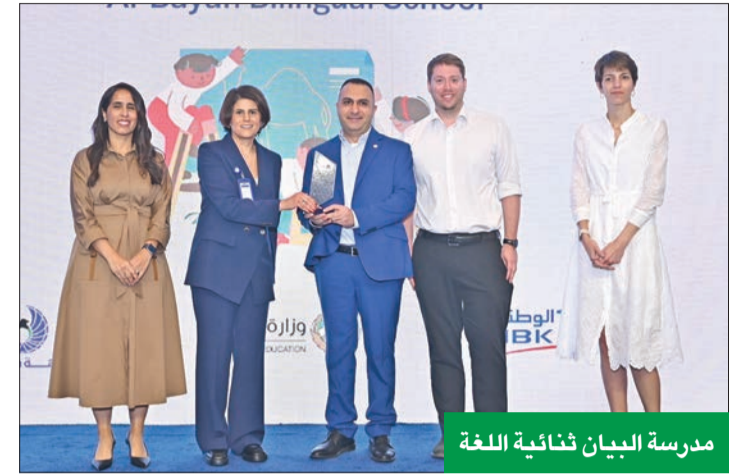
مدرسة البيان ثنائية اللغة

عبر مواقع التواصل المختلفة مثل «إنستغرام»، و«تيك توك»، و«يوتيوب». يذكر أن «الوطني» حصد أخيراً الجائزة البرونزية من «Qorus»، عن برنامج «Bankee» ضمن فئة الحوكمة البيئية والاجتماعية والمؤسسية (ESG)، حيث تعد تلك الجائزة تقديراً لابتهكارات التي تقوم بها المؤسسات لدمج الاستدامة والمعايير البيئية والاجتماعية والحوكمة في أنشطتها.