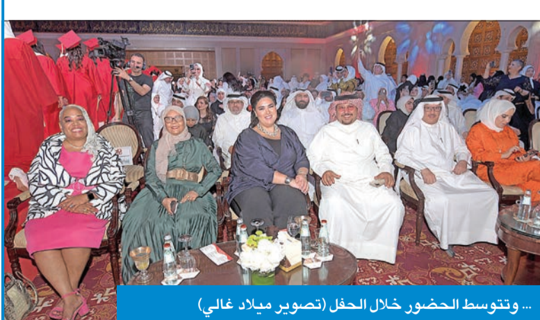
... وتتوسط الحضور خلال الحفل

إن يوفقن، ويسد خطاكن على طريق الخير. واختتمت كلمتها بتوجيه الشكر إلى كل من ساهم ويساهم في رفع شأن العلم والعمل، وكل من يساهم في رفعة مدرسة الإبداع الأميركية للبنات، مباركة للطالبات وأولياء أمورهن، ولأعضاء إدارة المدرسة، وأعضاء هيئة التدريس.