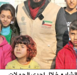
الشايح خلال إحدى الحملات

استمراراً لجهود قطاع الأمن العام في ضبط الخارجين عن القانون، نفذت مديرية أمن محافظة الأحمدية، ممثلة في إدارة العمليات والدوريات، حملة أمنية بمنطقة المهبولة أسفرت عن ضبط 5 باعة متجولين يقومون ببيع مواد غذائية وملابس مستعملة، وتم إحالتهم إلى جهة الاختصاص، لاتخاذ الإجراءات القانونية اللازمة بحقهم.