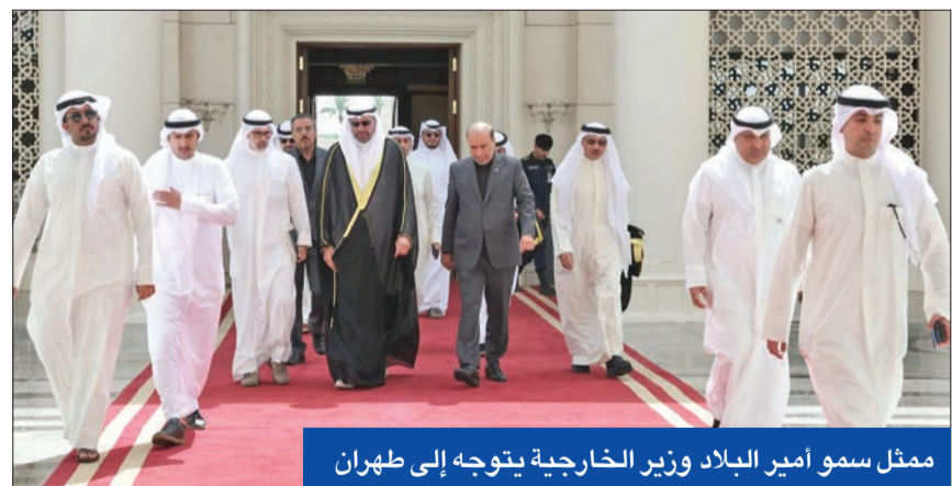
ممثل سمو أمير البلاد وزير الخارجية يتوجه إلى طهران

وانضم إلى موكب التشييع رئيس المكتب السياسي لحركة «حماس» إسماعيل هنية، ونائب الأمين العام لحزب الله اللبناني نعيم قاسم. وقال هنية للصحف «نحن مطمئنون أن الجمهورية