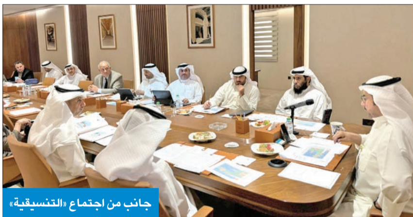
جانب من اجتماع «التنسيقية»

7 مواقع بديلة لمراكز التموين مساحتها من 500 حتى 1000م 2 لتعزيز الأمن الغذائي