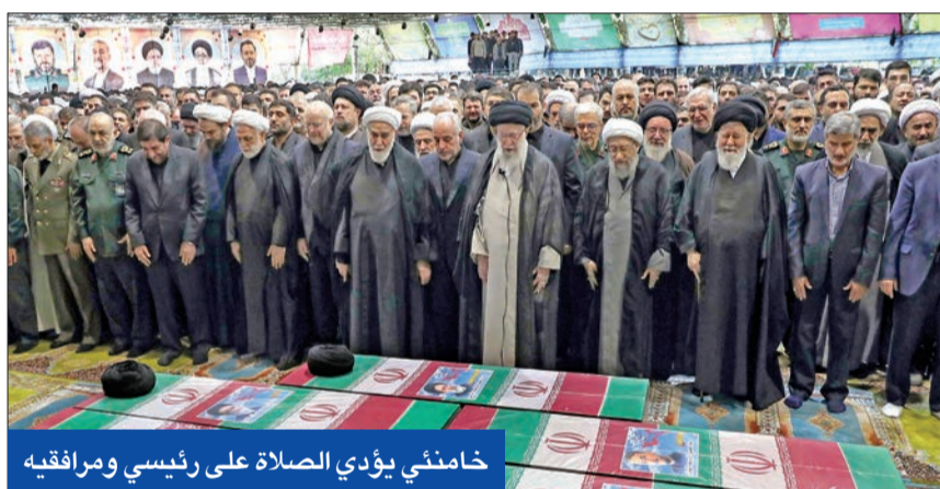
خامنئي يؤدي الصلاة على رئيسي ومرافقيه

المتطورة المزودة برادار SAR لتتخذ مهام في شمال المحيط الهندي ويعدها لمسافة كبيرة عن موقع تحطم المروحية، اضطرت فرق الإنقاذ ببدء عملية البحث بالوسائل الأرضية.