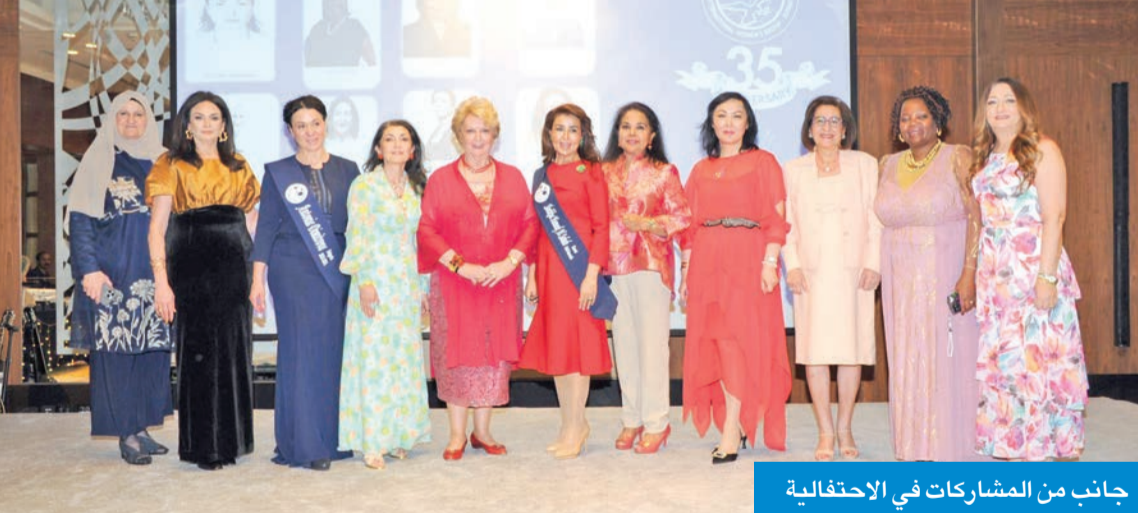
جانب من المشاركات في الاحتفالية

المجموعة شكلت مجلس إدارتها الجديد والبدر تشيد بالتنوع الثقافي لتعزيز الوحدة الوطنية