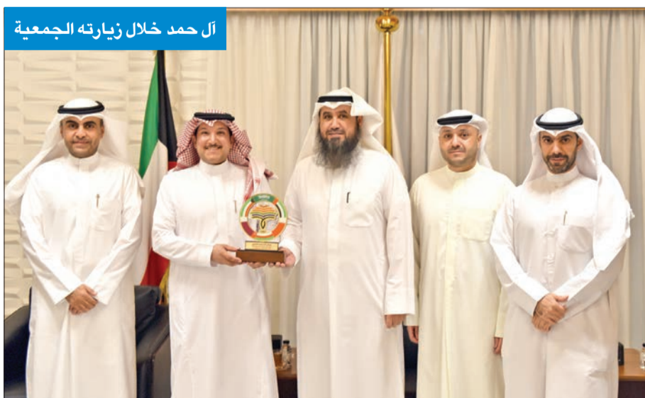
أل حمد خلال زيارته الجمعية

الحمد: حريصون على المشاركة في تحقيق التنمية وتطوير الاستثمار بالكويت