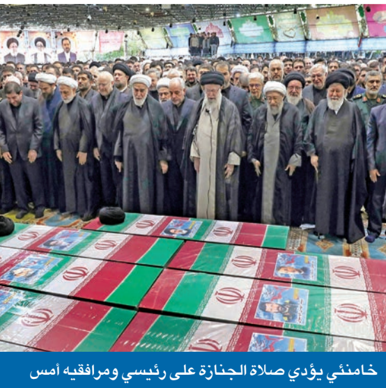
خامنئي يؤدي صلاة الجنازة على رئيسي ومرافقيه أمس

روحاني، ورئيس مجلس الشورى السابق علي لاريجاني، طلبوا لقاءات مع المرشد لاستشارته وليأخذوا الإذن منه للترشح. في المقابل، رُصدت بعض التحركات في صفوف الإصلاحيين، خصوصاً من جانب الأمين العام السابق للمجلس الأعلى للأمن القومي علي شمخاني، ونائب الرئيس السابق إسحاق جهانغيري، ورئيس مكتب روحاني محمد باقر نوبخت.