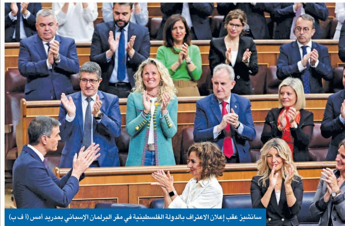
سانشيز عقب إعلان الاعتراف بالدولة الفلسطينية في مقر البرلمان الإسباني بمadrid أمس

ترحيب عربي بخطوة النرويج وإسبانيا وأيرلندا... والكويت تدعو سائر الدول لاتخاذ قرارات مماثلة ● تحفظ عربي متفاوت تصدره واشنطن... وبلجيكا على طريق الاعتراف