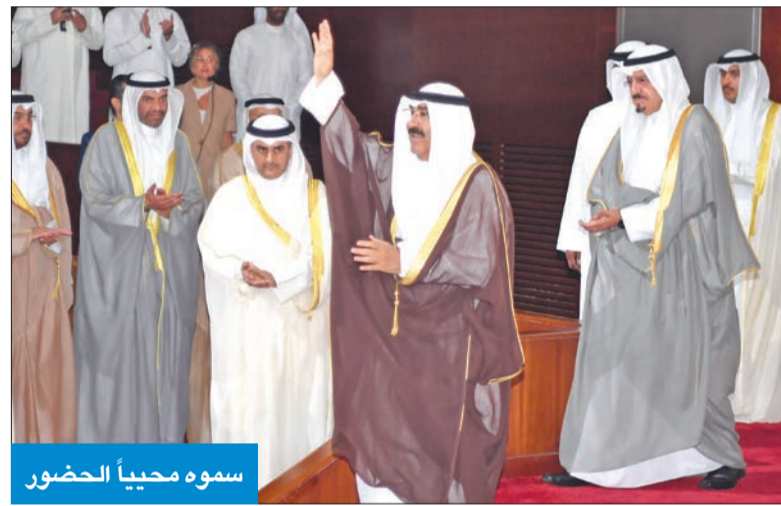
سموه محياً الحضور

برعاية وحضور سمو أمير البلاد الشيخ مشعل الأحمد، أقيم أمس حفل تكريم المتفوقين من خريجي كليات ومعاهد الهيئة العامة للتعليم التطبيقي والتدريب للعام الدراسي 2022 - 2023، على مسرح الديوان العام للهيئة الجديد بمنطقة الشويخ. وحضر الحفل سمو رئيس مجلس الوزراء الشيخ أحمد عبدالله، ورئيس المجلس الأعلى للقضاء رئيس محكمة التمييز المستشار د. عادل بورسلي، وكبار المسؤولين بالدولة وجمع غفير من اهالي الطلبة الخريجين والمواطنين.