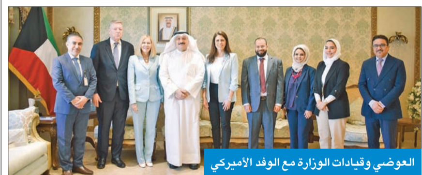
العوضي وقيادات الوزارة مع الوفد الأميركي