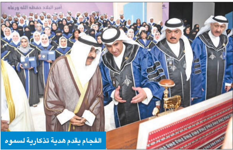
الفجام يقدم هدية تذكارية لسموه