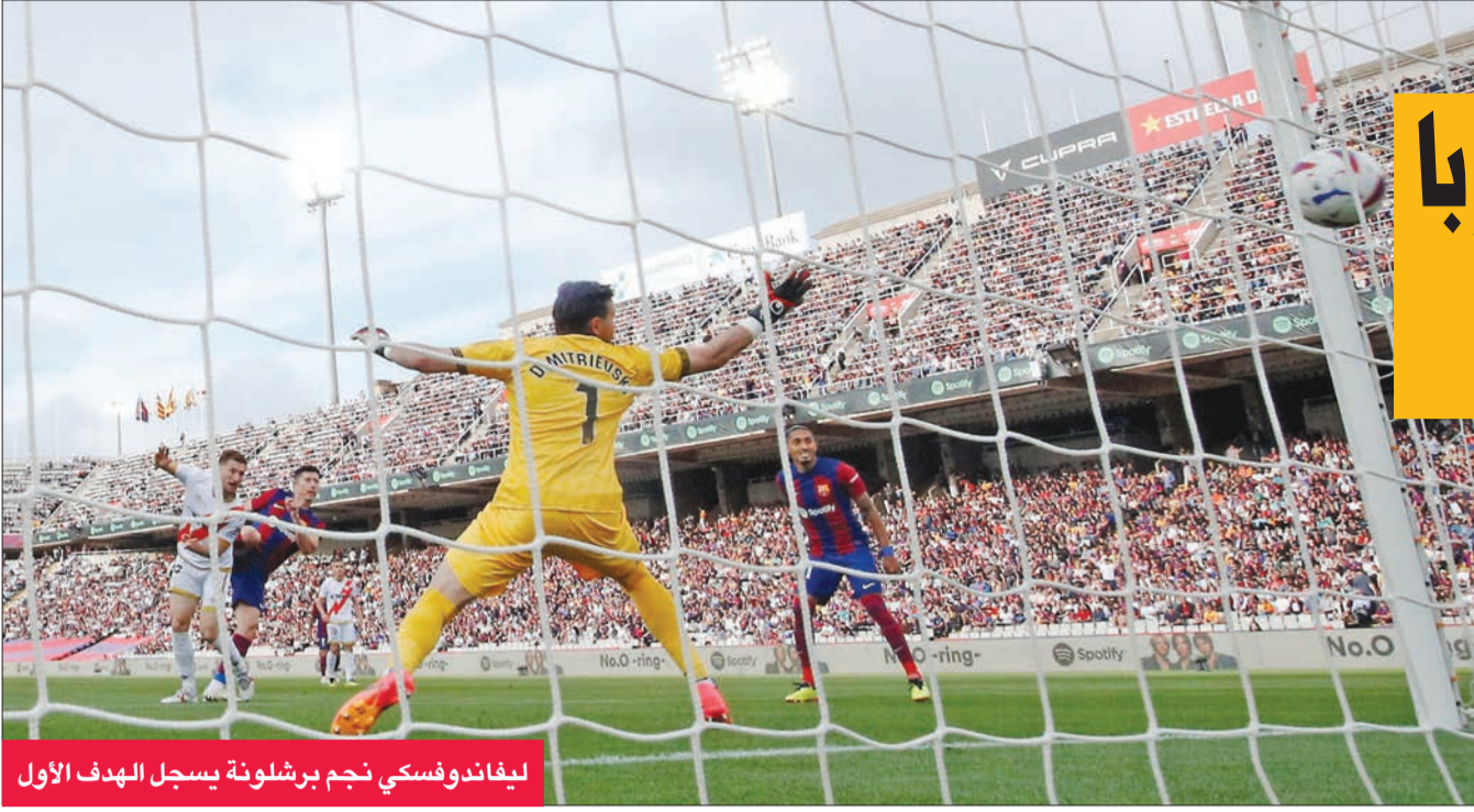
ليفاندوفسكي نجم برشلونة يسجل الهدف الأول

بقي متخلفاً بفارق 4 نقاط عن ريال مايوركا السابع عشر الذي تعادل بدوره مع ضيفه الميريلا الأخير 2-2. وضمن بلباو المركز الخامس بعدما ابتعد بفارق خمس نقاط عن سوسيداد، بفوزه على ضيفه إشبيلية بهدفين نظيفين. وعمق سلطا فيجو جراح مضيئه الهابط غرناطة التصع عشر بالفوز عليه 2-1، رافعا رصيده الى 40 نقطة في المركز الرابع عشر.