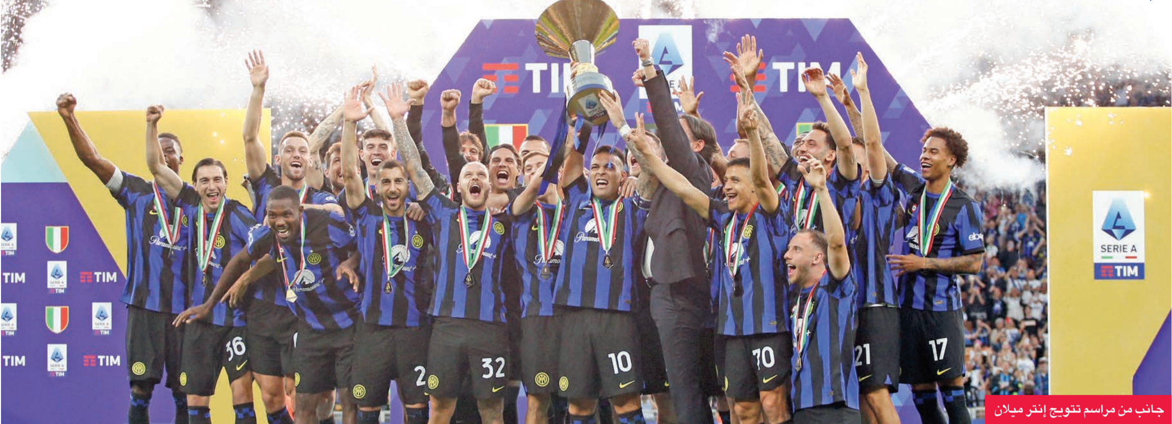
جانب من مراسم تتويج إنتر ميلان

ويدين «الذئاب» بالفضل في اقتناص النقاط الثلاث للنجم البلجيكي روميلو لوكاكو، الذي سجل الهدف الوحيد في الدقيقة 79، برأسية من صناعة ستيفان الشعراوي. واستعاد روما بهذه النتيجة طعم الانتصارات، تعادلت وخسارة، وكذلك خروج من الدوري الأوروبي من نصف النهائي على يد باير ليفركوزن الألماني، بطل ألمانيا. ورفع الفريق العاصمي رصيده إلى 63 نقطة، ويضمن إنهاء الموسم في المركز الخامس، المؤهل للدوري الأوروبي في الموسم المقبل. بينما تكبد جنوى خسارته الثانية في آخر 5 مباريات، 13 هذا الموسم، بـ66 نقطة في المركز 12.