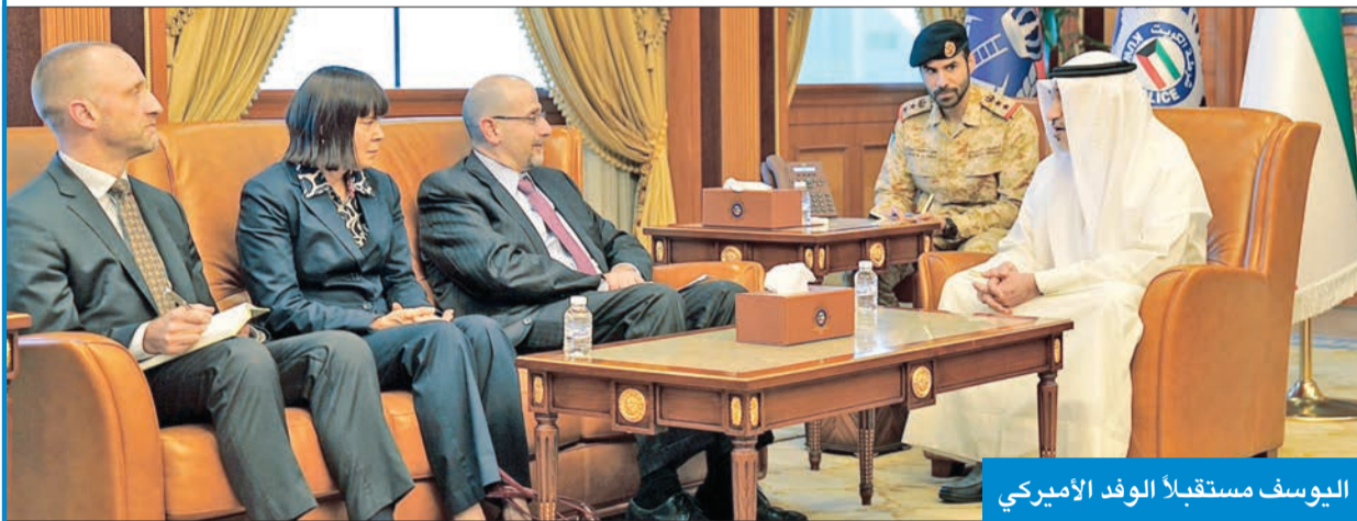
اليوسف مستقبلاً الوفد الأميركي