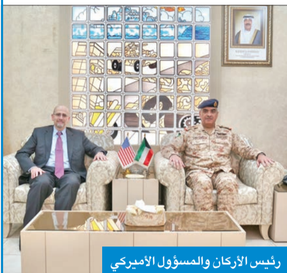
رئيس الأركان والمسؤول الأميركي

بحث رئيس الأركان العامة للجيش الفريق الركن طيار بندر المرزوق ووكيل وزارة الدفاع الشيخ د. عبدالله المشعل، كل على حدة، مع نائب مساعد وزير الدفاع الأميركي دانيال شايبيرو والوفد المرافق له وجهات النظر حول العديد من القضايا والمواضيع ذات الاهتمام المشترك، بمناسبة زيارته الرسمية للبلاد. وذكرت وزارة الدفاع، في بيان صحفي أمس، أنه تم خلال اللقاء تبادل وجهات النظر حول عدد من القضايا، إضافة إلى بحث أوجه التعاون والعمل المشترك في المجالات الدفاعية بين البلدين الصديقين، كما تم استعراض آخر التطورات والمستجدات الراهنة على الساحتين الإقليمية والدولية.