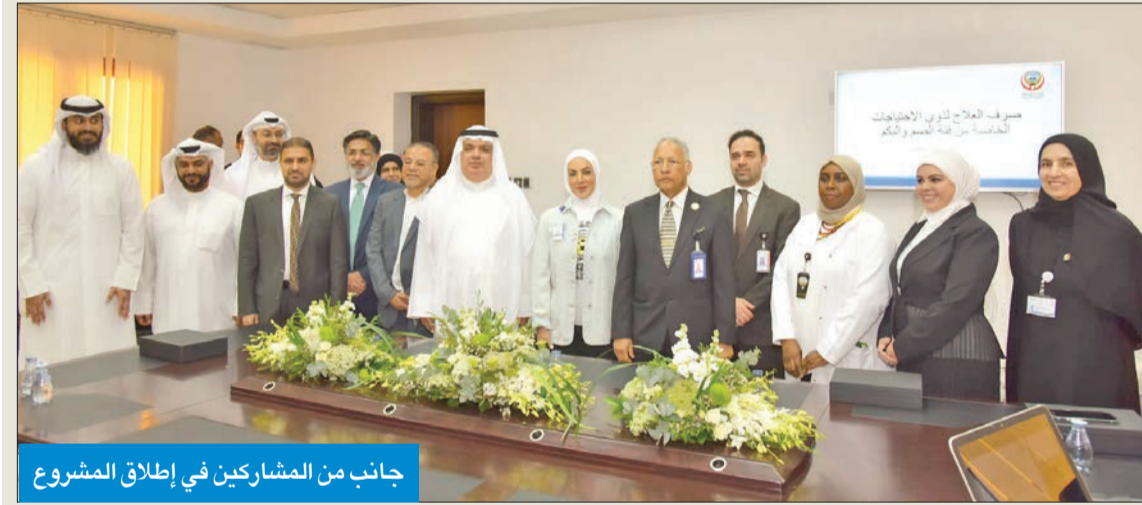
جانب من المشاركين في إطلاق المشروع

الصيدلية المحمولة وفي الصيدلية الرئيسية في مركز العدان التخصصي.