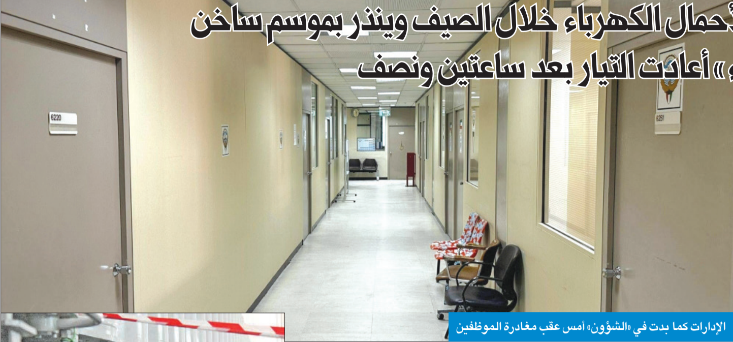
الإدارات كما بدت في «الشؤون» أمس عقب مغادرة الموظفين

● في أول اختبار غير مبشر لأحمال الكهرباء خلال الصيف وينذر بموسم ساخن ● فرق الطوارئ بـ «الكهرباء» أعادت التيار بعد ساعتين ونصف