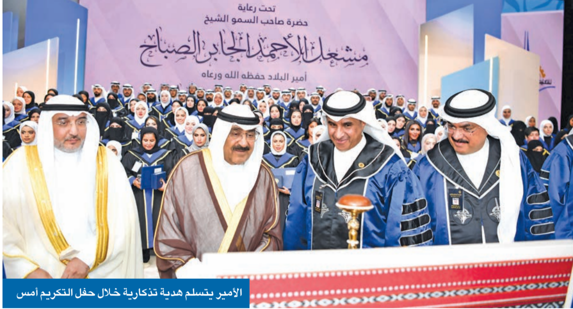
الأمير يتسلم هدية تذكارية خلال حفل التكريم أمس

صاحب السمو يكرم فائقي «التطريقي» العدواني: شبابنا ثروتنا غير الناضبة وأملنا لبناء كويت جديدة تحقيقاً لتطلعات القيادة الحكيمة