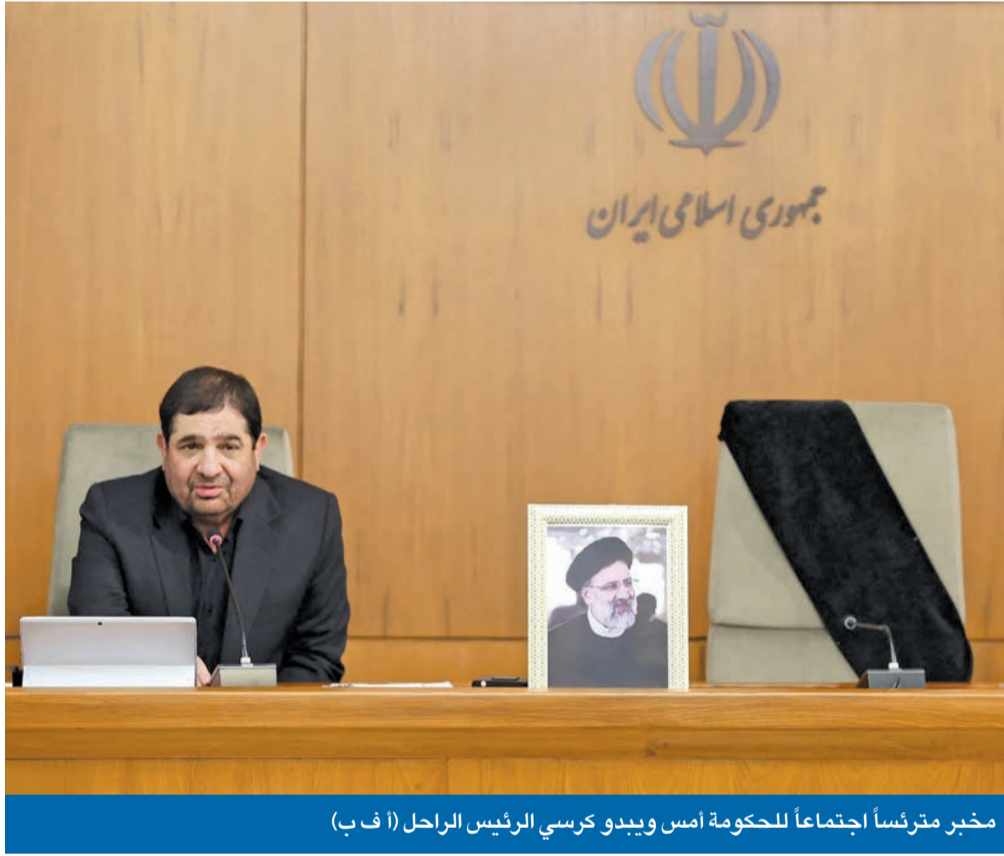
مخبر مترشحاً اجتماعاً للحكومة أمس ويبدو كرسي الرئيس الراحل

● طهران تفتح تحقيقاً بسقوط المروحية وواشنطن تستبعد هجوماً خارجياً