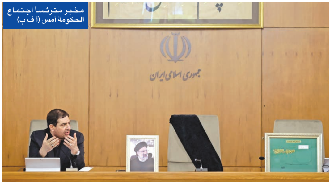
مخبر مترئسا اجتماع الحكومة أمس

تضرر الطائرة الرئيسية وهو ما لم يحصل. وتجنّب المسؤولون الإيرانيون تقديم أي تفسيرات أو تاوليات أو اتهامات بسبب حساسية الموقف، فيما أشار محللون وخبراء إلى 3 سيناريوهات محتملة وراء السقوط مؤامرة داخلية، أو مؤامرة خارجية، أو مجرد حادث عرضي بسبب الطقس. وقالت إسرائيل، التي لطالما اتهمت إيران بإقامة قواعد لجهاز الموساد على الحدود بين أذربيجان وإيران، إنها ليست المعنية بالحادث. ونقلت «رويترز» عن مسؤول إسرائيلي قوله: «لم تكن نحن». وقال مسؤول أميركي «لا يوجد أي تدخل أجنبي على الإطلاق في حادث تحطم طائرة الرئيس الإيراني».