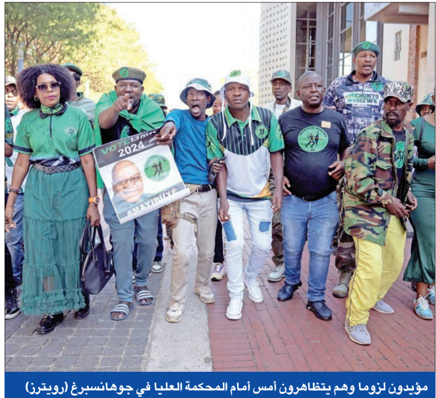
مؤيدون لزوما وهم يتظاهرون أمس أمام المحكمة العليا في جوهانسبرغ

وهند انصار حزب مخوننو ويسيزوي، الذي ينتمي إليه