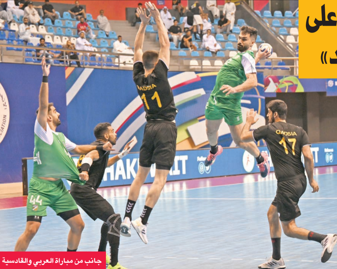
جانب من مباراة العربي والقادسية