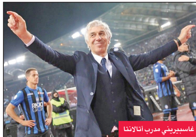
غاسبيريني مدرب أتالانتا

ونجح أتالانتا في التفوق على أندية أكبر منه تاريخياً، مثل فيورنتينا ولاتسيو، ويحتفظ برابط قوي مع مجتمعه المحلي، ويُعد من بين الأندية القليلة في الدوري الذي يملك ملعبه الخاص، ويعمل حالياً على تطويره، ليواكب التطور العصري، ومن المتوقع