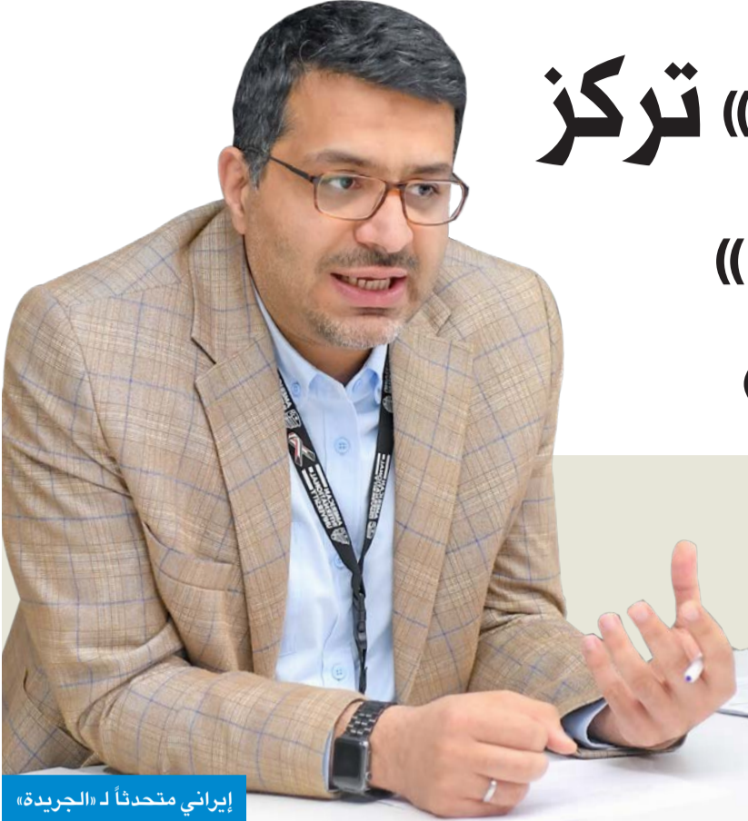
إيراني متحدثاً لـ «الجريدة»

بالنفع عليها، وتعمل على تحقيق تطور ونمو سريع في مجال البحث العلمي، ورفع مستوى الجامعة التعليمي. وذكر أن تخصص الفيزياء يحتاج إلى دعم حكومي ومادي لتعزيز الأبحاث فيه حتى يصبح معروفاً بالمجتمع، وتكون هناك رغبة طلابية للانخراط به، موضحاً أن الفيزياء لا تحظى بالشهرة الكافية في الوقت الحالي، رغم أنها تعتبر مجالاً أساسياً لتنمية أي بلد... وفيما يلي تفاصيل اللقاء.