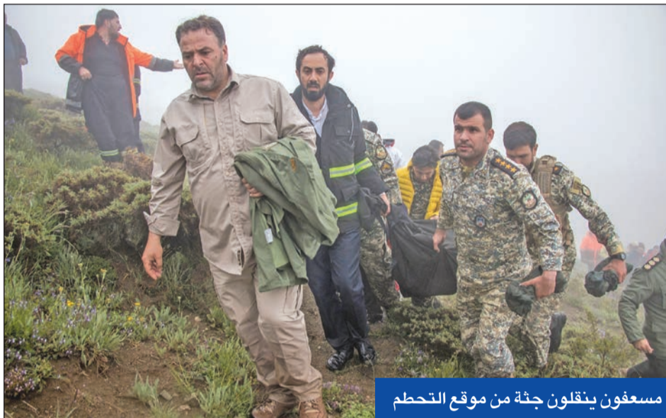
مسعفون ينقلون جثة من موقع التحطم