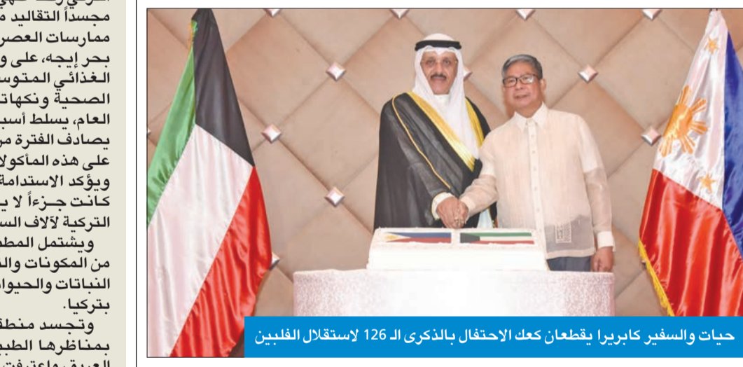
حيات والسفير كابريرا يقطعان كعك الاحتفال بالذكرى ال 126 لاستقلال الفلبين

«نسعى لتوسيع التعاون في مكافحة الإرهاب والجريمة والأمن الغذائي» 586 مليون دولار إجمالي التحويلات المالية لجاليتنا بالكويت خلال 2023