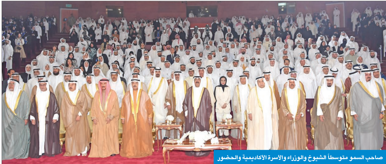
صاحب السمو متوسط الشيوخ والوزراء والأسرة الأكاديمية والحضور