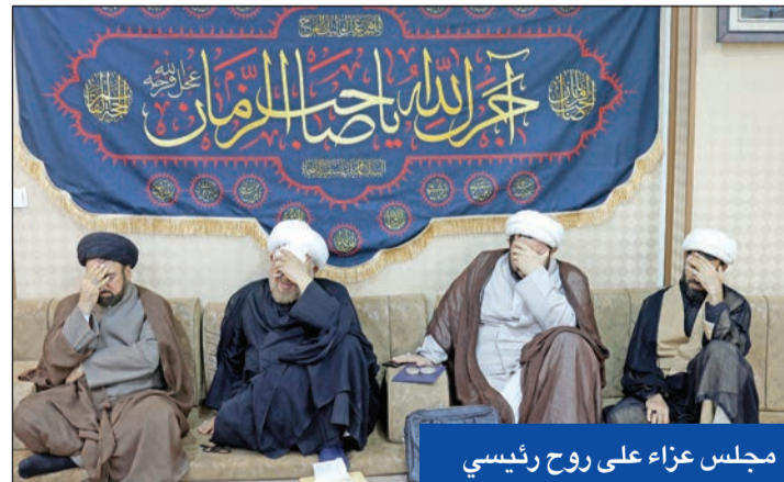
مجلس عزاء على روح رئيسي

تساؤلات حول إمكانية استعانة خامنئي بـ «الوسطيين»