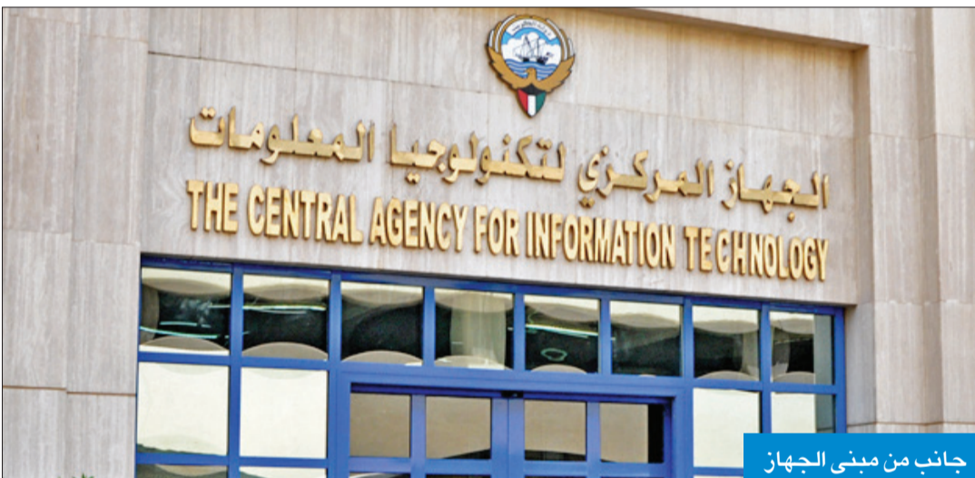
جانب من مبنى الجهاز

الاستراتيجي الذي يمكن أن يؤديه الذكاء الاصطناعي في تعزيز مكانة البلاد كقائد في العصر الرقمي، مما يمكن المؤسسات من تحقيق الابتكار والأزدهار ودفع عجلة التقدم.