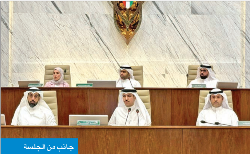
جانب من الجلسة