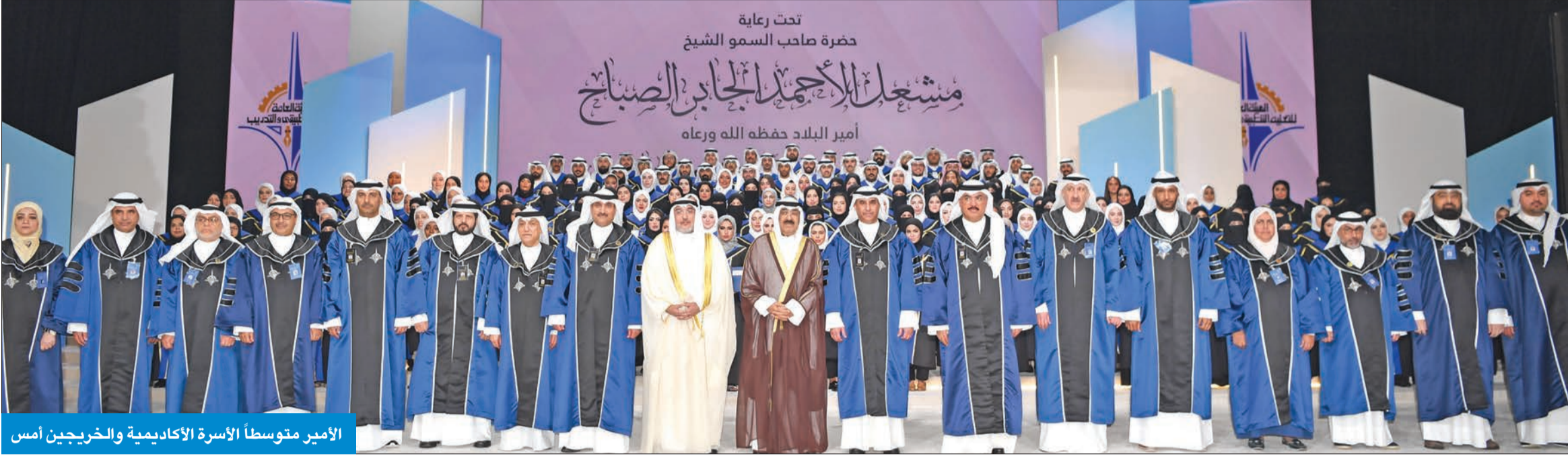
الأمير متوسط الأسرة الأكاديمية والخريجين أمس

● العداوي: الرعاية السامية للتكريم تؤكد الاهتمام الفائق لصاحب السمو بأبناء الهيئة ● الفجام: تشريف سموه هو احتفال بعودة الروح والفرح الحقيقي إلى قلب الهيئة