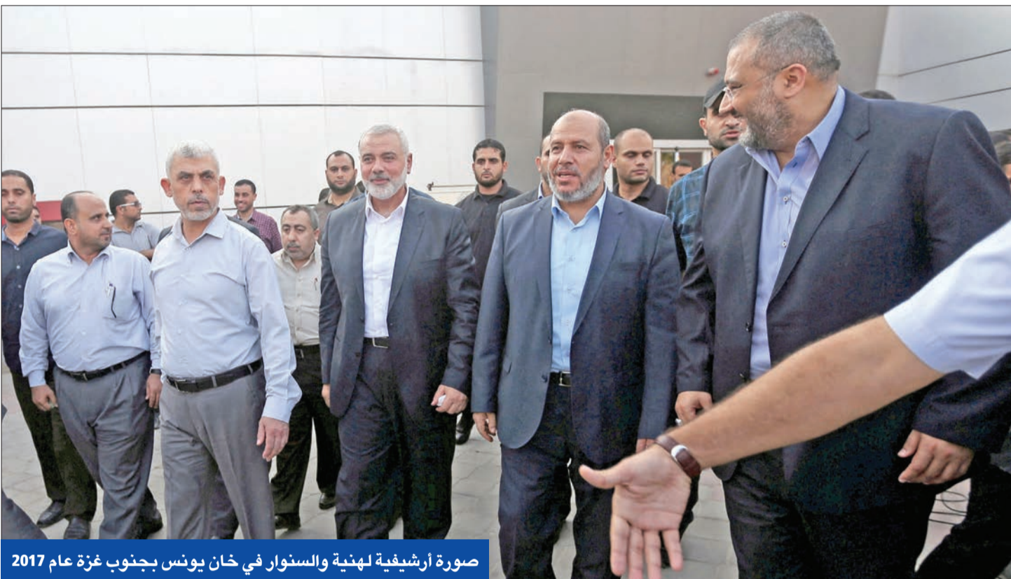
صورة أرشيفية لهنية والسنوار في خان يونس بجنوب غزة عام 2017

طلب المدعي العام بالمحكمة الجنائية الدولية، كريم خان، إصدار مذكرة اعتقال بحق رئيس الوزراء الإسرائيلي بنيامين نتنياهو، ووزير الدفاع يوآف غالانت وزعيم «حماس» إسماعيل هنية ويحيى السنوار، على خلفية اتهامهم بارتكاب جرائم حرب، في حين دعا مستشار الأمن القومي الأمريكي، جيك سوليفان، قادة إسرائيل إلى وضع خطة استراتيجية لحربهم المتواصلة بغزة.