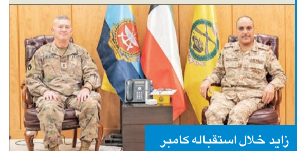
زايد خلال استقباله كامير

استقبل أمر القوة البرية اللواء الركن خالد علي زايد، بمكتبه، صباح أمس، قائد قوة سبارتن الأميركية اللواء تشارلز كامير، وتم خلال اللقاء تبادل الأحاديث الودية ومناقشة أهم الأمور والمواضيع ذات الاهتمام المشترك لاسيما المتعلقة بمحور اللقاء.