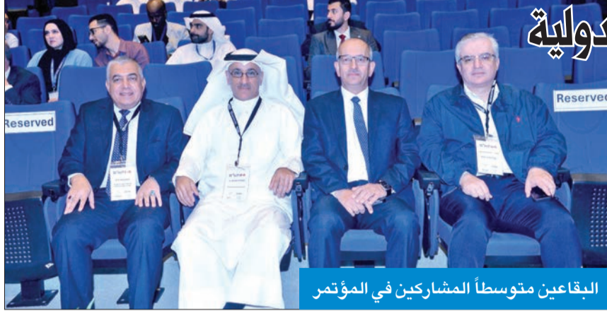
البقاعين متوسطاً المشاركين في المؤتمر