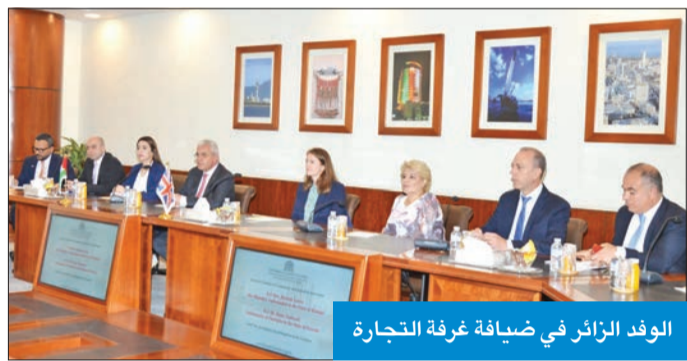
الوفد الزائر في ضيافة غرفة التجارة