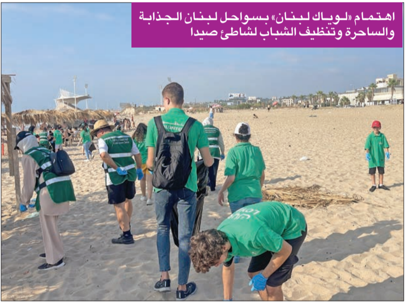
اهتمام «لويك لبنان» بسواحل لبنان الجذابة والساحرة وتنظيف الشباب لشاطئ صيدا

«تجميل بيروت» مشروع لتلوين حوائط بيروت بريشة فنانيين لبنانيين وبمساعدة المتطوعين الشباب