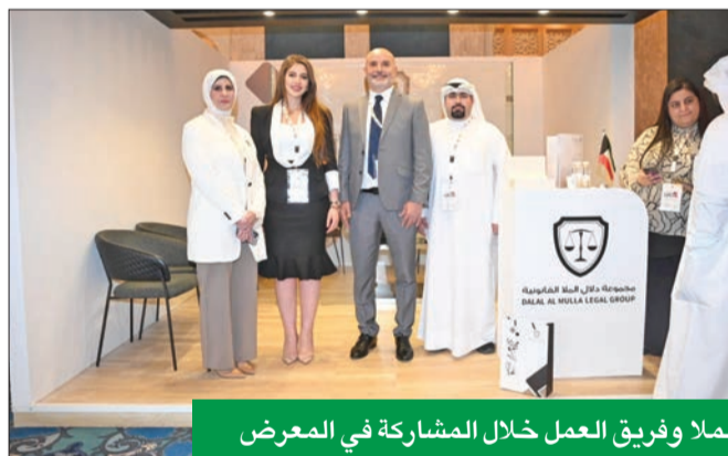
الملا وفريق العمل خلال المشاركة في المعرض

القانونية في العاصمة البريطانية لندن، في عام 2023 لتزويد عملائها في بريطانيا وبلدان الاتحاد الأوروبي والكويت بدعم قانوني شامل. وهو النهج الذي اتخذته منذ إنطلاقها عام 2003، لتحقيق مكانة كبيرة في الكويت والمنطقة، حيث استطاعت المجموعة «ترسيخ سمعتها كواحدة من أبرز المرجعيات القانونية التي تتمتع بالموثوقية والمصداقية والمهنية العالية في الكويت والعالم، وذلك بفضل فريقها المتميز من المحامين والمستشارين القانونيين المتخصصين في مختلف المجالات، مما يمكنها من تلبية احتياجات العملاء بكفاءة، وبفضل التزامها بأعلى معايير الأمانة والمسؤولية.