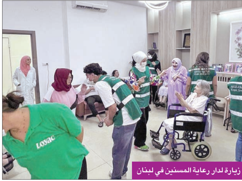
زيارة لدار رعاية المسنين في لبنان

رغم التحديات الاقتصادية والسياسية، تواصل «لويك لبنان» برامجها في تهيئة الأجيال عبر العمل المستمر على 3 مجالات أساسية هي: الخدمة المجتمعية، والتمكين الشخصي، والتطوير المهني.