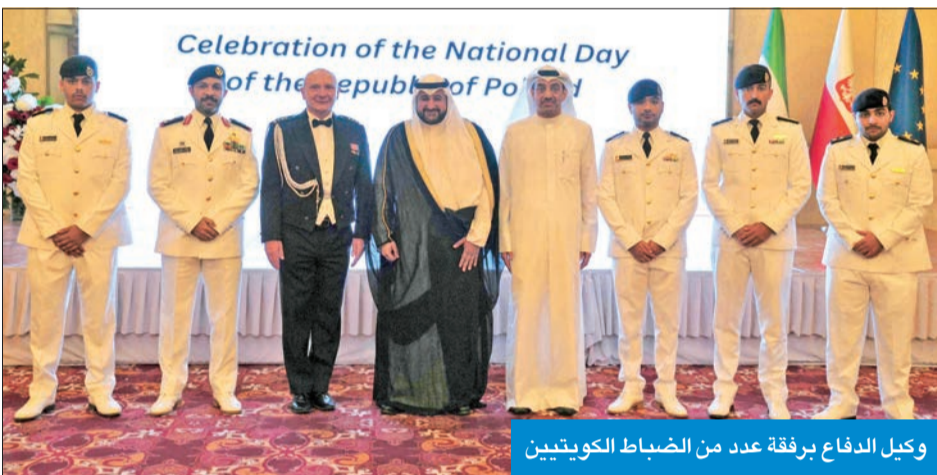
وكيل الدفاع برفقة عدد من الضباط الكويتيين

وصفت القائمة بالأعمال في سفارة بولندا لدى البلاد، أنا مارغا غودوي-تشيشكوفسكا، العلاقة بين بولندا والكويت بأنها «قوية»، كاشفة عن افتتاح خط طيران جديد بين الكويت ومدينة كراكوف، وأعربت عن فخرها بتسهيل برنامج تدريب لطلاب خفر السواحل والبحرية الكويتية في بلادها.