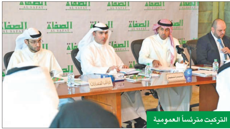
التركيت مترشداً العمومية

المسؤولية المجتمعية تعتبر المسؤولية الاجتماعية لـ «الصفة» من العناصر الحيوية والفعالة التي تعبر عن هويتها، إذ تشجع الشركة على فعل الخير والإحفاء به والتطوير الدائم للأفضل، فضلاً عن نشر الوعي والثقافة من خلال الإعلام وتبسيط الضوء الإيجابي على الإنجازات وتقديم المساعدة الدائمة في أقرب فرصة متاحة. وسعت الشركة في عام 2023 إلى التوسع في رؤيتها وتنويع مصادر العطاء، وتركزت الحصة الأكبر على ما كل يخص الصحة والشباب وتمكين المرأة. ونظمت «الصفة» خلال العام الماضي احتفالاً بالعيد الوطني وعيد التحرير للبلاد، وشاركت في رعاية حدث تمكين المرأة في استوديو فولفو، إضافة إلى مشاركتها في يوم البيئة ومعرض وظيفتي، وفعاليات التوعية الصحية.