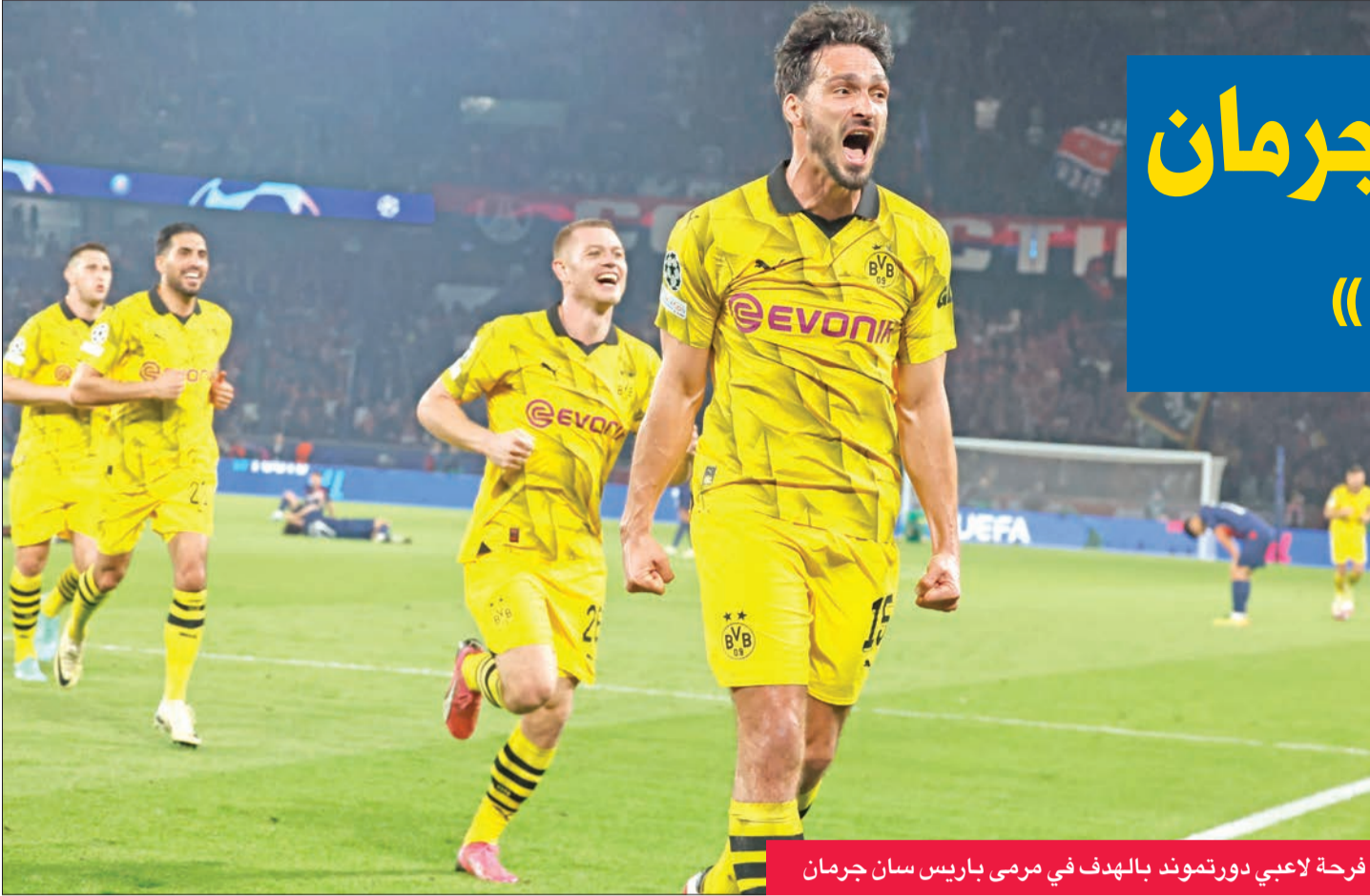
فرحة لاعبي دورتموند بالهدف في مرمى باريس سان جرمان