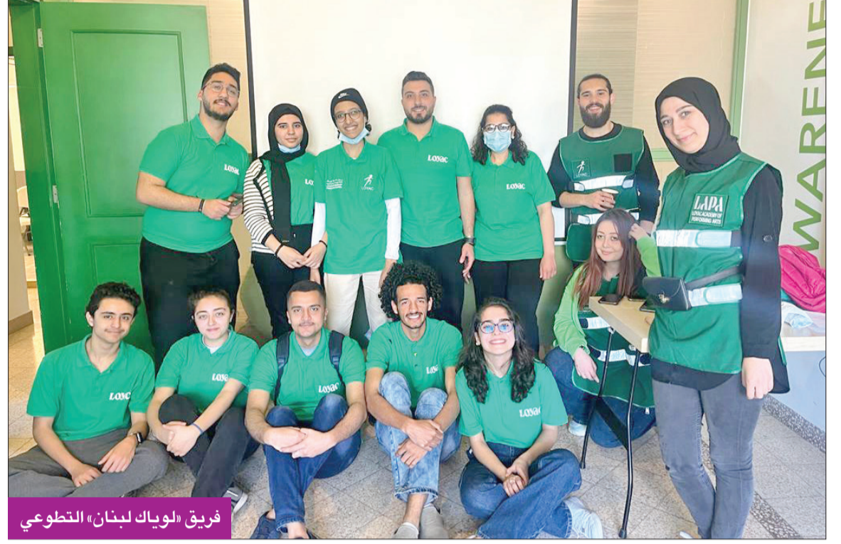
فريق «لويك لبنان» التطوعي