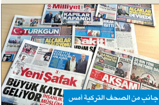
جانب من الصحف التركية أمس

أبرزت الصحافة التركية أنباء الزيارة التاريخية لسمو أمير البلاد الشيخ مشعل الأحمد إلى تركيا حيث خصصت مساحات كبيرة في صدر صفحاتها الأولى لوصف الزيارة والمباحثات التي أجراها سموه مع الرئيس التركي رجب طيب أردوغان.