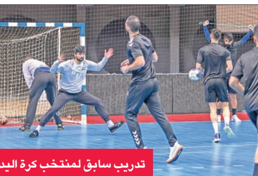
تدريب سابق لمنتخب كرة اليد

على الصليبيخات بهدف دون رد، وضمن معه التأهل للدوري الممتاز. في المقابل، تتأرجح بطاقة (الوصيف بـ 26 نقطة)، والساحل (الثالث بـ 24 نقطة). ويكفي التضامن، الذي يقوده اليوم المدرب جمال القنبدي، بعد توليه المهمة خلفاً للمدرب البرتغالي ميغيل ليال، الذي أنهى عقده بالتراضي، التعادل في لقاء اليرموك، من أجل حجز بطاقة التأهل الثانية، كون نتائج المواجهات المباشرة مع الساحل نصبت في مصلحته، بعد أن حقق الفوز في