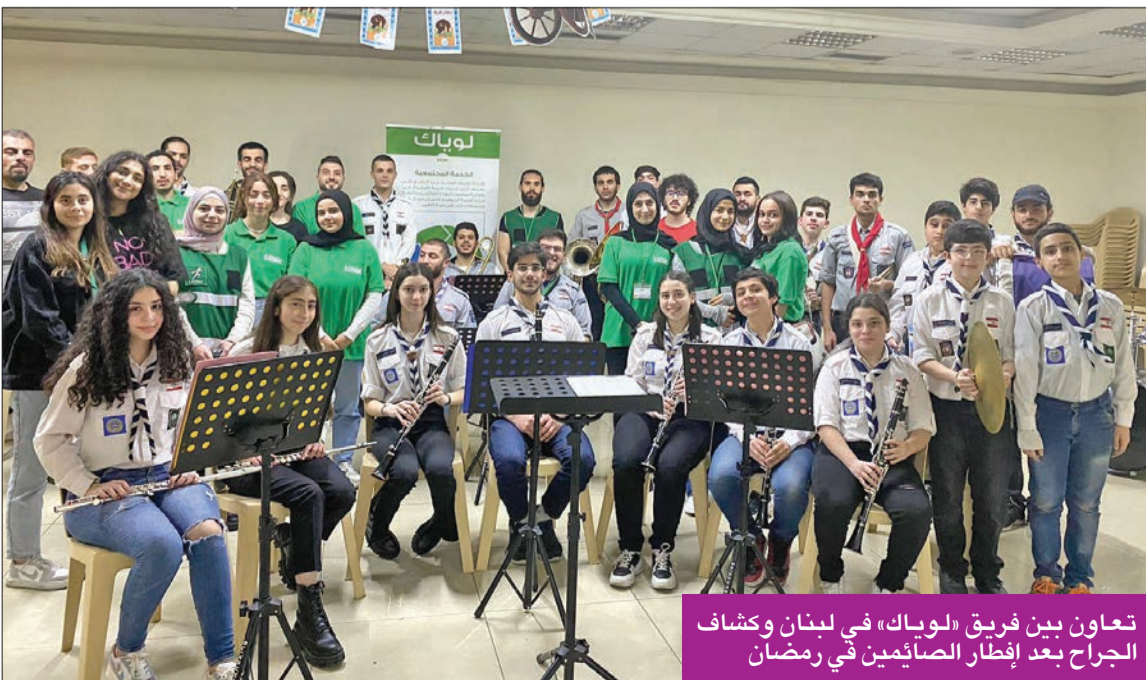
تعاون بين فريق «لويك» في لبنان وكشاف الجراح بعد إفطار الصائمين في رمضان