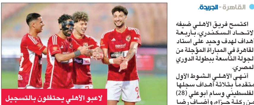
لاعبو الأهلي يحتفلون بالتسجيل

الاحتساك مع مدارس مختلفة في المباراة في التطبيق التكتيكي لطرق اللعب التي بنى الاعتماد عليها في الفترة المقبلة، والوقوف على مستوى جميع لاعبي «الأزرق» واحتياجاتهم من جميع الجوانب، واكتساب الخبرة اللازمة من الاحتكاك مع مدارس مختلفة في اللعبة. الدوري برصيد 30 نقطة من 14 مباراة، فيما تجمد رصيد الاتحاد عند 32 نقطة من 21 مباراة، ليبقى في المركز الخامس. من جانب آخر، تشهد منافسات الجولة 22 بالدوري المصري، إقامة مباراتين اليوم (الخميس)، إذ يستضيف الأهلي فريق سموحة، صاحب المركز السادس بـ 31 نقطة، نظيره زد إف سي، الثالث بـ 33 نقطة.