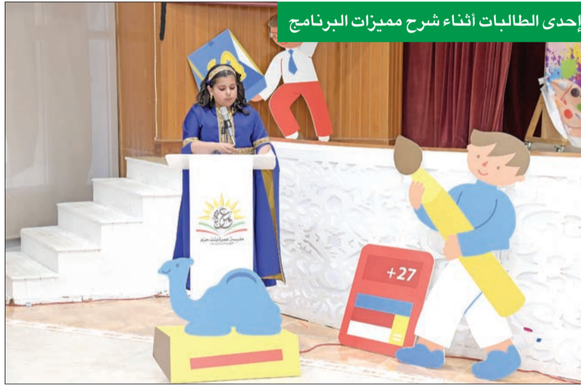
إحدى الطالبات أثناء شرح مميزات البرنامج

النظام الاقتصادي الواقعي بأساليب عملية وضمن بيئة تفاعلية، الأمر الذي سيجني المجتمع بأسره ثماره على المدى الطويل، وستمدد آثاره الإيجابية لتشمل الاقتصاد الكويتي بشكل عام. وأكد أن «الوطني» لا يالو جهداً في دعم المبادرات الوطنية التي من شأنها تهيئة جميع السبل أمام أبناء وبنات الكويت منذ صغرهم، ليكونوا قادرين على أداء دور مؤثر في بناء نهضة الكويت وازدهارها مستقبلاً، مشيراً إلى أن الاستثمار في الطلاب والطالبات من الصغر ومدّم بما يحتاجون إليه من دعم ومؤازرة تعليمية تواكب أحدث الأساليب المتبعة عالمياً من شأنه أن يُنشئ جيلاً قادراً على رفع راية الكويت خفاقة في جميع المجالات.