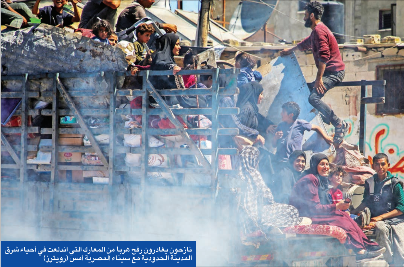
نازحون يغادرون رفح هرباً من المعارك التي اندلعت في أحياء شرق المدينة الحدودية مع سيناء المصرية أمس

اختتام جولة مفاوضات جديدة في القاهرة «بلا اختراق»... واشتباكات عنيفة بالأحياء الشرقية لرفح