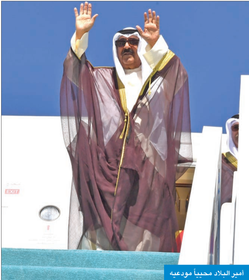
أمير البلاد محياً مودعيه

سموه أنهى زيارة دولة إلى تركيا وأبرق إلى أردوغان مؤكداً عمق الروابط واعتزاز به «وسام الدولة»