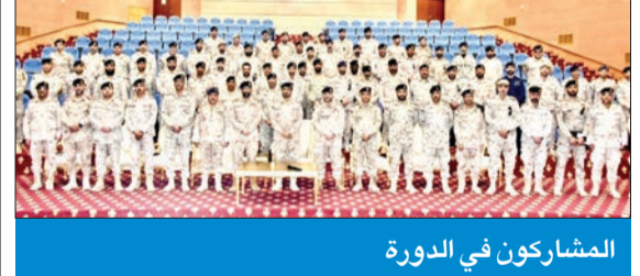
المشاركون في الدورة

نظم مركز الدراسات والبحوث دورة الذكاء الاصطناعي في الطائرات المسيّرة وتأثيراتها على التكنولوجيا والأمن العسكري، لمنسوبي الجيش الكويتي، بمشاركة ضباط من وزارة الداخلية والحرس الوطني، تحت رعاية رئيس الأركان العامة للجيش الفريق ركن طيار بندر المرزوق، وبحضور أمر مركز الدراسات والبحوث اللواء الركن محمد ناصر فلاح. وتهدف هذه الدورة إلى إبراز ونشر دور تقنية الذكاء الاصطناعي واستخداماتها، خصوصاً بالمجال الأمني والعسكري منها، كعمليات البحث والإنقاذ وحماية السفن والموانئ البحرية وقياس نسب ومعدلات التلوث باستخدام الطائرات المسيّرة.