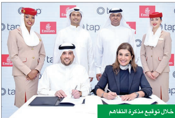
خلال توقيع مذكرة التفاهم

ومن خلال هذه الشراكة الاستراتيجية، تهدف شركة تاب للمدفوعات وطيران الإمارات إلى الحصول على قاعدة من الشركات الصغيرة والمتوسطة الحجم وجذبها في جميع أنحاء المنطقة، بهدف الاستفادة من برنامج بيزنس ريواردز لطيران الإمارات بحلول عام 2025. إن هذه الشراكة تسعى إلى تحقيق تحول جذري في كيفية إدارة الشركات الناشئة والصغيرة والمتوسطة لأعمالها في منطقة الشرق الأوسط وشمال إفريقيا وخارجها، من خلال تقديم منتجات دفع متقدمة ومكافآت سفر استثنائية من طيران الإمارات.