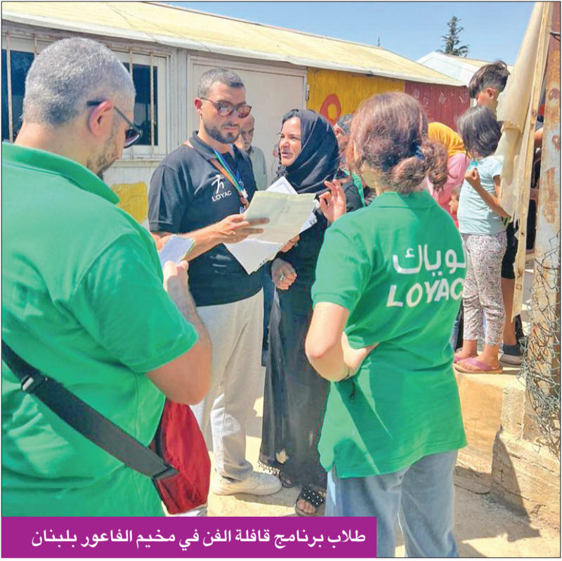
طلاب برنامج قافلة الفن في مخيم الفاعور بلبنان