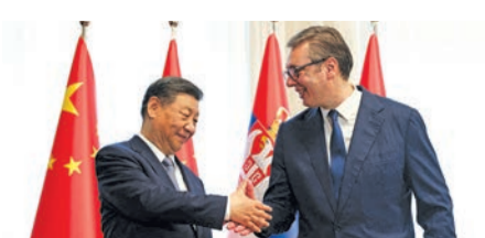
شي وفوتشيتش في بلغراد أمس

غداة زيارة «معددة» لفرنسا تخللتها مفاوضات صعبة حول روسيا والتنافس التجاري، حظي الرئيس الصيني شي جينبينغ، أمس، باستقبال شعبي ورسمي حافل لدى وصوله إلى صربيا في ثاني محطات جولته الأوروبية، التي ستقوده أيضاً إلى المجر، واللتيين تعذان من بين البلدان الأكثر تودداً لبكين وتعاطفاً مع موسكو في أوروبا. ووقع الرئيس الصيني مع نظيره