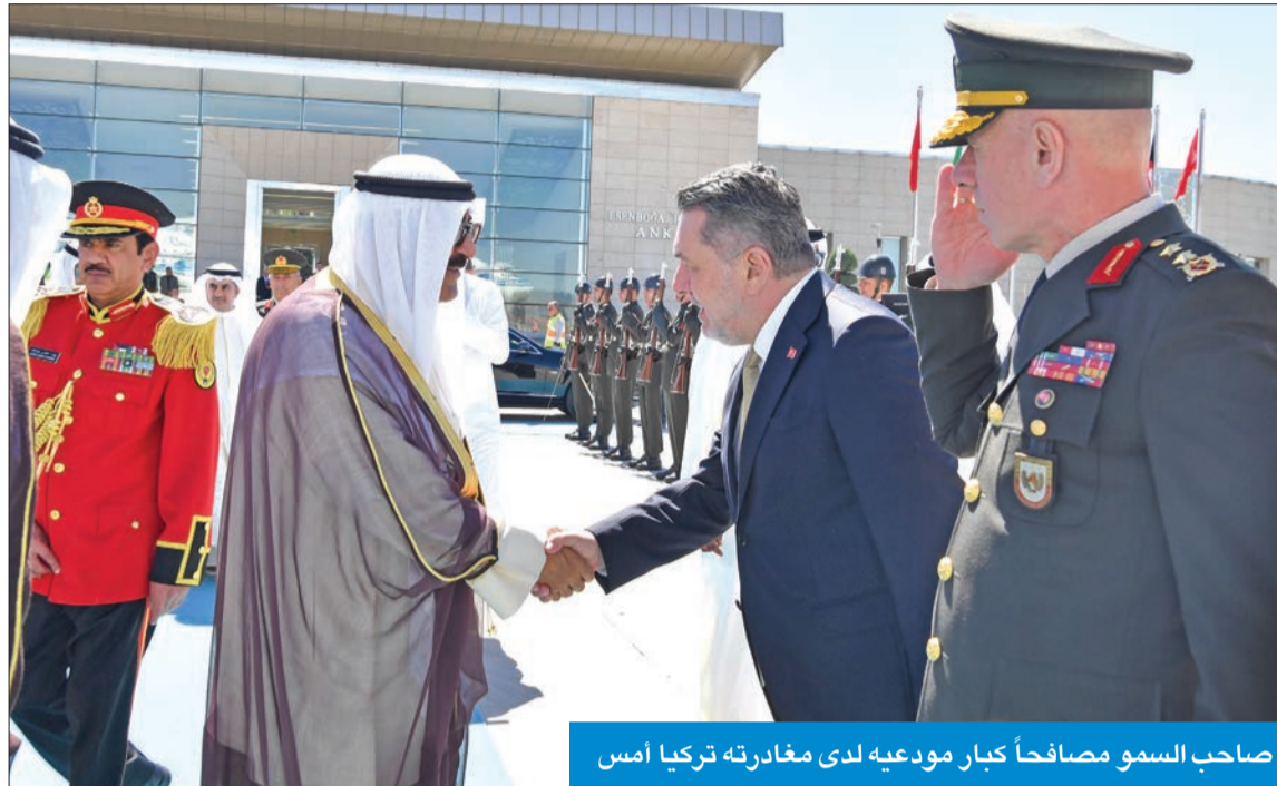
صاحب السمو مصافحاً كبار مودعيه لدى مغادرته تركيا أمس

استمرار دعم سيادة الكويت وسلامتها الإقليمية وأمنها وتطوير التعاون مع دول «الخليج» الرئيس التركي