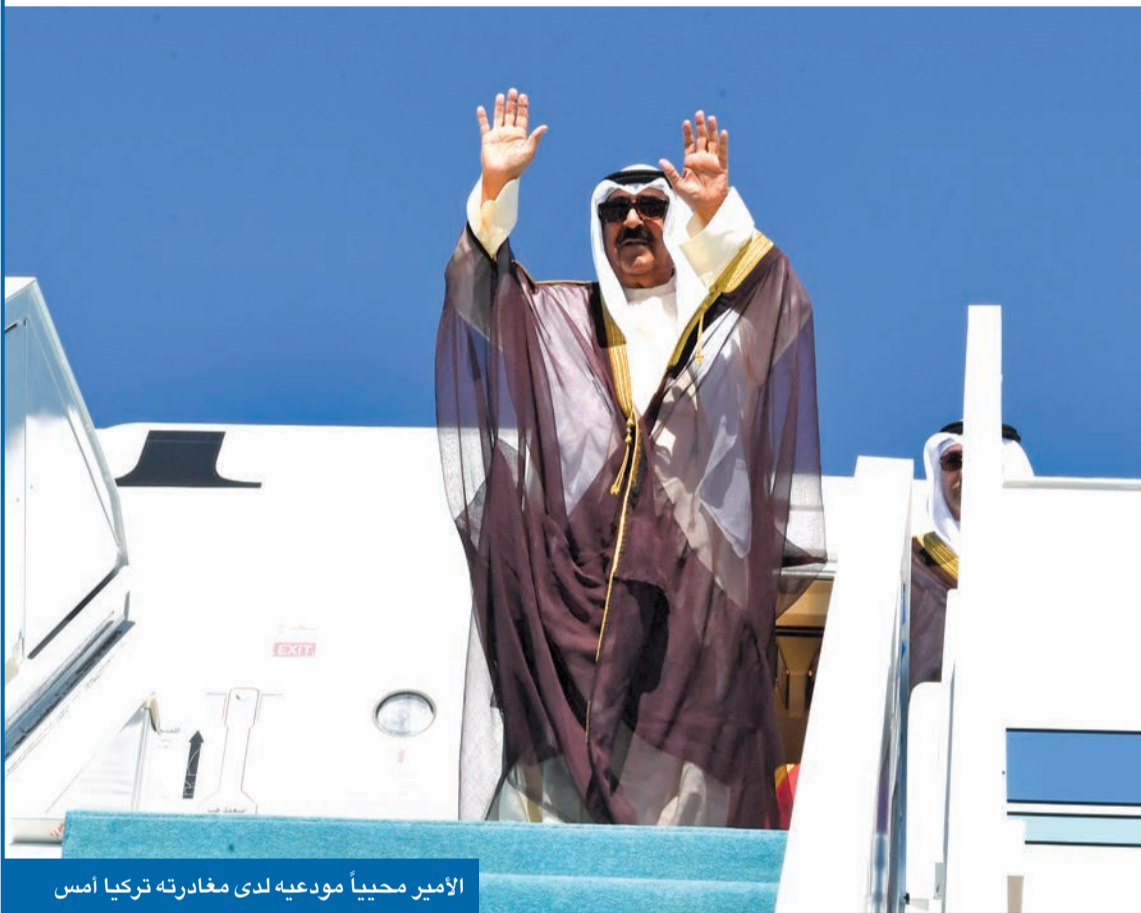
الأمير محياً مودعيه لدى مغادرته تركيا أمس