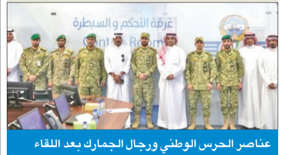
عناصر الحرس الوطني ورجال الجمارك بعد اللقاء

استقبلت الإدارة العامة للجمارك متدربي رئاسة الحرس الوطني الكويتي، وتم عمل جولة ميدانية لهم في إدارة المخاطر (غرفة التحكم والسيطرة) التابعة لقطاع البحث والتحري. وقالت الإدارة العامة للجمارك، إن بروتوكول التعاون القائم بين الجهتين، الذي وقع في 1 نوفمبر 2021، يهدف إلى تسخير كل الإمكانيات المشتركة للتعاون، لضمان جاهزية المنافذ وأمن وتيسير التجارة عبر الحدود وحماية الاقتصاد الوطني من كل المخاطر في حالات الطوارئ. وأضافت أن من أبرز نقاط بروتوكول التعاون تسخير الإمكانيات وتطوير القدرات لكلا الطرفين، لتلبية الاحتياجات الطارئة وفق خطط تعاون محكمة وأدوار بمسؤوليات محددة وخطط اتصال فعالة مع موظفي الجمارك.