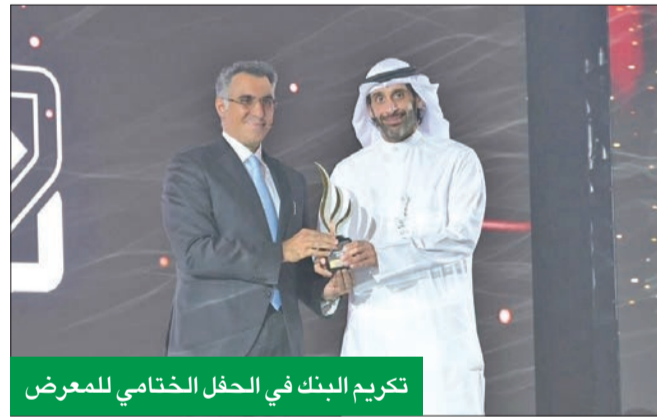
تكريم البنك في الحفل الختامي للمعرض

وأتاح الحدث الذي يربط الطلبة بأصحاب العمل المحتملين، الفرصة لـ «الأهلي» للتعرف على المواهب وأصحاب الكفاءات من الطلبة والخريجين، وجذب الكفاءات من الكوادر الوطنية القادرة على المساهمة بنموه ونجاحه على جميع الصعد. علاوة على ذلك، تؤكد رعاية البنك للمعرض تفانيه في دعم المواهب الوطنية، وتعزيز القوى العاملة في الكويت، حيث يظهر من خلال هذه المبادرات التزامه بالاستثمار في المواهب من الكوادر الوطنية، وتوفير فرص النمو الوظيفي لفريق عمله، والمساهمة بالتنمية الاقتصادية الشاملة في الكويت. وأضافت الأريش: «نفخر بدعم المواهب الوطنية، وتوفير فرص النمو والتطوير المهني، ونهدف من خلال