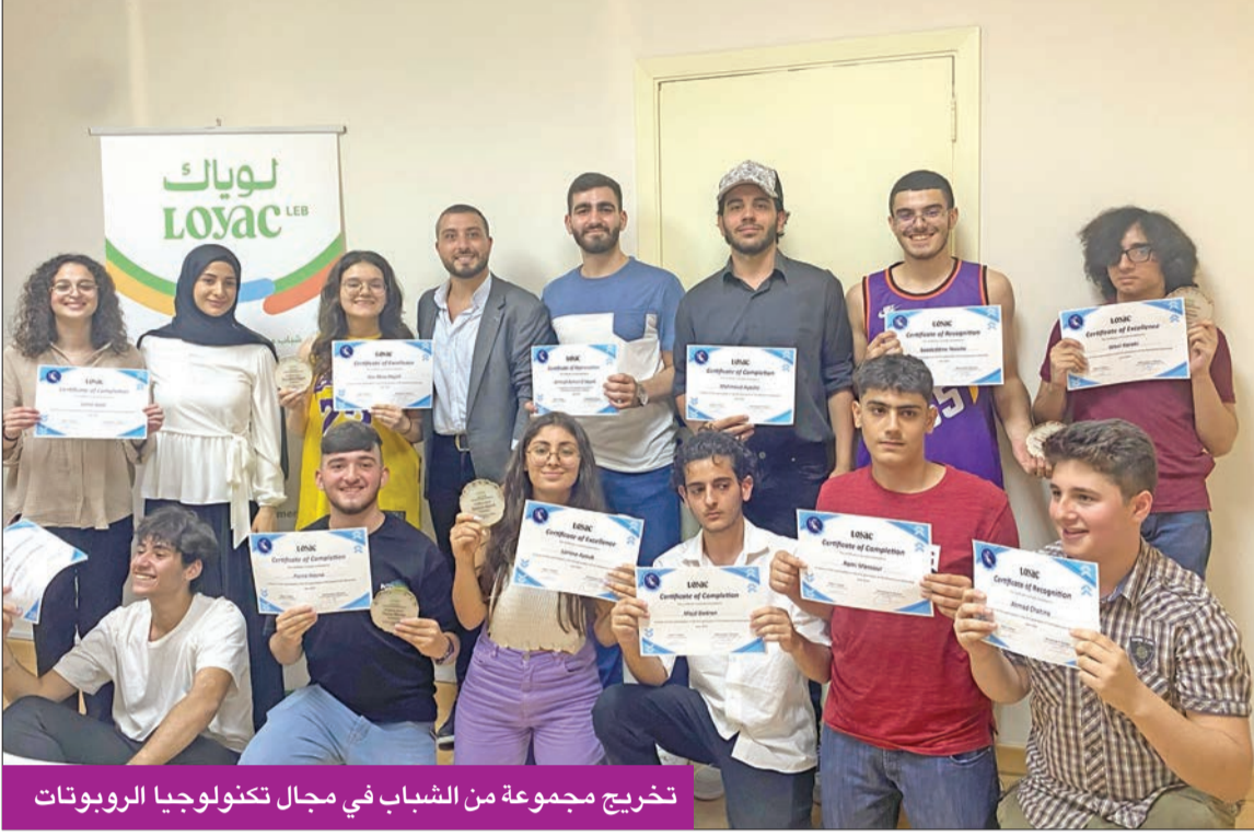
تخريج مجموعة من الشباب في مجال تكنولوجيا الروبوتات