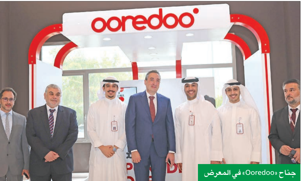
جناح «Ooredoo» في المعرض

تأكيذاً على التزامها بتمكين الشباب في مجال التعليم، أعلنت Ooredoo الكويت، أخيراً، رعايتها لمعرض الفرص الوظيفية السنوي لعام 2024، الذي تقيمه جامعة الشرق الأوسط الأمريكية (AUM)، في مبادرة ضمن شراكة طويلة الأمد بين الطرفين، لسد الفجوة بين المراحل التعليمية والمسارات المهنية في الكويت. ومع وجود أكثر من 11.500 طالب، وأكثر من 15 ألف خريج، تشيد Ooredoo بهذه المؤسسة المرموقة للتعليم العالي كإحدى منارات التميز الأكاديمي في الكويت، إذ تقوم الجامعة كل عام بإقامة هذا المعرض