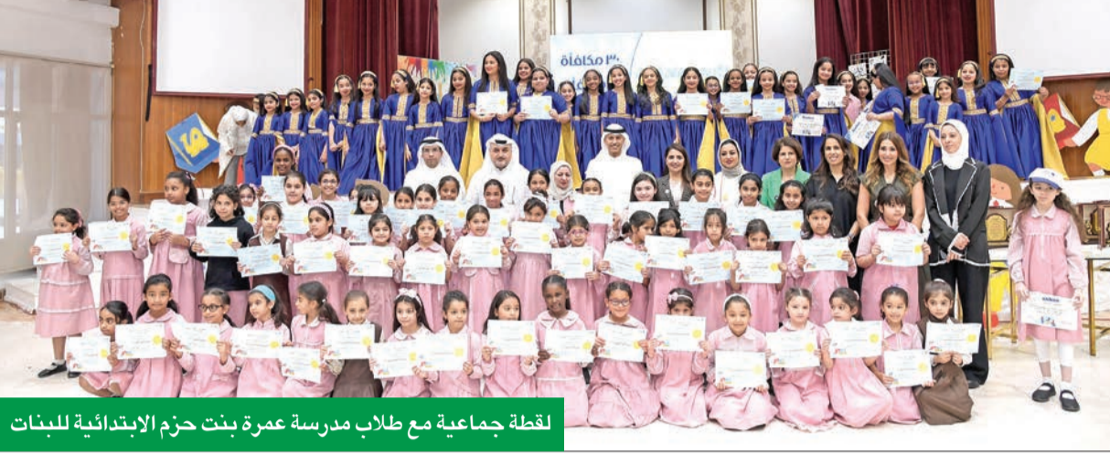
لقطة جماعية مع طلاب مدرسة عمرة بنت حزم الابتدائية للبنات