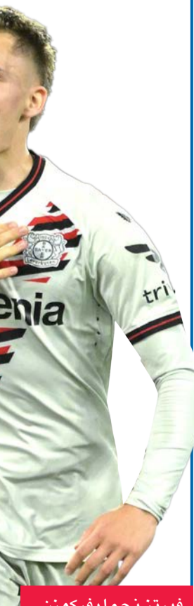
فيرتز نجم ليفركوزن

وكان ليفركوزن حطم الرقم القياسي لسلسلة من 43 مباراة بلا خسارة المسجل باسم يوفنتوس الإيطالي بين عامي 2011 و2012 والذي كان الأفضل لأحد فرق البطولات الخمس الكبرى في أوروبا. ضمن ليفركوزن بقيادة مدربه الإسباني تشابي الونسو إحراز الدوري الألماني للمرة الأولى في تاريخه، وبلغ نهائي كأس ألمانيا حيث يلقي كايزرسلاوترن من الدرجة الثانية