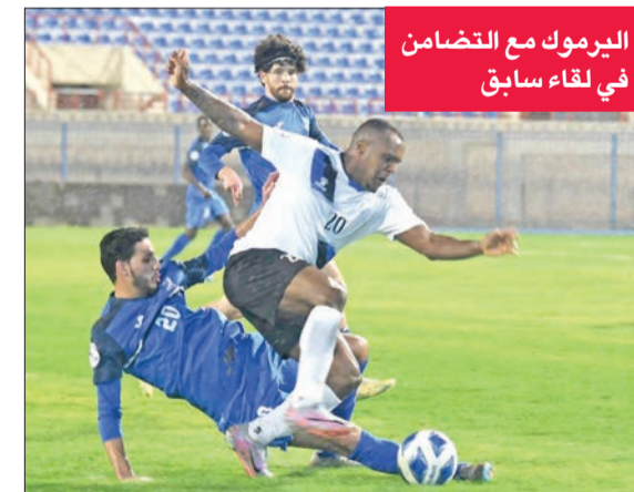
اليرموك مع التضامن في لقاء سابق

ويتوج اليرموك لليلة رسمياً بدرع دوري الدرجة الأولى، الذي حسم لقبه في الجولة الثامنة عشرة، بعد فوزه