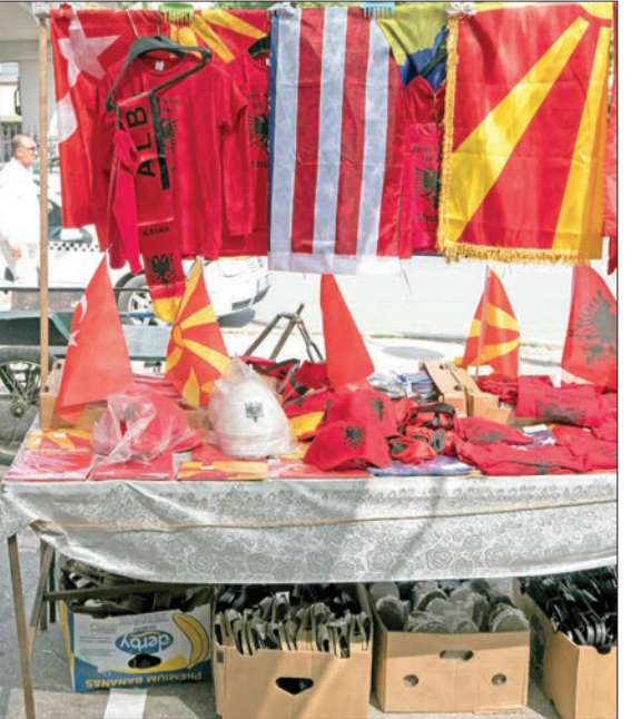
كشك لبيع اعلام لمقدونيا الشمالية وألبانيا وتركيا والولايات المتحدة في أحد شوارع سكوبيي أمس

بنت هذه الحركة مستقبلها السياسي على وعد بأن قاداتها قادرون على تحريك المفاوضات بهدف الانضمام إلى الاتحاد الأوروبي وتسوية الخلاف مع بلغاريا. ورفضت صوفيا دعم فتح مفاوضات الانضمام بين سكوبيي والاتحاد الأوروبي طالما ان مقدونيا الشمالية لم تعترف باقليتها البلغارية الصغيرة في دستورها.