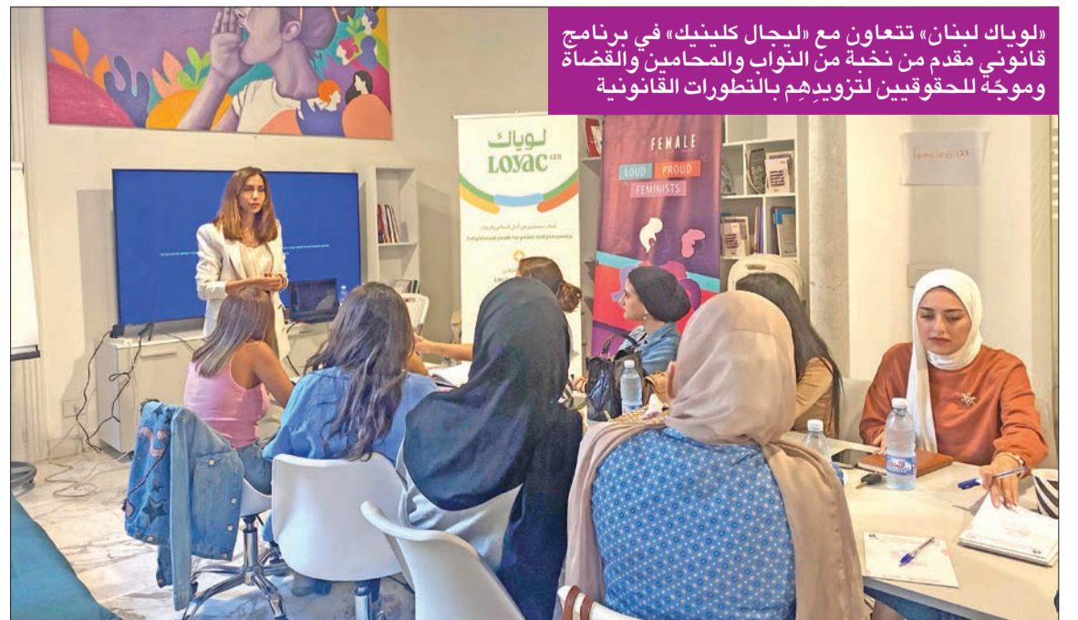
«لويك لبنان» تتعاون مع «المجال كلمتك» في برنامج قانوني يقدم من نخبة من النواب والمحامين والقضاة وموجه للحقوقيين لتزويدهم بالتطورات القانونية