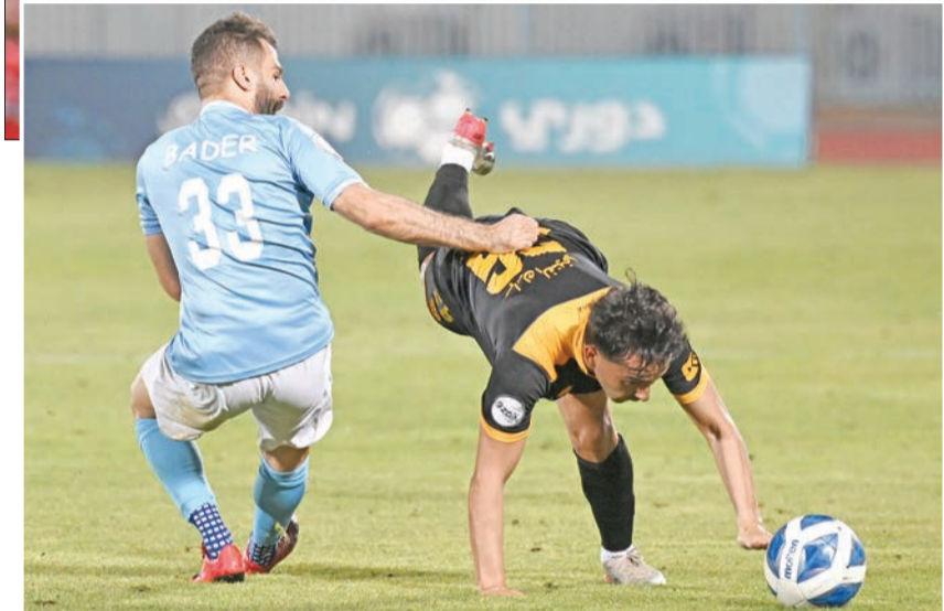
جانب من مباراة الكويت والفحيحيل وفي الإطار كرة مشتركة من لقاء القادسية والسالمية