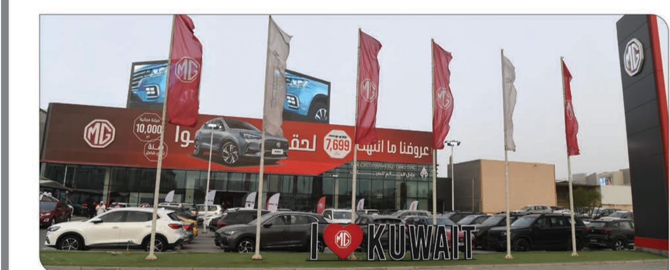
معرض «ام جي» في منطقة الري