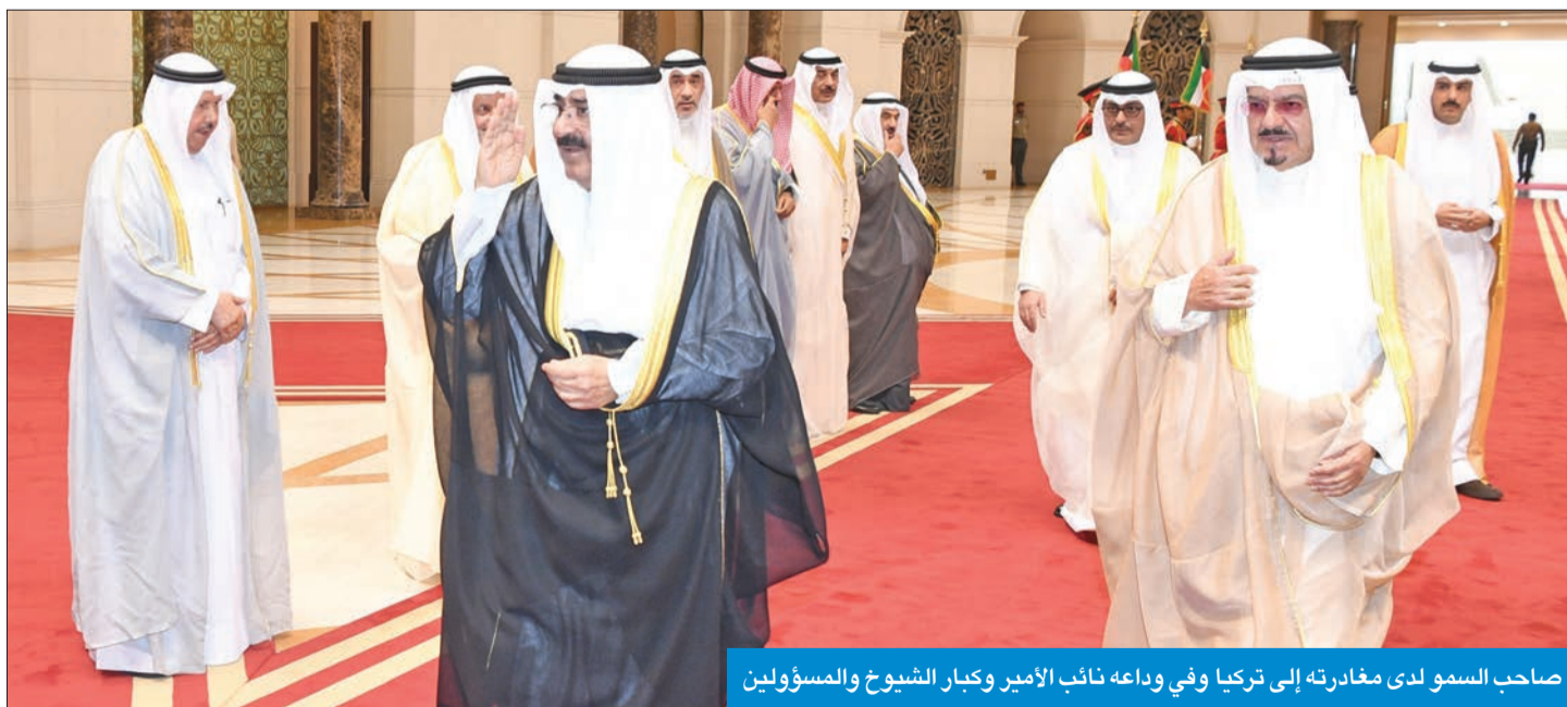
صاحب السمو لدى مغادرته إلى تركيا وفي وداعه نائب الأمير وكبار الشيوخ والمسؤولين

نتطلع إلى تعزيز التعاون المشترك خصوصاً الدفاعي من خلال التعاقد المباشر وأيضاً في المجالين التجاري والاستثماري