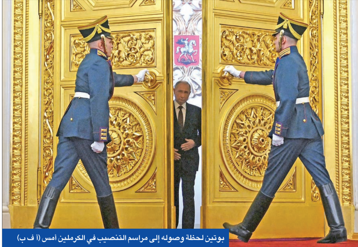
بوتين لحظة وصوله إلى مراسم التنصيب في الكرملين أمس

تعهّد الرئيس الروسي، فلاديمير بوتين، خلال حفل تنصيب باذخ، أمس، بتحقيق النصر للروس، لبدء ولاية رئاسية خامسة قياسية يبدو فيها أقوى من أي وقت مضى. وقال بوتين، الذي أكد أن قواته ستنتصر في أوكرانيا مهما كان الثمن، إن بلاده ستخرج «بكرامة وستصبح أقوى». وبعد ما وقف بمفرده تحت المطر بينما شاهد عرضاً عسكرياً، باركه رئيس الكنيسة الأرثوذكسية الروسية البطريرك كيريل. وقال البطريرك «فلينك الله في عونك لمواصلة المهمة التي سخرّك لها، مشبّهاً بوتين بالحاكم في العصور الوسطى ألكسندر نيفسكي، بينما تمنى له الحكم الأبدي». وقال بوتين من قاعة «سانت أندروز» في الكرملين إن «خدمة روسيا شرف هائل ومسؤولية ومهمة مقدّسة»، فاستقبل بتصفيق حار من المسؤولين الروس وأبرز الشخصيات العسكرية الذين ردّدوا الشئيد الوطني.