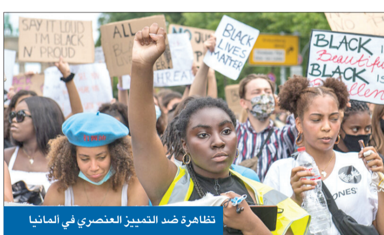
تظاهرة ضد التمييز العنصري في ألمانيا

أظهرت دراسة أجراها المركز الألماني لأبحاث الاندماج والهجرة أن الأشخاص الذين يتعرضون للتمييز العنصري في ألمانيا يتزايد خطر وقوعهم في الفقر. وأوضحت الدراسة، التي نقلت نتائجها وكالة الأنباء الألمانية، أن هذا ينطبق أيضاً حتى لو كان المتضرر من