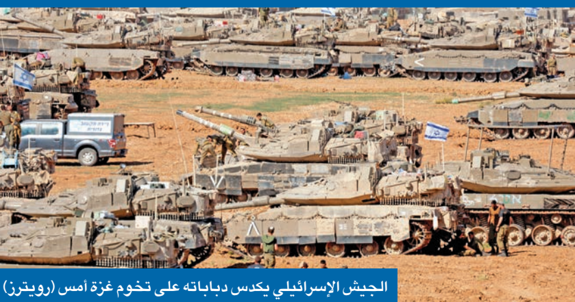
الجيش الإسرائيلي يكس دباباته على تخوم غزة أمس

إسرائيل تحتل معبر رفح... والكويت تحذر من هجوم همجي على المدينة