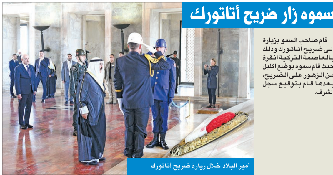
أمير البلاد خلال زيارة ضريح أتاتورك