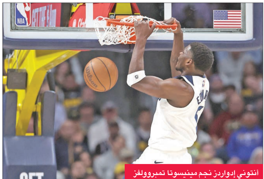
انتوني إدواردز نجم مينيسوتا تمبرولفز

ومنع الفريق الضيف أصحاب الأرض من فرض أسلوبهم الهجومى بفضل دفاع ثابت لا يكمل ومتحرك لمحاولة منع أي رمية، ما دفع ناغتس إلى خسارة الكرة 16 مرة، في حين اكتفى بنجمه المصري نيكولا يوكيتش بـ 8 نقطة وأضاف إليها 16 متابعاً و16 تمريرات حاسمة، وأرون غوردون بـ 20 نقطة.