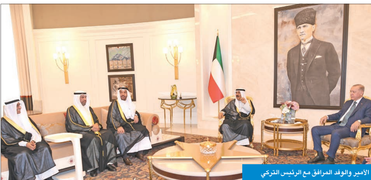
الأمير والوفد المرافق مع الرئيس التركي