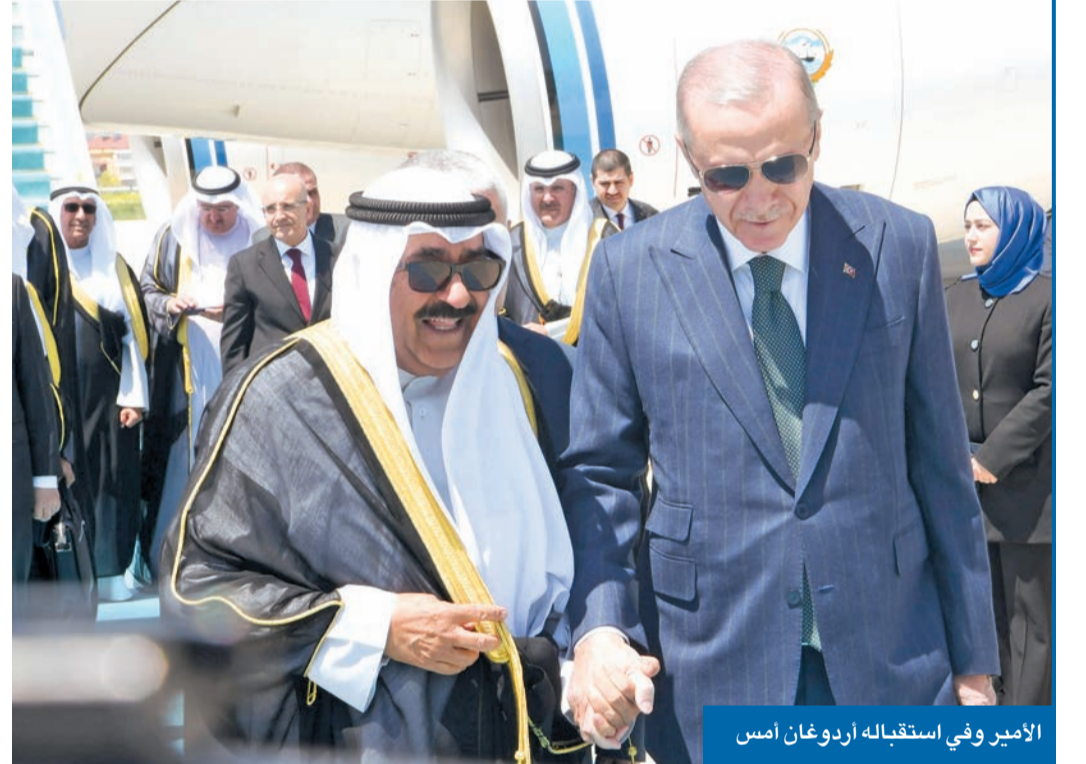
الأمير وفي استقباله أردوغان أمس