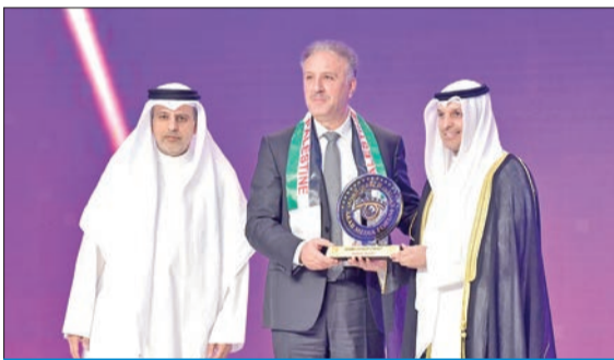
وزير الإعلام مكرمًا ممثل فلسطين ضيف الملتقى

عالمنا العربي من المحيط إلى الخليج في المجال الإعلامي وتطوير المنظومة الإعلامية العربية، مستذكراً أن «الملتقى الإعلامي العربي حدث إعلامي تعزز الكويت باحتضان فعالياته وجلساته النقاشية منذ انطلاقته الأولى قبل 21 عاماً».