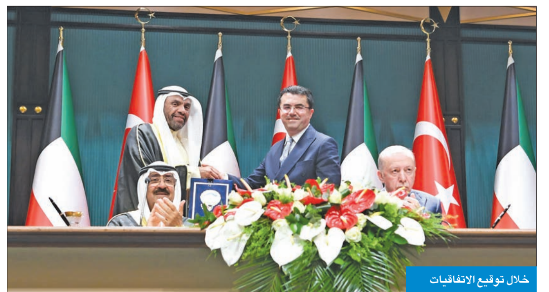
خلال توقيع الاتفاقيات