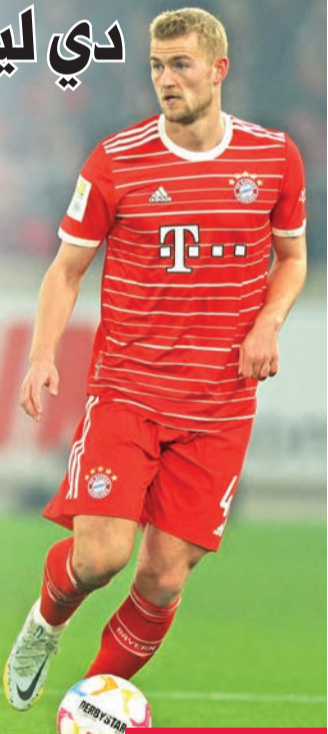
ماتيس دي ليخت

أصبح الثلاثي ماتيس دي ليخت وجمال موسيالا وإريك داير جاهزين تماماً للمشاركة مع بايرن ميونخ الألماني في لقائه المرتقب ضد مضيفه ريال مدريد الإسباني، اليوم، في إياب الدور قبل النهائي لبطولة دوري أبطال أوروبا لكرة القدم، وشارك اللاعبون الثلاثة في تدريبات بايرن، الثلاثاء، عقب تعافيتهم من الإصابات التي تعرضوا لها في الفترة الماضية. وغاب الهولندي دي ليخت عن مباراة الذهاب بين الفريقين الأسبوع الماضي، والتي انتهت بالتعادل 2-2 على ملعب البانتز أرينا في مدينة ميونخ الألمانية، بسبب مشاكل في الركبة، ليلعب بدلاً منه الكوري الجنوبي كيم مين جاي، الذي تسبب بشكل كبير في تلقي الفريق الألماني هدي نظيره الإسباني خلال اللقاء. وغاب موسيالا عن المباراة التي خسرها بايرن 3-1 أمام مضيفه شتوتغارت السبت الماضي بالدوري