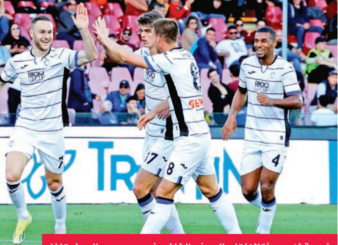
فرحة لاعبي أتالانتا بالهدف الثاني في مرمى ساليريناتا

خطا أتالانتا خطوة كبيرة نحو التأهل لدوري أبطال أوروبا الموسم المقبل عقب فوزه الآننن على حساب ساليريناتا منذ ترتيب 2-1 ضمن المرحلة الخامسة والثلاثين من الدوري الإيطالي لكرة القدم. وتقدم نادي أتالانتا إلى المركز الخامس برصيد 60 نقطة بفارق الأهداف عن روما