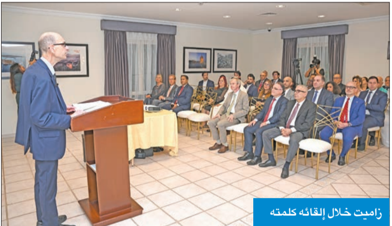
زاميت خلال لقائه كلمته

زاميت: 100 طالب كويتي يدرسون الطب والهندسة في جامعاتنا