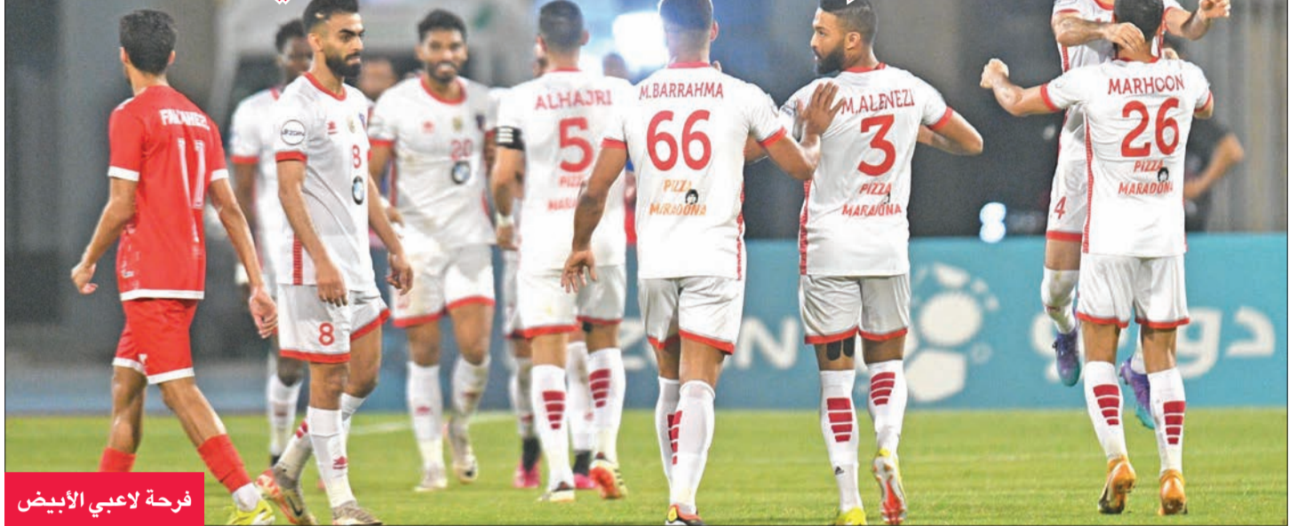
فرحة لاعبي الأبيض

الخطيب: لم نحسن التعامل مع النقص العددي للكويت