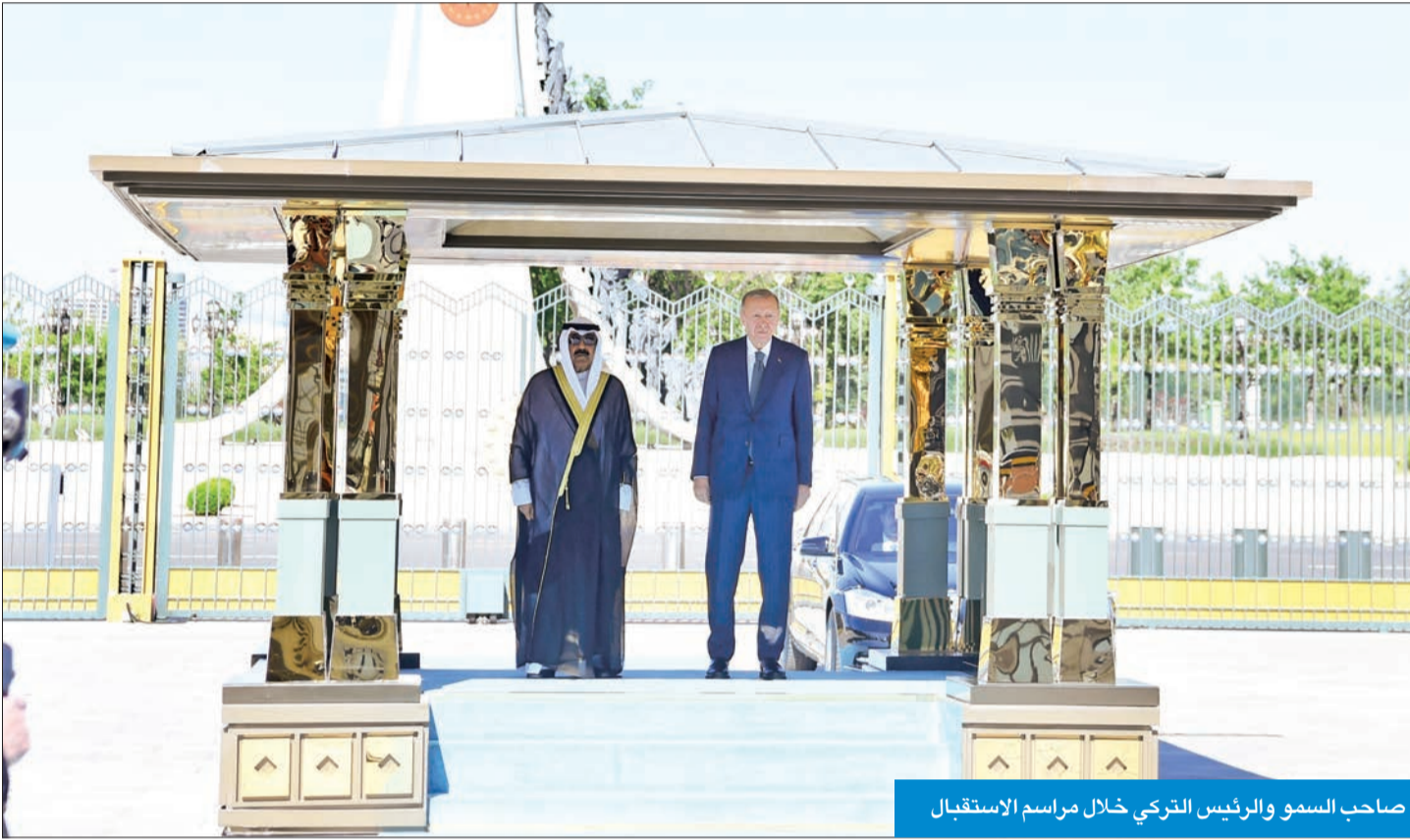
صاحب السمو والرئيس التركي خلال مراسم الاستقبال