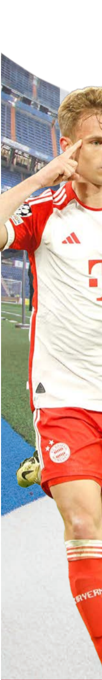
كيميتش نجم بايرن ميونخ

غيابه عن المباريات المقبلة، في الوقت نفسه، تاكدت مشاركة ماتيس دي ليخت وجمال موسيالا في المباراة، بعد أن شاركا في التدريبات الأخيرة للفرق بشكل كامل. (د ب أ)