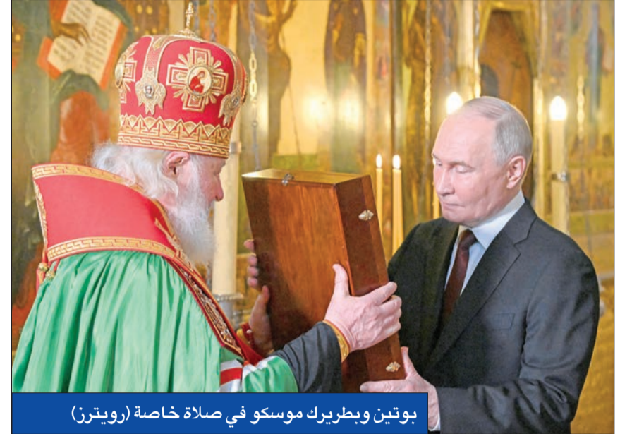
بوتين وبطريك موسكو في صلاة خاصة