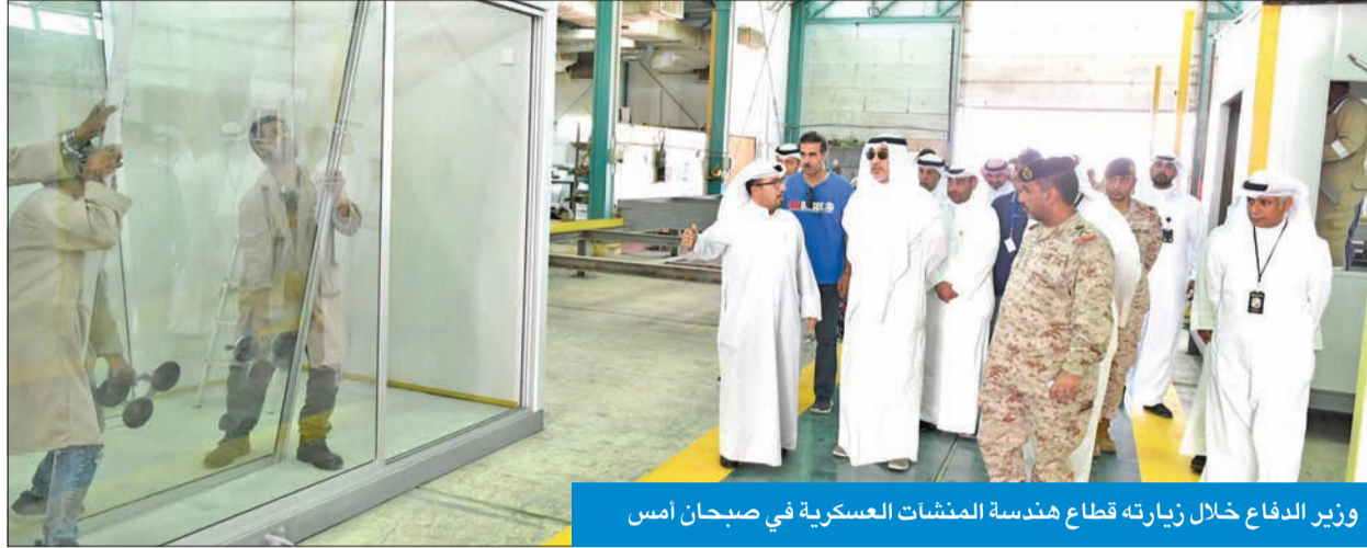
وزير الدفاع خلال زيارته قطاع هندسة المنشآت العسكرية في صباح أمس

وأكد اليوسف، في كلمة له، أن «الدفاع» بمختلف قطاعاتها العسكرية والمدنية تسخر جميع