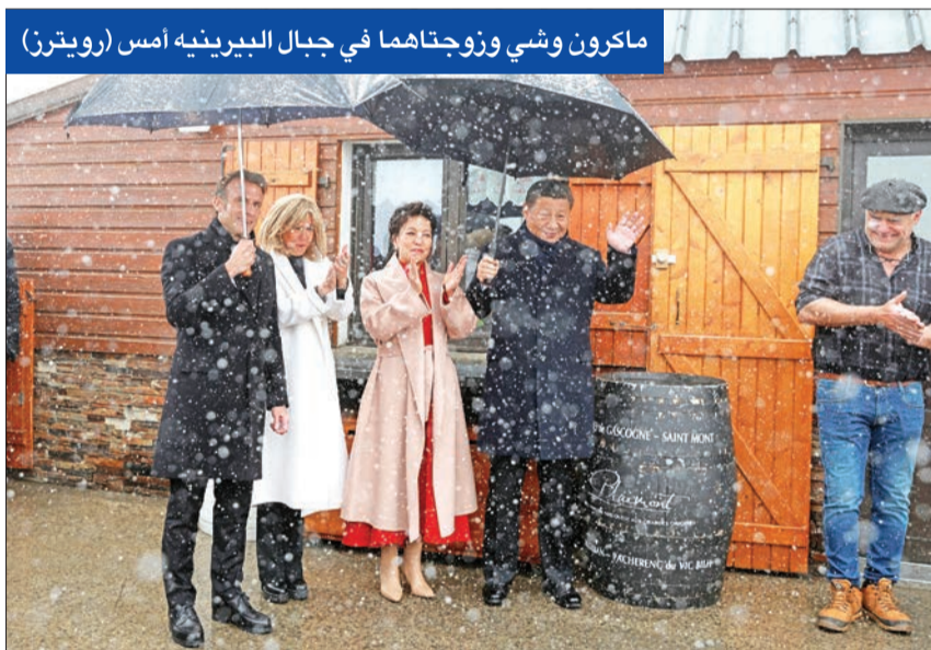
ماكرون وشي وزوجتهما في جبال البيرينيه امس

حتمل زيارة الرئيس الصيني شي جينينغ إلى صربيا رسالة رمزية مزدوجة، حيث تمت مزامنة الزيارة مع الذكرى السنوية لـ25 لخصف حلف شمال الأطلسي «ناتو» للسفارة الصينية في بلغراد عام 1999، كما أن صربيا التي تخوض مفاوضات شاقة منذ أكثر من 15 عاماً للانضمام إلى الاتحاد الأوروبي، تعتبر إحدى أقرب الدول إلى روسيا برئاسة فلاديمير بوتين، إلى جانب المجر المشمولة كذلك بجولة شي الأولى إلى أوروبا منذ 5 أعوام والتي بداها من فرنسا. وفي مقال نشرته وسائل الإعلام الصينية ووزعت الخارجية الصينية نسخة منه قبيل وصوله إلى صربيا، استذكر الزعيم الصيني «القصف الصارخ» للسفارة الصينية في بلغراد خلال الحملة الأطلسية على يوغوسلافيا السابقة، الذي ألقى بالوم فيه على خطأ بتحديد المواقع ارتكيبته بلغراد العام الماضي اتفاقية للتجارة الحرة. وتقدمت صربيا رسمياً بطلب عضوية الاتحاد الأوروبي في 22 ديسمبر 2009، ولا تزال مفاوضات الانضمام جارية حالياً وقد يسمح لها بالانضمام إلى الاتحاد بحلول عام 2026. وبعد مفاوضات شاقة في باريس، أمس الأول، جمعت الرئيس الصيني إلى نظيره الفرنسي إيمانويل ماكرون ورئيسة المفوضية الأوروبية الألمانية أورسولا فوندرلاين، وركزت على العلاقات الروسية الصينية وتأثيرها على الحرب في أوكرانيا والخلافات التجارية بين أوروبا والصين، اصطحب ماكرون أمين الرئيس الصيني إلى أعالي جبال البيرينيه، حيث تناولا الغداء في مطعم إريك أبادي الواقع على ارتفاع كبير