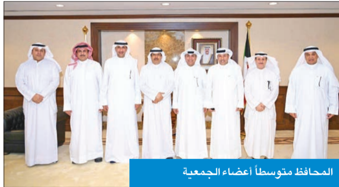
المحافظ متوسطاً أعضاء الجمعية