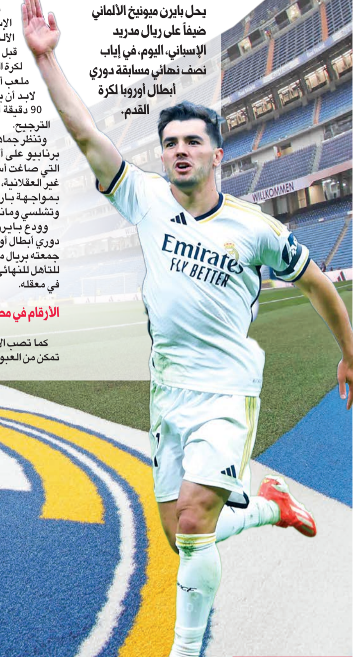
دياز نجم ريال مدريد