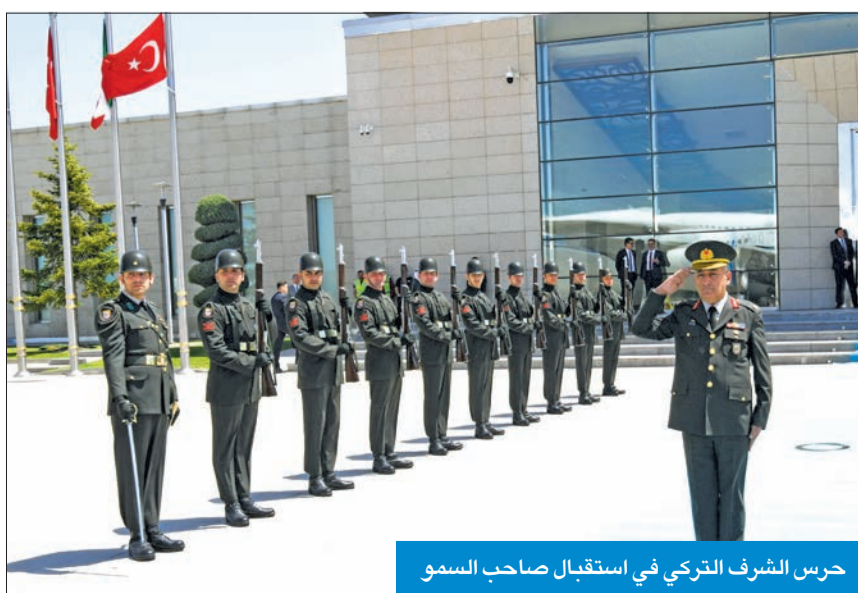
حرس الشرف التركي في استقبال صاحب السمو