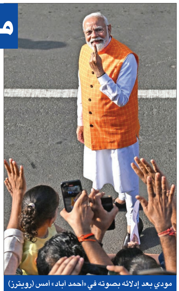
مودي يعد إدلائه بصوته في «أحمد آباد» امس