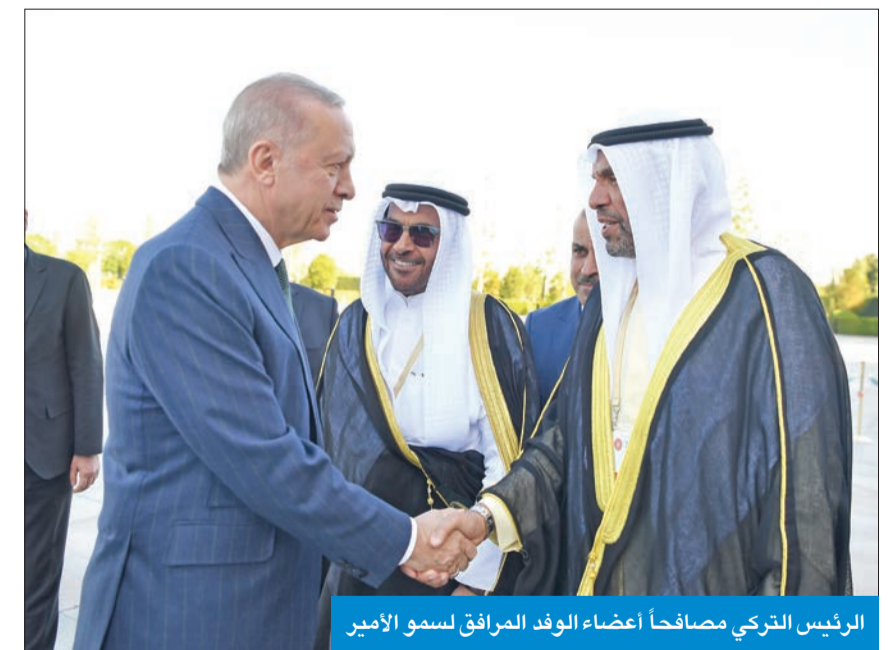
الرئيس التركي مصافحاً أعضاء الوفد المرافق لسمو الأمير