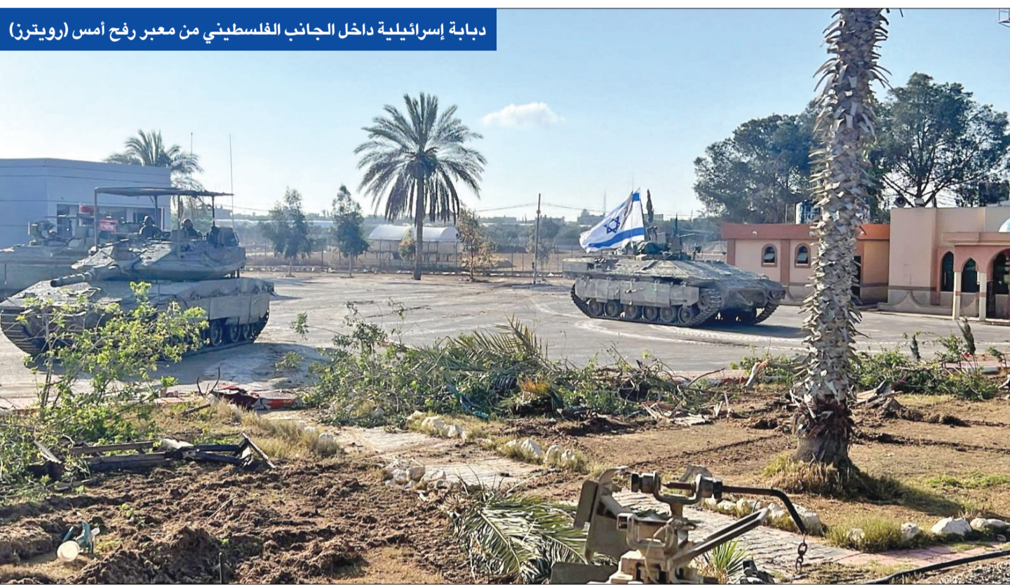
دبابة إسرائيلية داخل الجانب الفلسطيني من معبر رفح أمس

قرب معبر كرم ابوسالم، وصفت الحركة الإسلامية احتلال المعبر بأنه «جريمة ضد مشاة مدينة محمية بالقانون الدولي وتؤكد نية إسرائيل تعطيل جهود الوساطة لمصالح شخصية لانتهايو وحكومته المتطرفة». ودعت «حماس» الإدارة الأميركية والمجتمع الدولي إلى «الضغط على الاحتلال لوقف التصعيد». تهوين وضغط في غضون ذلك، عاد مدير الاستخبارات المركزية الأميركية «CIA» وليام بيرنز إلى القاهرة قادماً من تل أبيب لمتابعة جهود الوساطة غير المباشرة التي تقوم بها مصر وقطر من أجل دفع تهدئة طويلة، في حين نفى مسؤول أمريكي قبول بيرنز مقترحة مدلاً لاتفاق غزة» الذي أعلنت الحركة الإسلامية قبوله دون إطلاق إسرائيل عليه. وتحدثت موق «أكسيوس» الأمريكي عن حالة من خيبة الأمل والتشكك أصابت المسؤولين الإسرائيليين فيما يتعلق بدور الولايات المتحدة في المفاوضات والصيغة المحتملة، وكشفت تقارير عبرية عن إدارة الرئيس الديموقراطي جو بايدن التي تخشى من تأثير الحرب على الانتخابات المقبلة، قررت تأجيل