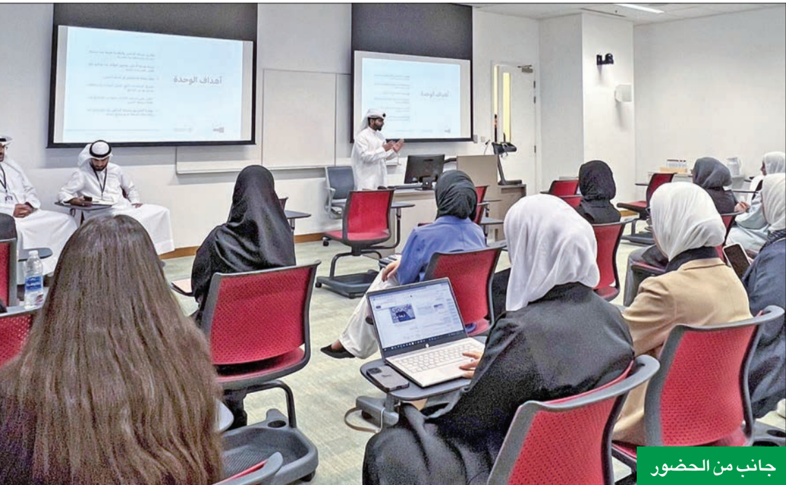
جانب من الحضور

الممارسة العالمية فضلاً عن توفير حماية للمتعاملين في الأنشطة التأمينية. وقدم ممثلو الوحدة شركاً مفصلاً عن نظام التأمين الصحي والوثائق التأمينية، موضحين المنافع والاستثناءات والمطالبات، كما ردوا على استفسارات المشاركين والحضور في الندوة من طاب كلية الصحة العامة وموظفي جامعة الكويت. وأكدت الوحدة مواصلة تعزيز الوعي والثقافة التأمينية من خلال تنظيم العديد من الندوات والمحاضرات التوعوية بالتعاون مع مختلف الجهات والمسؤوليات الحكومية والمؤسسات الحكومية المختصة لتوعية الجمهور بأواجباتهم وحقوقهم التأمينية.