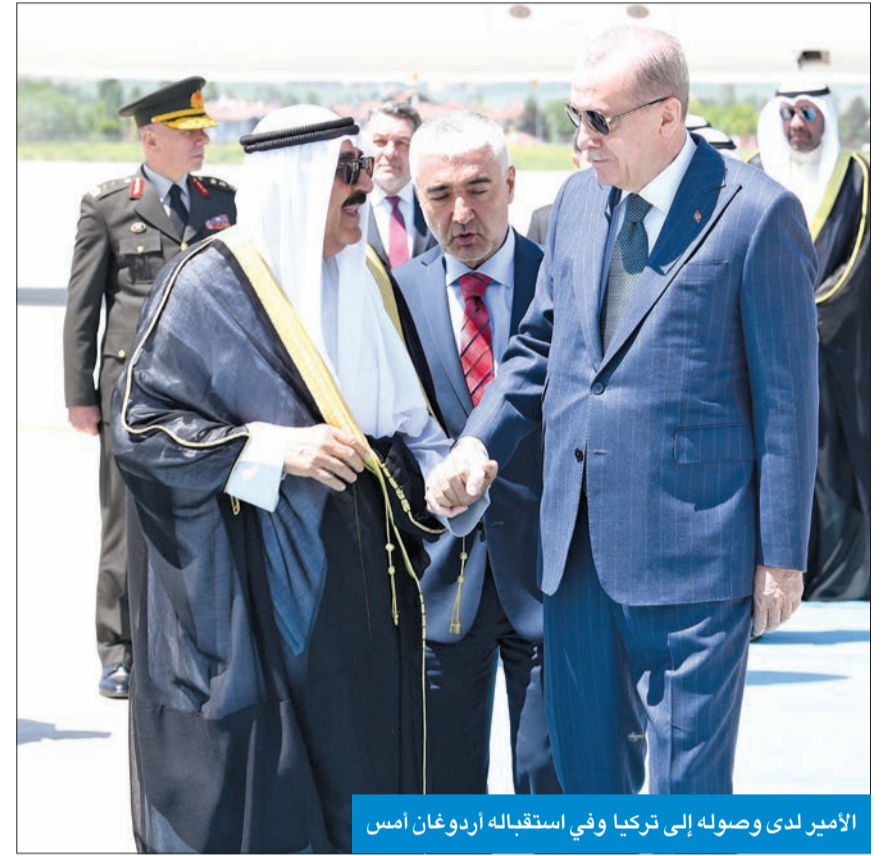
الأمير لدى وصوله إلى تركيا وفي استقباله أردوغان أمس

التي صرح بها سموه في تصريح صحفي، مؤكداً أن العلاقات الثنائية بين البلدين تشهد تطوراً ملحوظاً، خاصة في مجالات التعاون الاقتصادي والاستثماري. وأضاف سموه أن البلدين يتعاونان في مجالات متنوعة، بما في ذلك التجارة والصناعة والبنية التحتية. وأكد سموه أن البلدين يتعاونان في مجالات متنوعة، بما في ذلك التجارة والصناعة والبنية التحتية. وأكد سموه أن البلدين يتعاونان في مجالات متنوعة، بما في ذلك التجارة والصناعة والبنية التحتية.