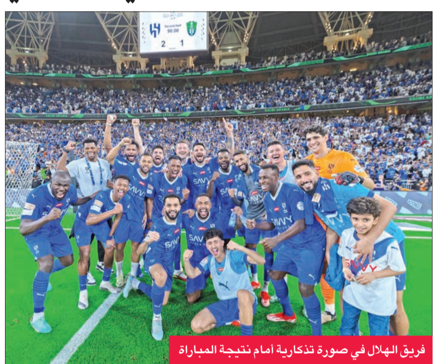
فريق الهلال في صورة تذكارية أمام نتيجة المباراة

فاز الهلال على مضيفه الأهلي 2 - 1 في المباراة المؤجلة من الجولة الثامنة والعشرين من الدوري السعودي لكرة القدم، والتي أقيمت أمس الأول على ملعب الجوهرة المشعة بجدة.