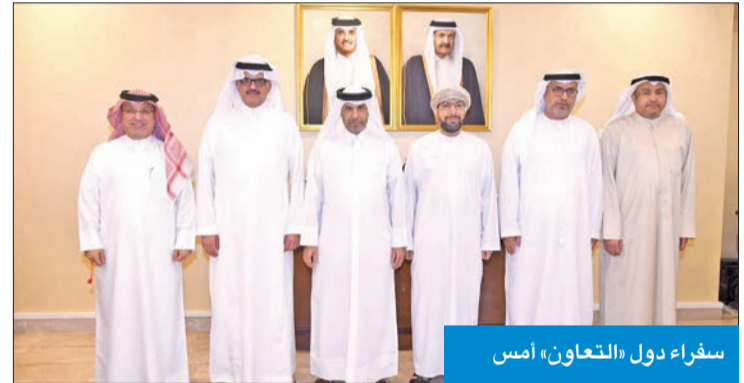
سفراء دول «التعاون» أمس

استضافت السفارة القطرية لدى دولة البلاد، أمس، الاجتماع التنسيقي لسفراء دول مجلس التعاون المعتمدين لدى الكويت وممثل وزارة الخارجية. وتم خلال الاجتماع الذي ترأسه سفير قطر علي بن عبدالله آل محمود، بحث الموضوعات المتعلقة بالعمل الخليجي المشترك والتعاون والتنسيق بين سفارات دول «التعاون» في الكويت.