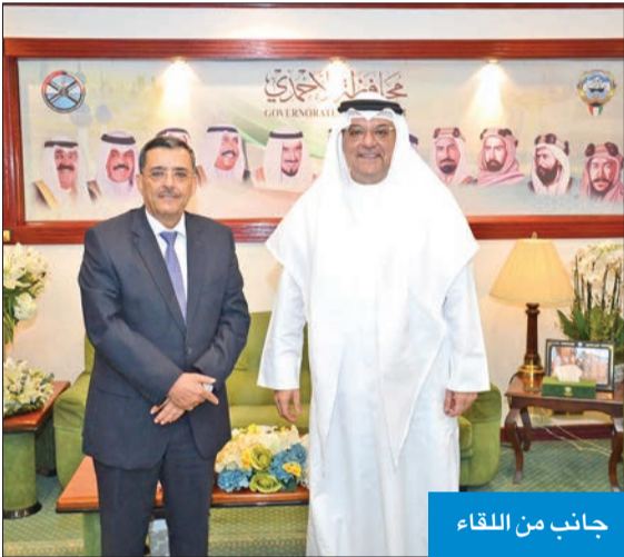
جانب من اللقاء

بلاده، ومواطنو اليمن على الصعيدين الرسمي والشعبي في الكويت.