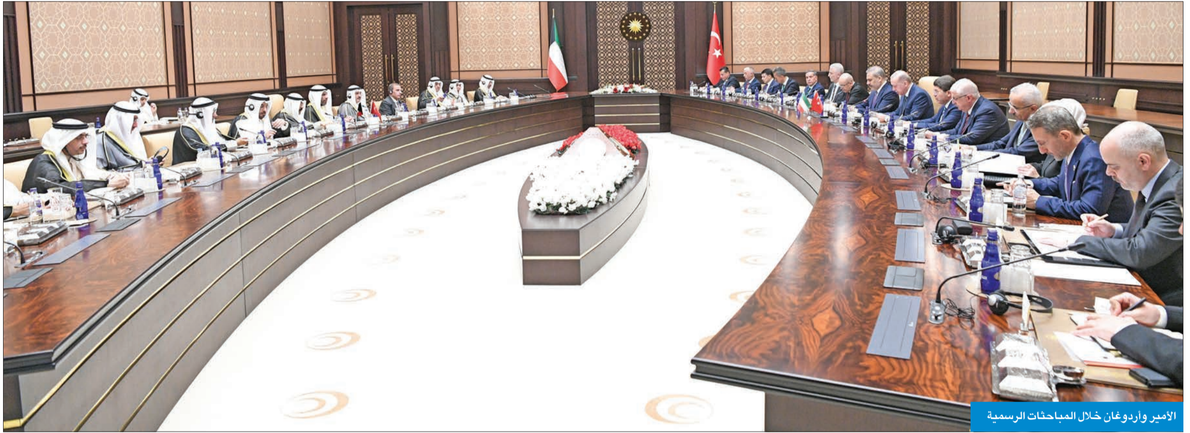
الأمير وأردوغان خلال المباحثات الرسمية

بإستعراض طابور حرس الشرف. كما تفضل سموه بمصافحة عدد من كبار المسؤولين بالحكومة التركية، ثم قام أردوغان بمصافحة أعضاء الوفد الرسمي المرافق لسموه.