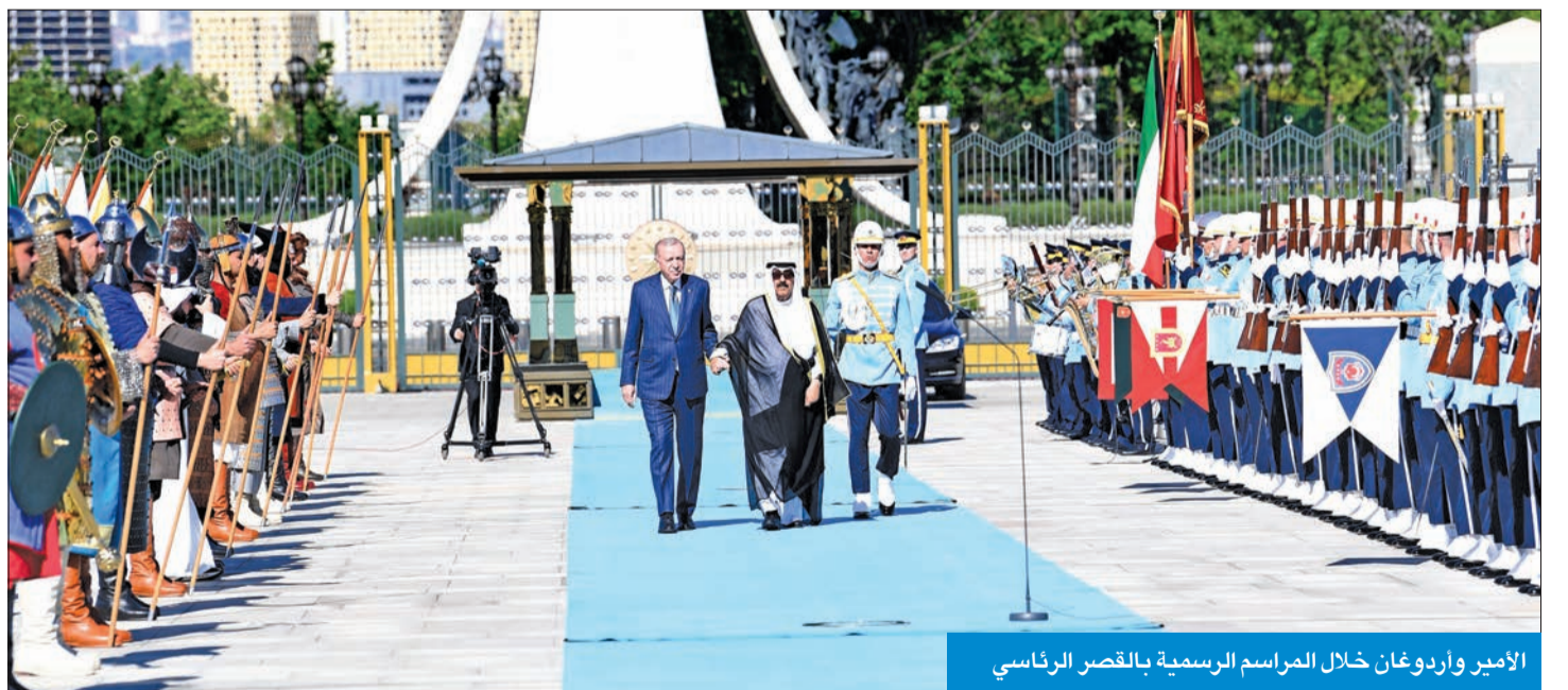
الأمير وأردوغان خلال المراسم الرسمية بالقصر الرئاسي