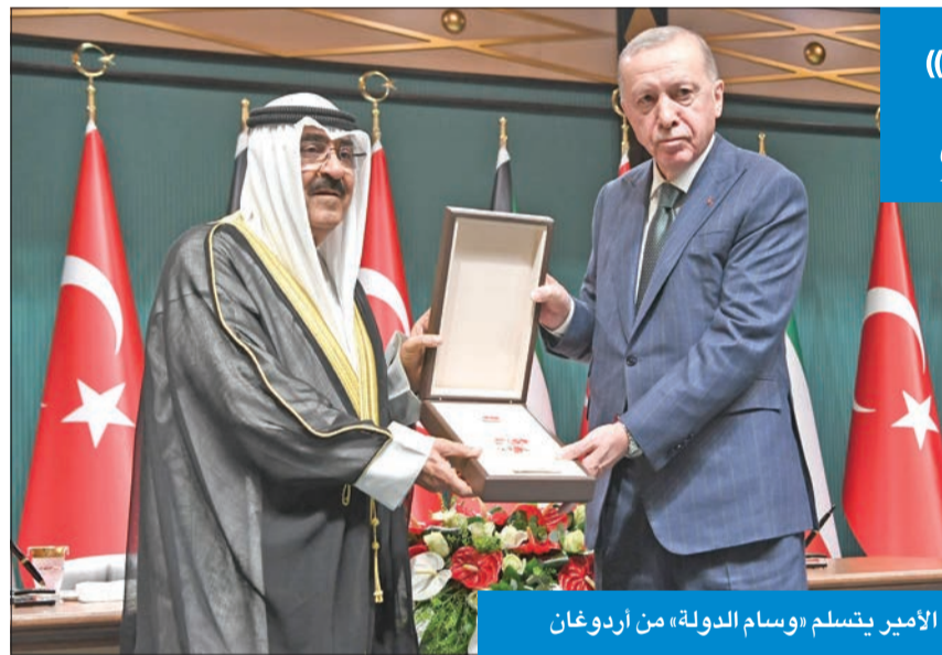
الأمير يتسلم «وسام الدولة» من أردوغان

كما عقدت في القصر الرئاسي بالعاصمة التركية أنقرة، عصر أمس، جلسة المباحثات الرسمية بين الكويت وجمهورية تركيا الصديقة، ترأس فيها صاحب السمو أمير البلاد الجانب الكويتي، فيما ترأس الرئيس أردوغان الجانب التركي. وقد تم خلال جلسة المباحثات استعراض العلاقات التاريخية الوطيدة التي تربط الكويت وجمهورية تركيا