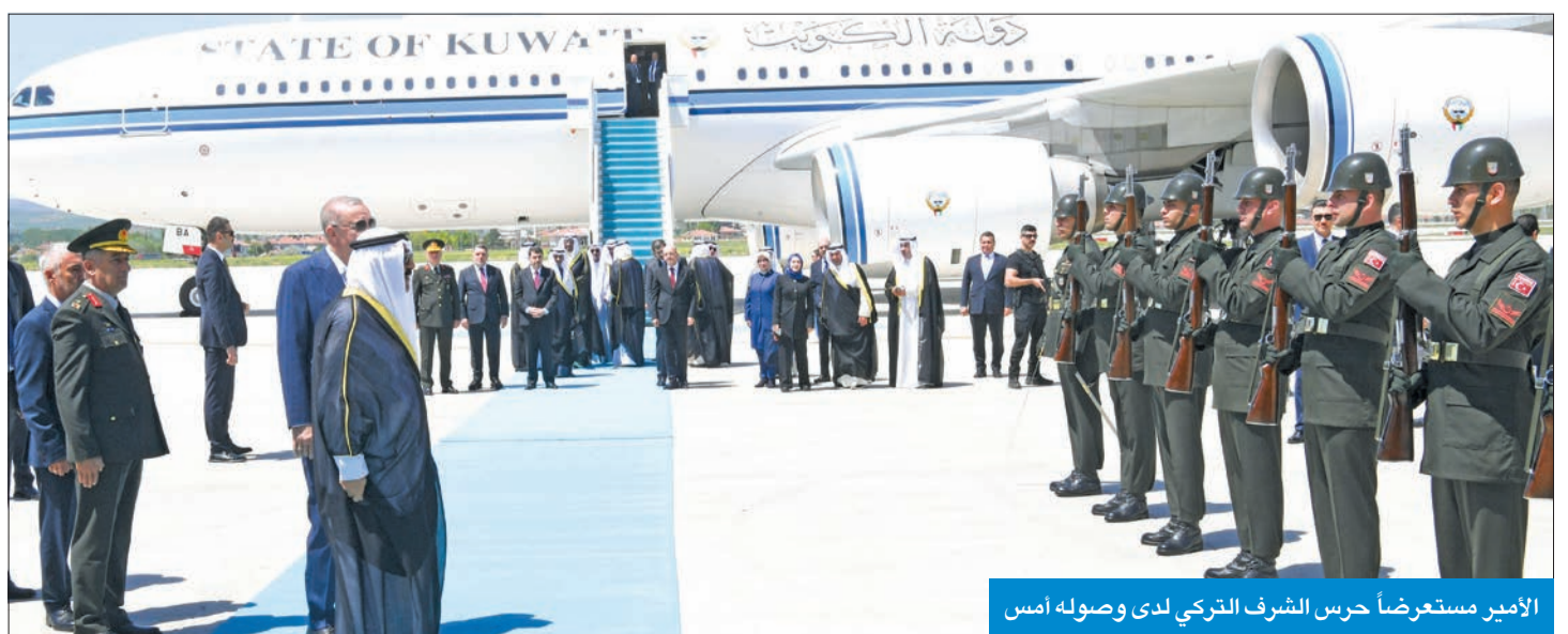
الأمير مستعرضاً حرس الشرف التركي لدى وصوله أمس