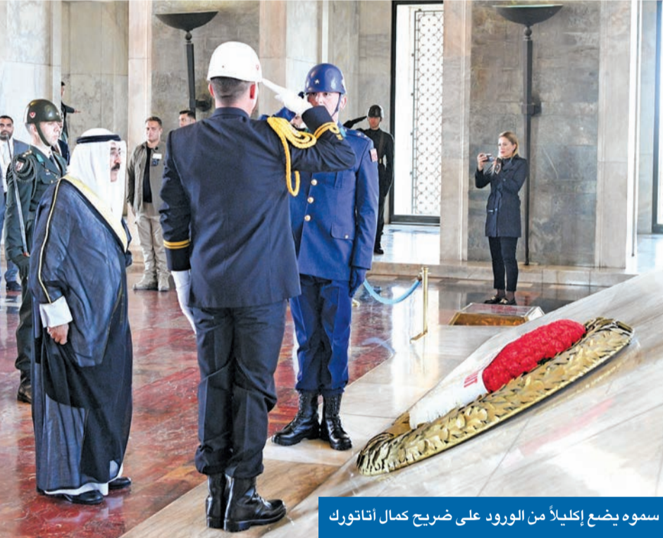
سموه يضع إكليلاً من الورود على ضريح كمال أتاتورك

علاقتنا تاريخية تمتد عبر 60 عاماً منذ تأسيسها عام 1964 وتنتقل إلى تقوية أواصرها زيارتنا تدعم التعاون المثمر البناء وتجسد حرصنا المشترك على الارتقاء به في شتى المجالات هدفنا خدمة المصالح المشتركة للبلدين وتحقيق آمال الشعبين الكريمين وتطلعاتهما نهتمكم بنجاح منتدى أنطاليا الدبلوماسي الثالث بمشاركة ممثلنا وزير الخارجية نشيد بتوقيع البيان المشترك لبدء المفاوضات حول اتفاقية التجارة الحرة بين مجلس التعاون وتركيا