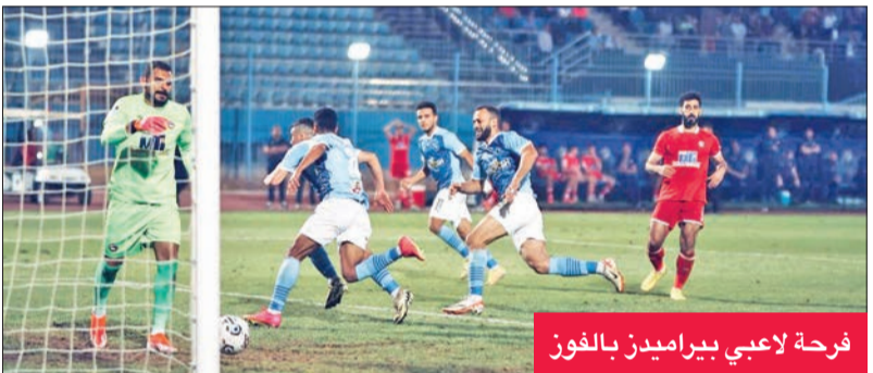
فرحة لاعبي بيراميدز بالفوز

سجل الهدف الثاني في الدقيقة الثالثة من الوقت المحتسب بدل الضائع من ركلة جزاء. بهذه النتيجة، عزز بيراميدز صدارته لجدول ترتيب الدوري المصري بـ 41 نقطة من 18 مباراة، فيما تجدد رصيد فيوتشر عند النقطة 26 بالمركز الحادي عشر.