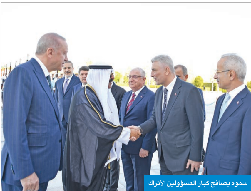
سموه يصافح كبار المسؤولين الأتراك

نعزز بجهود شركة «ليماك التركية» التي تتولى تنفيذ مشروع مبنى مطار الكويت الجديد 2T