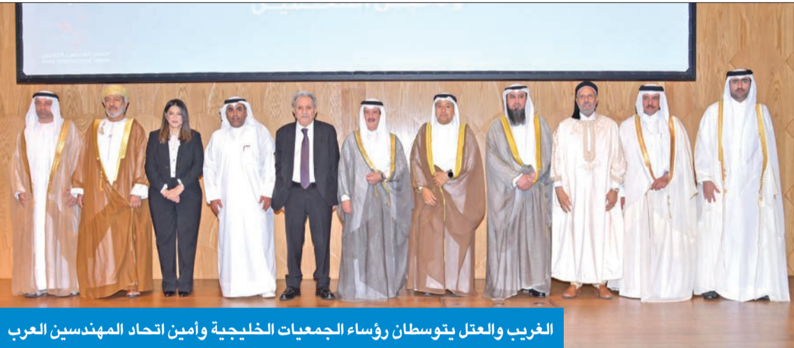
الغريب والعتل يتوسطان رؤساء الجمعيات الخليجية وأمين اتحاد المهندسين العرب

أكد وزير العدل وزير الأوقاف والشؤون الإسلامية، المستشار فيصل الغريب، أن «حجم القضايا التي تطرح على القضاء للفصل فيها في تصاعد مستمر»، مضيفاً أن التحكيم بات ضرورة يجب تطويرها في ظل النمو المطرد في المشروعات العامة والخاصة، وتنوع العلاقات الطبيعية والمعنوية بين الأشخاص. جاء ذلك في كلمة القاها الوزير خلال تمثيلية سمو رئيس مجلس الوزراء برعاية مؤتمر التحكيم الهندسي وتأهيل المحكمين، والذي تقيمه جمعية المهندسين، وانطلقت أعماله أمس بمركز الشيخ جابر الأحمد الثقافي، بالتعاون مع هيئة التحكيم العربية، وتستمر فعالياته حتى الخميس المقبل.