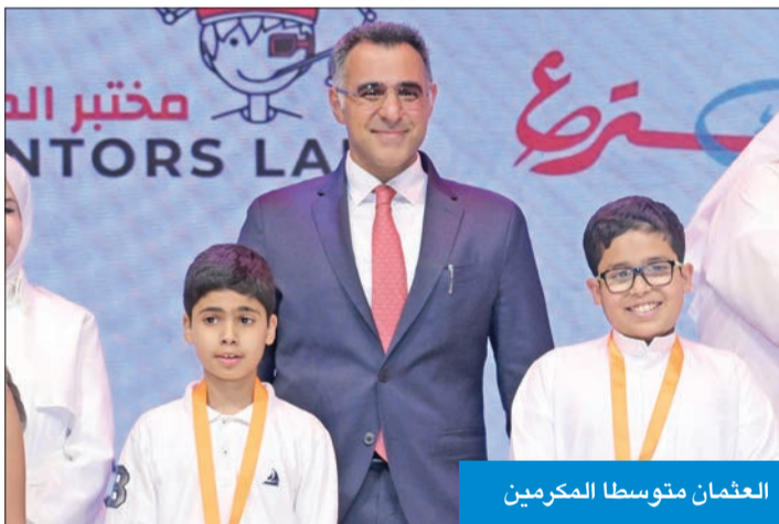
العمان متوسطا المكرمين

عمل، تمحورت فكرة ورشة العمل الأولى، بعنوان «حول فكرتك إلى لعبة»، حول التفكير التصميمي وأهميته في تحويل الفكرة إلى واقع، وتضمنت الورشة مجموعة من التمارين التطبيقية التي ساعدت المشاركين على فهم المعلومات المكتسبة. بينما ركزت ورشة العمل الثانية «كيف تحول لعبتك إلى شركة ناجحة» على عملية تأسيس شركة، والطرق المناسبة للترويج لها.