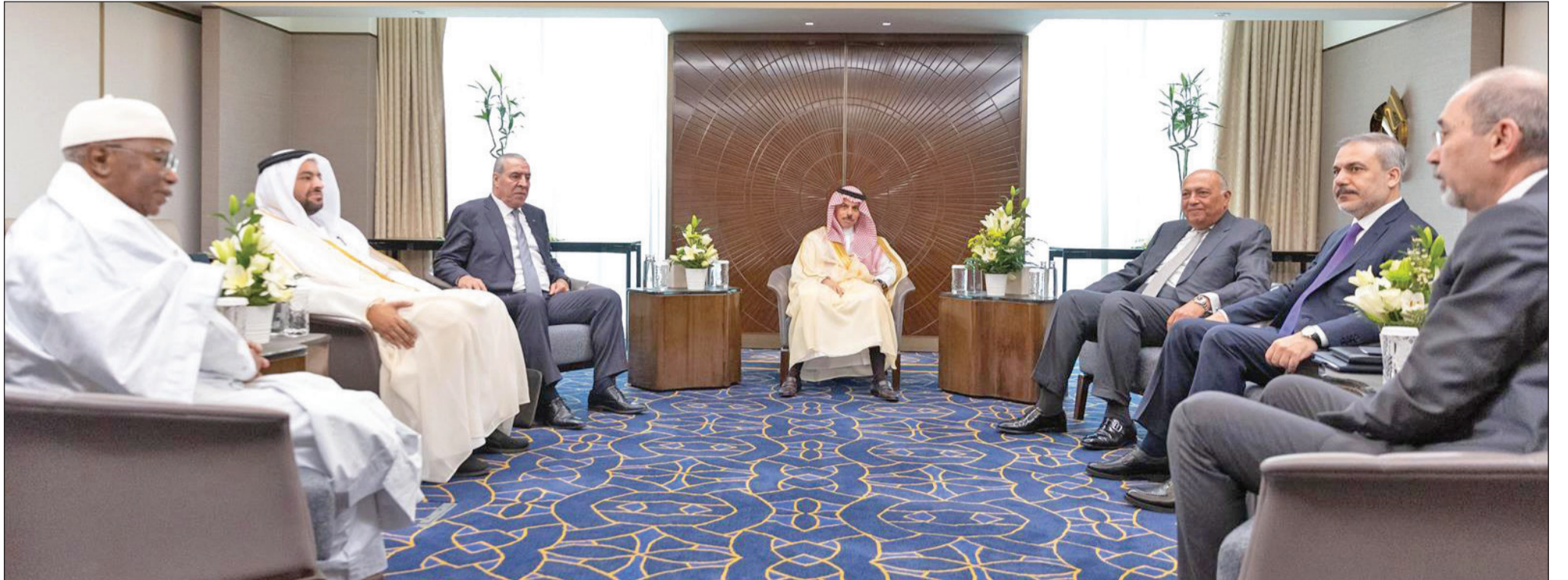
اجتماع اللجنة العربية الإسلامية المشتركة بشأن غزة في الرياض أمس (واس)

عباس: واشنطن وحدها القادرة على منع اجتياح رفح وإحداث «أكبر كارثة في تاريخ الفلسطينيين» سموتريتش يهدد ننتيا هو بتفجير الحكومة إذا وافق على صفقة الرهائن... وغانتس إذا رفضها