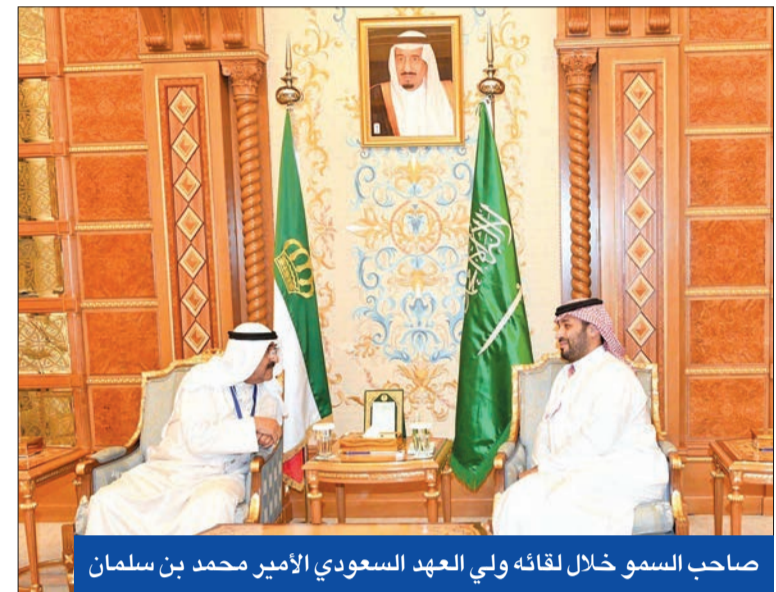
صاحب السمو خلال لقائه ولي العهد السعودي الأمير محمد بن سلمان