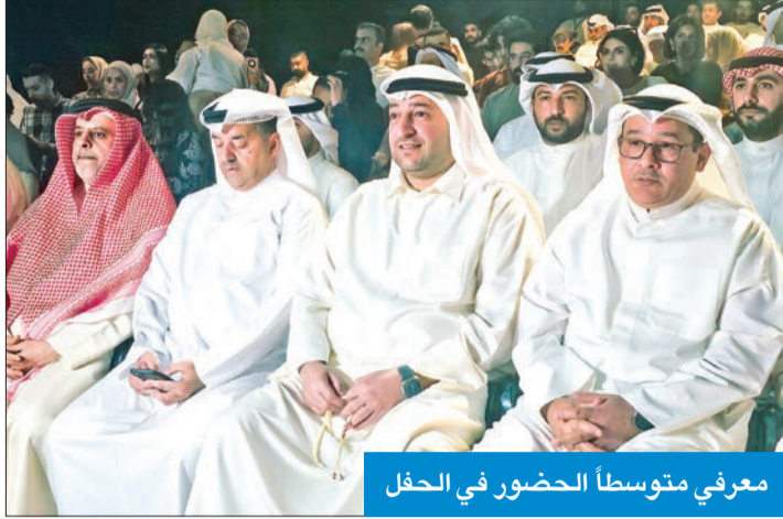
معرفي متوسطا الحضور في الحفل

اختتام الموسم الثالث من برنامج خطابات شبابنا «كويت سبيك أب»