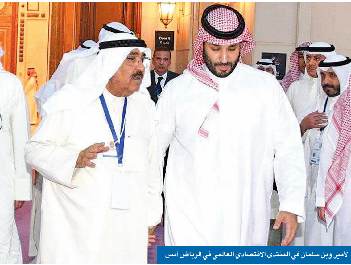
الأمير وبن سلمان في المنتدى الاقتصادي العالمي في الرياض أمس

ضغوط عربية وإسلامية للمضي في «حل الدولتين» وساعات حاسمة لوقف إطلاق النار في غزة