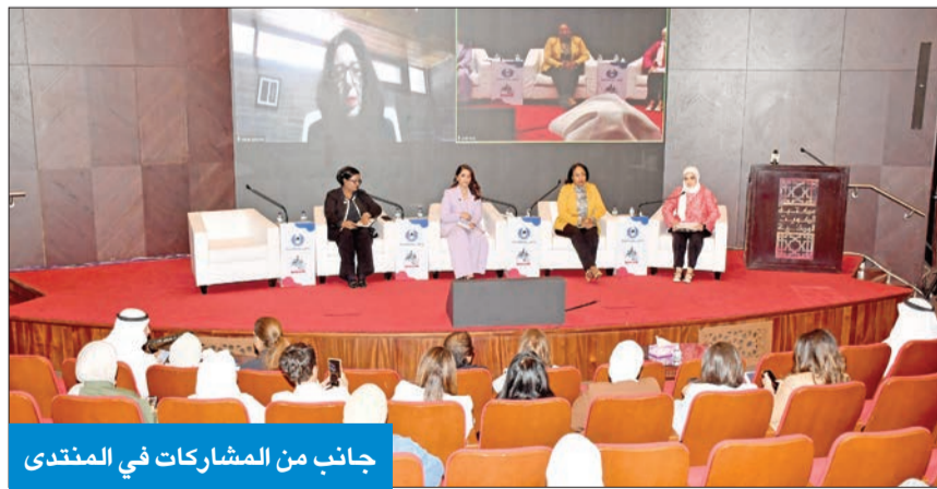
جانب من المشاركات في المنتدى