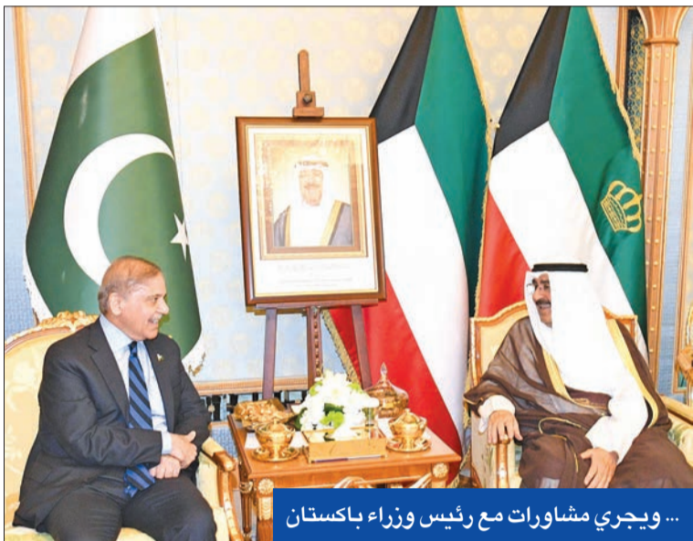
... ويجري مشاورات مع رئيس وزراء باكستان

سموه يلتقي بن سلمان ويبحث مع السوداني تعزيز العلاقات مع العراق ويتلقى دعوة لزيارة باكستان