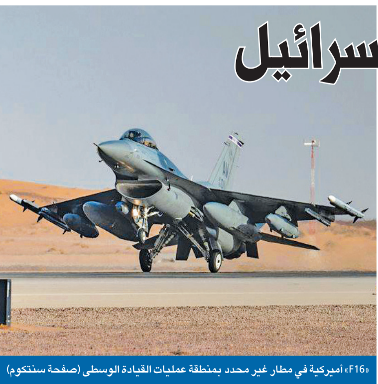
F16 أميركية في مطار غير محدد بمنطقة عمليات القيادة الوسطى (صفحة سنتكوم) 02

كشف مصدر مسؤول، لـ «الجريدة»، أن الولايات المتحدة شرعت تبني قاعدة عسكرية ضخمة جنوب إسرائيل، في خطوة قد تندرج ضمن إطار نقل واشنطن جزءاً من وجودها العسكري من قواعدها في دول الخليجية. وأشار المصدر إلى أن القاعدة الأميركية الجديدة تقع بمحاذاة قاعدة حنيسيم الجوية الإسرائيلية في صحراء النقب، حيث سيتم