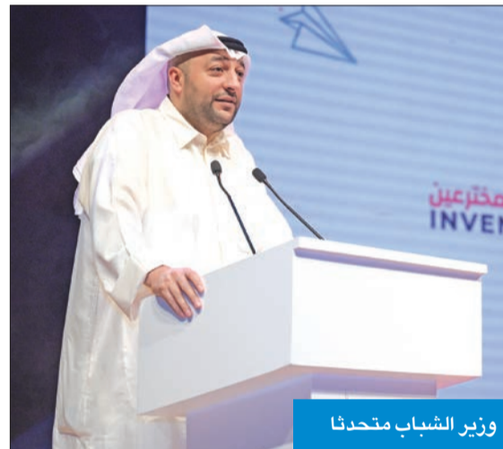
وزير الشباب متحدثاً