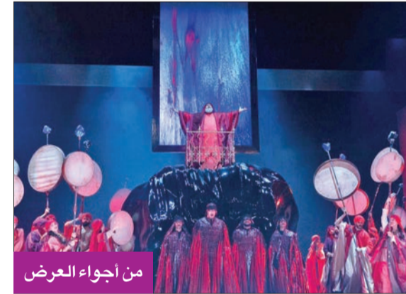
من أجواء العرض

وعبّر الزامل عن إشداده وسعادته بحضوره العرض، وبالهدوء التي تلقاها برفقة عدد من ساسة وفناني ومتقفي الكويت للمشاركة في هذا الحدث الفني الكبير والمهم.