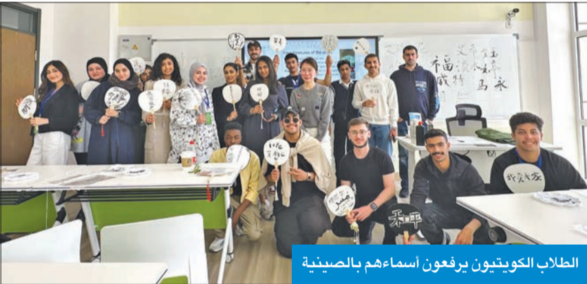
الطلاب الكويتيون يرفعون أسماءهم بالصينية

لتعزيز التبادل الثقافي بين الصين ودول الخليج عموماً، والكويت خصوصاً، تنفَّذَ للاتفاقيات المهمة التي تكت بين الرئيس شي جينبيغ، وسمو الأمير الشيخ مشعل الأحمد، خلال اجتماعهما العام الماضي. وقالت لونغ: «هذا النوع من المخيمات التثقيفية موجه للطلاب والشباب في دول الخليج فقط، وكان لابد من مشاركة وفد كويتي، وتطلع إلى أن تكون هذه الزيارة الأولى بداية جميلة للترابط والتواصل بين طلاب البلدين».