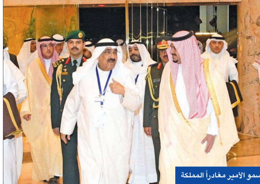
سمو الأمير مغادراً المملكة

وتحول الطاقة ليس أمراً ملحا لمستقبل الكوكب فحسب، بل لمعالجة التفاوتات الصارخة في الوصول وتحقيق هدف التنمية المستدامة المتمثل في توفير الطاقة النظيفة بأسعار معقولة للجميع، لا سيما في الاقتصادات النامية،