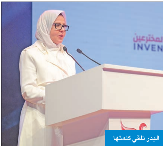
البدر تلقي كلمتها

الجدير ذكره أن «مختبر المخترعين Inventors Lab» تم تأسيسه من قبل مجموعة من خريجات الهندسة في AUM فقد نشأ شغفهن في نادي الروبوتات في AUM حيث تم تدريبهن وصقل مواهبهن، فعملن بعد التخرج على نقل هذا الشغف إلى أطفال وشباب الكويت، بهدف خلق فرص للتدريب لتحقيق الإبتكار والريادة، وفتح آفاق جديدة أمام اختراعاتهم وإبداعاتهم، إضافة إلى تشجيع العقول المميّزة على التفكير في بيئة عمل تفاعلية تتسم بالإبداع والحدّيات. هذا، وتحرض AUM على تحفيز المواهب الطلابية وتشجيعهم على التطوير والابتكار لكي يتمكنوا من القيام بالمبادرات ودخول قطاع الأعمال. كما أن تنظيم مثل هذه النشاطات يساهم في خلق التوعية لدى الطلاب، ونشر ثقافة ريادة الأعمال بينهم، وتوجيههم نحو عالم الأعمال وإعداد خطط المشاريع، وما يلزمها من دراسات جدوى وتسويق وإدارة.