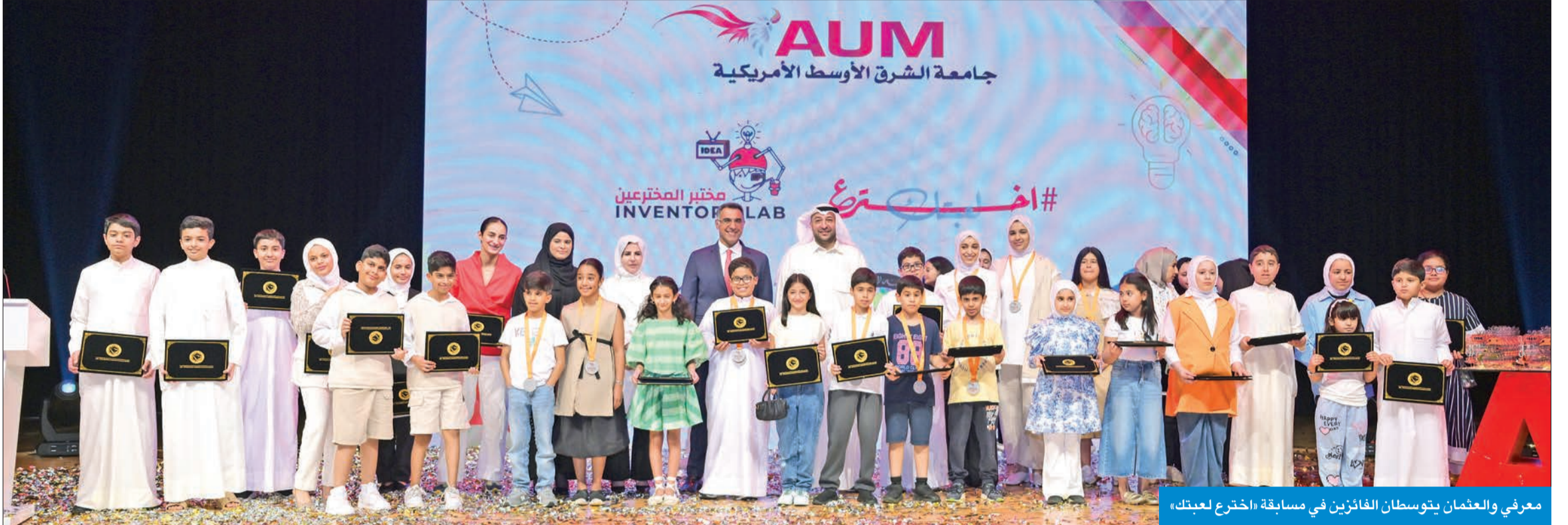
معرفي والعمان يتوسطان الفائزين في مسابقة «اخترع لعبتك»

كما أتيح للمشاركين فرصة عقد اجتماعات فردية مع أحد المختصين للإجابة عن استفساراتهم. أما اليوم الثاني، فقد استهل بورشة عمل بعنوان «براءات الاختراع وحفظ حقوق الملكية الفكرية»، حيث شرح المختصون كيفية تسجيل براءات الاختراع. أما ورشة العمل الثانية فكانت بعنوان «يلا نخترع»، حيث عمل المشاركون على تنفيذ أفكارهم واختراع العابهم الخاصة، بالإضافة إلى المقابلات الفردية بين المختصين والمشاركين لمعرفة المزيد من التفاصيل عن المواضيع التي طرحت خلال ورش العمل. أما خلال المرحلة الثانية، فقد عرض المشاركون أفكارهم وعابهم وناقشوها أمام لجنة التحكيم التي حرصت على اختيار أفضل الاختراعات، التي تم الإعلان عن فائزها في الحفل الختامي، وهو المرحلة الثالثة والأخيرة للمسابقة.