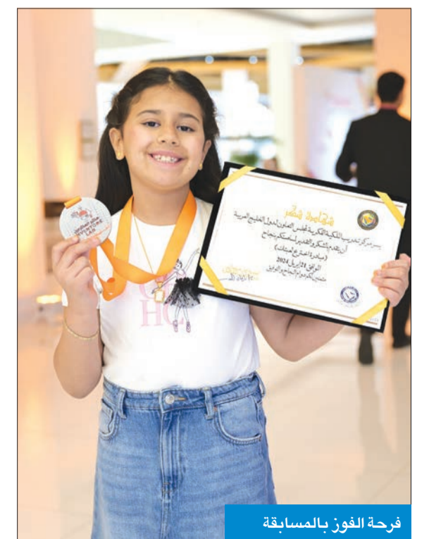
فرحة الفوز بالمسابقة