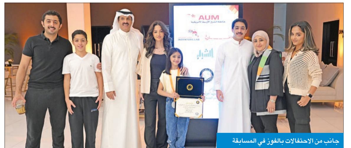
جانب من الاحتفالات بالفوز في المسابقة

مساعدة المشاركين على اختراع لعبة والعمل على تطويرها وتنفيذها وصولاً إلى إنتاجها وبيعها في الأسواق