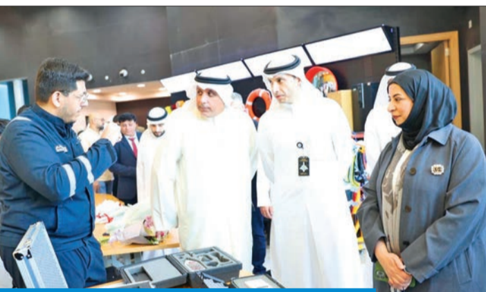
العصيمي خلال جولتها على معرض السلامة المهنية

بذلك تعرّض نفسها للمسائلة واتخاذ الإجراءات اللازمة وتسجيل المخالفات بحقها.