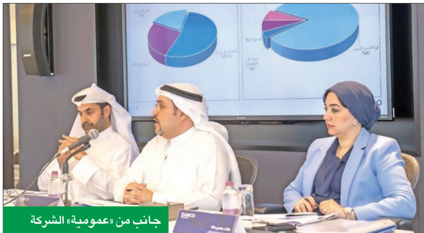
جانب من «عمومية» الشركة

العقارية، محققاً بذلك إنجازات هائلة ضمن فئة أصول جديدة، كما تم توزيع 47.0 مليون دولار على المستثمرين في الأصول العقارية، ليحصل بذلك العائد النقدي على رأس المال المستثمر إلى 7 بالمئة على أساس سنوي.