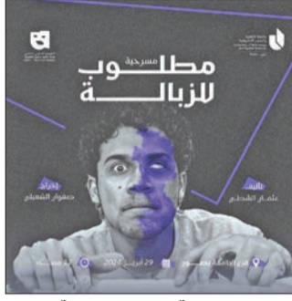
ملصق مسرحية «مطلوب للزبالة»

وأكد الشطبي أنه دائماً يسعى في ورشه إلى تقديم مادة مميزة في طريقته غير التقليدية، وأنه ضد