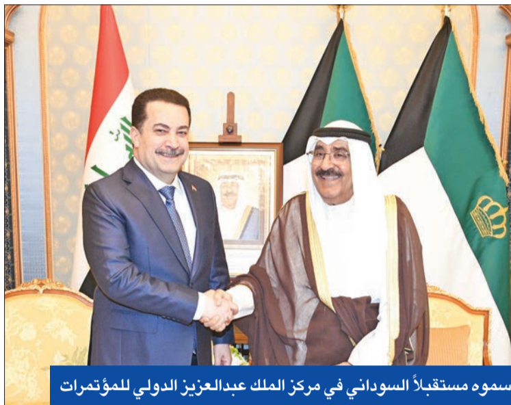
سموه مستقبلاً السوداني في مركز الملك عبدالعزيز الدولي للمؤتمرات