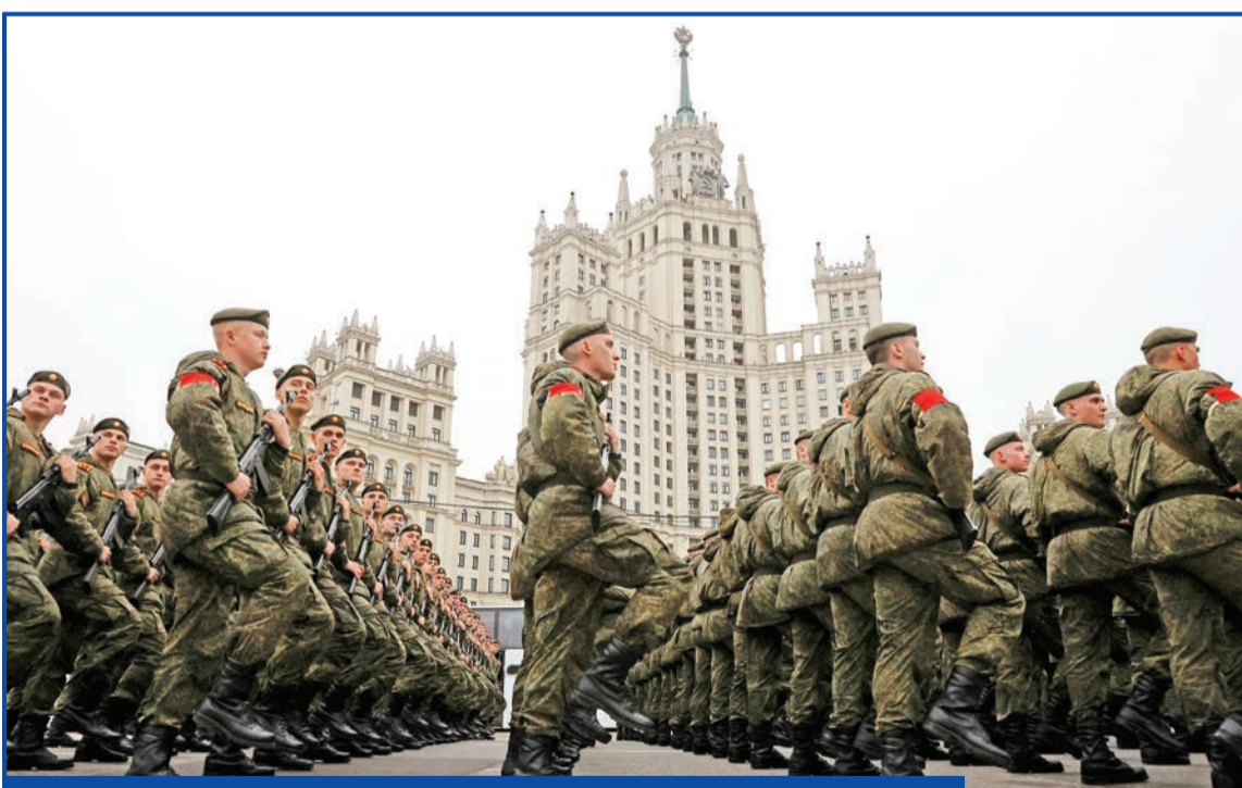
تمرينات روسية في موسكو استعداداً لاستعراض يوم النصر الشهر المقبل

وكشف مصدر من النخبة السياسية في موسكو أن أسلوب حياة إيفانوف الباذخ جعله هدفاً سهلاً، بينما سلطت تحقيقات أجراها ناشطون وصحافيون في السنوات الأخيرة الضوء على الرفاهية التي يتمتع بها نائب وزير الدفاع الروسي وعائلته. وفي عام 2022، حصل فريق مكافحة الفساد، التابع لرئيس المعارضة الراحل اليكسي نافاني، على البريد الإلكتروني لزوجته إيفانوف،