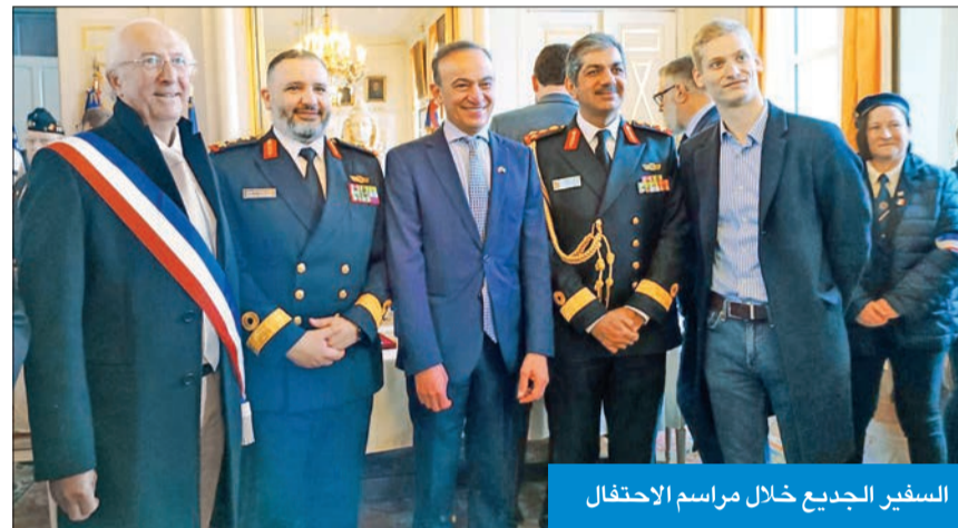
السفير الجديد خلال مراسم الاحتفال

قُدَّ سفير الكويت لدى فرنسا، محمد الجديد، علم «الرابطة الفرنسية للمحاربين القدامى» في حرب الخليج، وسام التحري للكويت، تقديراً لدور فرنسا في تحري البلاد.