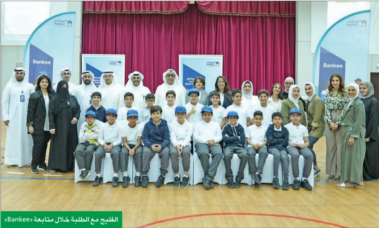
الفليج مع الطلبة خلال متابعة «Bankee»

الفليج: البرنامج حجر الزاوية في مساعيها لزيادة حجم المعرفة المالية لدى أبنائنا الطلبة