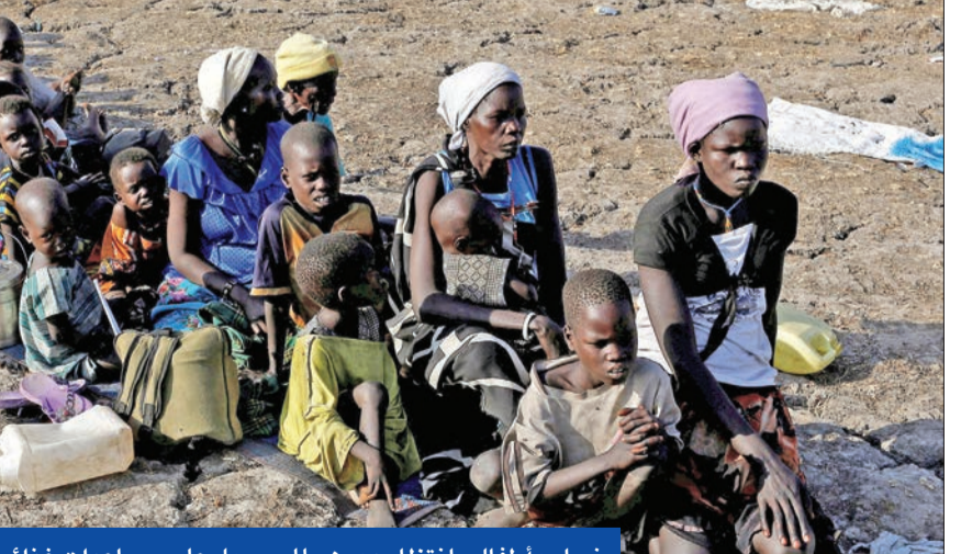
نساء وأطفال بانتظار دورهم للحصول على مساعدات غذائية في جنوب السودان