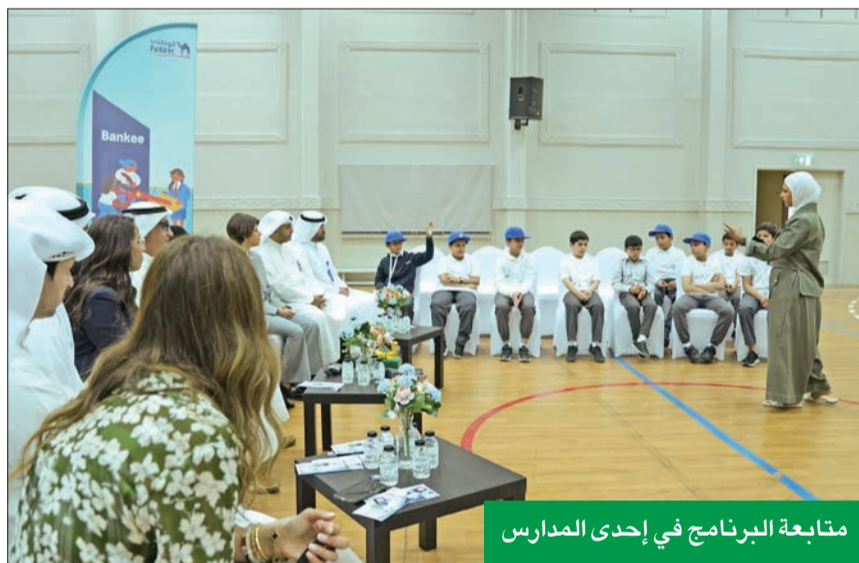
متابعة البرنامج في إحدى المدارس

تؤمن بأن زيادة الثقافة المالية بين المجتمع تشكل أساساً للازدهار الشخصي والاقتصادي