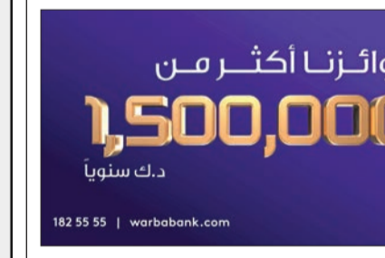
جوائزنا أكثر من 1,500,000 دك سنوياً

على مبلغ 250.000 دينار بمعدل 4 سحوبات خلال العام، حيث أقيم السحب الأول في أبريل، ويقام السحب الثاني في يوليو، والسحب الثالث في أكتوبر. أما السحب الرابع الأخير فسيكون في يناير 2025.