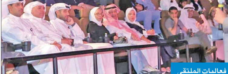
جانب من فعاليات الملتقى

وأشار البيان إلى أنه جرى توزيع 130 ألف وجبة «إفطار صائم» في مواقع متعددة، بينها: المساجد، وأسواق المباركية، وسوق السمك، والذي يُعد من أهم المشاريع الموسمية التي ينفذها البنك خلال شهر رمضان سنوياً.