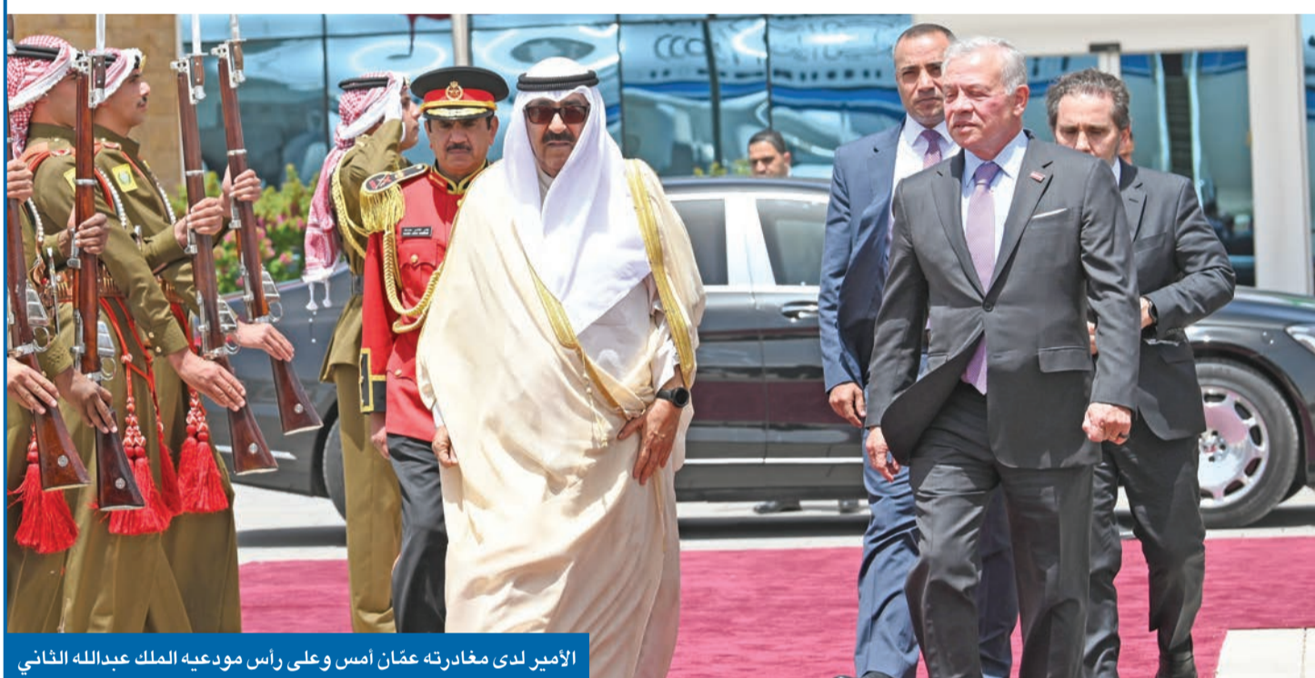
الأمير لدى مغادرته عمان أمس وعلى رأس مودعيه الملك عبدالله الثاني

صاحب السمو للعاهل الأردني: قيادة كريمة وشعب مضياف وكل الشكر على حفاوة الاستقبال ● الكويت والأردن أكدا في بيان ضرورة استكمال ترسيم الحدود البحرية الكويتية - العراقية لما بعد العلامة 162