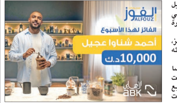
الفوز لهذا الأسبوع

في السحب الشهري الموافق الإثنين 29 أبريل 2024، حيث سيعلن اسم الراجح القادم، إذ إنه كلما زادت المبالغ المودعة زادت فرص الفوز.