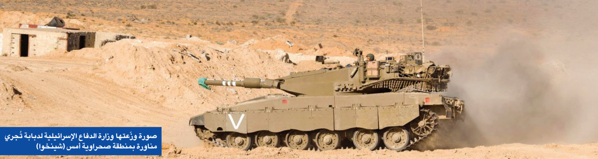
صورة وزعتها وزارة الدفاع الإسرائيلية لدبابة تُجري مناورة بمنطقة صحراوية أمس (شيوخو)

عبا الجيش الإسرائيلي لواءين احتياطيين للقيام بمهام في غزة، وقال إنه يستعد لاجتياح رفح قريباً جداً، رغم تواصل الدعوات الدولية لمنعه من دخول المدينة المكتظة بأكثر من مليون نازح، في حين زعم تقرير عربي أن دولاً عربية رفضت عرضاً تركيا لنشر قوات مشتركة في الضفة والقطاع لترتيبات ما بعد الحرب.