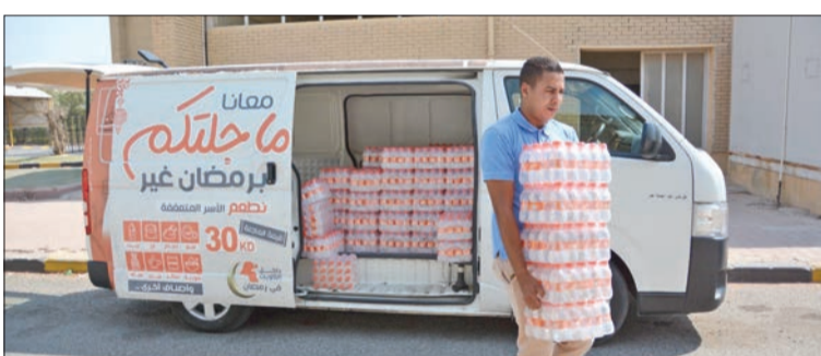
جانب من توزيع المساعدات

1500 سلة غذائية وزعت على الأسر المتعففة... وكسوة العيد لـ 600 يتيم