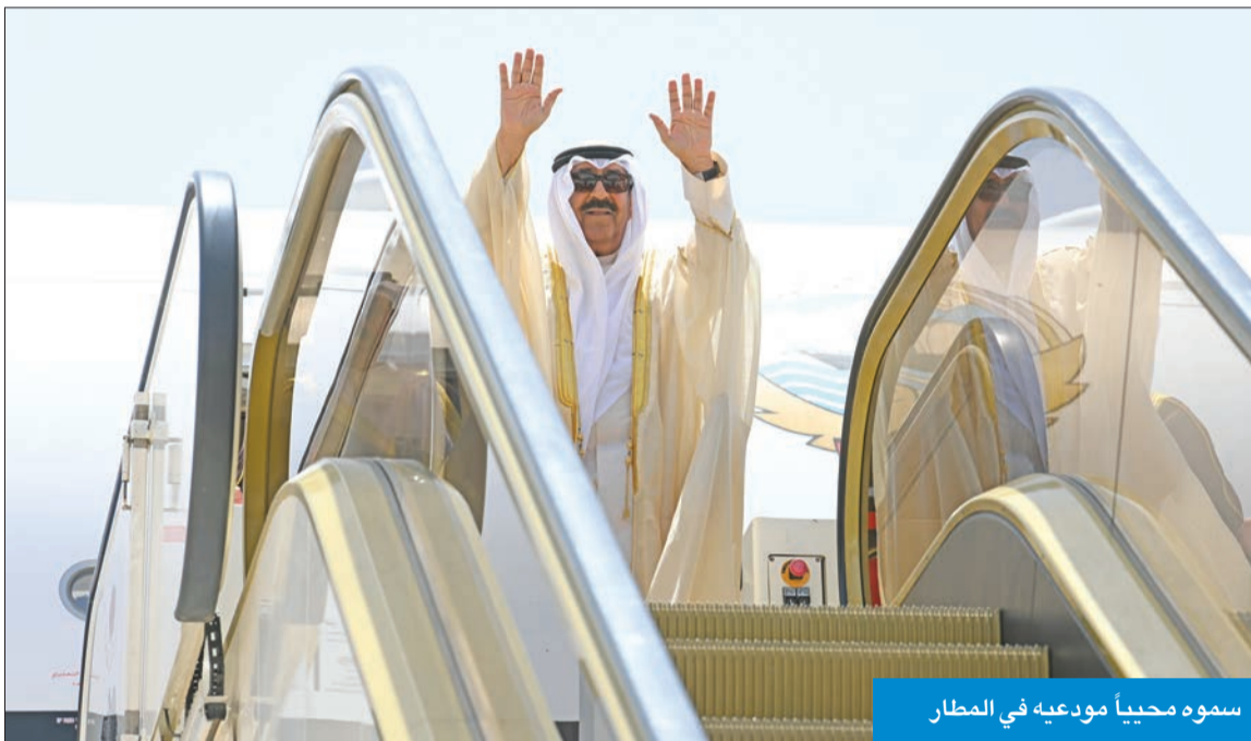
سموه محبياً مودعيه في المطار