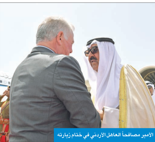
الأمير مصافحاً العاهل الأردني في ختام زيارته