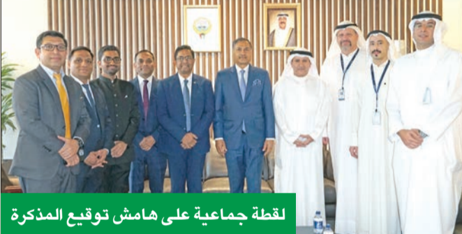
لقطة جماعية على هامش توقيع المذكرة

المساعدة في استقبال وفود الهيئتين من ذوي الاختصاص، والالتزام بقصر الأوراق المالية والمدير والمسؤولين والمساهمين والمستثمرين المحترفين لدى الشركات المدرجة أو المتقدمة بطلب إدراج في أسواق الأوراق المالية الخاصة بالهيئتين باي واجبات بموجب أي قوانين وأنظمة وقواعد ذات صلة بما في ذلك التزامات الإفصاح الكامل والدقيق.