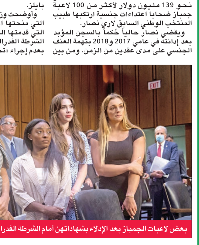
بعض لاعبات الجمباز بعد الإدلاء بشهادتهن أمام الشرطة الفدرالية

ضحاياه الكثيرات، البطلة الأولمبية سيمون بايلز. وأوضحت وزارة العدل في بيان أن التعويضات التي منحتها الحكومة هي استجابة للشكاوى التي قدمتها العديد من الضحايا اللاتي اتّهمن الشرطة الفدرالية «مكتب التحقيقات الفدرالي» بعدم إجراء «تحقيق مناسب».