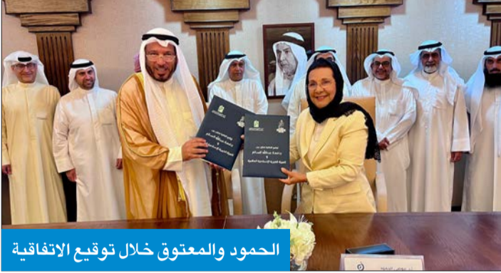
الحمود والمعوق خلال توقيع الاتفاقية

الحمود: لإعانة الدارسين على استكمال مسيرتهم التعليمية وإفادة أوطانهم