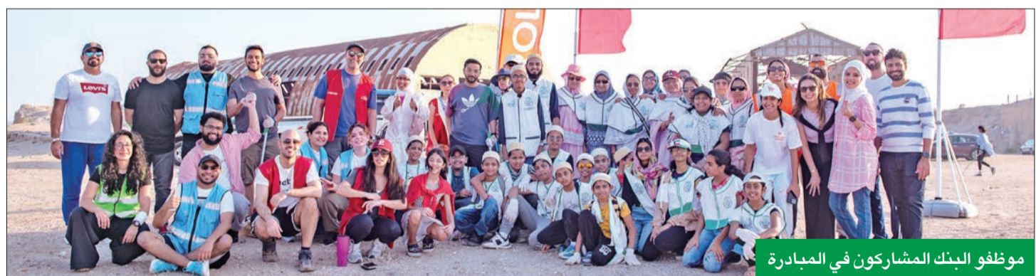
موظفو البنك المشاركون في المبادرة

بالتزامن مع الاحتفال بيوم الأرض وبالتعاون مع تراشتاق الكويت وTrolley