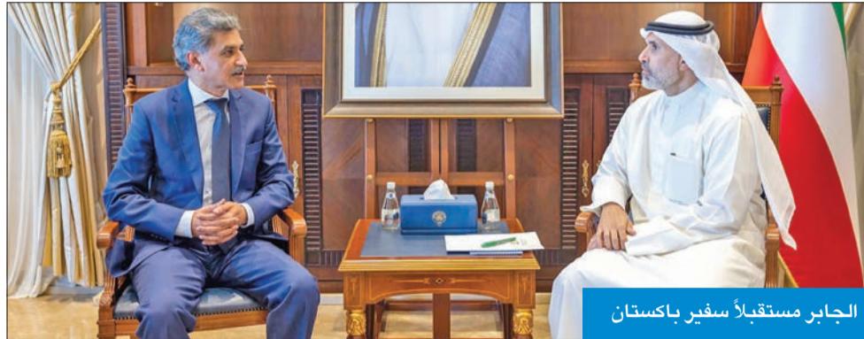
الجابر مستقبلاً سفير باكستان

تلقي صاحب السمو أمير البلاد، الشيخ مشعل الأحمد، رسالة خطية من رئيس وزراء جمهورية باكستان الإسلامية، محمد شهباز شريف، تتصل بالعلاقات الثنائية بين البلدين الصديقين، وسبل توطيدها في كل المجالات. وتسلم الرسالة نائب وزير الخارجية، السفير الشيخ جراح الجابر، أثناء استقباله سفير باكستان لدى دولة الكويت مالك فاروق. كما استقبل نائب وزير الخارجية، سفير الجمهورية الجزائرية الديمقراطية الشعبية، نورالدين مريم، بمناسبة انتهاء فترة عمله سفيراً لبلاده لدى الكويت.