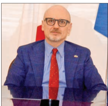
موريني خلال مؤتمره الصحفي

كما أن الشركات الإيطالية جاهزة لعرض منتجاتها الدفاعية على الكويت، ولدينا أهم الشركات المتخصصة بالعالم في هذا المجال». وعن القوات الإيطالية العاملة ضمن قوات التحالف الدولي في الكويت، قال موريني: «لدينا وجود قوي في قاعدة علي السالم الجوية، ولدينا نحو 500 جندي بالكويت، يعملون في الدعم اللوجستي والمراقبة في إطار التحالف ضد داعش».