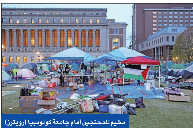
مخيم للمحتجين أمام جامعة كولومبيا

إن ذلك أدى إلى «تبدل الوضع بشكل هائل»، متحدثاً عن «سلوكيات فوضوية وتخريبية ومفيرة للعداء»، فضلاً عن «هتافات ترحيبية وعدة حوادث معادية للسامية». أما على الساحل الغربي، فاعلنت جامعة ولاية كاليفورنيا للعلوم التطبيقية أنها ستبقي مغلقة حتى الأربعاء على أقل تقدير، بعدما احتل متظاهرون مؤيدون للفلسطينيين مبنى إدارياً. كما لفتت الاحتجاجات انتباه الرئيس جو بايدن وإدارته.