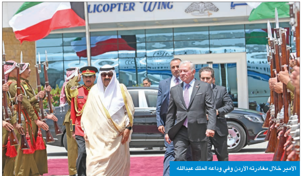
الأمير خلال مغادرته الأردن وفي وداعه الملك عبدالله

على أهمية أمن واستقرار الملاحة في الممرات البحرية بالمنطقة وفقاً لإحكام القانون الدولي واتفاقية الأمم المتحدة لقانون البحار لعام 1982 حفاظاً على مصالح دول العالم أجمع.