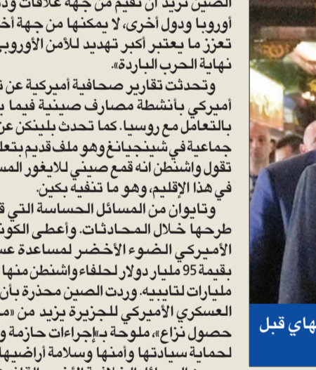
بليكن والسفير الأمريكي في الصين نيكولاس بيرنز باحد شوارع شنغهاي قبل مشاهدة مباراة كرة سلة يشارك فيها لاعبان أميركيان

الصين تريد أن تقيم من جهة علاقات ودية مع أوروبا ودول أخرى، لا يمكنها من جهة أخرى أن تترنن ما يعتبر أكبر تهديد للأمن الأوروبي منذ نهاية الحرب الباردة. وتحدثت تقارير صحافية أميركية عن تدقيق أمريكي بأنشطة مصارف صينية فيما يتعلق بالتعامل مع روسيا. كما تحدثت بليكن عن إعادة جماعة في شينجيانغ وهو ملف قديم يتعلق بما تقول واشنطن أنه قمع صيني للايغور المسلمين في هذا الإقليم، وهو ما تخفيه بكين. وتايوان من المسائل الحساسة التي قد يتم طرحها خلال المحادثات، وأعطى الكونغرس الأميركي الضوء الأخضر لمساعدة عسكرية بقيمة 95 مليار دولار لحلفاء واشنطن منها تسعة مليارات لتايبيه. وردت الصين محذرة بأن الدعم العسكري الأمريكي للجزيرة يزيد من «مخاطر حصول نزاع»، ملوحة بإجراءات حازمة وفعالة لحماية سيادتها وأمنها وسلامة أراضيها. ومن المسائل الخلافية الأخرى القانون الذي أقره الكونغرس الأميركي ويقضي بحظر تطبيق تيك توك في الولايات المتحدة ما لم توافق شركته الأم الصينية «بايتدانس» على التنازل عن حصتها فيه. وسئل المتحدث باسم الخارجية الصينية وانغ وينبين أمس، عن المسألة فاكتمل بالذكور بصوقف الصين المبدئي «بهذا الصدد». ودعت الصين وواشنطن في نهاية مارس