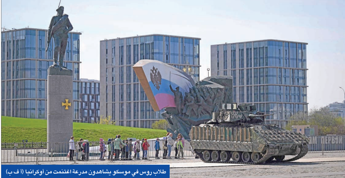
طلاب روس في موسكو يشاهدون مدرعة اغتتمت من أوكرانيا

أواجه طعنا في القضاء. إيران حاضرة ووافق مجلس الشيوخ على 3 مشاريع قوانين تفرض عقوبات متعلقة بإيران، خصوصاً «قانون مهسا» الذي يستهدف المرشد الإيراني علي خامنئي ومكتبه ومساعديه والرئيس الإيراني إبراهيم رئيسي وعدداً من الكيانات التابعة للمرشد. كما يطالب مشروع القانون أيضاً الرئيس الأميركي بأن يقدم تقريراً إلى الكونغرس كل عام حول ما إذا كان ينبغي أن يظل هؤلاء المسؤولون تحت العقوبات الحالية، ما يجعل من الصعب جداً على الإدارات الحالية والمستقبلية رفع العقوبات دون الرجوع إلى الكونغرس.