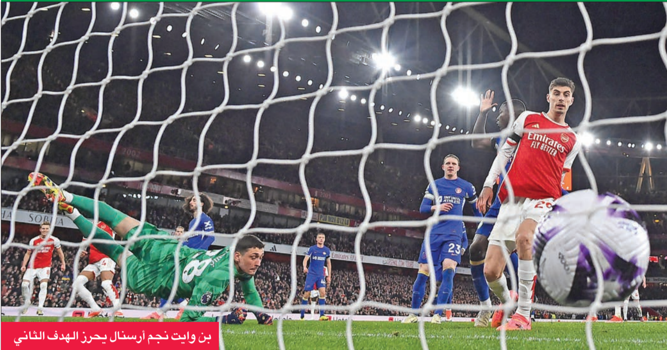
بن وايت نجم أرسنال يحرز الهدف الثاني

ملعب ويمبلي في نصف نهائي الكأس، بسبب إصابة عضلية تعرض لها خلال مواجهة ريال مدريد الإسباني في إياب ربع نهائي دوري أبطال أوروبا. وأكد الإسباني بيب غوارديولا مدرب سبتي أن إصابة هالاند ليست خطيرة، ويُمكن أن يعود قبل مواجهة توتنهام فوريسم الأحد في المرحلة الخامسة والثلاثين.