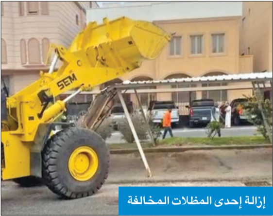
إزالة إحدى المظلات المخالفة

أكدت إدارة العلاقات العامة في بلدية الكويت أن الفريق الميداني يقسم إزالة المخالفات في محافظة مبارك الكبير نفق حملة إزالة التعديات على أملاك الدولة بعد الانتهاء من المدة القانونية للإنذار، حيث تمت إزالة 6 مظلات لمبان سكنية. وأعلنت الإدارة بدء حملات ميدانية مكثفة خلال شهر أبريل الجاري لإزالة أي تعديات مقامة على أملاك الدولة في كافة المحافظات، وأوضحت أنه بالتعاون مع أقسام إزالة المخالفات بفرع البلدية في المحافظات، ستنفذ الحملات الميدانية من الفرق الرقابية وستشمل المناطق الصناعية والتجارية الاستثمارية وتعديات مناطق البر، موضحة أن بلدية الكويت اهابت بجميع الفرق الميدانية في جميع المحافظات الالتزام بالقوانين وعدم التأخر مع أي مخالفات وتعديات وانذارهم قبل الإزالة.