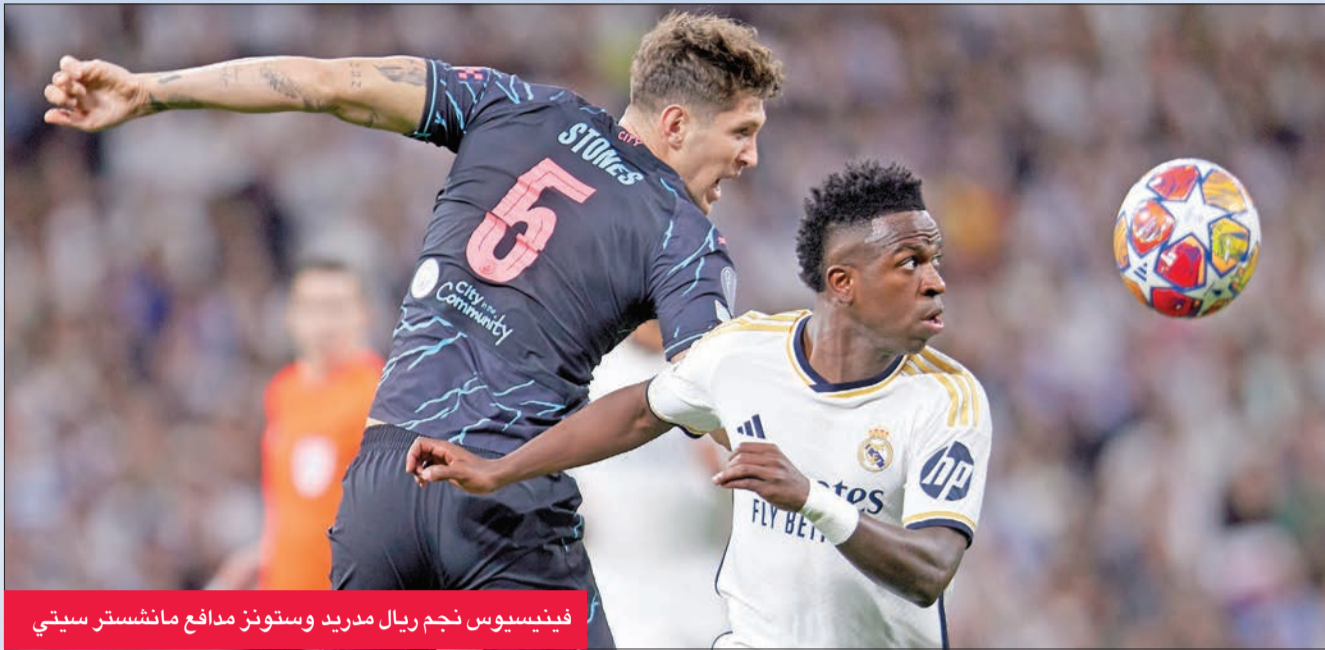
فينيسيوس نجم ريال مدريد وستونز مدافع مانشستر سيتي

وحت مدربه الإسباني ميكل أرتيتا فريقيه على عدم فقدان الشجاعة، وتحول التركيز إلى مباراة الأربعة في ألمانيا، وقال: «إذا كنت تريد الفوز بالبطولات، إذا كنت تريد أن تكون هناك في دوري أبطال أوروبا عندما تكون لديك هذه اللحظات، عليك أن تتفهم».