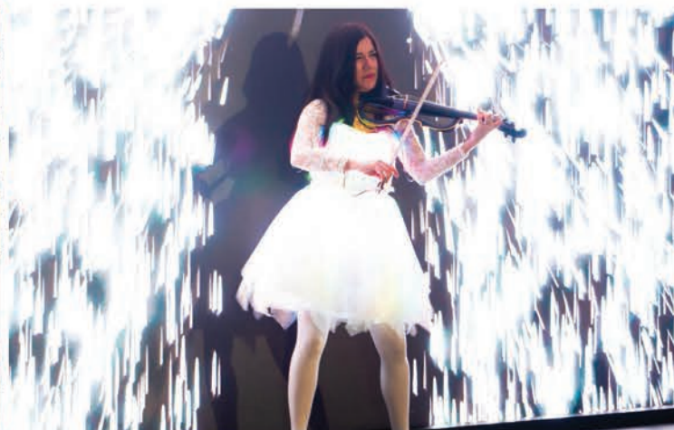
عازفة الكمان صممت مقطوعة فنية خصيصاً لحفل الإطلاق