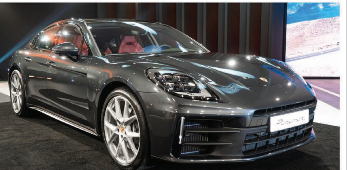
سيارة الباناميرا الجديدة باللون الرمادي البركاني المبتلي