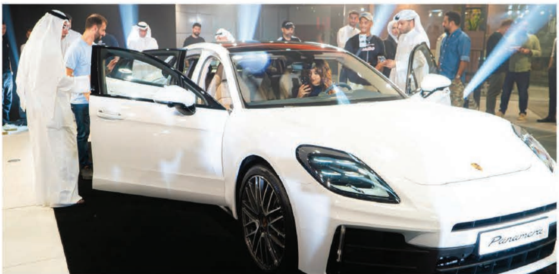
الحضور يستكفون سيارة الباناميرا الجديدة