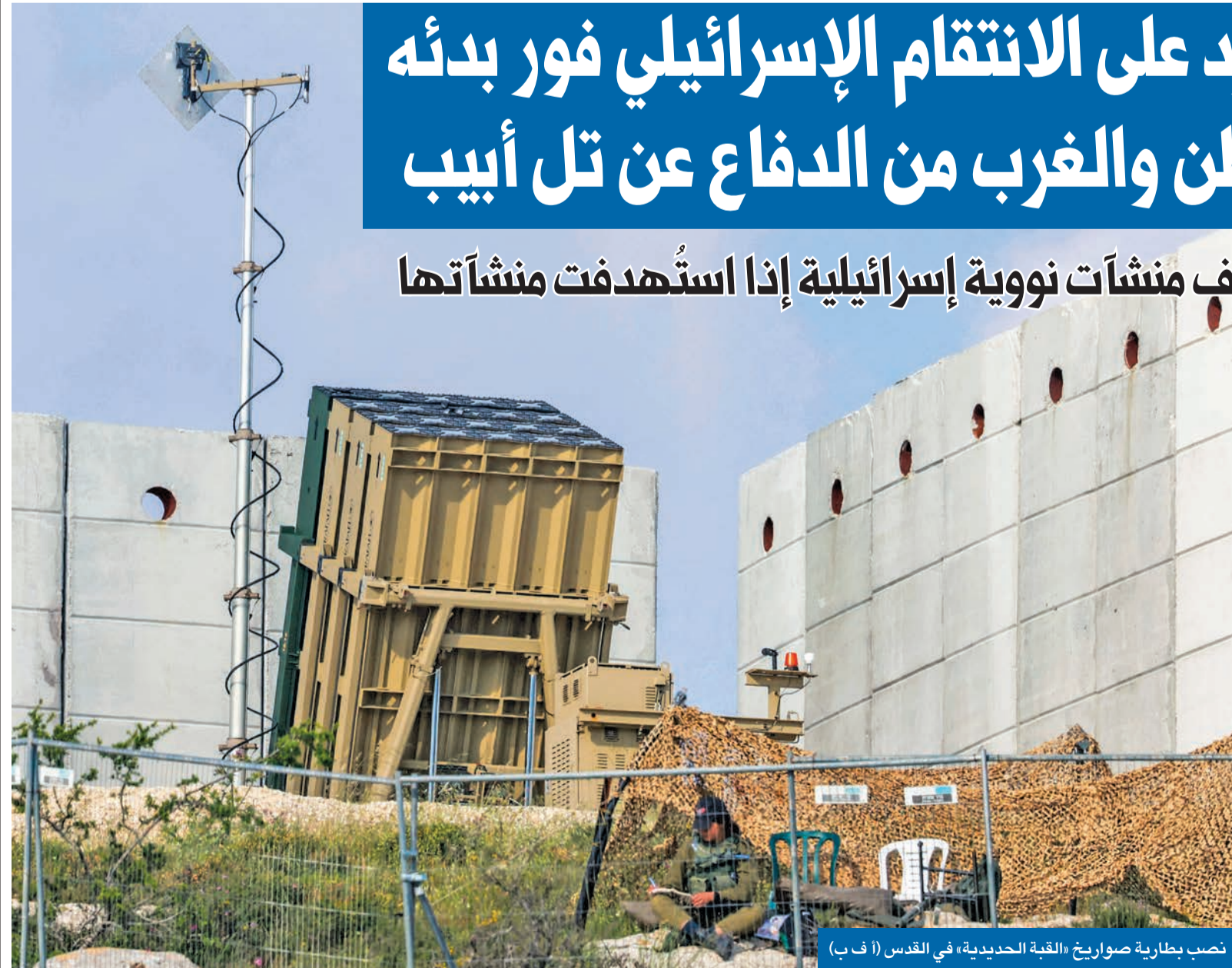
نصب بطارية صواريخ «القبة الحديدية» في القدس

وأضاف أن إيران قالت في الرسالة إنه يجب على الأميركيين والأوروبيين تجنب الدفاع عن إسرائيل كما فعلوا خلال الهجوم الأخير تحت طائلة تعرض قواتهم للخطر، وإنها لا تأخذ على حمل الجد التصريحات الأميركية بعدم المشاركة في الرد الإسرائيلي المرتقب، 02