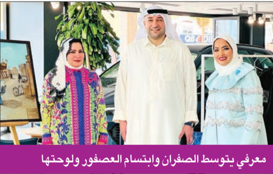
معرفي يتوسط الصفران وإبتسام العصفور ولوحاتها

بحضور وزير الدولة لشؤون الشباب والاتصالات داود معرفي