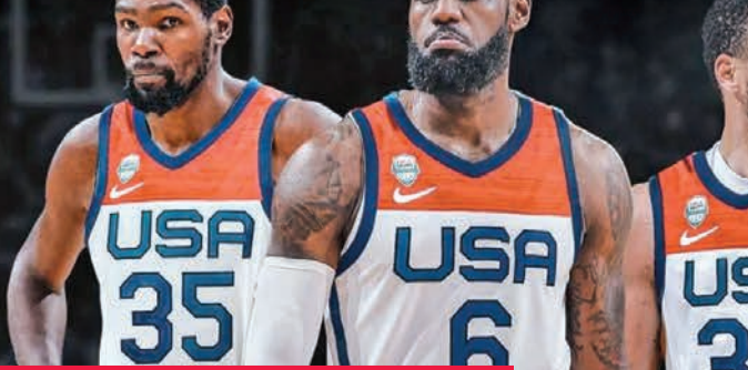
كوري وليبرون ودورانت نجوم المنتخب الأميركي

هيبت بام ادنبايو، وبوسطن سلتيكس جايسون تايتوم وجرو هوليدي، وزميل دورانت الذي يشارك في الألعاب الأولمبية بشكل مستمر منذ عام 2012، لاعبا رابعا توج بلقب أفضل لاعب في الدوري الأميركي للمحترفين (في عام 2023) في شخص لاعب ارتكان فيلادلفيا سفنتي سيكسرز الكاميروني الأصل جويل إمبيد الذي تم تجنيسه مؤخراً. وسيضم المنتخب الذي سيشارك عليه مدرب ووريزر ستيف كير، نجوم ليكرز الآخر أنتوني ديفيس وميامي