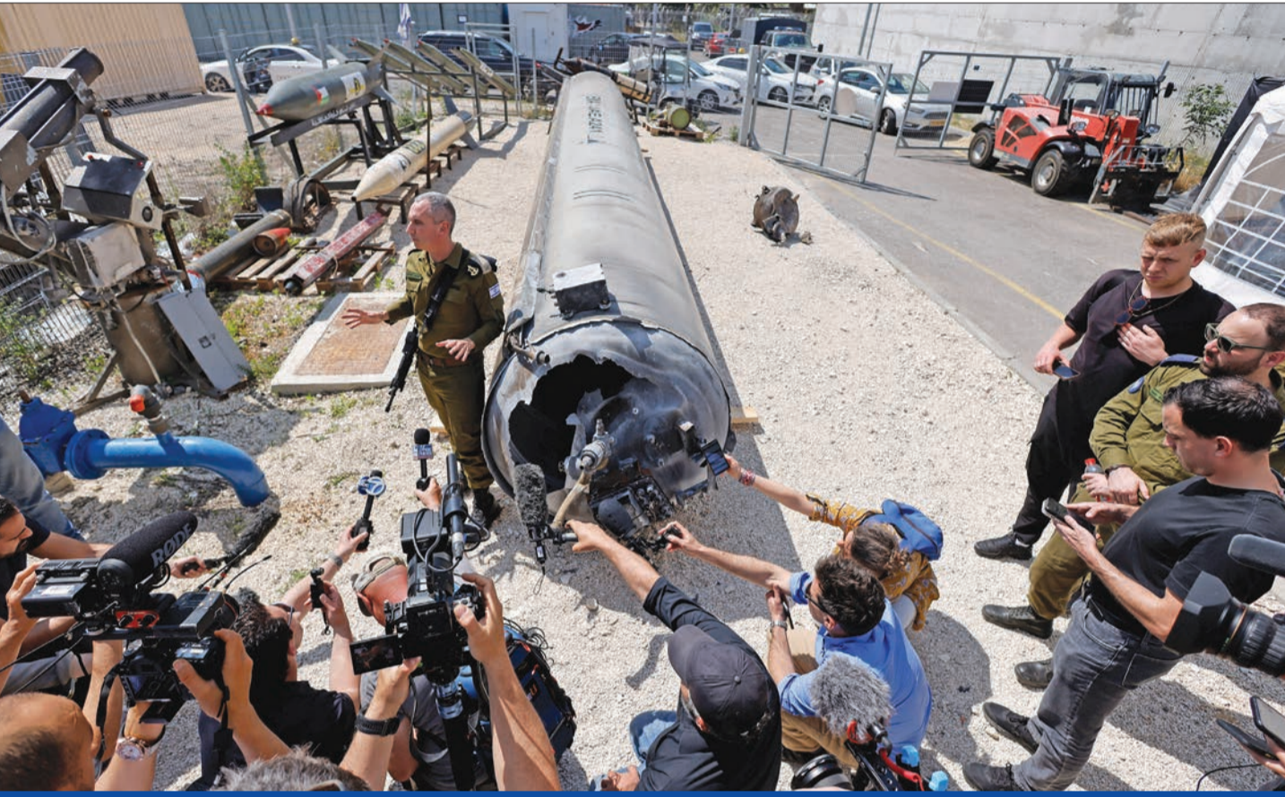
متحدث باسم الجيش الإسرائيلي خلال مؤتمر، أمس، بجوار هيكل صاروخ قال إنه تم انتشاله من البحر الميت عقب هجوم إيران على قاعدة جنوب إسرائيل

طهران تغلق مواقعها النووية وتمنح إجازة لقادة الفصائل بسورية وتؤكد لموسكو وبكين عدم سعيها للتصعيد