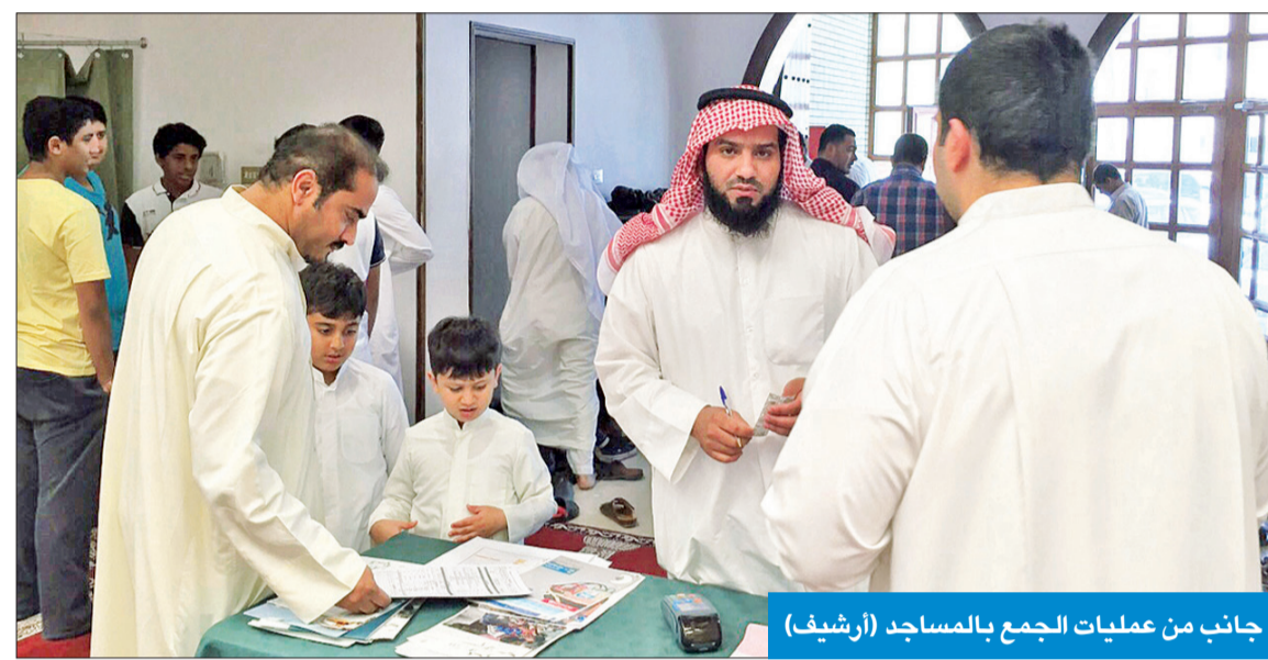
جانب من عمليات الجمع بالمساجد (أرشيف)

مالية مفصلة تظهر إجمالي حصيلة التبرعات خلال الشهر الفضيل، تتضمن إيراداتها ومصروفاتها، ومع تحديد نوعية المشروعات المنفذة، سواء كانت داخل الكويت أو خارجها. ووفقاً لمصادر «الشؤون»، فإن الإدارة ستصدر تعميماً بهذا الصدد تطبيقاً للاتحة تنظيم جمع التبرعات الصادرة بالقرار الوزاري 128/ لسنة 2016 وتعدياته، والتي ألزمت المصّرّح لهم بجمع التبرعات بعد انتهاء مدة الترخيص بالجمع تقديم تقرير مالي وكشف حساب بنكي إلى الإدارة المختصة، يوضح حصيلة الحملة، وموقع من رئيس الجهة أو من ينوب عنه، وذلك خلال أسبوعين من تاريخ انتهاء الترخيص.