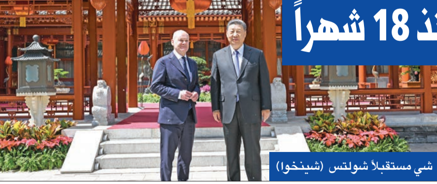
شي مستقبلاً شولتس

برلين تحذر بكين من تسليح موسكو... وشي ينه شولتس من الحمائية