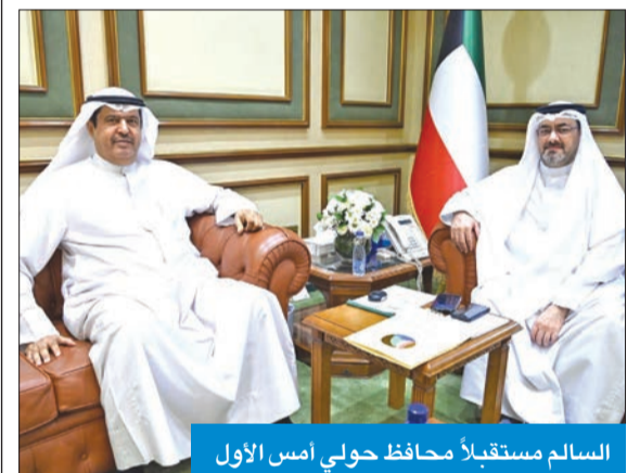
السالم مستقبلاً محافظ حولي أمس الأول

استقبل محافظ العاصمة الشيخ عبدالله السالم، في مكتبه أمس الأول، محافظ حولي علي الأصغر، وتم خلال اللقاء بحث العديد من القضايا التي تهم المحافظين والسبل الكفيلة بالارتقاء بهما. كما استقبل محافظ