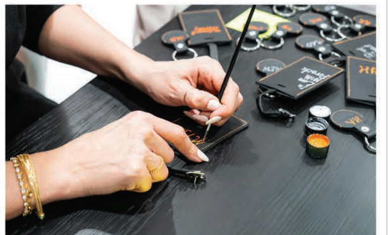
الهدايا التذكارية تم تخصيصها لكل فرد من الحضور