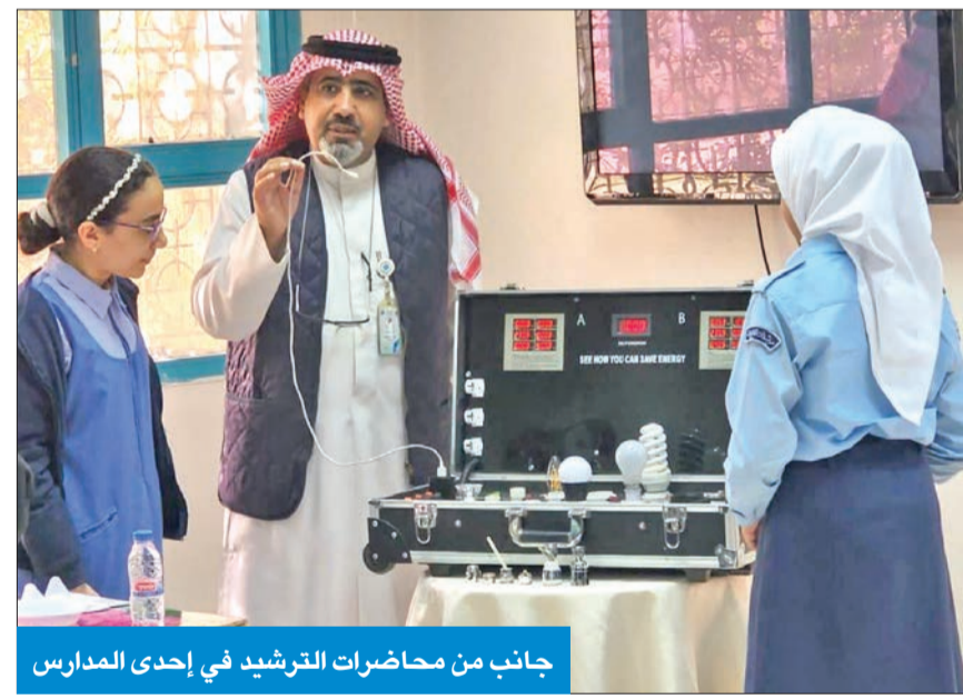
جانب من محاضرات الترشيد في إحدى المدارس

تلك المدارس بمختلف محافظات البلاد. وشكرت الكهرباء وزارة التربية، ممثلة في قطاع التنمية التربوية والأنشطة، على تعاونهم واستقبالهم لفريق الوزارة من أجل تقديم محاضرات ترفقي بالفكر التوعوي لدى طلاب المدارس المستهدفة من تلك الحملات التي تخدم الوزارة.