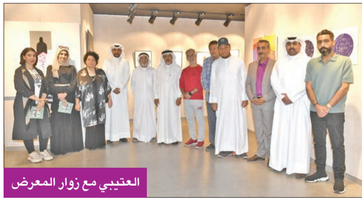
العتيبي مع زوار المعرض

أقاموا معرضاً مشتركاً في قاعة بوشهري للفنون