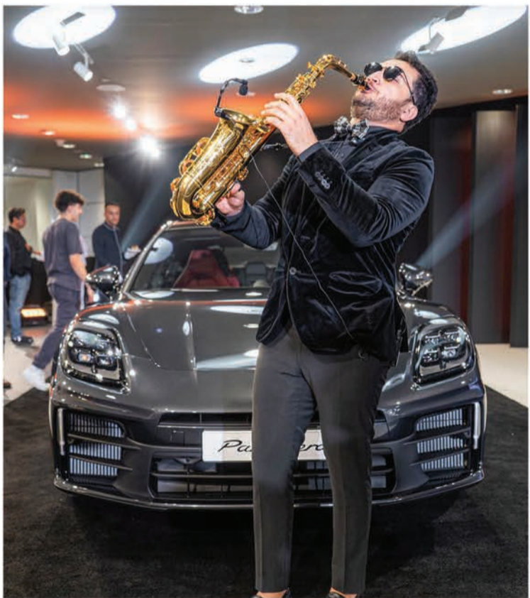
عازف الساكسفون يحيي الحفل

كما أنه لأول مرة، تتمتع سيارة بورشه بهيكل مبتكر مع تحكم نشط - كخيار لجميع الطرازات الهجينة. نحن نسلمها Porsche Active Ride. الأمر الذي يتيح مستوى جديد تماماً ونطاق حديث يجمع بين الأداء والراحة، مع ديناميكية ذكية على الطرق المتعرجة، بينما تكون سلسلة بين الطرق الأساسية في المدينة