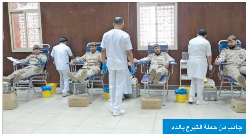
جانب من حملة التبرع بالدم

العسكرية، ضباط وضباط الصف والأفراد وكان هذه المناسبات. وقال المصدر إن إيران تستبعد أن تستهدف إسرائيل محطة بوشهر النووية جنوب إيران، لأن ذلك سيشكل خطراً على الدول الخليجية الصديقة لواشنطن، وكذلك القوات الأميركية في المنطقة، موضحة أن استهداف المنشآت الأخرى يتطلب قدرات لا تملكها إسرائيل، وإذا تم ذلك فستعتبر طهران واشنطن شريكة في الهجوم. وذكر أن البحرية الإيرانية تعمل على رصد تحركات السفن والغواصات في بحر عمان وبحر العرب والبحر الأحمر؛ تحسباً لاحتمال شن إسرائيل هجوماً من البحر، مؤكداً أن الأوامر أعطيت لاستهداف أي سفينة حربية أو غواصة إسرائيلية تقرب من إيران دون سابق إنذار.