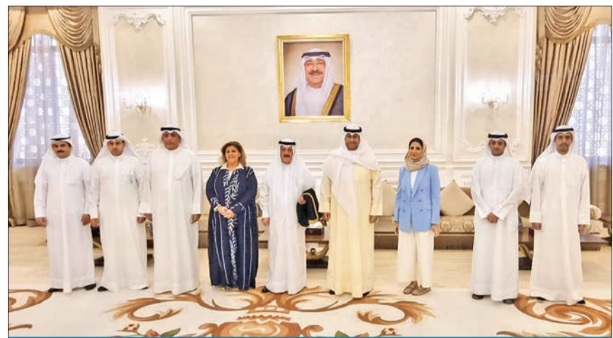
وفد الكويت برئاسة وزير العدل قبيل مغادرته إلى مسقط

يُعقد اليوم في سلطنة عمان بمشاركة خليجية وعربية ودولية