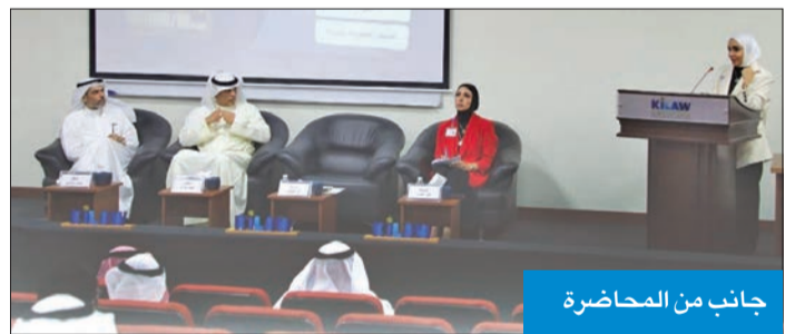
جانب من المحاضرة

قدّمت الهيئة العامة لمكافحة الفساد (نزاهة) محاضرة توعوية حول قانون حق الاطلاع على المعلومات لطلبة كلية القانون الكويتية العالمية (kilaw) في مقر الكلية، وتم شرح النصوص الدولية و مواد القانون وأهميته وأثره على حقوق الأفراد. وفي ختام المحاضرة بينت «نزاهة» جهود الهيئة ودورها حتى صدور القانون ولأخته التنفيذية، وذلك لأهميته في تعزيز النزاهة والشفافية، وأثره على منع الفساد وحماية المال العام.