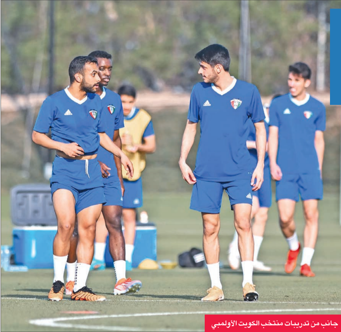
جانب من تدريبات منتخب الكويت الأولمبي