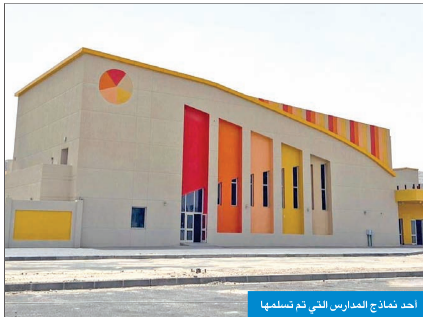
أحد نماذج المدارس التي تم تسلمها

بينما تعمل الجهات المختصة في وزارة التربية على متابعة الاستعدادات الخاصة بالعام الدراسي المقبل 2025/2024، وعملية تجهيز المدارس وتوفير الكوادر التعليمية والإدارية، لضمان تشغيلها وفق أحدث المواصفات، كشفت مصادر تربوية لـ«الجريدة»، عن تسلم وزارة التربية 10 مبانٍ مدرسية في مدينة المطلاع، حيث قامت المؤسسة العامة للرعاية السكنية بتسليم هذه المباني للوزارة مؤخراً، موضحة أن هذه المدارس تتوزع بين مبانٍ لرياض الأطفال، ومدارس ابتدائية، ومتوسطة، وثانوية. وقالت المصادر إن عملية التسليم تمت من خلال المهندسين المسؤولين عن المشاريع في «السكنية» ومهندسي قطاع المنشآت التربوية، حيث تم تسليم المباني مبدئياً خلال الأشهر الماضية، منوهة إلى أن آخر مبنى تم تسليمه الأحد الماضي هو مبنى روضة أطفال. وأضافت أن هذه المباني تخضع للكفالة والضمان لمدة سنتين من تاريخ الاستلام، حيث يتم الكشف مبدئياً على مدى مطابقتها للشروط ومن ثم تتم متابعة هذه المباني خلال فترة الضمان ومخاطبة «السكنية» في حال وجود أي ملاحظات.