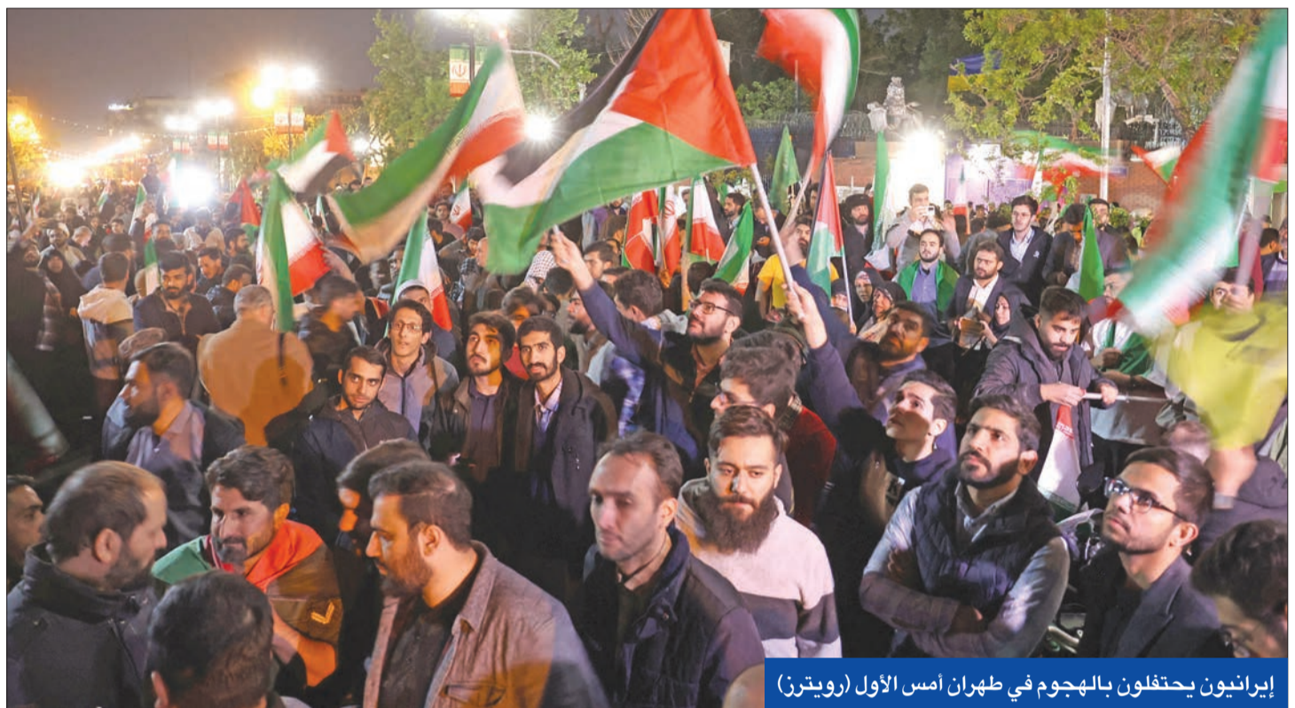
إيرانيون يحتفلون بالهجوم في طهران أمس الأول

أبيب بإخطار واشنطن قبل أي رد ضد طهران في ظل تخوفات من إقدام الحكومة الإسرائيلية التي يهيمن عليها التيار اليميني على خطوة متسارعة على غرار سلوكها بغزة وضربتها بدمشق. وبحسب الموقع الأميركي أبلغ بايدن نتنهاو في اتصال هاتفياً أن واشنطن ستعارض ولن تشارك بأي هجوم إيراني على إيران. وجاء ذلك في وقت قال المتحدث باسم مجلس الأمن القومي جون كيري إن بايدن لا يعتقد أن الهجوم الإيراني يتطلب التصعيد إلى حرب أوسع، مؤكداً أن المشاركة في التصدي للهجوم كانت من أجل منع توسع الصراع في المقابل، أفردت موسكو بدعم طهران على الساحة الدولية ووضعت ضربتها بخانة الدفاع عن النفس بعد فشل مجلس الأمن في إدانة ضربة القنصلية ومعالجة القضية الفلسطينية وازمة غزة. ورغم استمرار شبح اندلاع حرب مفتوحة بعد كسر قاعدة عدم توجيه كلا الطرفين ضربات عنيفة ومباشرة، أعادت دول الجوار ومن بينها العراق والأردن فتح أجوائها أمام الطيران الذي تم تعليقه قبل الهجوم أمس.