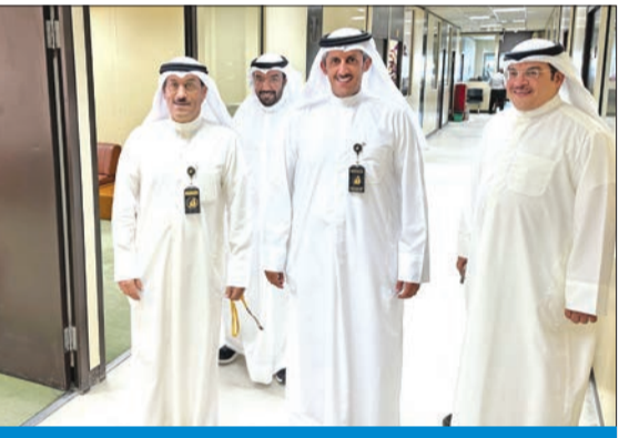
ساري خلال جولته أمس على الموظفين لتفقد سير العمل عقب الإجازة

عقب فتح النقل الذي يستمر حتى نهاية الشهر الجاري، وفق الضوابط والإجراءات المعمول بها بهذا الشأن.