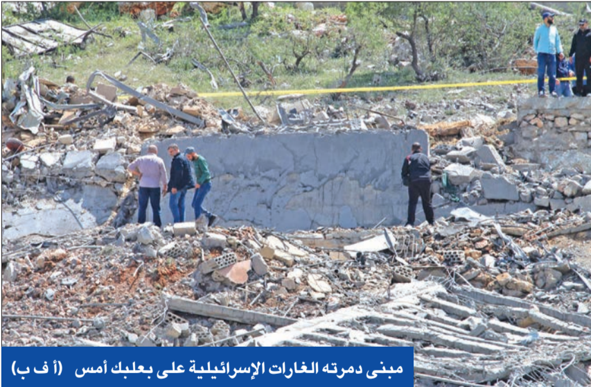
مبنى دمرته الغارات الإسرائيلية على يعلبك أمس