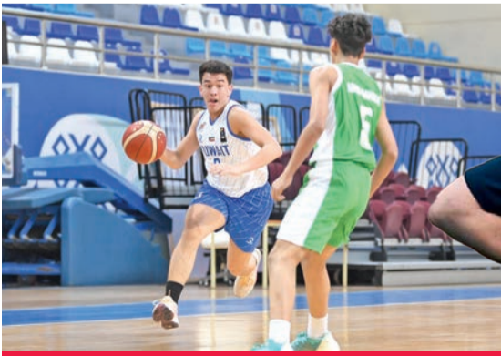
جانب من مباراة منتخب الشباب مع نظيره العراقي

حقق منتخبنا الوطني للشباب تحت 18 سنة لكرة السلة فوزاً مثيراً على نظيره العراقي بنتيجة 82-77 في المباراة الودية التي جمعتهما أمس الأول على صالة الاتحاد الرياضي، في إطار استعدادات منتخب الناشئين للمشاركة لبطولة الخليج في أغسطس المقبل.