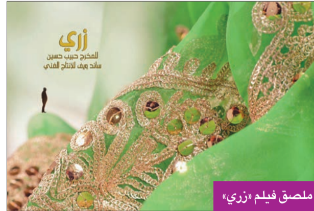
ملصق فيلم «زري»