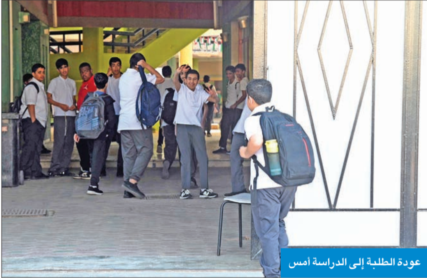
عودة الطلبة إلى الدراسة أمس

واستقبلت وزارة الكهرباء والماء، أمس، موظفيها الذين