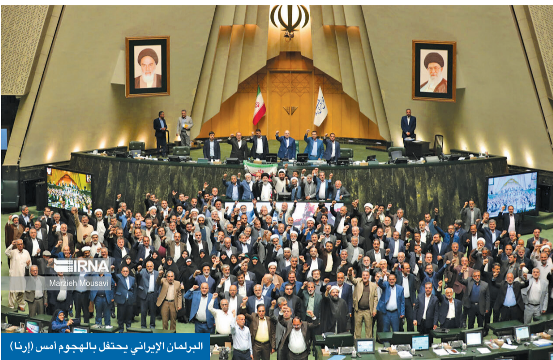
البرلمان الإيراني يحتفل بالهجوم أمس

طهران اختارت أحد 5 سيناريوهات... وواشنطن حذرتها من الرهان على قدرتها العسكرية