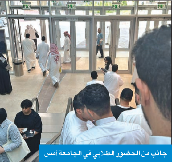
جانب من الحضور الطلابي في الجامعة أمس

والعديلية والكليات والمعاهد انضباطاً تاماً بنسبة كبيرة من قبل الموظفين. وفي ظل قلة أعداد الموظفين وأعضاء هيئة التدريس والطلبة في جامعة عبدالله السالم نتيجة طور تأسيسها، إلا أن الحضور كان بشكل كبير من قبل الإداريين وأعضاء هيئة التدريس والطلبة في الخالدية.