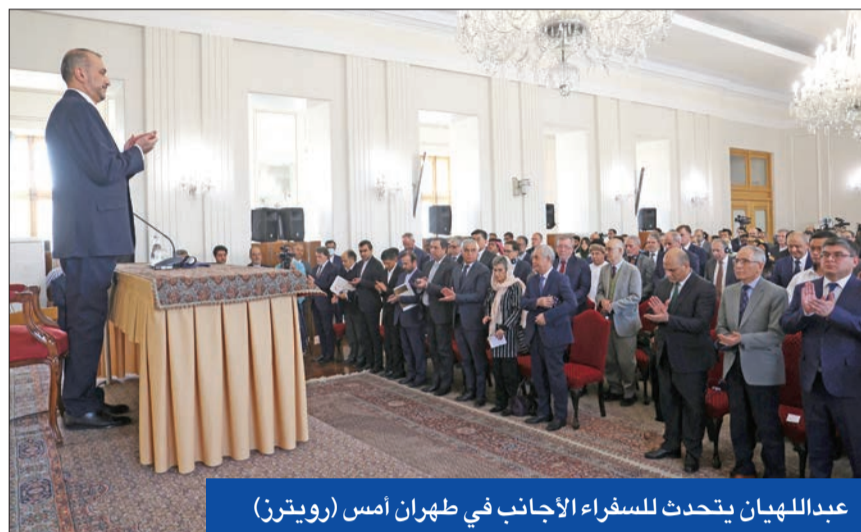
عبداللهيان يتحدث للسفراء الأجانب في طهران أمس