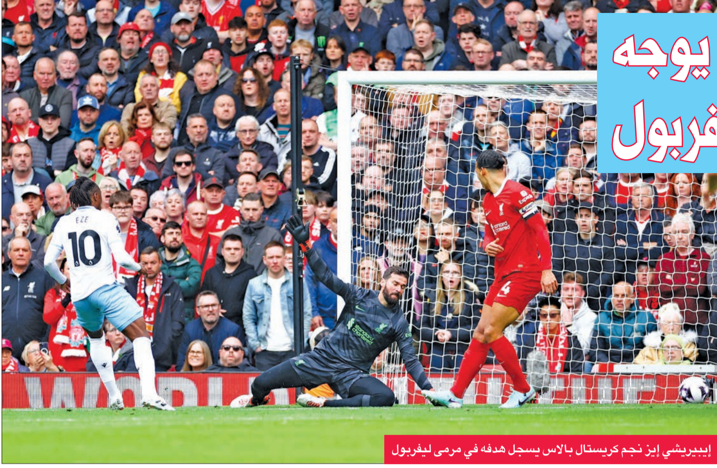
إيبيريشي إيز نجم كريستال بالاس يسجل هدفه في مرمى ليفربول

تلقى ليفربول ضربة قوية لطموحاته بإحراز لقب الدوري الإنكليزي الممتاز، وذلك بهزيمته أمام كريستال بالاس 1-0 صفر، أمس في المرحلة الثالثة والثلاثين من المسابقة.