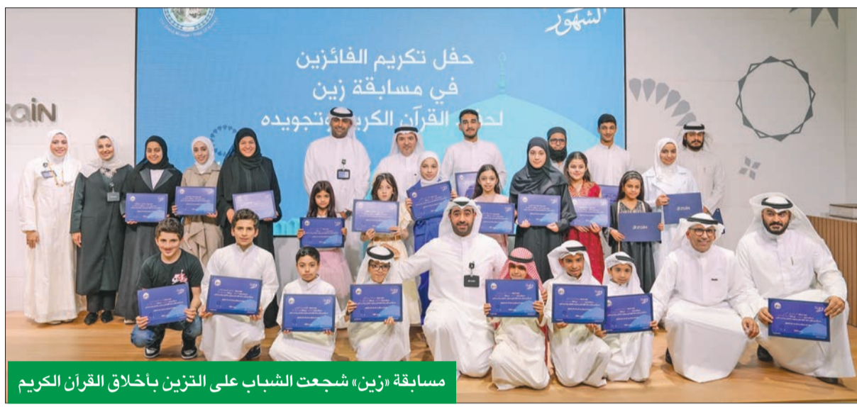
مسابقة «زين» شجعت الشباب على التزین بأخلاق القرآن الكريم

أقامت الشركة مسابقتها الأولى لحفظ القرآن الكريم وتجويده بمشاركة الاستراتيجية مع مسجد الدولة الكبير، التي شهدت مشاركة ثلاث المشاركين من الجنسين، وهدفت إلى تشجيع أفراد المجتمع من مختلف الفئات العمرية الشابة على حفظ كتاب الله تعالى، والتزین بقميحه السامية، وقدمت جوائز تشجيعية نقدية للفائزين بالمراكز الثلاثة الأولى لكل من الفئات الست.