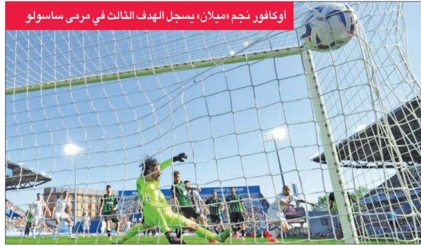
أوكافور نجم «ميلان» يسجل الهدف الثالث في مرمى ساسولو

أفلت ميلان من هزيمة محققة أمام ضيفه ساسولو، وتعادل معه 3-3، أمس ضمن منافسات الجولة 32 من الدوري الإيطالي لكرة القدم.