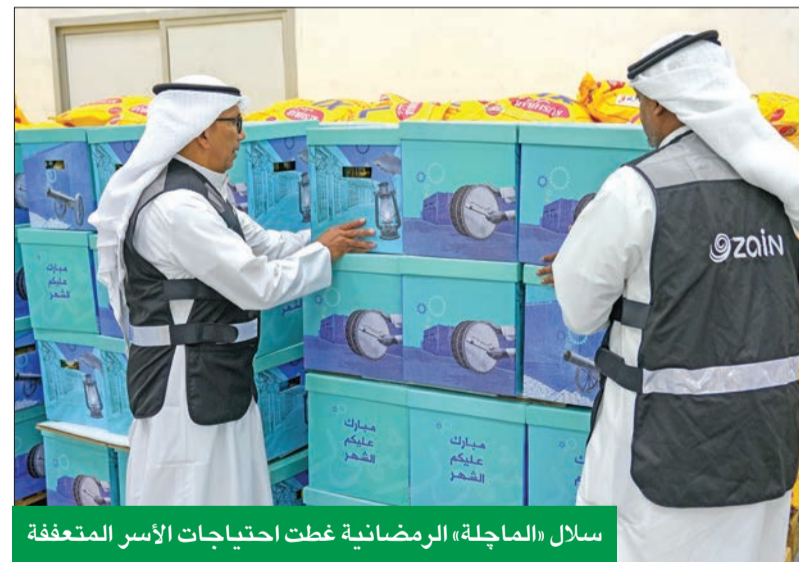
سلاسل «الماجلة» الرمضانية غطت احتياجات الأسر المتعففة

وللعمام الثالث على التوالي، انطلق «تحدي زين» الرمضاني في حديقة الشهيد بمشاركة الاستراتيجية مع شركة Suffix، وهو البرنامج الرياضي المميز الذي حقق نجاحاً كبيراً