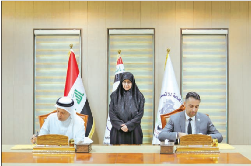
خلال توقيع الاتفاقية

كما يعالج نظام كابلات «كلام العراق ترانزيت»، الفريد المخاطر الجيوسياسية وقيود السعة، ما يوفر طريقاً أكثر كفاءة، فيما يقدم للعملاء خيارات اتصال متنوعة بالخليج العربي.