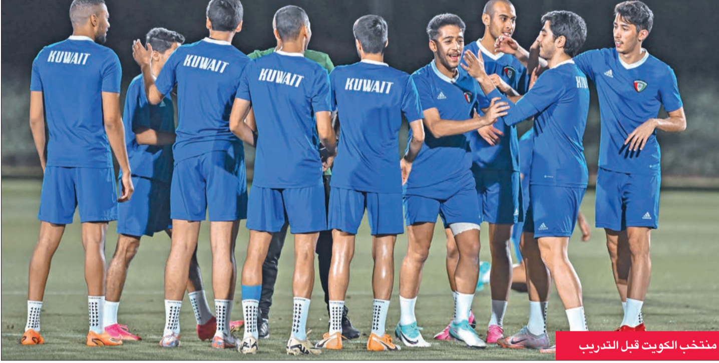
منتخب الكويت قبل التدريب