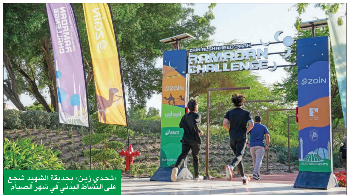
«تحدي زين» بحديقة الشهيد شجع على النشاط البدني في شهر الصيام