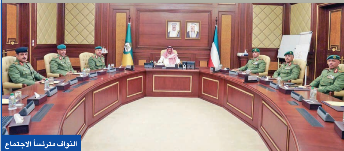
النواف مترئساً الاجتماع

ترأس نائب رئيس الحرس الوطني الشيخ فيصل النواف اجتماعاً مع وكيل الحرس الفريق الركن مهندس هاشم الرفاعي وكبار القادة، لاستعراض جاهزية الحرس في تأمين المعسكرات ومواقع الأمن والاستقرار والحفاظ على مقدرات الوطن بالتعاون مع منتسبي وزارتي