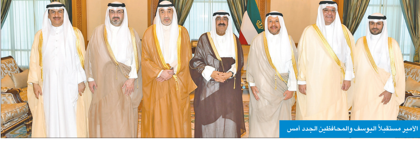
الأمير مستقبلاً اليوسف والمحافظين الجدد أمس

استقبل سمو أمير البلاد الشيخ مشعل الأحمد بقرص السيف، ظهر أمس، نائب رئيس مجلس الوزراء وزير الدفاع وزير الداخلية بالوكالة، الشيخ فهد اليوسف، حيث قدم لسموه محافظ الغرمانية الشيخ عذبي