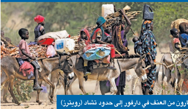
فارون من العنف في دارفور إلى حدود تشاد

واحدة من طرفي الحرب، مما جذبها حتى الامس القريب الإنزلق إلى القتال. وتتمركز في الفاشر، التي هاجمتها «الدعم السريع» أمس الأول، الحركات المسلحة الموقعة على اتفاق السلام التاريخي، الذي أبرم عام 2020 في جوبا مع الحكومة المدنية الانتقالية، التي تولت السلطة عقب إطاحة الرئيس السابق عمر البشير. ونتيجة تدهور الأوضاع في عاصمة ولاية شمال دارفور، أعلنت