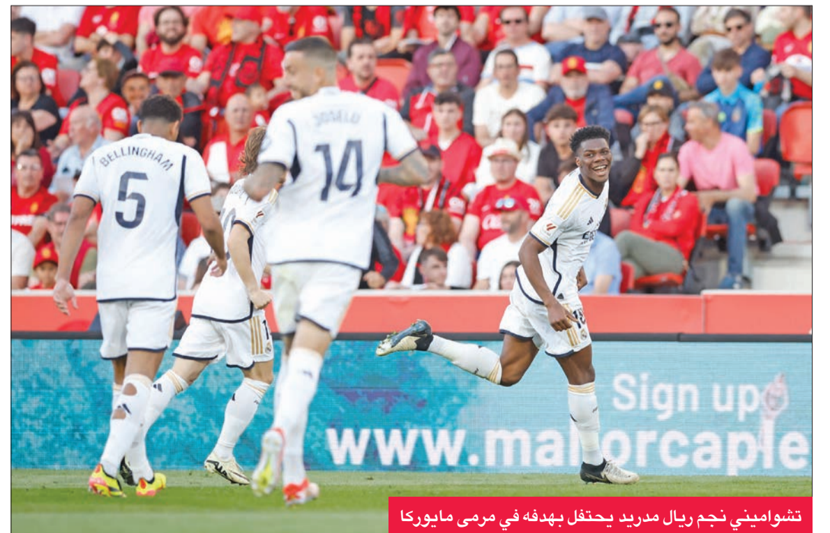
تشواميني نجم ريال مدريد يحتفل بهدفه في مرمى مايوركا

استعد ريال مدريد المتصدر لرحلته الشاقة إلى ملعب مانشستر سيتي الإنكليزي الأربعاء المقبل بشكل جيد، بفوزه على ضيفه ريال مايوركا 0-1 السبت في المرحلة 31 من الدوري الإسباني، ضامناً الإبقاء على فارق النقاط الثماني الذي يفصله عن غريمه برشلونة الفائز على ضيفه قádiz الجريج 0-1 أيضاً، قبل موقعة العملاقين الأحد المقبل في «سانتياغو برنابيو».