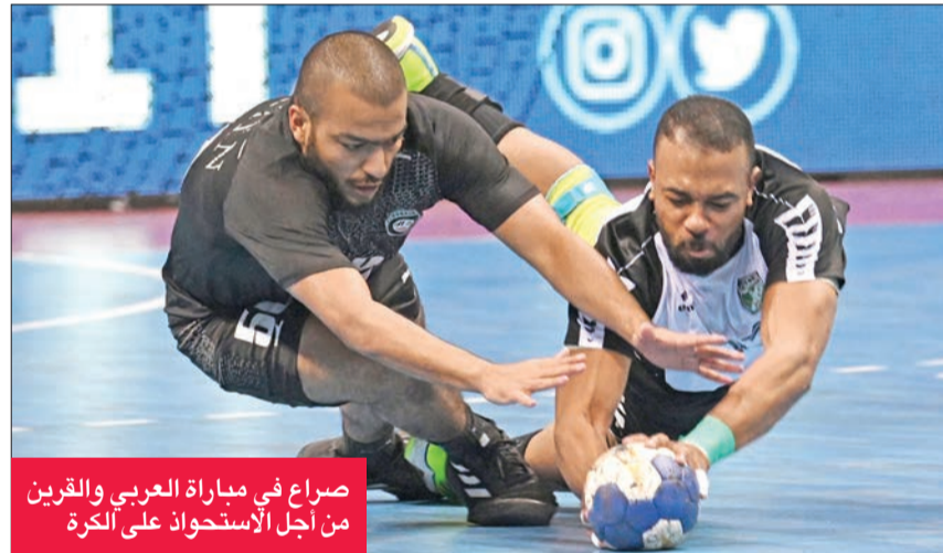
صراع في مباراة العربي والقرين من أجل الاستحواذ على الكرة

جاءت بداية مباراة العربي والقرين سريعة، وقدم الفريقان مستوى جيداً باداء متوازن.