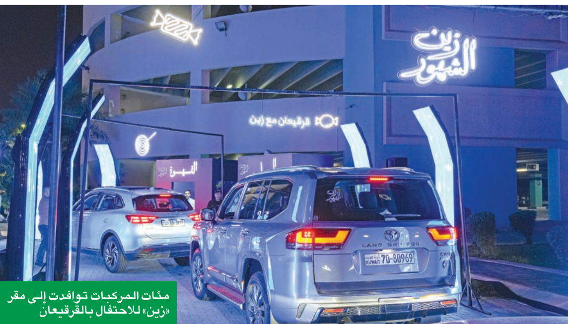
مئات المركبات توافدت إلى مقر «زين» للاحتفال بالقرقيعان

مشاركة أكثر من 800 متسابق في «تحدي زين» الرمضاني بحديقة الشهيد