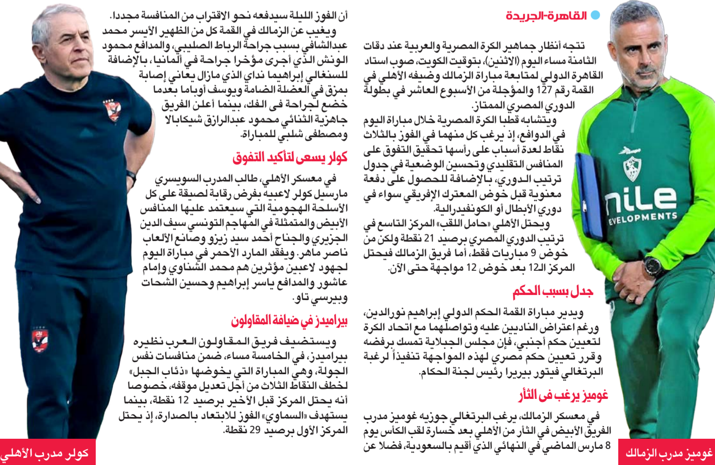
كولر مدرب الأهلي