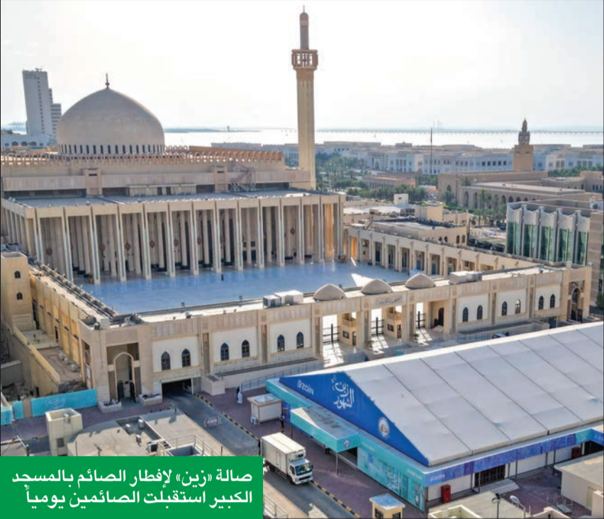
صالة «زين» لإفطار الصائم بالمسجد الكبير استقبلت الصائمين يومياً

الحملة الأكبر والأشمل شاركت بركة الشهر الفضيل مع جميع أطراف المجتمع