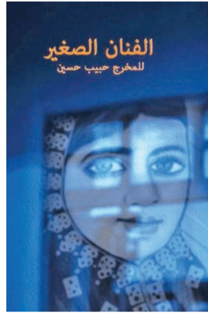
ملصق فيلم «الفنان الصغير»

أحدث معدات التصوير، والصوت، والمؤثرات السمعية والبصرية، لإنتاج أفلام جذابة فنياً ومفيدة فكرياً أو ذهنياً، مثلاً أنتج مسلسل وثائقي عن عالم الديناصورات، حيث استُخدمت لإنتاجه أحدث أساليب الإنتاج، وبلغت تكلفة إنتاج الحلقة الواحدة مليون دولار، عكس ما هو حاصل في الوطن العربي، فالأفلام والبرامج الوثائقية، كما ذكرت، لا تحظى باهتمام المحطات الفضائية، ولا يهتم المشاهد بمتابعة ما ينتج منها، لضعفها إنتاجياً، فمعظم ما ينتج عبارة عن لقاءات مطولة مملة، ولقطات أرشيفية مستهلكة، وتعرض في أوقات ميتة لا تحظى بالمشاهدة، وتستخدمها بعض المحطات لملء فراغات خارتها البرمجية».