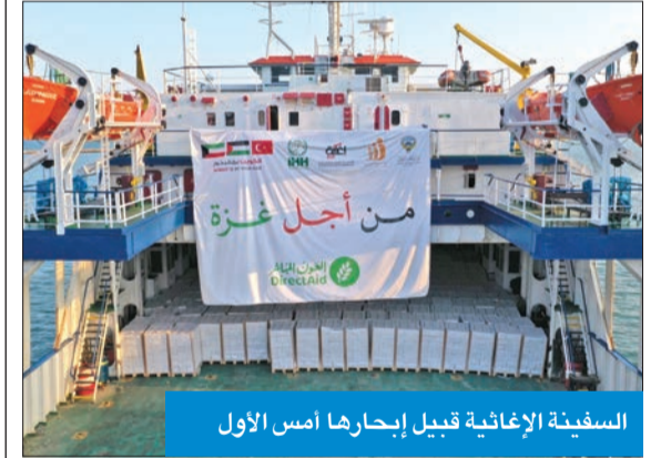
السفينة الإغاثية قبيل إبحارها أمس الأول

تحمل ألف طن من المواد الإغاثية لإدخالها إلى القطاع