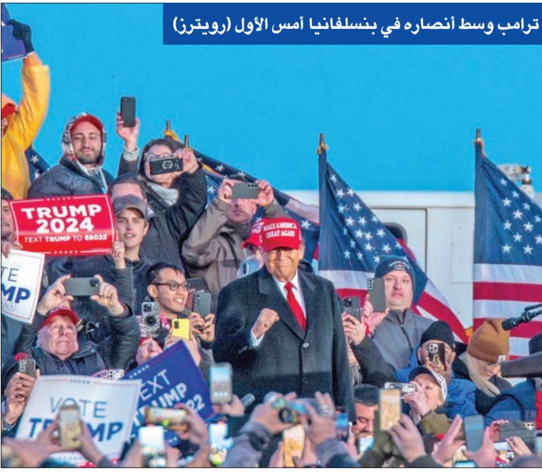
ترامب وسط أنصاره في بنسلفانيا أمس الأول

وفيما يكافح الاقتصاد الأوروبي للتعافي من جائحة كورونا والغزو الروسي لأوكرانيا، فإن المزاج يتغير في بعض الدول، خصوصاً مع تقدم ترامب الثابت في الاستطلاعات على بايدن، ما يقفز المخاوف بشأن التورات عبر الأطلسي والحرب التجارية العالمية الجديدة. في هذا الصدد، قال محلل شؤون أوروبا والصين في