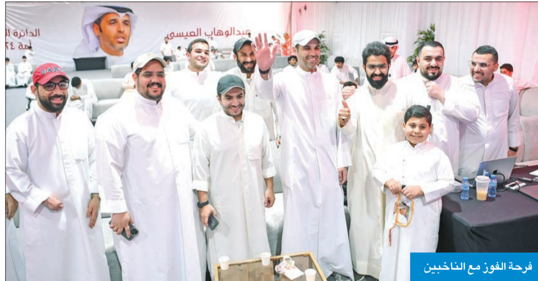
فرحة الفوز مع الناخبين

شكر النائب عبدالوهاب العيسى الشعب الكويتي بشكل عام وناخبي الدائرة الثانية خصوصا على تجديدهم الثقة به وإيصاله مجدداً إلى مجلس الأمة. وقال العيسى، في تصريح عقب فوزه في انتخابات «مجلس 2024»، إن «الحافز لنا في الاستمرار على نفس النهج والعمل الذي بدأناه سابقاً هو تجديد الثقة من قبل الشعب الكويتي والملفات المهمة التي نعملها في المجلس الجديد، وأهمها ملفات الشباب الكويتي ومستقبل الكويت وتحدياتها التنموية». وأعرب العيسى عن تطلعه إلى التعاون مع هذه الحكومة النيابية الرائعة في مجلس 2024، «ونتطلع إلى التعاون والانسجام مع الحكومة الجديدة لترجم الانجازات من جديد كما تحققت في مجلس 2023».