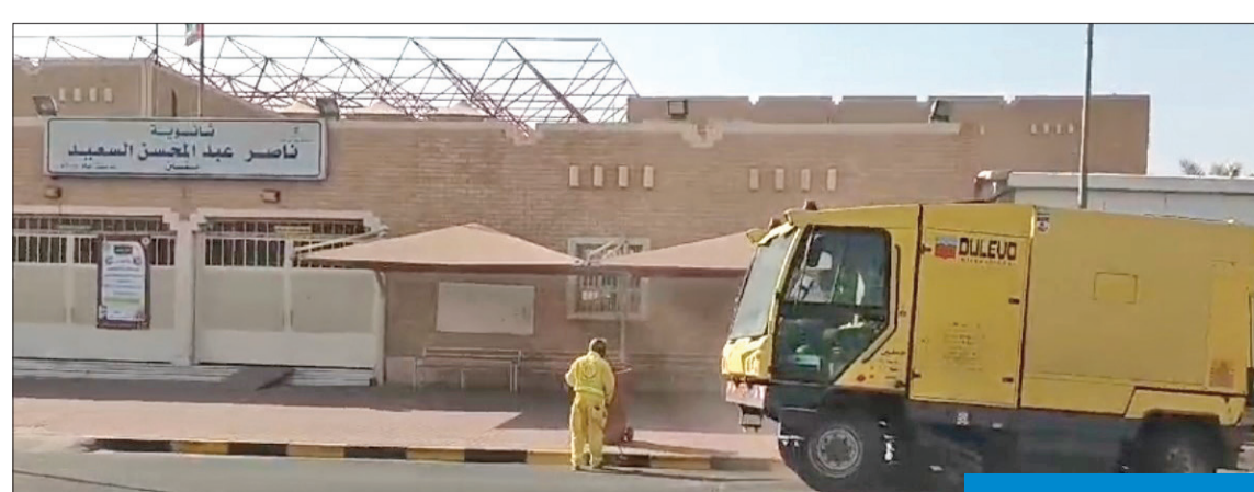
جانب من جهود التنظيف