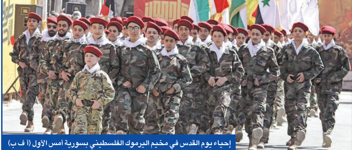
إحياء يوم القدس في مخيم اليرموك الفلسطيني بسورية أمس الأول

على وقع التهديدات الإيرانية بالرد على استهداف القنصلية في دمشق، يتواصل تناقل الرسائل الأميركية - الإيرانية حول ترتيبات هذا الرد، وكيف يكون في إطار منضبط لا يؤدي إلى حرب إقليمية شاملة. ورغم التهديدات العالية السقف، لا يزال الإيرانيون يسوقون لنظرية عدم الوقوع في الفخ الإسرائيلي، أي عدم الانجرار إلى حرب توقيت إسرائيل، ولذلك تحرص طهران على ألا يؤدي ردها إلى حرب واسعة، ووفق المعلومات، أوصل الأميركيون رسائل إلى الإيرانيين الذين ردوا بورهم رسائل مماثلة فحواها أن تضغط واشنطن على إسرائيل لوقف عملياتها ضد الإيرانيين في سورية ووقف عمليات الغارة، وفي حال حصلت طهران على هذا التعهد فيمكن لردّها أن يكون مضبوطاً وليس خارجاً عن السياق.