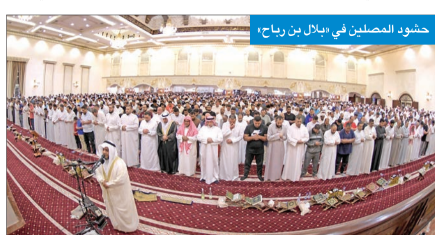
حشود المصلين في «بلال بن رباح»

فكما شهدت مختلف مساجد البلاد في جميع المناطق إقبالا كبيرا وسط أجواء إيمانية وأصوات عذبة تلت ما تيسر لها من كتاب الله، وسط خشوع وبقاء المصلين، راجين من الله أن يتقبل منهم ويغفر لهم.