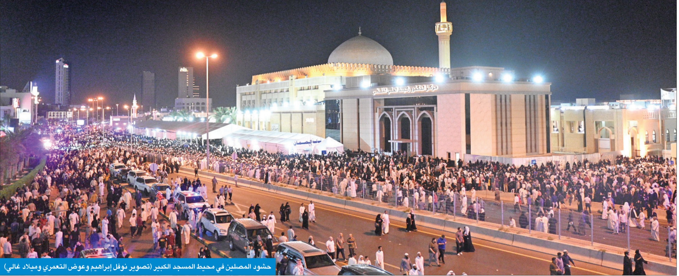
حشود المصلين في محيط المسجد الكبير

100 ألف أحيوا ليلة 27 رمضان بالمسجد الكبير وسط حضور أممي كثيف ● أحمد الثواف تهنئ «بلال بن رباح» وأشاد بالجهود التي أضحت على المسجد أجواء روحانية