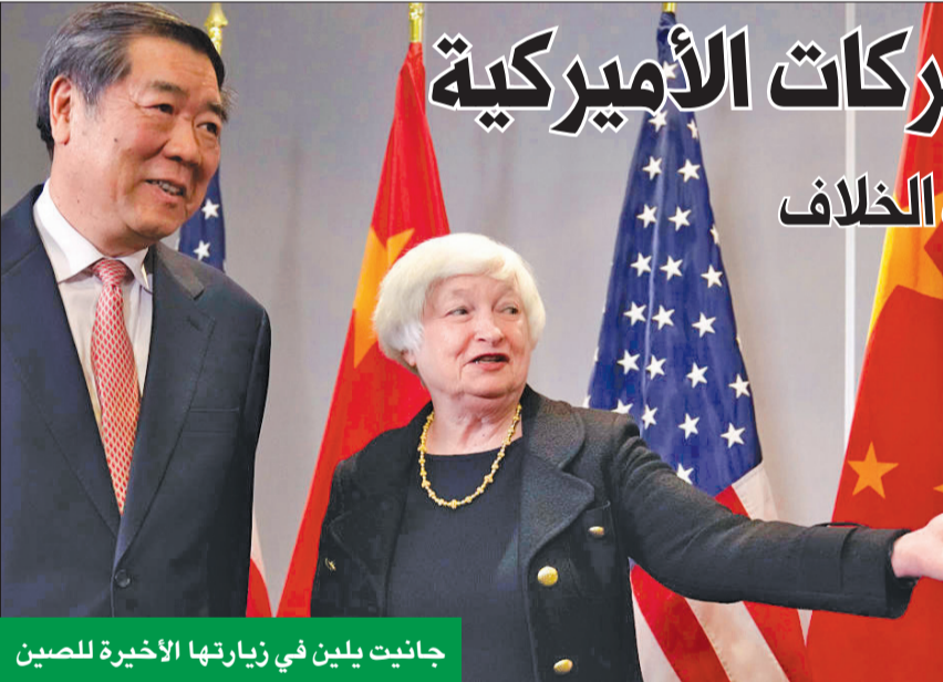
جانيت بلين في زيارتها الأخيرة للصين

أكدت خلال زيارتها للصين ضرورة إجراء اتصالات مفتوحة ومباشرة بشأن مجالات الخلاف