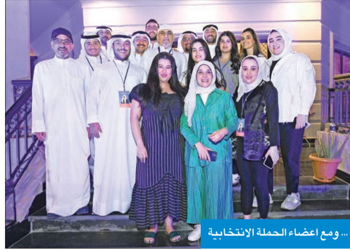
... ومع أعضاء الحملة الانتخابية

لي من كل أطراف المجتمع الكويتي، فهذا الأمر بالنسبة لي هو الفوز الحقيقي»، وتابعت «اشكر أعضاء حملتي الانتخابية الأعزاء لجهودهم رغم كل التحديات، فلا يمكن نسيانها فكلما شكرا لا تفككم حثكم». وأكدت أن «فوزي يتمثل في أن المصوتين