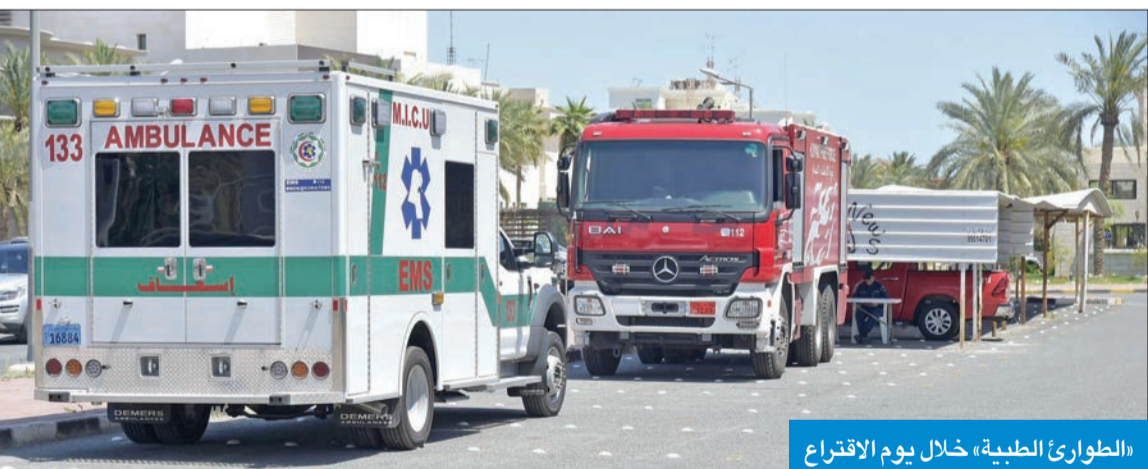
«الطوارئ الطبية» خلال يوم الاقتراع

أكدت وزارة الصحة أن مجموع من تم علاجهم يوم الاقتراع خلال انتخابات مجلس الأمة بلغ 216 حالة ما بين ذكور وإناث. وقالت إدارة الطوارئ الطبية، في بيان، إن عدد الذكور الذين تم علاجهم بلغ 139 حالة، في حين بلغ عدد النساء 77 حالة، لافتة إلى أن مجموع من تم علاجهم في العيادة بلغ 210 حالات، بينما تم نقل 6 حالات لعلاجهم في المستشفيات. وأشارت الإدارة إلى أن من تم علاجهم في الدائرة الأولى بلغ 13 حالة، و33 في الدائرة الثانية، و17 في «الثالثة» و71 «الرابعة»، و82 «الخامسة». وذكرت أن من تم علاجهم في العيادات تراوح ما بين هبوط سكري وصداع وارتفاع في ضغط الدم، أما من تم نقلهم إلى المستشفى فقد تراوحت حالاتهم بين هبوط عام وضيق في التنفس وارتفاع الضغط والدوخة.