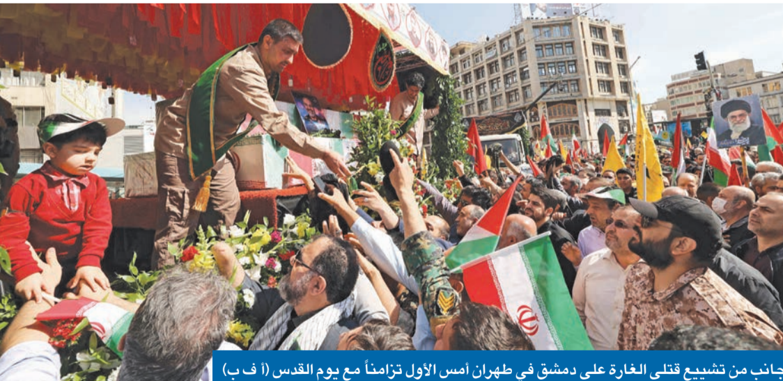
جانب من تشييع قتلى الغارة على دمشق في طهران أمس الأول تزامناً مع يوم القدس

جيوش المنطقة تتأهب وتنتياهو رفض اقتراحاً بالتعهد بوقف استهداف إيران في سورية