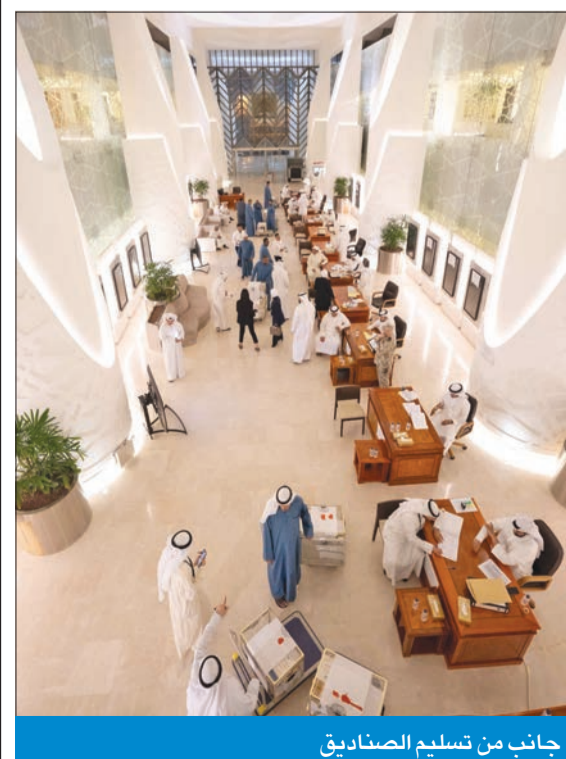
جانب من تسليم الصناديق