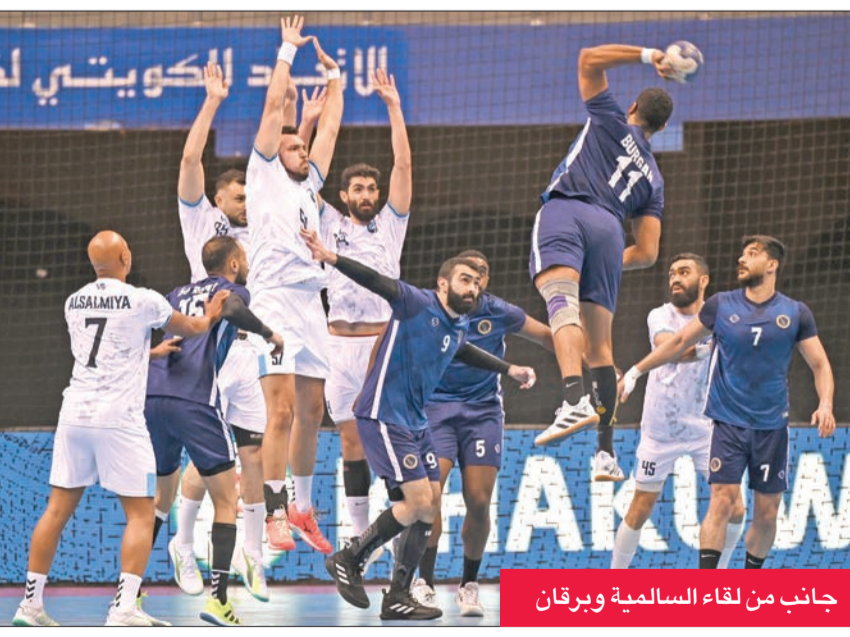
جانب من لقاء السالمية وبرقان

صالة مجمع الشيخ سعد عبدالله، ضمن الجولة التاسعة من البطولة، حيث يلتقي في الثامنة والنصف مساءً خيطان الثاني عشر بنقطتين مع التضامن الأخير بدون رصيد، وفي العاشرة مساءً يلعب الصليبيخات السابع بـ 7 نقاط مع الساحل الثالث عشر قبل الأخير بدون رصيد.