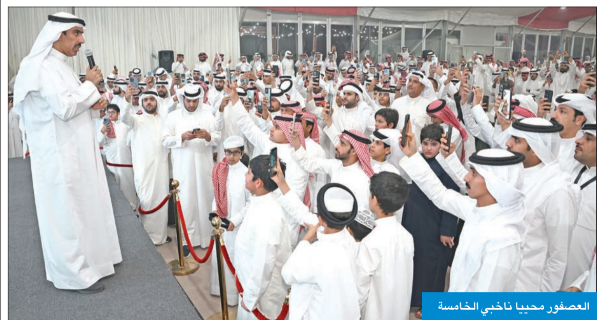
العصفور محيياً ناخبي الخامسة

شكر النائب سعود العصفور أهالي الدائرة الخامسة على هذه الثقة المتجددة وفوزه بعضوية مجلس الأمة. وقال العصفور، في تصريح عقب فوزه: «أعدكم مرة أخرى بالعمل من أجل هذا الوطن وشعبه،