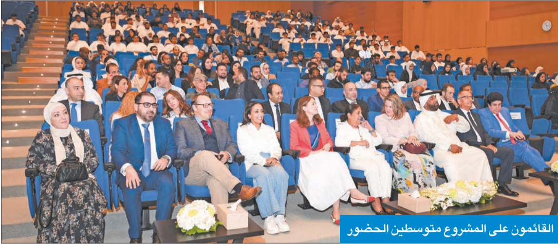
القائمون على المشروع متوسطين الحضور

● البقاعين: ندخل حقبة جديدة في الابتكار تدعم مسيرة البحث العلمي والمشاريع الطلابية ● بليندا لويس: فخورون بالمساهمة في التمويل الأولي لإطلاق المشروع الجديد