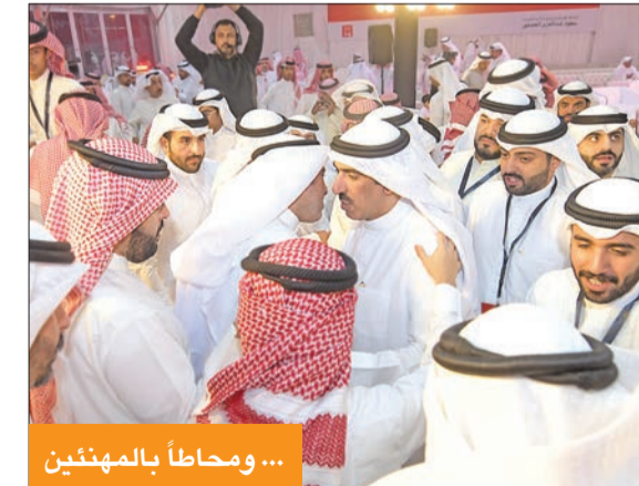
... ومحاظاً بالمهنيين