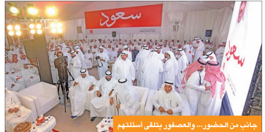
جانب من الحضور... والعصفور يتلقى أسئلتهم

إن زانت الكويت زانت للجميع وإن ساءت فستطول الجميع