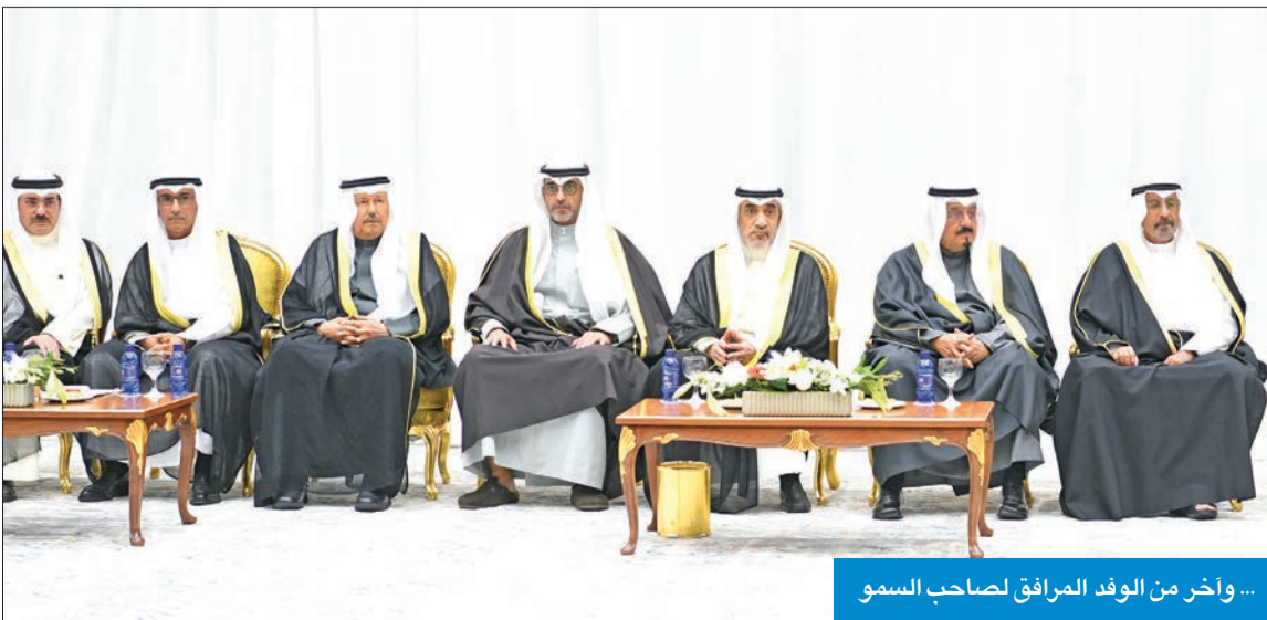
... وآخر من الوفد المرافق لصاحب السمو