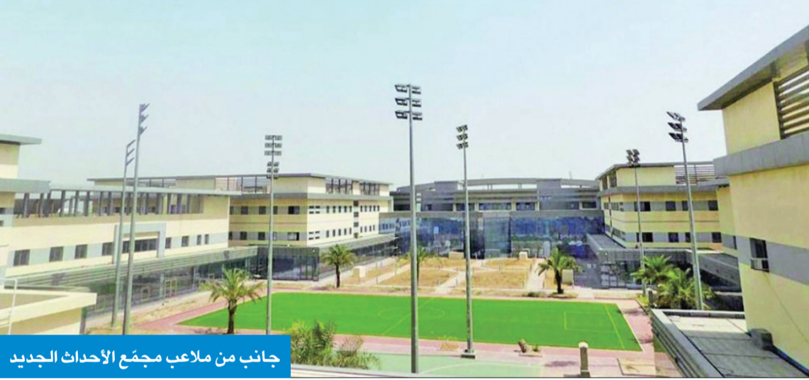
جانب من ملاعب مجمع الأحداث الجديد

● الكندري - الجريدة: تضمنان 14 حدثاً ليرتفع إجمالي النزلاء بالمجمع إلى 33 ● استكمال تجهيز الورش الحرفية والانتهاء من برنامج تعديل السلوك