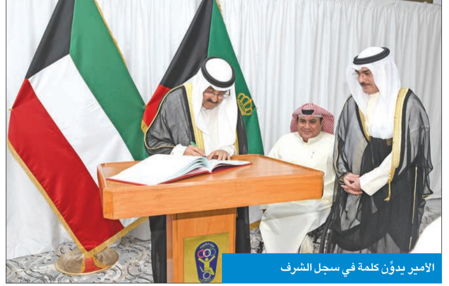
الأمير يدون كلمة في سجل الشرف

نوجه المعنيين نحو تبني سياسات شاملة لدعم هذه الفئة وتمكينها ودمجها في المجتمع