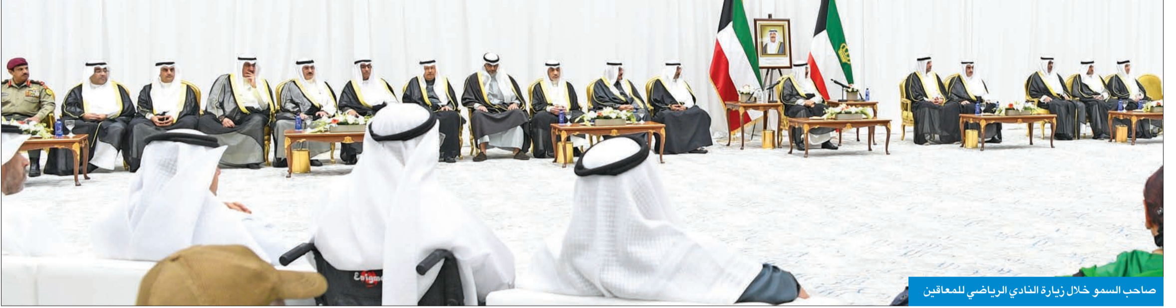
صاحب السمو خلال زيارة النادي الرياضي للمعاقين