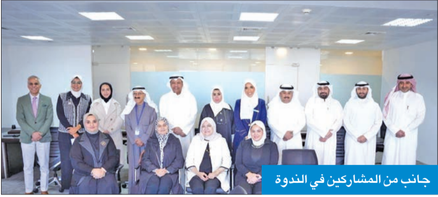
جانب من المشاركين في الندوة

في مجال الشكاوى والتظلمات. وشارك في الندوة عدد من مسؤولي تلقي الشكاوى والتعامل مع الجمهور في مؤسسات الدولة والهيئات الأهلية.