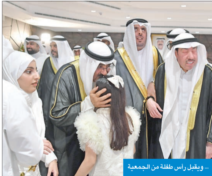
... ويقبل رأس طفلة من الجمعية

لقطات ● فضل سموه بالتوقيع على سجل الشرف. ● تم خلال الزيارة إهداء سموه هدية تذكارية بهذه المناسبة. ● رافق سموه في هذه الزيارة كبار المسؤولين بالدولة. ● تم عرض فيلم وثائقي بعنوان «عهد يتجدد». ● ألقى الشاعر سيف لافي الخليفان قصيدة شعرية لاقت استحسان الحضور.