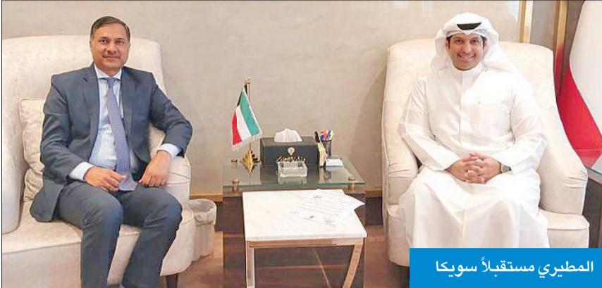
المطيري مستقبلاً سويكا

استقبل وزير الإعلام والثقافة عبدالرحمن المطيري في مكتبه أمس، السفير الهندي لدى البلاد أدرش سويكا، وبحسب سبل تعزيز التعاون بين الهند والكويت في مجال المعلومات والإعلام والثقافة.