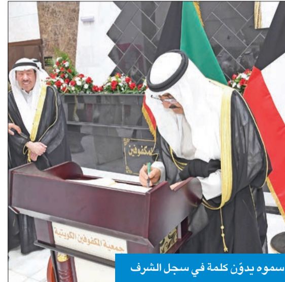
سموه يدون كلمة في سجل الشرف

وأكد العمل على ترجمة التوجيهات السامية ومواصلة تقديم الدعم وكل أوجه الرعاية لهذه الفئة المهمة والعمل على حل مشاكلهم وتطوير منظومة الهيئة العامة لشؤون ذوي الإعاقة.