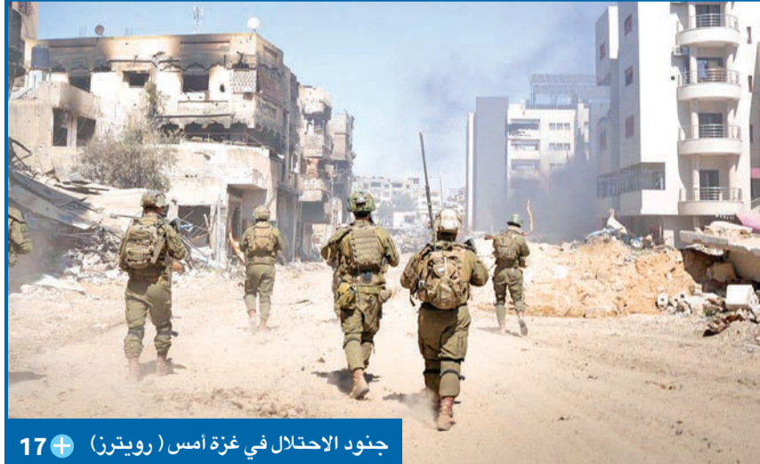
جنود الاحتلال في غزة أمس 17