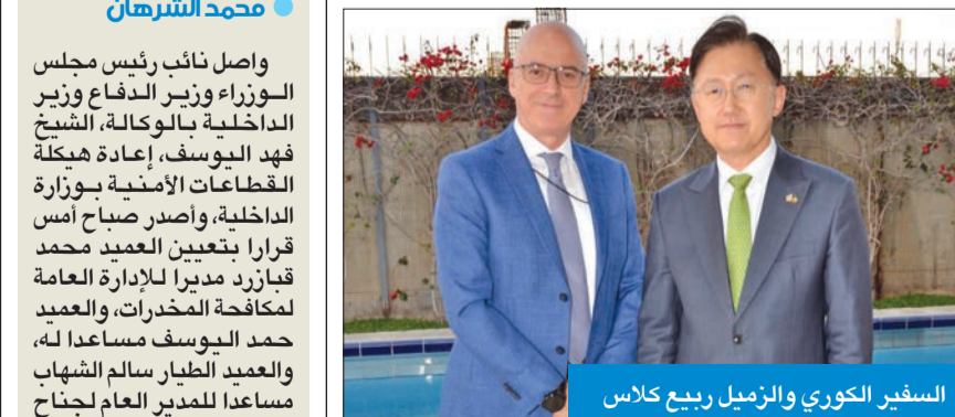
السفير الكوري والزميل ربيع كلاس

وأكد السفير الكوري لدى البلاد، تشونغ يونغ هان، أن حجم التبادل التجاري بين بلاده والكويت بلغ العام الماضي أكثر من 13 مليار دولار، مشيراً إلى «سعي السفارة لرفع معدلها». وفي تصريحات على هامش مائدة إفطار أقامها في منزله على شرف عدد من ممثلي وسائل الإعلام المحلية، تحدث السفير الكوري عن عمق وقوة ومتانة العلاقات الكورية - الكويتية، التي وصفها بأنها «تاريخية ومتطورة على الصعيد كافة وفي مختلف مجالات التعاون»، مشيراً إلى «تنوع مجالات التعاون الثنائي بين البلدين الصديقين لتشمل قطاعات جديدة، مثل إدارة المطارات والمزارع الذكية