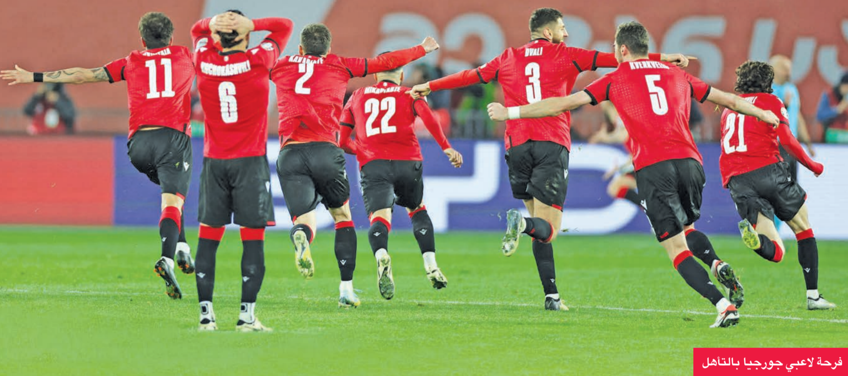
فرحة لاعبي جورجيا بالتأهل