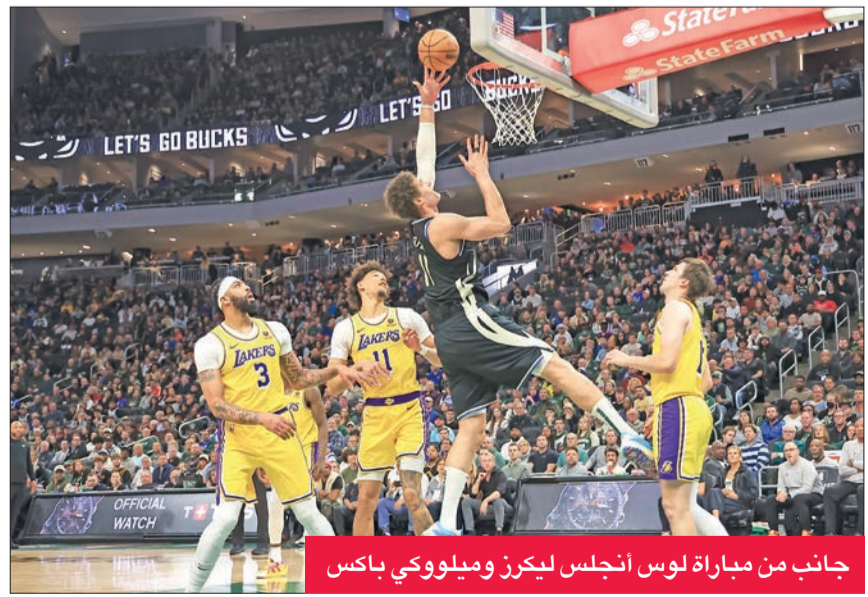
جانب من مباراة لوس أنجلس ليكرز وميلووكي باكس