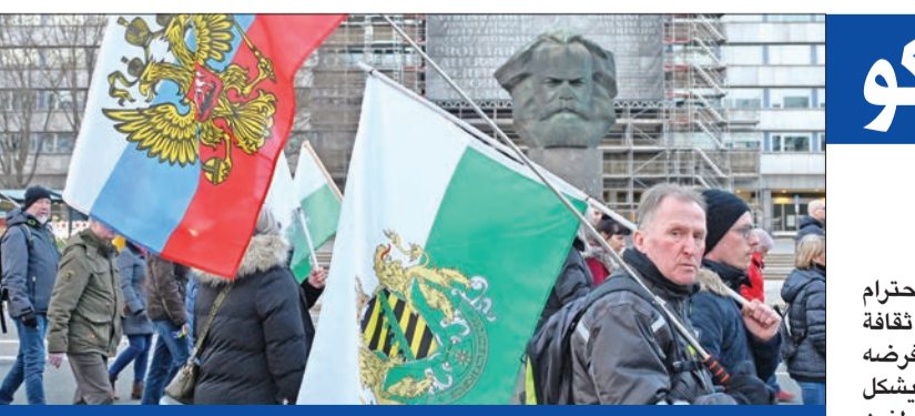
مناصرو حزب الماني يميني متطرف يتظاهرون دعماً لموسكو

لم يعد لهيب المواجهات المستمرة بين حزب الله وإسرائيل وحده الذي يلغ لبنان، فقد أصبح واضحاً أنه كلما طال أمد الحرب، اتسع الشرخ السياسي اللبناني وتعمق باتجاهات عدة، بعضها يتصل بقرار حزب الله الانخراط العسكري في مساندة غزة في ظل معارضة جزء كبير من اللبنانيين، وبعضها الآخر بسبب التوتر المتصاعد بين الفئتين الشيعي والقوي المسيحية بسبب ملف انتخاب رئيس جديد للجمهورية، فيما تطوف على ضفاف حزب الاستنزاف في الجنوب التي يبدو أنها ستستمر فترة غير قصيرة مشاكل أخرى اجتماعية واقتصادية. ولا يزال حزب الله يصبر على التزامه بقراره إبقاء جبهة الجنوب مفتوحة تحت شعار إسناد غزة، وهو موقف يعترض عليه معظم اللبنانيين الذين يتحسسون المخاطر، لا سيما مع إصرار رئيس الوزراء الإسرائيلي بنيامين نتانياهو على اجتياح رفح وربما بعدها نقل المعركة إلى الضفة الغربية أو لبنان، دون استبعاد أن يخوض حرباً في هاتين الساحتين في الوقت نفسه أو بالتدريج حسب الأولويات الإسرائيلية التي لا تبدو واضحة حتى الآن. وتصل رسائل دولية واضحة إلى بيروت،