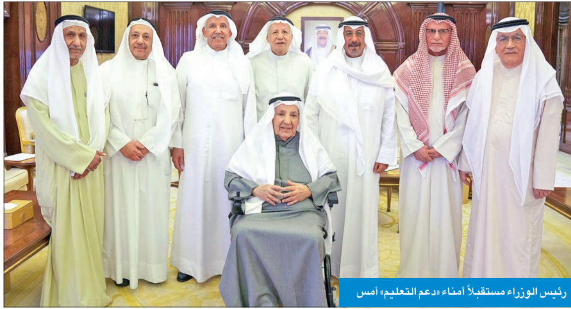
رئيس الوزراء مستقبلاً أمناء «دعم التعليم» أمس

استقبل سمو الشيخ الدكتور محمد الصباح رئيس مجلس الوزراء في قصر بيان أمس، رئيس وأعضاء مجلس أمناء اللجنة الوطنية لدعم التعليم ووقفية دعم التعليم.