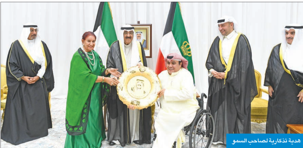
هدية تذكارية لصاحب السمو