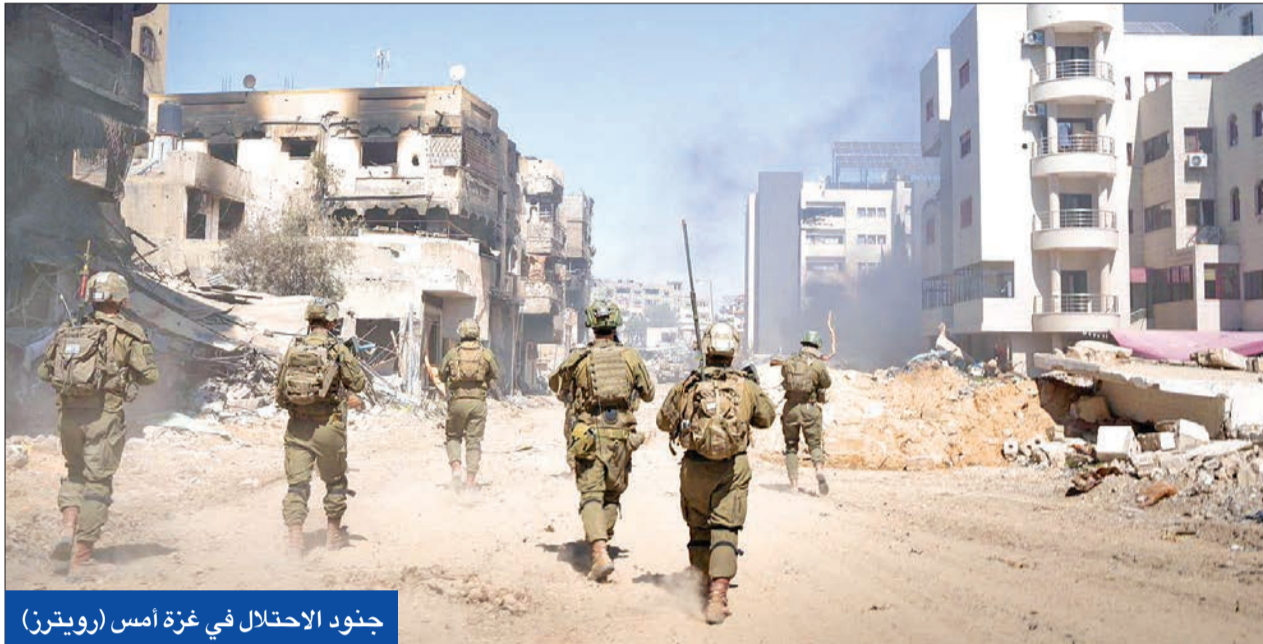
جنود الاحتلال في غزة أمس

● الجيش الإسرائيلي سيحمي الميناء الأميركي في القطاع ● بن غفير: بايدن فضل السنوار على نتنياهو