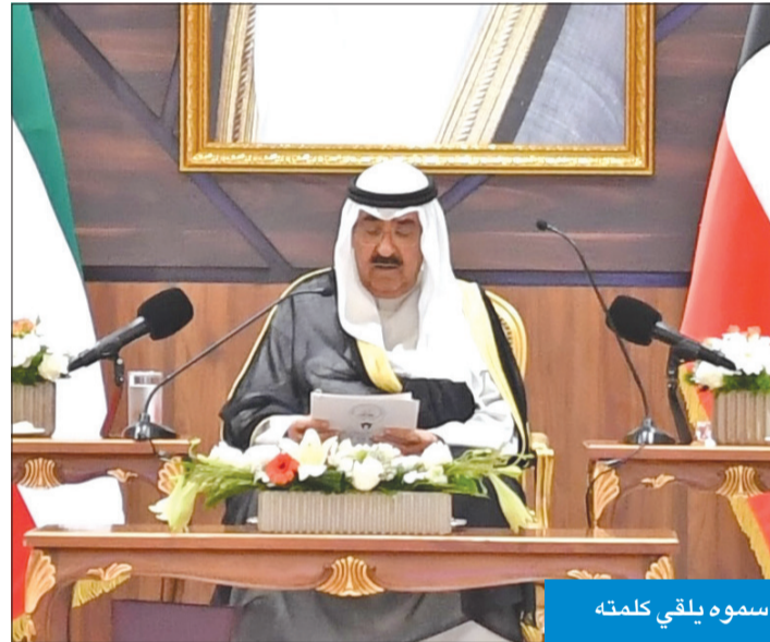
سموه يلقي كلمته

على إعادة نادي البصيرة الرياضي للمكفوفين.