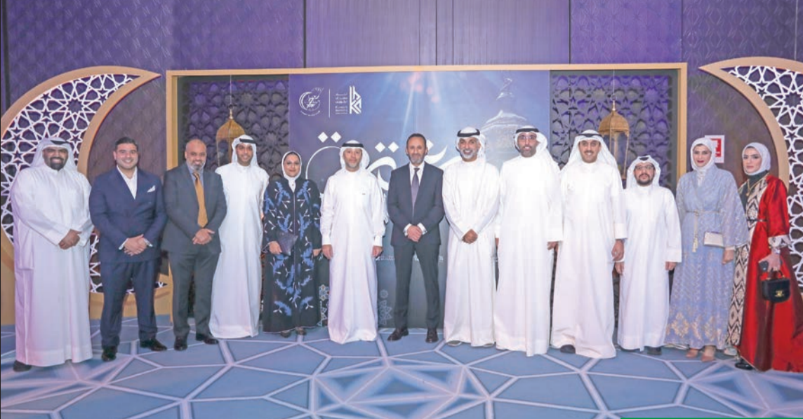
لقطات من غبقة اتحاد المصارف