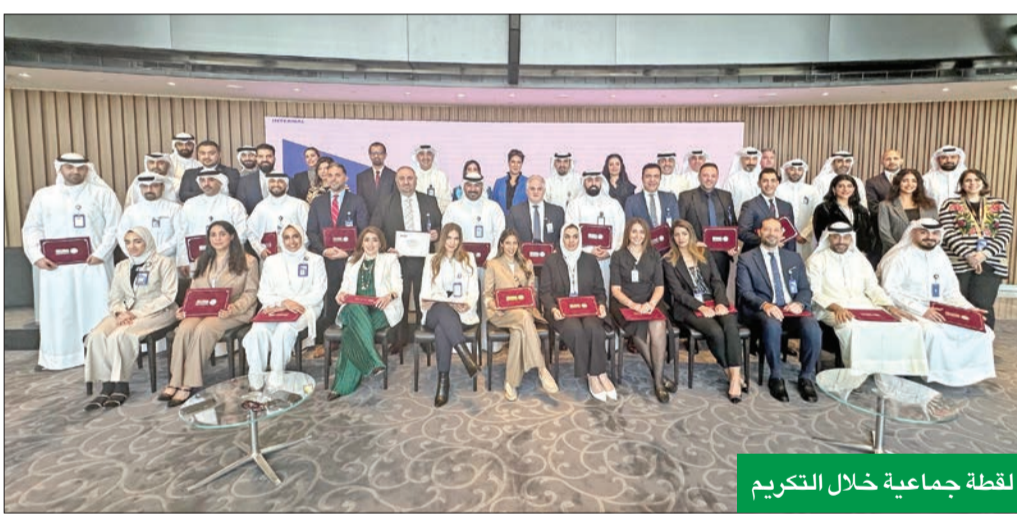
لقطة جماعية خلال التكريم

في عملية التنمية الاقتصادية للكويت. وتتلقي المبادرات التي يقدمها المعهد مع استراتيجية «الوطني»، الهادفة إلى الاستثمار في الموارد البشرية، وسعي البنك الدائم لدعم الكوادر الوطنية، وتمكينها وتأهيلها، وتوفير الفرص الوظيفية الملائمة لها، التزاماً بدوره كأحد أكبر مؤسسات القطاع الخاص توظيفاً للعمالة الوطنية، إلى جانب حرص البنك على توفير البرامج التدريبية التي تساعد في تطوير أداء موظفيه، والتي يتم إعدادها وفقاً لمعايير منهجية وعلمية حديثة.