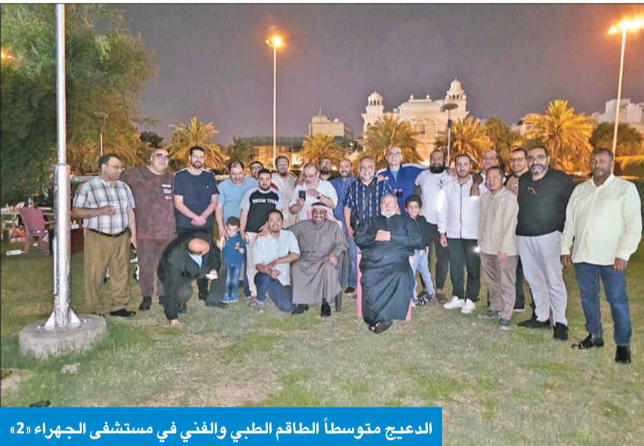
الدعيج متوسط الطاقم الطبي والفني في مستشفى الجهراء «2»

أكدت محاسبة كل من ثبتت إهماله أو تقصيره في أداء واجباته الوظيفية