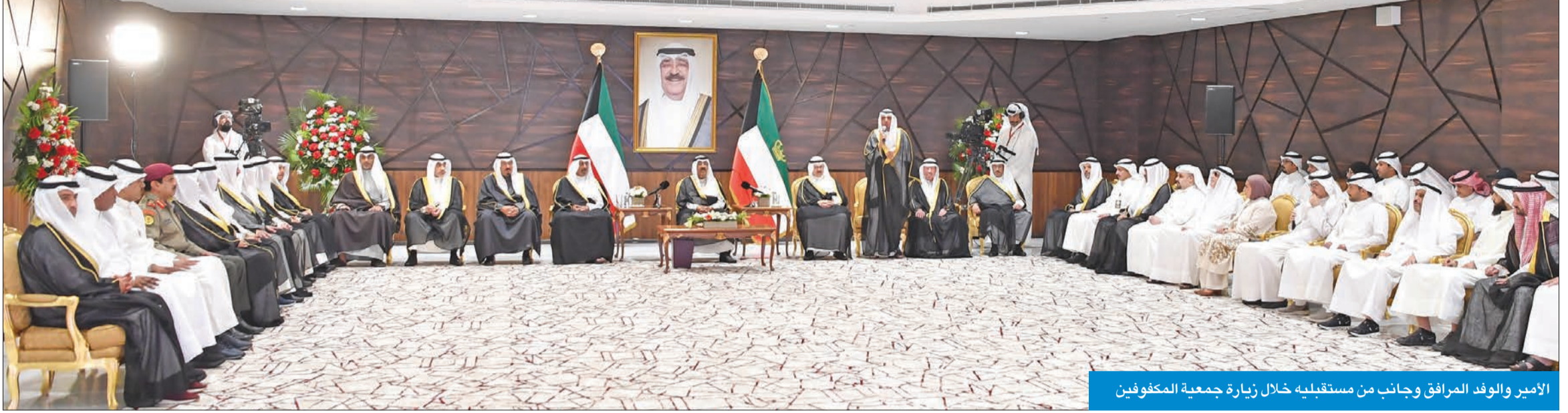
الأمير والوفد المرافق وجانب من مستقبليه خلال زيارة جمعية المكفوفين