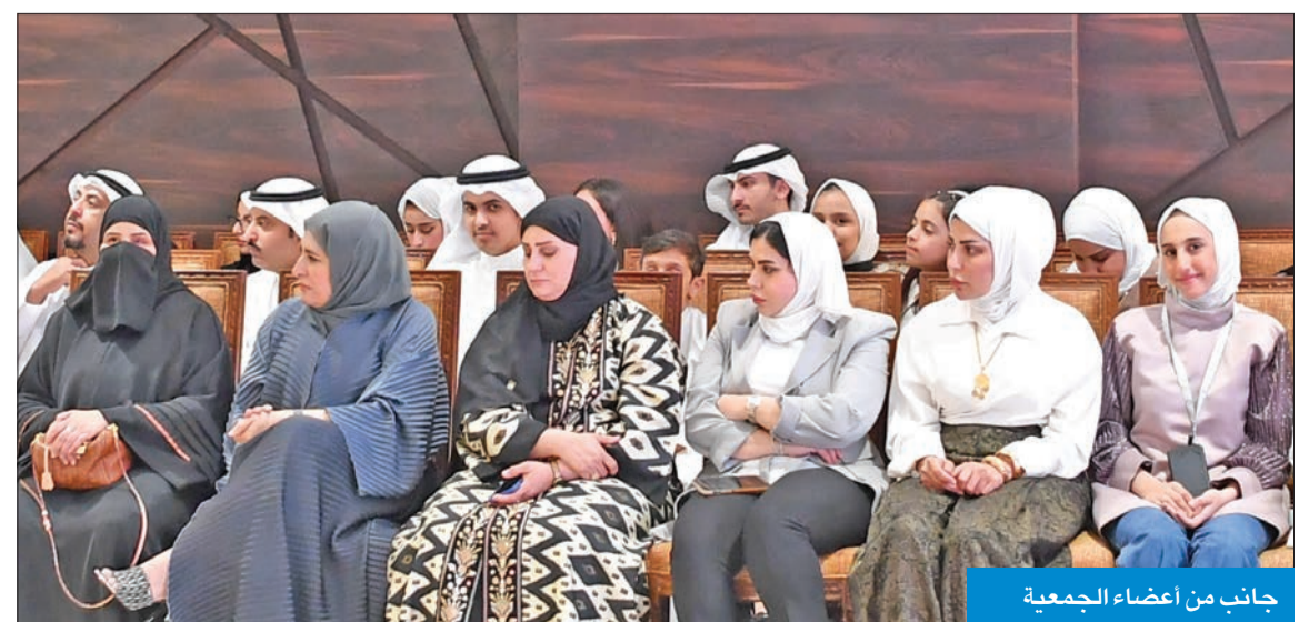
جانب من أعضاء الجمعية