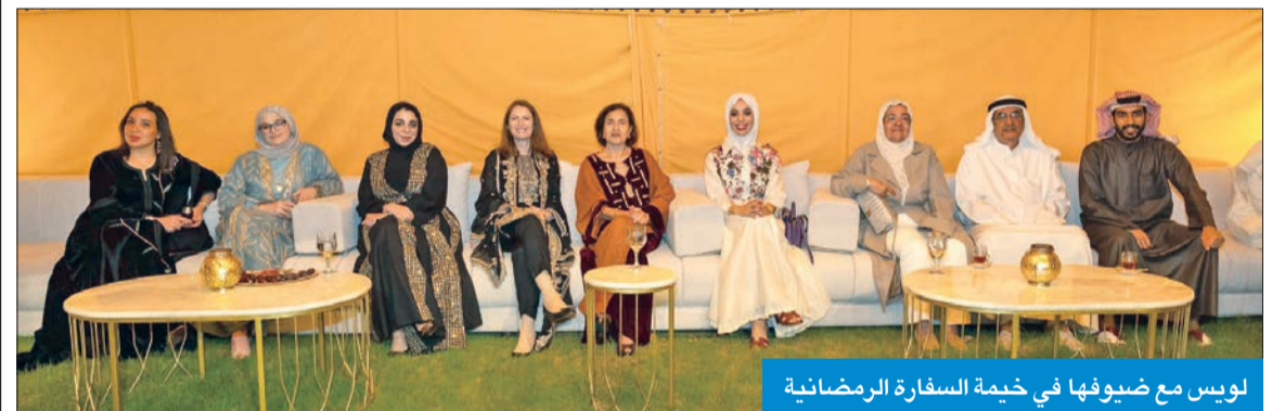
لويس مع ضيوفها في خيمة السفارة البريطانية

ويساعدون الناس على بناء قوتهم من خلال الفنون، والمتطوعون من منظمات المجتمع المدني التي تدعم إدماج الأشخاص ذوي الإعاقة، وتدعو إلى تحقيق قدر أكبر من المساواة بين الجنسين، وتدعم عدداً من القضايا الأخرى الجديرة بالاهتمام. وفي هذه المناسبة، قالت السفيرة البريطانية لدى البلاد، بليندا لويس: «لقد كانت غبقة السفارة البريطانية وسيلة رائعة لاحتضان الثقافة الكويتية والاعتراف بأولئك الذين يكسبون وقتهم وطاقاتهم وخبراتهم بإيثار لإفادة مجتمعاتهم المحلية والوطنية، وحتى الدولية».