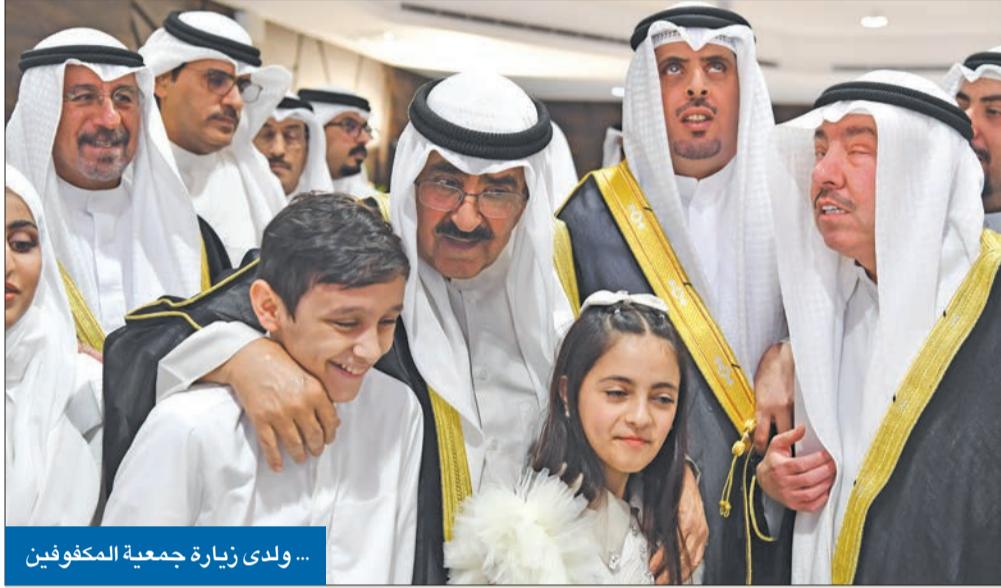
...ولدى زيارة جمعية المكفوفين

سموه أعرب لدى زيارته نادي المعاقين وجمعية المكفوفين عن فخره بهم وبتحديهم للإعاقة