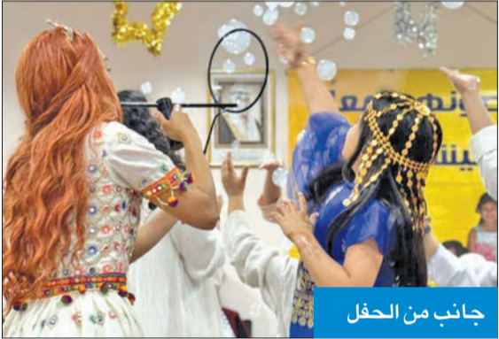
جانب من الحفل

جرباً على عاداتها؛ أقامت الجمعية الوطنية لحماية الطفل حفل القرقيعان لأعضائها وأصدقائها أمس الأول بمقرها الكائن بصاحبة عبدالله السالم. وتخلل الحفل تقديم وصلات من أغاني القرقيعان والألعاب والمسابقات التي شارك فيها الأطفال، وبعدها وزعت الهدايا الرمضانية، وكانت ليلة مبهجة لكل من حضر صغارا وكبارا.