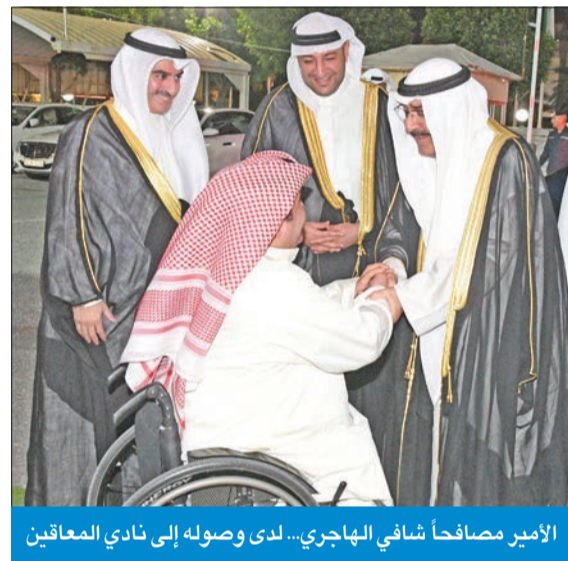
الأمير مصافحاً شافي الهاجري... لدى وصوله إلى نادي المعاقين

أكد صاحب السمو أمير البلاد الشيخ مشعل الأحمد أن ذوي الهمم برهنوا بعزيمتهم وإرادتهم على قدرتهم على مواجهة التحديات، وجعلوا شعارهم «المستحيل ليس صعباً... والإرادة لها أبطال»، فحققوا أهدافهم، وبلغوا المنال، مشيراً سموه إلى أن الكويت حريصة على توفير الرعاية الكاملة لهم، ودعمهم ورعايتهم، وهذا واجبتنا نحوهم، وحقهم علينا.