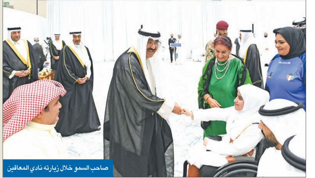
صاحب السمو خلال زيارته نادي المعاقين