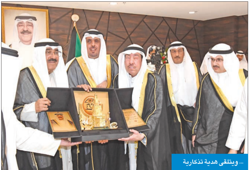
... ويتلقى هدية تذكارية