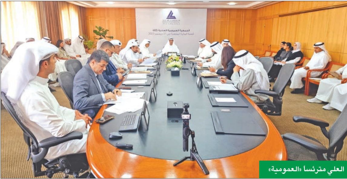
العلي مترئساً «العمومية»

الأحمد: أداء الشركة الإيجابي مالياً واستثمارياً خلال 2023 وفرّ محركاً لأداء أقوى في 2024