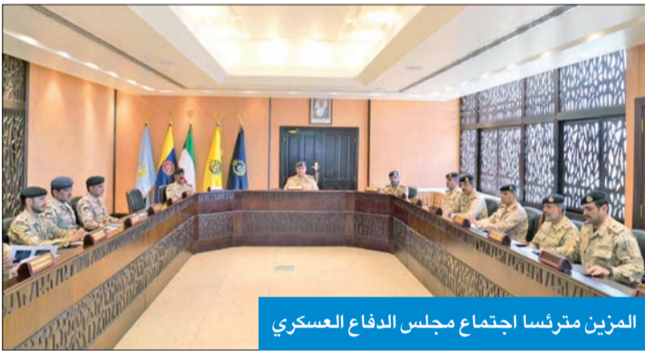
الوزير مترئسا اجتماع مجلس الدفاع العسكري

دعا رئيس الأركان العامة الفريق الركن طيار بندر المزين قيادات الجيش إلى العمل وفق التوجيهات السامية لسمو أمير البلاد القائد الأعلى للقوات المسلحة الشيخ مشعل الأحمد التي تفضل سموه بها خلال زيارته الكريمة واليمومة لوزارة الدفاع بمناسبة شهر رمضان المبارك والتي تعتبر خريطة طريق ومنهاج عمل. وأكد رئيس الأركان في كلمة خلال ترؤسه اجتماعاً لمجلس الدفاع العسكري، أمس الأول، حرص وإهتمام نائب رئيس مجلس الوزراء وزير الدفاع وزير الداخلية بالوكالة الشيخ فهد اليوسف بعمل جميع القيادات وفق التوجيهات السامية للقيادة السياسية. وأشار الفريق المزين إلى أن تلك التوجيهات تمثل خريطة طريق ومنهاج عمل يهدف إلى دعم وتشجيع منتسبي