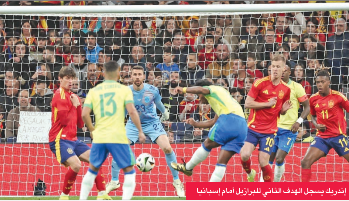
إندريك يسجل الهدف الثاني للبرازيل أمام إسبانيا

عاد المنتخب البرازيلي من بعيد وقلب تأخره بهدفين أمام إسبانيا إلى تعادل قاتل 3-3 في مباراة دولية ودية في كرة القدم على ملعب سانتياغو برنابيو في العاصمة الإسبانية مدريد، بعد ثلاثة أيام من فوزه على إنكلترا بهدف في ملعب ويمبلي الشهير. وأقيمت المباراة بين المنتخبين للمساعدة في مكافحة العنصرية بعد الإساءات المتكررة التي استهدفت جناح ريال مدريد الدولي البرازيلي فينيسيوس جونيور في الملاعب الإسبانية.