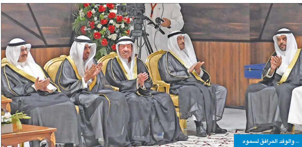
... والوفد المرافق لسموه

قضايا أصحاب البصيرة واحتياجاتهم، ودعم أنشطتهم، وتوفير الأجهزة والآلات والأدوات التي تساعدهم في حياتهم، وتوفير فرص عمل تتناسب مع ظروفهم، وتشجيع المتميزين من ذوي الهمم لاسيما أصحاب البصيرة من خلال تناول قصص نجاحهم في مختلف المجالات ومواجهتهم للتحديات. وفي ختام كلمته، دعا الله تعالى في هذا الشهر الكريم، أن يديم الرفعة والعزة على وطننا الغالي وأبنائه، وأن يوفق الجميع إلى ما فيه خيره ورخاؤه.