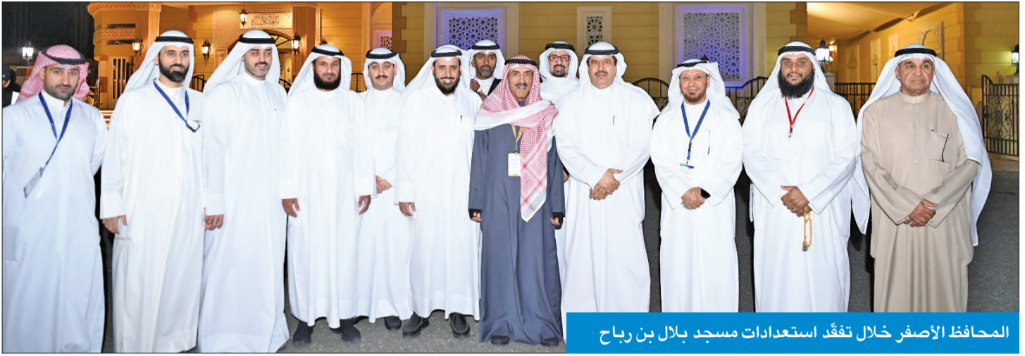
المحافظ الأصفر خلال تفقّد استعدادات مسجد بلال بن رباح

أكد محافظ حولي، محافظ العاصمة بالوكالة، علي الأصفر، مواصلة الجهود لتحويل محافظة حولي إلى مدينة صحية