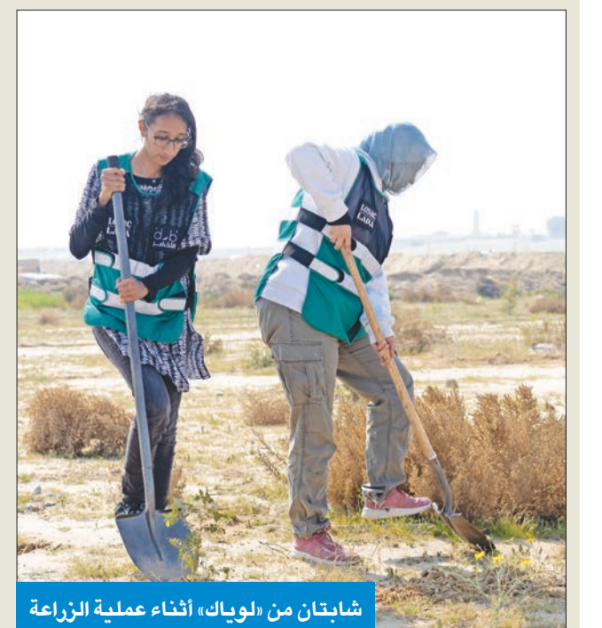
شابتان من «لويك» أثناء عملية الزراعة