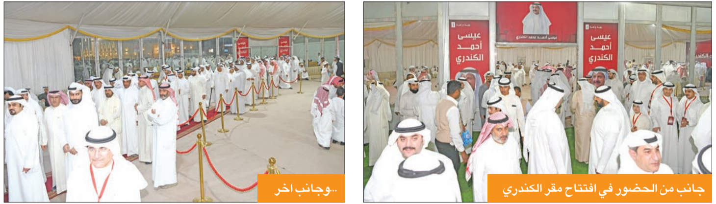
عيسى الكندري في افتتاح مقره الانتخابي

شدّد مرشح الدائرة الأولى عيسى الكندري على ضرورة أن يكون تحسين معيشة المواطنين أولى الأولويات خلال مجلس الأمة المقبل، مؤكداً أهمية تعاون السلطين مجلساً وحكومة من أجل إنجاز هذه الأولوية في هذا الجانب. وقال الكندري، خلال افتتاح مقره الانتخابي في الدائرة الأولى وإطلاق حملته الانتخابية تحت شعار «رؤية وإنجاز»، «لم تعد قضية تحسين معيشة المواطنين مجرد قضية انتخابية، بل هي ضرورة وطنية يجب أن تسعى لها الحكومة قبل المجلس بما يحافظ على كرامة الشعب، مبيّناً أن تلك القضية غير قابلة للمقايضة بعد ارتفاع الأسعار، وهو ما أثقل كاهل الأسر، وهذا ما قمنا به في الفترة السابقة، وسنستمر بإذن الله داعمين لقضايا المواطن وتحسين وضعه المعيشي». وأشار إلى أن من الثمار التي بدأ المواطن يجنيها من قانون المدن الإسكانية ومكافحة احتكار الأراضي نزول أسعار الأراضي بواقع 20 في المئة حتى الآن، ويتوقع الخبراء أن تشهد مزيداً من الانخفاض خلال الفترة المقبلة، مضيفاً أن مثل هذا الإنجاز كان بفضل التعاون الحكومي البنّابي عبر اللجنة التنسيقية التي تشرفت برئاسة الفريق الحكومي فيها. وتابع الكندري: «بري بالقسم والتزاماً بالمضامين التي طرحتها في رؤيتي الانتخابية السابقة، والتي عرضتها على ناخبي وناخبات الدائرة الأولى، فقد سعيت جاهداً بكل عزم وجهد