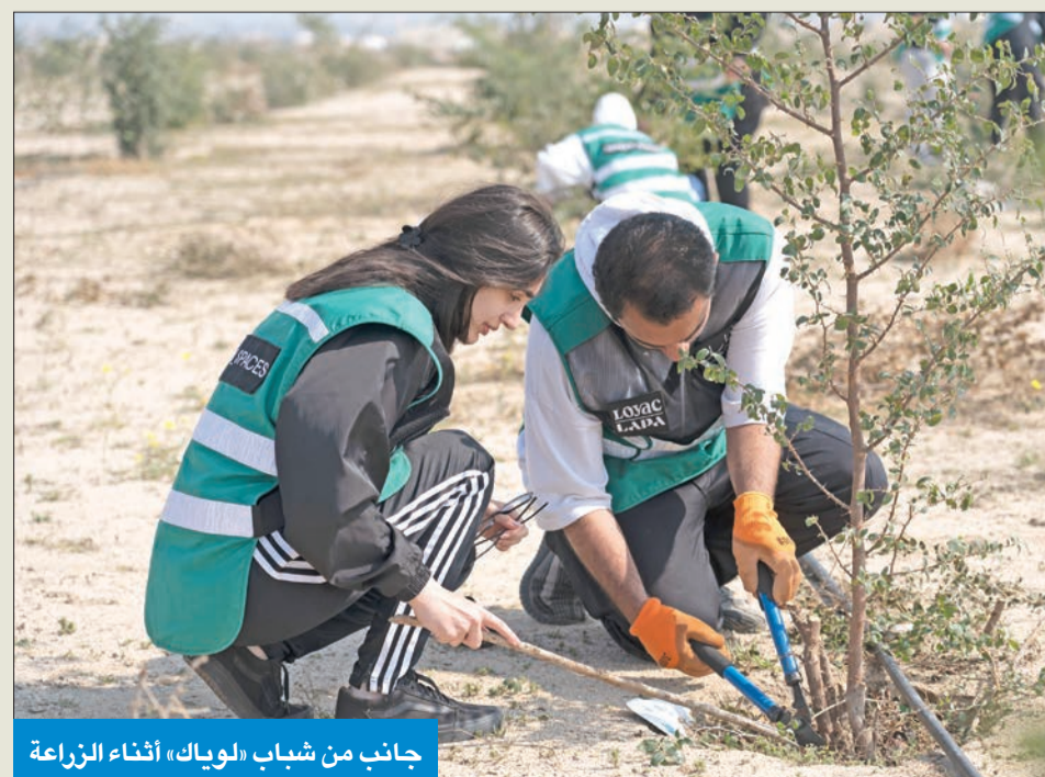
جانب من شباب «لويك» أثناء الزراعة

● الكليب: تدريب الشباب على كيفية تجديد المساحات الخاوية من المغذيات ● زراعة 1000 نخلة وشجرة في قلب الصحراء منها 200 نخلة و500 شجرة تفاح