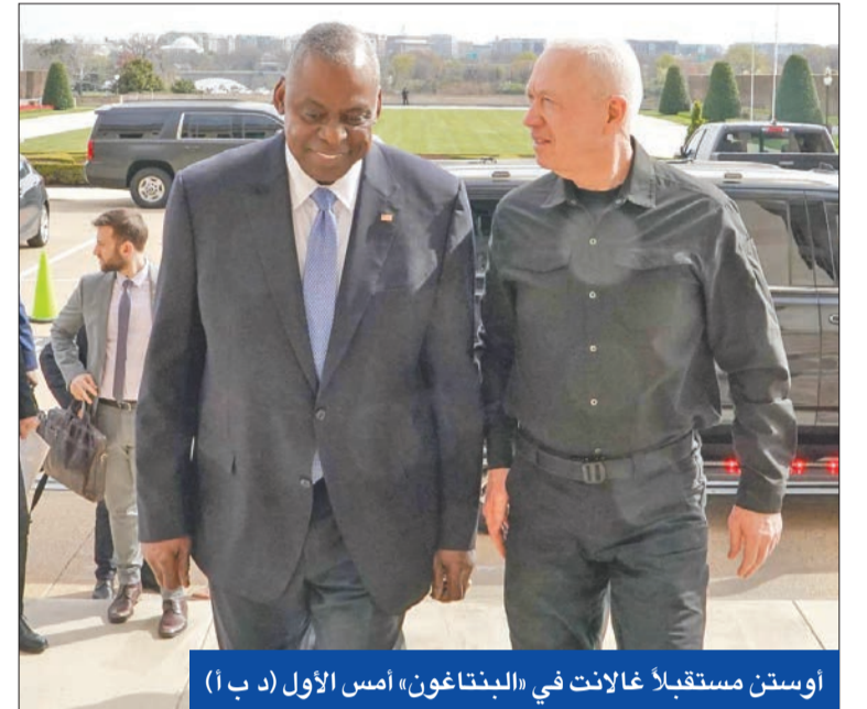
أوستن مستقبلاً غلانت في «البنيتاغون» أمس الأول

على خط بنينامين نتانياهو» وقال بن غفير، لصحيفة نيويورك تايمز، «كنت أتوقع ألا يتبع رئيس الولايات المتحدة تعيينه في يناير الماضي، رئيساً لمجلس الوزراء والزنادني يتحدر من الضالع جنوب اليمن، وهو دبلوماسي عريق شغل سابقاً مناصب في جمهورية اليمن الجنوبية، وكذلك منصب سفير اليمن لدى السعودية وبريطانيا وإيطاليا والأردن. وقال موقع «المشهد اليمني» حسب ما نقل عنه موقع «الحرّة إن الزنادني» بحسب على الشخصيات الدبلوماسية المؤيدة لانفصال اليمن إلى شمالي وجنوبي» ورغم الخلافات يشارك المجلس الانتقالي الجنوبي بقيادة عبدالرسول الزبيدي في مجلس القيادة الرئاسي.