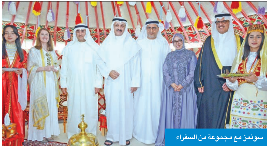
سونم مع مجموعة من السفراء

«الحسن الحظ، أنني موجودة في الكويت، التي جعلتني أشعر كأني في بيتي، وذلك رغم مشاعر الحنين إلى الوطن». كلمات قالتها السفيرة التركية لدى البلاد، طوبى نور سونمز، خلال غيبة أقامتها مساء الثلاثاء في دارتها، بحضور حشد كبير من السفراء والدبلوماسيين العرب والأجانب المعتمدين في الكويت، إضافة إلى عدد كبير من المسؤولين والمواطنين ومن أبناء الجالية التركية.