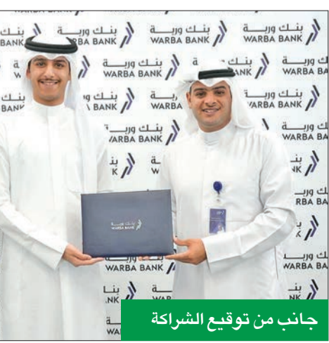
جانب من توقيع الشراكة