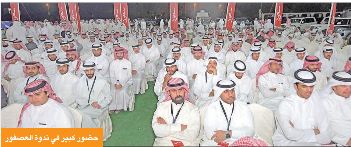
حضور كبير في ندوة العصفور

وأنت تعديلات هذا القانون للإزام الجميع بالمواصفات، كما أن هناك «كود بناء» يتم إعداده في المجلس البلدي، ونحن نتابعه، موضحاً أن البعض يعتقد أن قانون المعاقين يتعلق فقط بالمزايا المالية، بل هو واجبات من قبل الحكومة لتوفير سبل حقوق هذه الفئة لتوفير سبل العيش الكريم. ويؤيد أن تعديلات القانون ساوت بين المعاقين من الرجال والنساء، وكذلك المكلفين برعاية المعاقين، فالإعاقة لا تفرق بين رجل وامرأة، وإضافة مكلف ثان للإعاقة الشديدة، خصوصاً للإعاقات الذهنية والحركية، كما شملنا الأم الكويتية التي لديها ابن معاق غير كويتي بالقانون، على عكس ما كان معمولاً به في السابق، وهو تمايز في القانون. وأكد أنه سيسعمل على قانون آخر لذوي الإعاقة فيما يخص الجانب التعليمي بشكل متكامل واستغلال الطاقات المهدرة من ذوي الإعاقة وتوفير البيئة المناسبة لها.