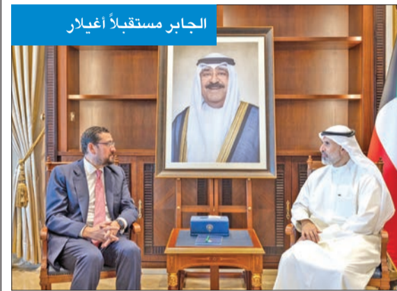
الجابر مستقبلاً أغيلار

وأضاف أغيلار: «كما بحثنا في مسألة التحضير للقاءات رفيعة المستوى، ونحن نعمل على عقد المزيد من الاجتماعات الثنائية في أسرع وقت ممكن من أجل مواصلة الجمع بين البلدين، ولما هو الأفضل لمصلحة شعبيهما».