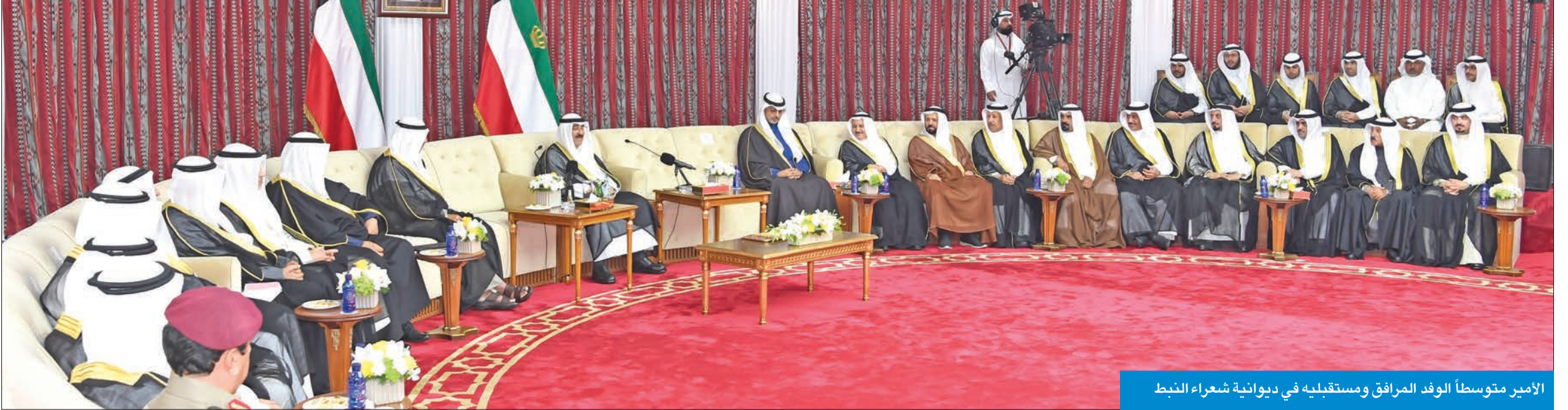
الأمير متوسماً الوفد المرافق ومستقبله في ديوانية شعراء النبط

شعراء النبط عام 1977، ودور سموكم الكبير بوضع الأسس والأركان لبناء صرح شعري يحفظ الشعر والشعراء، قائلاً: ونحن نعاهد سموكم على السير بنهجكم الكريم في الارتقاء بالشعر والحفاظ عليه حتى يبقى هذا الموروث المهم مع الأجيال جيلاً بعد جيل، وستبقى رسالتنا الدائمة هي ترسيخ الروح الوطنية ومشاعر الولاء للوطن والأمير وتعزيز التلاحم الوطني والاجتماعي.