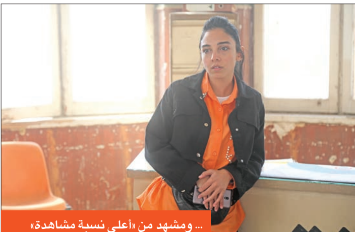
... ومشهد من «أعلى نسبة مشاهدة»

على العكس جاءت نهاية مسلسل «صلة رحم» حزينية مع وفاة د. حسام عقب لحظات من ولادة نجله آدم، الذي وضعته حنان، الفتاة التي قام باستئجار رحمتها، فيما جاءت وفاته بعد تعرضه للطنع من مطلق حنان خلال اشتباكهما بالأيدي. أما صنّاع مسلسل «كامل العدد 1+» و«اشغال