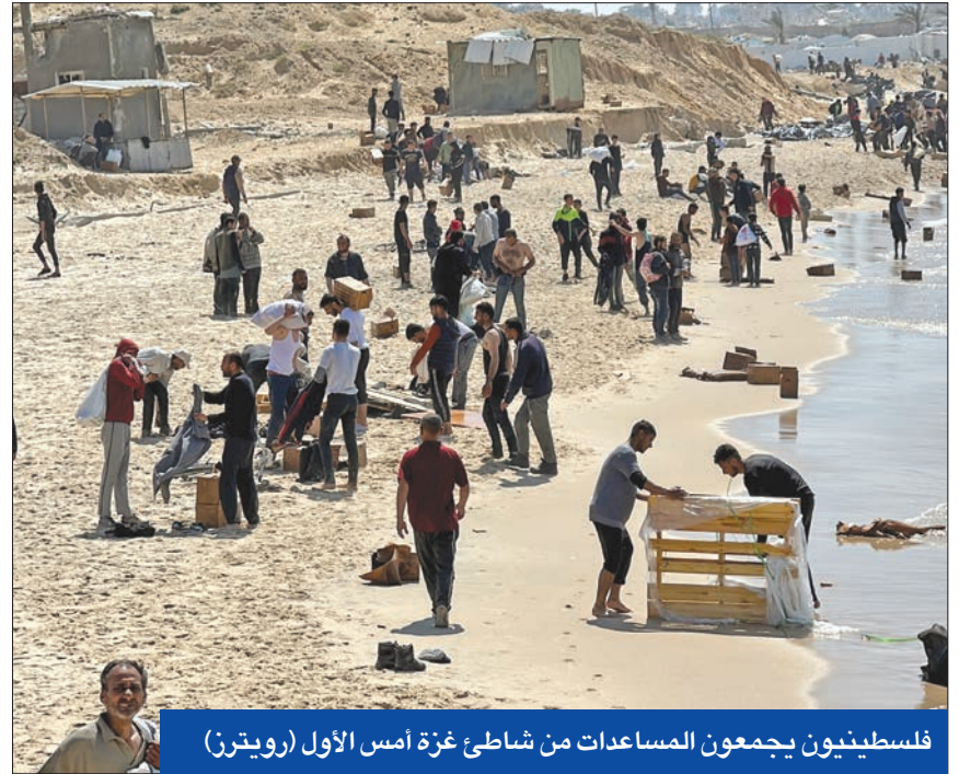
فلسطينيون يجمعون المساعدات من شاطئ غزة أمس الأول

ووسط الإشارات العربية والدولية بقرار مجلس الأمن، تواصل القتال في غزة أمس، مع استهداف الغارات الإسرائيلية أماكن قريبة من مدينة رفح