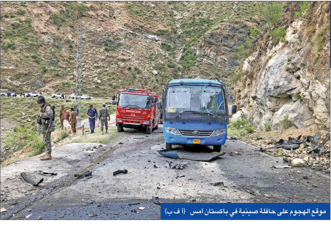
موقع الهجوم على حافلة صينية في باكستان أمس

في أول خطاب بليقيه منذ الزلزال السياسي الذي أحدثه فوزه التاريخي من الدورة الأولى. طمان الفائز بالانتخابات الرئاسية في السنغال ياسيرو ديوماي فاي شركاء بلاده «المحترمين» بأن السنغال ستظل الحليف الآمن والموثوق به». وفاي الذي بلغ لتوّه الرابعة والأربعين ولم يسبق له أن تولى أي منصب وطني منتخب يصبح خامس رئيس للسنغال وأصغر الرؤساء سنّياً في البلد الواقع في غرب إفريقيا ويبلغ عدد سكانه 18 مليون نسمة. وقال الرئيس المنتخب في خطاب متلفّ مساء أمس الأول: «أودّ أن أقول للمجتمع الدولي ولشركائنا الثنائيين والمتعددي الأطراف، إن السنغال ستحتفظ