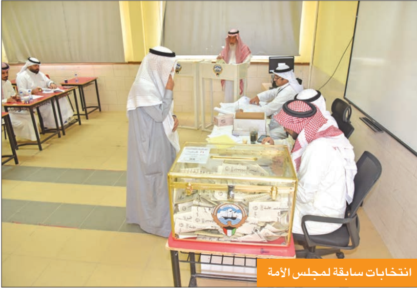
انتخابات سابقة لمجلس الأمة

على الصعيد زيارة الدواوين تتقى الشريان الرئيسي للمرشحين والحلقة الموثوقة مع الناخبين