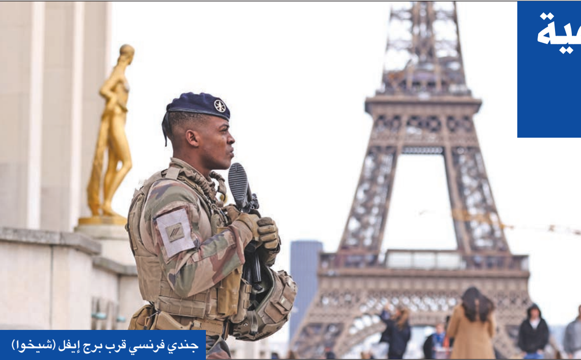
جندي فرنسي قرب برج إيفل (شيخوا)

وأوضح كيربي أن المسؤولين الأميركيين سيواصلون طرح مخاوفهم