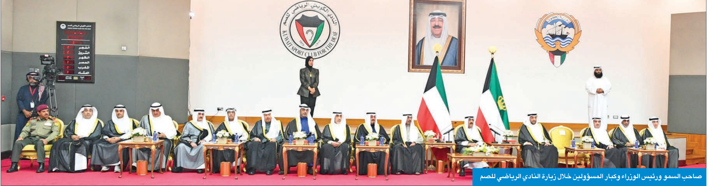
صاحب السمو ورئيس الوزراء وكبار المسؤولين خلال زيارة النادي الرياضي للصم

الاستثمار في العنصر البشري لإعداد شباب يتمتع بقدرات تنافسية لتحقيق الإنجازات في المحافل الدولية، فهم الثروة الحقيقية والرصيد الدائم لكويت.