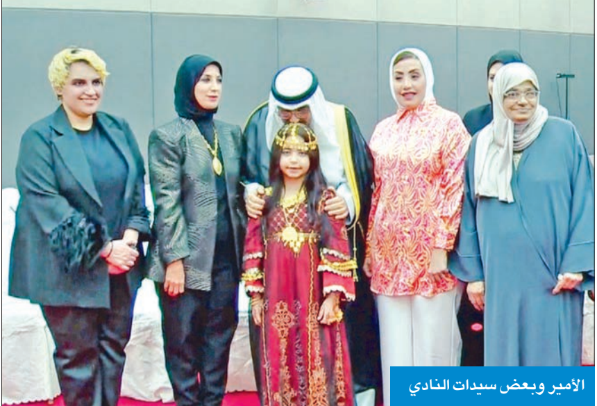
الأمير وبعض سيدات النادي

توفير الأجهزة والتقنيات والبرامج التي تساعدهم على التواصل مع المحيطين بهم خصوصاً فيما يتعلق بسلامتهم الأمير