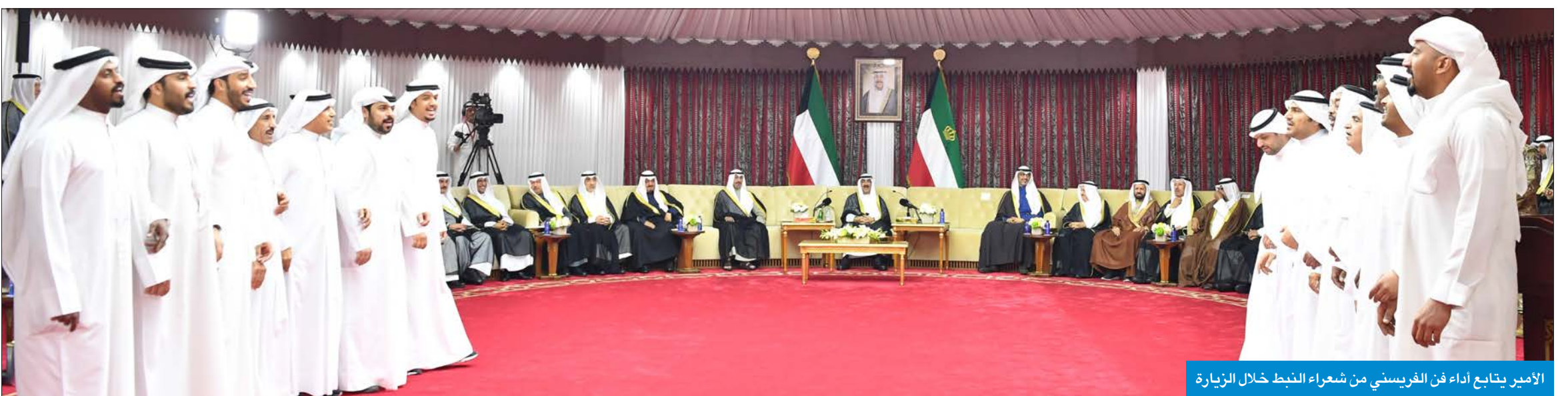
الأمير يتابع أداء فن الغريسي من شعراء النبط خلال الزيارة