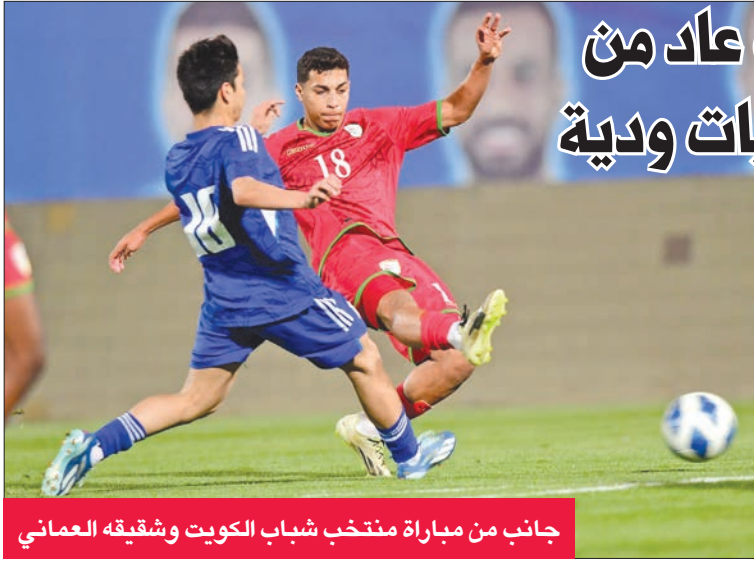
جانب من مباراة منتخب شباب الكويت وشقيقة العماني