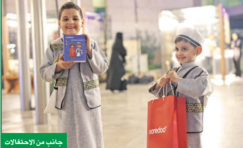
جانب من الاحتفالات

وشركة Ooredoo لن تدخر جهداً في تعزيز تواصلها مع عملائها وجميع شرائح المجتمع الذي تعمل فيه، حيث تبذل جهودها الحثيثة إلى ترسيخ مفهوم التعاون والتواصل مع أفراد المجتمع بشكل عملي ودقيق، من خلال تكثيف برامج المسؤولية الاجتماعية، لتعزيز استثماراتها في العلاقات مع المجتمع المحلي، باعتبارها من الشركات الرائدة التي تؤمن بمسؤوليتها لتطوير عالم عملائها. جدير بالذكر، أن مشاركة Ooredoo في احتفالات القرقيعان تتماشى مع برنامجها المتميز في المسؤولية الاجتماعية، والذي يقع في سلم أولوياتها المشاركة المجتمعية، وتعزيز التراث الثقافي. ومن خلالها وجودها النشط في مثل هذه الفعاليات، تؤكد الشركة التزامها بتعزيز الشعور بالانتماء للمجتمع، والحفاظ على تقاليد الثقافة الكويتية.