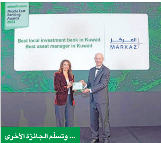
... وتسلم الجائزة الأخرى