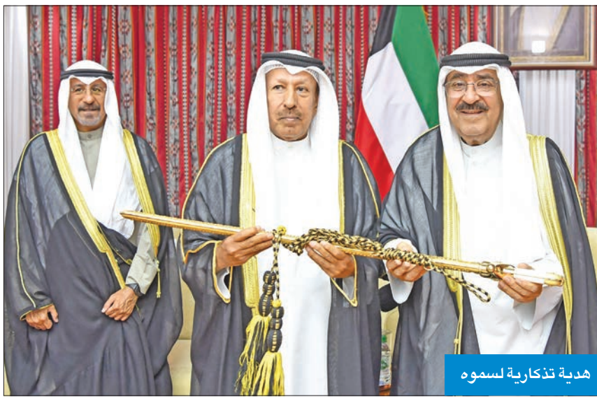
هدية تذكارية لسموه

وقد رافق سموه في هذه الزيارة كبار المسؤولين بالدولة.