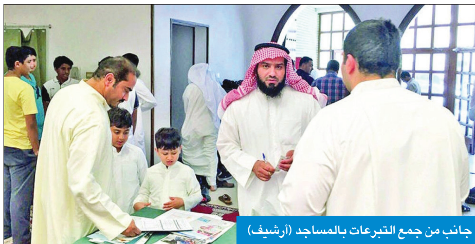
جانب من جمع التبرعات بالمساجد

المسبقة، في مخالفة جسيمة للضوابط والأشراطات والقوانين المنظمة للعمل الخيري في البلاد، مشيرة إلى أنه تمت مخاطبة النيابة العامة باسمائهم لاتخاذ الإجراءات القانونية اللازمة حيالهم.