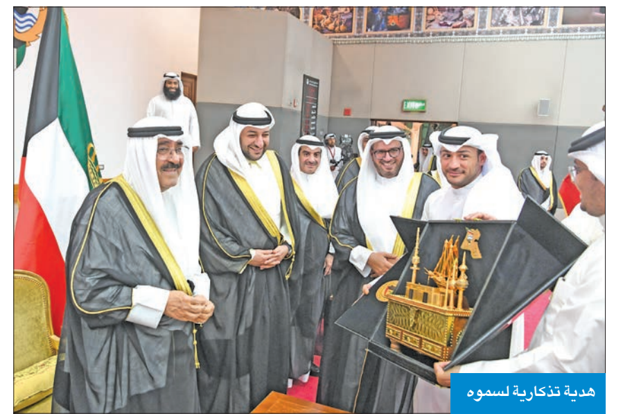
هدية تذكارية لسموه