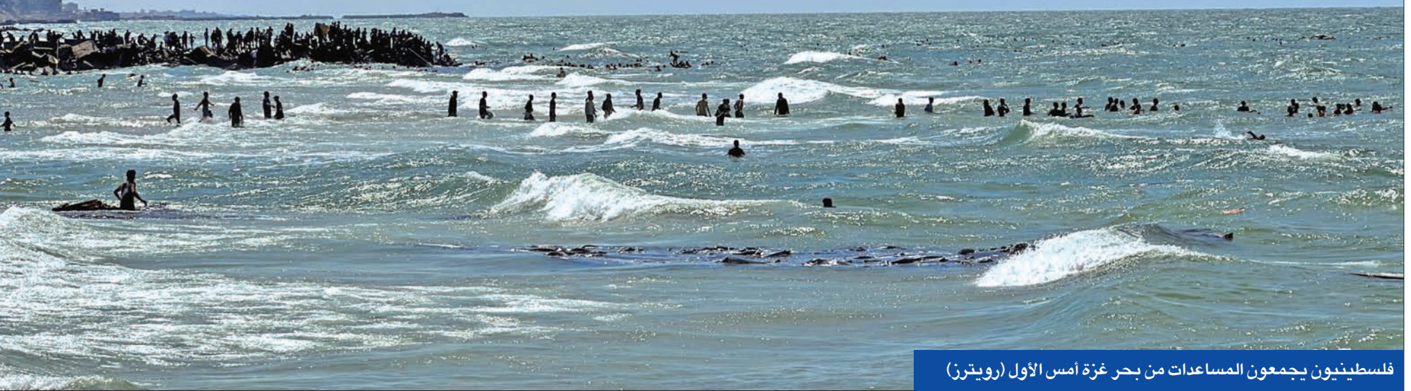
فلسطينيون يجمعون المساعدات من بحر غزة أمس الأول

واشنطن تبرر امتناعها التاريخي عن التصويت • هنية في طهران... وبواد تفكك بحكومة نتانياهو