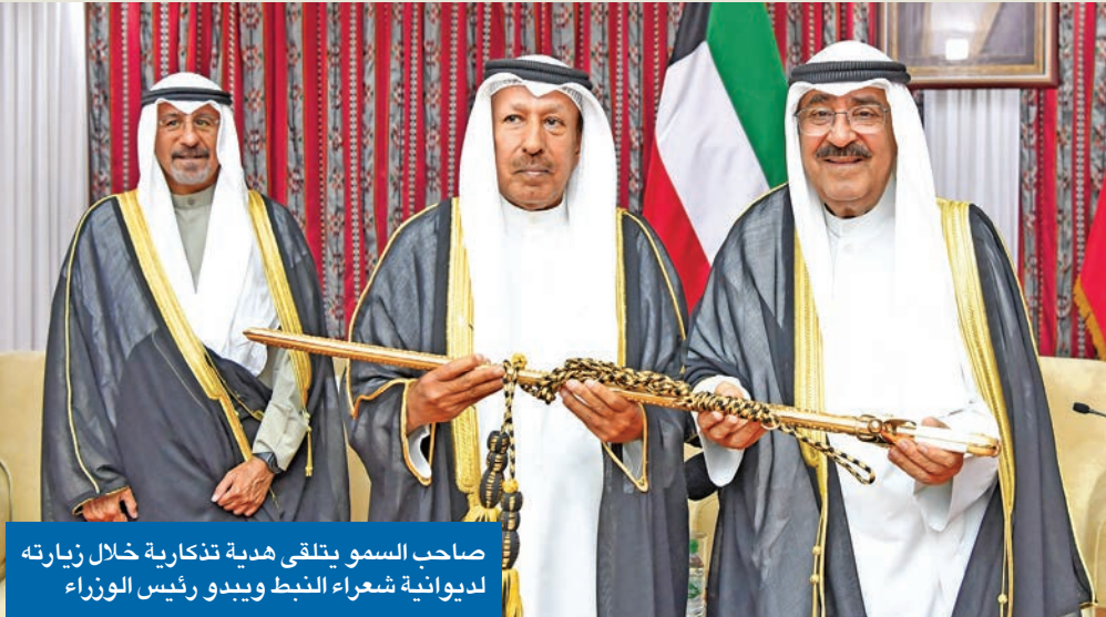
صاحب السمو يتلقى هدية تذكارية خلال زيارته لديوانية شعراء النبط ويبدو رئيس الوزراء

سموه أكد لدى زيارته نادي الصم وديوانية شعراء النبط ضرورة تعزيز التواصل المجتمعي