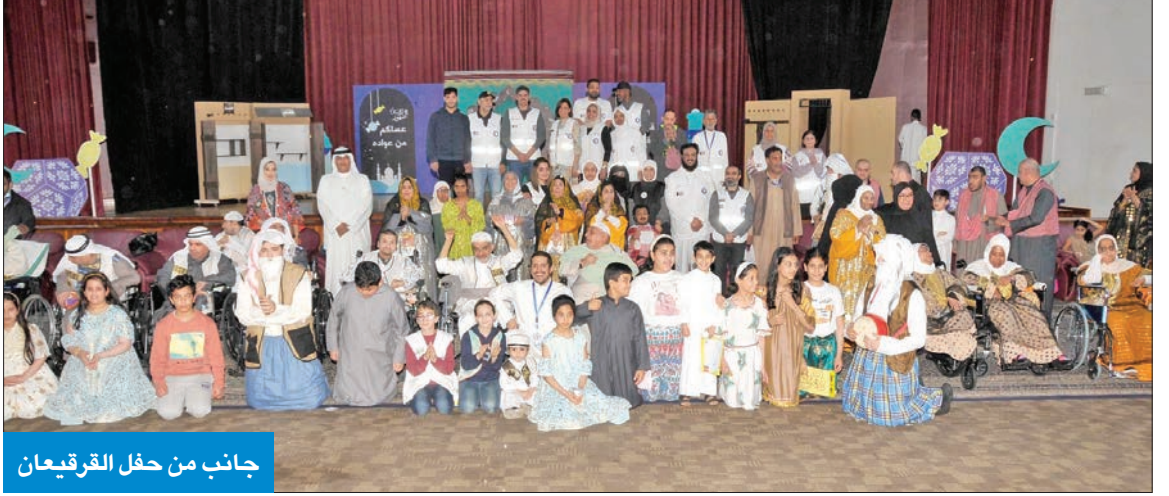
جانب من حفل القرقيعان

لمشاركة فرحة رمضان مع الأيتام والمسنين وذوي الاحتياجات