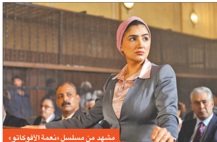
مشهد من مسلسل «نعمة الأفوكاتو»

على العكس جاءت نهاية مسلسل «صلة رحم» حزينية مع وفاة د. حسام عقب لحظات من ولادة نجله آدم، الذي وضعته حنان، الفتاة التي قام باستئجار رحمتها، فيما جاءت وفاته بعد تعرضه للطنع من مطلق حنان خلال اشتباكهما بالأيدي. أما صنّاع مسلسل «كامل العدد 1+» و«اشغال