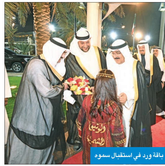
باقة ورد في استقبال سموه

والبرامج التي تساعدهم على التواصل والتفاعل مع المحيطين بهم وبخاصة ما يتعلق بسلامتهم. وفي ختام كلمته، قال سموه: لكم منا جميعاً التحية والسلام، راجين لكم دوام التميز وتحقيق المنال، داعين الله تعالى أن يوفق الجميع لخدمة كويتنا الغالية ورفع شأنها وازدهارها.