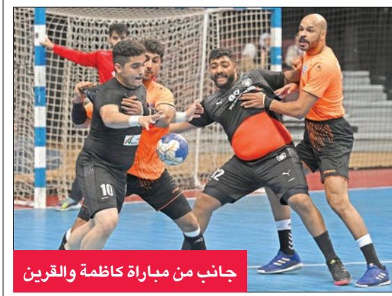
جانب من مباراة كاظمة والقرين

استعاد الفريق الأول لكرة اليد بنادي كاظمة نغمة الفوز مجدداً بفوزه على القرين للمرة الثانية على التوالي بنتيجة 33 - 25، في المباراة التي جمعت الفريقين أمس سعد العبدالله الرياضي ضمن منافسات الجولة السادسة من دوري الدمج، التي شهدت أيضاً فوز النصر على خيطان بنتيجة 34 - 33.