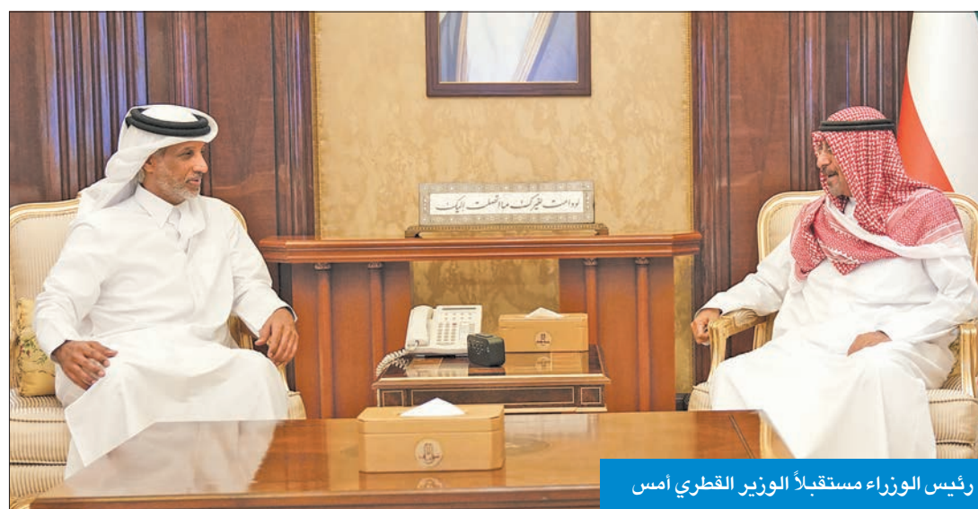
رئيس الوزراء مستقبلاً الوزير القطري أمس

واستقبل سموه، بحضور وزير الدولة لشؤون مجلس الأمة وزير الدولة لشؤون الشباب وزير الدولة لشؤون الاتصالات