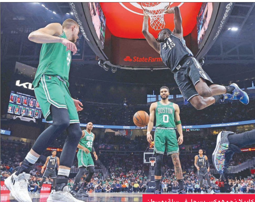
كابيللا نجم هوكس يسجل في سلة بوسطن

ديفنتشيفنسو فريقه نيويورك نيكس إلى الفوز على ضيفه ديترويت بيستونز 124 - 99 بتسجيله 40 نقطة كأفضل سجل في مسيرته.