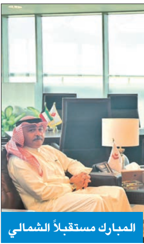
المبارك مستقبلاً الشمالي

استقبل رئيس الإدارة العامة للطيران المدني الشيخ م. محمود المبارك في مكتبه سفيرة دولة الكويت لدى جمهورية الهند مشعل الشمالي، حيث تمت مناقشة العلاقات الخنائية والمواضيع التي تخص الطيران مع الجانب الهندي، ومنها تشغيل الناقلات الوطنية لدى الهند.