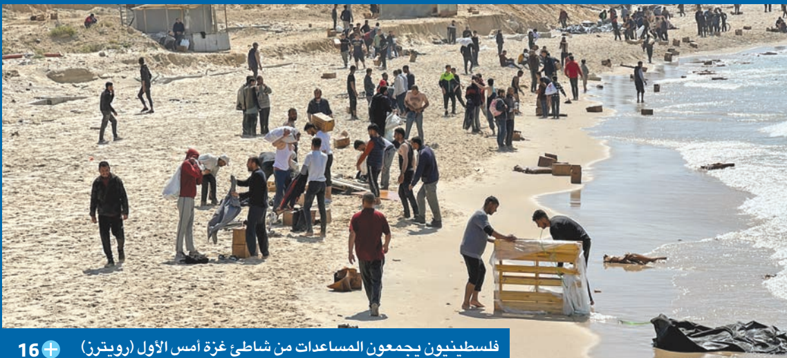
فلسطينيون يجمعون المساعدات من شاطئ غزة أمس الأول