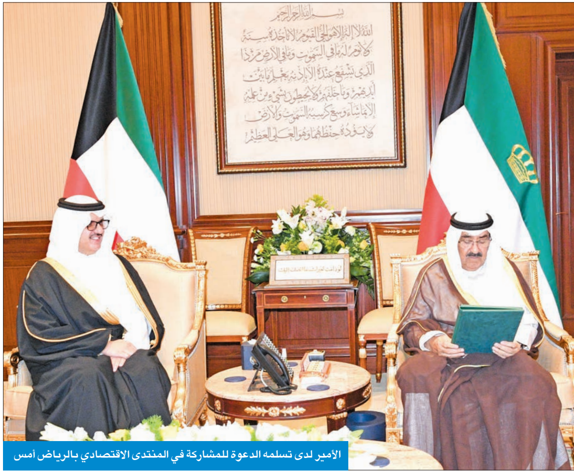
الأمير لدى تسلمه الدعوة للمشاركة في المنتدى الاقتصادي بالرياض أمس