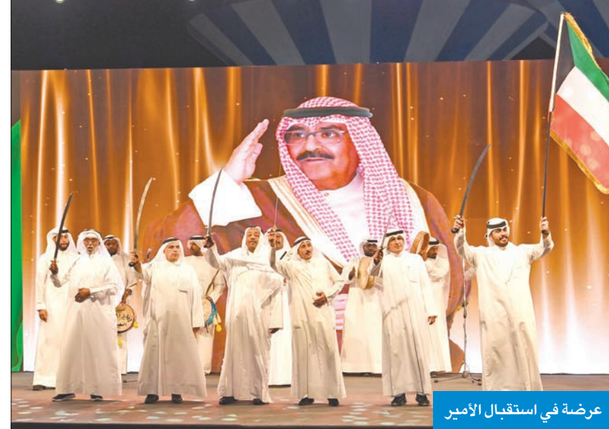
عرضة في استقبال الأمير

صرح أدبي ثقافي متميز في المبنى والمعنى ويرمز إلى التاريخ والتراث والأصالة