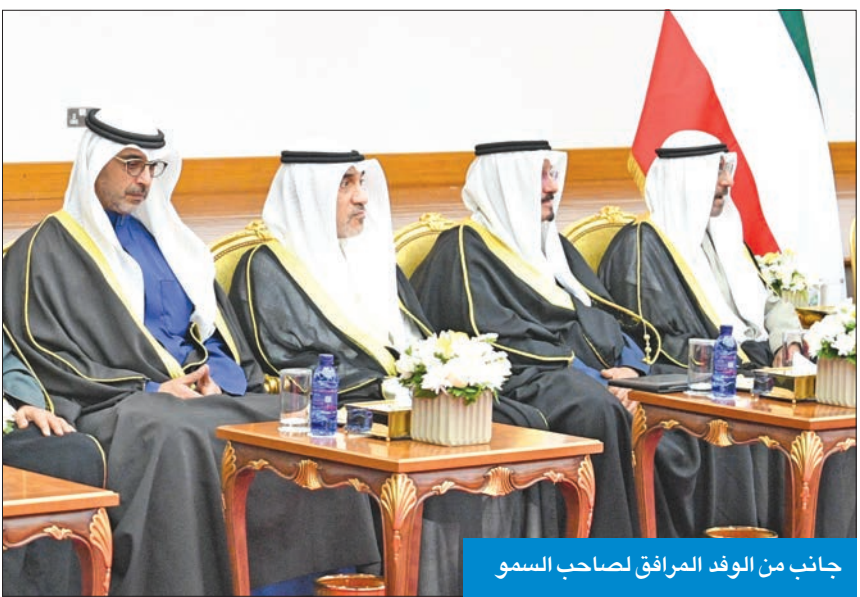
جانب من الوفد المرافق لصاحب السمو

تحقيق رؤية سموكم وتوجيهاتكم السامية شاركتنا في العديد من البطولات الدولية وحققنا فيها مراكز متقدمة الحربي