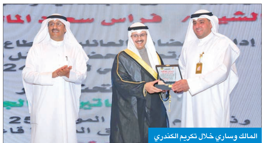
المالك وساري خلال تكريم الكندري

للليتيم، والمجتمع الكويتي بكل فئاته حريص على العناية باليتيم، لأننا شعب جُبِل على حب الخير والإحسان والتكافل بأوسع معانيه». جاء ذلك خلال رعايته، أمس الأول، الاحتفال السنوي باليوم العربي لليتم تحت شعار «كهايتين في الجنة»، الذي نظّمته إدارة الحضّانة العائلية في وزارة الشؤون. وأشار المالك، خلال كلمة له