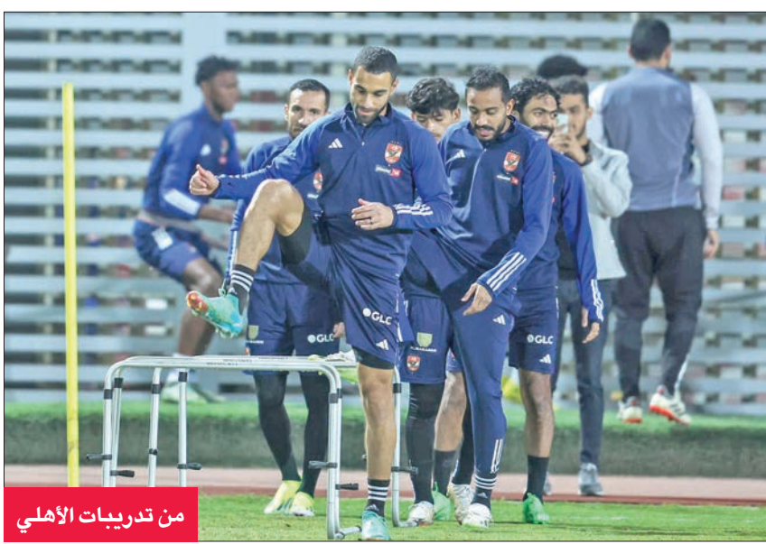
من تدريبات الأهلي