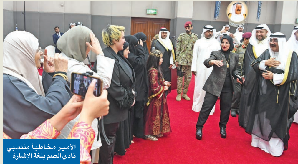
الأمير مخاطباً منتسبي نادي الصم بلغة الإشارة