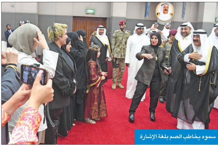
سموه يخاطب الصم بلغة الإشارة

وأشار إلى أنه لتحقيق رؤية سموكم، وعلى خطى توجيهاتكم السامية وبفضل دعمكم الكريم فقد شارك النادي في العديد من البطولات الدولية وحقق فيها مراكز متقدمة، وتشرفنا برفع علم الكويت في المحافل الدولية، متمنين لسموكم دوام الصحة وموفور العافية، أملين أن نكون عند حسن ظنكم، فزيارتكم الأبوية وسام فخر وشرف ومصدر بهجة وسعادة بالغة لأبنائكم الصم. وتم خلال هذه الزيارة إهداء سموه هدية تذكارية بهذه المناسبة، كما تفضل سموه بالتوقيع على سجل الشرف. ورافق سموه في هذه الزيارة كبار المسؤولين بالدولة.