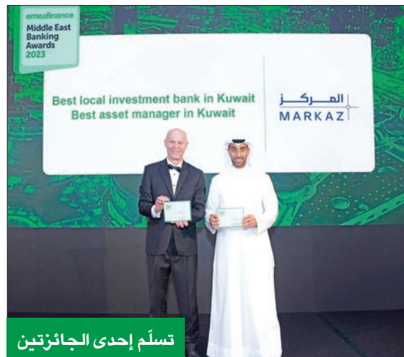
تسلم إحدى الجائزتين