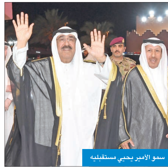
سمو الأمير يحيي مستقبله

جميعاً في أداء رسالتكم، وتحقيق رؤيتكم، وأن يديم على وطننا الغالي وابنائنا المخلصين التميز».