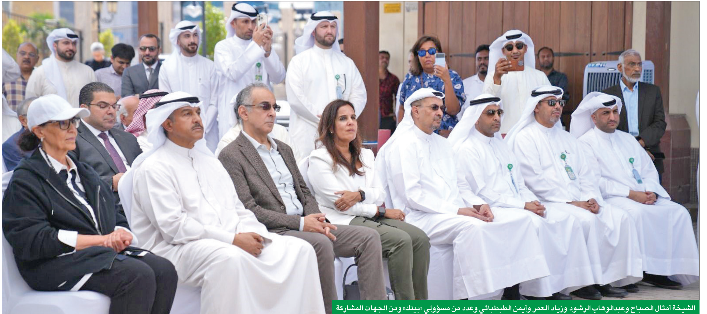
الشيخة أمثال الصباح وعبد الوهاب الرشود وزياد العمر وأيمن الطبطبائي وعدد من مسؤولي «بيتك» ومن الجهات المشاركة

قالت رئيسة العمل التطوعي الشيخة أمثال الأحمد، في تصريح صحفي، «أشكر بيت التمويل الكويتي على هذه المبادرة، ونتمنى من البنوك والشركات أن يقوموا بمثل هذا الدور لأن الكويت تستاهل»، لافتة إلى أن المباركية تحتاج إلى الكثير من الدعم.