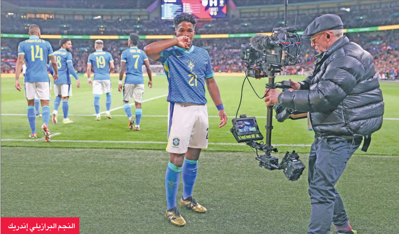
النجم البرازيلي إنديريك

ومن المهم جداً العمل والوصول إلى جعل الفريق يعمل كمجموعة متجانسة في أقرب وقت ممكن، لقد لعبنا ضد إنكلترا، وهو منتخب جيد، وحققنا الفوز على أرضه وهذه بداية جيدة لمشروع السيليساو» (إفي)