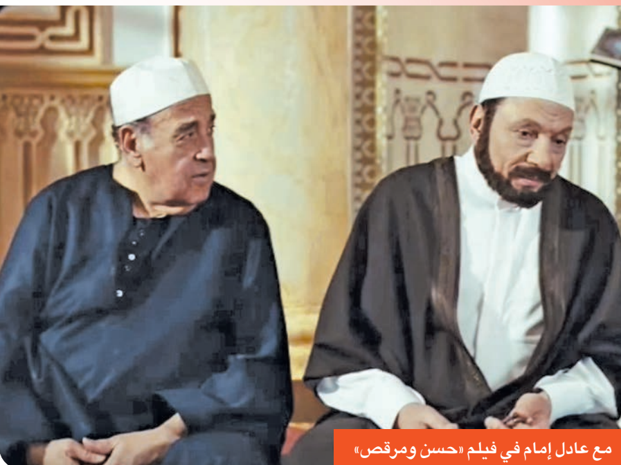
مع عادل إمام في فيلم «حسن ومرقص»

وجسد الفنان حسن مصطفى في «ابتسامه واحدة تكفي» شخصية «حمزة» أمام يسرا، ونور الشريف، ومصطفى فهمي، وبدور الفيلم حول لقاء «أميرة ومصطفى» أثناء تواجدهما في بعثة خارج البلاد، ويعدا مصطفى بالزواج فور عودتهما، وتمت سنوات في انتظار رسالة من مصطفى كي يفي بوعدته، وتعيش على حلم الانتظار لقدام لا يأتي.