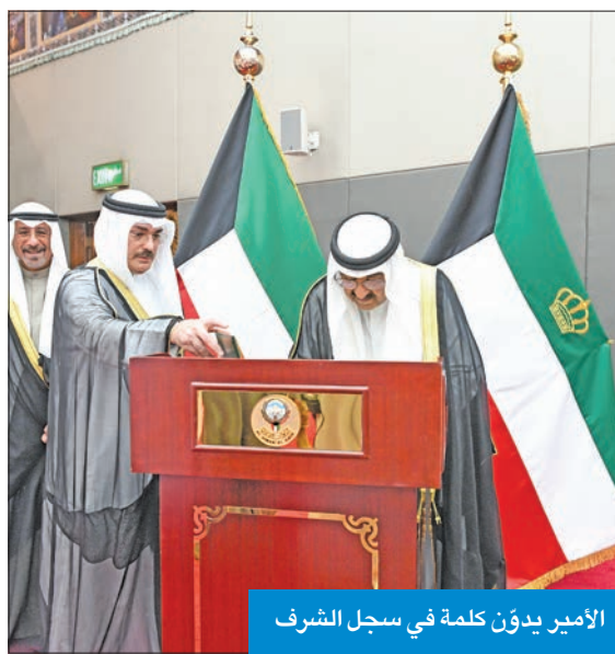
الأمير يدون كلمة في سجل الشرف