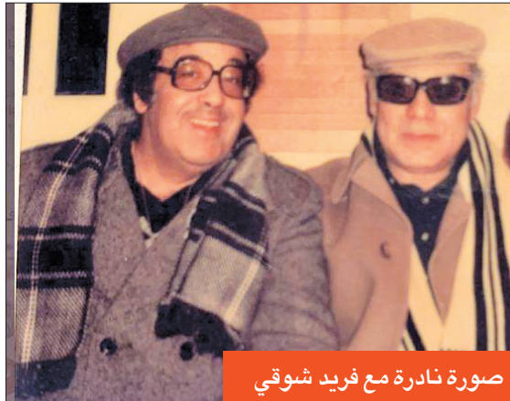
صورة نادرة مع فريد شوقي

الشوارع شبه خالية في أرجاء مصر والبلاد العربية، وكان الجمهور يردد العبارة الدرامية الشهيرة «أنا البرادعي» التي يقولها بطل المسلسل.