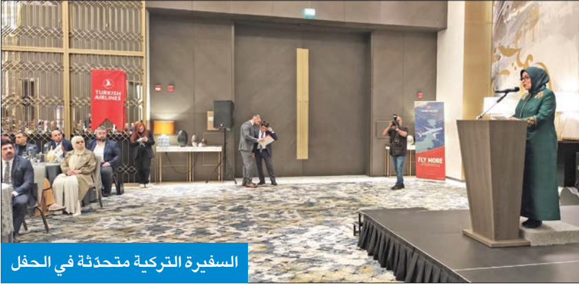
السفيرة التركية متحدثة في الحفل

في كلمة ألقته خلال غيبة أقامتها «الخطوط الجوية التركية» مساء أمس الأول، أشادت السفيرة التركية لدى البلاد طوبى نور سونمز بـ«الدور الداعم والتكميلي الذي تؤديه الخطوط الجوية التركية في مساعيها الدبلوماسية، والتي كان لها دور فعال في تعزيز العلاقات بين تركيا والكويت».