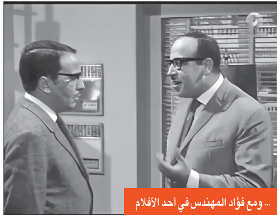
... ومع فؤاد المهندس في أحد الأفلام

التقى الراحلان حسن مصطفى وفؤاد المهندس في أعمال فنية عديدة، سواء على الشاشة أو على خشبة المسرح، ودارت في الكواليس مواقف طريفة، لكن الأمر اختلف في مسرحية «سيدتي الجميلة»، فذات ليلة عرض طرد المهندس زميله أمام الجمهورا وروى مصطفى تفاصيل ذلك الموقف الغريب، حين وقف على خشبة المسرح أمام فؤاد المهندس، ونسي جملة من حوار، وأدرك المهندس نسيانه، وخرج عن النص وقال له بصوت عالٍ: «ابعد عن وشي دلوقت إنت موترتني وروح في الجنينة واشرب قهوتك، وفكر لي في حل في مصيبي»، فقال له «طيب» وخرج مسرعاً. ومن سوء حظهُ أن الملقن غاب يومها، فقال لنفسه، إن فؤاد المهندس ارتحل الحوار وخرج عن النص ليذكره بما نسيه، وفي الكواليس أمسك الأوراق واسترجع الجملة التي نسيها وعاد مسرعاً إلى خشبة المسرح كأنه يعانده ويريد البقاء بجانبه، وقال له «إنت تعرف يا كمال إني ما باحش القهوة»، ومر المشهد بإضحاك أكثر وحب زاد في قلبه لفنان الكوميديا الكبير فؤاد المهندس.