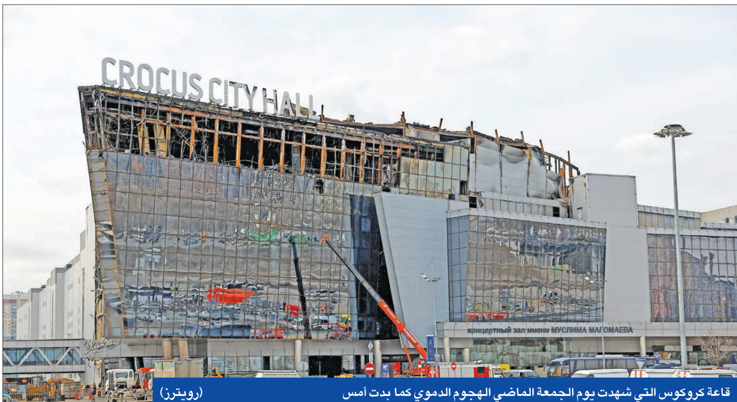
قاعة كروكوس التي شهدت يوم الجمعة الماضي الهجوم الدموي كما بدت أمس

اتهمت روسيا الغرب وأوكرانيا بمساعدة منفذي هجوم موسكو، عادة إقرار الرئيس الروسي بأن «متطرفين إسلاميين» نفذوا الهجوم، بعد أن تجنّب ذلك في خطابه الأول عقب الاعتداء الأكثر دموية في روسيا منذ عقدين.