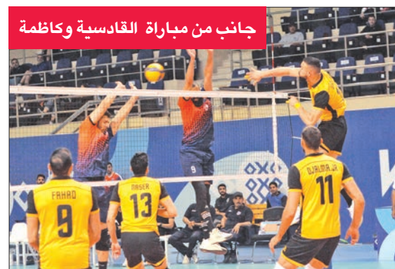
جانب من مباراة القادسية وكاظمة

وفاز فريق برقان على التضامن بثلاثة أشواط مقابل لاشيء «19-25، 17-25، 19-25» في المباراة التي جمعتها من المربع الذهبي للدوري العام لكرة الطائرة، وسيلتقي الفريقان اليوم عند التاسعة مساءً على صالة الاتحاد ضمن الجولة الثانية من المربع الذهبي، وفي حال فوز الأصفر فسيعصد مباشرة