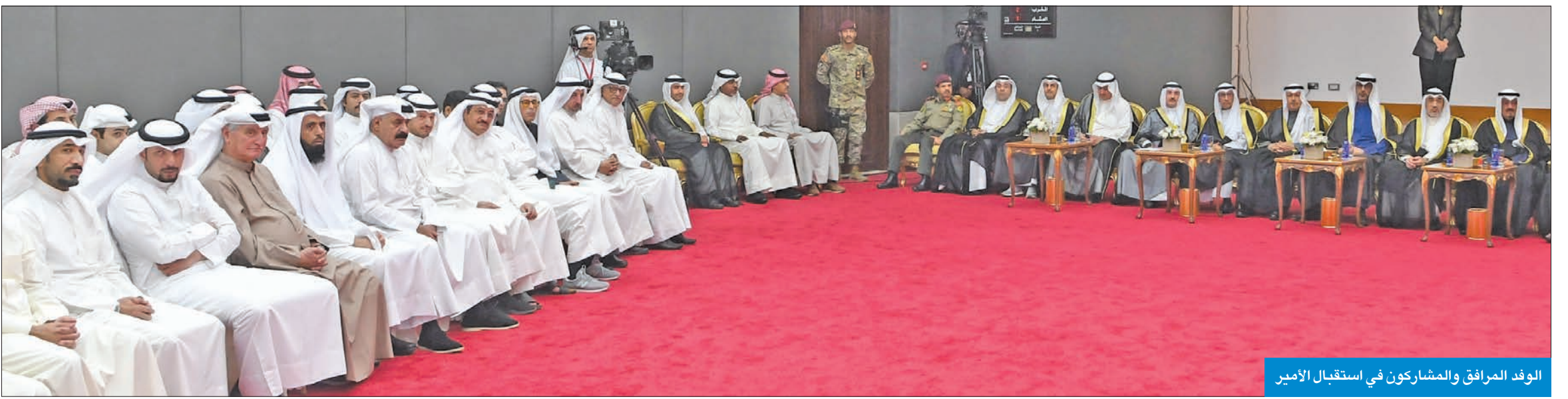
الوفد المرافق والمشاركين في استقبال الأمير