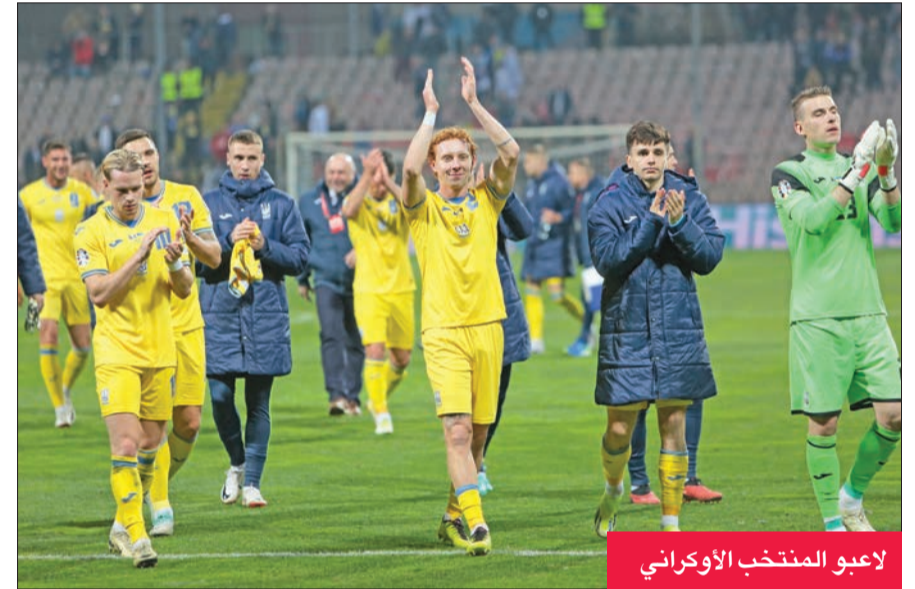
لاعبو المنتخب الأوكراني

وحجز فريق المدرب سيرهي ريبروف بطاقته إلى نهائي المسار، حيث سينتخب اليوم مع أيسلندا. ولم يغب المنتخب الأوكراني عن كأس أوروبا منذ 2012 حين تأهل للمرة الأولى منذ الاستقلال عن الاتحاد السوفياتي، وقد وصل في النسخة الأخيرة صيف 2021 إلى ربع النهائي.