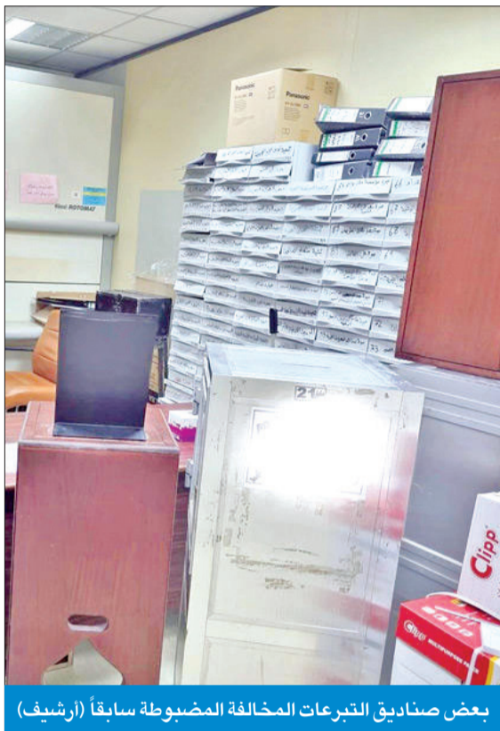
بعض صناديق التبرعات المخالفة المضبوطة سابقاً (أرشيف)

في موضوع آخر، أنجزت الوزارة، ممثلة في إدارة شؤون التعاون، وإشهار الجمعيات والائتلافات التعاونية بقطاع التعاون، الجدول الخاص بعقد عموميات وإجراء انتخابات مجالس إدارات الجمعيات التعاونية التي انتهت الولاية القانونية لأعضائها والمقرر عقدها خلال شهري أبريل ومايو المقبلين. ووفقاً للمصادر، فإن ثمة 12 تعاونية ستعقد عمومياتها خلال الشهرين المقبلين، 10 منها في أبريل وهي جمعيات (جليب الشيوخ، عبدالله المبارك، الشامية والشيوخ، النزهة، التعيم، بيان، الأدار، الدعية، الصباحية، الفحيجيل، في حين تعقد تعاونيات الشعب وعلي صباح السالم وعموميتها في مايو. ولغفت المصادر إلى أن هناك انتخابات وحيدة سيتم إجراؤها في أبريل لمجلس إدارة جمعية الصليبيخات