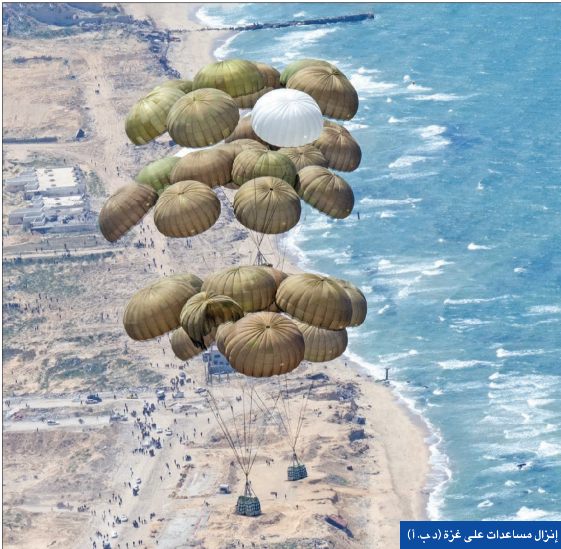
إزالة مساعدات على غزة (د.ب. 1)