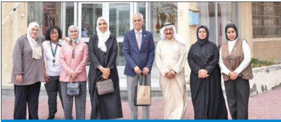
وفد «حقوق الإنسان» خلال الأسبوع الثقافي بدور الرعاية

دشنت اللجنة الدائمة للشكاوى والتظلمات في الديوان الوطني لحقوق الإنسان اسبوعها الثقافي والترفيهي المقام لصالح إدارة رعاية الأحداث التابع لوزارة الشؤون الاجتماعية وبالتعاون مع جمعية البناء البشري للتنمية الاجتماعية، وسيأتي هذا النشاط لتعزيز دور الترفيحي والتوعوي لغشأت الرعاية المختلفة.