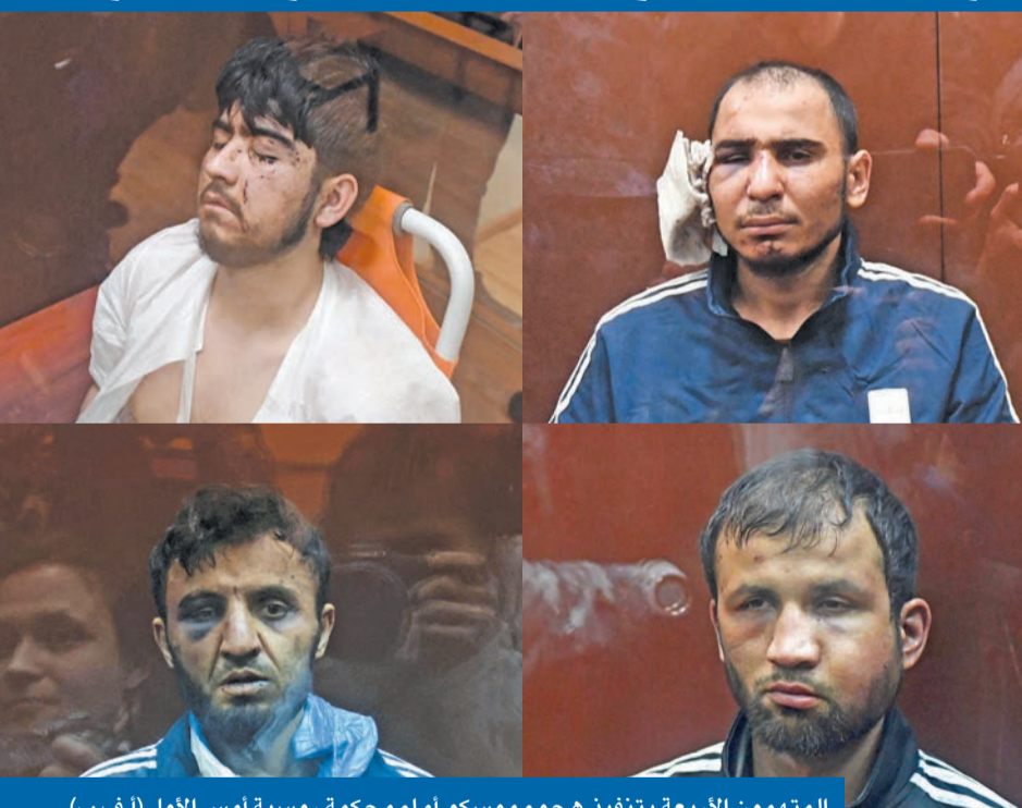
المتهمون الأربعة بتفجير هجوم موسكو أمام محكمة روسية أمس الأول (أ ف ب)

وجاء الإنذار الأقوى من فرنسا التي أعلنت أمس الأول رفع التأهب الأمني إلى أعلى مستوى بعد خفضه إلى المستوى الثاني في مطلع العام. وكشف الرئيس الفرنسي إيمانويل ماكرون أن «داعش - ولاية خراسان» يقف وراء محاولات سابقة لشن هجمات في فرنسا في الأشهر الماضية، مؤكداً أنه أسوة بواشنطن هناك معلومات تؤكد مصداقية تبني التنظيم لهجوم موسكو. وقال رئيس الحكومة الفرنسية غابريال اتال، أمس الأول، إن «التنظيم سبق أن هدد فرنسا وهو ضالع في العديد من خطط الهجوم المحبطة مؤخراً في عدد من الدول الأوروبية، من بينها ألمانيا وفرنسا». وبحسب تقارير فرنسية تعرضت نحو 40 مدرسة متوسطة وثانوية في فرنسا لتهديدات «إرهابية» من خلال بث مقاطع فيديو عن تنفيذ إعدامات، بعد قرصنة حساباتها ومواقعها الإلكترونية. في سياق متصل، حذرت