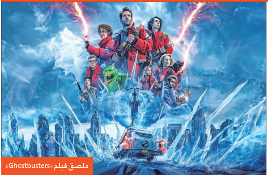
ملصق فيلم «Ghostbusters»

وفي المركز الثالث، تراجع مركزين عن عطلة نهاية الأسبوع الماضية، حل فيلم الكوميديا والفنون القتالية «كونغ فو باندا 4» (Kung Fu Panda 4) من إنتاج «يونيفرسال» و«دريم ووركس أنيميشن»، مع عائدات بلغت 16.8 مليون دولار، تلاه «إيماكولت» (Immaculate)، وهو فيلم رعب نفسي جديد من إنتاج استوديوهات «نيون» المستقلة وبطولة سيدني سويني، بإيرادات بلغت 54 مليون دولار. وجاء في المركز الخامس فيلم «ارثر ذي كينغ» (Arthur the King)، من إنتاج شركة لاينز، محققاً إيرادات بلغت 4.4 ملايين دولار، ويؤدي مارك والبيرغ في هذا العمل دور مغامر يصادق كلباً ضالاً مصاباً.