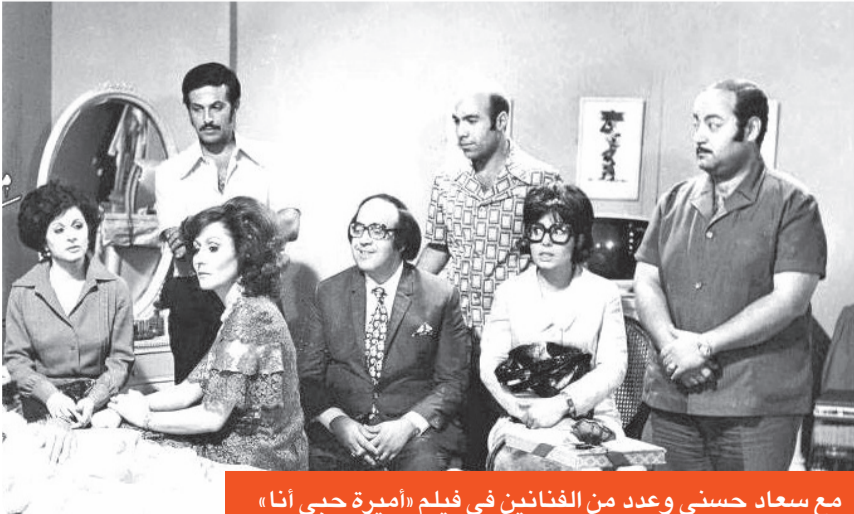
مع سعاد حسني وعدد من الفنانين في فيلم «أميرة حبي أنا»