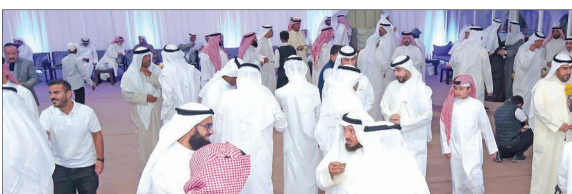
حضور كبير بمقر المطر

الكويتي، كما حدث في الخريطة التشريعية للمجلس السابق، والتي أقر من خلالها عدداً من القوانين المهمة خلال فترة قيادته. وتابع: نعم نشهد الاستقرار والتعاون بين السلطتين ووضع