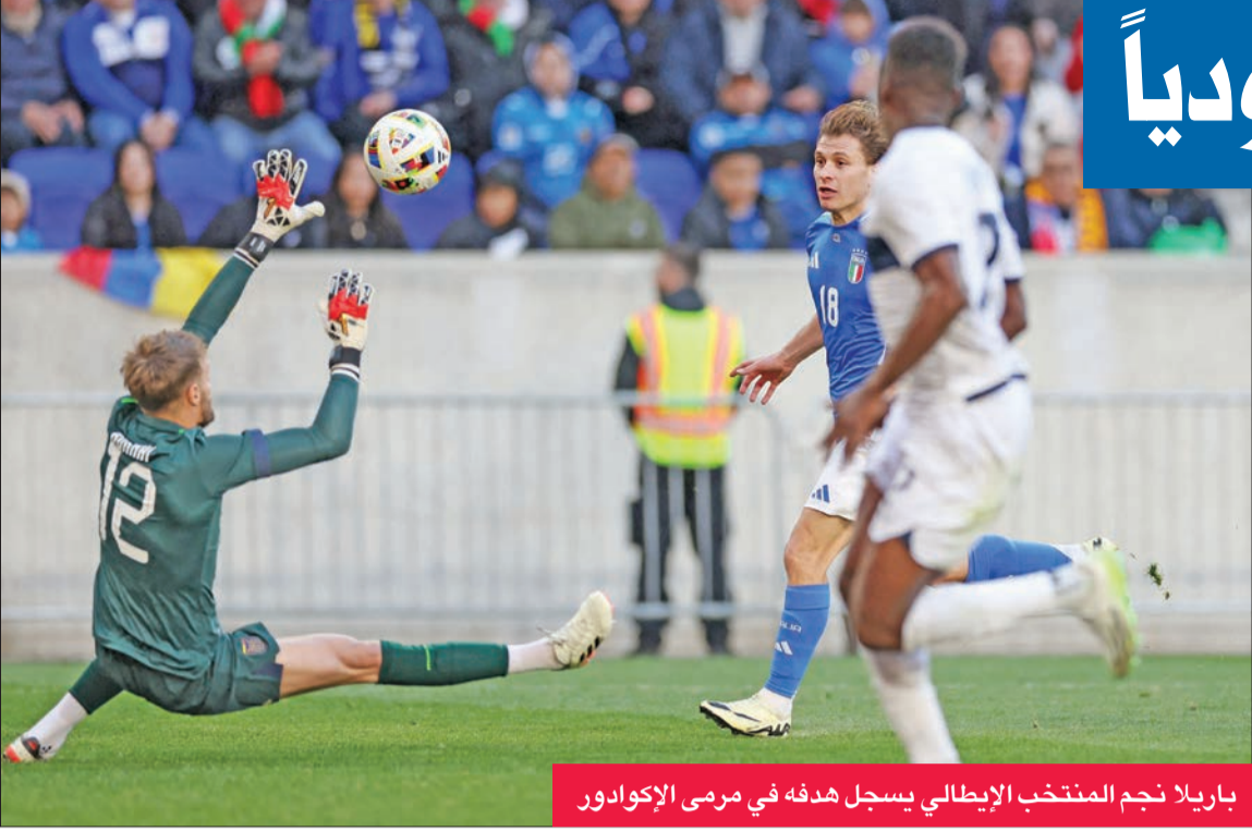
باريلا نجم المنتخب الإيطالي يسجل هدفه في مرمى الإكوادور

ونجح باريلا في تسجيل هدف الأمان للظلمة إثر هجمة مرتدة سريعة في الدقيقة الأخيرة من الوقت بدل الضائع تلقى على إثرها كرة من البديل أورسوليني داخل المنطقة فلعبها ساقطة داخل المرمى.