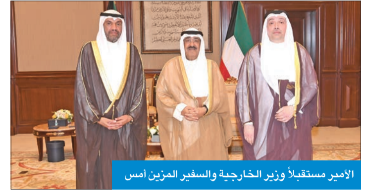
الأمير مستقبلاً وزير الخارجية والسفير المرزوق أمس

وقام بتسليم الرسالة لسموه، سفير مملكة البحرين لدى الكويت صلاح المالكي. حضر المقابلة كبار المسؤولين بالدولة. واستقبل صاحب السمو، رئيس المجلس الأعلى للقضاء رئيس محكمة التمييز المستشار د. عادل بورسلي.