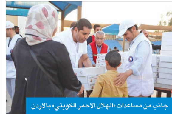
جانب من مساعدات «الهلال الأحمر الكويتي» بالأردن