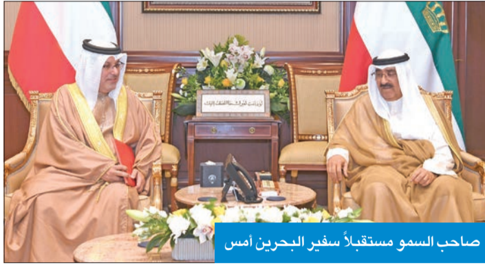
صاحب السمو مستقبلاً سفير البحرين أمس

تهنئة إلى رئيسة اليونان كاترينا ساكيلاروبولو، عبر فيها سموه عن خالص تهنائه بمناسبة العيد للوطني لبلادها.