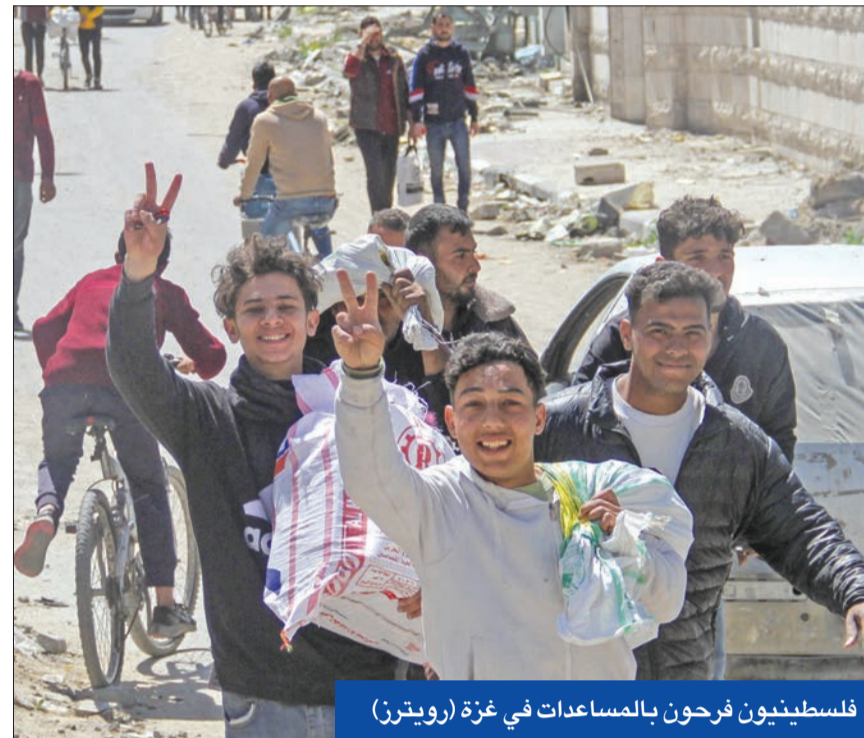
فلسطينيون فرحون بالمساعدات في غزة

قبل ساعات من تصويت مجلس الأمن على نص جديد يطالب بوقف فوري لإطلاق النار في غزة، ذكرت هيئة البث الإسرائيلية، أن المفاوضات غير المباشرة الجارية في قطر حول اتفاق لوقف إطلاق النار لمدة 6 أسابيع مقابل إطلاق سراح 40 محتجزاً إسرائيلياً وصلت إلى طريق مسدود.