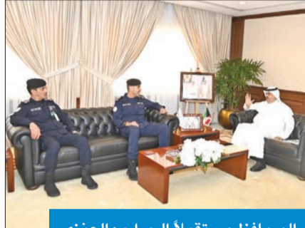
المحافظ مستقبلاً الجراح والعنزي

وهنا المحافظ العميد بنو ليهما منصبهما الجديدين وبحث معهما شؤوناً أمنية، مؤكداً ضرورة تطبيق تعليمات نائب رئيس مجلس الوزراء وزير الدفاع وزير الداخلية بالوكالة الشيخ فهد اليوسف بهدف حفظ الأمن والاستقرار وتطبيق القانون، متمنياً لهما كل التوفيق والنجاح لخدمة هذا الوطن الغالي.