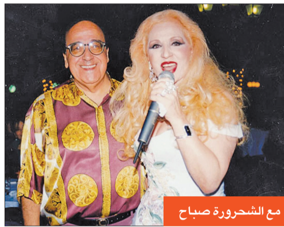
مع الشحرورة صباح

وحقق «العذاب فوق شفاة تبسّم» نجاحاً كبيراً، وبلغت تكاليف إنتاجه 33 ألف جنيه مصري، وحقق إيرادات بلغت نحو 60 ألف جنيه، واستمر عرضه لمدة 22 أسبوعاً في سينما «كايرو» بالقاهرة.