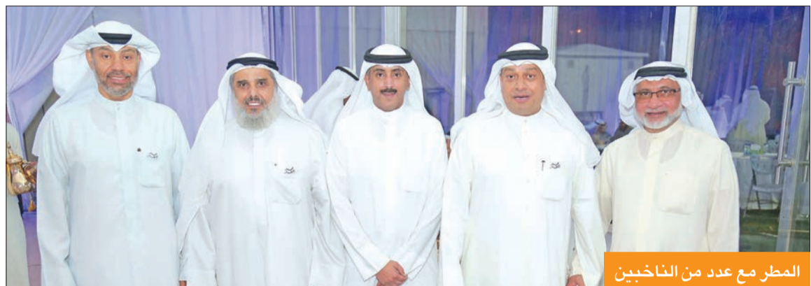
المطر مع عدد من الناخبين