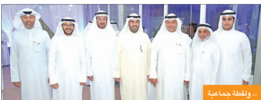
... ولقطة جماعية

رفعت شعار «التستقر» تعبيراً عن تفاؤلي... والشعب لا يتخلى عن قاعة عبدالله السالم