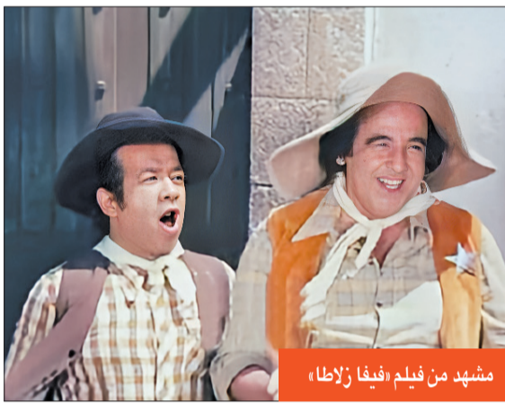
مشهد من فيلم «فيفا زلاطا»