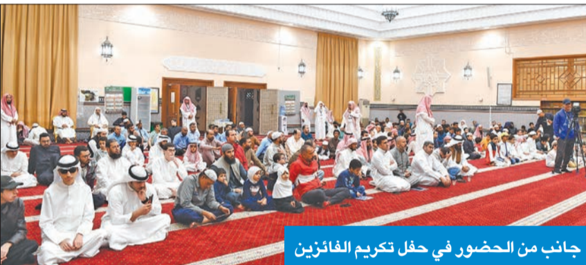
جانب من الحضور في حفل تكريم الفائزين