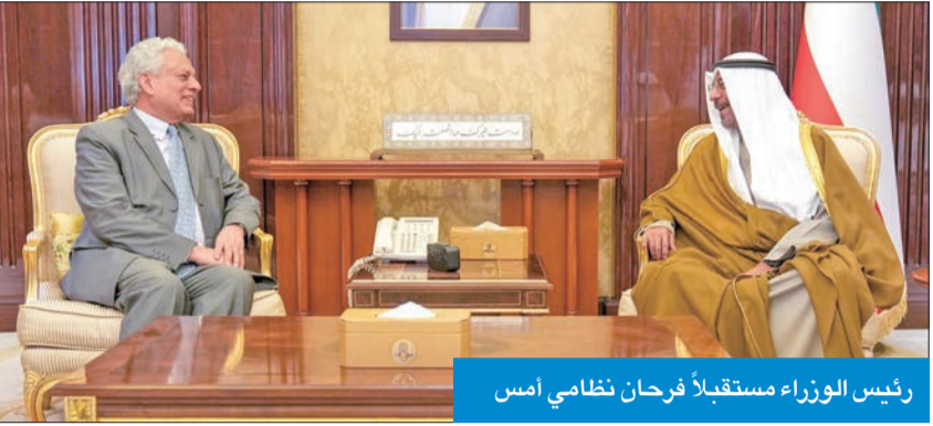
رئيس الوزراء مستقبلاً فرحان نظامي أمس

بمناسبة زيارته للبلاد. من جهة أخرى، بعث سموه ببرقية تهنئة إلى رئيسة اليونان كاترينا ساكيلاروبولو، بمناسبة العيد للوطني لبلادها.