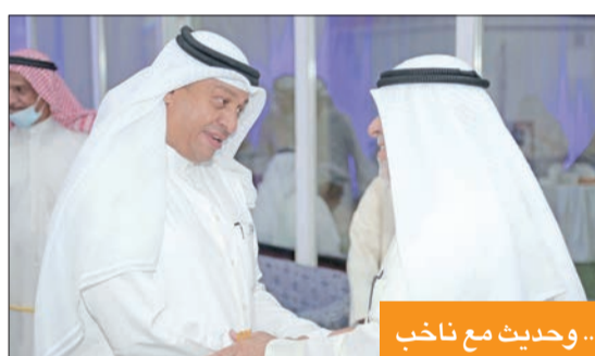
... وحدث مع ناخب