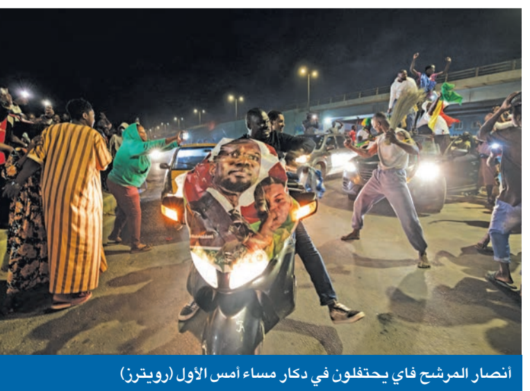
انصار المرشح فاي يحتفلون في دكار مساء أمس الأول