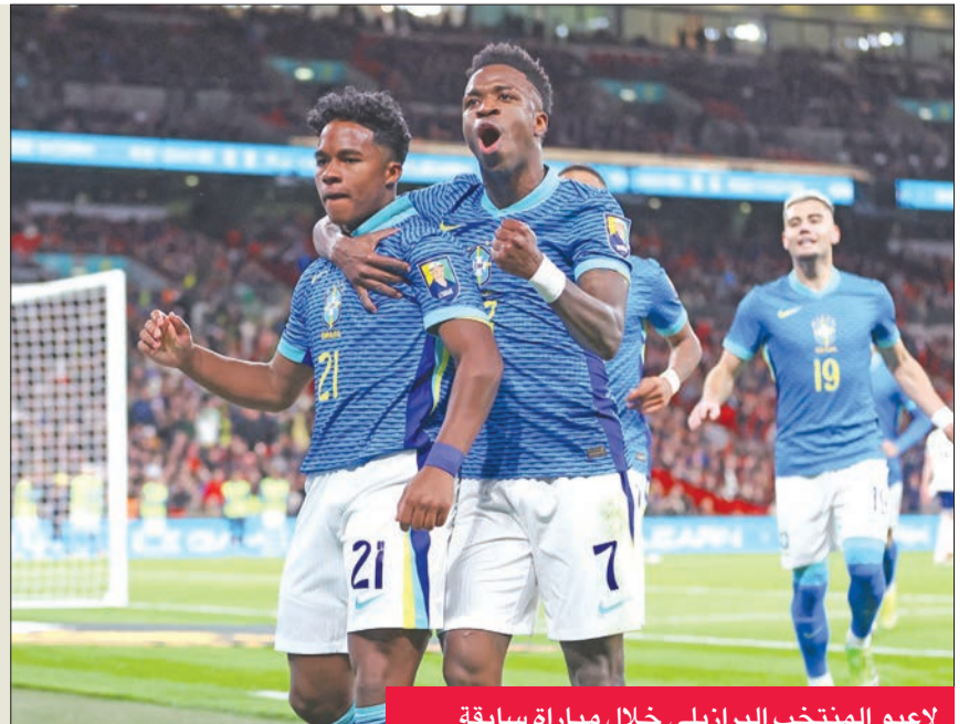
لاعبو المنتخب البرازيلي خلال مباراة سابقة

استأنف منتخب البرازيل تدريباته مباشرة عقب الفوز على منتخب إنكلترا في مقر داره بهدف نظيف سهله، الموهبة الواعدة إندريك، وذلك استعداداً للمباراة الودية الأخرى أمام إسبانيا اليوم على ملعب «سانتياغو برنابيو». وخاض «الكناري»، مرانه أمس الأول على ملاعب نادي أرسنال في ضواحي لندن، حيث أجرت المجموعة التي شاركت في الشوط الثاني من مباراة إنكلترا مراناً قوياً، بينما خاض اللاعبون الذين شاركوا منذ البداية تدريبات استشفائية، قبل أن تتجه البعثة كلها إلى العاصمة الإسبانية. وشهدت مباراة إنكلترا حدثاً خاصاً للموهبة الواعدة إندريك، الذي سينتقل إلى صفوف ريال مدريد الإسباني بداية من الموسم المقبل، الذي سجل هدف الانتصار