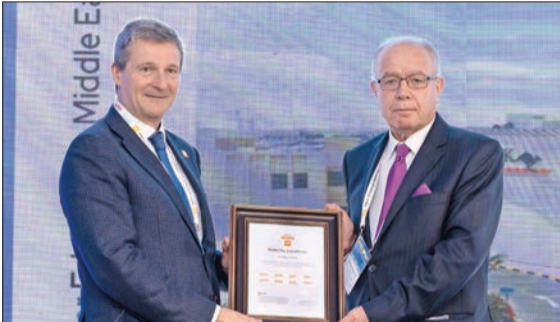
جانب من تسليم شهادة التصنيف

خضعت الجامعة الأسترالية للتدقيق والمراجعة من قبل مؤسسة التصنيف العالمية للجامعات QS، وتمت الإشارة بإنجازات الجامعة في مجالات عدة ضمن أحدث تصنيفات المؤسسة، وتمنحت المؤسسة تقديماً بخمس نجوم للجامعة الأسترالية في مجالات التعليم والتوظيف والشمولية والعلمية والتطوير الأكاديمي.