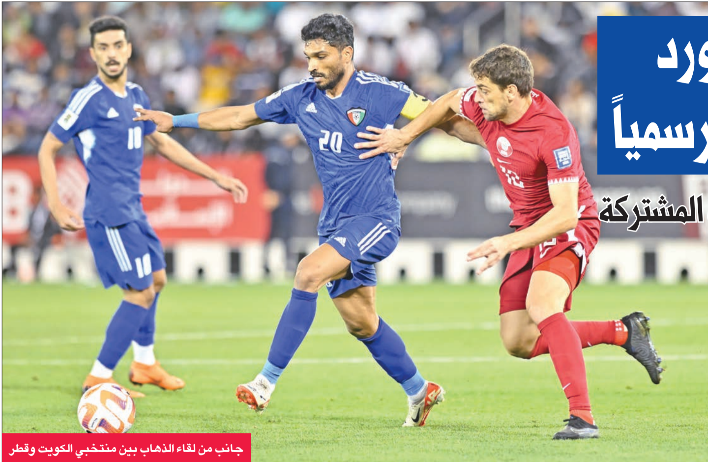
جانِب من لقاء الذهاب بين منتخبَي الكويت وقطر