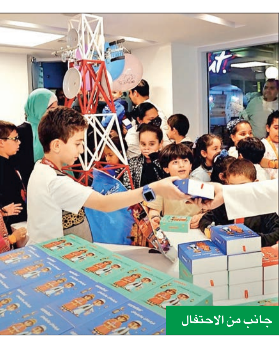
جانب من الاحتفال

تستمر شركة Ooredoo الكويت، بعادتها في تنظيم الأنشطة المخصصة للأطفال للمشاركة في المناسبات المجتمعية، لاسيما تلك المتعلقة بالعبادات التراثية الكويتية العريقة، وذلك عبر الاحتفال بالقرقيعان خلال شهر رمضان. وفي هذا العام، شاركت Ooredoo احتفالات القرقيعان مع فريق كيدزانيا، التي سعت من خلالها إلى إحياء التقاليد والحفاظ على العادات المتوارثة في الكويت، وإضفاء البهجة على قلوب الأطفال. القرقيعان هو تقليد كويتي ذو شعبية واسعة، يقوم فيه الأطفال بإرتداء الزي الشعبي، وزيارة جيرانهم، لأخذ الحلويات والمكسرات فيما يغنون الأغاني القديمة. وخلال الفعاليات التي أقيمت في نهاية الأسبوع الماضي بمقر كيدزانيا، قام فريق Ooredoo بتوزيع علب قرقيعان مزينة بشخصيات قصص الرسوم المتحركة المحبوبة. كما تخلل الفعالية مجموعة من الأنشطة الترفيهية والمسلية لجميع الأعمار. كشركة متصلة بعمق في المجتمع الكويتي،