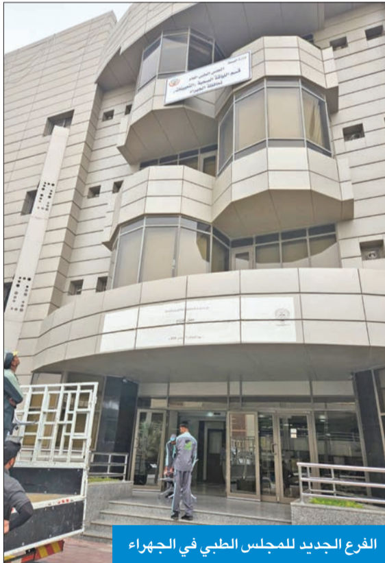
الفرع الجديد للمجلس الطبي في الجهراء

وأفادت الوزارة في بيان توضيحي لما تم تداوله بشأن وجود تسريب مياه في أحد المستشفيات، بحدوث تسريب بسيط في ممر خارجي للزوار تمت معالجته، دون أدنى تأثير على مستوى الخدمة الطبية داخل الأجنحة ووحدات العناية المركزة، وذلك بالتزامن مع تواجد فرق الشؤون الهندسية التابعة للوزارة، وتعاملها الفوري مع أي طارئ يستدعي التدخل، في جميع المناطق الصحية بالبلاد.