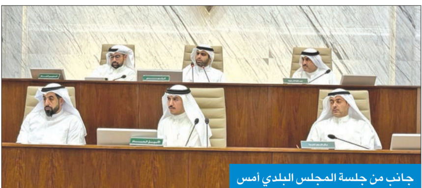
جانب من جلسة المجلس البلدي أمس

والغى «البلدي»، ضمن الجدول الجديد، السماح بعمل سردابين، لفضل السماح ببناء سرداب واحد فقط، بينما سمح ببناء مصعد ثانٍ لمساحة السكن الخاص والنموذجي 750 متراً وكبير، ومصعد خاص لذوي الاحتياجات الخاصة للسكن الخاص والنموذجي الأقل من مساحة 750 متراً، بشرط أن يكون مسجلاً لدى الهيئة العامة لذوي الإعاقة، أو مصعد خاص للطعام يربط المطبخ الرئيسي بأجزاء المنزل، كما أضاف حرية