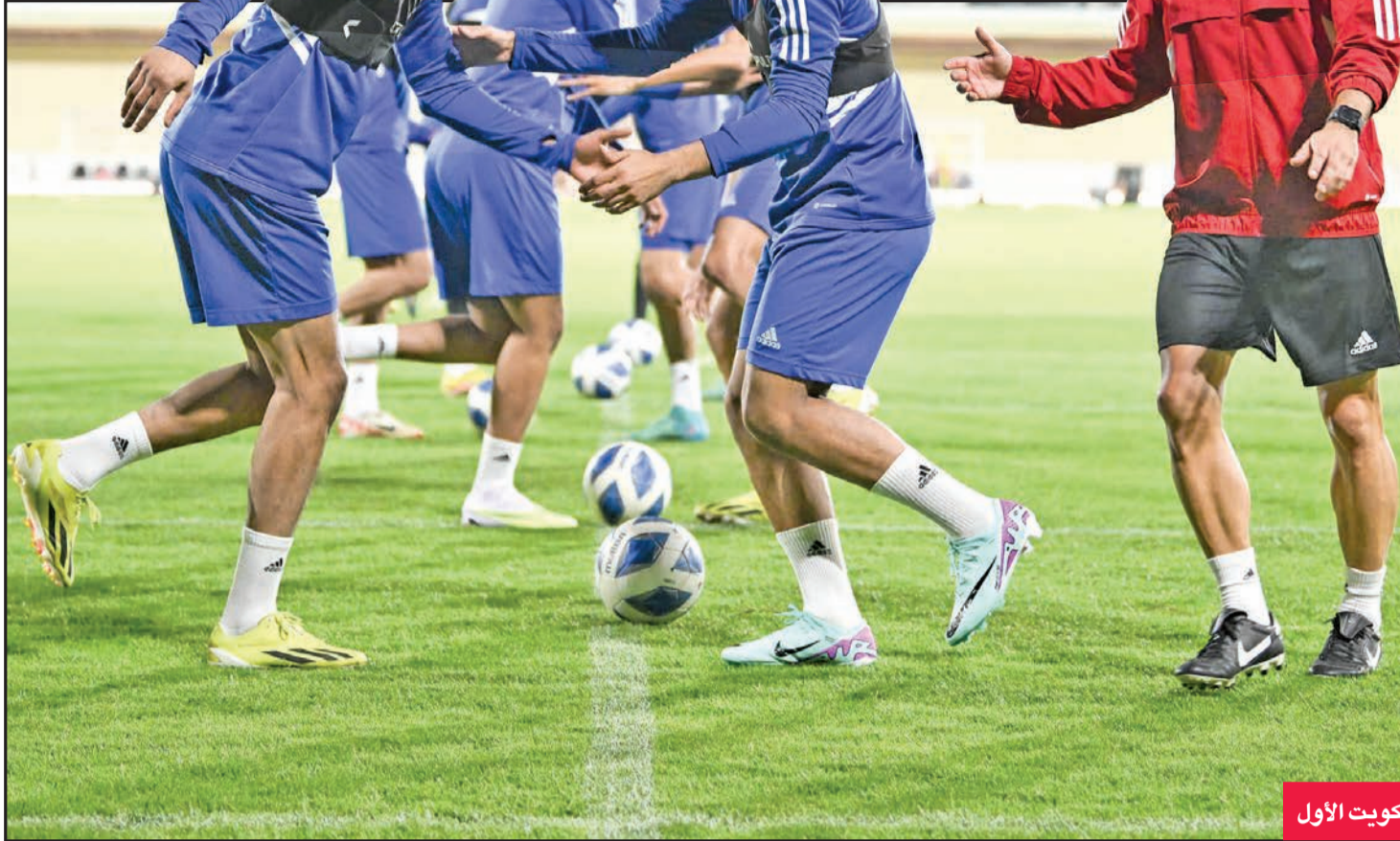
جانب من تدريب منتخب الكويت الأول