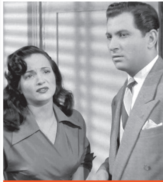
الحريري وشادية في مشهد سينمائي

«سلامة في خير»... أول ظهور سينمائي صامت مع نجيب الريحاني