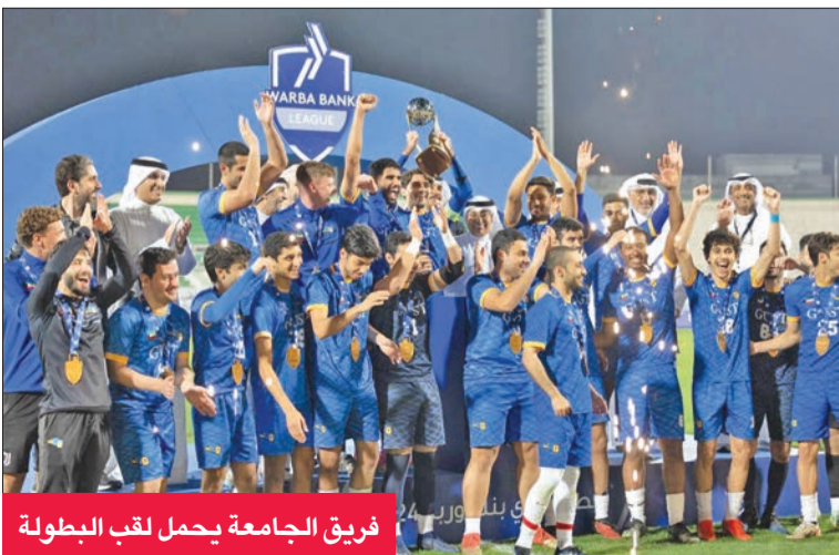
فريق الجامعة يحمل لقب البطولة

قدمه اللاعبون يضعنا أمام مسؤولية كبيرة لتطوير النسخ المقبلة وتحقيق المزيد من الإنجازات.» وقال: «نسعى أن نكون جزءاً من المسؤولية الاجتماعية بالمشاركة مع الاتحاد الرياضي المدرسي في دعم الفعاليات الرياضية الناجحة.»