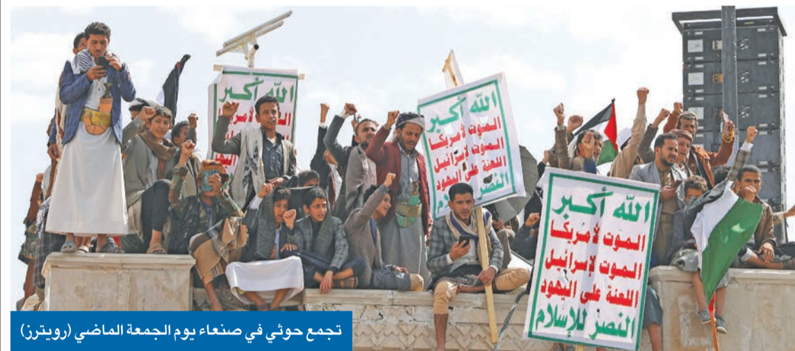
تجمع حوثى فى صنعاء يوم الجمعة الماضى

إيران تريد تكرار سيناريو اعتمده الحزب منذ تأسيسه حتى حرب 2006 بهدف تمكين الحوثيين • الحزب استضاف فى بيروت اجتماعاً بين الحوثيين و«حماس» لنقل ثقل الجبهة إلى البحر الأحمر • تراجع وتيرة العمليات العسكرية فى جنوب لبنان... ورسائل متبادلة بشأن تجنب التصعيد