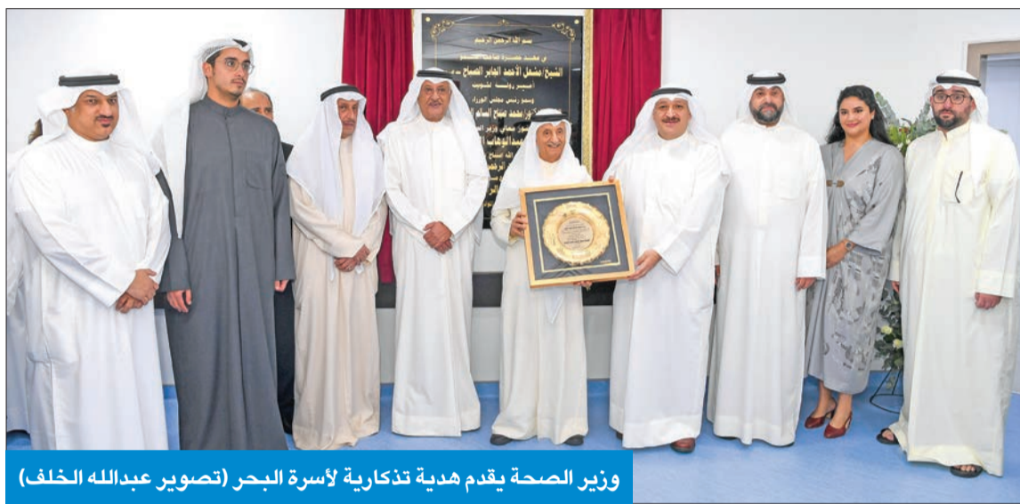
وزير الصحّة يقدم هدية تذكارية لأسرة البحر

إنجاز التوسعة يقصص قائمة انتظار الجراحات غير الطارئة من 30 إلى 14 يوماً الفودري