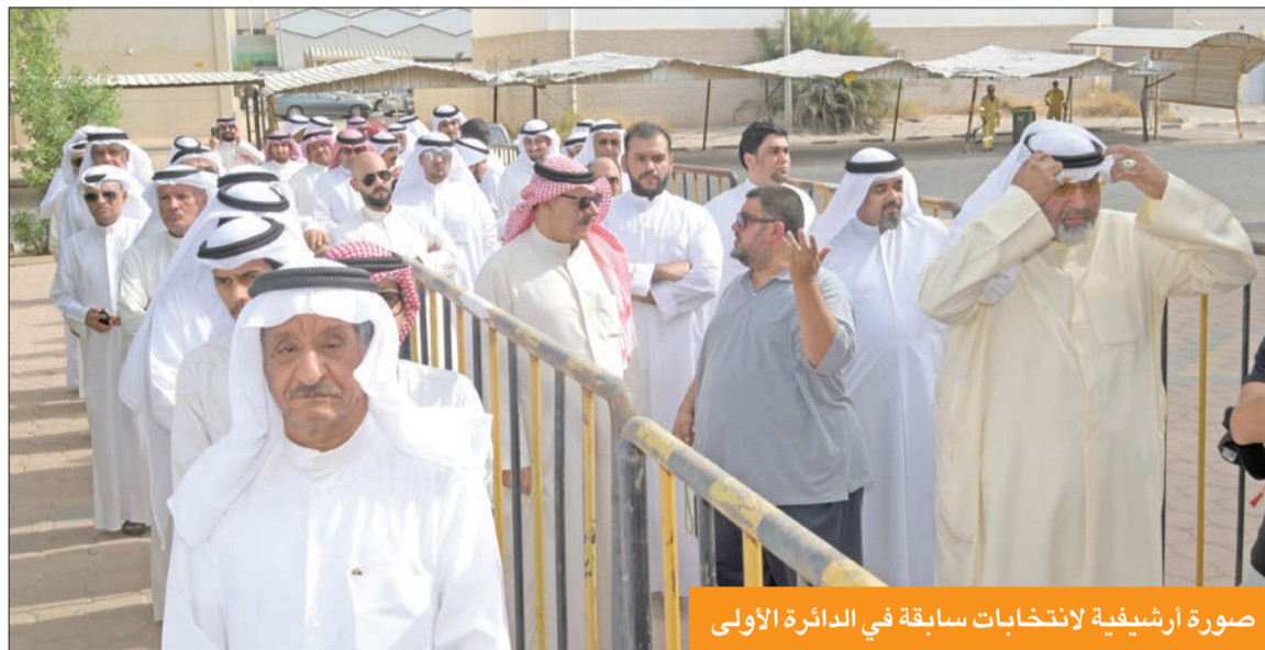
صورة أرشيفية لانتخابات سابقة في الدائرة الأولى