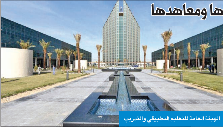
الهيئة العامة للتعليم التطبيقي والتدريب

الهيئة تدرس مقترحاً لتدشين التحاقهم بكلياتها ومعاهدها