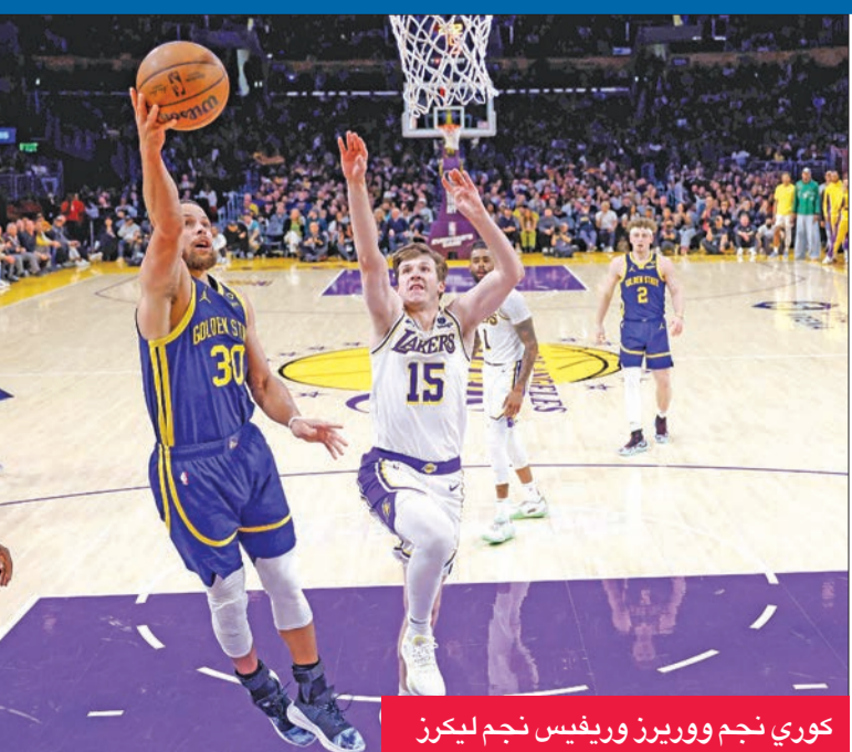
كوري نجم ووريزز وريفييس نجم ليكرز

وتألق في صفوف الفائز، كلاي تومسون من على مقاعد البدلاء مع 26 نقطة، فيما ساهم الكونغولي جوناثان كومينغا بـ 23 نقطة وديرايموند غرين بـ 12 متابعه و13 تمريرة حاسمة. نقطة أفضل لاعب في الدوري نجح في 15 رمية من اصل 23، ليكرز على كاهله بعدما عاد ديفيس إلى 12 دقيقة فقط على أرض الملعب سجل خلالها 8 نقاط وحقق 4 مسجلات وتمريرتين حاسمتين. وعلى ملعب «فيداكس فوروم» في ممفيس، سجل غالن وليامس 23 نقطة لقيادة ووريزز للفوز بـ 6 كرات حاسمة في فوز فريقه أوكلاهوما سيتي ثاندر على مضمف غرينليز 118 - 112.