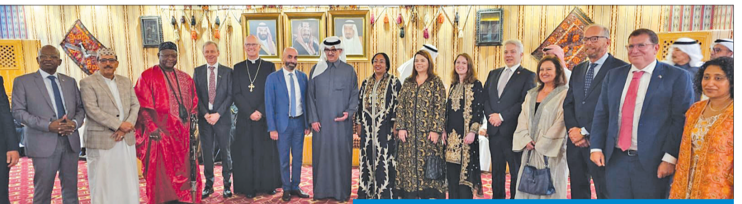
بن سعد مستقبلاً عدداً من السفراء والدبلوماسيين في ديوانية السفارة السعودية