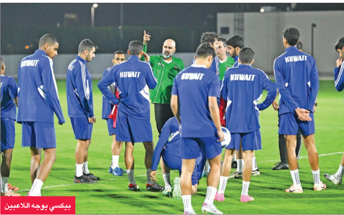
بيكسي يوجه اللاعبين

بدوره، يعمل الجهاز الإداري على تجهيز اللاعبين نفسياً للقاء، من خلال التأكيد على قدرتهم على العودة إلى البلاد