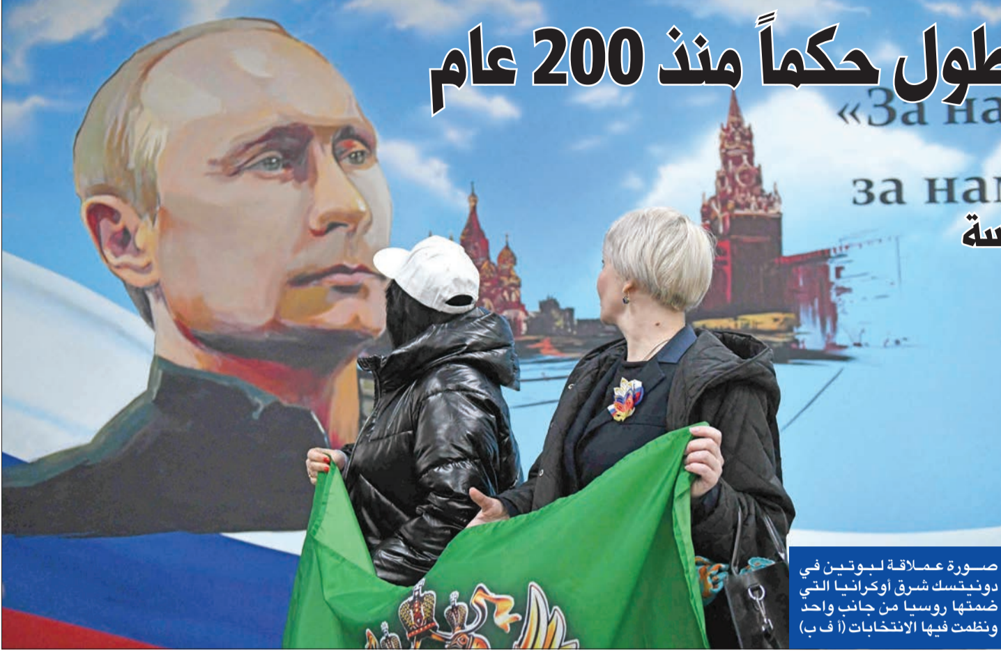
صورة عملاقة لبوتين في دونينسك شرق أوكرانيا التي ضمتها روسيا من جانب واحد ونظمت فيها الانتخابات

تداعيات الرئاسة الأميركية على أوكرانيا وتوازن الاقتصاد أبرز تحديات الولاية الخامسة