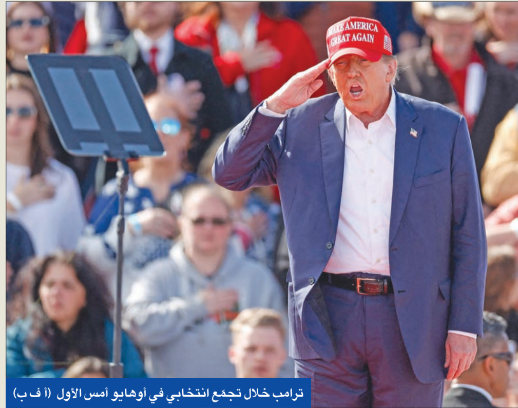
ترامب خلال تجمع انتخابي في أوهايو أمس الأول

تمتها إياه بالتخلي عن إسرائيل، وأعرب عن أسفه لما يحدث بصناعة السيارات الأمريكية من تهديدات قال إنها ستكون «أقل المخاوف» بالنسبة إلى الولايات المتحدة إذا أعيد انتخاب بايدن، وانتقد ما قال إنها «خطت صنيعةا لتكريب سيارات في المكسيك وبيعها للاميركيين»، قائلا «لن يتمكنوا من بيع تلك السيارات إذا تم انتخابي. وإذا لم يتم انتخابي، فسيشكل ذلك مجزرة (حمام دم) بحق البلاد، وهذا أقل ما في الأمر. لن يبيعوا تلك السيارات».