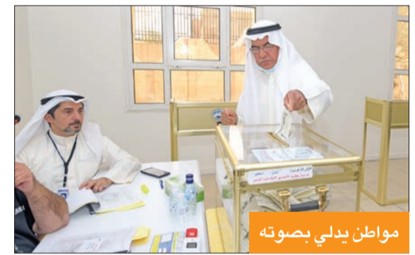
مواطن يبدي بصوته

وتأتي منطقة مشرف في المرتبة الثالثة وتشكل أيضاً 17 في المئة من إجمالي قيود الدائرة، وسجلت زيادة بـ 618 قيداً، منها 304 للذكور و314 للإناث، ليرتفع عدد ناخبها من 17238 قيداً إلى 17856، منها 8730 للذكور و9127 للإناث. وفي المرتبة الرابعة، تأتي منطقة سلوى وتشكل نحو نسبة 16 في المئة من الدائرة، وسجلت زيادة بلغت 792 قيداً منها 360 للذكور و432 للإناث،