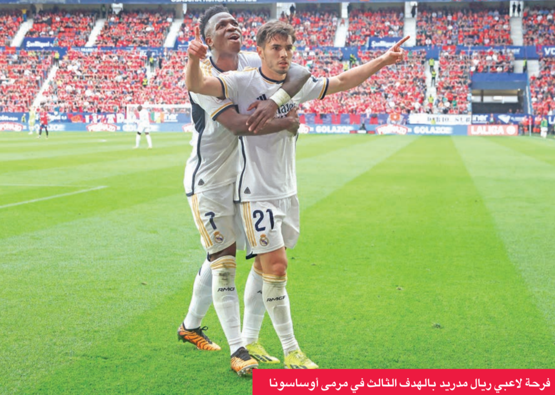
فرحة لاعبي ريال مدريد بالهدف الثالث في مرمى أوساسونا

وكان مهاجم ريال الشاب التركي اردا غولر يسجل هدفاً استعراضياً رائعاً من منتصف الملعب لكن كرتيه ارتدت من العارضة في الثواني الأخيرة عندما لمح حارس أوساسونا