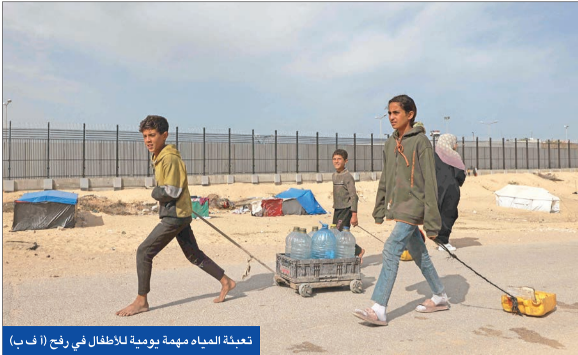
تعبئة المياه مهمة يومية للأطفال في رفح (أ ب)

العُدوان المستمر على القطاع المحاصر منذ 7 أكتوبر الماضي إلى 31 ألفاً و645 شهيدا و73 ألفاً و676 مصابا، وفق وزارة الصحة بغزة. وأعلنت هيئة البث الإسرائيلية، أمس، مقتل القائم بأعمال رئيس الأركان في حماس، مروان عيسى الأسبوع الماضي بغارة إسرائيلية، مشيرة إلى أن الحركة أكدت في محادثات مغلقة أنه بقي مدفونا تحت أنقاض النفق الذي كان فيه مع قائد لواء الأمن الإسرائيلي اقتحمت، فجر أمس، عدة مدن وبلدات واعتقلت 8 شبان، خصوصا في جنين. كما داهمت القوات الإسرائيلية أيضاً مدينة الخليل وبلدة بيت أمر وبلدة دورا، بمحاطة الخليل، واعتقلت 3 شبان بعد مصادمة منازلهم والعبث بمحتوياتها، وفق ما نقلته وكالة أنباء العالم العربي. سعت إسرائيل إلى المحافظة على 92 شهيدا و130 مصابا، وبذلك، ارتفعت حصيلة