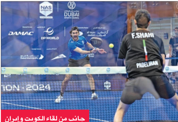
جانب من لقاء الكويت وإيران

حقق منتخب الكويت للبادل المركز الثاني لبطولة «ند الشبا» الدولية لفرق البادل، التي اختتمت منافساتها أمس الأول (السبت) في دبي، بعد خسارته النهائية بنتيجة 0-2.