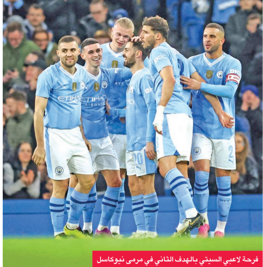
فرحة لاعبي سيتي بالهدف الثاني في مرمى نيوكاسل

حقق فريق مانشستر سيتي إنجازاً تاريخياً بعد وصوله إلى الدور قبل النهائي من نسخة الموسم الحالي ببطولة كأس الاتحاد الإنجليزي لكرة القدم. وفاز مانشستر سيتي على ضيفه نيوكاسل يونايتد 2 - 0 صفر، السبت، ضمن منافسات دور الثمانية بالبطولة، ليبلغ المربع الذهبي. وبات ذلك التأهل هو السادس على التوالي لفريق مانشستر سيتي في البطولة، ليصبح أول فريق في تاريخ كأس الاتحاد الإنجليزي يحقق ذلك الإنجاز. ومنذ موسم 2018 - 2019 إلى الموسم الجاري، تأهل مانشستر سيتي للدور قبل النهائي، وفاز باللقب مرتين وخرج من الدور قبل النهائي ثلاث مرات.