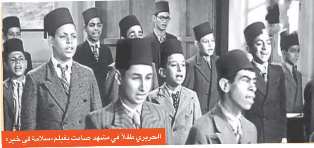
الحريري طفلا في مشهد صامت بفيلم «سلامة في خير»

وبعد سنوات، كشف الحريري سر رفضه العمل مع عميد المسرح العربي خلال لقاء جمعه بالفنانة صفاء أبو السعود في إحدى حلقات برنامج «ساعة صفا»، والأزمة بدأت حين عمل معه في مسرح الدولة، وكان وهبي مديرا للمسرح القومي، لكنه ترك منصبه للعمل منفردا بعيدا عن مسرح القطاع العام، ورفض الحريري العمل في فرقة