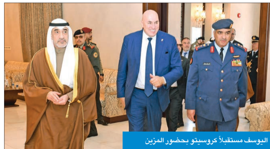
اليوسف مستقبلاً كروسيو بحضور المزين