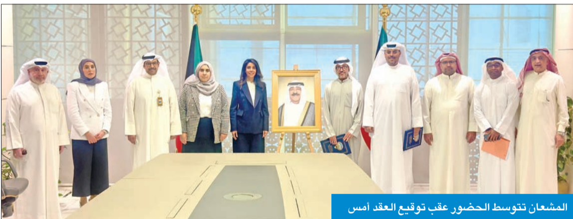
المشعان تتوسط الحضور عقب توقيع العقد أمس

أكبر المصانع على مستوى العالم، والأكبر على مستوى دول الخليج العربية، والذي يهدف إلى تخفيف الحمل البيئي والحفاظ على الموارد الطبيعية وتقليل هدر مساحات كبيرة من الأراضي المستخدمة في ردم النفايات، والتي تقدر يومياً بـ1000 طن، إضافة إلى توفير مصادر بديلة للطاقة من خلال استرجاع الطاقة (Heat Recovery) بواسطة الوقود المصنع من النفايات (RDF) والتقليل من حجم النفايات في المرادم واستبدالها بمنظومة بيئية حديثة لمعالجة النفايات البلدية الصلبة.