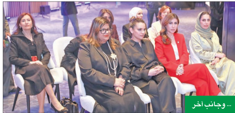
... وجانب آخر

10 - مشاركات من بنك الكويت الوطني الكويت.