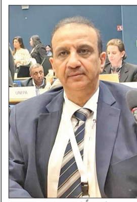
الحمد مشاركاً في المنتدى

المثال ما قام به الصندوق الكويتي للتنمية الاقتصادية العربية الذي عمل وساهم في مشاريع لأكثر من 104 دول حول العالم في مجالات الطاقة والمياه والبيئة والبنى التحتية. وبين أنه ستعقد في الكويت خلال مايو المقبل بالتعاون ما بين الهيئة العامة للبيئة في الكويت و«اسكوا» الورشة الإقليمية الـ 17 لبناء القدرات لمفاوضات تغير المناخ في المنطقة العربية. وكشف أن ثمة اتفاق بين وزارة الخارجية الكويتية ولجنة اسكوا لتقديم ورش تدريبية للدبلوماسيين العاملين في وزارة الخارجية في مجالين الدبلوماسية الاقتصادية وتغير المناخ.