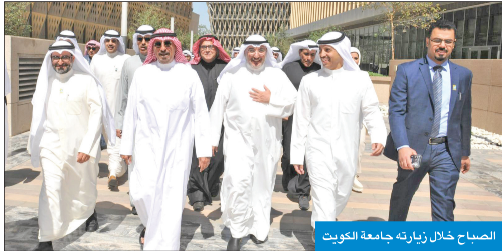
الصباح خلال زيارته جامعة الكويت

وذكر أنه «خلال زيارتنا لسلطنة عمان، تم افتتاح مشروع كويتي - عماني يعد من أهم مصفاة التكرير مطل على بحر العرب وخليج عمان، وهو من المشاريع الرائدة على مستوى العالم، ويشكل ارتباطاً آماليا لاستخدام النفط الكويتي، من خلال إصدار مواد متطورة من البتروكيماوية». ولفت إلى أنه «تم كذلك مع الاخوة في البحرين وفي قطر وفي الإمارات لتعزيز هذه الشبكة من المجلات وليس فقط على المستوى السياسي، بل على المستوى الأمني والاقتصادي في كل المجالات وهذه رؤية صاحب السمو».