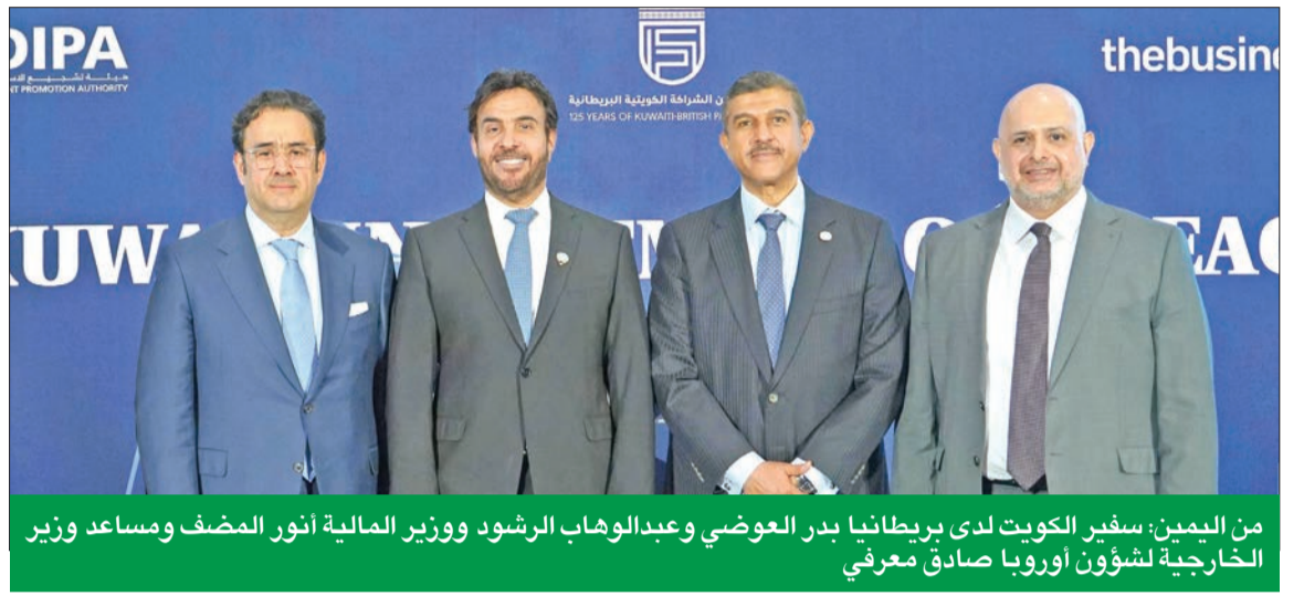
من اليمين: سفير الكويت لدى بريطانيا بدر العوضي وعبد الوهاب الرشود ووزير المالية أنور المضاف ومساعد وزير الخارجية لشؤون أوروبا صادق معرفي

ولفت إلى أن مشاركة «بيتك» في ملتقى الكويت للاستثمار، هي خطوة مهمة تعزز مكانة بيتك كأكبر بنك إسلامي في العالم، وتؤكد على التزام بيتك بالابتكار والتحول الرقمي في التمويل الإسلامي، واهتمامه بالقطاعات الناشئة كالأمن السيبراني والذكاء الاصطناعي.