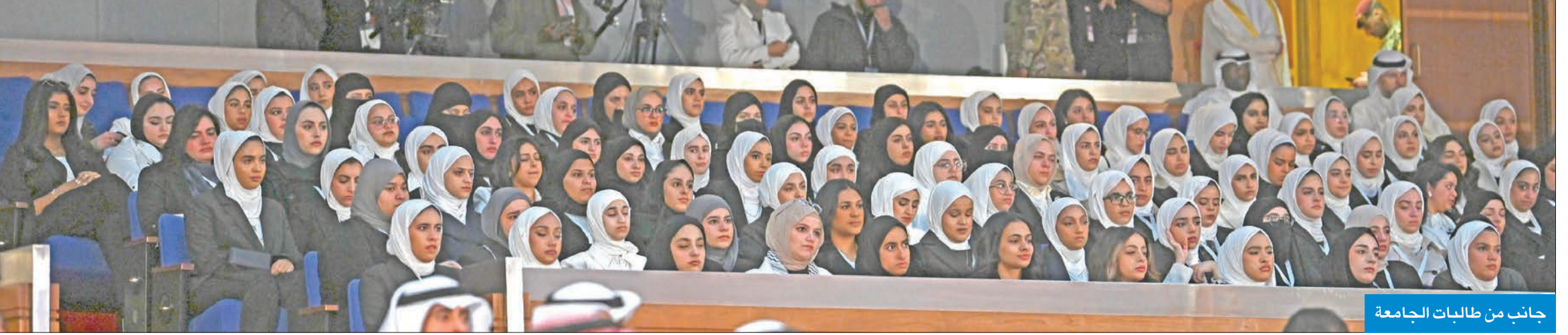
جانب من طالبات الجامعة

اللوحه الجدارية إيداناً بافتتاح الجامعة. وتم تقديم هدية تذكارية إلى سموه بهذه المناسبة، ليغادر سموه بعدها مكان الحفل بمثل ما استقبل به من حفاوة وتقدير.