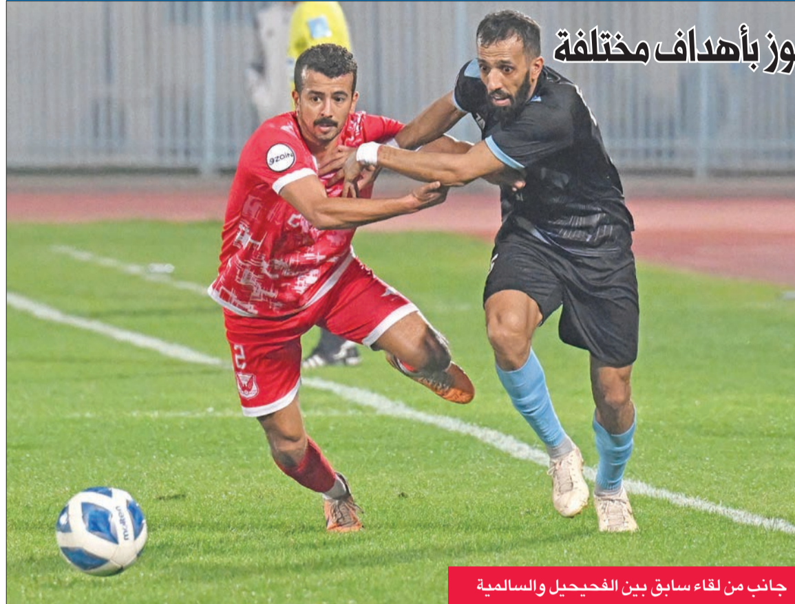
جانب من لقاء سابق بين الفحيحيل والسالمية

خالد رأس الحربة الصريح ابتداء من اليوم. ويشهد تشكيل الفريق لراس الحربة الصريح، حيث يستخدم المشعان ما يُعرف برأس الحربة الوهمي، والذي أكد للجميع أن إحرار الأهداف بات وهماً.