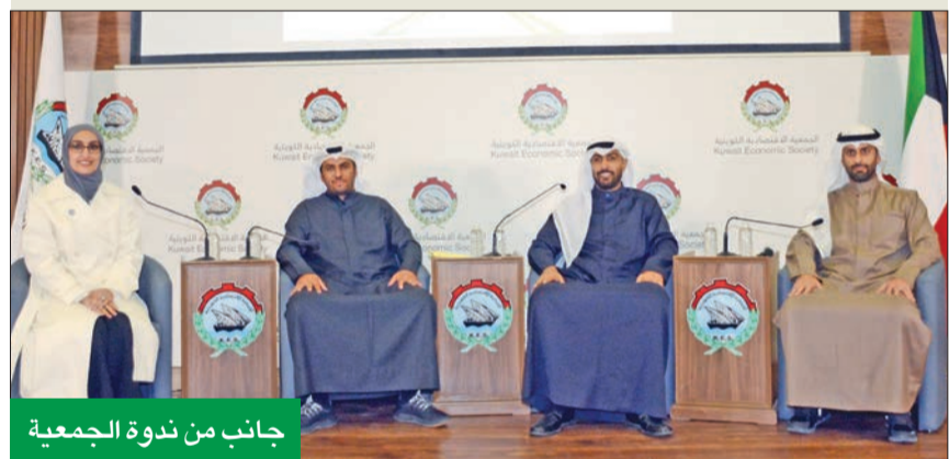
جانب من ندوة الجمعية