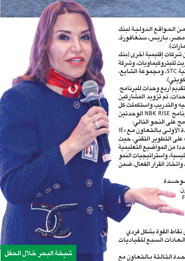
شيخة البحر خلال الحفل

6 - مشاركات من المواقع الدولية لبنك الكويت الوطني (مصر، باريس، سنغافورة، البحرين، لندن، الإمارات). 5 - مشاركات من شركات إقليمية أخرى (بنك بركان، وشركة إيكويت للبروكلماويات، وشركة الاتصالات الكويتية STC، ومجموعة الشايح، والبنك التجاري الكويتي). وتم التحضير لتقديم أربع وحدات للبرنامج وبالتوازي مع الوحدات، تم تزويد المشاركين بورش عمل للتوجيه والتدريب واستكمل كل المشاركين في برنامج NBK RISE الودعتين الأوليين من البرنامج على النحو التالي: • ركزت الوحدة الأولى بالتعاون مع IE Business School، على التطوير التقني، حيث تلقت المشاركات عددا من المواضيع التعليمية مثل: التوجهات الرئيسية، واستراتيجيات النمو والإبداع والابتكار، واتخاذ القرار الفعال، ضمن أمور أخرى.