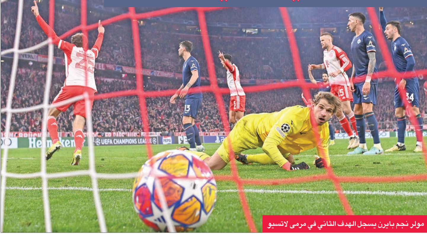
مولر نجم بايرن يسجل الهدف الثاني في مرمى لاتسيو

وغير معتادة، إذ فاز مرة واحدة في آخر خمس مباريات، مما دفع إدارته إلى إعلان رحيل توكحل في نهاية الموسم. بعد أن أصبحت أماله في الحفاظ على لقب البوندسليغا للعام