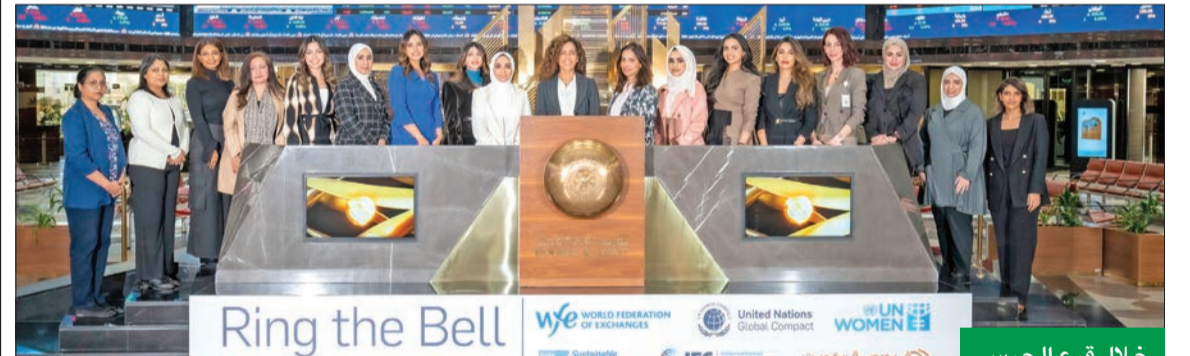
خلال قرع الجرس

انضمت بورصة الكويت إلى أكثر من 100 بورصة عالمية بمبادرة قرع الجرس لتمكين المرأة للسنة السابعة على التوالي، وذلك يأتي احتفاءً باليوم العالمي للمرأة. وتؤكد هذه المبادرة، التي تنظمها الهيئة العامة للأموال المتحدة للمرأة بالمشراكة مع الاتحاد العالمي للبورصات حول العالم، الدور الحاسم الذي يمكن أن تقوم به البورصات في تحقيق أهداف الأمم المتحدة للتنمية المستدامة. وتفخر بورصة الكويت بأنها أول بورصة في الخليج تنضم إلى هذه المبادرة، وبأنها ثاني بورصة في الشرق الأوسط قرع الجرس لتمكين المرأة. ويقام حفل هذا العام بعنوان «الاستثمار في المرأة... تسريع التقدم»، لتأكيد وتعزيز الانضمام لاصوات النساء والاحتفاء