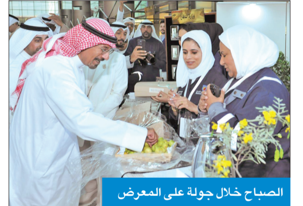
الصباح خلال جولة على المعرض

وذكر أنه «تم تكليف فريق من الشباب للعمل على استرداد كل