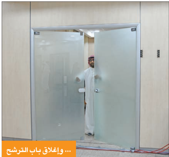
... وإغلاق باب الترشح