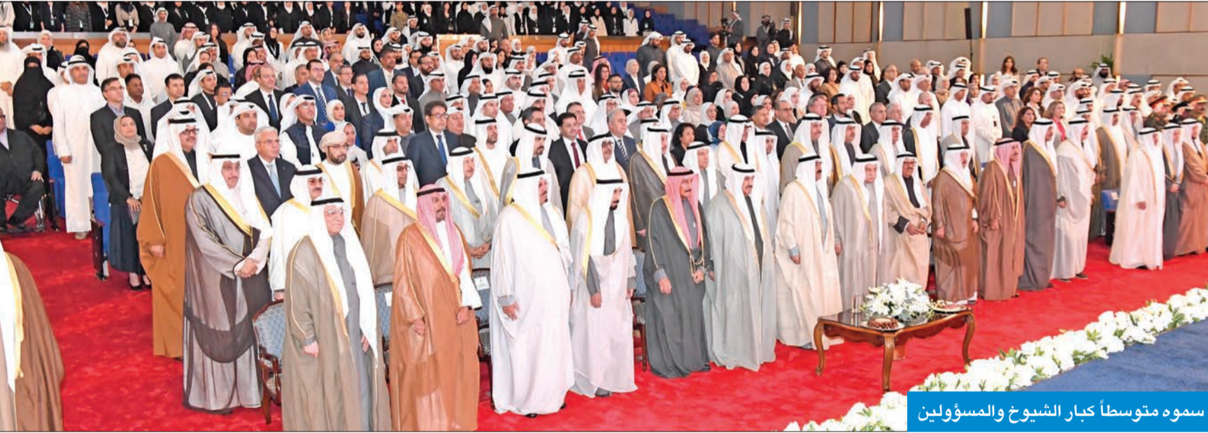
سموه متوسطاً كبار الشيوخ والمسؤولين