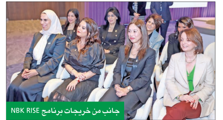
جانب من خريجات برنامج NBK RISE

وفي كلمتها خلال الحفل قالت البحر: «بعد نجاح برنامج NBK RISE بمنزلة شهادة على تفاني بنك الكويت الوطني في مساعيه نحو تمكين المرأة وتعزيز إمكاناتها القيادية، فمع تخريج الدفعة الأولى من هذا البرنامج المميز، تضع هذه المبادرة الأساس لمستقبل تلعب فيه المرأة دوراً بارزاً بشكل متزايد في تشكيل مشهد الأعمال».