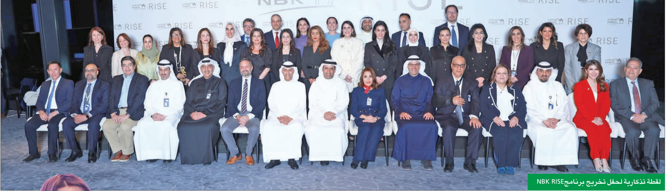
لقطة تذكارية لحفل تخريج برنامج NBK RISE

البحر: المبادرة العالمية مجرد بداية في رحلة نستهدف بها دعم قائدات المستقبل