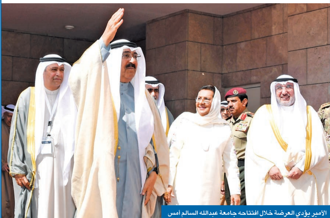
الأمير يؤدي العرضة خلال افتتاحه جامعة عبدالله السالم أمس

سموه رعى افتتاح جامعة عبدالله السالم على طريق استثمار الثروة البشرية