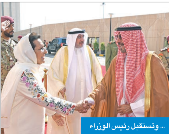
... وتستقبل رئيس الوزراء