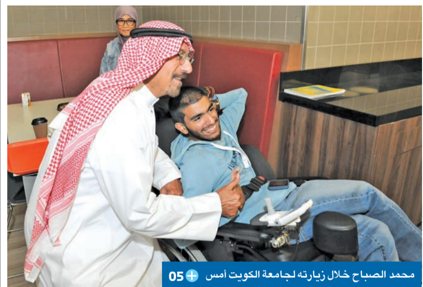
محمد الصباح خلال زيارته لجامعة الكويت أمس 05

● إحالة «صندوق الجيش» للقضاء دليل على تطبيق القانون على الجميع ● قدمنا بلاغاً جديداً بشأن اعتداء مكاتب عسكرية على الأموال العامة ● بكل ثقة ستتحول إلى أفق أجمل من خلال رؤية الأمير بنقل الكويت للأفضل