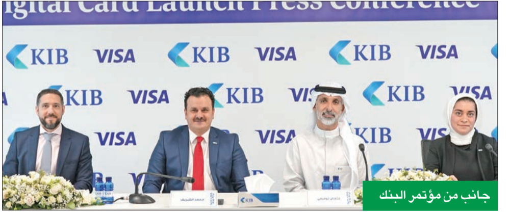
جانب من مؤتمر البنك

البطاقات مصممة لتجربة سفر استثنائية وأمنة