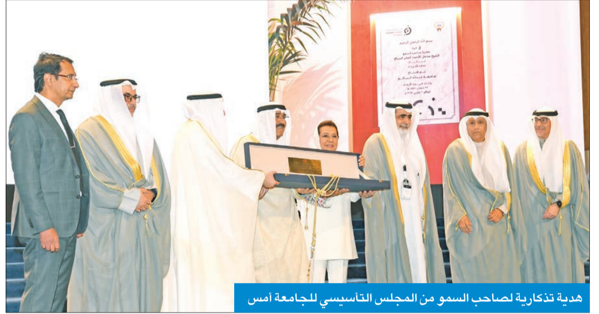
هدية تذكارية لصاحب السمو من المجلس التأسيسى للجامعة أمس