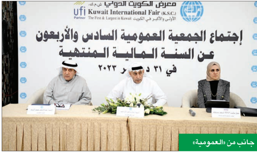
جانب من «العمومية»

الى مستويات فنية وإدارية عالية الأداء، وأظهرت قدرات من الثبات المالي والتشغيلي، واستمرار المحافظة على الجودة والمواصفات التي تتمتع بها معارضنا، والالتزام