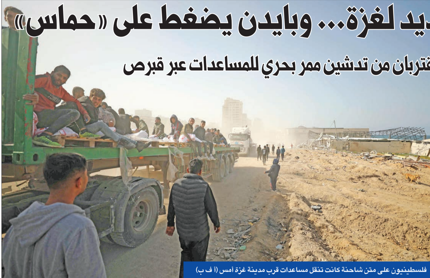
فلسطينيون على متن شاحنة كانت تنقل مساعدات قرب مدينة غزة أمس

وجاء موقف الحركة فيما كشفت صحيفة «وول ستريت جورنال»، أمس، أن الوسطاء اقترحوا هدنة قصيرة لمدة أيام في غزة، كخطوة لبناء الثقة والتوصل لاتفاق أطول.