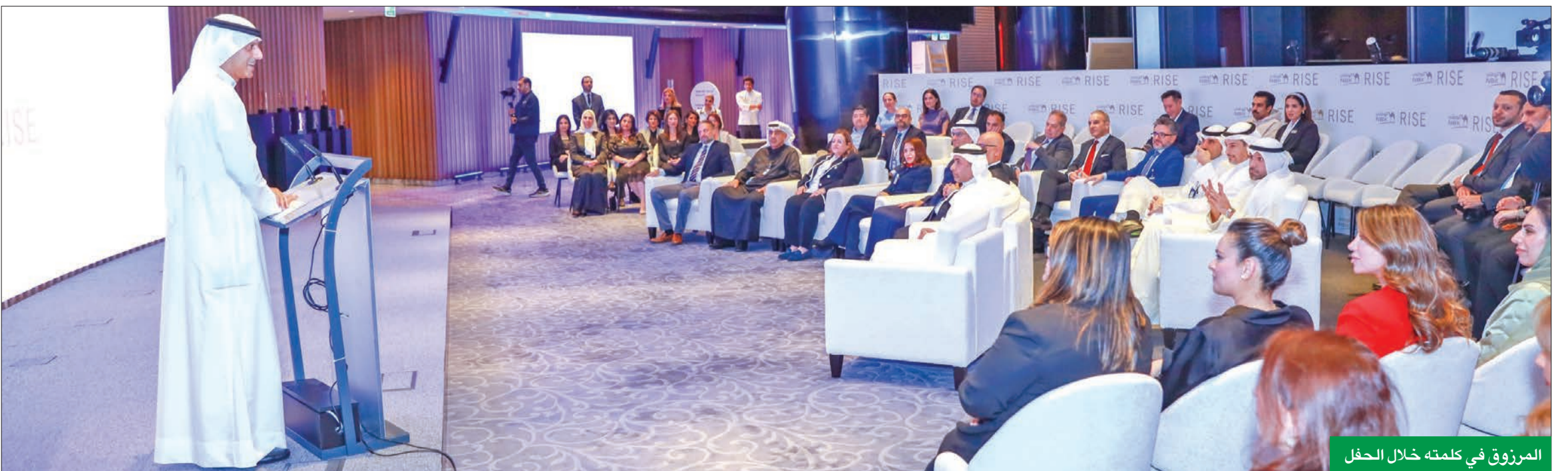
المرزوق في كلمته خلال الحفل