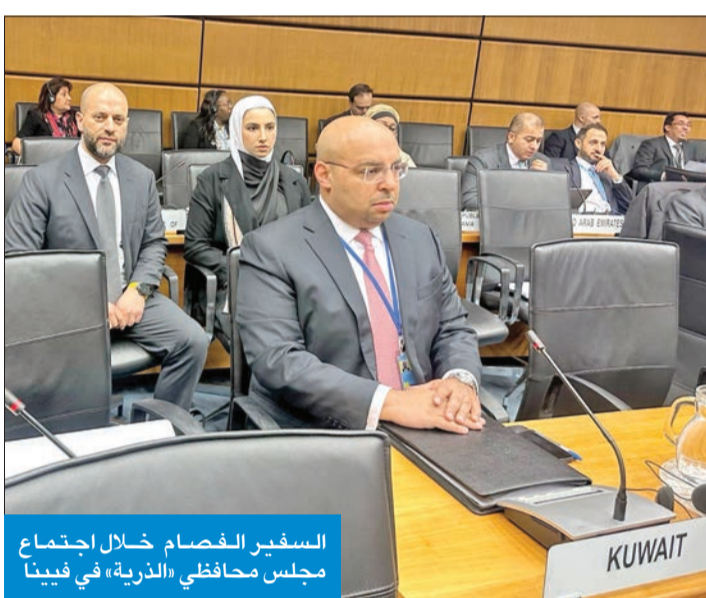
السفير الفصام خلال اجتماع مجلس محافظي «الذرية» في فيينا

الذي أصدرته الوكالة حول إيران قائلًا «إن التقرير يؤكد مجدداً تأثير عمليات التحقق والرصد التي تقوم بها الوكالة منذ توقف إيران بتاريخ 23 فبراير 2021 عن تنفيذ التزاماتها المتعلقة بالمجال النووي بموجب خطة العمل الشاملة المشتركة بما في ذلك بروتوكول التفتيش الإضافي». وذكر أن التقرير أشار كذلك إلى أنه وبسبب قرار إيران بإزالة جميع معدات الوكالة التي تم تركيبها سابقاً من أجل أنشطة المراقبة والرصد المتعلقة بخطة العمل الشاملة المشتركة «فقدت الوكالة إمكانية الحصول على المعلومات المتعلقة بإنتاج وجرّد أجهزة الطرد المركزي والدورات والمنايفخ والماء الثقيل». وشهد الاثنين الماضي انطلاق أعمال مجلس محافظي الوكالة الدولية للطاقة الذرية في فيينا حيث ألقى المدير العام للوكالة رافائيل غروسي كلمة افتتاحية أشار ضمنها إلى أن مخزون إيران من اليورانيوم المخصب زاد «بشكل ملحوظ» على الرغم من انخفاض مستوى اليورانيوم المخصب بنسبة تصل إلى 60 في المئة بشكل طفيف. وذكر غروسي أنه مرّت ثلاثة أعوام