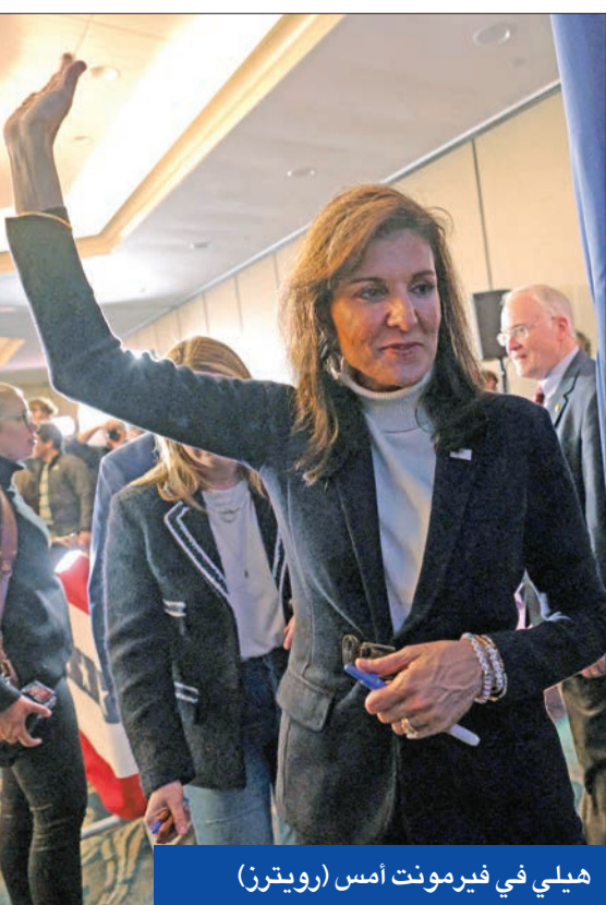
هيلي في فيرمونت أمس

ويمكن ترامب من الفوز في 14 من 15 ولاية، هي الاباما والاسكا وأركنسو وكولورادو وكاليفورنيا وماين وماساتشوستس ومينيسوتا وكارولينا الشمالية ووكلاهوما وتينيسي وتكساس وفيرجينيا ويوتا،