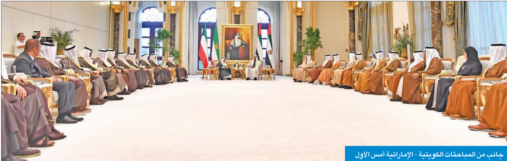
جانب من المباحثات الكويتية - الإماراتية أمس الأول

أهمية التزام العراق باتفاقية تنظيم الملاحة البحرية في خور عبدالله