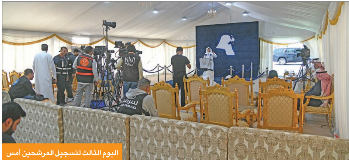
اليوم الثالث لتسجيل المرشحين أمس