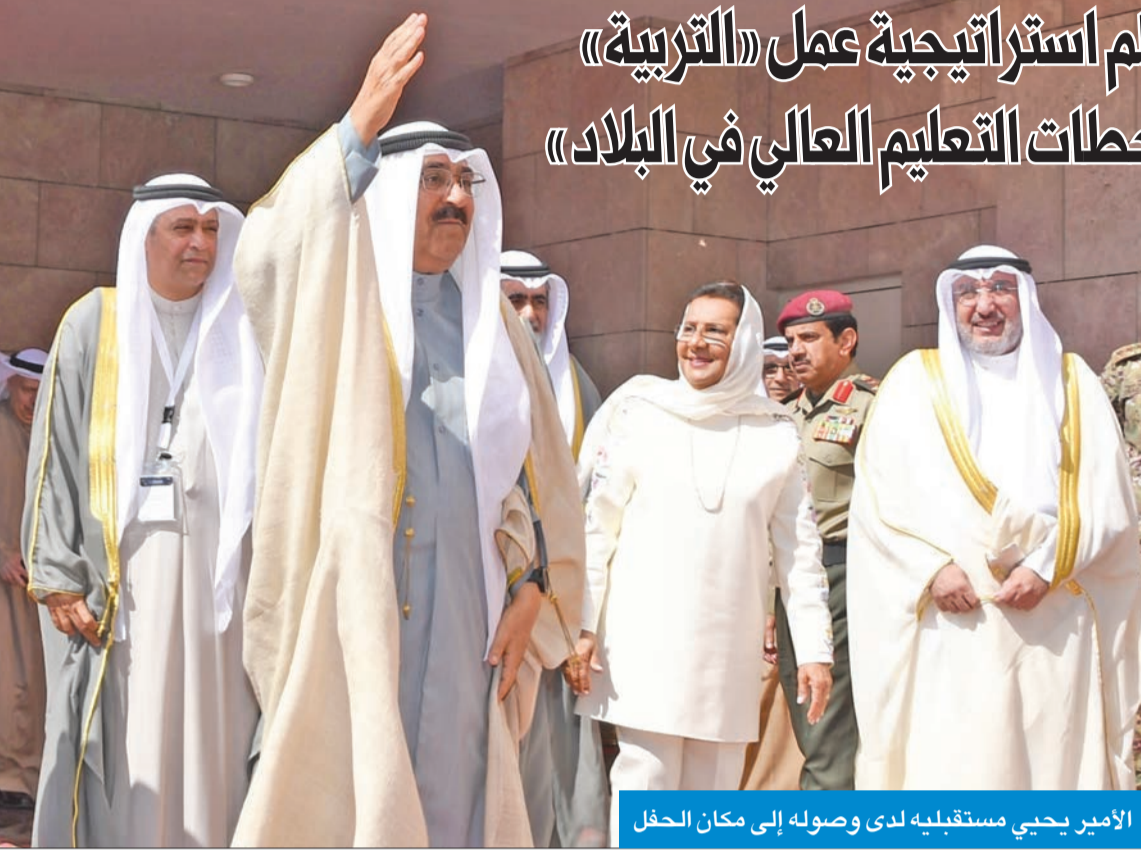
الأمير يحيى استقباله لدى وصوله إلى مكان الحفل

● العدوانى: بناء رأس المال البشري وإصلاح التعليم ضمن سلم استراتيجى عمل «التربىة» ● «افتتاح الجامعة مشهد وطنى تاريخى ومحنة مهمة من محطات التعليم العالى فى البلاد»