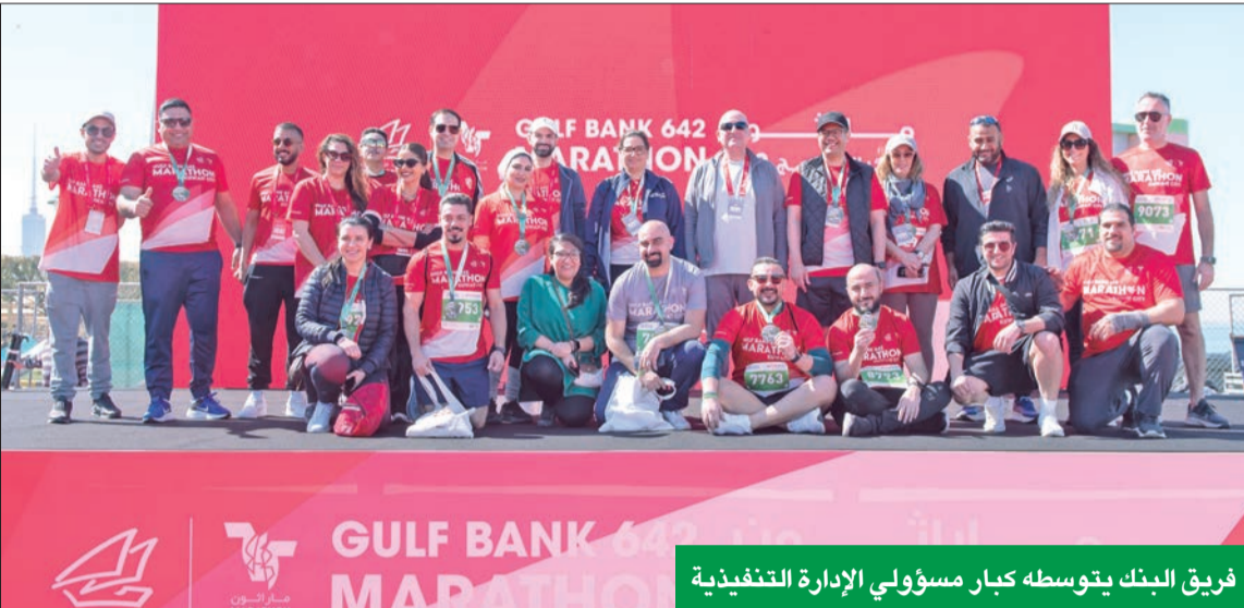
فريق البنك يتوسطه كبار مسؤولي الإدارة التنفيذية

بحضور ومشاركة وزير الشباب والإدارة التنفيذية في البنك