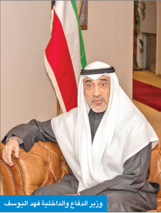
وزير الدفاع والداخلية فهد اليوسف

وقال اليوسف، في مقابلة مع «كونا» نشرتها أمس، إنه ماض قدماً في المهام الموكلة لوزارتي