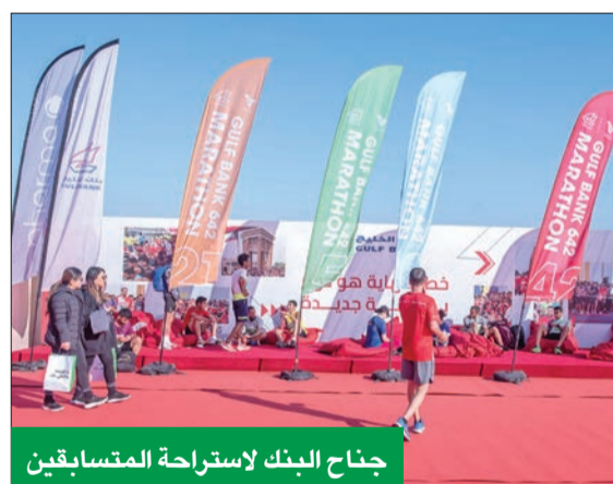
جناح البنك لاستراحة المتسابقين

ويتكون ماراتون بنك الخليج هذا العام من فئات