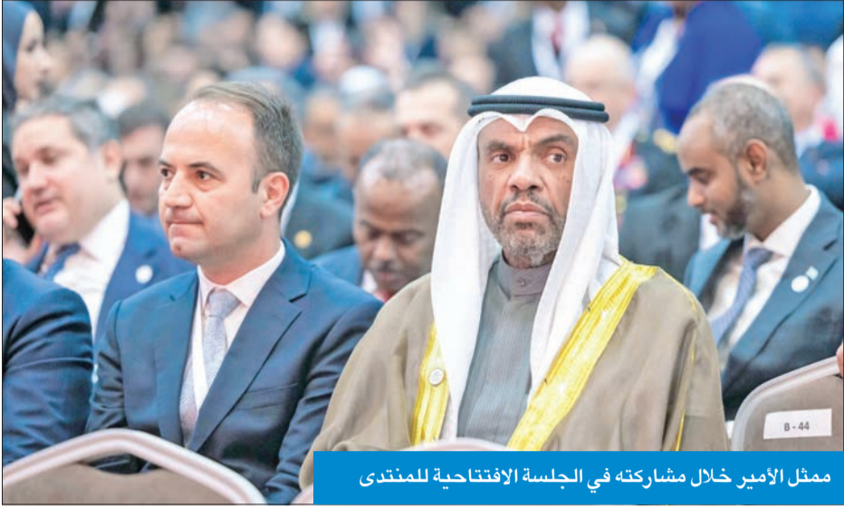
ممثل الأمير خلال مشاركته في الجلسة الافتتاحية للمنتدى