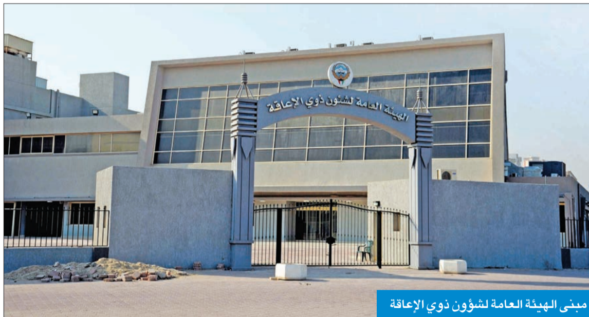
مبنى الهيئة العامة لشؤون ذوي الإعاقة

علمت «الجريدة» من مصادرها أن الهيئة العامة لشؤون ذوي الإعاقة لم تنجز حتى الآن التقايم السنوية لموظفيها جراء إشكالية تقنية حالت دون ذلك، لافتة إلى أن ثمة اجتماعاً، عقد الأسبوع الماضي، بين قياديي الهيئة ومسؤولين في ديوان الخدمة المدنية لإيجاد حلول سريعة لهذه الإشكالية، ليتسنى سحب التقايم الباقية وإنجازها قبل نهاية السنة المالية. وأكدت المصادر، أن الهيئة تعمل على قدم وساق للانتهاء من إنجاز التقايم لتتمكن من صرف مكافآت الأعمال الممتازة للموظفين المستحقين قبل نهاية رمضان، إضافة إلى إنجاز الترقية بالاختيار، موضحة أن التقايم حسب وفق النسبة السنوية الحاصل عليها الموظف كالاتي: 54 في المئة واقل (ضعيف)، ومن 55 إلى 74