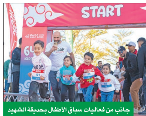
جانب من فعاليات سباق الأطفال بحديقة الشهيد

ضمن مساعي بنك الخليج للتفاعل والتواصل مع الجمهور والعملاء، شهد جناح البنك على هامش الماراتون العديد من الأنشطة والفعاليات، التي استقطبت الكثير من المشاركين.