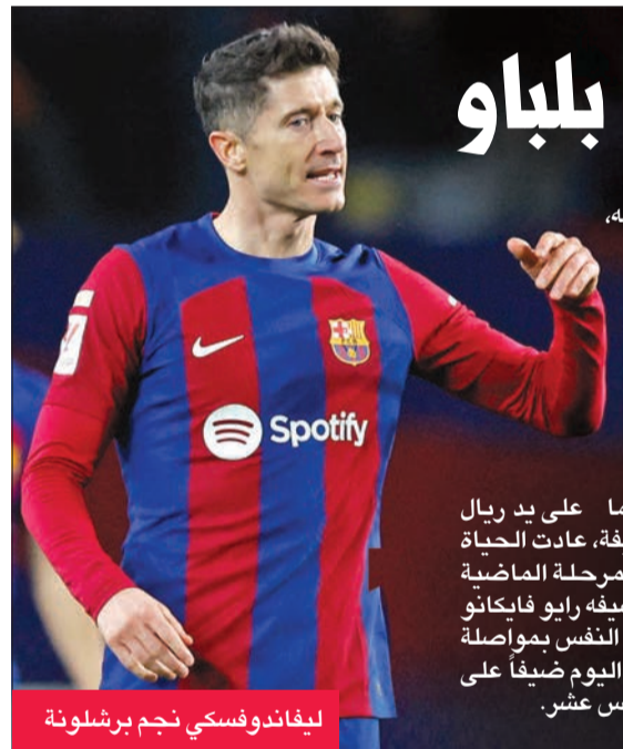
ليفاندوفسكي نجم برشلونة

النهائي، بعدما فاز ذهاباً أيضاً 0-1، وذلك بفضل الشقيقتين إينياكي ونيكو ولياس اللذين سجلا الهدفين الأولين بتمريرة حاسمة أيضاً لكل منهما. ويُعرف برشلونة تماماً حجم المهمة التي تنتظره في سان ماميس، حيث خرج من ربع نهائي الكأس بالخسارة أمام فريق مدرّبه السابق إرنستو فالغويردي 2-4 بعد التمديد في 24 يناير. وقبل التفكير في النهائي، سيكون تركيز بلباو منصبا على مواجهته مع برشلونة، لإسما أنه يقاتل من أجل المركز الرابع الأخير المؤهل لدوري الأبطال، حيث لا يتخلف إلا بفارق ثلاث نقاط عن أتلتيكو مدريد الطامح