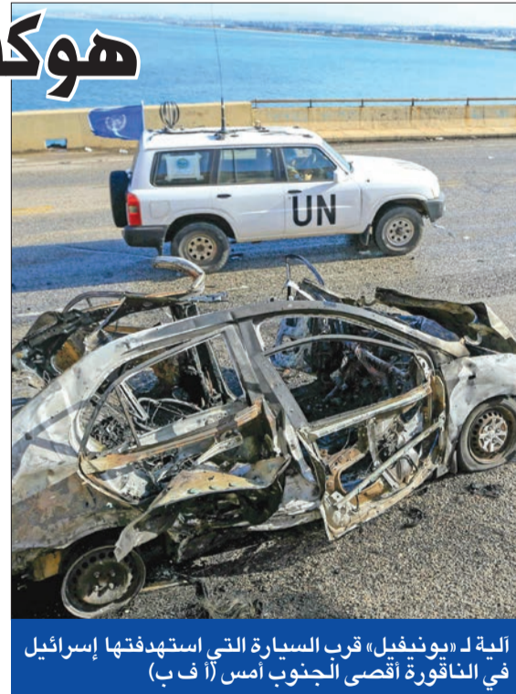
ألية لـ «يونيفيل» قرب السيارة التي استهدفها إسرائيل في التاقورة أقصى الجنوب أمس

بمقابلة الملف اللبناني الإسرائيلي، وعقدوا اجتماعات مع المسؤولين هناك في سبيل البحث عن تخفيف التوتر. وتكشف مصادر متابعه أن هؤلاء المسؤولين نقلوا رسائل واضحة إلى لبنان بأن الأحوال في إسرائيل تصعب أكثر سلبية وأن مهلة الوصول إلى اتفاق سياسي بدأت تضيق جداً، خصوصاً أن الإسرائيليين غير قادرين على تحمل استمرار المواجهات واستمرار تهجير سكان المستوطنات الشمالية بدون القيام بأي ردة فعل. المعلومات إلى أن الإسرائيليين يعبرون عن استياء كبير من الضغط الذي يتعرضون له من سكان هذه المستوطنات وقد يكونون أمام خيار الأمر بتنفيذ عمليات واسعة في لبنان لتبرير القدرة على إنجاز أي اتفاق يعيد السكان إلى منازلهم. وتضيف المصادر، أن الرسائل التي نقلت تشير إلى أن تل أبيب مصرة على تحقيق أهدافها إما بالسلم وعبر المفاوضات الدبلوماسية وإما بالحرب، وأن خيار الحرب