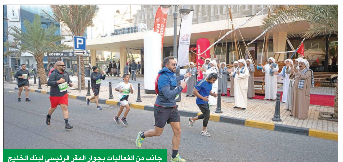
جانب من الفعاليات بجوار المقر الرئيسي لبنك الخليج