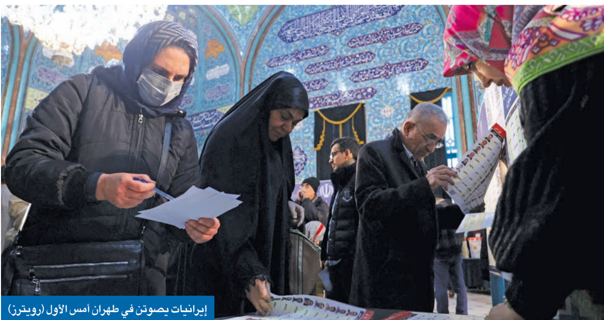
إيرانيات يصوتن في طهران أمس الاول

رغم دعوات المرشد الأعلى علي خامنئي الإيرانيين إلى تخييب أسال الأعداء والتصويت بكثافة في الانتخابات التي عدّها «واجباً شرعياً»، أغلقت صناديق الاقتراع ليل الجمعة. السبت في انتخابات مجلسي الشورى (البرلمان) وخبراء القيادة، على أدنى نسبة مشاركة منذ الثورة الإسلامية عام 1979. ورغم تمديد فتح صناديق الاقتراع ساعتين إضافيتين، أوردت وكالة أنباء فارس، أن نسبة المشاركة بلغت نحو 41 في المئة، وهو ما أكدته وزارة الداخلية أمس، أي بنسبة تقل عن الانتخابات السابقة قبل أربع سنوات، حين أدلى 42.57 في المئة من الناخبين بأصواتهم، وكان هذا أدنى معدل منذ إعلان الجمهورية الإسلامية. وقالت مصادر مطلعة في الوزارة لـ «الجريدة»، إن نسبة المشاركة الحقيقية لا تتعدى 21 في المئة، موضحة أن 50 في المئة من المشاركين صوتوا عبر الورقة