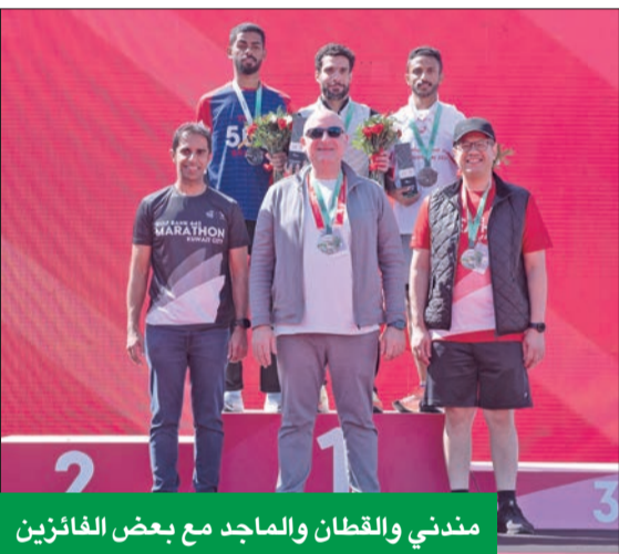
مندني والقطان والماجد مع بعض الفائزين

تم تصميم الماراتون ومساره لتشجيع المشاركين على قضاء هذا اليوم العائلي الممتع، حتى وإن كانوا من غير ممارسي الرياضة بشكل منظم، حيث يطلق بنك الخليج «ماراثون بنك الخليج 642» للعام التاسع على التوالي، التزاماً منه بتعزيز الاستدامة المجتمعية في البلاد.