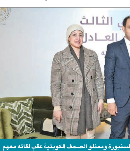
السنيرة وممثلو الصحف الكويتية عقب لقائه معهم

والتابع السنيرة، بالرد على سؤاله عن العلاقات اللبنانية مع دول الخليج، قال: «الوضع السني بحاجة إلى جهد إضافي من أجل تعزيز الوضع الوطني بلبنان، والقصة ليست قصة الشنة، علماً بأن السنة في لبنان، حسب مفهومه الشخصي للامور، هناك واجب ودور يجب أن يلعبه السنة في لبنان، لكن دون أن يوليهم هذا الدور أي ميزة على زملائهم في الوطن، وهذا الدور طبيعي وأجبه يقومون به، ولبنان بين كل الدول العربية هو الذي لديه دستور مدني وليس طائفياً»، مستطرداً: «شيل الممارسة على جنب».