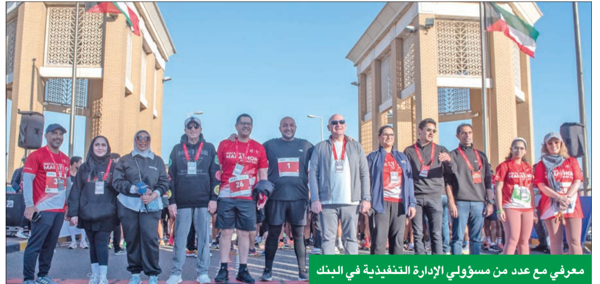
معرفي مع عدد من مسؤولي الإدارة التنفيذية في البنك