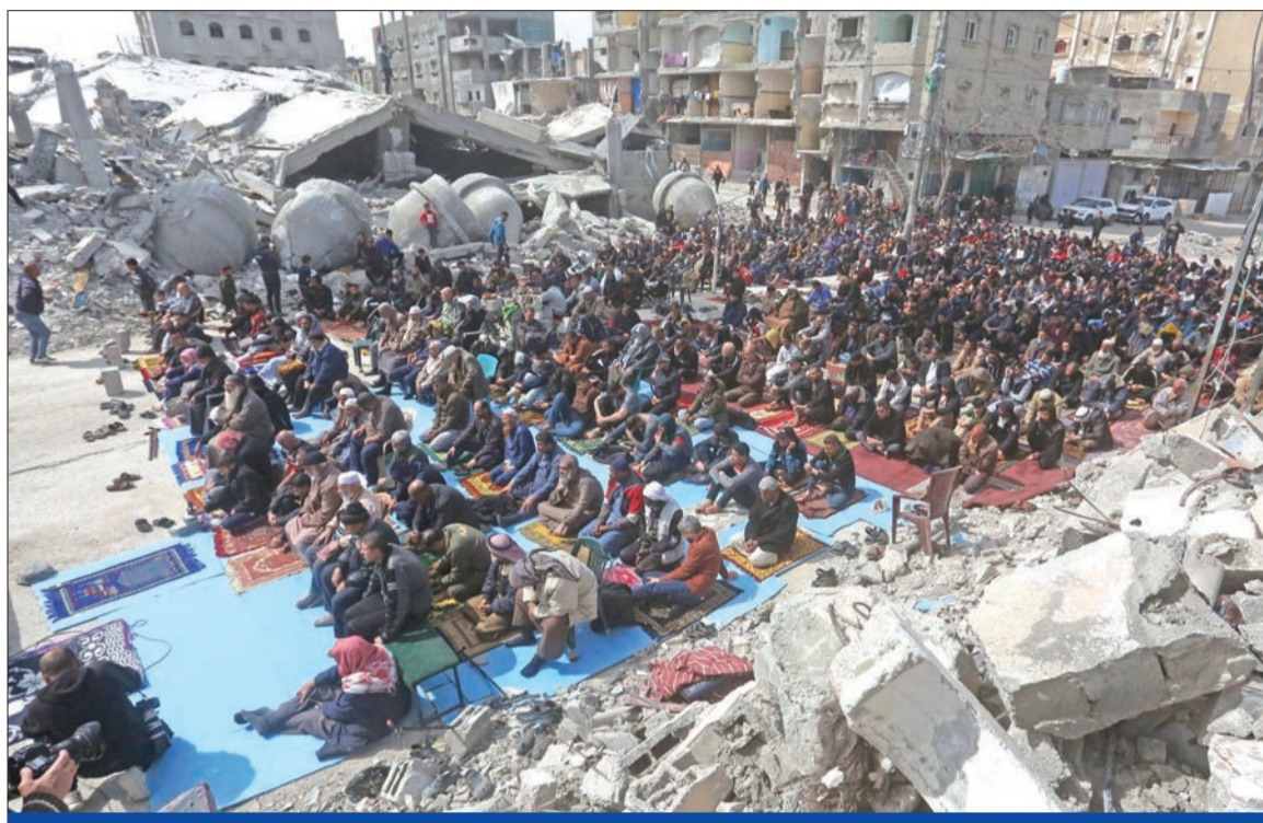
فلسطينيون يستمعون لخطبة الجمعة بمحيط مسجد مدمر جراء الغارات الإسرائيلية في رفح أمس الأول

وهي منظمة التحرير» وتابع: «نريد حكومة تتعامل مع التحديات القائمة ومع المجتمع الدولي، ونحاول قدر الإمكان أن نصل إلى توافق على حكومة تكنوقراط مرجعيتها الرئيس الفلسطيني محمود عباس. وأوضح الوزير: «الفترة المقبلة ستشهد مزيداً من الحوارات الفلسطينية الداخلية بشأن الوصول للانتخابات»، مشيراً إلى أن «الظروف موافقة للاتفاق الداخلي، ونلمس مسؤولية من الجميع».