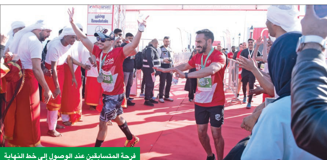
فرحة المتسابقين عند الوصول إلى خط النهاية