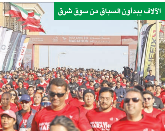
الآلاف يبدؤون السباق من سوق شرق