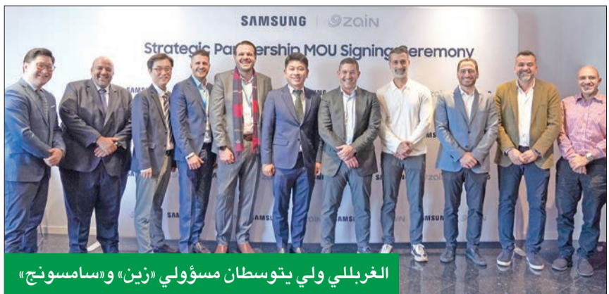
الغربي ولي بتوسطان مسؤولي «زين» و«سامسونج»

على هامش أعمال المؤتمر العالمي للاتصالات MWC في برشلونة