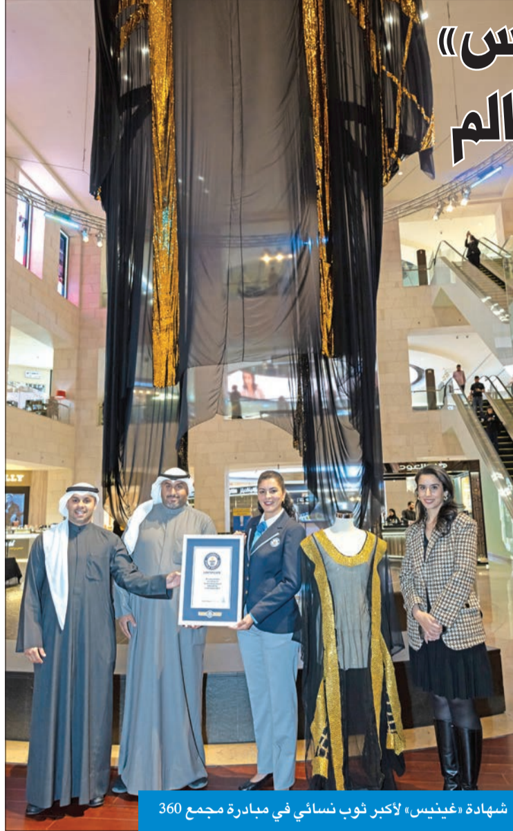
شهادة «غينيس» لأكبر ثوب نسائي في مبادرة مجمع 360