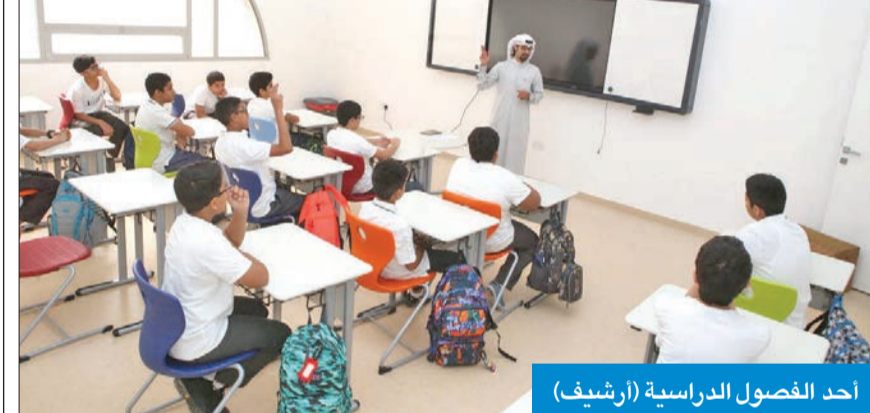
أحد الفصول الدراسية (أرشيف)

بدأية العام الدراسي الجديد يتجاوز الـ 11 مدرسة في مختلف المراحل الدراسية، لتقديم الخدمات التعليمية لقاطني هذه المناطق.