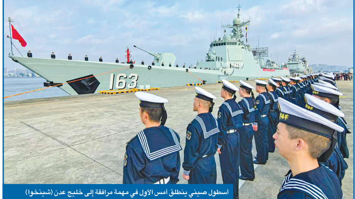
اسطول صيني ينطلق أمس الأول في مهمة مرافقة إلى خليج عدن

واشنطن قلقة من تقارير بشأن تسليح إيراني للجيش السوداني