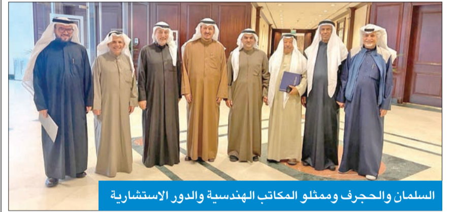
السلمان والحجرف وممثلو المكاتب الهندسية والدور الاستشارية

أشاد رئيس اتحاد المكاتب الهندسية والدور الاستشارية الكويتية م. بدر السلمان بتعاون وزير الكهرباء والماء والطاقة المتجددة وزير الدولة لشؤون الإسكان د. سالم الحجرف، لافتاً إلى سرعة تجاوبه للقاء المكاتب الهندسية والدور الاستشارية الكويتية، وبحث عدد من القضايا المهنية ذات العلاقة بتعزيز دورها في تنفيذ المشاريع والإشراف عليها.