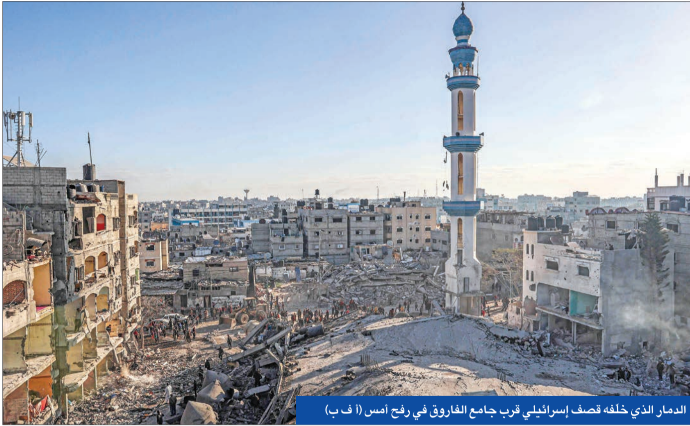
الدمار الذي خلفه قصف إسرائيلي قرب جامع الفاروق في رفح أمس

قُتل جندي إسرائيلي وأصيب 11 في هجوم بإطلاق النار شبه 3 مهاجمين فلسطينيين عند حاجز عسكري على مشارف شرق القدس، بالقرب من مستوطنة معاليه أدوميم، مما عزز مخاوف من انفجار كبير بالضفة الغربية مع قرب حلول رمضان، في حين أفادت تقارير بتلحين «حماس» موقفاً بشأن صفقة التبادل والهدنة في غزة.