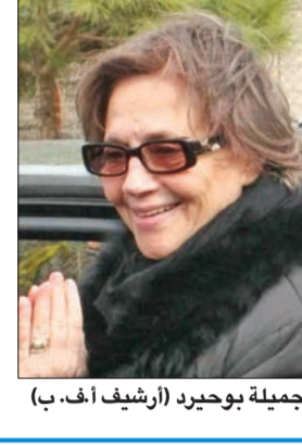
جميلة بوحيرد

تفاعلاً مع كتاب «مركز البحوث يوثق لتاريخ الدعم الكويتي للثورة الجزائرية»، الذي نشر أمس، وصلت إلى «الجريدة» مجموعة صور نادرة لزيارة المناضلة جميلة بوحيرد ولقائها رئيس دائرة المعارف المرحوم الشيخ عبدالله الجابر، وزيارتها للكويت وللمرحوم الأمير الشيخ عبدالله السالم في الستينيات. وزارت بوحيرد، أمس، سفارة الكويت بالعاصمة الجزائرية، والتقت عميد السفراء المعتمدين السفير محمد الشيو، الذي أطلعها على النسخة الإلكترونية من الكتاب الذي أعده د. بشير فايد، حيث أبدت تقديرها ودعمها لدور الكويت في دعم بلادها والعلاقات التي تربطها بالأمير الراحل الشيخ عبدالله السالم والكويت.