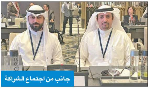
جانب من اجتماع الشراكة

هيئة التدريس، والمصلحة العامة للكليات التطبيقية، مبينا أنه تم التطرق إلى آخر مستجدات عمل اللجنة الوزارية المختصة. وحول تفعيل النظام الجديد للساعات الإضافية، أوضح الصفيقي أنه تبين للرابطة أن سبب تأخير اعتمادها يرجع لعدم اجتماع مجلس ديوان الخدمة من تاريخ إقرارها في ديسمبر 2023، مما انعكس على جمود جميع الاستحقاقات المالية لمختلف الجهات الخاضعة للديوان. وأشار إلى أن الرابطة طالبت بتسريع وتسهيل إجراءات صرف البدل النقدي، واتفق الطرفان على استمرار العمل بهذا الملف وحسمه لمصلحة الهيئة التدريسية.