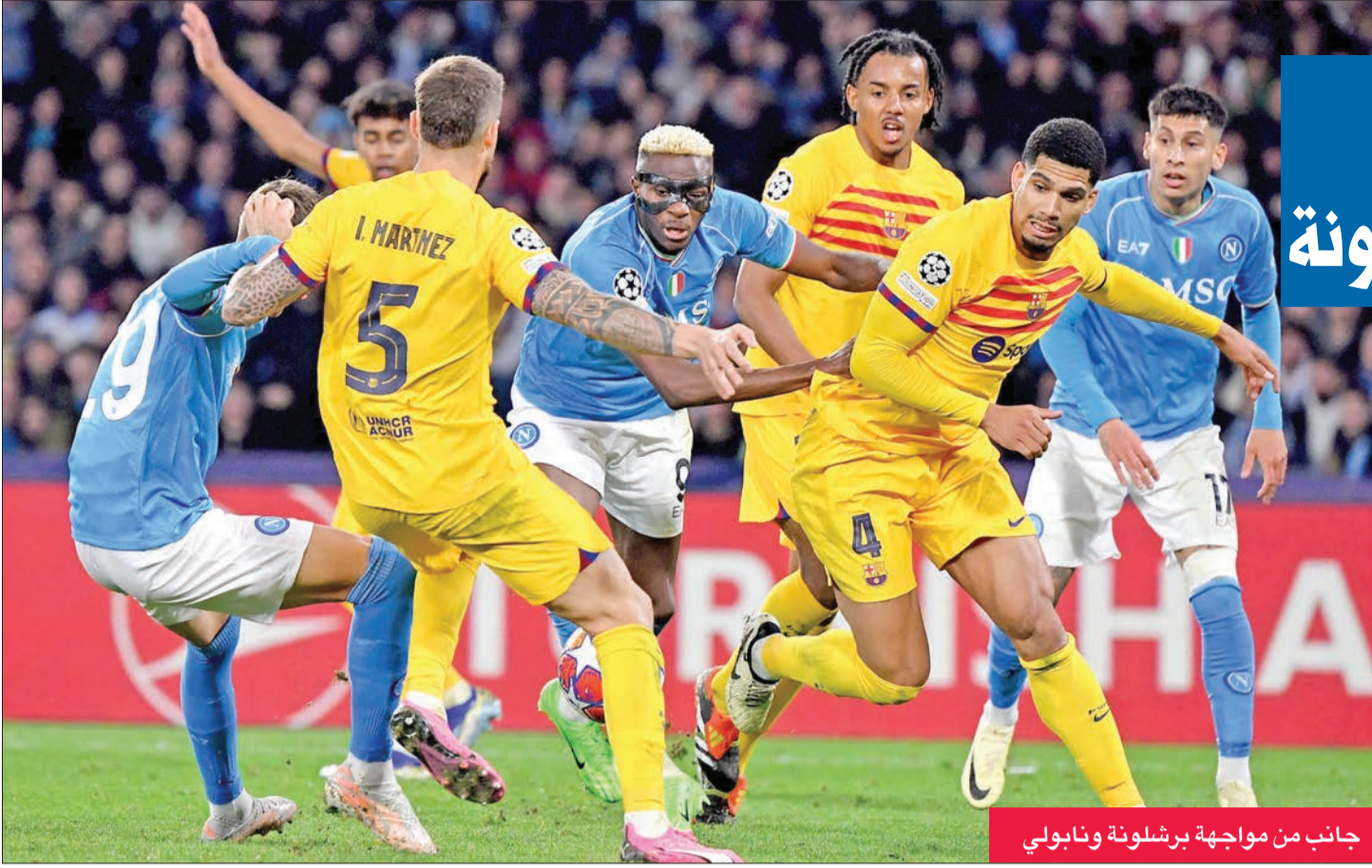
جانب من مواجهة برشلونة ونابولي