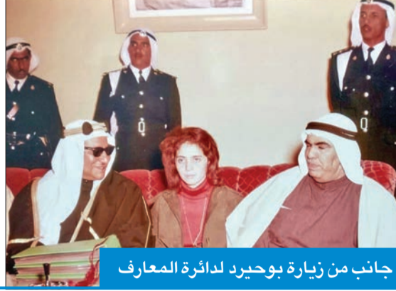
جانب من زيارة بوحيرد لدائرة المعارف