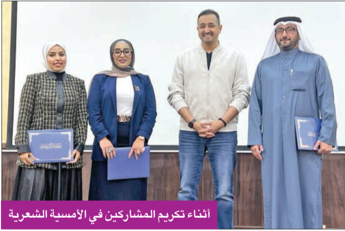
أثناء تكريم المشاركين في الأمسية الشعرية

جدير بالذكر، أن العتوروز أصدرت مجموعة من الدواوين، منها: «خلجات نفس»، و«واقصص خواترك»، و«كزهر اللوز».