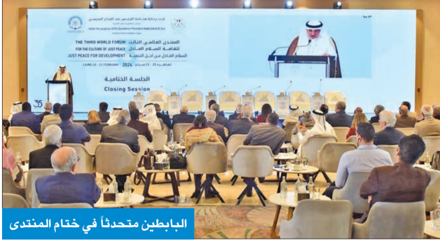
البابطين متحدثاً في ختام المنتدى

الاقتصاد قائد للتنمية... ودور القطاع الخاص في النهوض حيوي