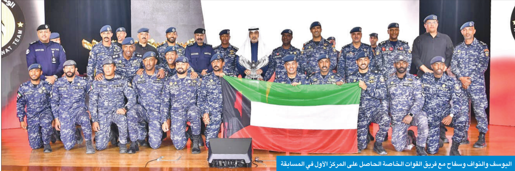
اليوسف والتواف وسفاح مع فريق القوات الخاصة الحاصل على المركز الأول في المسابقة