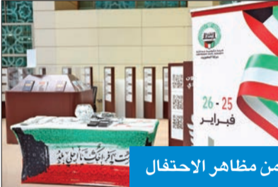
من مظاهر الاحتفال