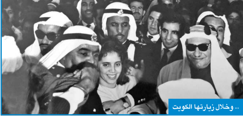
... وخلال زيارتها الكويت