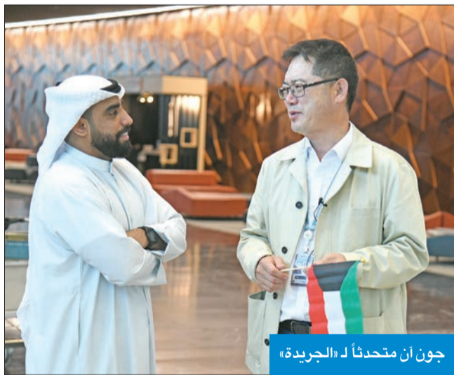
جون أن متحدثاً لـ «الجريدة»

وأضاف جون أن أن الكويت جميلة أكثر من عقد في الصومال اتفاقاً عسكرياً جديداً مع مقديشو، في حين سيطر الهجوم الذي شنته «الشباب» قبل نحو 10 أيام، وأدى إلى مقتل 4 عسكريين إماراتيين وضابط بحريني، الضوء على الوجود الخليجي العسكري في هذا البلد. وكان الرئيس المصري عبدالفتاح السيسي لوح بتدخل عسكري في الصومال في حال طلبت حكومة مقديشو منه ذلك، مؤكداً رفض مصر للاتفاق بين أدبس أبابا وإقليم صوماليلاند. وقال عبدالمك الحوثي عيم الحوثيين في اليمن أمس إن الجماعة تنجّه إلى تصعيد عملياتها، وإنها أدخلت «سلاح الغواصات» في هجمات على السفن. وبعد عدة حوادث لاستهداف سفن تديرها شركات ليست إسرائيلية أو أميركية أو بريطانية، ذكر الحوثيون أمس أن السفن المملوكة كلياً أو جزئياً لأفراد أو كيانات إسرائيلية والسفن التي ترغف علم إسرائيل والسفن المملوكة لأفراد أو كيانات أميركية أو بريطانية، أو التي تبحر رافعة علمي الولايات المتحدة أو بريطانيا، ستمنع من عبور البحر الأحمر وخليج عدن وبحر العرب.