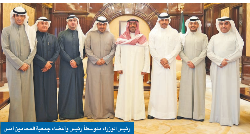
رئيس الوزراء متوسلاً رئيس وأعضاء جمعية المحامين أمس

استمع من مسؤولي عدة جمعيات إلى القضايا المطروحة على الساحة المحلية