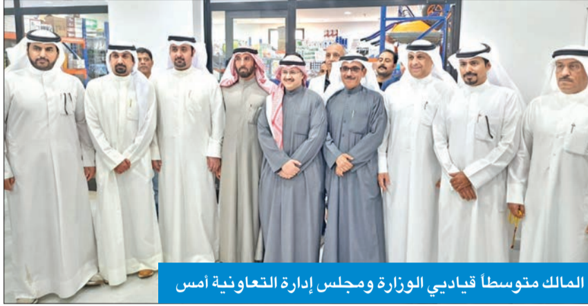
الملك متوسلاً قياديي الوزارة ومجلس إدارة التعاونية أمس

علمت «الجريدة» أن وزارة الشؤون الاجتماعية، ممثلة في إدارة الشؤون الإدارية، حضرت إجمالي عدد الموظفين الحاصلين على تقايم سنوية «امتياز» الذي بلغ نحو 2250 موظفاً وموظفة في جميع القطاعات وبنسبة مئوية بلغت نحو 35 بالمئة، من أصل 6700 يخضعون لأعمال التقييم، وفقاً لتعميم ديوان الخدمة المدنية بشأن تقييم الأداء عن عامل حساب مجموع مدد التأخير خلال سنة التقييم.