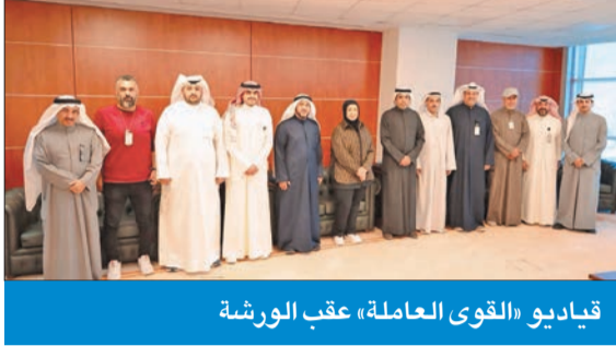
قياديو «القوى العاملة» عقب الورشة

العصيمي: استكمال إجراءات «ميكنة» التفتيش على الشركات