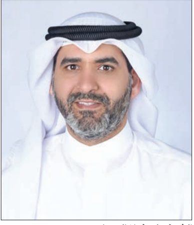
الشيخ علي فواز الصباح

وللمجموعة حصص ملكية رئيسية في بنوك تجارية وشركات تأمين وشركات إدارة الأصول والخدمات المصرفية الاستثمارية.