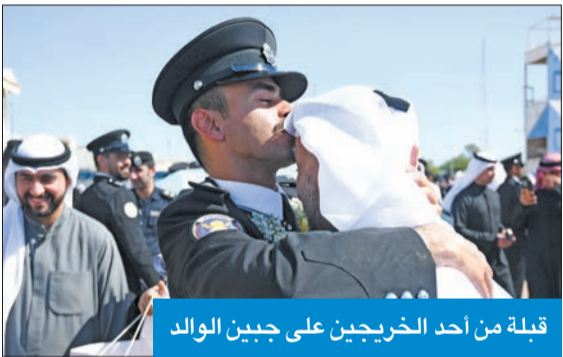
قبلة من أحد الخريجين على جبين الوالد