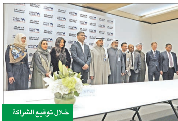
خلال توقيع الشراكة

وبالتالي ترسيخ مكانتنا الريادية في القطاع. وتعتبر بطاقة KWT Visa Infinite الانتمانية هي الأكثر نجاحاً على مستوى الكويت، حيث تمنح حاملها نمط حياة فريداً بفضل ما تقدمه من مكافآت تصميمها لتناسب احتياجات العملاء وتلبي طموحاتهم وتطلعاتهم، حيث يمكن للعملاء الحصول على استرداد نقدي حتى 1000 دينار على هيئة نقاط KWT من «الوطني». وتجمع البطاقة بين باقة من المزايا الاستثنائية والشعور بالفخر الوطني الذي يعكسه تصميمها، مما يجعلها فريدة من نوعها، حيث تمنح حاملها حرية اختيار الطريقة التي يريدونها للحصول على النقاط وفقاً لنمط حياتهم، إما باختيار فئة الإنفاق أو الفئة التجارية. وعند تفعيل فئة التجار يمكن