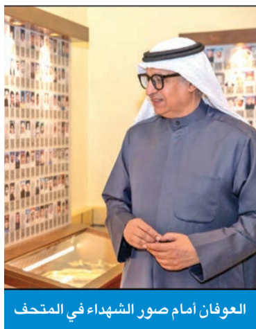
العوفان أمام صور الشهداء في المتحف

الذي قضاوا أثناء الواجب، أو الذين قضاوا خلال عمليات إرهابية أخرى.