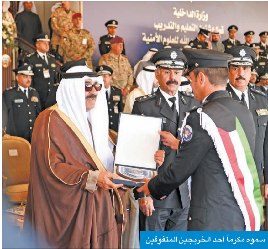
سموه مكرماً أحد الخريجين المتفوقين

برعاية وحضور سمو أمير البلاد الشيخ مشعل الأحمد، القائد الأعلى للقوات المسلحة، احتفلت أكاديمية سعد العبدالله للعلوم الأمنية بحفل تخرج الدفعة الـ 31 من طلبة ضباط الاختصاص بكلية الشرطة، وذلك بميدان أكاديمية سعد العبدالله للعلوم الأمنية. وبينهم 3 خريجين من البحرين من ذوي الشقيقة حصلوا جميعاً على درجة الدبلوم في العلوم الشرطية، ويأتي ذلك بالتزامن مع احتفالات الكويت بالأعياد الوطنية، فهنئنا للوطن بتخريج تلك الكوكبة من أبنائه الذين عاهدوا الله على صون الأمانة والحفاظ على أمن وسلامة واستقرار البلاد، متمسكين بالقيم الوطنية الأصيلة. وأضاف الرومي: «نعاهد سمو أمير البلاد بأن تظل أكاديمية سعد العبدالله للعلوم الأمنية مؤسسة أمنية تحمل لواء المسؤولية، والسير بخطى ثابتة وطموح لا سقف له، لتظل مركز إشعاع علمي وثقافي تسهم بكل جهودها لإعداد وتأهيل رجال أمن متسلحين بالوطنية والانتماء والتفاني في أداء الواجب، واضعين جميعاً نصب أعيننا كلمات سموكم السامية: «إن هذا الوطن أمانة في أعناقنا جميعاً نضونه بالنفس قبل النفس»، فنحن على الدرب سائرون وبوفائكم وولائكم مقتدون، ولسموكم ولكم جميعاً معاهدون أن نحفظ وطننا من كيد الكائدين وحقد الحاقدين، وأن تظل الكويت دوماً صرحاً منيعاً على أعدائها مرفوعة الهامة وواحة أمن وأمان. وأشار إلى «أن الحفل يأتي في ظل موجة التطوير والتحديث لقدرات الأكاديمية التي تهدف إلى بناء استراتيجية أمنية معاصرة وواحدة من أجل مسيرة ركب التطور المتسارع في التقدم العلمي والتدريبي والتقني، لافتاً إلى أنه «لا يفوتني في هذا المقام أن أتقدم بخالص الشكر لجميع