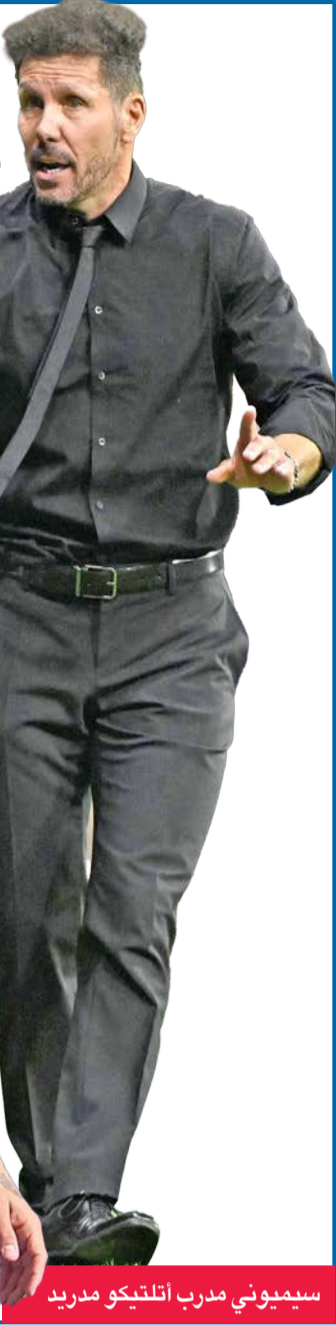
سيميوني مدرب أنتليكو مدريد