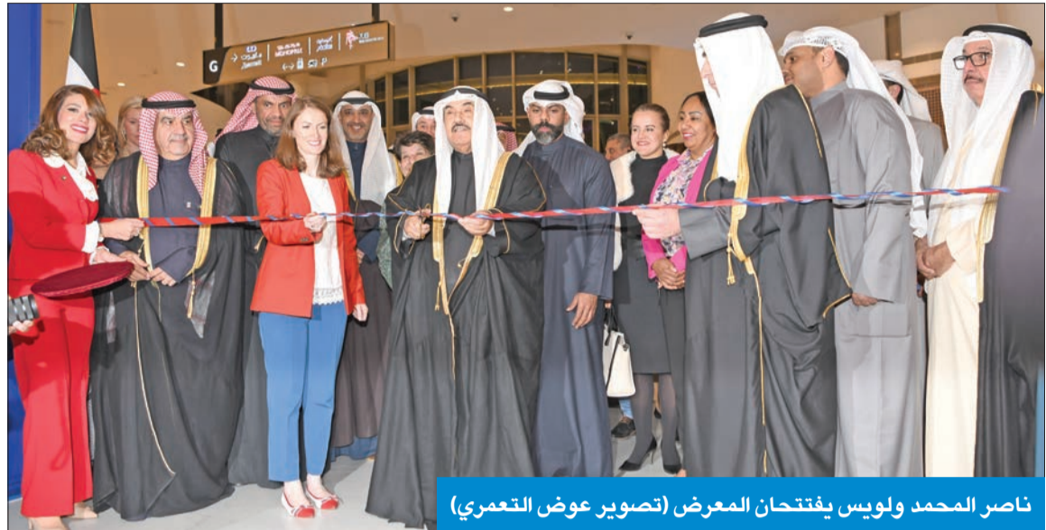
ناصر المحمد وبليندا لويس يفتتحان المعرض

الزيارة التاريخية لصاحب السمو الأمير الشيخ مشعل الأحمد للعاصمة البريطانية لندن في أغسطس الماضي، حينما كان سموه ولياً للعهد، ليضم برعايته وحضوره احتفالية مكتب الاستثمار الكويتي في المملكة المتحدة لتأسيسه، جسدت عمق العلاقات التاريخية والاستراتيجية التي تربط الكويت بالمملكة المتحدة الصديقة، وساهمت في فتح آفاق جديدة للتعاون الثنائي في المجالات الاقتصادية والأمنية والثقافية، بما يعكس واقع العلاقات الاستراتيجية التي تربط بين البلدين.