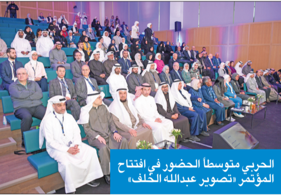
الحربي متوسطاً الحضور في افتتاح المؤتمر «تصوير عبدالله الخلف»

الخصر: 322 ملصقاً علمياً مشاركاً في مؤتمر «البحث العلمي»