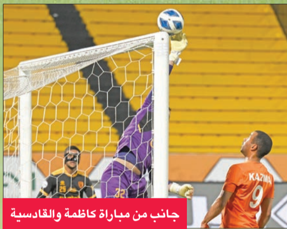
جانب من مباراة كاظمة والقادسية

وواصل خيطان عناده وتعادل للجولة الثانية على التوالي مع السالمية، وهو تعادل معنوي في المقام الأول إلى جانب اقتناص نقطة مهمة في منافسته على البقاء.