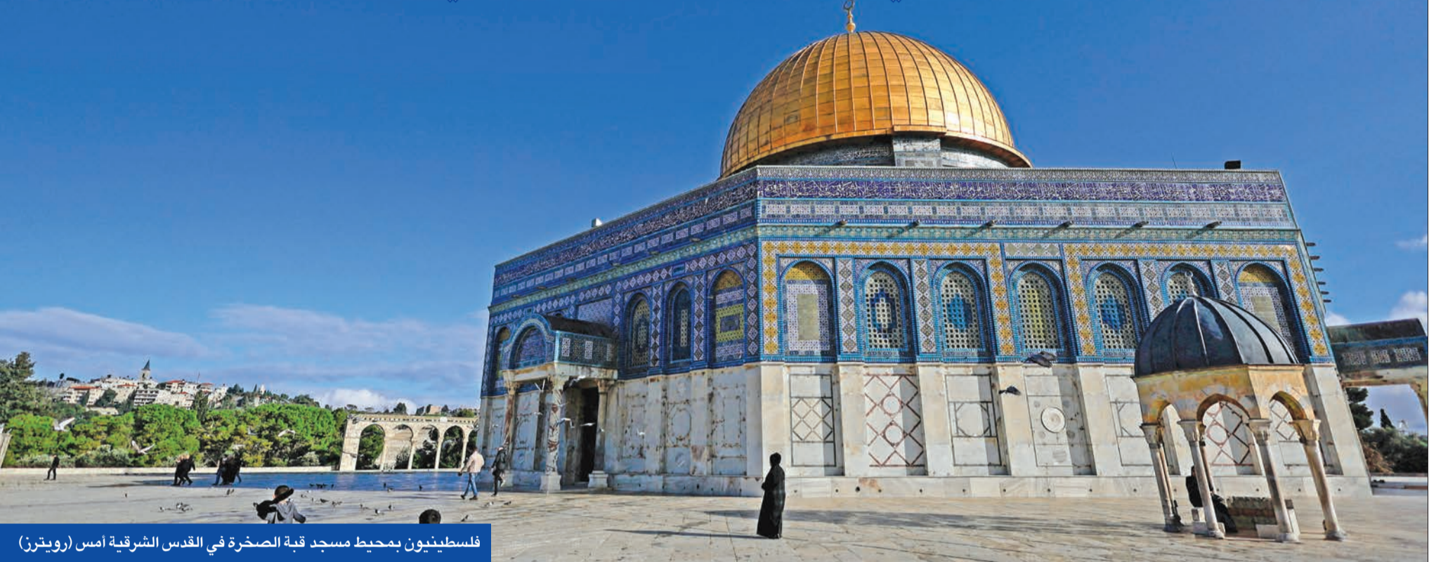
فلسطينيون بمحيط مسجد قبة الصخرة في القدس الشرقية أمس

نتنياهو ويرر القيود على المصلين في «الأقصى»... و«حماس» تنفي بحث استبدال السنوار