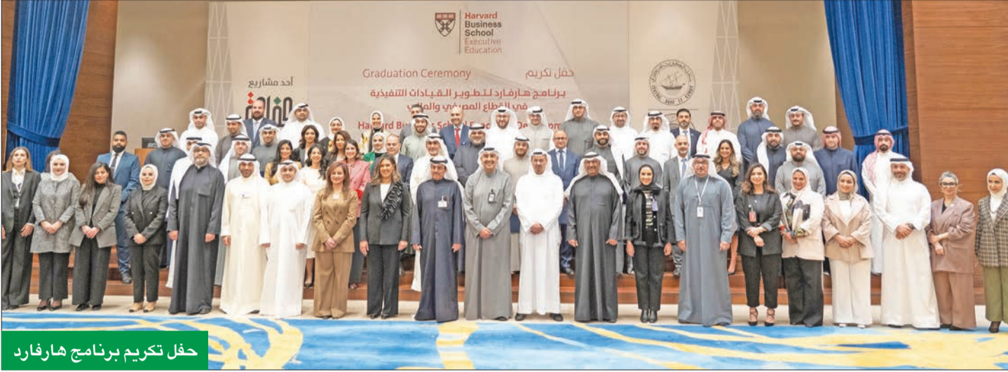
حفل تكريم برنامج هارفارد

عملهم التي استثمرت فيها. وفي الختام تم توزيع الشهادات على المشاركين، متمنين للجميع المزيد من النجاح والتقدم.