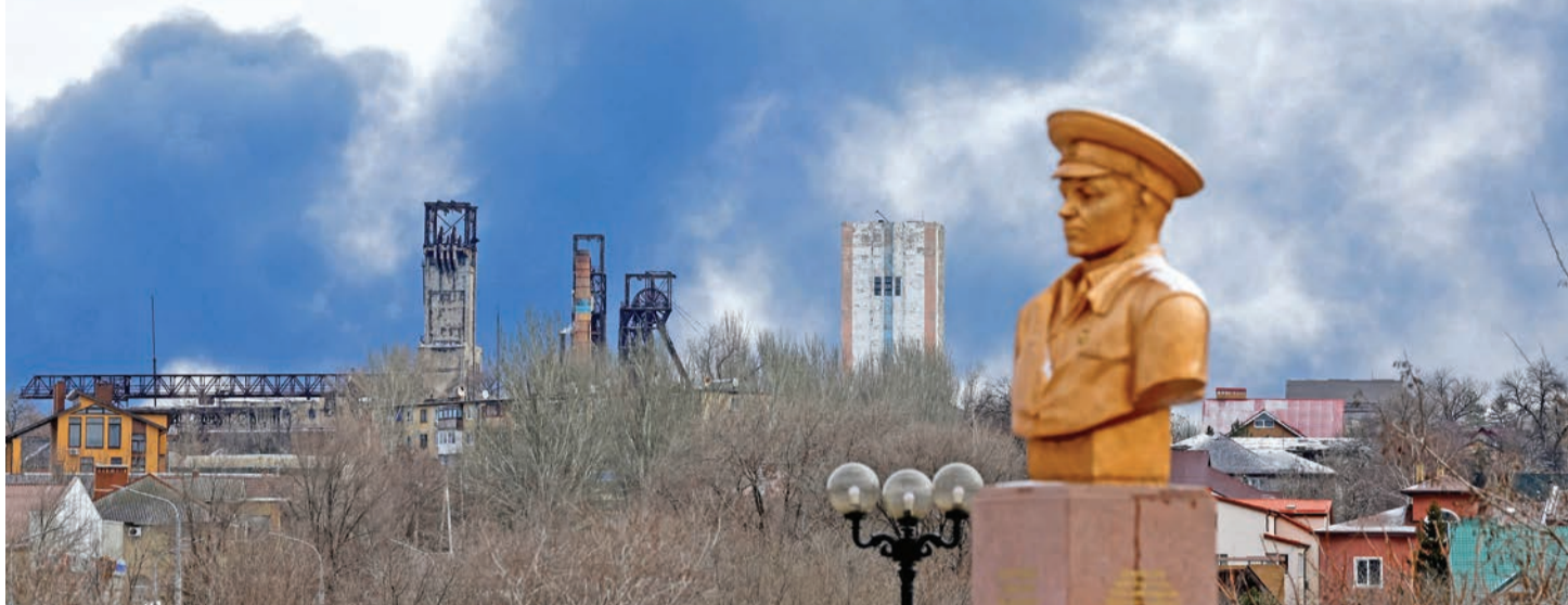
الدخان يتصاعد خلف نصب تذكاري من الحرب العالمية الثانية في دونيتسك شرق أوكرانيا التي تسيطر عليها روسيا أمس (رويترز)

● موسكو تهاجم لاستعادة بلدة على الجبهة الجنوبية خسرتها في الهجوم الأوكراني المضاد ● فرنسا وألمانيا وبولندا تفعل «مثلث فيمار»... وباريس تزيد «بوليصة تأمين» بخلاف «الناتو»