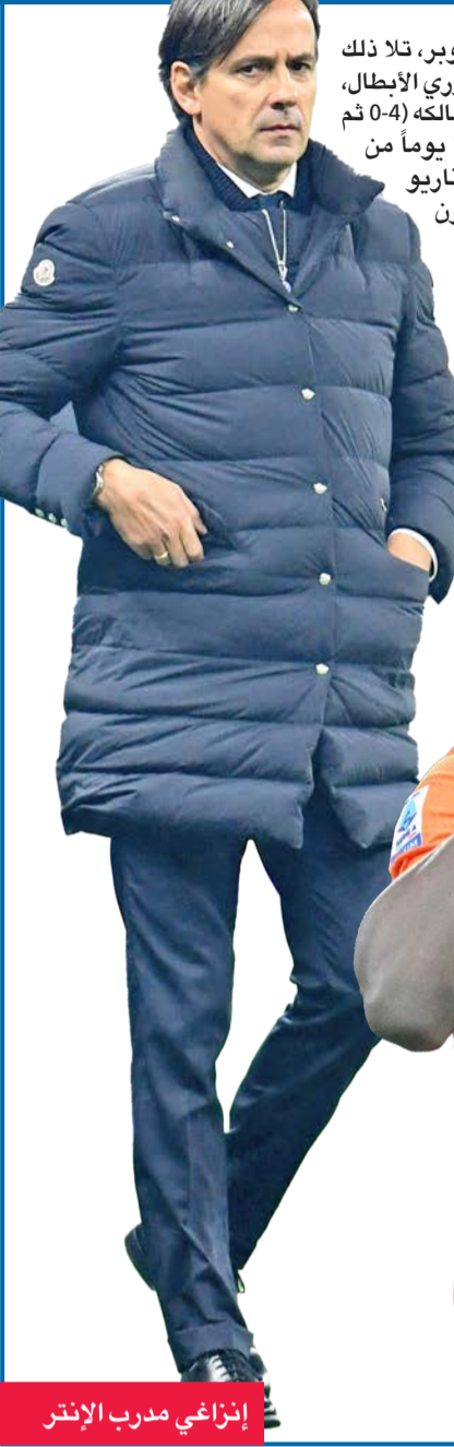
إنزاعي مدرب إنتر