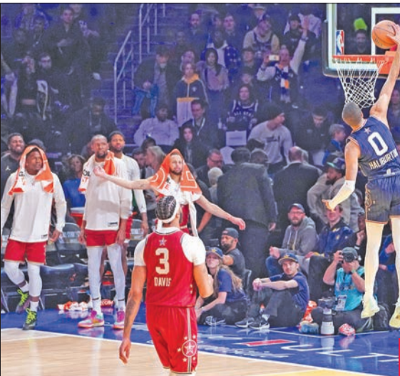
ليبارد يسجل سلة استعراضية

إلى الاستعراض عن طريق السلات الساحقة من دون أي معارضة. وعادت مباراة «أول ستار» إلى صيغتها القديمة بمواجهة بين نجوم المنطقتين الشرقية والغربية، بعد ست سنوات من اختصار نظام اختيار قائدان تشكيلة فريقهما.