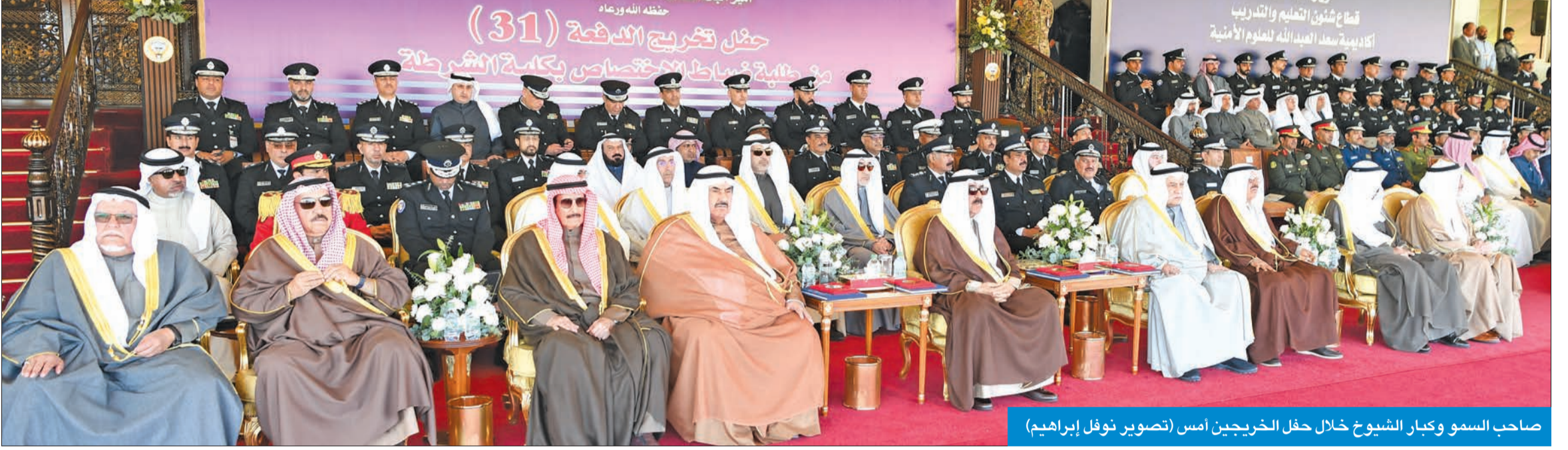
صاحب السمو وكبار الشيوخ خلال حفل الخريجين أمس

الرومي: الأكاديمية الأمنية تواكب موجة التطوير والتحديث بهدف بناء استراتيجية معاصرة