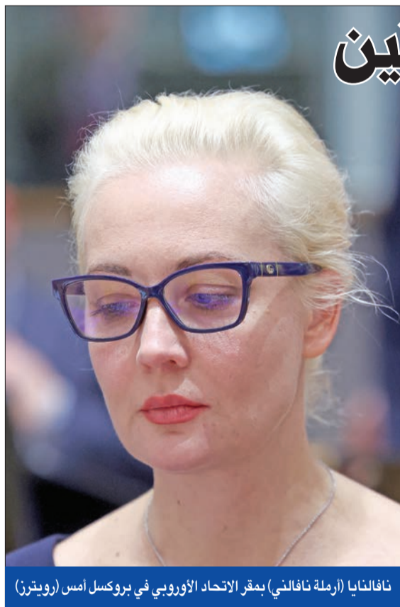
ناتاليا (أرملة نافالني) بمقر الاتحاد الأوروبي في بروكسل أمس

وقال وزير الخارجية الفرنسي، عقب تصريحات ترامب بشأن الناتو، إن أوروبا بحاجة إلى بوليصة «تأمين على الحياة» ثانية لا تكون بديلة للناتو، بل تشكل إضافة جديدة للحلف.