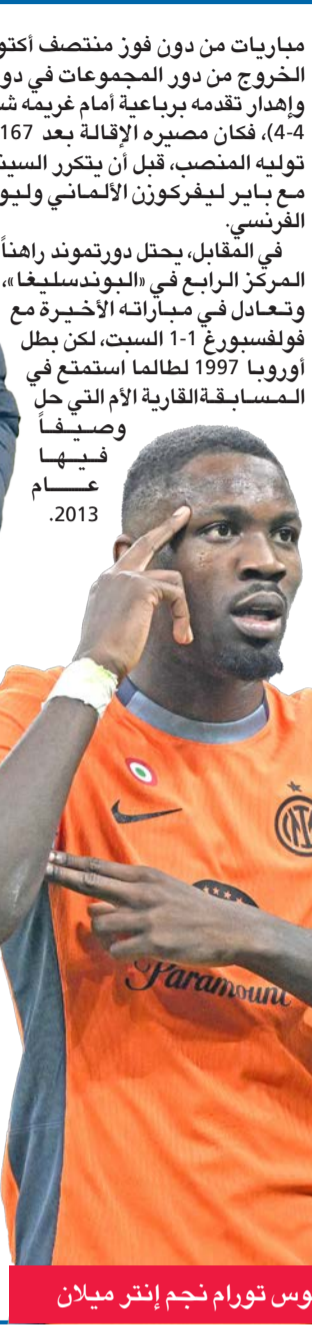
ماركوس تورام نجم إنتر ميلان

اتمتع بعلاقة جيدة معه، لأنني كنت معه في لانس، ويقوم بأشياء جيدة جدا في إنتر». ويتصدر إنتر الدوري الإيطالي بفارق كبير عن يوفنتوس ببلغ تسع نقاط ومباراة أقل، علماً بأنه فاز بكل مبارياته الثماني في 2024. وقال سيميوني، السبت، لمنصة دازون للبت التدقي: «خسرنا مباراة تيممة هذا الموسم، هم اقوياء، يؤمنون بعملهم الدفاعي والهجومى». ويعول إنتر، حامل اللقب ثلاث مرات، على مهاجمة الأرجنتيني الفتك لاوتارو مارتينيز، وإلى جانبه الفرنسي ماركوس تورام. وأضاف إنزاعي عن مزايا أنتليكو: «يعتمدون على اللعب البدني، يعرفون ماذا يريدون، يملكون لاعبين رائعين ومدرباً جيداً كان أيضاً زميلاً رائعاً».