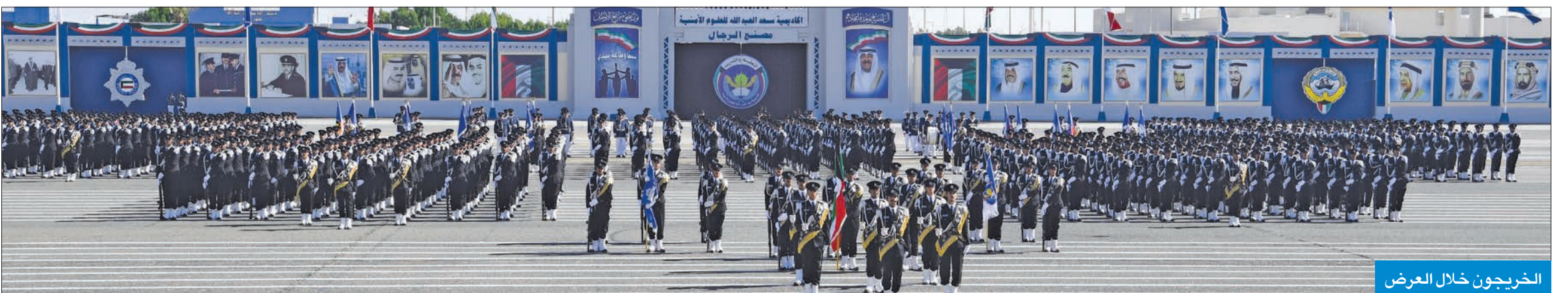
الخريجون خلال العرض