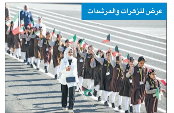
عرض للزهرات والمرشدات

شاركت وزارة التربية في حفل التخرج بعرض للزهرات والمرشدات في ميدان أكاديمية سعد العبدالله للعلوم الأمنية.