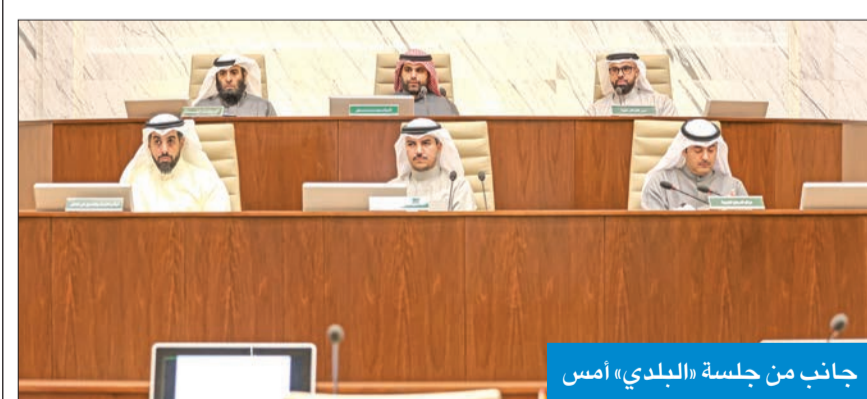
جانب من جلسة «البلدي» أمس

ودعت الفارسي إلى معالجة وتأهيل جميع مرادم الكويت المغلقة والبداة الجاد بمشاركة الاستفادة من النفايات وإعادة تدويرها، لافتة إلى أن مساحة