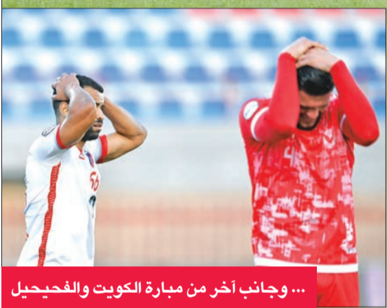
... وجانب آخر من مباراة الكويت والفحيحيل