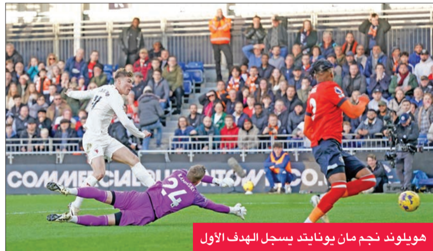
هويلوند نجم مان يونايتد يسجل الهدف الأول

المرمرى إلا أن لوكونجا أبعدها في الدقيقة 60.