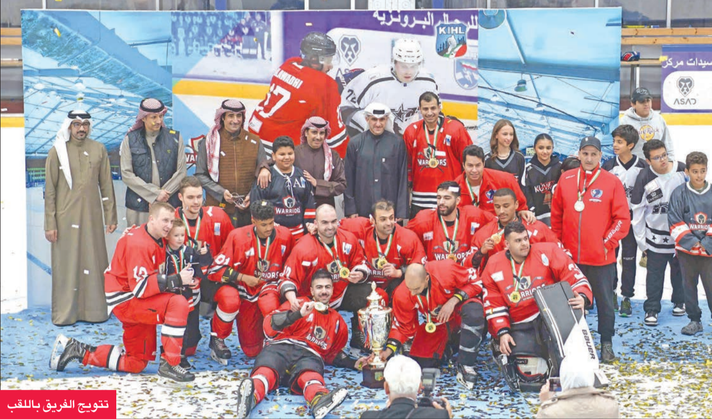
تتويج الفريق باللقب

البحرين البحريني، لافتا إلى سعي النادي لضم فرق خليجية أخرى للدوري لتكون دوري «كونا» خليجي.