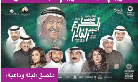
ملصق «ليلة وداعية»

أعلن رئيس الهيئة العامة للترفيه، تركي آل الشيخ، تأجيل حفل تكريم الفنان الراحل عبدالكريم عبدالقادر، عقب إصابة الفنان عبدالله الرويشد بوعكة صحية. وعبر حسابه على موقع إكس، أعلن آل الشيخ تأجيل الحفل، الذي كان من المقرر إقامته 23 الجاري على مسرح محمد عبده أرينا.