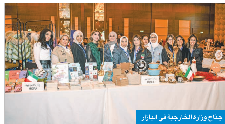
جناح وزارة الخارجية في البازار

وقال العون إنه «نتيجة للعدوان الإسرائيلي والمجازر اليومية والقصف اليومي على