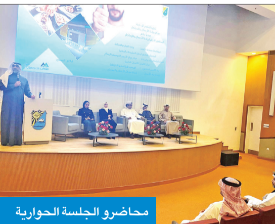
محاضرو الجلسة الحوارية

● خلال تدشين الملتقى الأول لريادة الأعمال والابتكار ● «المحفظة الصناعية»: مؤلنا 2586 مشروعاً