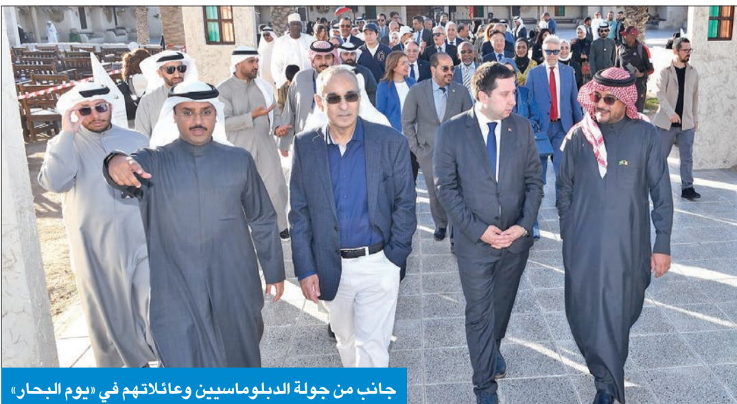
جانب من جولة الدبلوماسيين وعائلاتهم في «يوم البحار»

الفعاليات ذات الصلة منها الاحتفال في «يوم البحار» بسوق المباركية التراثي كوشك مبارك» بالتعاون مع مكتب الشهيد» بالتعاون مع مكتب الشهيد.