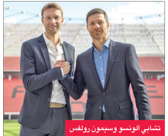
تشابي ألونسو وسيمون رولفس

النقلة، فهو من قام بنقله نوعية للفريق منذ توليه المسؤولية في خريف 2022 عندما كان يحتل الفريق المركز الثاني من القاع في البوندسليغا. ولعب ألونسو لفريق ليفربول في الفترة من 2004 إلى 2009 وفاز معه بدوري أبطال أوروبا في 2005، كما فاز بدوري أبطال أوروبا مع ريال مدريد، بالإضافة لبطولة كأس العالم للأندية في 2010، وبطولتي أمم أوروبا 2008،