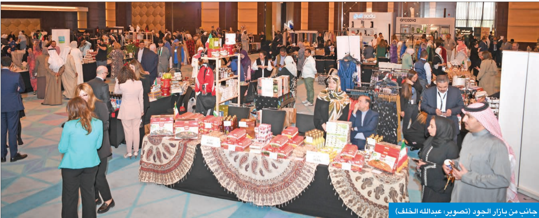
جانب من بازار الجود