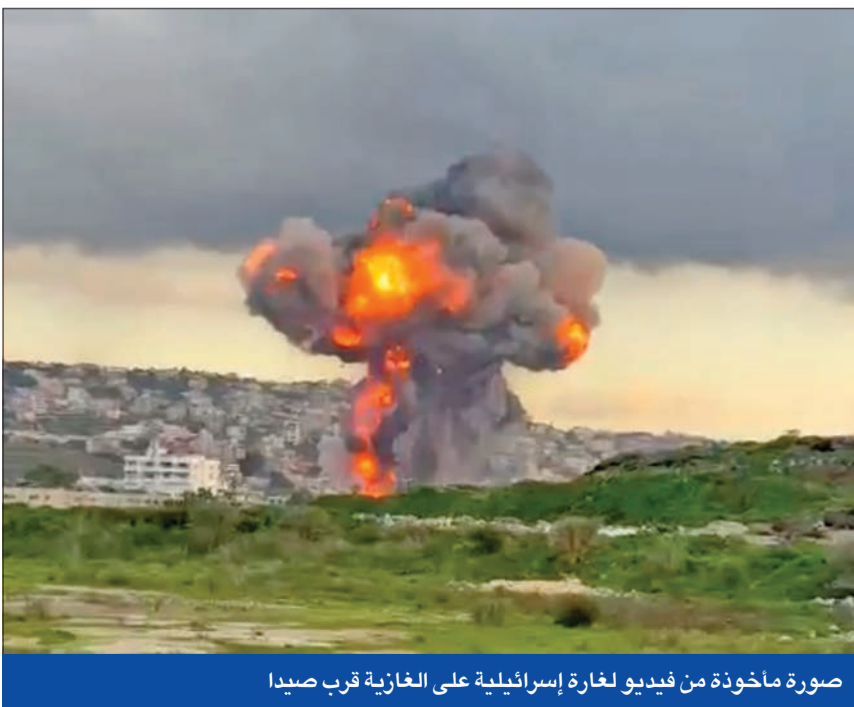
صورة مأخوذة من فيديو لغارة إسرائيلية على الغازية قرب صيدا

إلى ذلك، بث التلفزيون الإيراني وقائع جنازة 12 شخصا لقوا حتفهم في غارة أميركية في