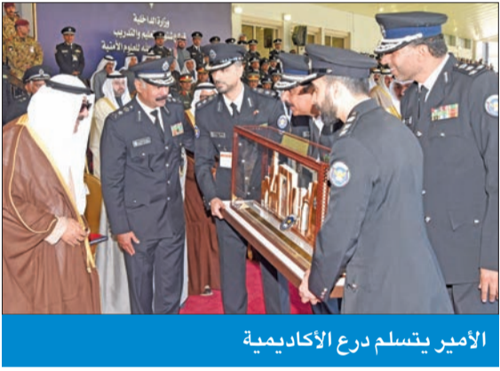
الأمير يتسلم درج الأكاديمية