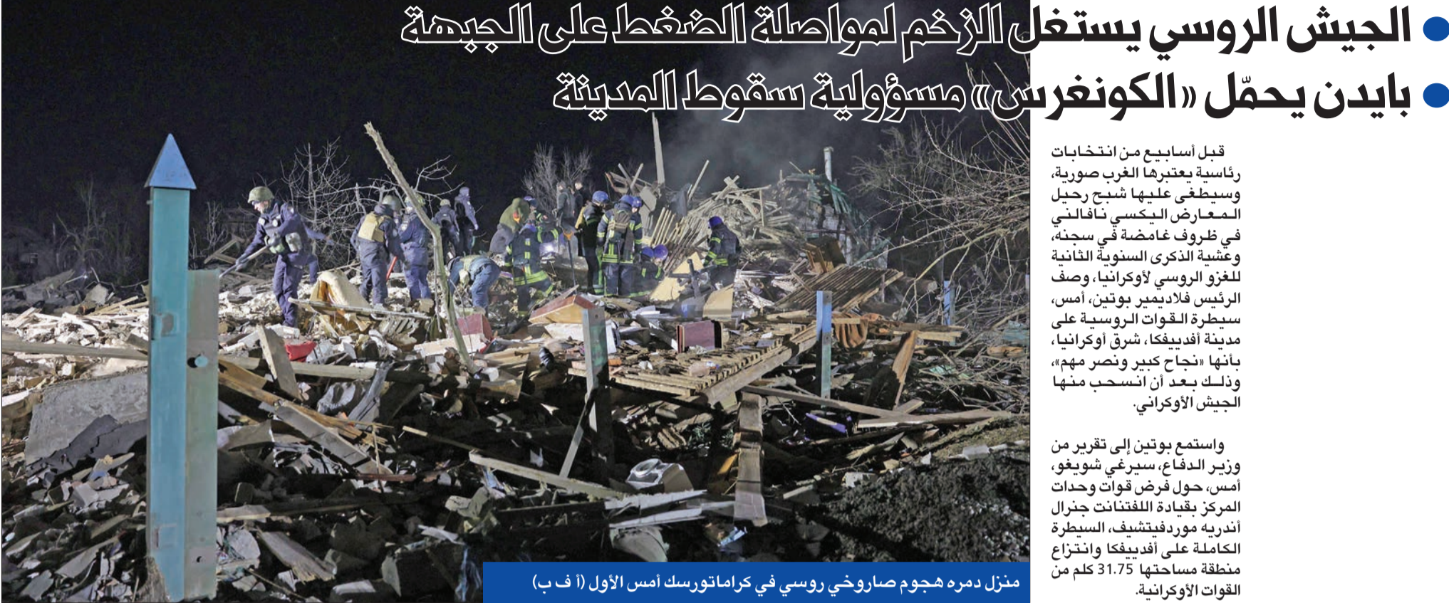
منزل دمره هجوم صاروخي روسي في كراماتورسك أمس الأول

نقاط، والتي تركز على انسحاب القوات الروسية، واستعادة حدود ما بعد الاتحاد السوفياتي عام 1991، ووضع إطار لمحاكمة موسكو على أفعالها. واقرحت الصين، التي تسعى إلى إقامة «شراكة استراتيجية» مع روسيا، خطة سلام خاصة بها العام الماضي تدعو إلى وقف إطلاق النار والمفاوضات وإنهاء العقوبات المفروضة على روسيا. لكن الخطة لم تحرز تقدما يذكر.