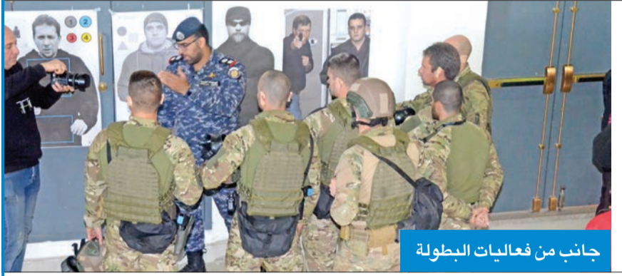
جانب من فعاليات البطولة

● الطيخ: المسابقات عسكرية وتختص بها فرق الاقتحام الـ S.W.A.T