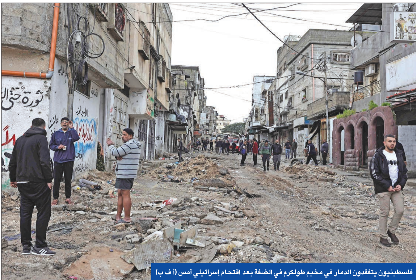
فلسطينيون يتفقدون الدمار في مخيم طولكرم في الضفة بعد اقتحام إسرائيلي أمس (أ ب)

● اشتية يتحدث عن شروط للحوار مع «حماس» في موسكو... وإدارة بايدن تدرس إنقاذ «السلطة» من الإفلاس ● ثاني أكبر مستشفى في غزة يخرج عن الخدمة ● مذكرة مصرية لمحكمة العدل حول ممارسات تل أبيب