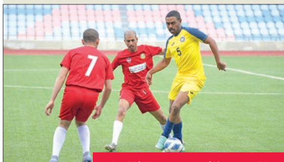
جانب من منافسات دوري الثانويات

حافظ فريق الفروانية على صدارة المجموعة الثانية لدوري بنك وربة للمرحلة الثانوية لكرة القدم، بعد الفوز على فريق منطقة العاصمة بهدفين لهدف في المباراة التي جمعتهما على الملعب الفرعي لاستاد جابر الدولي. ورفع الفروانية رصيده إلى 6 نقاط، فيما توقف رصيد العاصمة عند 3 نقاط. وفي المباراة الثانية بنفس المجموعة نجح فريق الجهراء في تعويض خسارته بالجولة الأولى، بالفوز على فريق التعليم الخاص 4 - صفر، ليرفع رصيده إلى 3 نقاط، في المركز الثالث، فيما احتل الخامس المركز الرابع. وفي منافسات دوري التعليم العالي اكتمل المربع الذهبي بتأهل أكاديمية سعد العبدالله للعلوم الأمنية والجامعة الأميركية بعد فوزهما على كلية علي الصباح وفريق جامعة الكويت، حامل اللقب.