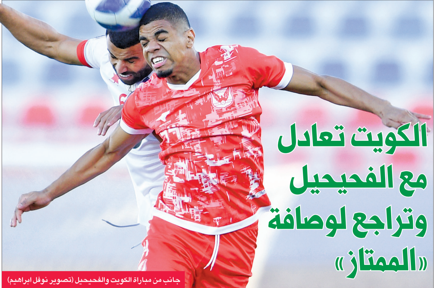
جانب من مباراة الكويت والفحيحيل

الكرواتي أنتقي ميشا انه كان يستهدف الفوز وتأكيد اللقاء بين فريق المجموعة الأولى، مشيرًا إلى أن المنافس لعب مباراة دفاعية وخرج بنقطة التعادل. وأضاف ميشا أن دفاعات السالمية أدت الأدوار المطلوبة منها في اللقاء، في حين كان يتعين على المهاجمين بذل مجهود أكبر لتسجيل الأهداف.