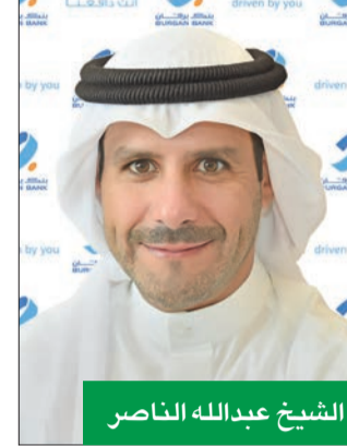
الشيخ عبدالله الناصر

وشهد عرض التمويل السكني الذي يقدمه البنك للمقيمين في المملكة المتحدة والمغتربين والمقيمين الأجانب نمواً قوياً، مع زيادة إجمالي الأرصدة بنسبة 40 في المئة على أساس سنوي إلى 1.065 مليار جنيه إسترليني (وصل إلى 762 مليون جنيه إسترليني عام 2021). ويهدفه المناسبة، قال فهد بودي، رئيس مجلس الإدارة ومؤسس «غيتهاوس»: «فخور جداً بالنمو الذي حققته البنك منذ تأسيسه عام 2007، لإسما على مدى السنوات الماضية، مع تطوير منتجات التمويل العقاري للمستهلكتين في المملكة المتحدة والأجانب الراغبين في شراء منزل أو عقار استثماري بالمملكة المتحدة، وتطويرنا منصة البناء المتكاملة والشاملة في (غيتهاوس)، ودعم المستثمرين من جميع أنحاء العالم».