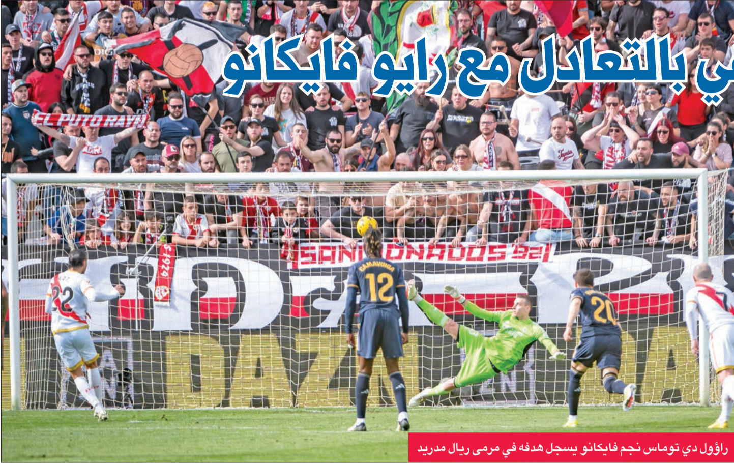
راؤول دي توماس نجم فايكانو يسجل هدفه في مرمى ريال مدريد

تعادل ريال مدريد مع مضيفه رايو فايكانو بهدف لمتله ضمن منافسات الجولة الـ 25 من الدوري الإسباني لكرة القدم.