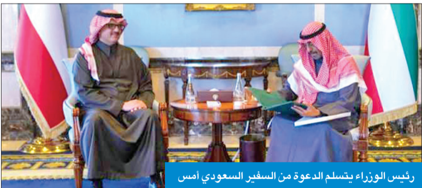
رئيس الوزراء يتسلم الدعوة من السفير السعودي أمس

تهنئة إلى رئيس جمهورية غامبيا، أداما بارو، بمناسبة العيد الوطني لبلاد.