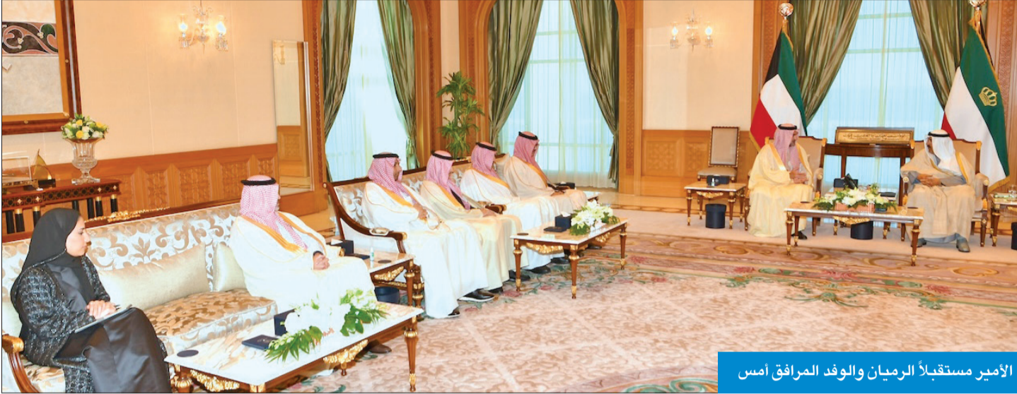
الأمير مستقبلاً الريمان والوفد المرافق أمس

في رابع محطات زياراته الدولية، يزور سمو أمير البلاد الشيخ مشعل الأحمد دولة قطر غداً، تلبية لدعوة أمير قطر الشيخ تميم بن حمد وأعلنت وكالة الأنباء القطرية الرسمية، أمس، أن صاحب السمو سيبحثان العلاقات الأخوية الوطيدة بين البلدين وسبل دعمها وتطويرها، وتعزيز العمل الخليجي المشترك، إضافة إلى أبرز المستجدات الإقليمية والدولية.