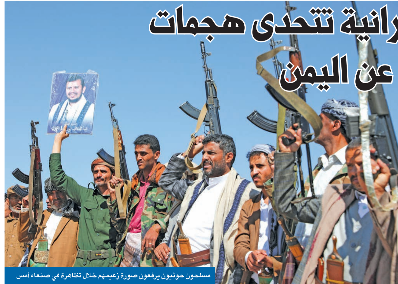
مسلحون حوثيون يرفعون صورة زعيمهم خلال تظاهرة في صنعاء أمس

نفي مصدر في قيادة الأركان الإيرانية أن تكون سفينة بهشاد التابعة للبحرية الإيرانية قد تعرضت لهجوم أو أي تهديد عسكري مباشر، لكنه أكد أن السفينة، التي أشارت تقارير غربية إلى أنها تقدم دعماً وإسناداً لوجستياً واستخبارياً لجماعة «أنصار الله» الحوثية في اليمن لمهاجمة السفن في البحر الأحمر، تعرضت لعدة هجمات سيرانية خلال مهمتها في البحر الأحمر وخليج عدن خلال الشهر الماضي.