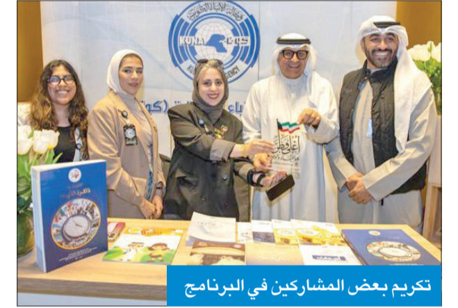
تكريم بعض المشاركين في البرنامج

في هذه الفعالية وكانت أكثر من 22 جهة شاركت الكويت أفرحها وأعيادها الوطنية تخليداً لشهداء الكويت الأبرار، وتكريماً لأسرهم الذين حضروا هذه الفعاليات وشاركوا الكويت أفرحها، كما تم افتتاح جدارية وقائع الاستشهاد منذ الاستقلال حتى يومنا هذا من عمل طالبات كلية التربية الأساسية «قسم التربية الفنية» والتي جسدت مدى التلاحم الوطني بين فئات المجتمع.