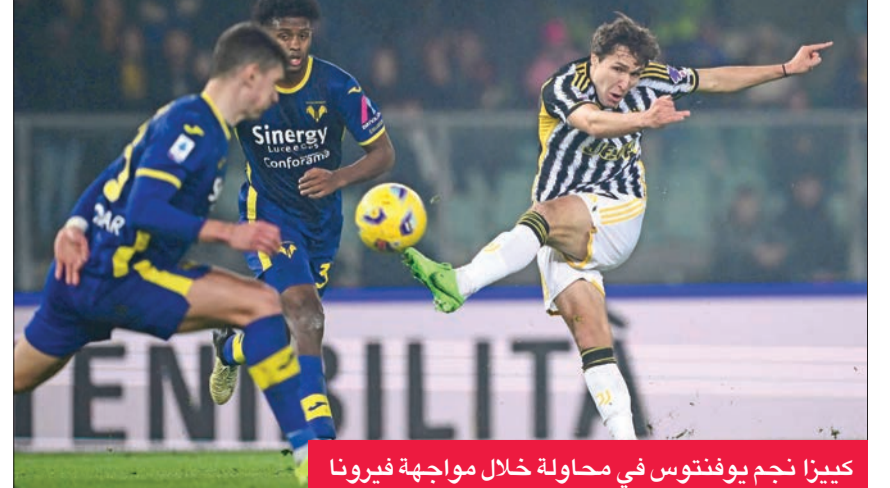
كيززا نجم يوفنتوس في محاولة خلال مواجهة فيرونا

واصل يوفنتوس نزيف النقاط بسقوطه في فخ التعادل أمام مضيفه فيرونا 2 - 2، وتابع نابولي حامل اللقب ترنحه قبل قمته الثمانية أمام برشلونه الإسباني عندما أفلت من الخسارة على أرضه أمام ضيفه