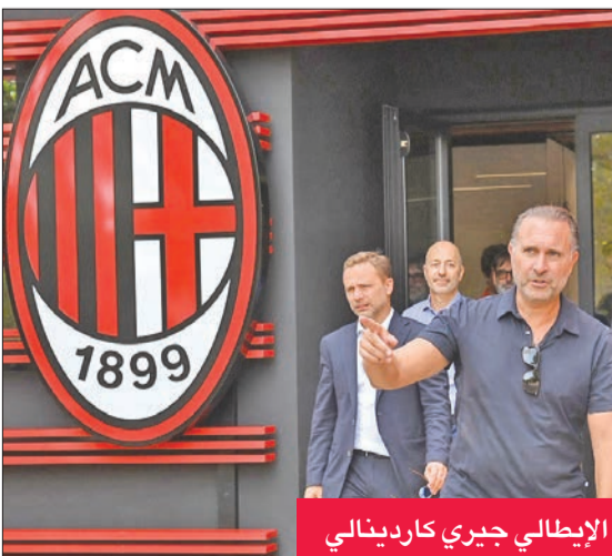
الإيطالي جيري كاردينالي

أبدى مالك نادي ميلان الإيطالي جيري كاردينالي حماسه الشديد لإعادة الفريق مجدداً لمصاف الكبار بين أندية القارة العجوز. ويعاني ميلان كثيراً هذا الموسم، حيث ودع دوري أبطال أوروبا من مرحلة المجموعات، ويتخلف عن غريمه إنتر ميلان بفارق كبير في الدوري الإيطالي.