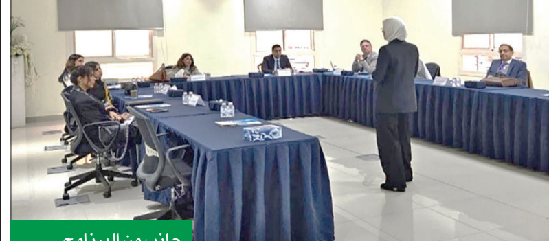
جانب من البرنامج