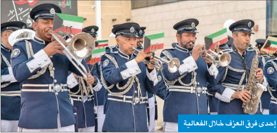
إحدى فرق العزف خلال الفعالية