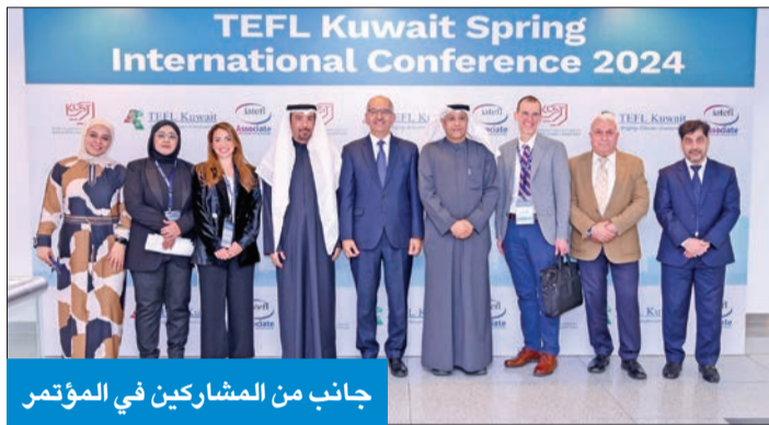
جانب من المشاركين في المؤتمر