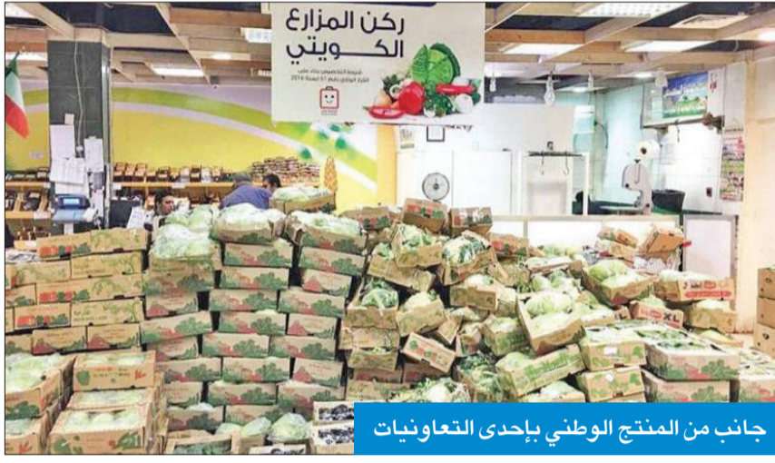
جانب من المنتج الوطني بإحدى التعاونيات

وعلى صعيد الرقابة والمتابعة للجهات المشاركة في المشروع ورصد وتحريم وإزالة المخالفة الخاصة بالعمل الخيري خلال الشهر الفضيل، شكلت الوزارة، بالتنسيق مع الجهات الحكومية ذات العلاقة مثل وزارة الداخلية، والهيئة العامة للقوى العاملة، وبلدية الكويت، فرقا لرصد وإزالة مخالفات التبرعات طوال رمضان.