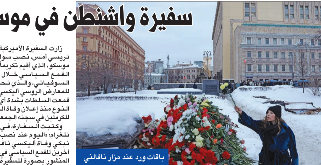
باقات ورد عند مزار نافالني

زارت السفارة الأميركية في روسيا لين تريسي، أمس، نصب سولوفيتسكي، في موسكو، الذي أقيم تكريماً لذكرى ضحايا القمع السياسي خلال حقبة الاتحاد السوفياتي، والذي تحول إلى «مزار» للمعارض الروسي اليكسي نافالني بعدما قدمت السلطات بشدة أي تجمع من هذا النوع منذ إعلان وفاة المعارض الأكبر للكرملين في سجنه الجمعة الماضي. وكتب السفارة، في حسابها على تلغرام: «اليوم عند نصب سولوفيتسكي، نذكر وفاة اليكسي نافالني وضحايا آخرين للقمع السياسي في روسيا». وأرفق المنشور بصورة للسفيرة أمام باقات من