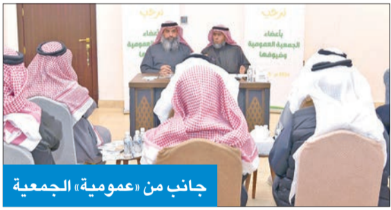
جانب من «عمومية» الجمعية

عقدت جمعية الحكمة الكويتية الخيرية اجتماع الجمعية العمومية العادية لمناقشة إنجازاتها السنوية، وما حققته من أعمال في سبيل التخفيف من معاناة المحتاجين في العديد من المجالات الخيرية والإنسانية، الأحد الماضي، بحضور ممثلين عن وزارة الشؤون الاجتماعية وشؤون الأسرة والطفولة، ومكتب تدقيق الحسابات، وأعضاء مجلس الإدارة.