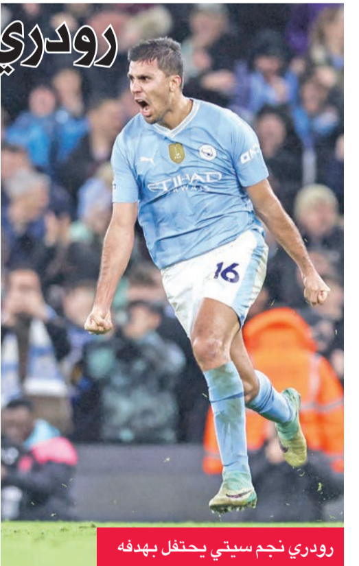
رودري نجم سيتي يحتفل بهدفه

وحرم تشلسي مانشستر سيتي من تحقيق الفوز السابع له على التوالي في الدوري الإنجليزي، ليتعادل للمرة الخامسة هذا الموسم. ورفع تشلسي رصيده إلى 35 نقطة، في المركز العاشر جدول الترتيب. وتقدم تشلسي بالهدف الأول على ملعب الاتحاد قبل ثلاث دقائق من الاستراحة، بعد هجمة مرتدة سريعة بدأها نيكولاس جاكسون، الذي تقدم على الجناح الأيمن، ومرر الكرة نحو رحيم ستراينغ غير المرأب على