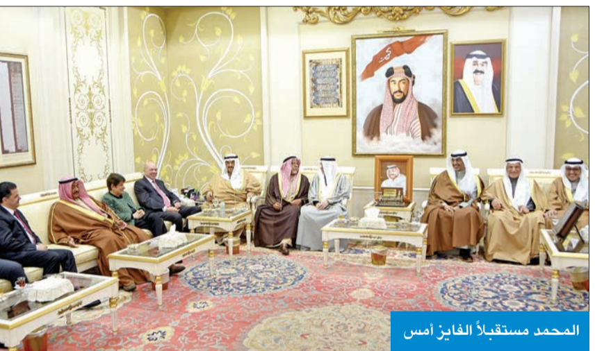
المحمد مستقبلاً الفايز أمس

واستقبل سمو رئيس مجلس الوزراء، في قصر السيف أمس، رئيس مجلس الأعيان الأردني فيصل الفايز، والوفد المرافق له، وذلك بمناسبة زيارته للبلاد.