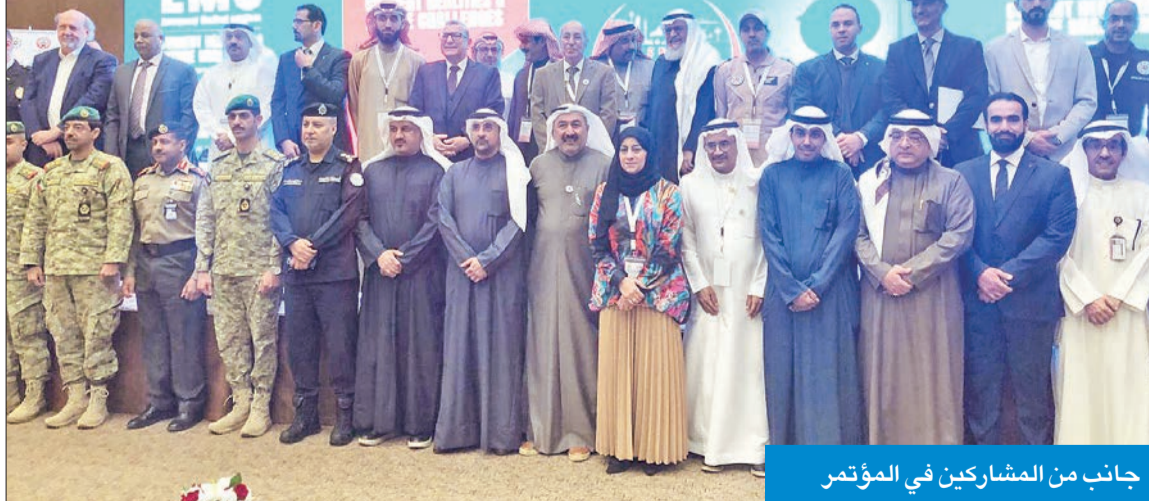
جانب من المشاركين في المؤتمر

أعلنت وزارة الصحة تدشين 10 مراكز للإسعاف خلال العام الحالي ليصل إجمالي عدد مراكز وخدمات الإسعاف في البلاد إلى 86 مركزاً و200 سيارة إسعاف.