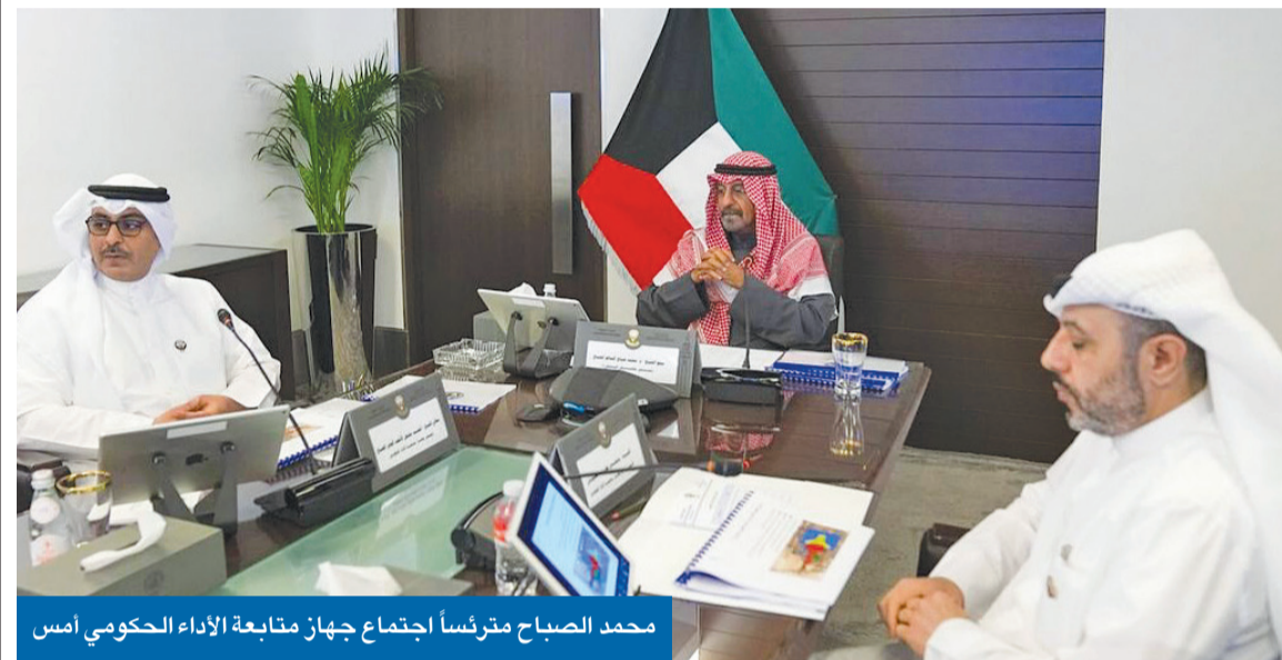
محمد الصباح مترأساً اجتماع جهاز متابعة الأداء الحكومي أمس

سموه ترأس اجتماع الجهاز واطلع على نسب إنجاز المشروعات وتذليل معوقاتها