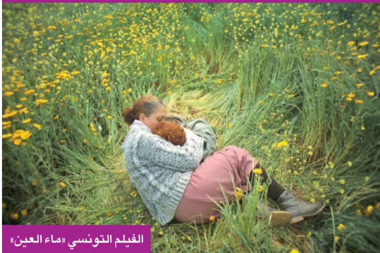
الفيلم التونسي «ماء العين»