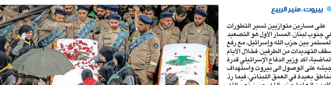
جانب من تشييع المدنيين الذين قتلوا في غارة إسرائيلية بالضفة أمس الأول

على مسارين متوازيين تسير التطورات في جنوب لبنان. المسار الأول هو التصعيد المستمر بين حزب الله وإسرائيل، مع رفع سقف التهديدات من الطرفين. فخلال الأيام الماضية، أكد وزير الدفاع الإسرائيلي قدرة جيشه على الوصول إلى بيروت واستهداف مناطق بعيدة في العمق اللبناني، فيما ردّ الأمين العام لحزب الله، حسن نصرالله، بأن إسرائيل ستدفع ثمن مقتل المدنيين اللبنانيين دماً وليس فقط مواقع. كلام نصرالله بمهّد الطريق أمام تنفيذ حزب الله عمليات عسكرية مختلفة عن العمليات التي تجري منذ 8 أكتوبر، والتي تقتصر على استهداف مواقع عسكرية أو أجهزة إرسال وتنتضت ووقف المعلومات، فإن الجهاز العسكري في الحزب يعكف على تحديد الأهداف التي سيتم ضربها.