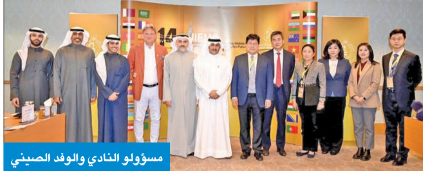
مسؤولو النادي والوفد الصيني

يهدف لتطوير الاختراعات تلبية للاحتياجات التنموية هو زينفو