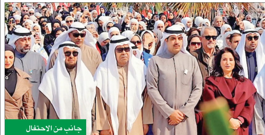
جانب من الاحتفال

أعلنت Ooredoo الكويت، تعاونها مع جامعة الكويت كراع رئيسي للاحتفالات باليوم الوطني، التي أقيمت في حرم الجامعة بمنطقة الشداية، تحت شعار «دمت يا بلدي فخراً وللعلم مهدياً». وشهدت الفعالية إقبلاً كبيراً، حيث اجتمع الآلاف من الطلاب وأفراد المجتمع للاحتفال بهذه المناسبة الوطنية. وفي مشهد يعكس التفاني في التواصل المجتمعي وإثراء الثقافة، تآلفت Ooredoo بين أكثر من 50 مؤسسة مشاركة في هذه الفعالية. وقد حظي الحضور بيوم مليء بالموسيقى الكويتية والعروض المثيرة والاحتفالات الوطنية، التي أقيمت في قاعة الدانة الحديقة الرئيسية للجامعة. ومن بين أبرز النقاط التي