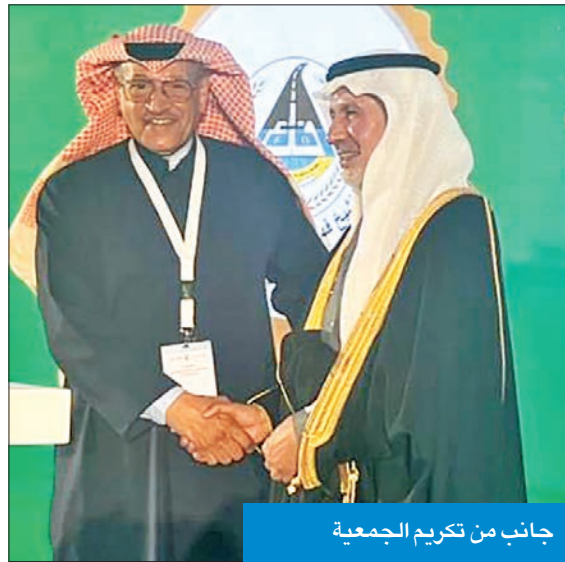
جانب من تكريم الجمعية