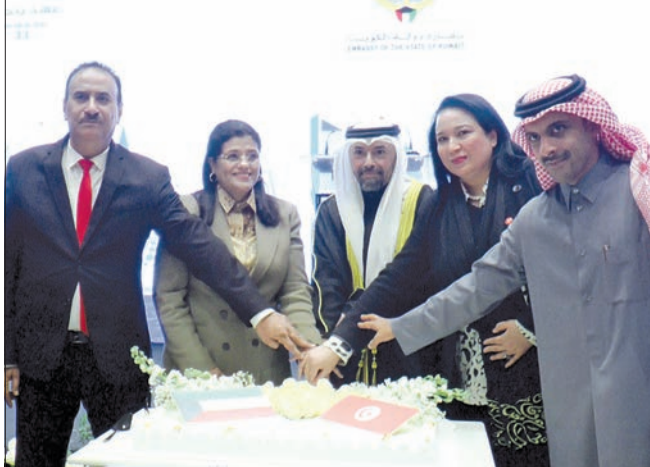
جانب من المشاركين في الاحتفال بأعياد الكويت

بين البلدين على أكثر من صعد وتعاوناً تاريخياً ونحن في لحظة عربية وعالمية تستدعي أن يتضاعف التعاون من أجل عالم عربي صامد ويسير نحو التقدم». وأقام سفير الكويت لدى تونس منصور العمر حفل الاستقبال بحضور الوزيرتين البوعديري وموسى وأعضاء السفارة الكويتية وللخبرات والتجارب بين البلدين منذ سبعينيات القرن الماضي.