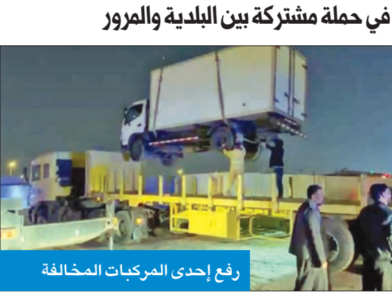
رفع إحدى المركبات المخالفة