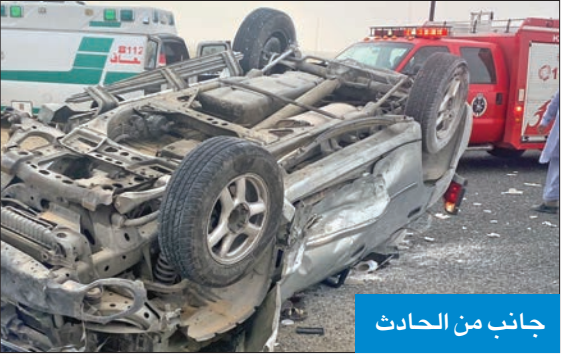
جانب من الحادث