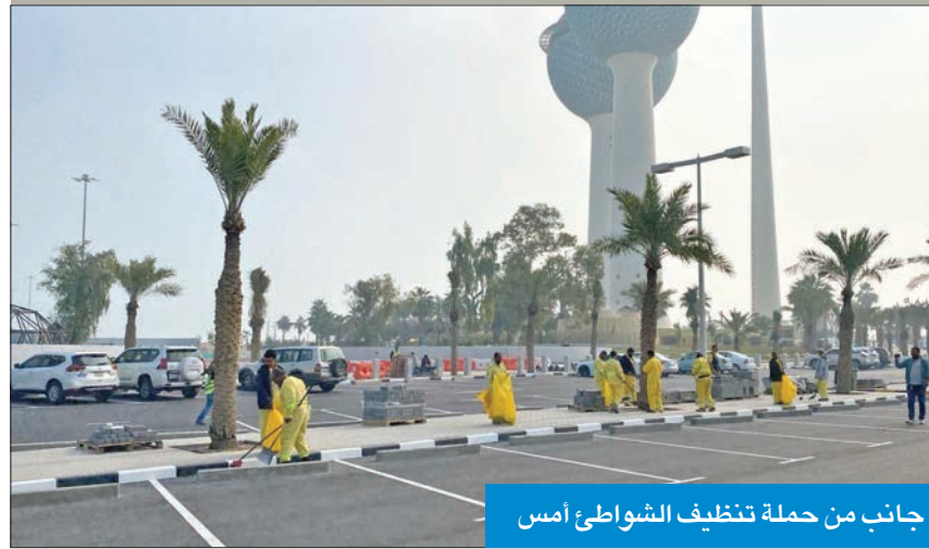
جانب من حملة تنظيف الشواطئ أمس

ذكرت العلاقات العامة في بلدية الكويت، أن فريق إدارة النظافة العامة وإشغالات الطرق بمحافظة العاصمة نفذ حملة ميدانية أمس، للتأكد من جاهزية الشريط الساحلي، إلى جانب توزيع الحاويات في الأماكن التي ستشهد الاحتفالات الوطنية. وبينت الإدارة أن الحملة عن تنظيف المرافق العامة والشريط الساحلي والأماكن المخصصة للاحتفال بالاعياد الوطنية وزعت 165