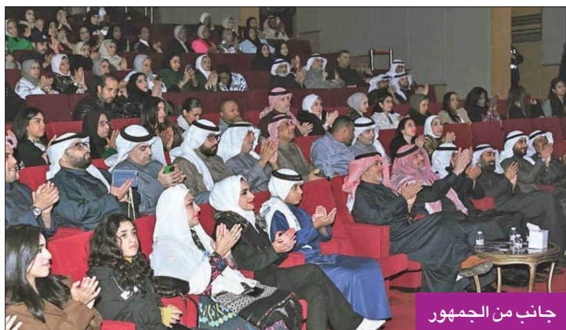
جانب من الجمهور

وتقدّم نجوم الحفل المطربين فيصل السعد وخالد المسعود وقوافل المرزوق بالشكر لجمهور الحفل الذي يتمتع بذائقة فنية وحس وطني يربطهم بالتاريخ الكويتي على مستوى الفن والموسيقى الشعبية، كما تقدّموا بالشكر لمجلس الوطني للثقافة والفنون والآداب على الاهتمام بالتراث الفني الكويتي وتخليده ونقله للجمهور جيلاً من بعد جيل.