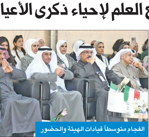
الفجام متوسطاً قيادات الهيئة والحضور

وأضاف أن «التطبيقي» مؤسسة تعليمية كبيرة، موجهة رسالة إلى منتسبيها من أعضاء هيئتي التدريس والتدريب وأيضاً الهيئة الإدارية وموظفي الهيئة، أن الكويت أعطتنا الكثير، وقد أن الأوان أن نعمل بجهد وإخلاص لرفعة هذا البلد، مضيفاً أن الطلبة هم عماد مستقبل هذا الوطن، ولا بد من الاجتهاد والمثابرة.