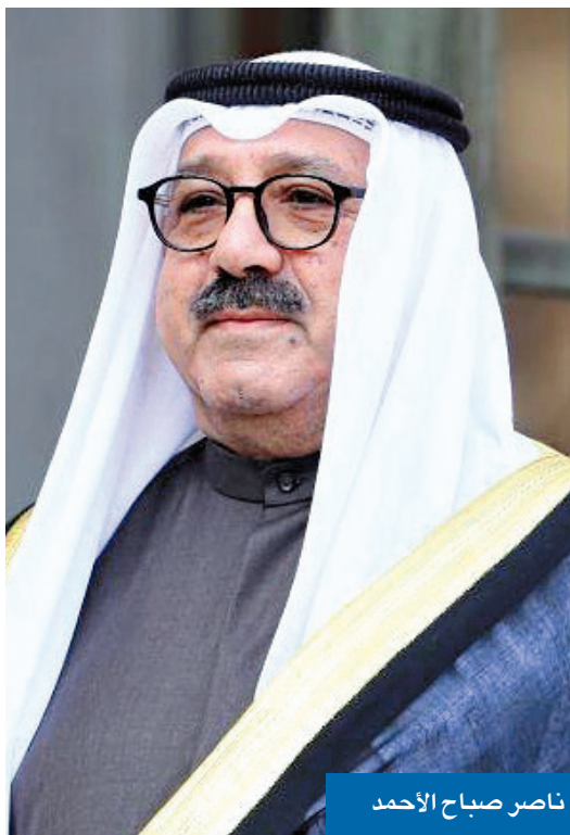
ناصر صباح الأحمد

ما تضمنه التقرير من شبهات تتعلق بوقائع تجاوزت وتعدّ على المال العام من بعض المتهمين. وأشارت المصادر إلى أنه «استناداً إلى تشكيل فريق عمل برئاسة الأمين العام لمجلس الوزراء وعضوية ممثلين عن النيابة العامة، ووحدة التحريات المالية، ووزارة الدفاع، وبنك الكويت المركزي، ليتولى الاطلاع والتدقيق على حسابات وزارة الدفاع لدى عدد من البنوك المحلية والأجنبية داخل الكويت وخارجها، وفحص الحسابات الخاصة بديوان رئيس مجلس الوزراء في كل من لندن وباريس والبحرين وسويسرا ولبنان ومصر، استمع مجلس الوزراء في اجتماعه في 12 فبراير الجاري إلى شرح قدمه فريق العمل بشأن تفاصيل التقرير النهائي عن نتائج أعمال الفريق والخطوات والإجراءات التي قام بها للتوصل إلى النتائج التي انتهى إليها التقرير وما تخيره هذه النتائج من شبهات تتضمن وقائع تجاوزت وتعدّ على المال العام».