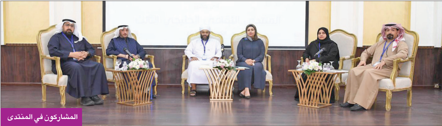
المشاركون في المنتدى

أما الشاعرة الجبري، فقد شددت بقصائد عدة تضمنت، بدوره، ألقى السعودي الشاعر محمد الجراح، قصيدة بعنوان «البرئى من براه القلث طوباً؟» في رثاء الشاعر والأديب عبدالعزيز سعود البابطين. واختتم المهرجان بقصائد للشاعر حسين العدديب من الكويت، رثى في واحدة منها الراحل الكبير الشاعر العم عبدالعزيز البابطين.