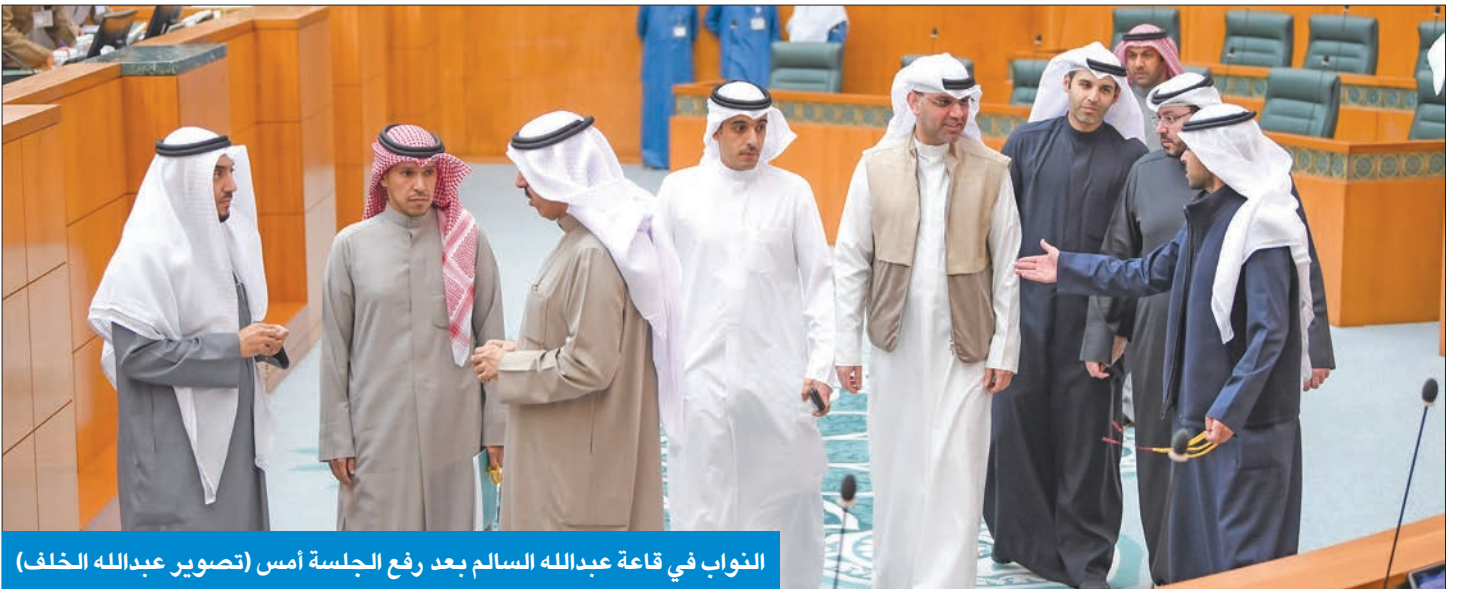
النواب في قاعة عبدالله السالم بعد رفع الجلسة أمس

السعدون: أبلغني نائب الأمير والمعوشي بعد حضورها... ورفعها إلى 5 مارس