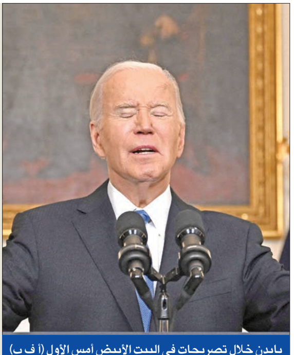
بايدين خلال تصريحات في البيت الأبيض أمس الأول

فاز توم سوزي مرشح الحزب الديمقراطي الأميركي، أمس الأول، بمقعد في مجلس النواب الأميركي في مواجهة الجمهورية مازي فيليب بعد طرد جورج سانتوس النائب الجمهوري عن دائرة في نيويورك من الكونغرس بسبب سلسلة من الأكاذيب. ومع فوز سوزي، قلص حزب الرئيس جو بايدين غالبية الجمهوريين الضئيلة أصلاً في مجلس النواب، فيما صوت الجمهوريون في مجلس النواب لصالح مشروع في إجراءات عزل وزير الأمن الداخلي أليكساندرو مايوركاس في خطوة غير مسبوقه منذ عقود.