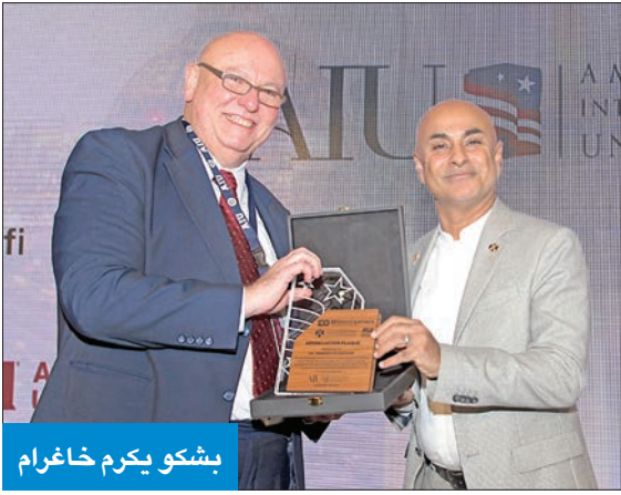
بشكو يكرم خاغر

البرنامج سيكون بـ 22 لغة حول العالم... منها «العربية» خاغر