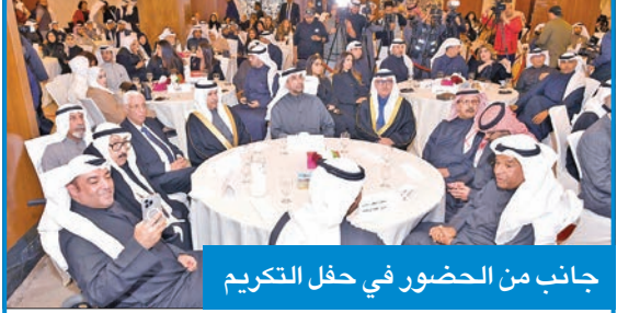
جانب من الحضور في حفل التكريم

كزت هيئة الملتقى الإعلامي العربي، أمس الأول، الفائزين بجائزة الكويت للإبداع في نسختها الـ 11 من المبدعين والمؤثرين في مجالات الفن والثقافة والعلاقات العامة والتسويق والإعلان والطب والعمل الإنساني والأعمال الفنية الوطنية، وغيرها.