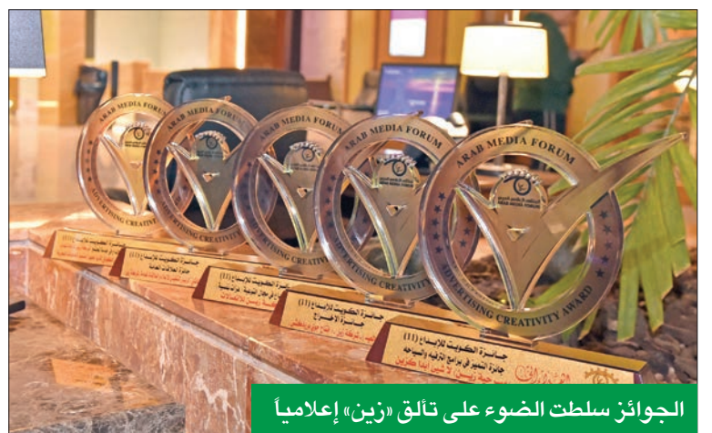
الجوائز سلطت الضوء على تالق «زين» إعلامياً

التي عودت جمهورها عليه كل عام، وعلى حرصها لتفعيل هذا الجانب لديها، كونها من كبريات المؤسسات الاقتصادية الرائدة في الكويت، حيث تؤمن الشركة بأهمية الإعلام بوسائله التقليدية والحديثة وتأثيره الكبير على المؤسسات والأفراد في المجتمع، إضافة إلى كون الإعلان التجاري وسيلة أساسية للتواصل مع المجتمع بمختلف فئاته. وشهدت الجائزة السنوية - التي تُنظّمها هيئة الملتقى الإعلامي العربي بالتعاون مع الجمعية الكويتية للإعلام والاتصال وأكاديمية الإعلام المتكامل - وجود العديد من الجهات الإعلامية والشخصيات الإبداعية في المجالات الإعلامية والإعلانية، والفنية على المستويين المحلي والإقليمي، وعدد كبير من كبار الفنانين الكويتيين