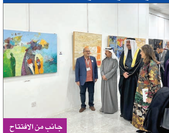
جانب من الافتتاح

افتتحت الجمعية الكويتية للفنون التشكيلية، أمس الأول، المهرجان الفني «حوار الثقافات» المشترك بين فنانى الكويت والبحرين، ضمن فعاليات مهرجان القرين الثقافي الـ 29. ويشارك في المهرجان، المقام بمقر الجمعية التشكيلية، 26 فناناً من الكويت، و14 فناناً من البحرين، بلوحات فنية مميزة. وقال رئيس الجمعية رئيس اتحاد التشكيليين العرب عبدالرسول سلمان، في كلمة الافتتاح، إن هذا المهرجان الأول من نوعه في تاريخ الحركة التشكيلية في الكويت يأتي «انطلاقاً من إدراكنا بأهمية الفن، الذي نعده مرآة للتاريخ والبشرية». وأوضح أن المهرجان، الذي يأتي تزامناً مع احتفال الجمعية بمرور 55 عاماً على تأسيسها، يعكس حرصها على تنظيم تظاهرات فنية تجمع فنانين «رسموا مسيرة الفن المضيئة خلال العقود الماضية».