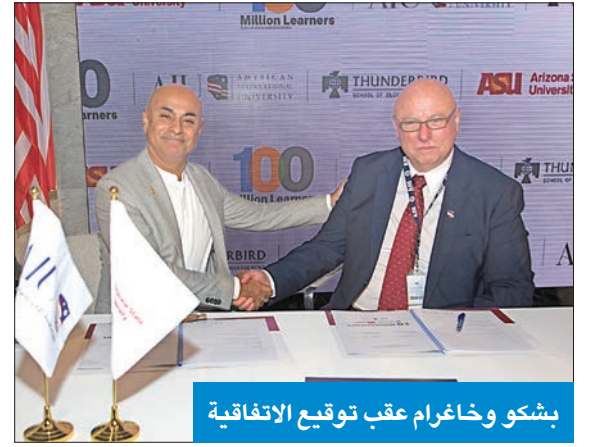
بشكو وخاغر عقب توقيع الاتفاقية