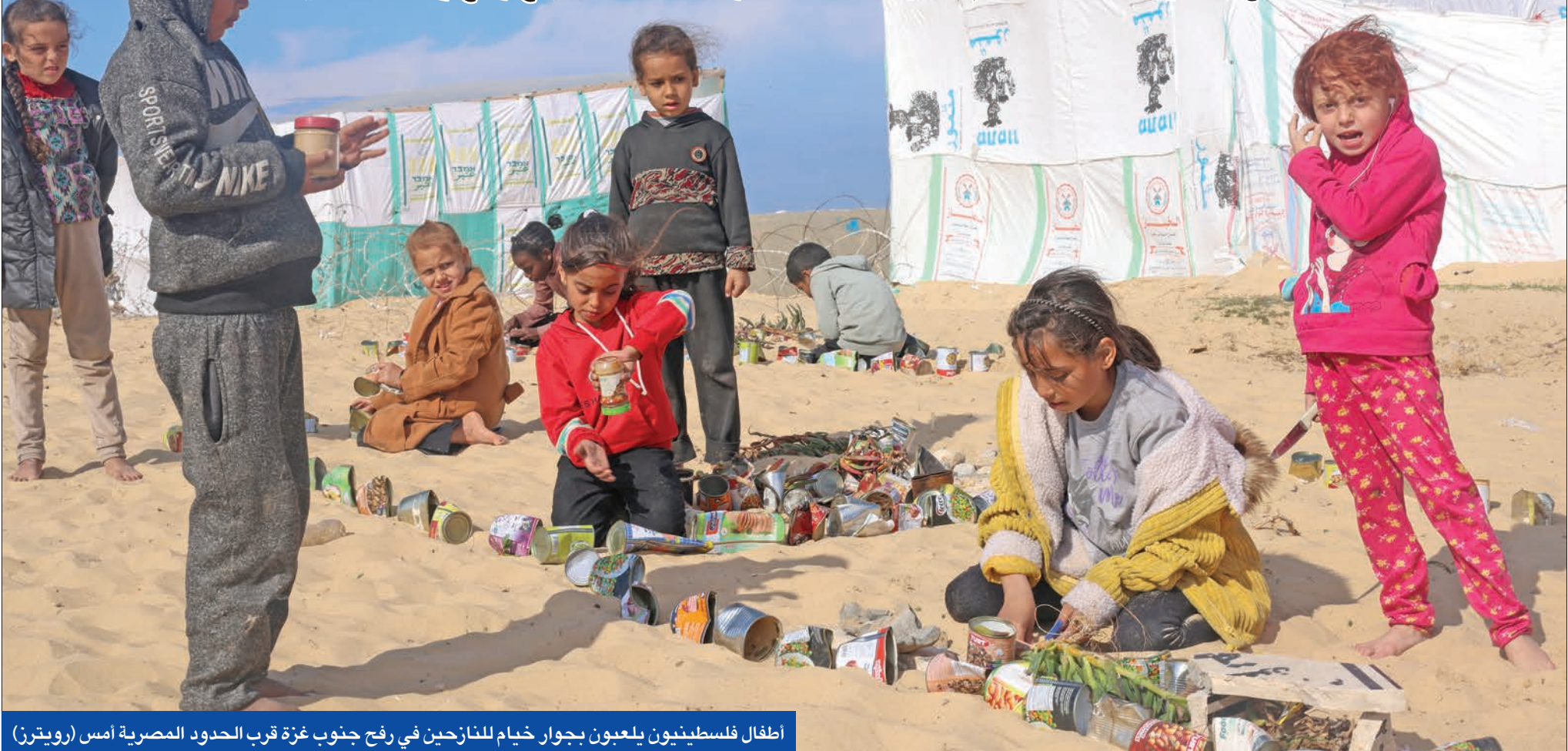
اطفال فلسطينيون يلعبون بجوار خيام للاجئين في رفح جنوب غزة قرب الحدود المصرية أمس

عباس يستعجل الجميع خصوصاً «حماس» لإنجاز صفقة الأسرى لتجنب اجتياح رفح و«نكبة جديدة»