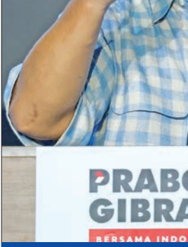
سويانتو يعلن فوزه وبجانبه نجل الرئيس المنتهية ولايته ويدودو بجكرتا أمس

أعلن وزير الدفاع الإندونيسي برابوو سويانتو فوزه في الجولة الأولى من الانتخابات الإندونيسية أمس بعدما أشارت النتائج الأولية إلى أنه في طريقه ليصبح رئيس أكبر قوة اقتصادية في جنوب شرق آسيا. ولن تصدر النتائج الرسمية حتى الشهر المقبل لكن مراكز استطلاع تعترف بها الحكومة جمعت عينات من الأصوات في مراكز الاقتراع للقيام بعمليات «فرض سريعة» سبق أن نجتصحتها أشارت إلى نيل سويانتو أكثر من 55 في المئة من الأصوات، بعد فرز معظم الأصوات ضمن العينة. وقال سويانتو أمام حشد في وسط جاكارتا «في جميع الحسابات والاستطلاعات.. تظهر الأرقام فوز برابوو-جبران من جولة واحدة. يجب أن يشكل هذا الانتصار انتصاراً لجميع الإندونيسيين»، في إشارة إلى المرشح لمنصب نائب الرئيس جبران راکابومينغ راکا (36 عاماً) النجل البكر للرئيس المنتهية ولايته جوكو ويدودو. ورغم إعلانه الفوز، إلا أنه أكد بأنه سينتظر صدور النتيجة الرسمية، عن لجنة الانتخابات، وقال لانتصاره «نؤمن بان الديمقراطية تسير