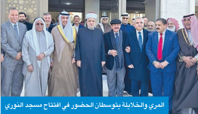
المري والخليلة يتوسطان الحضور في افتتاح مسجد النوري

سفيرنا بالأردن أشاد بالعلاقات المتميزة بين البلدين