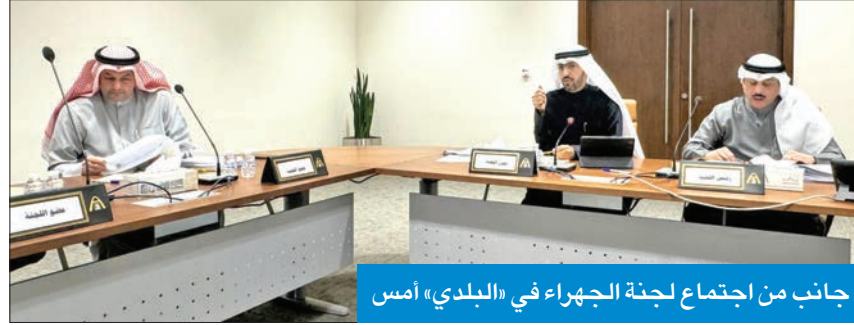
جانب من اجتماع لجنة الجھراء في «البلدي» أمس

والنقل البري تخصيص مواقع أحواض وقنوات مائية مكشوفة، ووصلة مائية تحت سطح الأرض وسائر ترابي وذلك لتجميع وتصريف مياه الأمطار حول منطقة الصابرية، بينما أبتت اللجنة على جدولها كلا من طلب تخصيص مواقع أحواض مكشوفة لتجميع مياه الأمطار وقناة مائية تحت سطح الأرض ومسارات لصرف