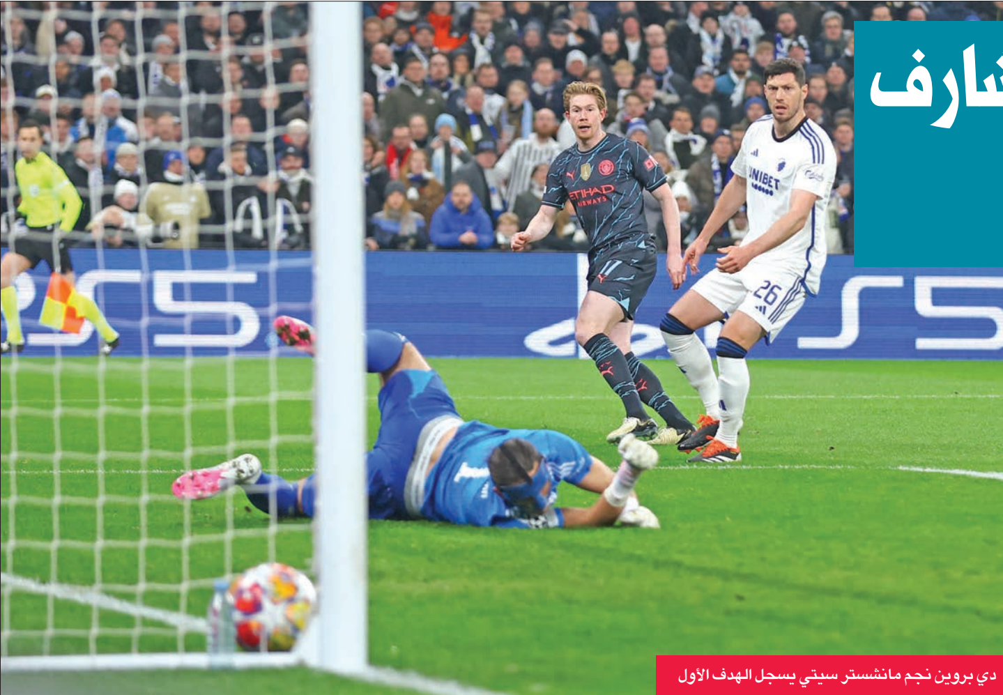
دي برون نجم مانشستر سيتي يسجل الهدف الأول