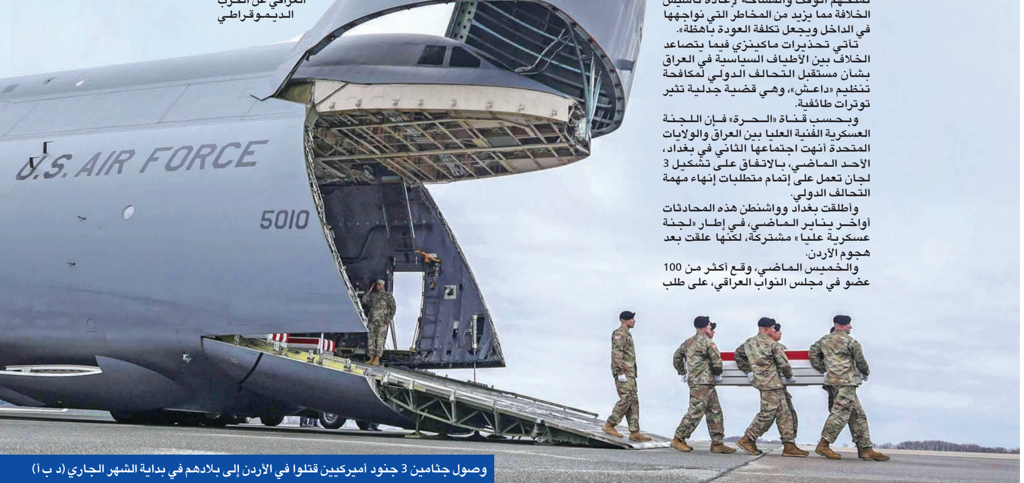
وصول جنائمين 3 جنود أميركيين قتلوا في الأردن إلى بلادهم في بداية الشهر الجاري (د ب أ)

قال قائد أركان الجيش الأميركي السابق كينيث ماكينزي إن الوقت لم يحن لسحب القوات الأميركية من منطقة الشرق الأوسط، خصوصاً العراق وسورية، مضيفاً أن انسحاباً أميركياً سريعاً سيكون دليلاً على ضعف أميركي لن يتردد الخصوم في استغلاله، فيما يتطلب المقاء دعماً فعالاً لإيران والمليشيات المدعومة منها. وفي مقال بصحيفة «نيويورك تايمز» حذر ماكينزي من فكرة سحب القوات من سورية في ظل الحوار مع الحكومة العراقية حول الوجود العسكري الأميركي في العراق، هي خطوة تشكل خطراً على مصالح الولايات المتحدة بالمنطقة وتعطي الأمل ل طهران بأنها تنجح في تحقيق هدفها طويل المدى المتمثل في إخراج الأميركيين من المنطقة. وأشار الجنرال الأميركي إلى أن الهجوم على قاعدة في الأردن الذي أسفر عن مقتل ثلاثة جنود أميركيين أثار تساؤلات جديدة حول سلامة الآلاف من العسكريين الأميركيين المتمركزين في الأردن وسورية والعراق مع اتساع الصراع في الشرق الأوسط. وأكد ماكينزي أن «ما نحتاج إليه الآن هو قرار رئاسي تم تأجيله لفترة طويلة بالتزام حازم بإبقاء قواتنا في سورية والتزام إضافي دقيق بالعمل مع الحكومة العراقية لإيجاد مستوى مقبول للطرفين».