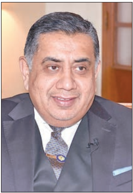
اللورد طارق أحمد

تؤيد حل الدولتين، حيث إن أفضل حل لضمان الاستقرار والأمن في المنطقة هو حل الدولتين وموقف المملكة المتحدة تجاه الشعب الفلسطيني واضح في شأن هذه المسألة.