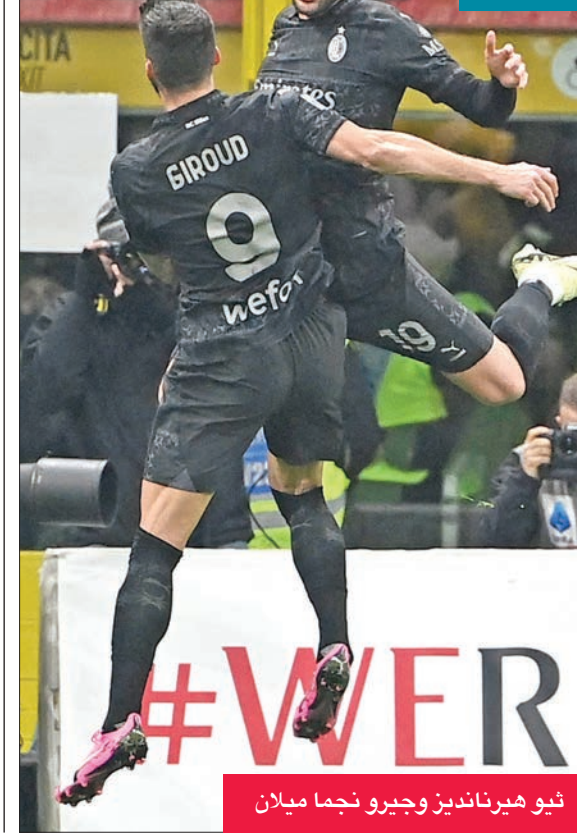
ثيو هيرنانديز وجيرو نجما ميلان

وتعرض فريق المدرب الإيطالي جينارو غاتوزو لسلطة جديدة، بعد تعادله المخيب أمام متز 1-1 الجمعة في الدوري المحلي، حيث تراجع إلى المركز الثامن دون أي فوز في آخر خمس مباريات، وبفارق 20 نقطة عن باريس سان جيرمان المتصدر. لكن تحسن أداء الفريق الجنوبي أمام متز يعيد له الثقة في المسابقة الوحيدة التي ابتمتت له هذا الموسم، خصوصاً في ظل عودة لاعبيه من كأس أمم إفريقيا التي اختتمت الأحد في ساحل العاج. في المقابل، يخوض شاختار المنافسات، حامل لقب 2009، وبلاد غارقة في الحرب. وفي باقي المباريات، يلعب يونغ بويز السويسري مع سيورتيغ البرتغالي، وغلطة سراي التركي مع سبارتا براغ التشيكي، ولنكس الفرنسي مع فرايبورغ الألماني، وبنفيكا البرتغالي مع تولوز الفرنسي، وبرافا البرتغالي مع قره باغ الأذربيجاني.