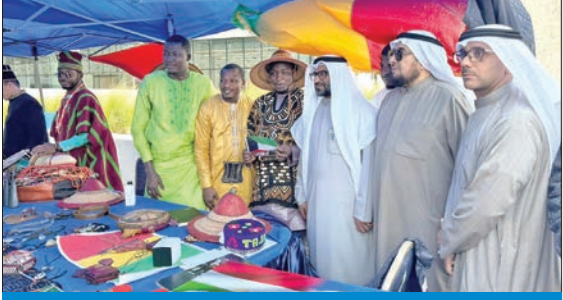
الحرفي متوسطاً الحضور خلال أجواء الفعالية

احتفالاً بالأعياد تحت شعار «دمت يابلادي فخراً وللعلم مهداً»