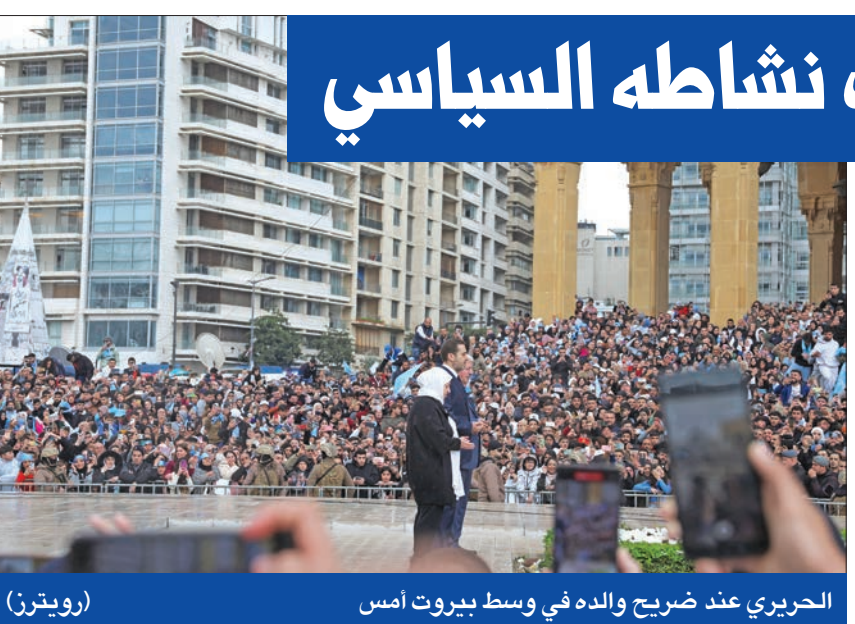
الحريري عند ضريح والده في وسط بيروت أمس

أنهى رئيس الحكومة اللبنانية السابق سعد الحريري، أمس، التحقيقات بالتراجع عن قرار تعليق عمله إلى لبنان لإحياء ذكرى اغتيال والده رئيس الحكومة الراحل وفيق الحريري في 2005. ووسط حشد شعبي كبير من أنصار نيار «المستقبل» تواجد من مختلف المناطق، زار الحريري ضريح والده في وسط بيروت بالذكري السنوية التاسعة عشرة لاغتياله، قبل أن يلقي كلمة أمام أنصاره في بيت الوسط. ولم يعن الحريري التراجع