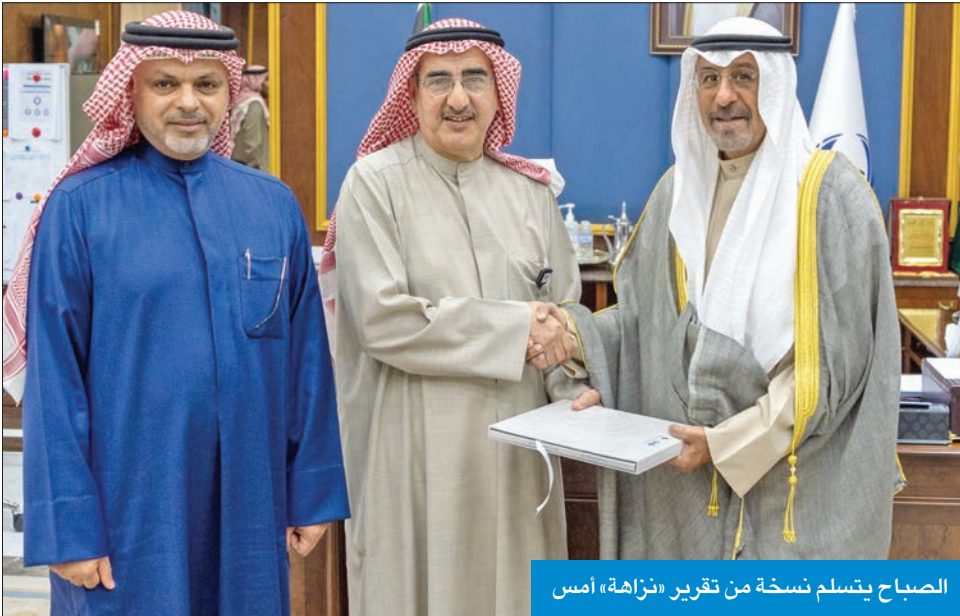
الصباح يتسلم نسخة من تقرير «نزاهة» أمس

التقى سمو الشيخ الدكتور محمد الصباح، رئيس مجلس الوزراء، أمس، رئيس الهيئة العامة لمكافحة الفساد (نزاهة) عبدالعزيز الإبراهيم في مقر الهيئة، حيث تسلم سموه نسخة من التقرير نصف السنوي لأعمال الهيئة. وقدم سموه خلال زيارته للهيئة إقراراً بذمته المالية وفقاً للقانون رقم (2) لسنة 2016 في شأن إنشاء الهيئة العامة لمكافحة الفساد والأحكام الخاصة بالكشف عن الذمة المالية ولائحته التنفيذية.