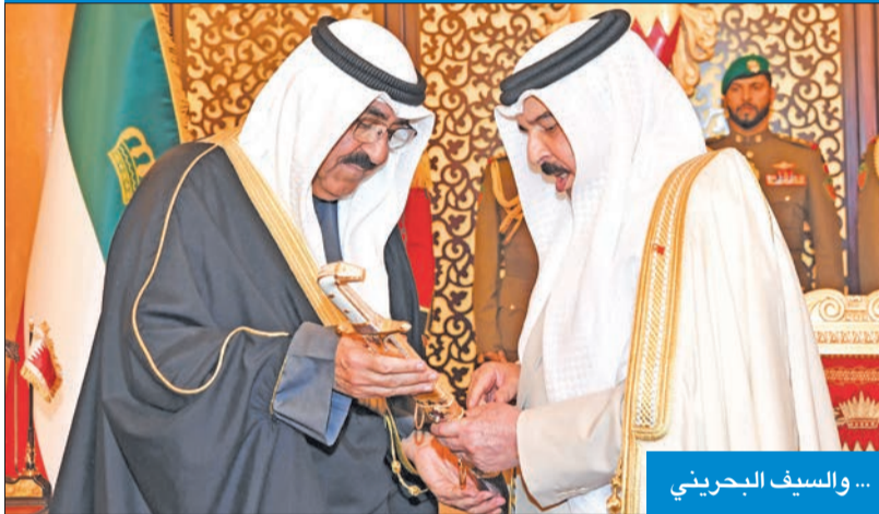
... والسيف البحريني