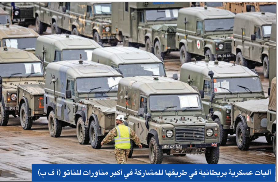
ليات عسكرية بريطانية في طريقها للمشاركة في أكبر مناورات للناتو

وصف تقرير لمعهد «تشاتام هاوس»، المعلومات التي نشرتها وكالة «رويترز» في نهاية يناير الماضي، حول ضغط صيني على إيران لكبح هجمات الحوثيين ضد السفن في البحر الأحمر، بأنه غير دقيق. وبحسب تقرير المعهد البريطاني المعني بالسياسات الدولية، قد تكون الصين قد ضغطت بالفعل على إيران في الأسابيع الماضية، حيث أكد وزير الخارجية الصيني وانغ يي أن بلاده «تبدل جهوداً نشطة لتخفيف التوترات في البحر الأحمر منذ البداية»، لكن مسؤولاً إيرانياً كشف أنه «بالأساس»، قالت الصين إنه إذا تضررت مصالحنا بأي شكل من الأشكال فسيؤثر ذلك على علاقاتنا التجارية مع طهران لذلك أطلب من الحوثيين ضبط النفس».