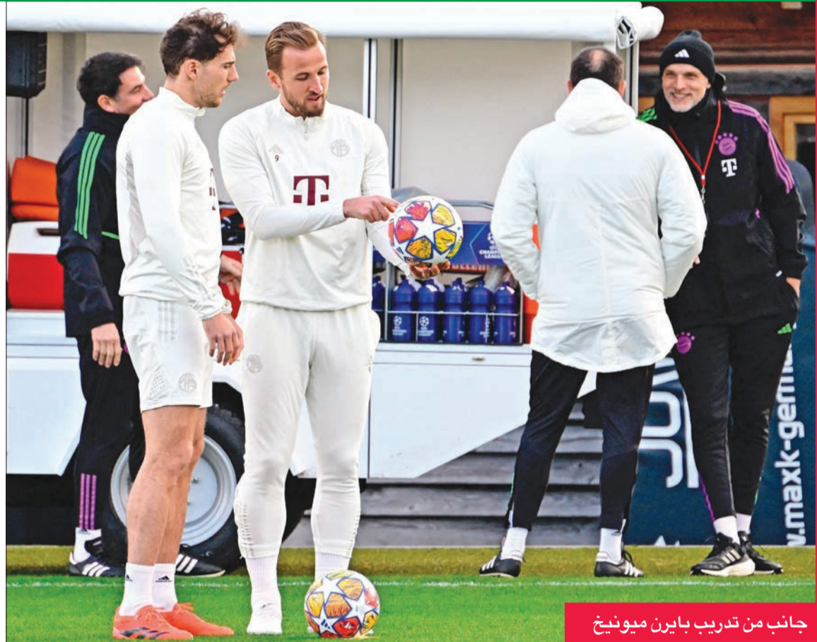
جانب من تدريب بايرن ميونخ

مهمة شاقة اليوم في باريس ضد سان جرمان الذي سيكون باستطاعته الاعتماد على نجمه المطلق كيليان مبابي المتعافى من الإصابة. ولم يشارك مبابي في المباراة التي فاز فيها فريقه على ضيفه ليل 3 - 1 السبت في الدوري، بعدما فضل إنريكي عدم المخاطرة بمنصهر هدافي الدوري (20 هدفاً)، فأبقاه على مقاعد الاحتياط بعد إصابته في الكاحل خلال الفوز على بريست 3 - 1 في ربيع نهائي كأس فرنسا.