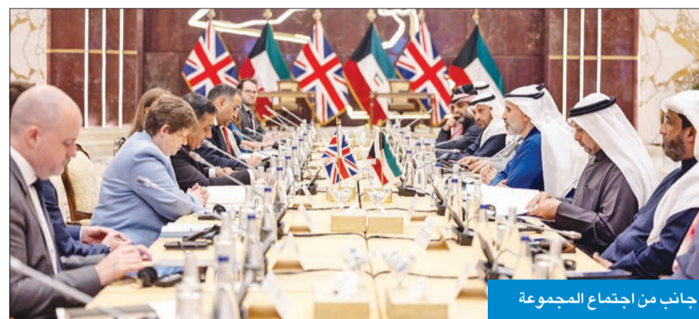
جانب من اجتماع المجموعة

وعلى صعيد التعاون الاقتصادي والتجاري، أشاد الجانبان بمستوى النمو الثابت لمعدل التبادل التجاري المتميز سنوياً مع التأكيد على أهمية الحفاظ على تدفق الاستثمارات المتبادلة والتطلع لمواصلة الشراكة التجارية والاقتصادية بين البلدين والاستفادة من خبرات الجانب البريطاني في مجال دعم وتنمية قطاع المشروعات الصغيرة والمتوسطة، كما أعرب الجانبان عن تطلعهما إلى الفعالية التي ستقيمه هيئة تشجيع الاستثمار المباشر في لندن خلال مارس المقبل. وفي التعاون الثقافي والتعليمي، تم تسليط الضوء على برامج الإبتعاث للدراسة في المملكة المتحدة باعتبارها وجهة رئيسية للطلبة الكويتيين، إذ تجاوز عدد الطلبة هذا العام 9500 طالب وطالبة يتلقون تعليمهم في الجامعات والمؤسسات الأكاديمية البريطانية بمختلف التخصصات، كما ناقشا العمل على