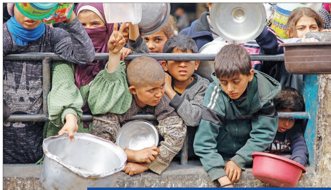
اطفال عند نقطة توزيع وجبات للنازحين برفق قرب الحدود المصرية أمس

اختتمت في اندونيسيا الحملات الانتخابية التي استمرت حوالي 3 أشهر فيما يستعد أكثر من 200 مليون ناخب للإدلاء بأصواتهم اليوم في الانتخابات الرئاسية لأقوى دولة بمنطقة جنوب شرق آسيا، والتي من المرجح أن تلعب دوراً رئيسياً في تحديد مسار علاقاتها مع الصين والولايات المتحدة إضافة إلى مصر الديموقراطية في البلاد. ويتوجه ناخبو اندونيسيا إلى صناديق الاقتراع ليس فقط لاختيار رئيس جديد ونائب رئيس، بل كذلك برلمان مركزي وبرلمانات على مستوى الأقاليم والمحافظات، بواقع انتخاب 20 ألف نائب وممثل لهذه البرلمانات. وتعد هذه الانتخابات الأكبر التي تجرى في العالم في يوم واحد فقط.