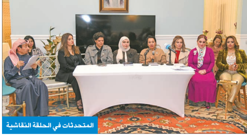
المتحدثات في الحلقة النقاشية

● حلقة نقاشية لناشطات أثارت مفهوم الضوابط الشرعية في المادة 16 من القانون ● نادية العثمان: السلطان لا تلتفتان إلى أصوات الناشطين والكتاب حول مثالب القانون