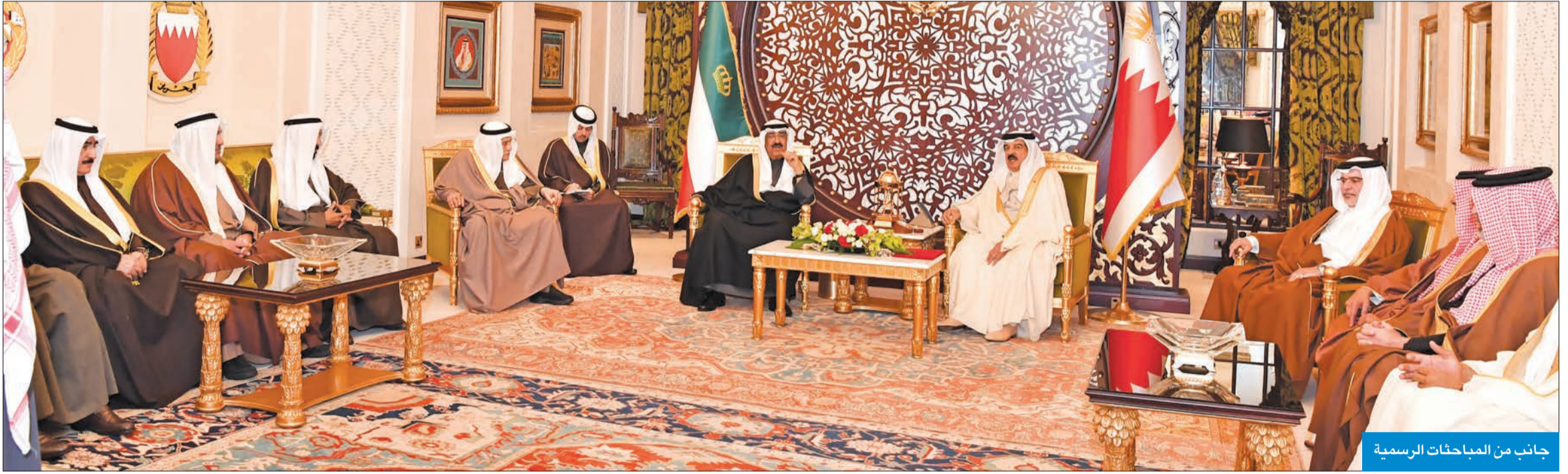
جانب من المباحثات الرسمية