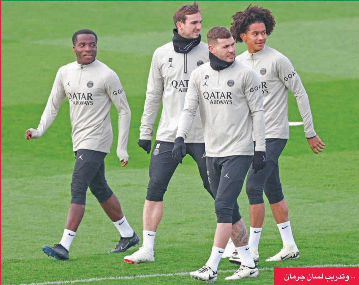
... وتدريب لسان جرمان