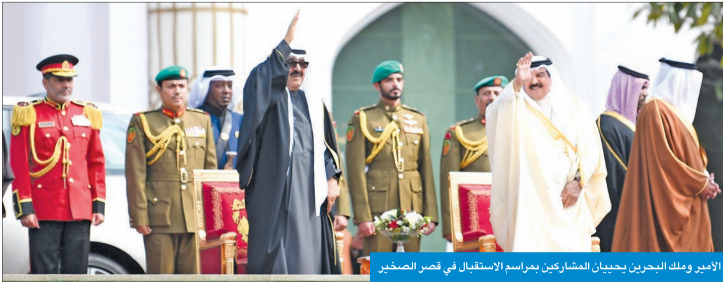
الأمير وملك البحرين يحييان المشاركين بمراسم الاستقبال في قصر الصخير

فرق شعبية أدت العرضة البحرينية احتفالاً بقدوم صاحب السمو إلى المملكة