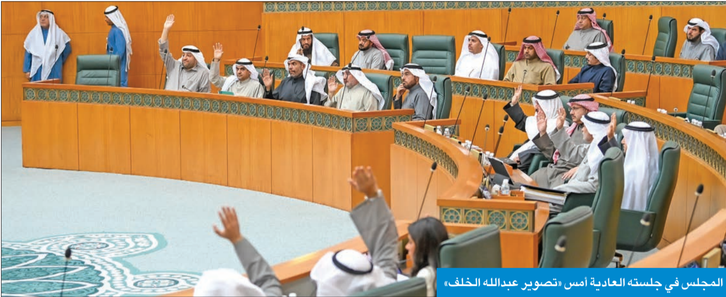
المجلس في جلسته العادية أمس

سجلات نيابية - نيابية ونيابية - حكومية في بند الرسائل الواردة والأسئلة البرلمانية