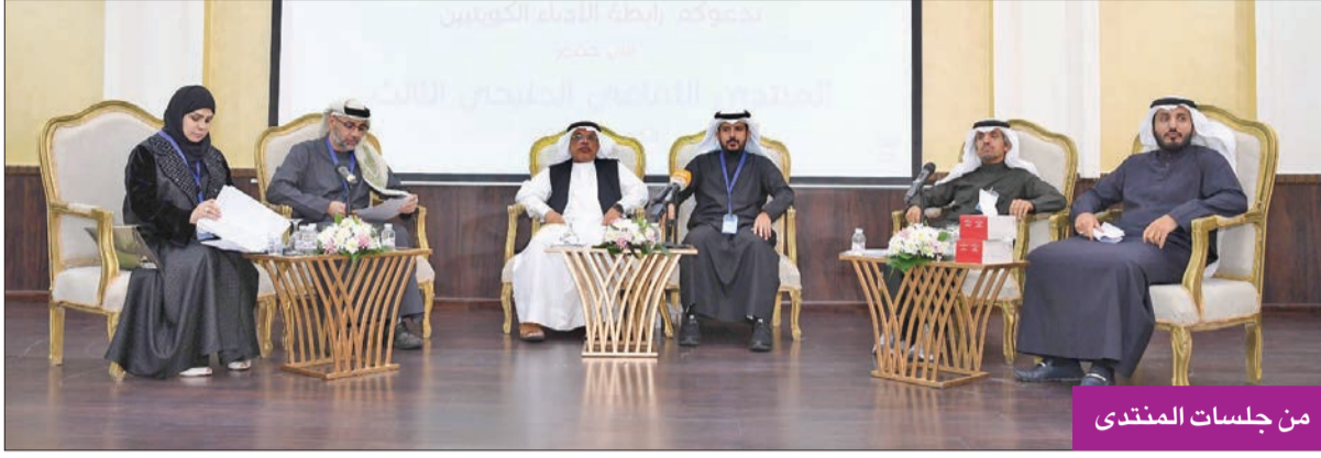
من جلسات المنتدى