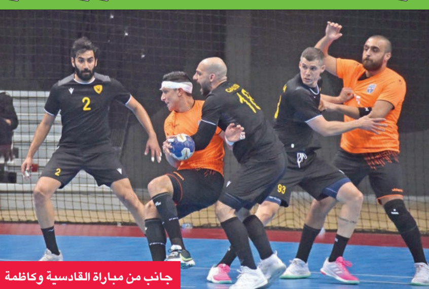
جانب من مباراة القادسية وكازمة

ثالثاً، وكازمة رابعاً، والسالمية خامساً بفارق الأهداف ورسيد واحد بنتيقتين، وجاء النصر في المركز السادس، والصليبيخات سابعاً، وبرقان ثامناً، والقرين تاسعاً، وفارق الأهداف ونقطة واحدة لكل منهم، فيما ظل اليرموك