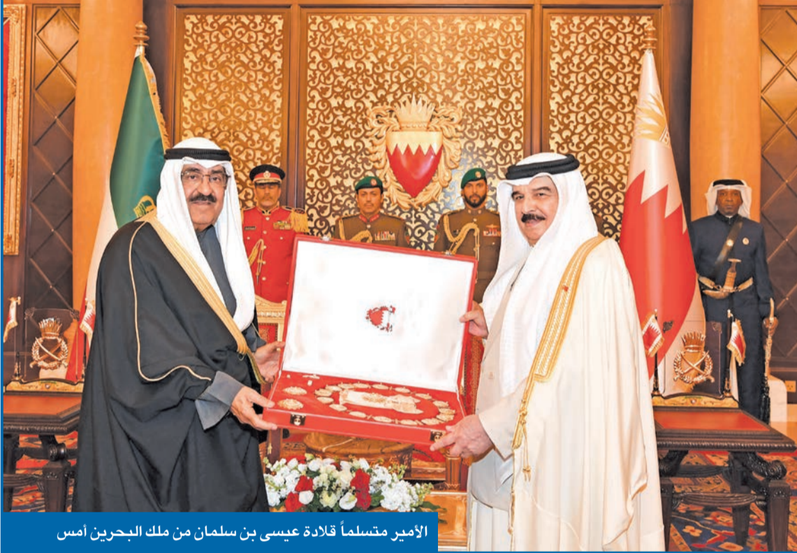
الأمير متسلماً قلادة عيسى بن سلمان من ملك البحرين أمس

● عاهل البحرين: المزيد من التقدم والرفي للشعب الكويتي الشقيق في ظل القيادة الحكيمة للأمير