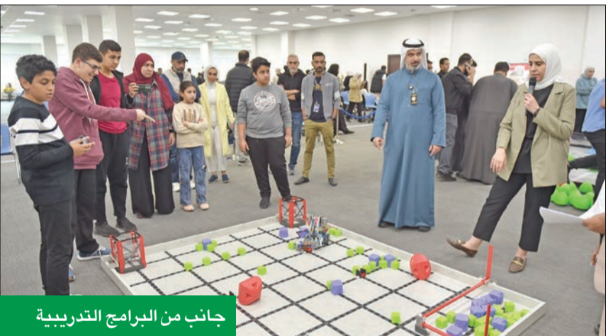
جانب من البرامج التدريبية

القطاعات لتأهيل الجيل القادم من المبتكرين في الكويت. وتندرج هذه الشراكة الاستراتيجية تحت مظلة مبادرة «وطن الابتكار»، والتي تشمل جميع مبادرات وجهد «زين» لدعم الإبداع وتعزيز المهارات التقنية وتمكين زيادة الأعمال في المجتمع، خصوصاً في مجالات التكنولوجيا والهندسة والعلوم والرياضيات (STEM)، وتستهدف الشباب من الأعمار من 10 إلى 19 عامًا، وتضم سلسلة البرامج والمبادرات التي تقدمها كل من زين والمركز تحت مظلة شراكتها الاستراتيجية التي بدأت العام الماضي، بهدف تحقيق عدد من الأهداف الاستراتيجية المستدامة ضمن رؤيتهم المشتركة، والتي تتضمن العديد من الركائز مثل دعم الابتكارات وريادة الأعمال، وتمكين أصحاب الشركات الناشئة، وتعزيز صلابة الإبداع، والاستثمار في المهارات الرقمية لدى الشباب، وغيرها.