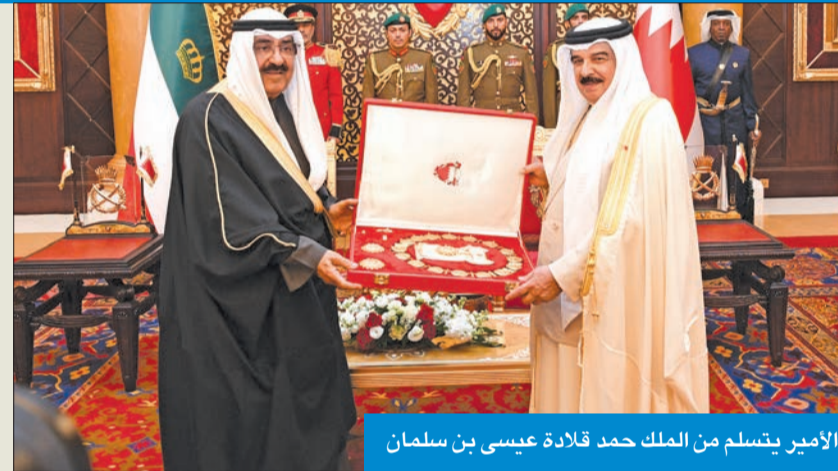
الأمير يتسلم من الملك حمد قلادة عيسى بن سلمان

قلد الملك حمد بن عيسى صاحب السمو أمير البلاد قلادة الشيخ عيسى بن سلمان آل خليفة من الدرجة الممتازة (القلادة) تقديراً لجهود سموه ودوره البارز في توطيد العلاقات الثنائية وتوثيق الأواصر التاريخية بين البلدين الشقيقين وذلك في قصر الصخير بالعاصمة البحرينية المنامة. كما قام ملك البحرين بإهداء سموه هدية تذكارية (السيف البحريني) بهذه المناسبة. وألقى الشاعر محمد هادي الحلواجي قصيدة شعرية لاقت استحسان الحضور.