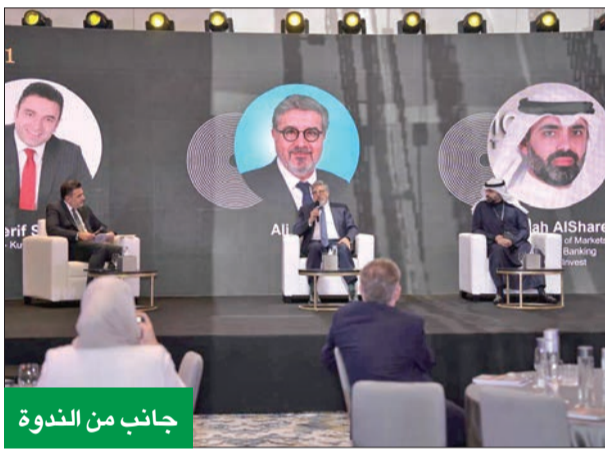
جانب من الندوة

«المركز» شارك في الندوة السنوية لـ «برايس ووترهاوس كوبرز» حول الضرائب