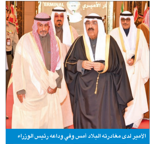
الأمير لدى مغادرته البلاد أمس وفي وداعه رئيس الوزراء