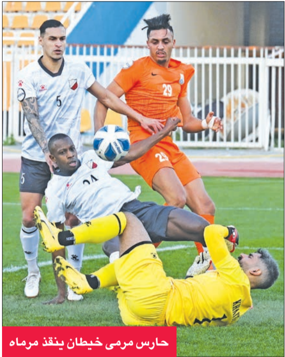
حارس مرمى خيطان ينقذ مرماه

فرض التعادل السلبي نفسه على مباراة كاظمة وخيطان، ضمن منافسات الجولة الخامسة عشرة لدوري زين الممتاز لكرة القدم. بهذه النتيجة، ارتفع رصيد كاظمة إلى 18 نقطة في المركز السابع، ورصيد خيطان إلى 8 نقاط في المركز التاسع، وتؤكد بشكل رسمي مشاركته في المجموعة الثانية «مجموعة الهبوط».