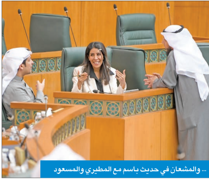
... والمشعان في حديث باسم مع المطيري والسعدون