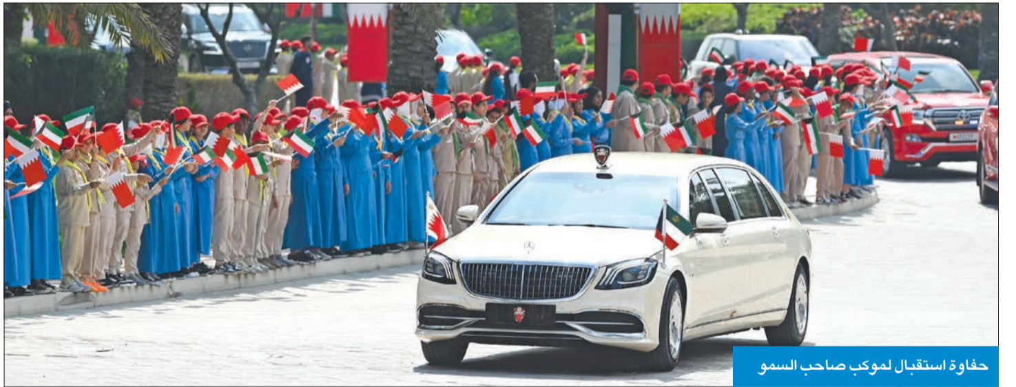
حفاوة استقبال لوكب صاحب السمو