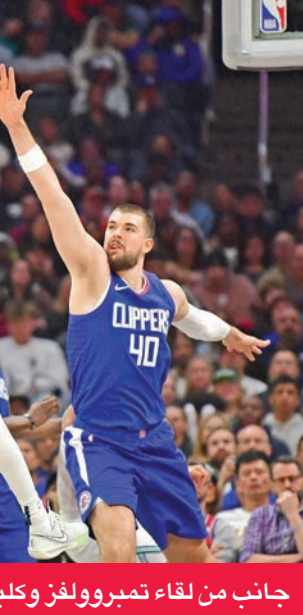
جانب من لقاء تمبروولفز وكليبرز

وفي ثورونثو، واصل «المبتدئين» ويمبانياما تالقه في موسمه الأول، بتحقيقه ثلاثة أرقام مزدوجة «تريبل دابل»، بعدما سجل 27 نقطة مع 14 متابعة و10 اعتراضات دفاعية (بلوك)، وأضاعاً بذلك حداً لمسلسل هزائم سبيرز عند سبع مباريات متتالية، وملحقاً برباوتوز الهزيمة الخامسة والخلائين.