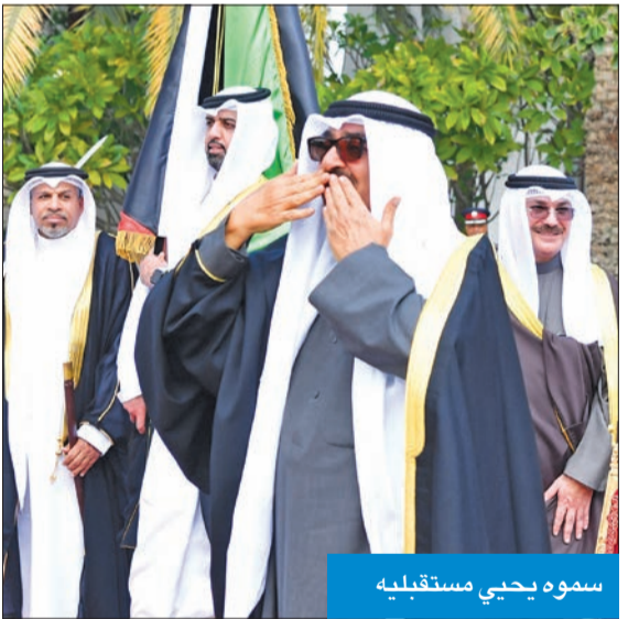
سموه يحيي مستقبليه

كما كان في استقبال سموه ولي العهد رئيس مجلس الوزراء بالمملكة الأمير سلمان بن حمد، ورئيس الحرس الوطني البحريني الشيخ محمد بن عيسى، والممثل الشخصي للملك الشيخ عبدالله بن حمد، وممثل الملك للأعمال الإنسانية وشؤون الشباب الشيخ ناصر بن حمد، والنائب الأول لرئيس المجلس الأعلى للشباب والرياضة، رئيس اللجنة الأولمبية البحرينية، رئيس الهيئة العامة للرياضة، الشيخ خالد بن حمد، ورئيس الديوان الملكي الشيخ خالد بن أحمد، والقائد العام لدفاع البحرين