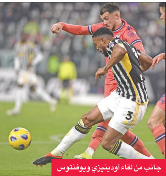
جانب من لقاء أودينيزي ويوفنتوس

وجه أودينيزي ضربة جديدة لأمل يوفنتوس في استعادة لقب «السيري أ»، بالفوز عليه في عقر داره بهدف نظيف، في اللقاء الذي احتضنه ملعب البانز ستاديوم، أمس الأول (الأثنين)، في ختام الجولة الـ 24 بدوري الدرجة الأولى الإيطالي لكرة القدم.