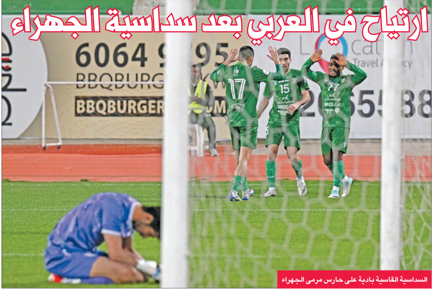
السداسية القاسية بادية على حارس مرمى الجهراء

في حدود المتاح، مؤكداً أنه كان يتطلع مع اللاعبين إلى الظهور بصورة أفضل.