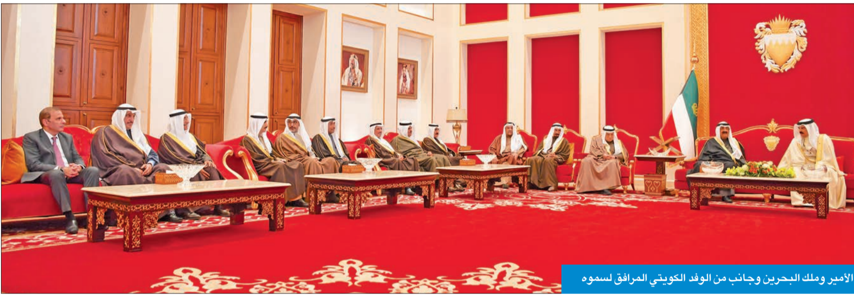
الأمير وملك البحرين وجانب من الوفد الكويتي المرافق لسموه