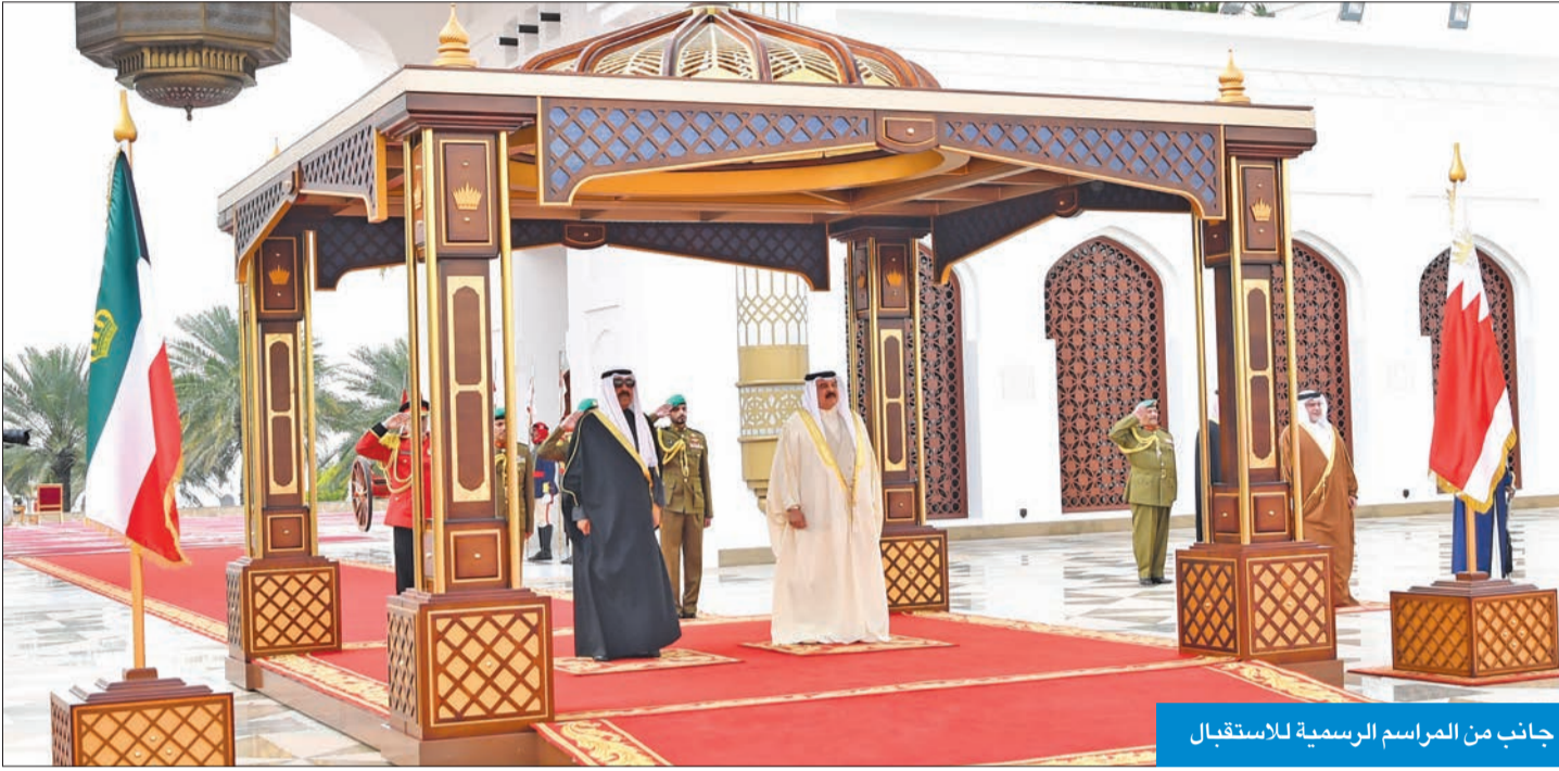
جانب من المراسم الرسمية لاستقبال