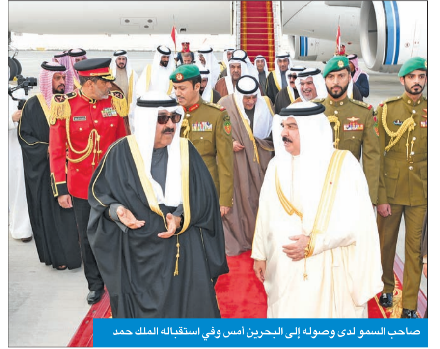
صاحب السمو لدى وصوله إلى البحرين أمس وفي استقباله الملك حمد