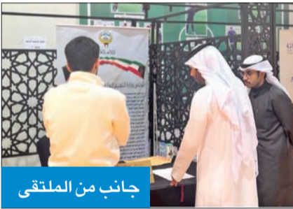
جانب من الملتقى

لتعريف الطلاب المتوقع تخرجهم بشروط القبول بالبعثات الخارجية