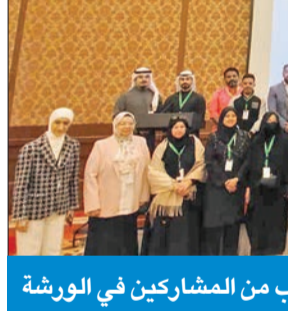
جانب من المشاركين في الورشة

وأكدت أن أمراض القلب والأوعية الدموية تسبب في أكبر عدد من الوفيات الناجمة عن الأمراض غير السارية في الكويت، بنسبة 41%، تليها أمراض السرطان بنسبة 15%، ومن ثم أمراض القلب والأوعية الدموية بنسبة 6%، ومرض السكري بنسبة 3%، وأشارت إلى أن تنظيم هذه الورشة يهدف إلى نشر الوعي الصحي وتقديم الخطط والسياسات التي من شأنها أن تشجع المجتمع الكويتي بكل فئاته العمرية على الحركة وتجنب الخمول البدني. وشددت على أهمية ممارسة النشاط البدني كل حسب عمره ولطاقته البدنية وقدرته، لافتة إلى أن الأمراض غير السارية هي السبب الرئيسي للوفيات على مستوى العالم.