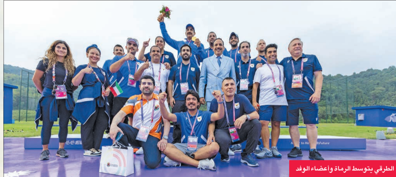
الطريقي يتوسط الرماة وأعضاء الوفد

أزرق اليد فاز على الصين وتأهل للدور الثاني في المجموعة الأولى