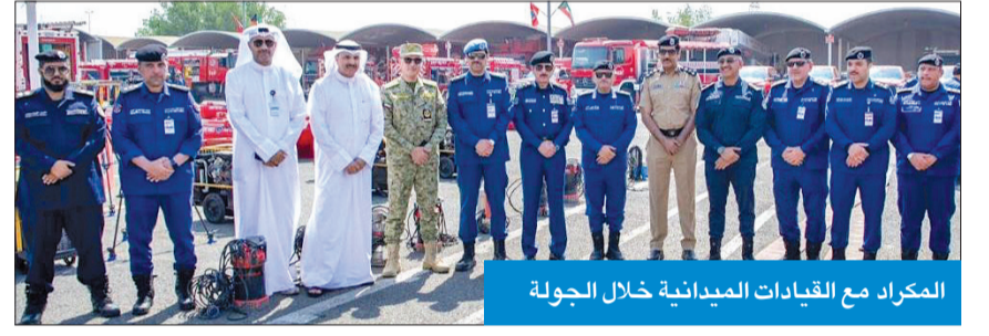
المركز مع القيادات الميدانية خلال الجولة

المركز تفقد استعدادات القوة في مركز الإسناد بالري