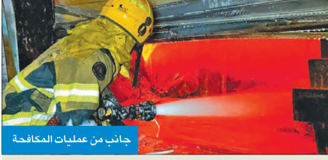
جانب من عمليات الكفاحية