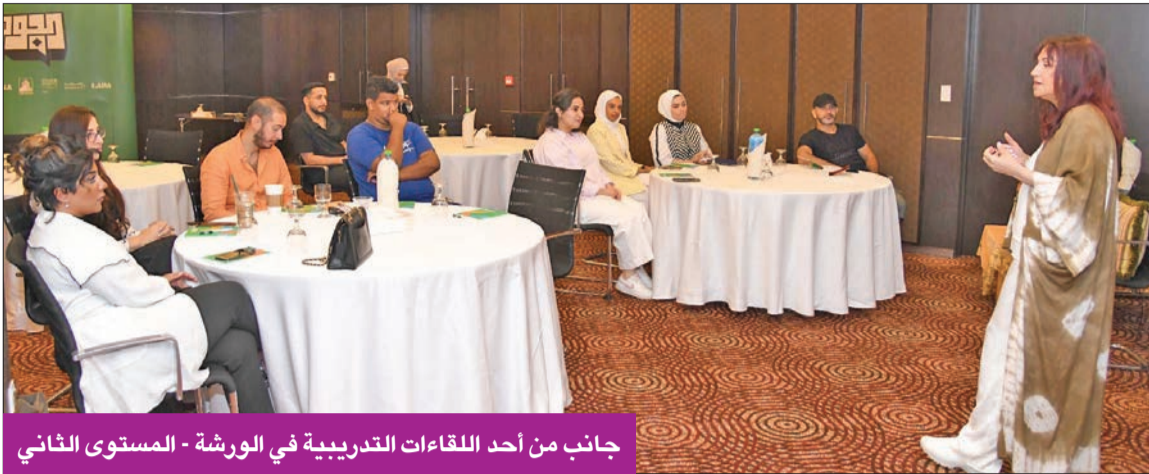
جانب من أحد اللقاءات التدريبية في الورشة - المستوى الثاني

تضم ورشة «إعداد المذيع» مستويين من التدريب: الأول تدريب على كل مهارات التقديم التلفزيوني، وتمكين كل متدرب من تطوير شخصية فريدة ومستقلة لذاته أمام الشاشة تختلف عن غيره من مقدمي البرامج، فيما ارتكز الثاني على كيفية إعداد وتقديم تقارير ميدانية، في وقت تضمنت الورشة عدداً كبيراً من التطبيقات العملية، التي تمنح الفرصة للمتدربين لكسر رهبة مواجهة الكاميرا، مطبقين عدة مهارات من ضمنها القراءة من جهاز الأوتو كيو، واستخدام سماعة الأذن، والتحكم في لغة الجسد، ونبيرة الصوت.