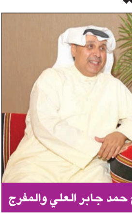
الشيخ حمد جابر العلي والمفراج

الأبدین عبر تسجيلاته، وسيظل صوته الشجي «يلعب، ويطننا». في حين أكد الفنان عبد الرحمن العقل أن «فناناً من طراز عبدالعزيز المفراج لا يمكن أن ينسى، فهو حاضر بيننا بأغانيه، والأوبريتات الوطنية التي قدمها على مدى عقود من الزمن».