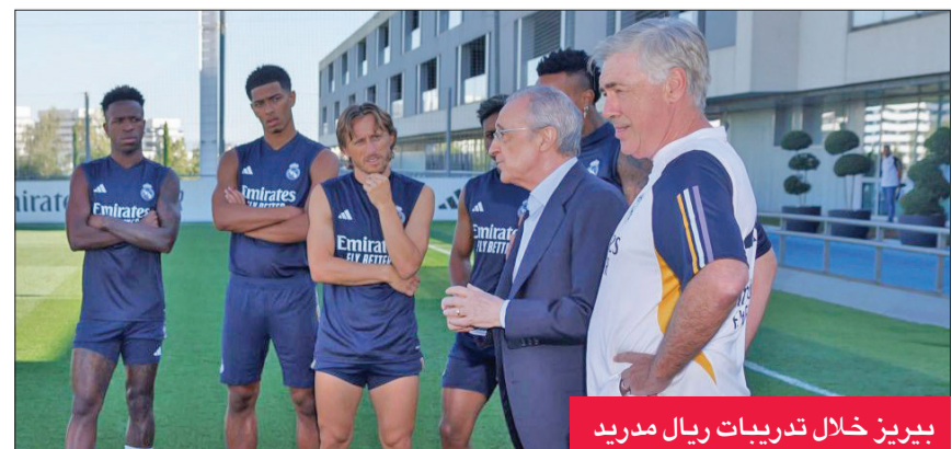
بيريز خلال تدريبات ريال مدريد

وإلى جانب زيارة بيريز، شهدت التدريبات ظهور داني سيبايوس، الذي يتعافى من إصابة بالفخذ