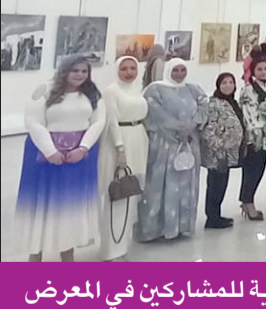
لقطة جماعية للمشاركين في المعرض