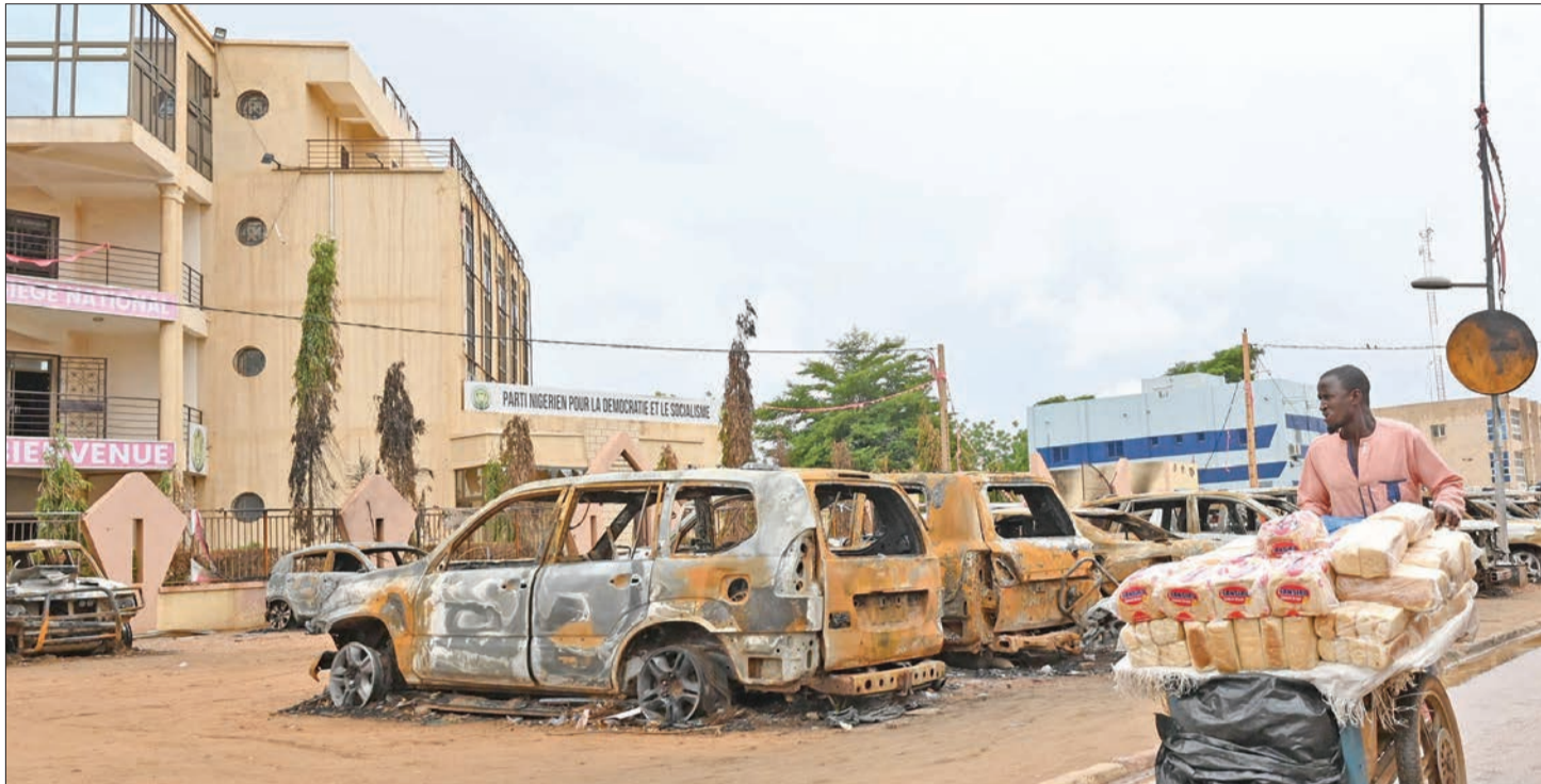
نيجري يدفع عربته بجوار سيارات محترقة أمام مقر حزب الرئيس المعزول بازوم في نيامي أمس

أغلق المجلس العسكري الحاكم في النيجر الأجواء، وسط ترقب لرد مجموعة إيكواس، بعد انتهاء مهلة المعزول محمد بازوم إلى السلطة أو مواجهة تدخل عسكري، فيما دعت إيطاليا إلى تمديد المهلة وإفساح المجال للمزيد من الوقت لحل الأزمة دبلوماسياً.