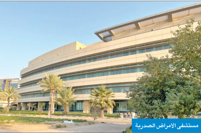
مستشفى الأمراض الصدرية

مبيناً أن الصمام الحديث يتميز بسهولة ورقة كبيرتين في التركيب، وذلك يرتبط عليه تقليل المضاعفات للمرضى واستخدام أقل للصبغة، إضافة إلى تقليل وقت إجراء العملية، كما أن استخدام هذا الصمام الحديث يجعل عملية إجراء قسطرة القلب للشرايين أسهل إذا احتاج إليها المريض في المستقبل. وبين أن إجراء هاتين العمليتين في مستشفى الأمراض الصدرية كأول مركز للقلب يستخدم هذا الصمام يدل على أهمية هذا المركز