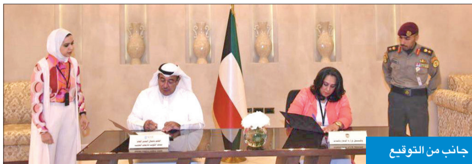
جانب من التوقيع

أعلن قطاع هندسة المنشآت العسكرية التابع لوزارة الدفاع، أمس، توقيع اتفاقية تعاون مع معهد الكويت للأبحاث العلمية في مجال الأبحاث العلمية والتقنية والإبتكارات وتسهيل وتبسيط إجراءات العمل ورسم خريطة الطريق لمجالات التعاون. وقال بيان صحافي صادر عن «الدفاع»، إن الاتفاقية تهدف أيضاً إلى الاستفادة من خبرات الباحثين والاستشاريين في مجال إجراء الدراسات التي تخد تطبيق قرارات وتوصيات مجلس الوزراء بالاستفادة من مخرجات المشاريع البحثية التي ينجزها