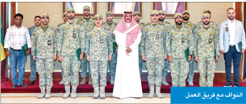
النواف مع فريق العمل

استقبل فريق الفيلم وثمن المستوى العالي في تصويره ومحتواه