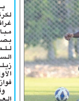
جانب من مباراة القادسية وسبورتنغ

جيدة، معرباً عن امله في تقدم المستوى فيما تبقى من مباريات خلال المعسكر. ولم يخف مدرب الأصفر ان غياب التسجيل خلال اللقاء من الأمور التي يسعى إليها في المباريات المقبلة، مؤكداً أن معسكر الإسكندرية 7 أهداف، بواقع 4 في المباراة الأولى، و3 في الثانية.