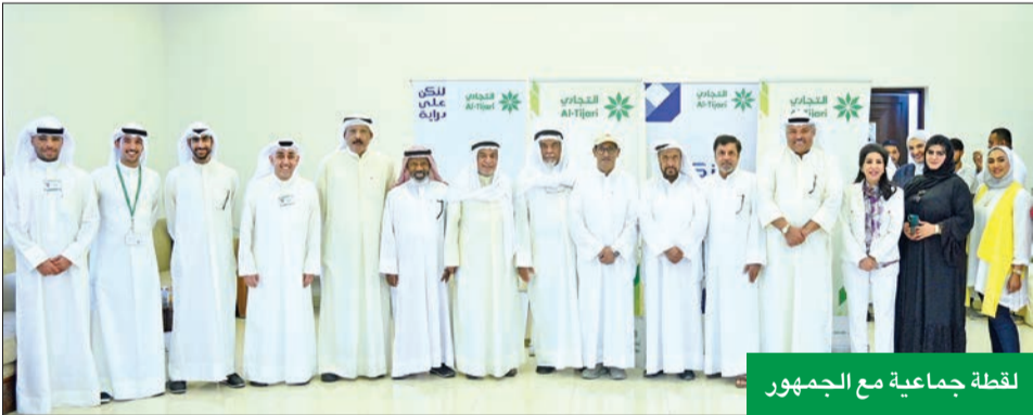
لقطة جماعية مع الجمهور

● في إطار التعاون مع «الخالدية التعاونية» وديوان الرعيل الأول