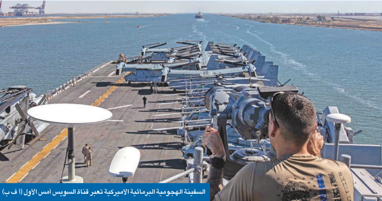
السفينة الهجومية البرمائية الأميركية تعبر قناة السويس أمس الأول

«أرامكو»: حقل استراتيجي أموره ماضية كما هو مخطط لها مع الكويت