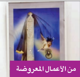
من الأعمال المعروضة