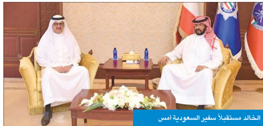
الخالد مستقبلاً سفير السعودية أمس

تسلم دعوة من نظيره خليفة بن حمد لزيارة الدوحة