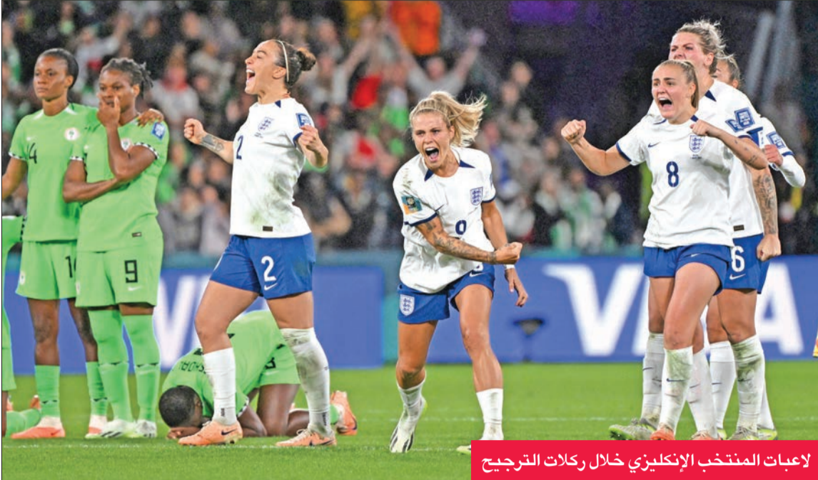
لاعبات المنتخب الإنجليزي خلال ركلات الترجيح

تجاوز المنتخب الإنجليزي نظيره النيجيري بركلات الترجيح 2-3، في منافسات المجموعة الثانية التي أناهاها في المركز الثاني.