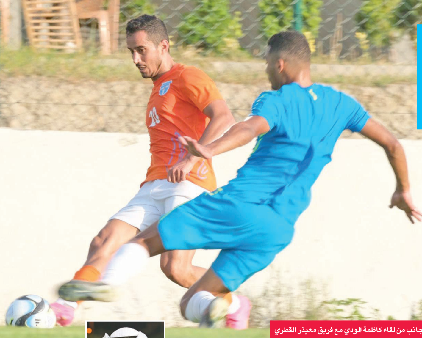
جانب من لقاء كاظمة الودي مع فريق معيذ القطري

مفيدة جداً للبرتغالي وحققت الأهداف المرجوة له، مضيفاً في تصريح له «الجريدة»، أن الجهاز الفني بقيادة المدرب البرازيلي سيرجيو فراباس لع بتشكيلين مختلفين في شوطي المباراة. وقال الصريعي: «وضع فراباس عدداً من الجمل التكتيكية التي نفذها اللاعبون، إلى جانب العديد من التعليمات، وأكدت المباراة قدرة اللاعبين على الالتزام بالخطة، وتنفيذ تكتيك المدرب، إلى جانب الارتفاع بمعدل اللياقة البدنية لديهم.»