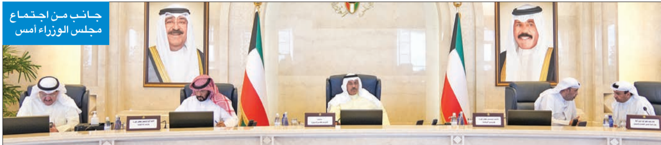
جانب من اجتماع مجلس الوزراء أمس

ووجه رئيس مجلس الوزراء سمو الشيخ أحمد نواف الأحمد الجهات الحكومية بضرورة تسريع وتيرة إنجاز وتنفيذ المرافق العامة والخدمات في مدينتي المطلاع وصباح الأحمد، وكل ما من شأنه تسهيل الإجراءات المتعلقة بالمواطنين.