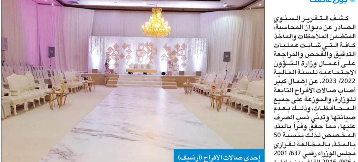
إحدى صالات الأفراح (أرشيف)

225 ألف دينار تكلفة إجمالية لترميمها كلها ولمدة 6 أشهر