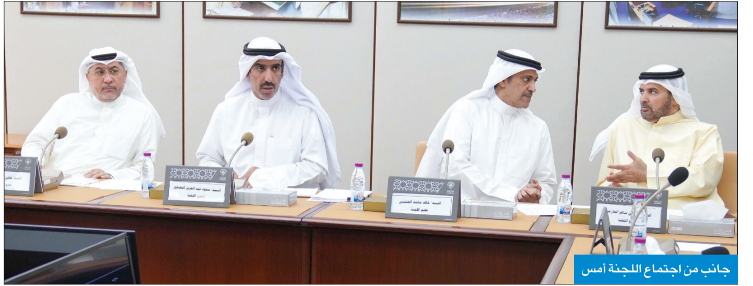
جانب من اجتماع اللجنة أمس