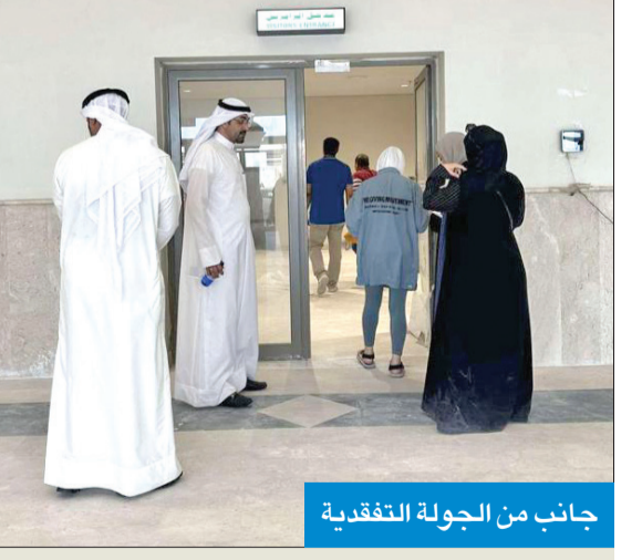
جانب من الجولة التفقدية

عيسى: مطابق لكود البناء الخاص بذوي الإعاقة