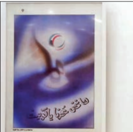
من الأعمال المعروضة