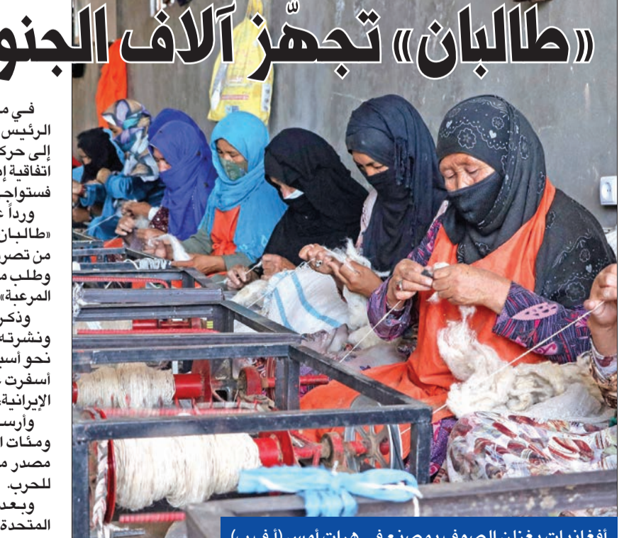
أفغانيات يغلزلن الصوف بمصنع في هرات أمس

وبعد عقدين من القتال ضد الولايات المتحدة، وجد قادة طالبان، أنفسهم حالياً في سجال مع جيرانهم، في الوقت الذي وصلت