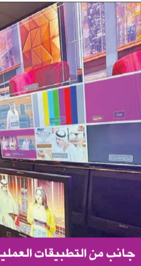
جانب من التطبيقات العملية في الاستديو

تضمنت الورشة زيارات ميدانية لاستوديو تلفزيون atv للتدريب على كيفية التعامل مع معدي البرامج وفريق العمل