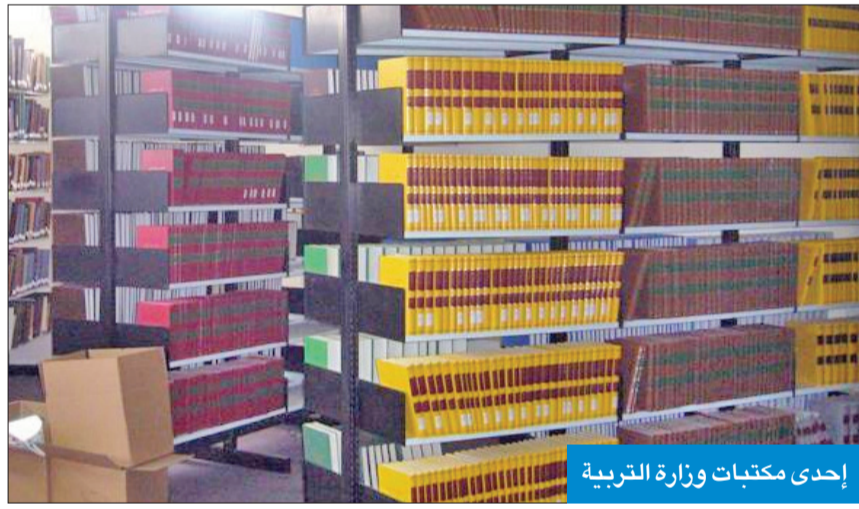
إحدى مكتبات وزارة التربية

بنسبة 69 في المئة من إجمالي الرصيد، بينما حلت المرحلة المتوسطة في المكتبات برصيد 145511 كتاباً بنسبة 87.5 في المئة من إجمالي الرصيد. وأشارت إلى أن الإضافات الجديدة من الكتب التي تم تزويد المكتبات المدرسية بها كانت بواقع 708 كتب من الكتب العربية المصنفة 708 عناوين، حيث تم تزويد المكتبات بـ 55967 نسخة منها، فيما كانت الكتب الأجنبية بواقع 83 عنواناً تم تزويد المكتبات بـ 25015 نسخة منها، وكتب الأطفال بواقع 118 عنواناً تم تزويد المكتبات بـ 36315 نسخة منها، ليكون إجمالي الكتب العربية والأجنبية الجديدة 791 عنواناً جديداً و118088 نسخة. وأوضحت أن إجمالي عدد