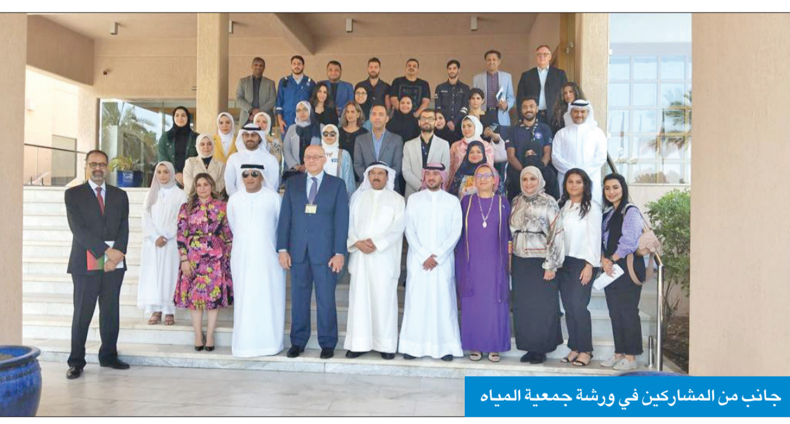
جانب من المشاركين في ورشة جمعية المياه