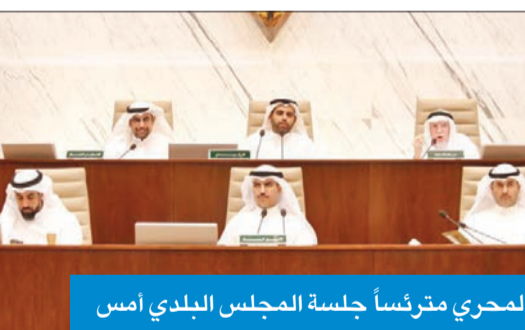
المحري مترئساً جلسة المجلس البلدي أمس

أقرّ موقعاً تسويقياً لكل مزرعة ورفض «مواقع المستشفيات»