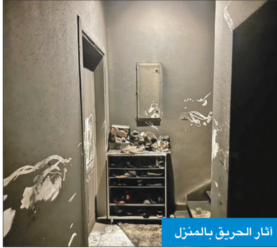
أثار الحريق بالمنزل

إلى موقع الحادث، للمعاينة والتحقيق في أسباب اندلاع النيران.