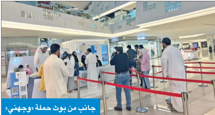
جانب من بوت حملة «وجهني»

الصراف دعت الراغبين بالابتعاث للاطلاع على اللوائح قبل اتخاذ قرارهم