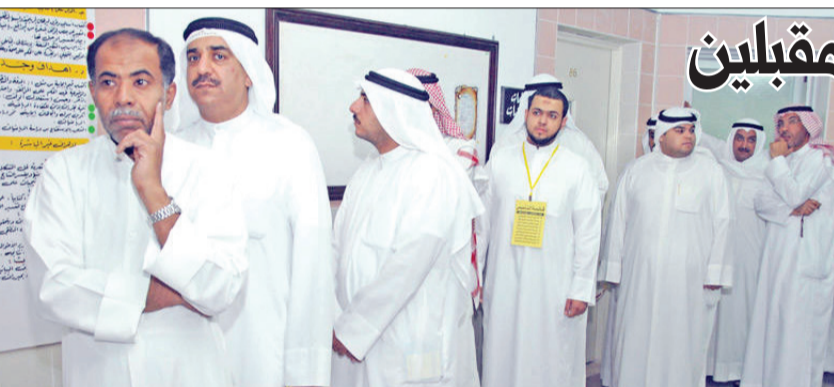
جانب من انتخابات سابقة لمجلس إدارة إحدى «التعاونيات» (أرشيف)

أسوار مفار الاقتراع (المدارس)، مضيفة أن الوزارة تنسق مع «الداخلية» قبل عقد أي عمومية أو انتخابات، لتوفير قوة من الشرطة لضبط الأمن وإحكام السيطرة والتنظيم خلال عقد العموميات، وهذا إجراء متبع في جميع العموميات التي أجريت سلفاً.