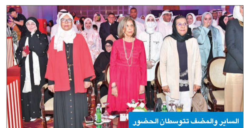
الساير والمضف تتوسطان الحضور

المتحدة الأميركية، وتلت الطالبة في البذل آيات من القرآن الكريم، ثم رحبت بمديرة المدرسة بالحضور، وتمنت للخريجات متابعة مشوار التفوق والنجاح.