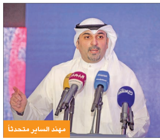
مهندس الساير متحدثاً

ودعا الساير الشعب الكويتي الى المشاركة قائلاً: المرحلة المقبلة، لا تقل عن التحول الديمقراطي الذي مرت به الكويت منذ عام 1962، فنحن سنمر بمرحلة تحديد مسار الدولة وتحولها خلال المجلس القادم، لذلك ادوات الفساد تريد أن توصل رسالتها بأن الشعب الكويتي لا يريد المشاركة في القرار ومصير البلد، وأنا ادعو الشعب الكويتي الى دعم النواب الذين يضعون مصلحة الكويت وشعبها فوق كل اعتبار، والقادرين على مواجهة الفساد.