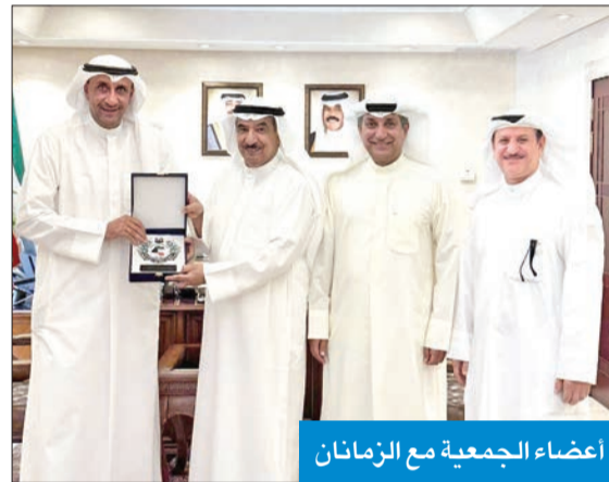
أعضاء الجمعية مع الزمانان

وتم خلال اللقاء بحث المواضيع المتعلقة بالجمعية، وطرح فكرة إنشاء لجنة لجمعيات الضباط والعسكريين المتقاعدين بدول المجلس تحت مظلة الأمانة العامة لدول مجلس التعاون، وخصوصاً بعد حصول الكويت على منصب نائب رئيس الاتحاد الدولي للمحاربين القدماء لشؤون الشرق الأوسط.