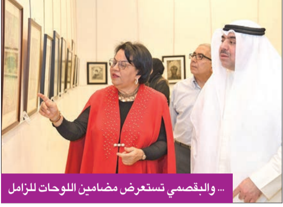
... والبقصي تستعرض مضامين اللوحات للزامل