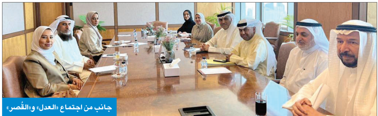
جانب من اجتماع «العدل» و«القصر»