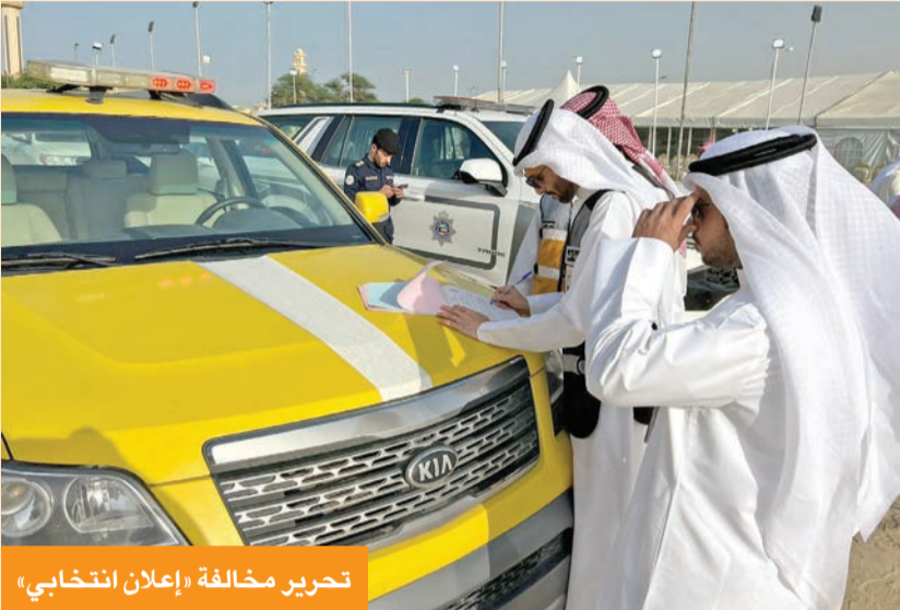
تحرير مخالفة «إعلان انتخابي»

«البلدية»: إزالة 650 إعلاناً انتخابياً مخالفاً 119 مقراً مرخصاً في المحافظات الست