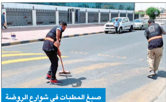
صبغ المطبات في شوارع الروضة

الكندري: ندعم مبادرات صيانة وتجميل الطرق في المنطقة