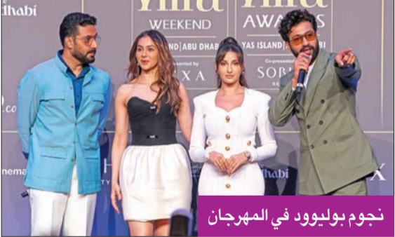
نجوم بوليوود في المهرجان

فيما كانت أنظار العالم شاخصة نحو مدينة كان الفرنسية في ختام مهرجانها السنوي السادس والسبعين، أقيمت حفلة «الأوسكار» بسنختها الهندية أمس الأول في أبوظبي، لتكرم أفضل أفلام بوليوود، أكثر قطاعات السينما غزارة في الإنتاج عالمياً.