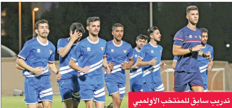
تدريب سابق للمنتخب الأولمبي

ومغوليا، والفلبين، وأفغانستان، وبروناي، وكوريا الشمالية، وغوام، وماكاو، وباكستان، وقطر (المستوى الرابع). وسيضع الاتحاد الآسيوي لكرة القدم المنتخبين المستضيفين للمجموعات في وعاء آخر يضم منتخبات: الكويت، والبحرين، والصين، وإندونيسيا، والأردن، وكوريا الجنوبية، والسعودية، وطاجيكستان، وتايلاند، وأوزبكستان، وفيتنام.