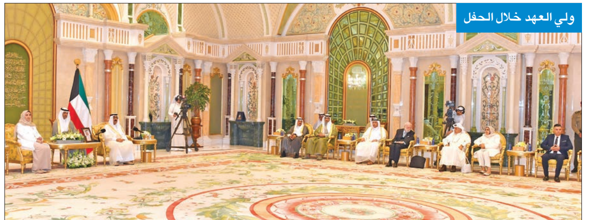
ولي العهد خلال الحفل