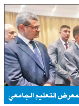
السفير الأردني مستمعاً إلى شرح بمعرض التعليم الجامعي

أكد السفير الأردني لدى الكويت صقر أبوشتال أن نحو 4500 طالب كويتي يتلقون تعليمهم في الجامعات الأردنية حالياً.