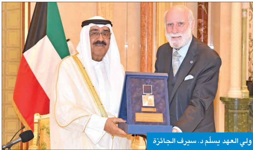
ولي العهد يسلم د. سيرف الجائزة

من التحديات للقيم والمبادئ الإنسانية، ومؤذنا بتحولات جذرية لم تشهدا البشرية. وأضافت أن جائزة سمو الشيخ سالم العلي للمعلوماتية، التي تشرف بحمل اسم مؤسسها وسندها المكين، تشع عالياً في هذا الأفق الممتد بنجاحاتها في مواجهة تلك المتغيرات بخطة وثيقة ومنجزات راسخة خلال اثنين وعشرين عاماً، وما كان لهذا أن يتحقق إلا بفضل من الله تعالى، ثم بتوجيهات إمرائنا الذين حباها الله بهم، وبقيادتهم الحكيمة ورؤاهم السديدة، فحققت لهم القلوب تقديراً، ونطقت لهم الألسن