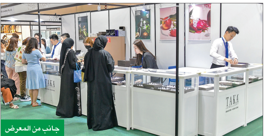
جانب من المعرض

وقامت TEDx الكويت بدعوة واستضافة عدد من القيادات والشخصيات المحلية البارزة من مختلف القطاعات الاقتصادية والاجتماعية وغيرها، ليشاركوا مع الحضور تجاربهم ورؤاهم واستشرافهم للمستقبل ليكون أكثر إشراقاً وتحفيزاً للأجيال الجديدة، وكان الطابق 55 في برج الحمراء للأعمال مكاناً مميزاً واستثنائياً كملئنا للمشاركين في هذا الحدث الخاص الذي استقطب حضوراً طيباً من مختلف الفئات العمرية والثقافات، والذين تواجدوا بدافع التعلم من المتحدثين والمشاركة بآرائهم حول المواضيع التي خصصتها هذه الفعالية لتتناول محاور متنوعة، منها على سبيل المثال المشاريع