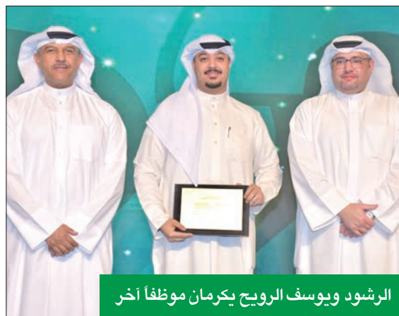
الرشود ويوسف الرويح يكرمان موظفاً آخر