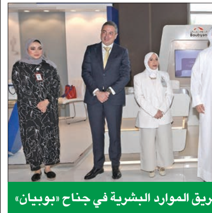
فريق الموارد البشرية في جناح «بويان»