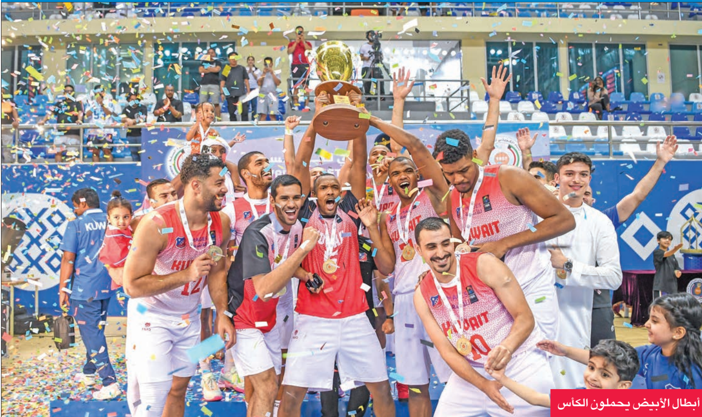
أبطال الأبيض يحملون الكأس