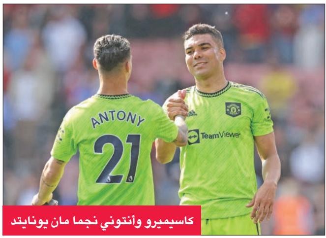
كاسيميرو و أنتوني نجما مان يونايتد

في آخر مباراتين أمام بورنموث وولفرهامبتون، بينما يدخل تشلسي صاحب المركز الثاني عشر