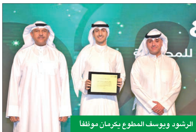
الرشود ويوسف المطوع يكرمان موظفاً