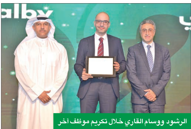
الرشود وسام القاري خلال تكريم موظف آخر