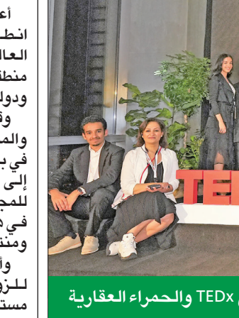
فريق TEDx والمعرض العقارية

وأضافت الذهب أن الحدث أضفى وجهة مميزة للزوار ينظم من قبل شركة المعرض سنوياً، مستقطباً العديد من الشركات الدولية المشاركة عبر مختلف البلدان منها الإمارات، والبحرين، والولايات المتحدة الأمريكية، وإيطاليا، والهند، وتركيا، ولبنان، وهونغ كونغ، وتايوان، ما يساهم أيضاً في تعزيز التبادل التجاري بين الدول، وأشار إلى أن المعرض يسعى إلى تعزيز الابتكار والإبداع في صناعة المجوهرات، وتعزيز قدرات المصممين المحليين، وتوفير الفرص لعرض التصاميم والتعرف على ما هو جديد في الصناعة