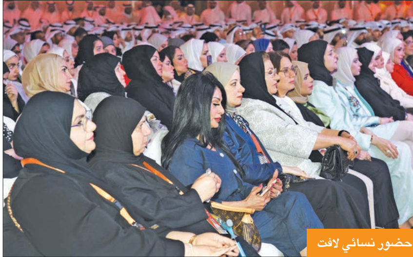
حضور نسائي لافت