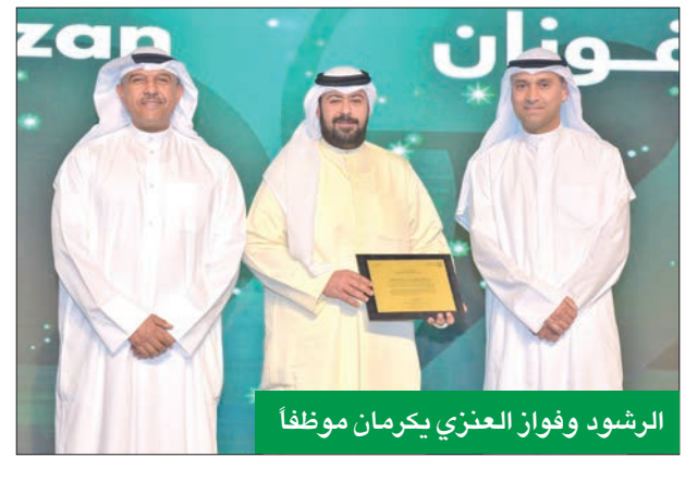
الرشود وفواز العنزي يكرمان موظفاً