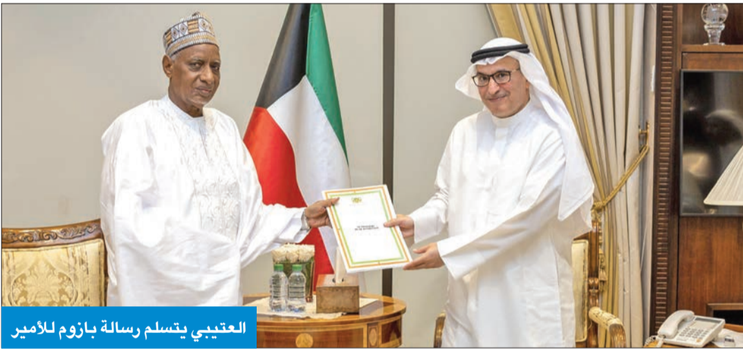
العتيبي يتسلم رسالة بازوم للأمير

التقى نائب وزير الخارجية السفير منصور العتيبي، أمس، رئيس الوزراء السابق للنيجر، الأمين العام السابق لمنظمة التعاون الإسلامي، الرئيس الحالي لمجلس إدارة الهيئة العليا للأوقاف، د. حامد الغابدي، الذي سلم رسالة خطية موجهة إلى سمو الأمير الشيخ نواف الأحمد من رئيس النيجر محمد بازوم، تتصل بعلاقة الصداقة التي تجمع كلا البلدين الصديقين وسبل تعزيزها في كل المجالات والصعد.