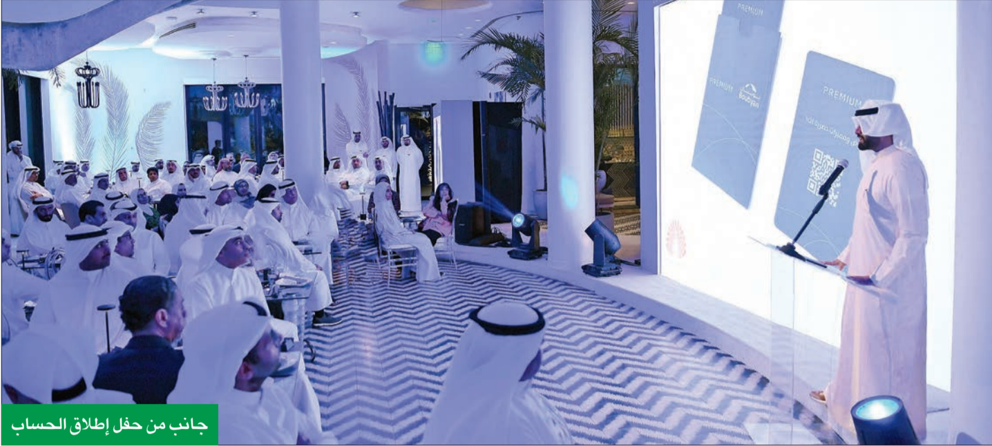
جانب من حفل إطلاق الحساب

المجتم: يواكب طبيعة حياة هذه الشريحة ويُلبي احتياجاتهم اليومية ويجعلها أكثر سهولة