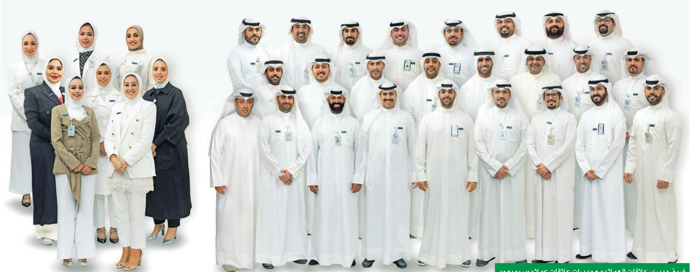
فريق مديري علاقات العملاء مع مديرات علاقات عملاء «بريميوم»