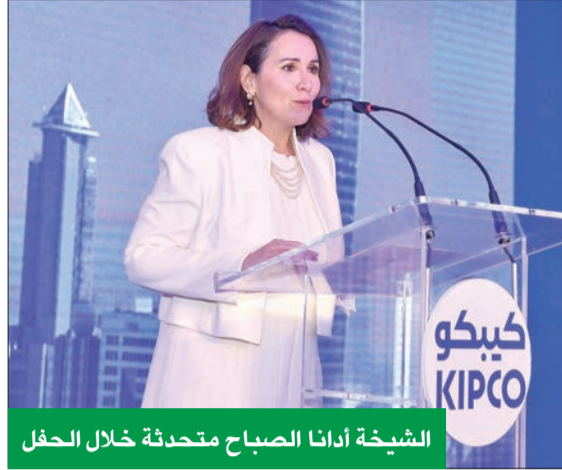
الشيخة أدانا الصباح متحدثة خلال الحفل

كرمت شركة مشاريع الكويت (القابضة) أفضل موظفي العام في شركاتها التشغيلية الرئيسية، في حفل العشاء السنوي الذي تقمه الشركة بهذه المناسبة، والذي استضافته الرئيسة التنفيذية لمجموعة شركة المشاريع الشيخة أدانا ناصر صباح الأحمد، وحضره أكثر من 300 رئيس ومدير تنفيذي يمثلون أكثر من 30 شركة تابعة وزميلة في الكويت والخارج. ورحبت الشيخة أدانا، في كلمة ألقته خلال الحفل، بالضيوف وقالت: «أصبحت شركة المشاريع اليوم أكبر حجماً وأكثر تنوعاً، وأود أن أغتنم هذه المناسبة لأعبر عن شكري وامتناني لكم على