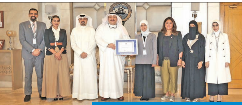
العضوي متوسلاً أعضاء التدريس والأطباء المتدربين

مركز في الكويت يحصل على هذا الاعتراف. وقالت وزارة الصحة، في بيان صحفي، إن هذا الاعتراف جاء بعد تحقيق البرنامج شروط الاعتراف خلال العاميين الأكاديميين السابقين.