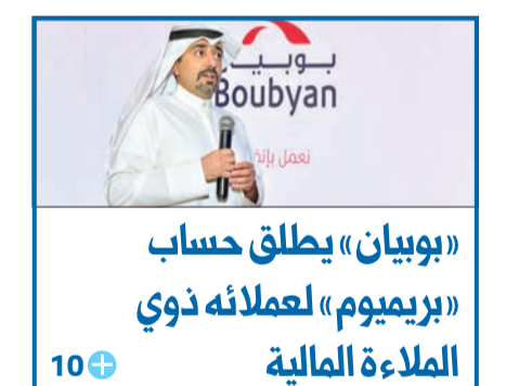
«بوبيان» يطلق حساب «بريميوم» لعملائه ذوي الملاءة المالية