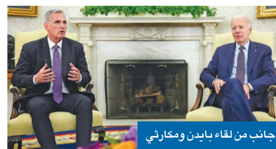
جانب من لقاء بايدن ومكارثي

وقال مكارثي لدى خروجه من الاجتماع: «كانت لغة الحوار أفضل من المناقشات السابقة ومثمرة، لكن لا اتفاق حتى الآن»، مضيفاً أنه يتوقع مواصلة المحادثات بشكل يومي مع بايدن حتى يتم التوصل إلى اتفاق. وكانت وزيرة الخزانة جانيت يلين، حذرت في وقت سابق من نفاذ الأموال في وزارتها بحلول أوائل يونيو. وبعد الاجتماع، أكد مكارثي أن الجمهوريين لن يوافقوا على أي تغييرات ضريبية كجزء من صفقة سقف الدين، قائلاً: «نحن لا نبحث في الإيرادات». وقبل الاجتماع، حث بايدن على «ضرورة اتخاذ