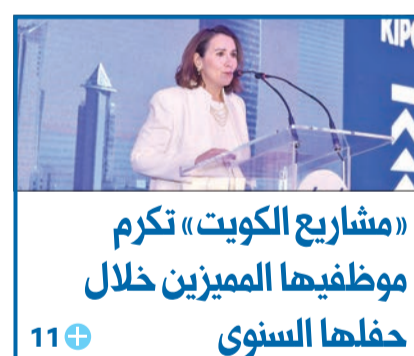
«مشاريع الكويت» تكريم موظفيها المميزين خلال حفلها السنوي

على وقع المطالبات الدولية بتككين المرأة، أكدت وزيرة الشؤون الاجتماعية وزيرة المرأة والطفولة مي البغلي لممطي بعتة صندوق النقد الدولي، الذين التقتهم أمس، الحرس الواسع الذي توليه القيادة السياسية لإنصاف المرأة، لافتة إلى أن جميع الوزارات والمؤسسات والهيئات الحكومية في الكويت تناصر المرأة وتنفخ المجال