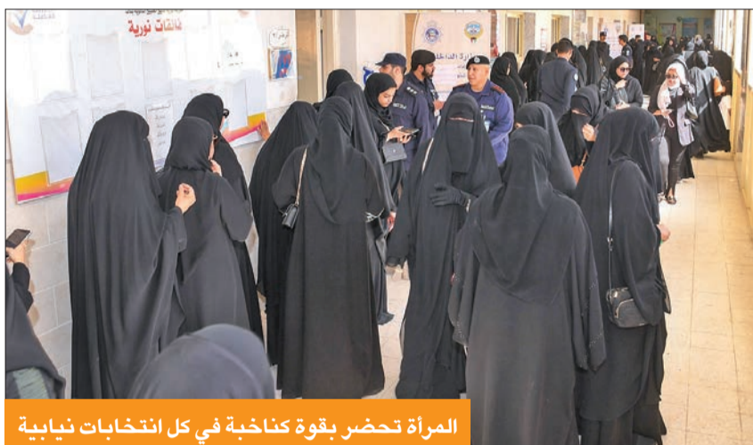
المرأة تحضر بقوة كناخبة في كل انتخابات نيابية

«نطالب اليوم بنهج إصلاحي وطني شامل جاد وقوي ذي رؤية واضحة»