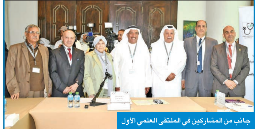
جانب من المشاركين في الملتقى العلمي الأول