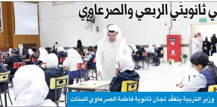
وزير التربية يتفقد لجان ثانوية فاطمة الصرعاوي للبنات

ليؤدوا الامتحانات براحة وطمانينة، مشيدا بحسن سير اللجان بالشكل المطلوب، وعلى مستوى من المهنية المرتفعة جداً.