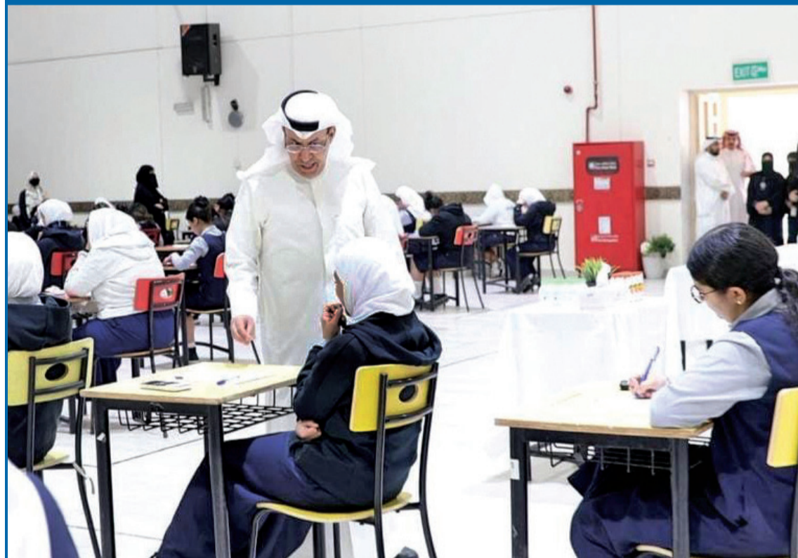
وزير التربية خلال تفقده لجان ثانوية فاطمة الصراعي للبنات في اليوم الأول لانطلاق اختبارات الـ 10 و 11 الثانوي أمس