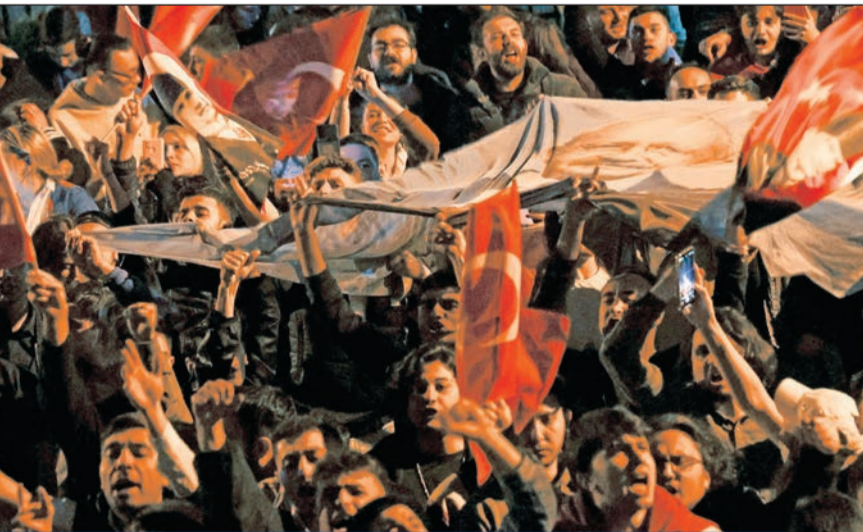
مؤيد كليشدار أوغلو أمام مقر الحزب ليلية الاقتراع في الجولة الأولى

زادت مذكرة التوقيف الدولية التي أصدرها القضاء الفرنسي بحق حاكم مصرف لبنان، رياض سلامة، من الضغوط الدولية على لبنان والقوى السياسية فيه للذهاب باتجاه انتخاب رئيس جديد للجمهورية. ويُعد الادعاء على سلامة خطوة تحمل الكثير من الخطورة بالنسبة إلى أطراف متعددة، لا سيما لجهة كشف الهندسات المالية التي عمل الرجل على حياكاتها لمصلحة الطبقة السياسية، والمفارقة أن ذلك يتزامن مع تهديدات دولية بإمكانية فرض عقوبات على القوى التي تعرقل انتخاب الرئيس، وضغط من أجل إنجاز الاستحقاق قبل موعد انتهاء ولاية حاكم مصرف لبنان، في يوليو المقبل، ليتمكن العهد الجديد من تعيين بديل عنه. وفي ظل صمت سياسي رسمي لافت إزاء مذكرة التوقيف، ثمة ترقب قائم لما