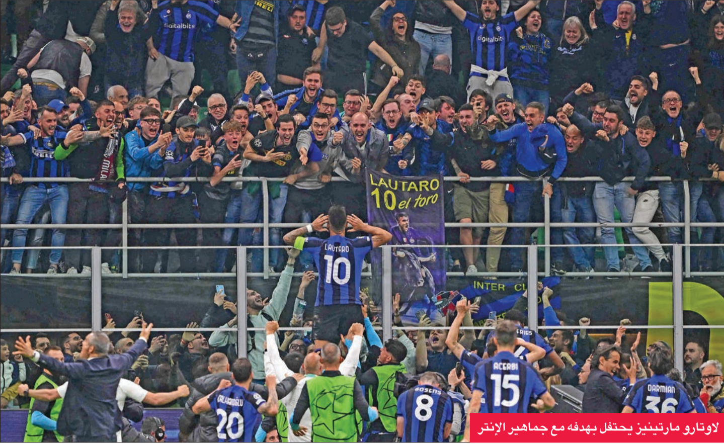
لاوتارو مارتينيز يحتفل بهدفه مع جماهير الإنتر

جدد إنتر ميلان فوزه على جاره ميلان، ليتأهل للمباراة النهائية ببطولة دوري أبطال أوروبا لكرة القدم.