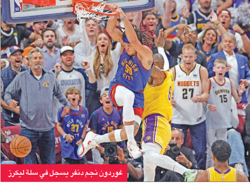
غوردون نجم دنفر يسجل في سلة ليكرز

قدم العلاء الصربي نيكولا يوكيتش عرضاً متكاملًا وقاد دنفر ناغفس إلى الفوز على ضيفه لوس أنجلوس ليكرز ونجمه ليريون جيمس وانتوني ديفيس 132-126 الثلاثة، في افتتاح سلسلة نهائي المنطقة الغربية ضمن دوري كرة السلة الأمريكي للمحترفين (إن بي إيه). وضرب أفضل لاعب في الدوري مرتين بقوة محققاً تريبل دابل (عشر أو أكثر في ثلاث فئات احصائية)، بواقع 34 نقطة، و21 متابعية و14 تمريرة حاسمة، ليتقدم دنفر 1- صفر في سلسلة يحتاج الفائز منها إلى أربعة انتصارات من سبع مباريات لبلوغ نهائي الدوري وملقاة الفائز من بوسطن سلتيكس وميامي هيت.