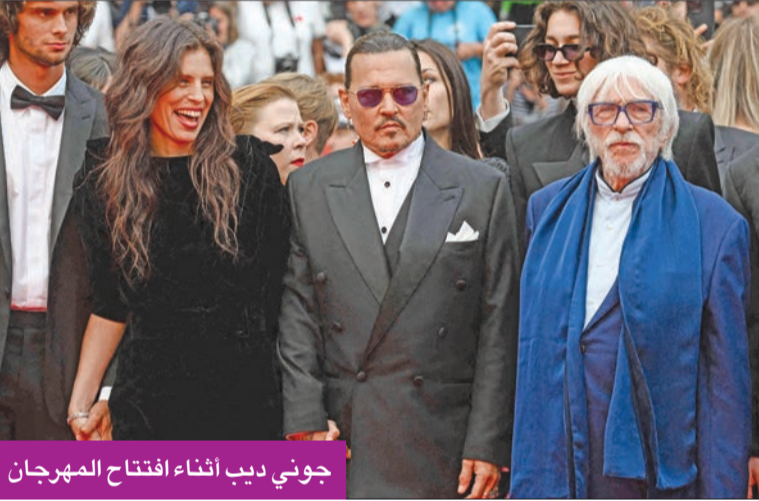
جونى ديب أثناء افتتاح المهرجان

استعاد النجم الأميركي جونى ديب بريق الشهرة، على ما يبدو، إذ شوهد وهو يلتقط الصور مع معجبيه ويتبرك توقيعه عليها قبل العرض الأول لفيلمه (جون دو باري) في افتتاح الدورة السادسة والسبعين من مهرجان كان السينمائي، وذلك في أول أدواره الرئيسية منذ موثله للمحاكمة في قضية تشهير جذبت الأنظار. ورفع محبو ديب في المدينة الفرنسية الواقعة على ساحل الريفيرا لافتات كتب عليها: «تاهنا يا جونى»، ونحن أسفون». ولم يخلف مهرجان كان بنسخته الـ 76 وعده كعادته كل عام، وشهد افتتاحه ظهوراً لمجموعة كبيرة من النجوم، مثل: ماديس ميكلس وجون كيه. رايلي وهيلين ميرين، التي صبغت شعرها باللون الأزرق. ويلعب ديب في فيلم «جون دو باري» دور الملك الفرنسي لويس الخامس عشر. والفيلم من إخراج مايون لو بيسكو، المعروفة باسم مايون، وتلعب فيه أيضاً دور دو باري، محظية الملك الفرنسي، التي تسلفت السلم الاجتماعي وأصبحت المفضلة لديه. وسلط النقاد الضوء على جاذبية الفيلم، الذي حصل على تمويل من مؤسسة