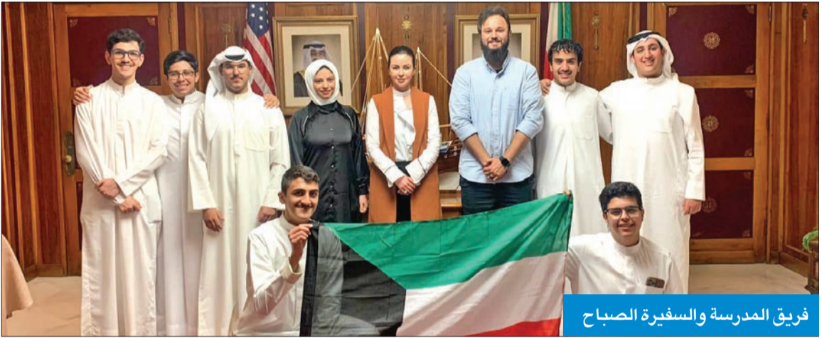
فريق المدرسة والسفيرة الصباح

وأشاد جميع المشاركين بقدرته فريق «البكالوريا الأميركية» على بناء «روبوت متميز» من أول مشاركة في هذه النهائيات، إذ تمكنوا من إتمام جميع مهام المسابقة بنجاح. وعلى هامش المسابقة، التقت سفيرة الكويت في الولايات المتحدة، الزين الصباح، فريق المدرسة المشارك، وقدمت لهم التهنئة والتشجيع على الإنجاز الذي رفع اسم الكويت عالياً في