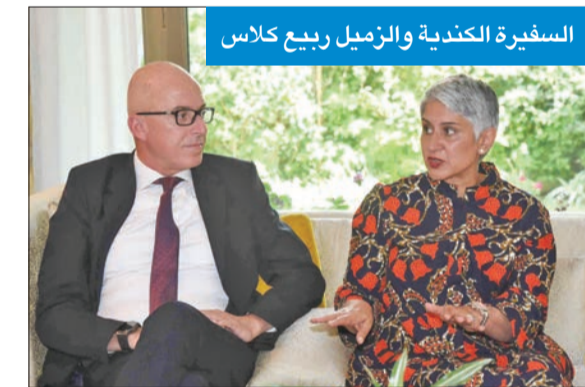
السفيرة الكندية والزميل ربيع كلاس

مازالت أمام النساء الكويتيات الكثير الذي يجب أن يحارن من أجله، وهذا شيء إيجابي للغاية، والإشارات وقطر، وموضحة أن بلادها «تسعى لإدخال المزيد من المواد الغذائية الكندية العالية الجودة إلى الكويت»، لافتة إلى أن «لدى كندا الكثير لتقديمه للكويت»، وفي الحقل الطبي والصحي، أوضحت أنه «يوجد تعاون كبير في هذا المجال بين الدولتين»، مبيئة أن «هناك تعاوناً متزايداً، حيث يوجد نحو 450 طالباً كويتياً يدرسون الطب في الجامعات الكندية، كما يوجد عدد كبير من الأطباء الذين يذهبون إلى كندا للتدريب واكتساب الخبرة».