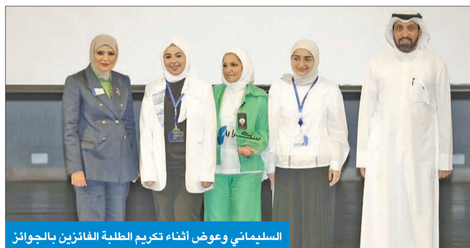
السليمانى وعوض أثناء تكريم الطلبة الفائزين بالجوائز

عوض: طلبة الكويت حصدا جوائز عديدة في المسابقات الدولية