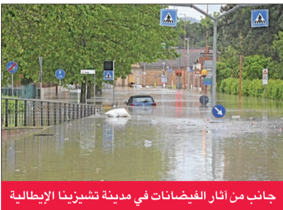
جانب من آثار الفيضانات في مدينة تشيزينا الإيطالية

أعلن منظمو جائزة إيميليا-رومانيا الكبرى، المرحلة السادسة من بطولة العالم للفورمولا واحد، التي كانت مقررة نهاية الأسبوع الحالي على حلبة إيمولا الشهيرة، أن السباق «لن يقام» بسبب الفيضانات التي أودت بحياة خمسة أشخاص على الأقل في شمال إيطاليا.