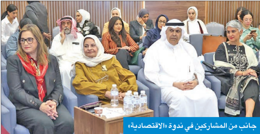
جانب من المشاركين في ندوة «الاقتصادية»