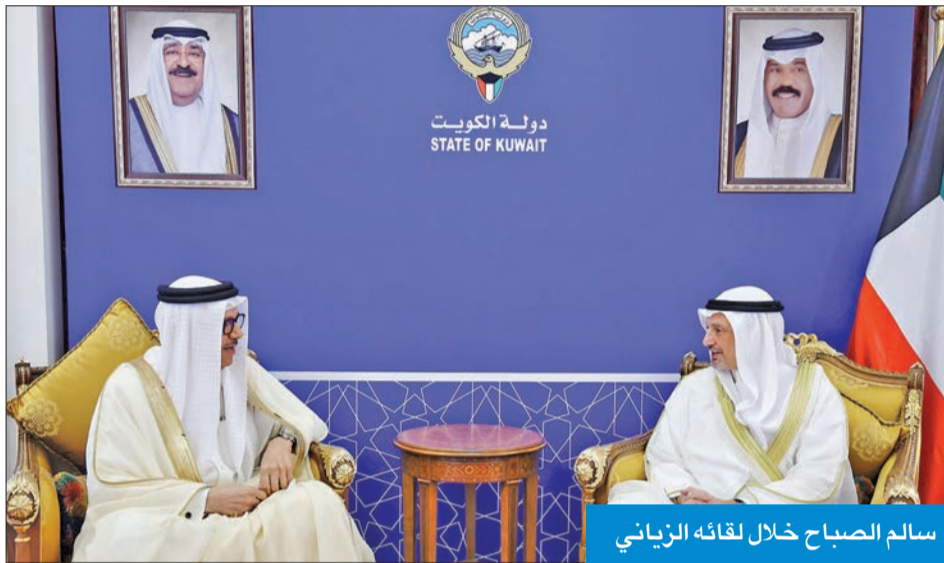
سالم الصباح خلال لقائه الزباني

التقى وزير الخارجية، الشيخ سالم الصباح، أمس، وزير خارجية البحرين، د. عبداللطيف الزباني، وذلك على هامش اجتماع وزراء الخارجية التحضيري لمجلس جامعة الدول العربية على مستوى القمة في دورته الـ 32 المقرر عقدها غداً بمدينة جدة السعودية. كما التقى وزير الخارجية نظيره الأردني أيمن الصفدي.