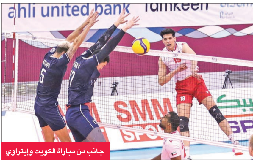
جانب من مباراة الكويت وإيتراوي

يتلقى في الرابعة والنصف من عصر اليوم فريق الكويت لكرة الطائرة نظيره فريق شهداب إيران على صالة عيسى بن راشد في المنامة، ضمن الجولة الأولى من المجموعة الثانية في الدور ربع النهائي للبطولة الآسيوية الثالثة والعشرين للأندية للرجال المقامة حالياً في البحرين.