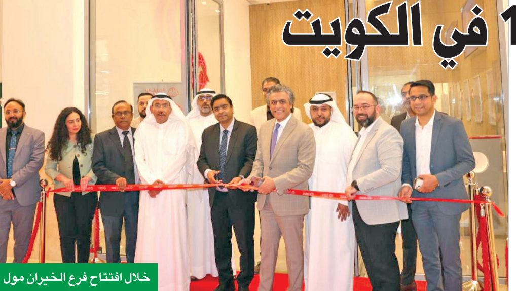
خلال افتتاح فرع الخيران مول

جعل خدماتها المالية في متناول الجميع، فبالإضافة إلى شبكة فروعها القوية، يوفر تطبيق المزيني حلولاً مالية آمنة وبمبسطة مع العديد من الميزات، مثل: التوفر في جميع المنصات الرقمية، والتسجيل لأول مرة للعملاء الجدد عن طريق التطبيق دون الحاجة لمراجعة الفرع، والقدرة على إضافة مستفيد جديد، والاستفادة من خدمة التحويل عن طريق ويسترن يونيون وخدمات التحويل لبطاقات Visa بخطوات بسيطة من أي مكان وفي أي وقت.