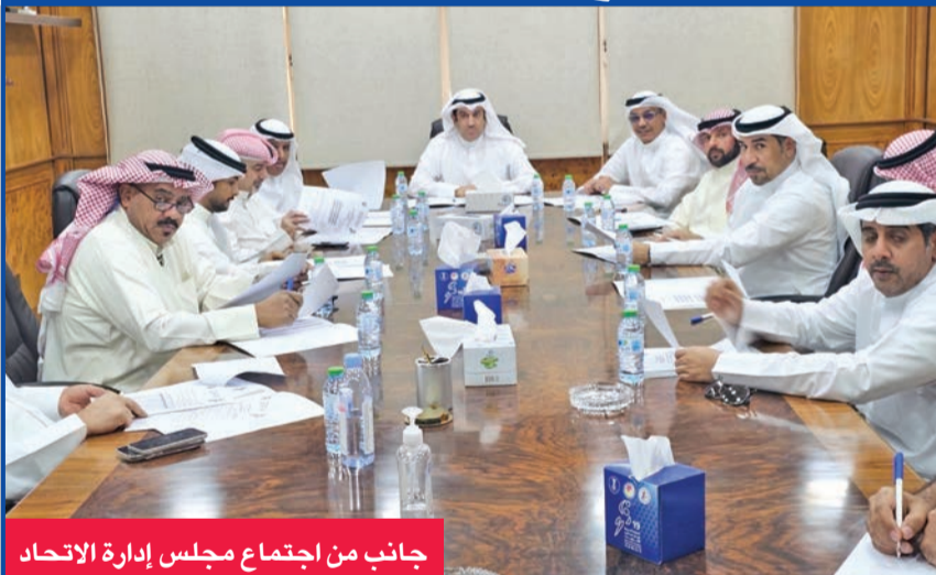
جانب من اجتماع مجلس إدارة الاتحاد