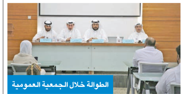
الطولة خلال الجمعية العمومية