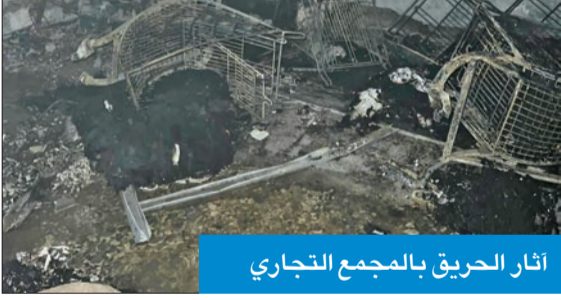
آثار الحريق بالمجمع التجاري