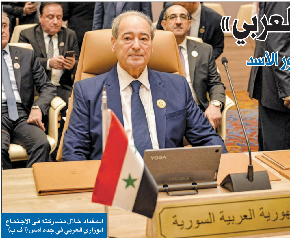
المقداد خلال مشاركته في الاجتماع الوزاري العربي في جدة أمس

«قمة جدة» تدعم جهود السلام في اليمن والسودان بحضور الأسد