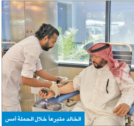
الخالد متبرعاً خلال الحملة أمس

انطلقت صباح أمس حملة التبرع بالدم تحت شعار «دمي للكويت»، بتنظيم من مديرية التوجيه المعنوي والعلاقات العامة، والتنسيق مع هيئة الخدمات الطبية وبنك الدم المركزي بوزارة الصحة. وكان النائب الأول لرئيس مجلس الوزراء وزير الداخلية وزير الدفاع بالإنابة الشيخ طلال الخالد فاجاً القائمين على الحملة بالوصول إلى الموقع والتبرع بالدم، طالباً من القائمين على الحملة التعامل معه كبقية الموجودين للتبرع. بدورها، حرصت رئاسة الأركان العامة للجيش على المشاركة في حملة «دمي للكويت»، وتشجيع منتسبيها لتعزيز دور الجيش تجاه المجتمع، تماشياً مع الدور الإنساني والمسؤولية المجتمعية في مد يد العون والمساعدة للمرضى المحتاجين. وبين مدير التوجيه المعنوي والعلاقات العامة العقيد الركن بحري محمد العوضي أن حملة «دمي للكويت» تأتي إيماناً بأهمية التبرع بالدم، وانطلاقاً من الدور الإنساني والوطني لمنتسبي الجيش في العطاء