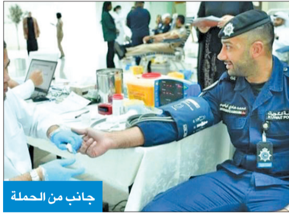
جانب من الحملة