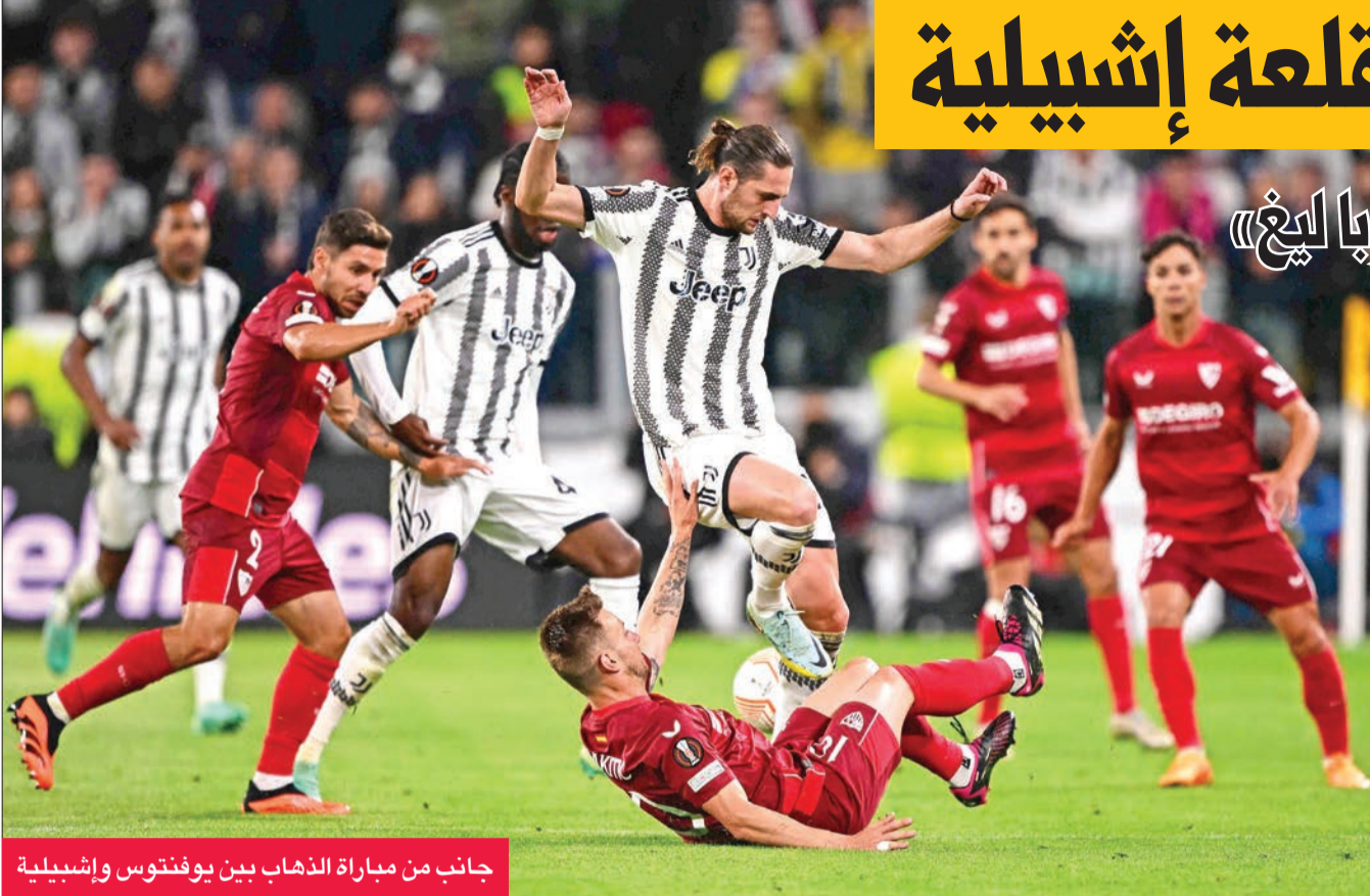
جانب من مباراة الذهاب بين يوفنتوس وإشبيلية