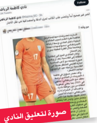
صورة لتعليق النادي

مفضل أو له حظوة لمجرد أنه أصبح نجماً للتو. والسؤال هو: هل نفي «الخبر» يأتي تعبيراً، ممن اقترح أو قرر، عن سعاده وارتياحه لتصرف اللاعب وإشارته إلى رغبته في ترك الفريق؟ أم مباركة لانتقاله إلى نادٍ منافس؟ أخيراً اعتدنا في «الجريدة» على احترام مهنتنا، والعمل بمصداقية تامة، لذلك واحتراماً للمهنة، نلتزم دائماً بعدم ذكر أسماء المصادر حينما يطلون ذلك، لكننا في الوقت نفسه نتمكّن من الشجاعة ما لا يمتلكه غيرنا بذكر الأسماء في حال تراجعهم عن