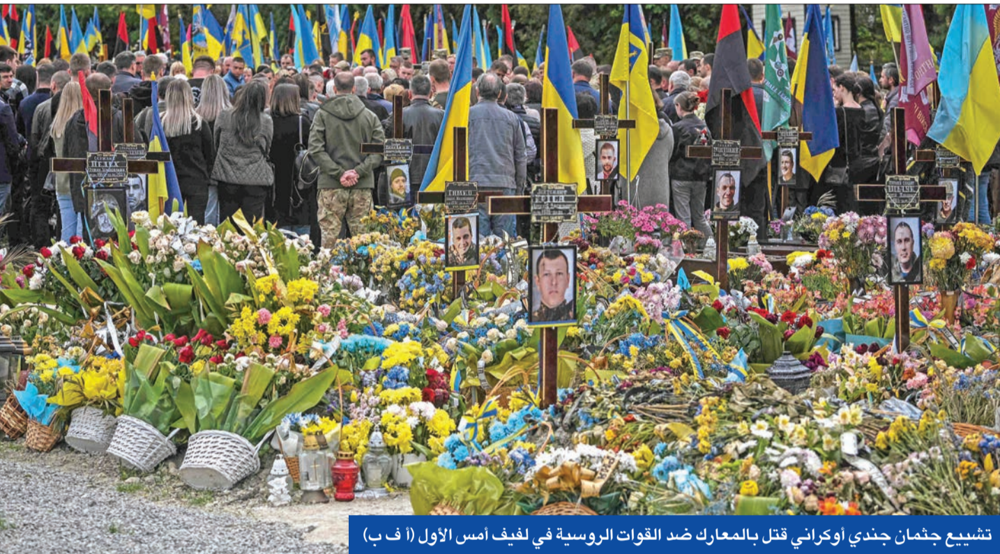
تشييع جثمان جندي اوكراني قتل بالمعارك ضد القوات الروسية في ليفيف أمس الأول

واشنطن تنتقد الشراكة الدفاعية الوثيقة بين موسكو وطهران... وتركيا تنجح باللحظة الأخيرة في تمديد اتفاق الحبوب