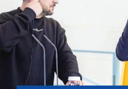
شولتس متحدثاً إلى زيلينسكي خلال مؤتمر في برلين أمس (دي بي إيه)

المعارك مع القوات الروسية في شرق أوكرانيا، فيما تؤكد موسكو مواصلة تقدمها في المدينة التي باتت تسطر على القسم الأكبر منها، والتي دمرت إلى حد كبير. وقالت وزارة الدفاع الروسية، أمس، إنها «اصابت» مواقع في ترنوبل (غرب) وبيتروفافيلكا (وسط شرق) في أوكرانيا، تحزّن فيها أسلحة غربية تم تسليمها إلى كييف. كما أعلنت موسكو مقتل قائدين عسكريين على الجبهة في أوكرانيا، في إعلان نادر من قبل القيادة العسكرية منذ بدء الغزو الروسي لأوكرانيا قبل حوالي 15 شهراً. وقال المتحدث باسم وزارة الدفاع، إيغور كوناشكوف، خلال مؤتمر صحفي يومي، إن الكولونيل فياتشيسلاف مكاروف وبيغيفيتي بروفكو سقطا في القتال. (كيفيف | أ ف ب، رويترز، د ب أ)