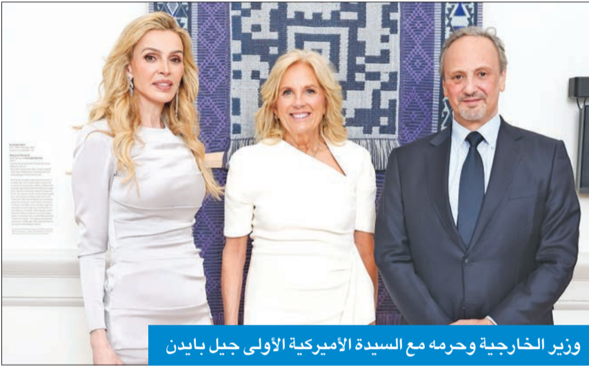
وزير الخارجية ورحمه مع السيدة الأميركية الأولى جيل بايدن