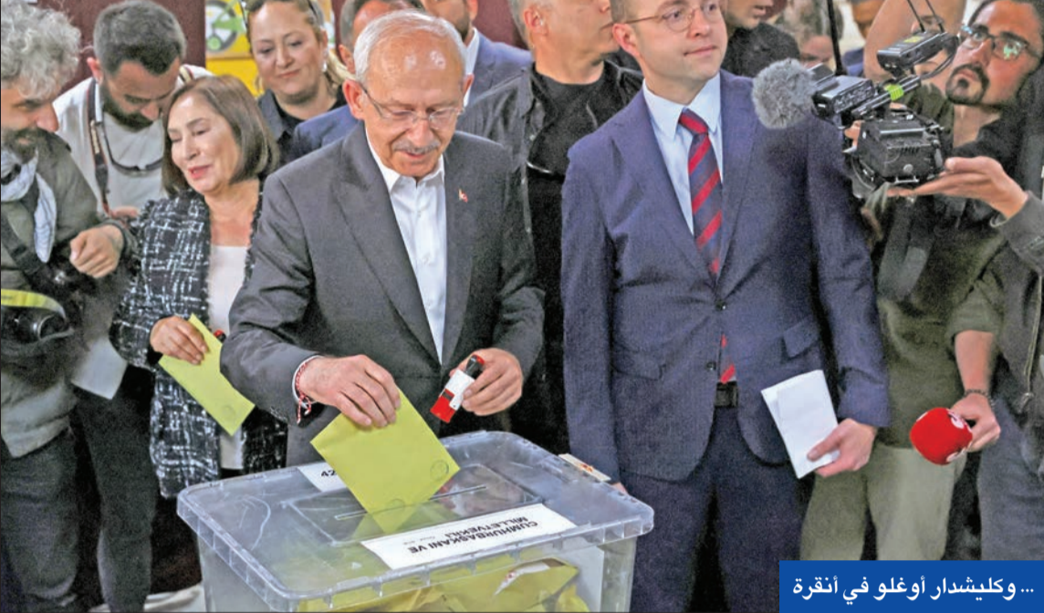
... وكليشدار أوغلو في أنقرة

• كليشدار أوغلو: اشتقنا للديموقراطية • إردوغان يشيد بالاقتراع • دعوات لحماية إرادة الشعب