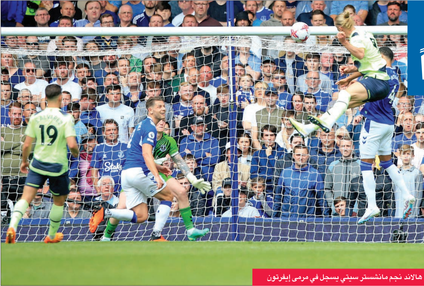
هالاند نجم مانشستر سيتي يسجل في مرمى إيفرتون