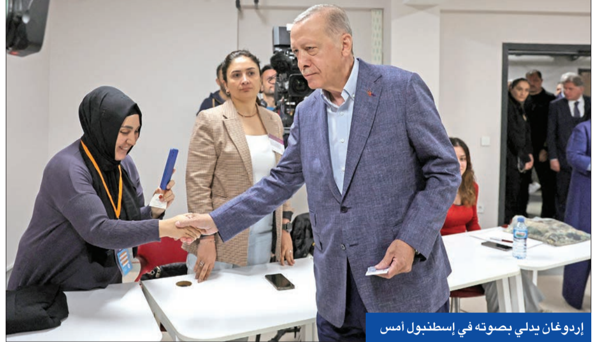
إردوغان يدلي بصوته في إسطنبول أمس