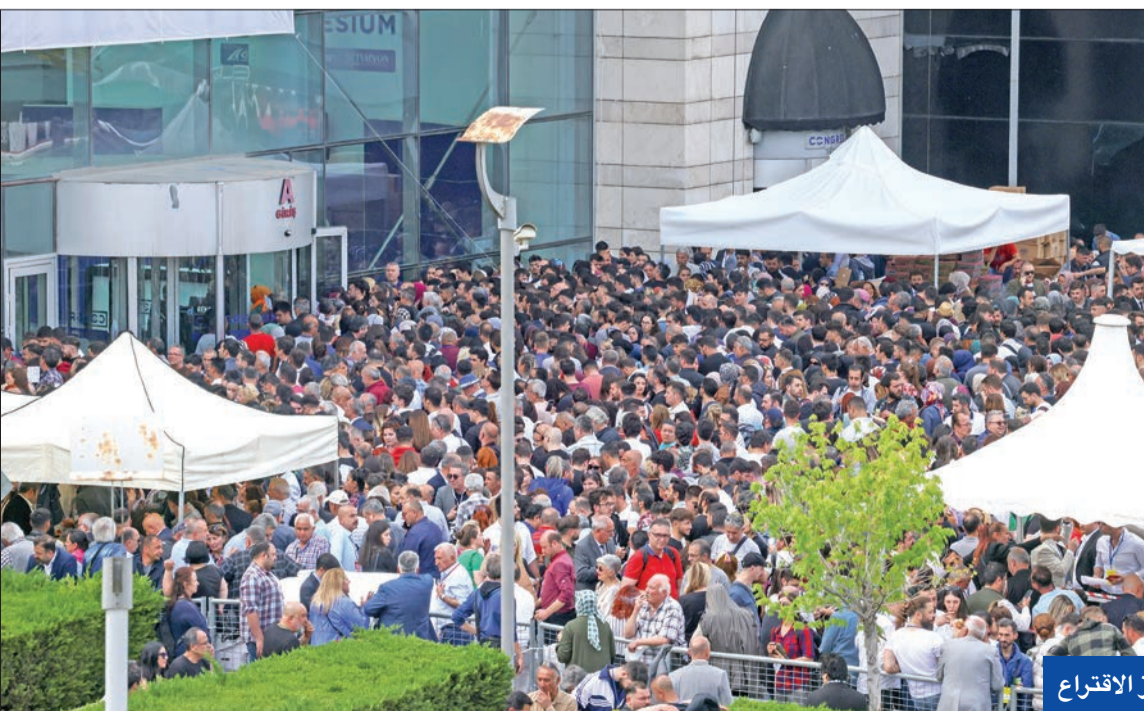
زحمة في مراكز الاقتراع

وقال أوغان، وهو قومي خلال الإدلاء بصوته أمس، إن هدفه الحالي هو الأحمس الانتخابات من الجولة الأولى، إنما دفع البلاد نحو جولة ثانية.