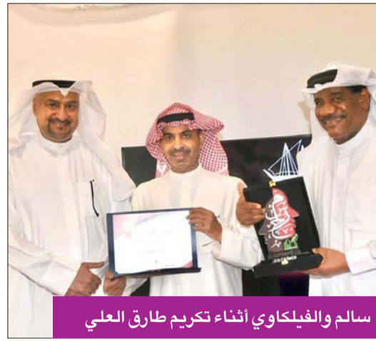
سالم والفيلكوي أثناء تكريم طارق العلي

التعاون الثنائي بين الدولتين في مجال المسرح بمختلف تخصصاته، وتبادل الزيارات والعروض المسرحية لنقل خبرات المخرجين والمؤلفين والممثلين من خلال العلاقات العامة والناطقة الرسمية عن الفرقة فاطمة الطباخ، بهدف البروتوكول إلى تبادل الخبرات والثقافات الفنية المسرحية بجميع أنواعها المختلفة، حفاظًا على استمرارية المسيرة الفنية بين البلدين الشقيقين، وأيضًا لمد جسور