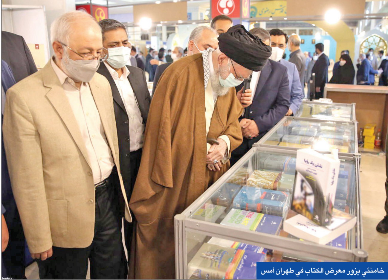
خامنئي يزور معرض الكتاب في طهران أمس

«عشاء سياسي» يضم رئيسين سابقين ومعتدلين وإصلاحيين • حفل في كردستان يغضب طهران