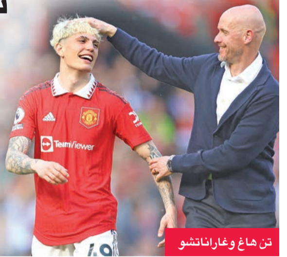
تن هاغ وغاراناتشو