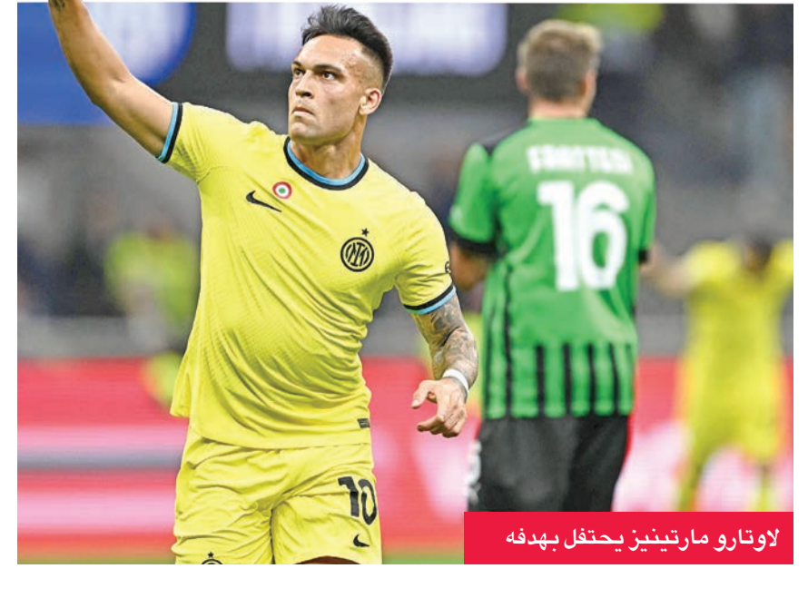
لوتارو مارتينيز يحتفل بهدفه