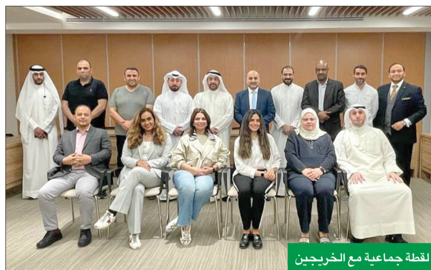
لقطة جماعية مع الخريجين

بالتعاون مع مركز عبدالعزيز الصقر في غرفة التجارة ومعهد خبراء المال