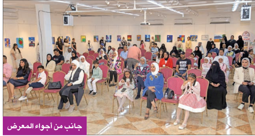
جانب من أجواء المعرض