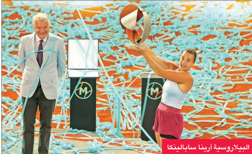
البيلاروسية أرينا سابالينكا

وباتت سابالينكا أكثر اللاعبات تحقيقاً للانتصارات منذ مطلع العام الحالي مع 29 فوزاً.