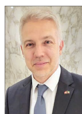
السفير تيزيانو بالميلي

الخارجية السفير منصور العتيبي، واستعراض مجمل علاقات الصداقة والتعاون الثنائي المشترك بين البلدين الصديقين، وبحث سبل تعزيزها في مختلف المجالات والصعد، إلى جانب التطرق للمواضيع ذات الاهتمام المشترك، علاوة على مناقشة آخر التطورات على الساحتين الإقليمية والدولية.