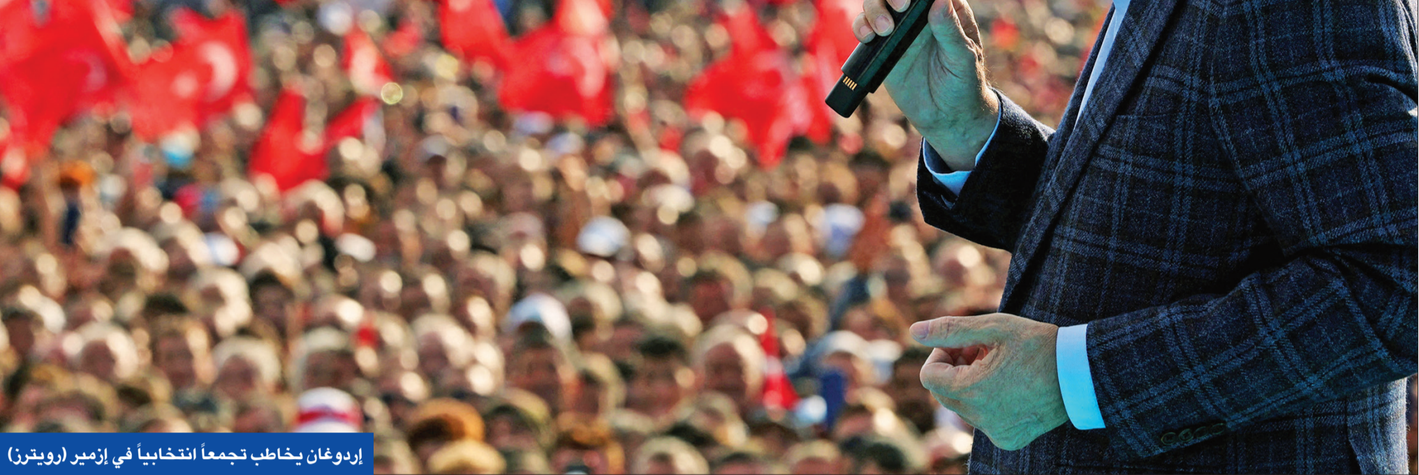
إردوغان يخاطب تجمعا انتخابياً في إزمير

تزايد التوقعات بالذهاب إلى دورة ثانية للاقتراع الرئاسي