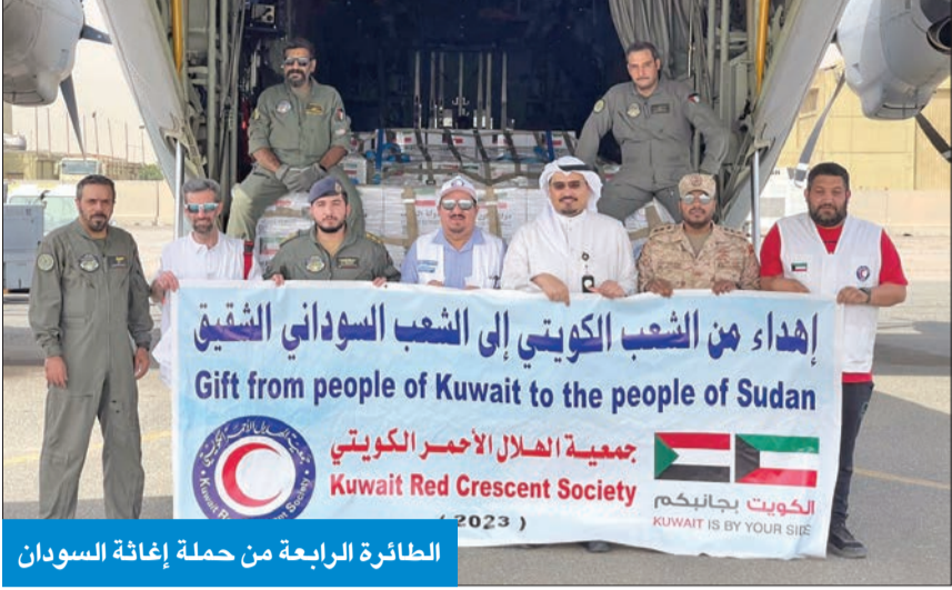
الطائرة الرابعة من حملة إغاثة السودان

أن الجسر الإغاثي مستمر وفق خطط وبرامج أعدتها «الهلال الأحمر» لهذا الغرض، بالتعاون مع وزارات الخارجية والدفاع والصحة والمالية، وأضاف أن هذه المساعدات تأتي تحت شعار «الكويت بجانبكم»، في إطار العلاقات التي تجمع الكويت مع السودان الشقيق، وضمن الدور الإنساني الكويتي في إغاثة المحتاجين والمضطرين من الكوارث المختلفة، وأعرب عن بالغ الشكر والتقدير للمواطنين والقطاع الخاص والبنوك لتبرعهم بحملة جمعية الهلال الأحمر الكويتية (إغاثا السودان) لمصلحة الشعب السوداني الشقيق عبر الموقع الإلكتروني للجمعية.