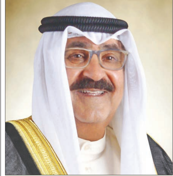
عاد ممثل سمو أمير البلاد الشيخ نواف الأحمد، سمو ولي العهد الشيخ مشعل الأحمد، والوفد الرسمي المرافق لسموه إلى أرض الوطن مساء أمس الأول قادمًا من المملكة المتحدة، وذلك بعد أن حضر سموه مراسم تتويج الملك تشارلز الثالث ملكاً لها.