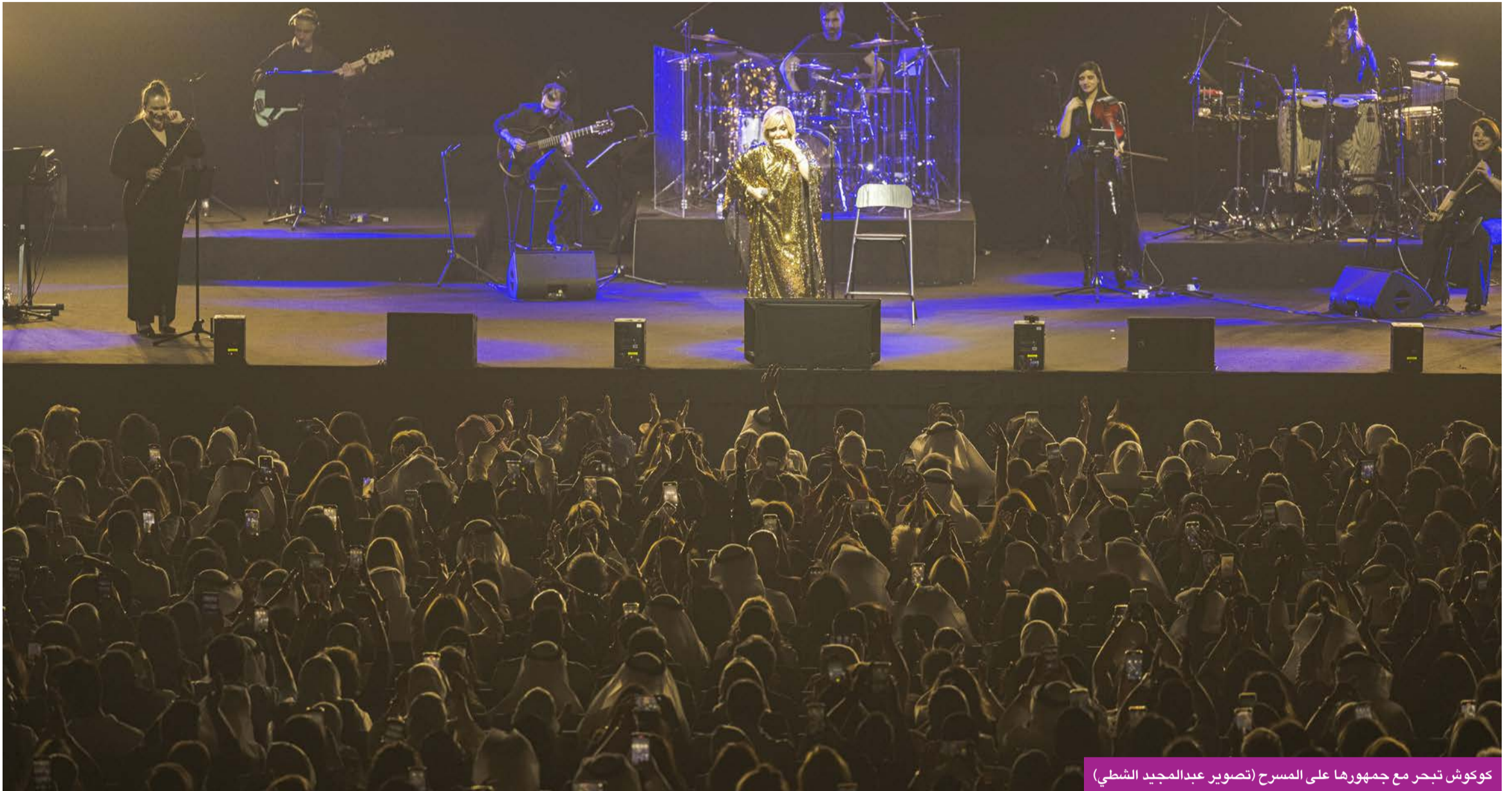
كوكوش تبهر مع جمهورها على المسرح

النجمة العالمية قدّمت حفلاً ساحراً على خشبة مسرح أرينا 360 انطلق بفيلام تسجيلي لها