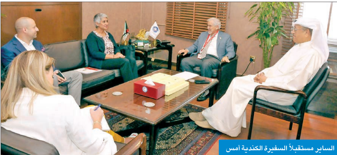
السائر مستقبلاً السفيرة الكندية أمس

في الجهود الإنسانية التي تقوم بها الكويت عبر تقديم الدعم والمساندة للمنكوبين جراء الكوارث الطبيعية أو من صنع الإنسان. وأشار السائر إلى أن اللقاء تطرق إلى المساعدات التي تقدمها الجمعية إلى المنكوبين والمضربين، وأهم أعمالها وتحركاتها الإنسانية لإغاثة ومساعدة المناطق المتضررة.