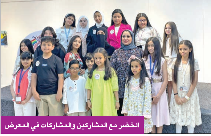
الخضر مع المشاركين والمشاركات في المعرض

أكدت أن التدريب والتعليم يستندان إلى أسس علمية فنية