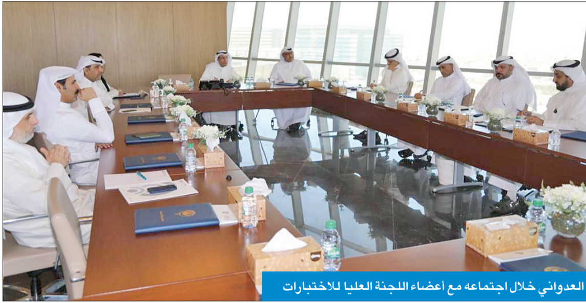
العدواني خلال اجتماعه مع أعضاء اللجنة العليا للاختبارات

بينما تنطلق اختبارات المرحلة الثانوية لصفوف النقل 28 الجاري، تقرر وزارة التربية بتعليمات ومتابعة من وزير التربية وزير التعليم العالي د. حمد العدواني من حسم خياراتها في الإجراءات التي سيتم تطبيقها في فترة اختبارات نهاية العام الدراسي الحالي 2023/2022 التي تأمل من خلالها القضاء على ظاهرة الغش ونسب الاختبارات والتي كانت هاجساً لكل مسؤولي التربية خلال العامين الماضيين، حيث من المقرر الخروج بالتوصيات النهائية في اجتماع اللجنة العليا للاختبارات الذي سيعقد في 17 الجاري.