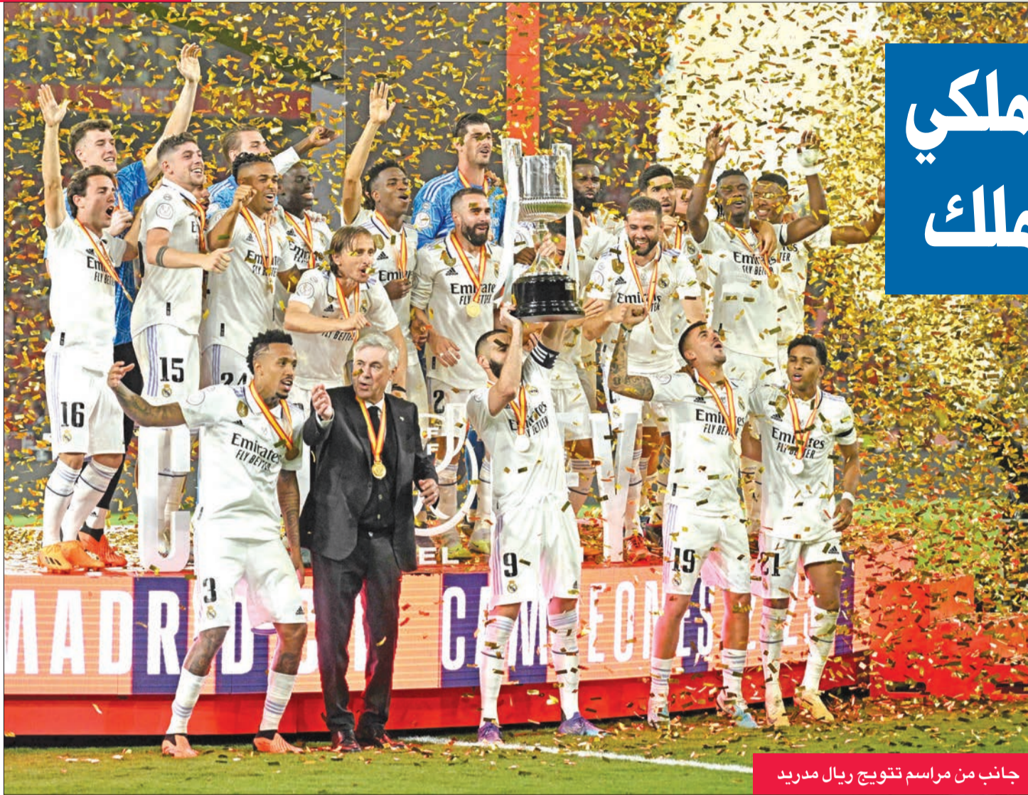
جانب من مراسم تتويج ريال مدريد

في المباراة الأولى، ساهم نجما ليكرز أنتوني ديفيس وليبرون جيمس بفوز عريض لفريقيهما على غولدن ستايت ووريرز، فسجل الأول 25 نقطة و13 متابعة وأضاف الثاني 21 نقطة و8 تمريرات حاسمة ومثلاها مقابعات، كما سجل دانجيلو راسل 21 نقطة أيضا. وفي المجموعة الشرقية، قاد جيمي باتلر العائد من إصابة فريقه ميامي إلى الفوز على نيويورك نيكس 105-86 بتسجيله 28 نقطة ليتقدم على منافسه 2-1 في السلسلة.