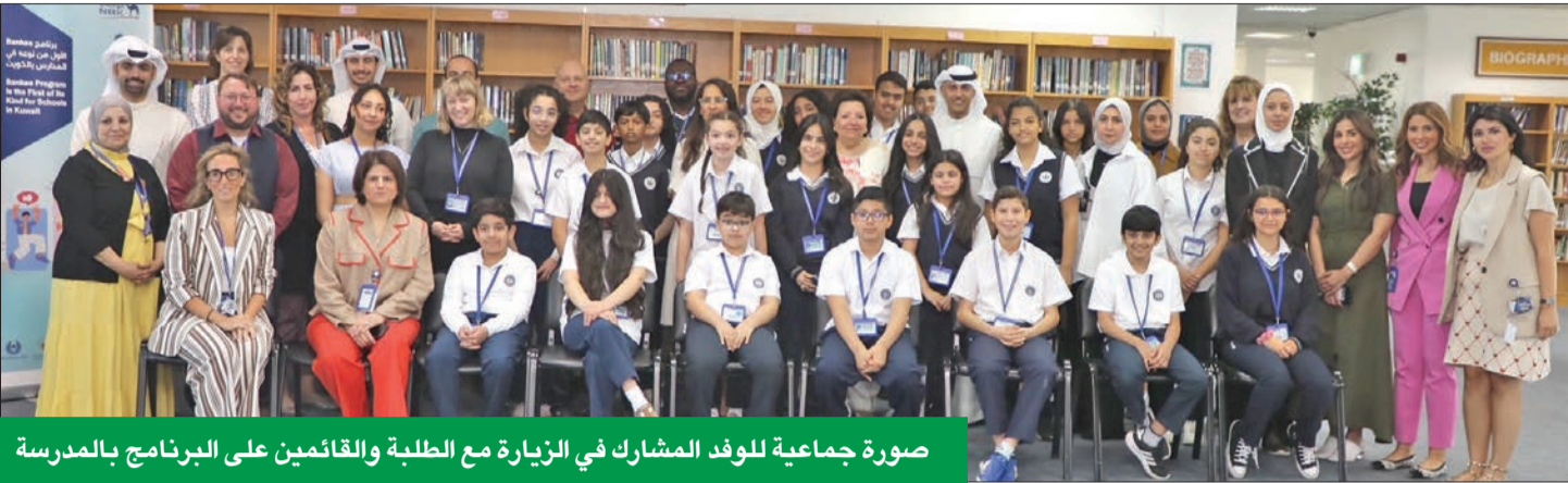
صورة جماعية للوفد المشارك في الزيارة مع الطلبة والقائمين على البرنامج بالمدرسة

يواصل بنك الكويت الوطني، بالتعاون مع وزارة التربية والهيئة العامة لمكافحة الفساد «نزاهة»، متابعة المرحلة التجريبية من برنامج Bankee، الذي يهدف إلى زيادة الوعي والثقافة المالية لدى طلاب وطالبات المدارس الحكومية والخاصة. وفي هذا الإطار، نظم البنك زيارة للمدرسة العالمية الأميركية بحولي، في إطار جولات الإدارة التنفيذية لمتابعة تطبيق البرنامج في المدارس.