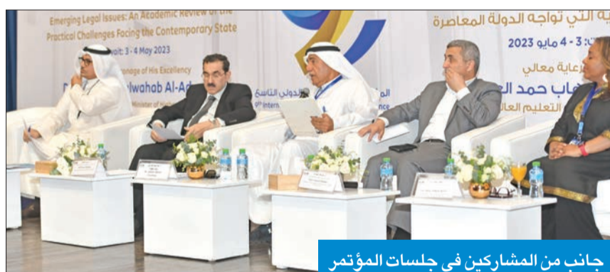
جانب من المشاركين في جلسات المؤتمر

تناولت القضاء والتشريع والتحالفات العسكرية والذكاء الاصطناعي