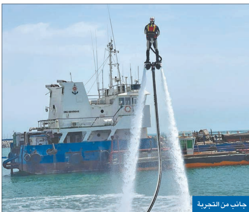
جانب من التجربة

في مسعى لتطوير معداتها والبياتها، بهدف دعم جهود منتسبيها، قامت قوة الإطفاء العام أمس بتجربة عملية على الجت سكي «فلاي بورد» وال «جت بورد» للحرائق المحدودة بالأماكن الضيقة، مثل المراسي وغيرها. وأعلنت «الإطفاء»، خلال التجربة، أن الهدف منها مساعدة رجال الإطفاء لتمكينهم من أداء مهام عملهم في مكافحة الحرائق من خلال التكنولوجيا الحديثة، وآخر ما توصلت إليه المعدات والآليات والتدرب عليها، وقد تخلل التجربة تمرين على مكافحة حريق زورق، حيث حقق نتائج إيجابية في سرعة إخماد الحريق. حضر التجربة رئيس قوة الإطفاء العام، الفريق خالد المكراد، وعدد من المسؤولين في «الإطفاء» والإنقاذ البحري.