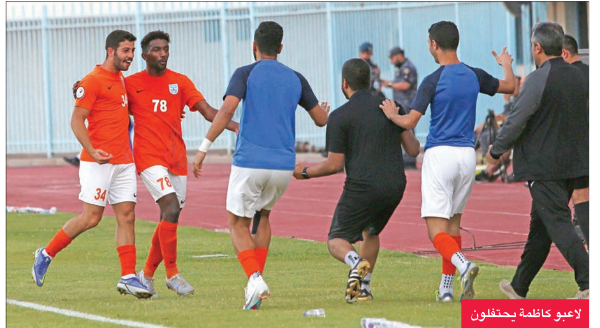
لاعبو كاظمة يحتفلون

وأضاف: «اللاعب الكويتي كاظمة في الموسم الحالي، شدد عقلة على أن «كاظمة» من أفضل الفرق التي تقدم مستويات في الموسم الحالي، ومحاولاً التقليل من أداء (البرتقالي) لا تليق بما يقدمه من مستويات لافتة أمثله إلى أن يكون مرشحاً لحصد لقب الدوري الممتاز».