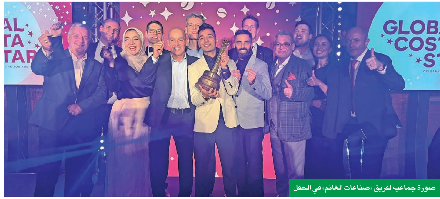
صورة جماعية لفرق «صناعات الغانم» في الحفل

المقاعد المريحة المصممة بشكل خاص لتتناسب مع متطلبات كل موقع على حدة. وتستمر صناعات الغانم في التزامها بتوفير تجربة فريدة من كوستا كوفي لمحبي القهوة في المنطقة، حيث تقدم