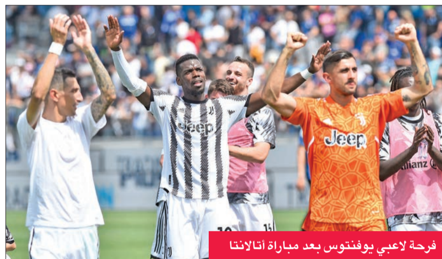
فرحة لاعبي يوفنتوس بعد مباراة أتالانتا

حسم المهاجم البلجيكي الدولي روميلو لوكاكو النتيجة بعد تمريرة حاسمة من الأرجنتيني لوانتارو مارتينيس قريبة داخل الشباك (33)، ثم