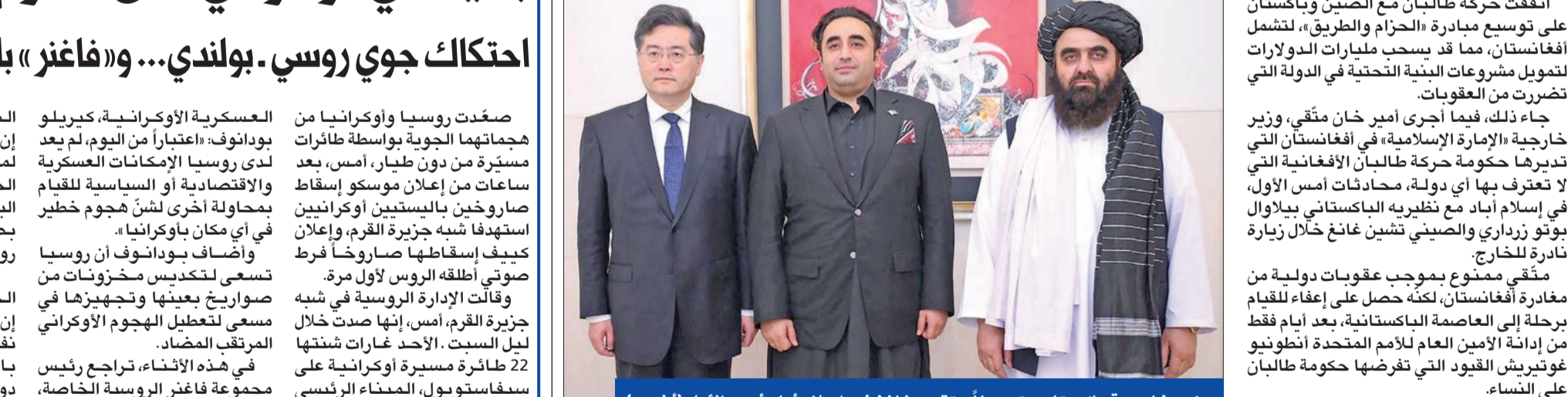
وزير خارجية باكستان متوسطاً متقي وغانغ في إسلام آباد أمس الأول

إسلام آباد: العلاقة مع دلهي رهن إعادة «الحكم الذاتي» لكشمير