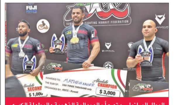
البطل البرازيلي متوجاً بالميدالية الذهبية والبطولة الكبرى

أحرز لاعبون كويتيون مشاركون في بطولة نادي أبو ظبي للقتال (أيه دي سي سي) المفتوحة للجوجيتسو 14 ميدالية ذهبية. وتوج البرازيلي ماتيويس أكرافير بالجائزة الكبرى والميدالية الذهبية، التي اختتمت أمس الأول، في فئة «الوزن المفتوح».