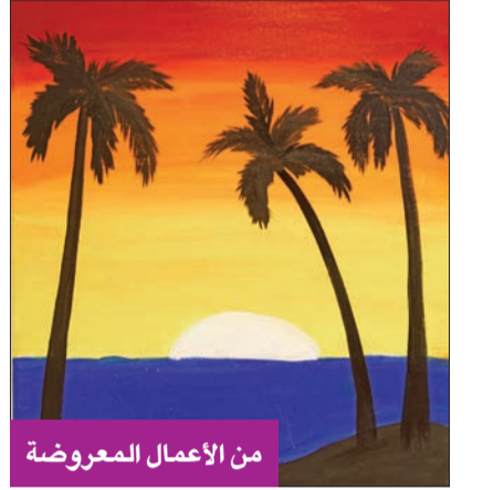
من الأعمال المعروضة