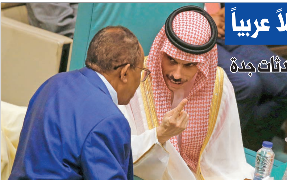
وزير خارجية السعودية فيصل بن فرحان يتحدث مع سفير السودان بمصر عبدالعزيز صالح في مقر الجامعة العربية بالقاهرة أمس

تحدثت أوساط سعودية بكثير من الحذر عن إمكانية حدوث اختراق في محادثات جدة وتحولها إلى مفاوضات سلام وليس فقط محادثات لتثبيت الهدنة.