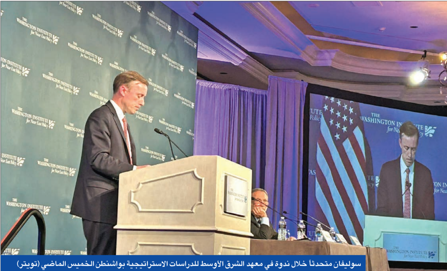
سوليفان متحدثاً خلال ندوة في معهد الشرق الأوسط للدراسات الاستراتيجية بواشنطن الخميس الماضي

الوثائق كشفت عن أنشطة تراقبها المخابرات الأمريكية تابعة للجيش الصيني في ميناء مطل على مياه الخليج، حيث يسعى البلد، الذي وصف بالشريك الأمني منذ وقت طويل، لتطوير علاقات أمنية أوثق مع بكين على حساب الولايات المتحدة. وتحتوي الوثيقة على خريطة من المرافق الأخرى التي يخطط الجيش الصيني لإنشائها في الشرق الأوسط وجنوب شرق آسيا وجميع أنحاء أفريقيا، وجاء فيها أن المسؤولين العسكريين الصينيين يطلقون على هذه الخطط اسم «المشروع 141».