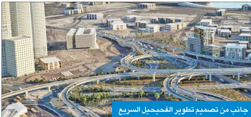
جانب من تصميم تطوير الفيحيل السريع

مخرجات الاتفاقيات الاستثمارية من خلال دراسة البدائل التصميمية المتاحة، وتحديث المستندات لضمان تحديث المواصفات والمتطلبات الفنية لكل الجهات المعنية. وأضاف أن الإجراء باتي تماشياً مع تطبيق كل المعايير والمواصفات العالمية الحديثة لجميع المكونات وبنود الأعمال المشمولة بتلك المشاريع، مع تحسين جودة وتكلفة المشاريع، والبدء في تنفيذها وفقاً للولويات، وبما يحقق