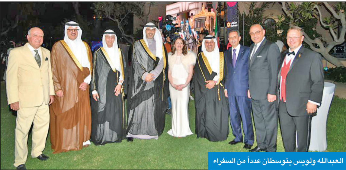
العبدالله ولويس يتوسطان عدداً من السفراء