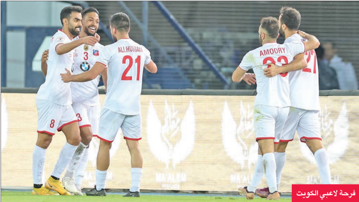
فرحة لاعبي الكويت

ستان يحسم تشكيل «البرتقالي» اليوم... و«الأبيض» يسابق الزمن لتجهيز برحمة وعامري