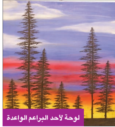
لوحة لأحد البراعم الواعدة

ونصحت أولياء الأمور بتعليم ابنائهم الرسم، لأنه يعد مهارة جميلة يجب علينا جميعاً تشجيع الأطفال على ممارستها من اللحظة التي يتمكنون فيها من التلوين لأول مرة، مضيئة أن المركز يبدأ مع الطفل بالألوان «الشيئية»، إلى أن يصل إلى الألوان الزيتية ومن ثم استخدام الرصاص. وفي ختام المعرض كرمت الخضر العديد من الأطفال المشاركين في المعرض.