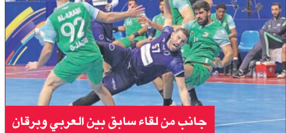
جانب من لقاء سابق بين العربي وبرقان

لُختمت اليوم الدور ربع النهائي لبطولة كأس الاتحاد لكرة اليد، بإقامة مباراتين، حيث يلتقي في الخامسة مساءً العربي مع برقان، وفي السابعة مساءً يلعب السالمية مع كاظمة، وذلك على صالة اليد بمجمع صالات الشيخ سعد عبدالله الرياضي.