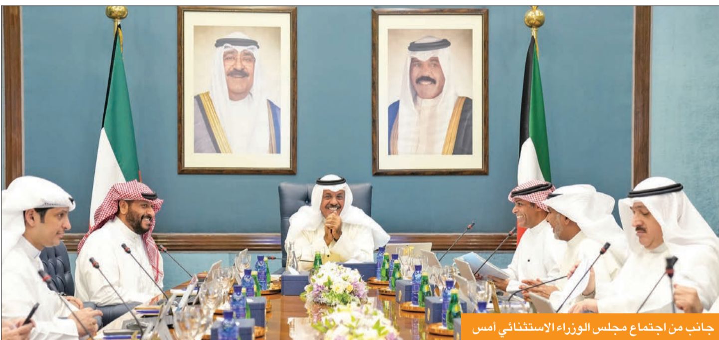
جانب من اجتماع مجلس الوزراء الاستثنائي أمس