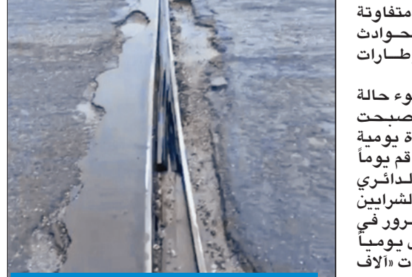
فواصل التمديد على جسور الدائرية الرابع

وأحدثت حفراً بأحجام متفاوتة مما يهدد بخطر الحوادث سياراتهم. «الجريدة» رصدت أصح تلك الفواصل، والتي أصبحت مشكلة حقيقية ومعاناة يومية لمترادي الطرق وتتفاقم يوماً بعد يوم خصوصاً الدائري الرابع الذي يعتبر أحد الشرايين الرئيسية لحركة المرور في البلاد، حيث يستقبل يومياً كثافة عالية من السيارات «الألف المركبات».