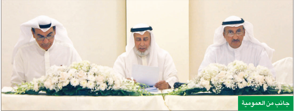
جانب من العمومية

السعد: نتطلع في 2023 إلى رفع الطاقة الإنتاجية لبعض المصانع تلبية لحاجة السوق