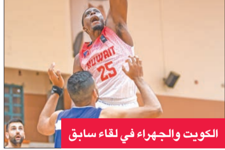
الكويت والجهراء في لقاء سابق

تقام اليوم مباراة واحدة في افتتاح منافسات الدور قبل النهائي لبطولة الدوري الممتاز لكرة السلة، إذ يلتقي في الساعة السابعة مساءً فريق الكويت مع الجهراء في أولى مباريات «البلاي أوف»، الذي يقام من ثلاث مباريات، على صالة الاتحاد بمجمع الشيخ سعد عبدالله الرياضي. وكان الكويت اختتم مبارياته في الدور الثاني من الدوري الممتاز بالخسارة أمام القادسية بنتيجة 106-102.