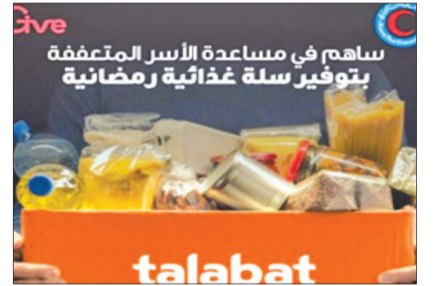
ساهم في مساعدة الأسر المتعففة بتوفير سلة غذائية رمضانية

وزعت «طلبات» 3000 كسرة الصائم على السائقين عند إشارات المرور في الشوارع الاستراتيجية. وتتميز هذه المبادرة بأنها تهدف إلى الحد من الحوادث المرورية خلال الشهر الفضيل، لاسيما مع اقتراب موعد الإفطار، وحث السائقين على عدم محاولة التجاوزات المرورية.