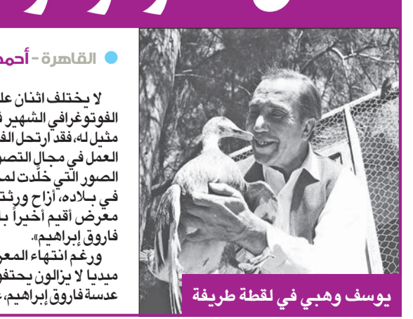
يوسف وهبي في لقطة طريفة

القاهرة - أحمد الجبال لا يختلف اثنان على أن التركة التي خلفها المصور الفوتوغرافي الشهير فاروق إبراهيم، هي كنز توثيقي لا مثيل له، فقد ارتحل الفنان المصري في مسيرة طويلة من العمل في مجال التصوير الصحافي، التقط خلالها آلاف الصور التي خلّدت لمحات من حياة الزعماء والمشاهير في بلاده، أزاح ورتنه الستار عن مجموعة منها في معرض أقيم أخيراً بالقاهرة تحت عنوان «الأسطورة فاروق إبراهيم». ورغم انتهاء المعرض، فإن رواد مواقع السوشيال ميديا لا يزالون يحفظون باللقطات النادرة التي خلّدتها عدسة فاروق إبراهيم، عبر إعادة نشرها على نطاق واسع.