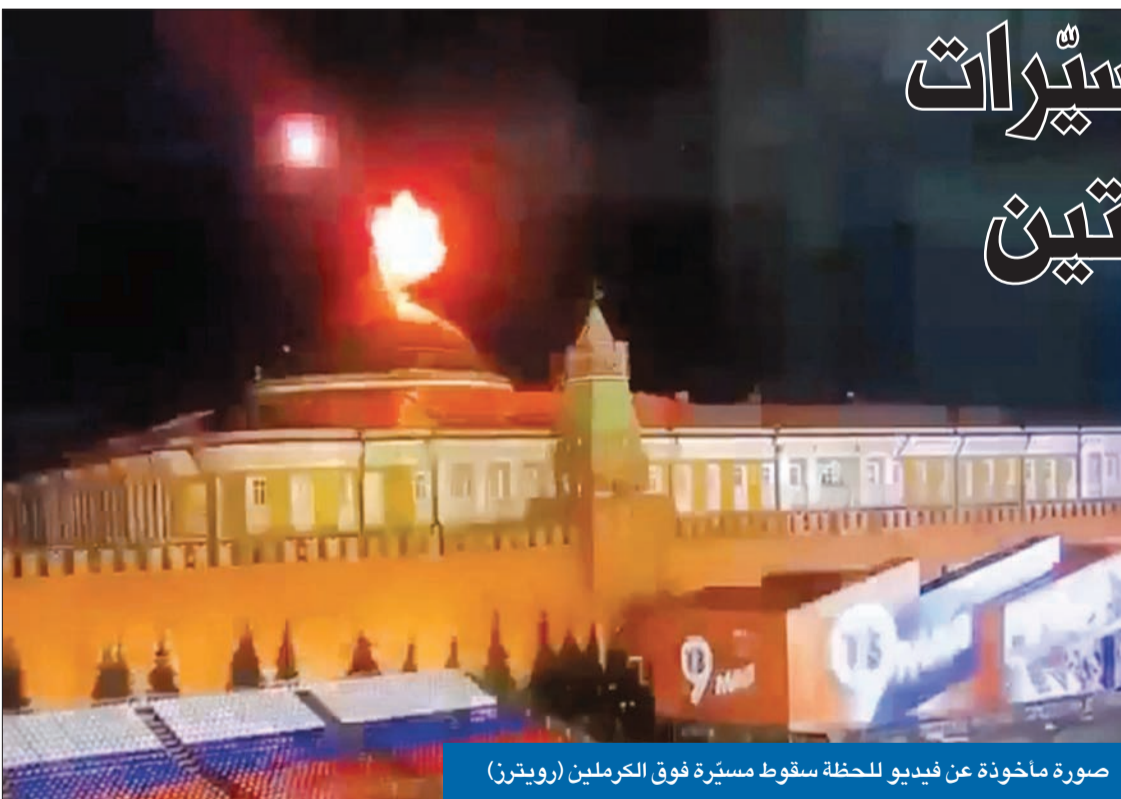
صورة مأخوذة عن فيديو للحظة سقوط مسيّرة فوق الكرملين

في أول هجوم على العاصمة الروسية منذ الحرب العالمية الثانية، أعلنت روسيا، أمس، أنها أسقطت طائرتين مسيّرتين استهدفتا الكرملين فيما وصفته بمحاولة «إرهابية» لاغتيال الرئيس فلاديمير بوتين، مؤكدة أنها تحفظ بحق الرد على الهجوم بالمكان والزمان المناسبين، في وقت نفت أوكرانيا علاقتها بالهجوم، وشككت واشنطن في الرواية الروسية. وأوضحت الرئاسة الروسية، في بيان، أن «مسيّرتين استهدفتا الكرملين... وتم تعطيل الجهازين»، واصفة العملية بأنها «عمل إرهابي ومحاولة