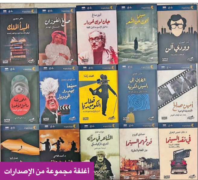
أغلفة مجموعة من الإصدارات