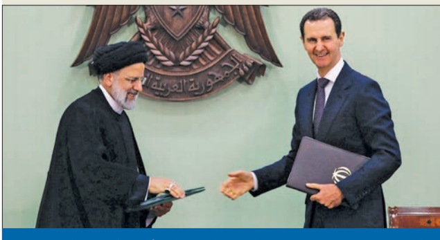
الأسد ورئيسي بعد توقيع اتفاقات في دمشق أمس

في زيارة هي الأولى منذ بدء الأزمة السورية في 2011 لرئيسي إيراني، قام الرئيس الإيراني إبراهيم رئيسي أمس بزيارة للعاصمة السورية دمشق، التقى خلالها الرئيس بشار الأسد، وذلك عقب الاتفاق الذي جرى قبل شهرين بين السعودية وإيران في بكين، وموجة التقارب العربي خصوصاً السعودي مع سورية. ووقع رئيسي والأسد مذكرة تفاهم لـ «خطة تعاون استراتيجي شامل وطويل الأمد» بين بلديهما، في مستهل الزيارة، كما شهد الرئيسان توقيع 15 وثيقة للتعاون في مجالات شملت الزراعة والنخيل والرياح بين البلدين بالسكك الحديدية، والاعتراف بالشهاديات البحرية والمناطق الحرة والطيران المدني. 02