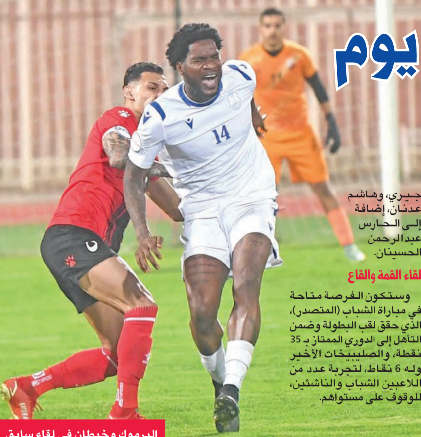
اليرموك وخيطان في لقاء سابق

وستكون الفرصة متاحة في مباراة الشباب (المتصدر)، الذي حقق لقب البطولة وضمن التأهل إلى الدوري الممتاز بـ 35 نقطة، والصليبخات الأخير وله 6 نقاط، لتجربة عدد من اللاعبين الشباب والنشئين، للوقوف على مستواهم.