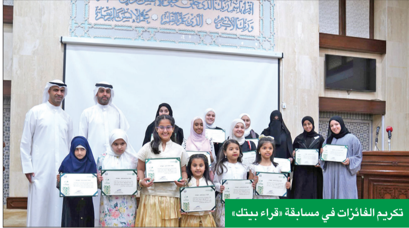
تكريم الفائزين في مسابقة «قراء بيتك»