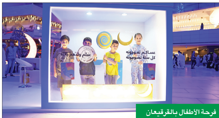
فرحة الأطفال بالقرقيعان