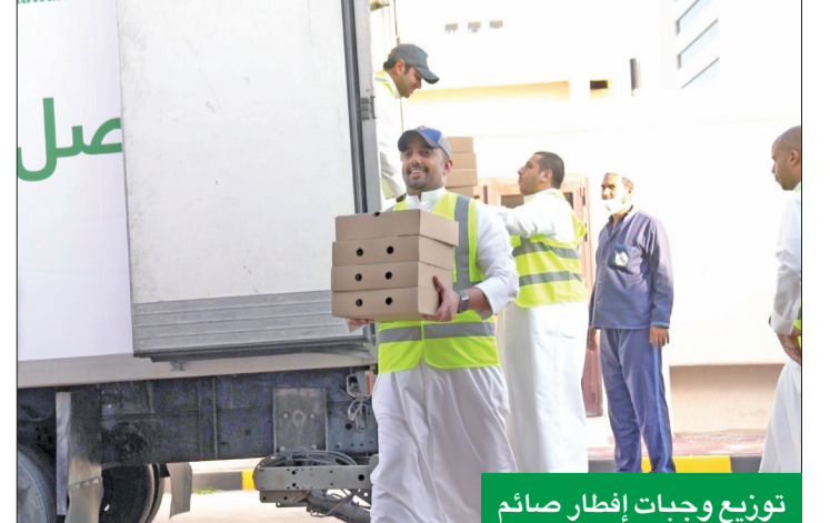
توزيع وجبات إفطار صائم