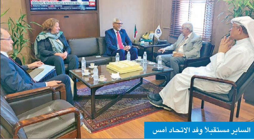
الساير مستقبلاً وفد الاتحاد أمس

أشاد الأمين العام للاتحاد الدولي لجمعيات الصليب الأحمر والهلال الأحمر جاغان شاباغاين أمس بدور دولة الكويت في مجال العمل الإنساني والإغاثي والتعامل مع الأزمات والكوارث والمشاركة المجتمعية.