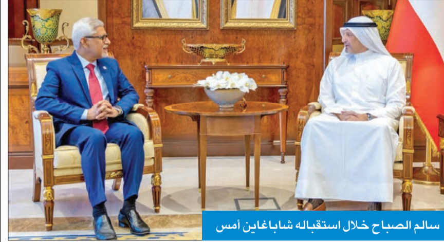
سالم الصباح خلال استقباله شاباغاين أمس

بحث مع شاباغاين التعاون لرفع المعاناة عن السودانيين