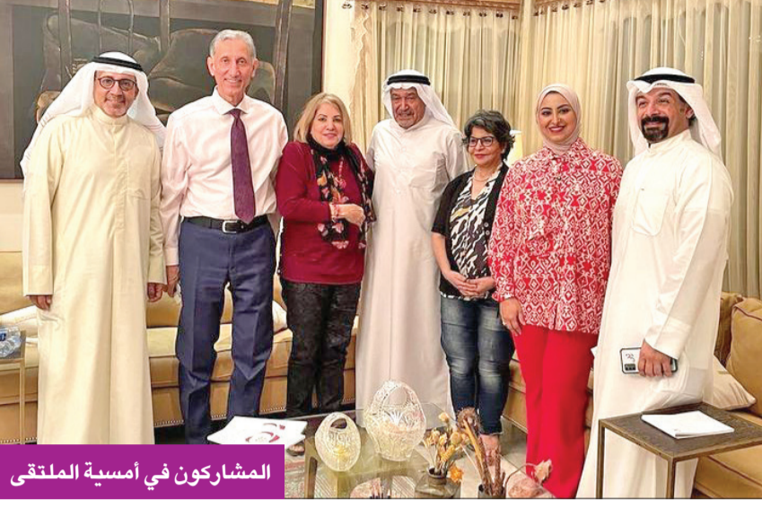
المشاركون في أمسية الملتقى

ومن ثم منصات التواصل الاجتماعي، مبينا أن الدراما الرمضانية في الوقت الحالي لم تعد دراما رمضان عتدمت فقط الأسماء، والوضحة، والجدل. وفي مداخلة للفنان القدير جاسم النبهان، أشار إلى ضرورة دعم الشباب وإعطائهم فرصة، وأضاف: نحن نحتاج إلى كاتب