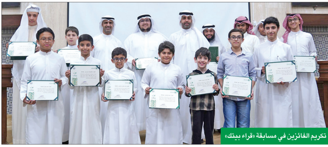
تكريم الفائزين في مسابقة «قراء بيتك»

وأكد الرويح المضي قدما في المساهمات المجتمعية ودعم كل مبادرات العمل التطوعي، بما يؤكد ريادة «بيتك» في المسؤولية الاجتماعية التي تشكل ركيزة أساسية في التنمية المستدامة بمختلف الجوانب البيئية والصحية والاجتماعية والتعليمية والرياضية وغيرها، مشيرا إلى تصنيف «رائد المسؤولية الاجتماعية» على مستوى الكويت الذي فاز به «بيتك» من مجلة يوروموني العالمية، تقديرا لمسيرته المجتمعية الممتدة، ودوره البارز في تنفيذ المبادرات المجتمعية ذات القيمة المضافة، والأثر الإيجابي على المجتمع، وريادته على مستوى مؤسسات القطاع الخاص.