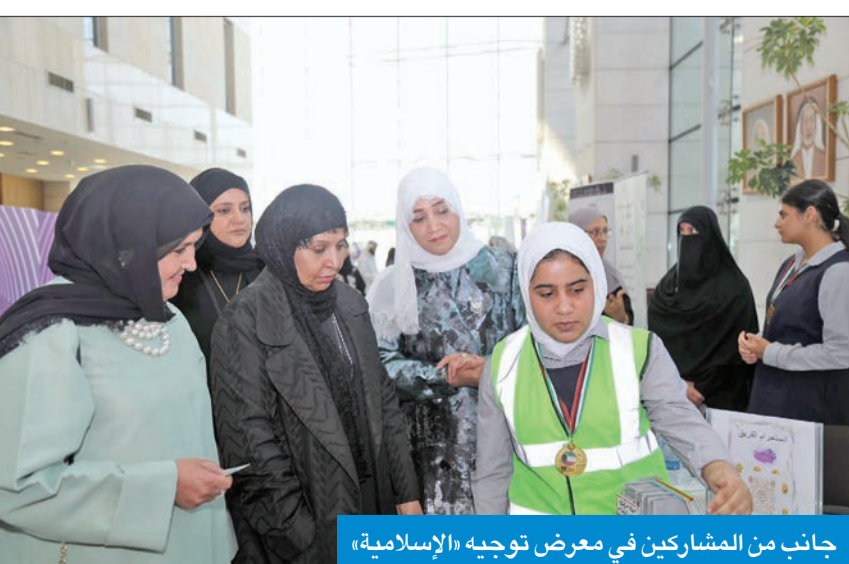
جانب من المشاركين في معرض توجيه «الإسلامية»