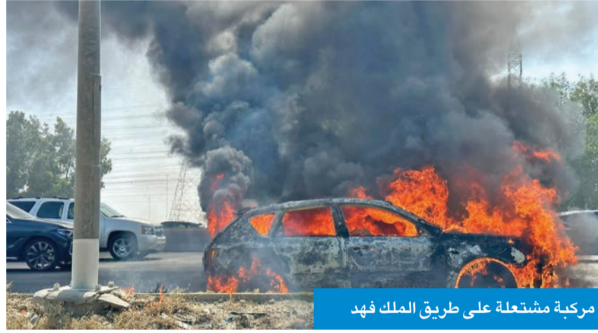
مركبة مشتعلة على طريق الملك فهد

من جانب آخر، وفي حادث منفصل، ذكرت إدارة الإعلام أن «العمليات المركزية»