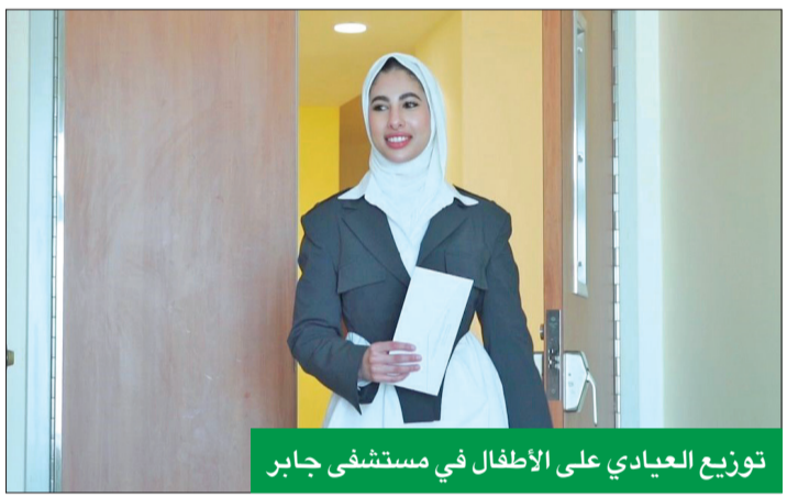
توزيع العيادي على الأطفال في مستشفى جابر

ممارسة الرياضة واتباع نمط حياة صحي ضمن اطار حملة «صحة أفضل... حياة أفضل». وأضاف أن هذه المبادرات تندرج ضمن اطار المسؤولية الاجتماعية التي يحرص من خلالها «بيتك» على تسليط الضوء على التجارب الريادية للشباب الكويتي، ودعم المبادرين ورواد الأعمال والمشاريع الشبابية الكويتية ومبادرات الابتكار والتكنولوجيا، مثل تطبيق V-Thru وغيرها من التطبيقات الأخرى التي يحرص «بيتك» على دعمها، انطلاقا من ريادة وجهوده المتميزة في التحول الرقمي في هذا المجال.