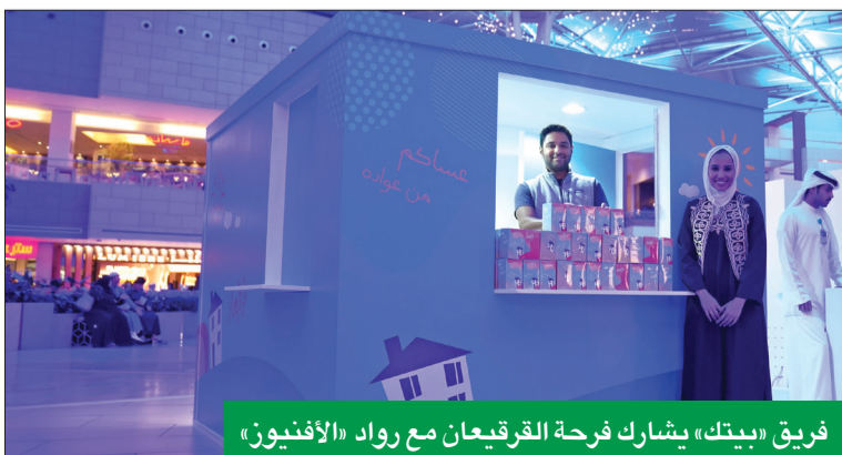
فريق «بيتك» يشارك فرحة القرقيعان مع رواد «الأفنيوز»