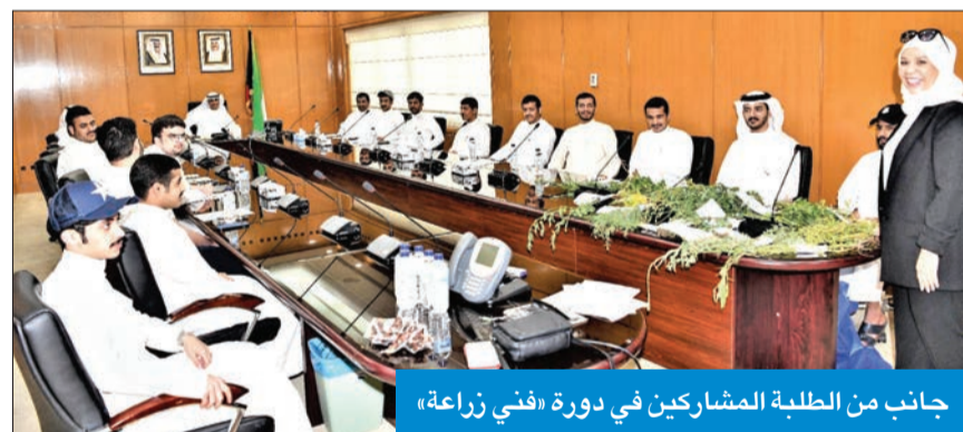
جانب من الطلبة المشاركين في دورة «فني زراعة»

القريفة: مستعدون لاستيعاب خريجي الهيئة وكليات الزراعة