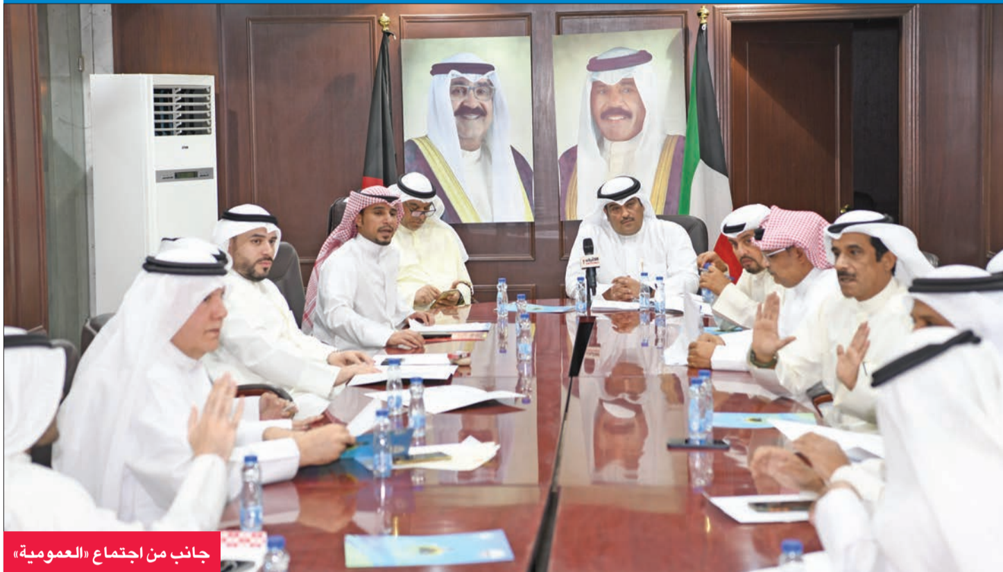
جانب من اجتماع «العمومية»