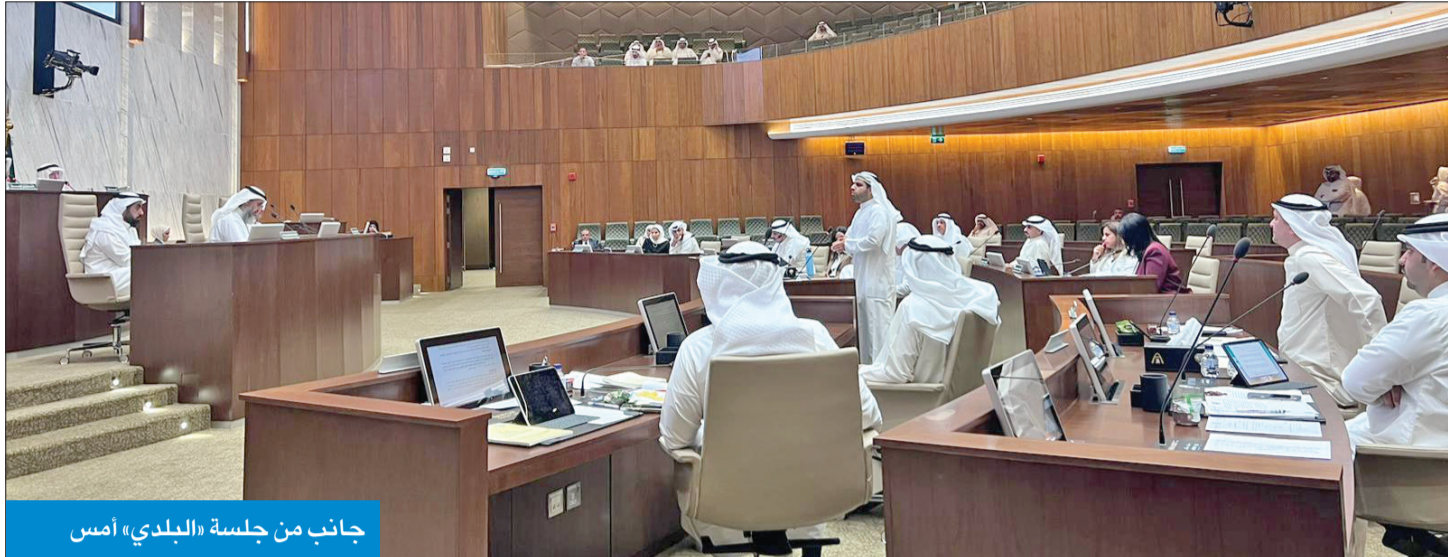
جانب من جلسة «البلدي» أمس

«قانونية البلدية»: لا يحق إلغاء الرسوم بعد صدور قرار مجلس الوزراء المشروع أثار حفيظة الأعضاء: من الخطأ إخراجنا مادام قرار الحكومة نافذاً