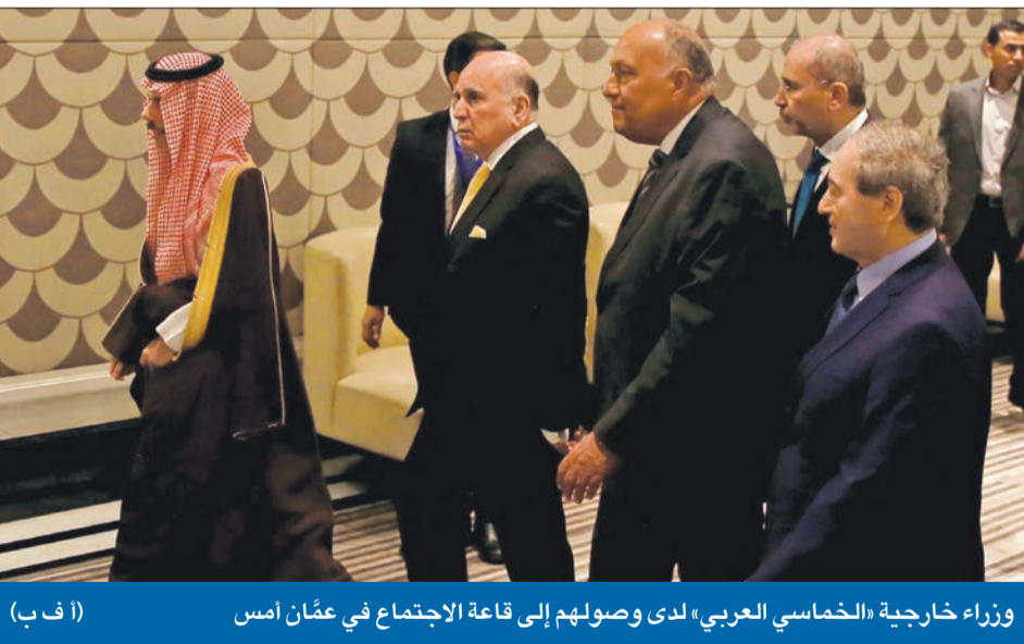
وزراء خارجية «الخماسي العربي» لدى وصولهم إلى قاعة الاجتماع في عمان امس

آلية لعودة سريعة وأمنة للاجئين... ودمشق تتعهد بدعم مكافحة المخدرات