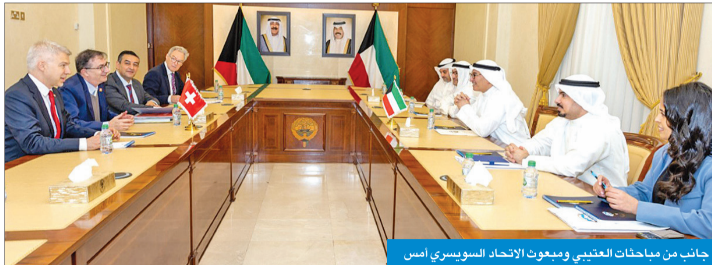
جانب من مباحثات العتيبي ومبعوث الاتحاد السويسري أمس

التقى نائب وزير الخارجية السفير منصور العتيبي، أمس، في مقر وزارة الخارجية مع مبعوث الاتحاد السويسري الخاص لمنطقة الشرق الأوسط وشمال إفريقيا السفير ولفغانغ أماديوس بيرولهارت، بمناسبة زيارته الرسمية إلى دولة الكويت.