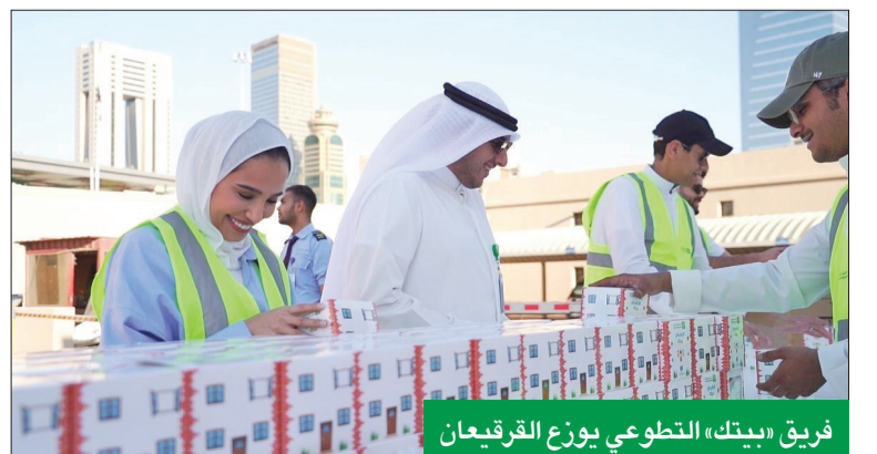
فريق «بيتك» التطوعي يوزع القرقيعان