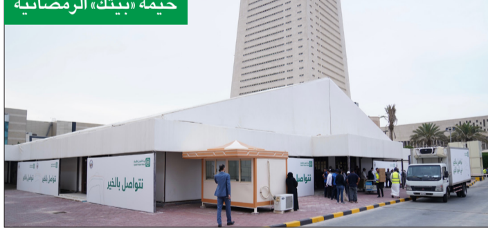
خيمة «بيتك» الرمضانية

ولفت إلى أن «بيتك» اختتم أكبر مسابقة تحدي مشي للجمهور، والتي استمرت طوال شهر رمضان، بالتعاون مع الشريك الاستراتيجي للبنك، تطبيق (V-Thru)، بمشاركة أكثر من 10 آلاف متسابق، وتأتي المسابقة في اطار تشجيع المجتمع على