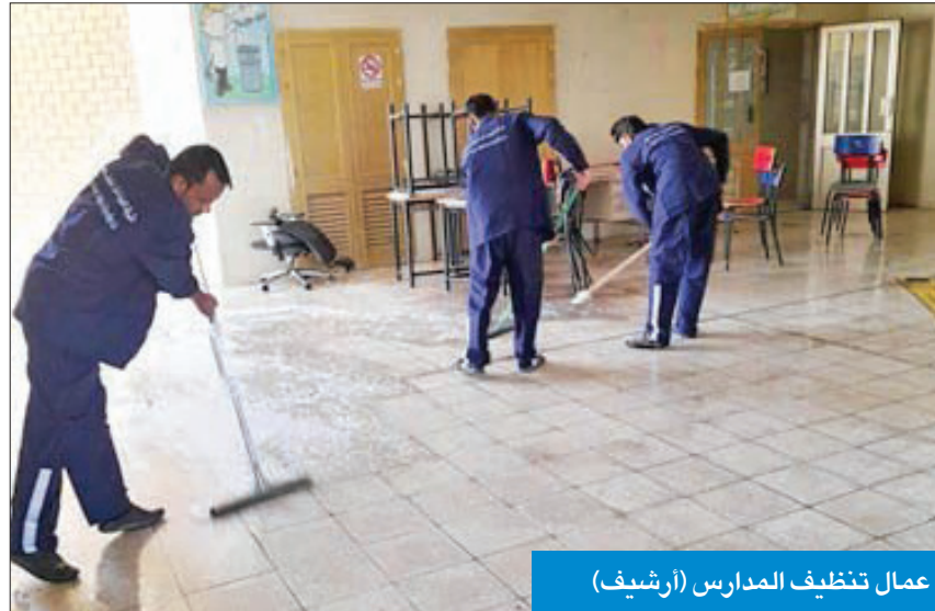
عمال تنظيف المدارس (أرشيف)

يُذكر أن «التربية» وقعت في مازق خلال أزمة «كورونا» مع انتهاء بعض عقود النظافة من جهة، وعدم التزام بعض الشركات من جهة أخرى في توفير عمالة النظافة، الأمر الذي دفعها إلى الاستعانة بعمال النظافة لدى بلدية الكويت التي ساهمت في تنظيف المدارس مع بداية العام الدراسي قبل الماضي.