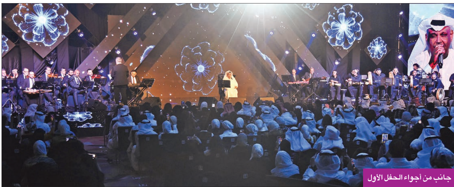
جانب من أجواء الحفل الأول

وكان مسك الختام مع الفنان خالد عبدالرحمن، الذي وجه كلمة للجمهور قال فيها «السلام عليكم، كل عام وانتم بخير، وكل عام حكامنا وأوطاننا بخير، أنا سعيد هذه الليلة بوجودي بينكم»، ليصفق له الجمهور بحرارة، ويبدأ بطلباتهم من الأغاني، ليرد عليهم ويقول «ياذن الله، راح نقدم اللي نقدر عليه»، وبدأ وصلته الغنائية بغناء