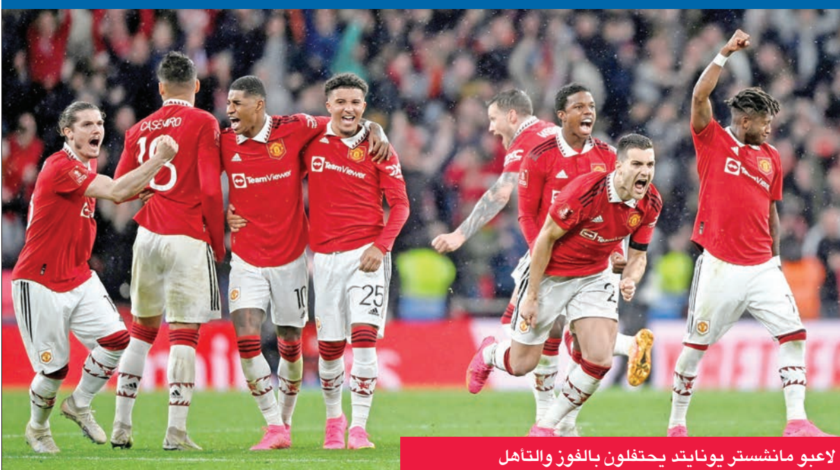
لاعبو مانشستر يونايتد يحتفلون بالفوز والتأهل

خسر أمام تشلسي، علماً بأن لقبه الأخير يعود إلى 2016 على حساب كريستال بالاس. أما برايتون فكان يامل العودة إلى النهائي للمرة الثانية فقط في تاريخه والأولى منذ 1983 عندما سقط أمام مانشستر يونايتد 4-0 بعد انتهاء المباراة الأولى بالتعادل (النظام السابق).