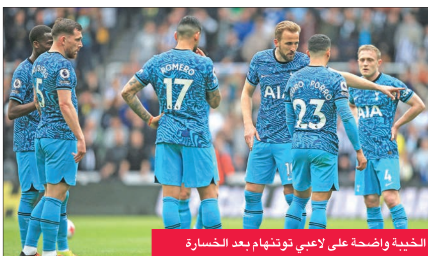
الخيبة واضحة على لاعبي توتنهام بعد الخسارة

الحق نيوكاسل هزيمة مذلة بضيفه توتنهام 1-6. في مباراة سجل فيها أصحاب الأرض الأهداف الخمسة الأولى في أول 21 دقيقة، في منافسات المرحلة الثانية والثلاثين من الدوري الإنكليزي لكرة القدم، فحسم مواجهة مهمة في الصراع على مراكز دوري أبطال أوروبا.