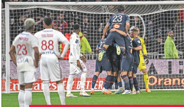
لاعبو مرسيليا يحتفلون بالفوز القاتل وسط صدمة لاعبي ليون

استعاد مرسيليا المركز الثاني من لنس، بفوزه القاتل والثمين على مضيضة ليون 2-1، أمس الأول (الأحد)، في ختام المرحلة الثانية والثلاثين من بطولة فرنسا لكرة القدم. وكان مرسيليا الهادي بالتسجيل عبر مهاجمه الدولي التركي دجنغيز أوندر (44)، لكن القائد المخضرم الكسندر لاكازيت أدرك التعادل لليون (68)، قبل أن يخطف الفريق الجنوبي هدف الفوز بفضل النيران الصديقة عندما حاول المدافع العاجي سيبالي ديومانديه إبعاد كرة عرضية من أمام المرعى، فارتدت من زميله مالو غوستو إلى الشباك (2+90). وكان لنس انترز المركز الثاني مؤقتاً، السبت، بفوزه الكبير على ضيفه موناكو بثلاثة نظيفة.