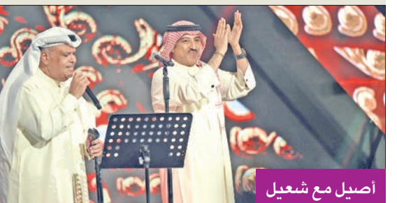
أصيل مع شعيل

على هامش الحفل الأول، أكد نائب رئيس مجموعة البركة الإعلامية د. علي حسن، أن حفل الفنان نبيل شعيل وأصيل أبوبكر سالم ليس أول مشاركة بين الفنانين مع بعضهما بعضاً، لافتاً إلى أنه على الصعيد المحلي تعد أول مشاركة بينهما، مضيفاً أنهم أحبوا أن يعملوا توليفة جديدة، والمفاجأة للجمهور هي أغنية «دويتو» لأول مرة تجمعهما. وعن سبب اختيارهم لنبيل شعيل وأصيل في أولى حفلات العيد قال: «الفنان نبيل شعيل يعد أحد أكبر نجوم الكويت، ونجوم الشرق الأوسط أيضاً، أما الفنان أصيل أبوبكر فهو أحد أبرز نجوم الشرق الأوسط، والسعودية، والكويت، خصوصاً أن والده - يرحمه الله - أول أغنية غناها «يا دوب مرت علي» كانت في الكويت، واليوم الفنانان يعتبران من النجوم الكبار في المنطقة».