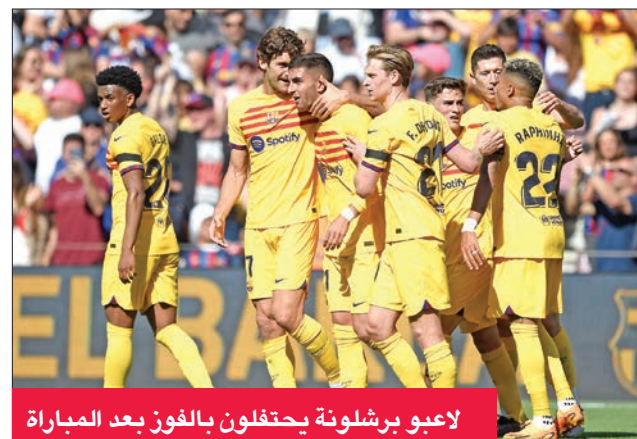
لاعبو برشلونة يحتفلون بالفوز بعد المباراة

حقق برشلونة الأهم واستعاد توازنه مقرباً من اللقب الأول منذ 2019 بحسم القمة أمام ضيفه أتلتيكو مدريد 1-0 صفر الأحد في المرحلة الثلاثين من بطولة إسبانيا لكرة القدم. ويدين برشلونة بفوزه لمهاجمه الدولي فيران توريس الذي سجل الهدف الوحيد في الدقيقة 44. وعاد برشلونة إلى سكة الانتصارات بعد تعادله مع سلبين مكييين أمام جيرونا وخيتافي، واستعاد فارق النقاط الـ11 التي تفصله عن غريمه التقليدي ومطارده المباشر ريال مدريد حامل اللقب الموسم الماضي والفائز على ضيفه سلتا فيغو 2-0 صفر السبت. والسدى برشلونة خدمة للنادي الملكي بعدما تمكن الأخير من الابتعاد بفارق خمس نقاط عن جواره ووضع حداً لسلسلة من ستة انتصارات تواليها لاتلتيكو في الليغا.