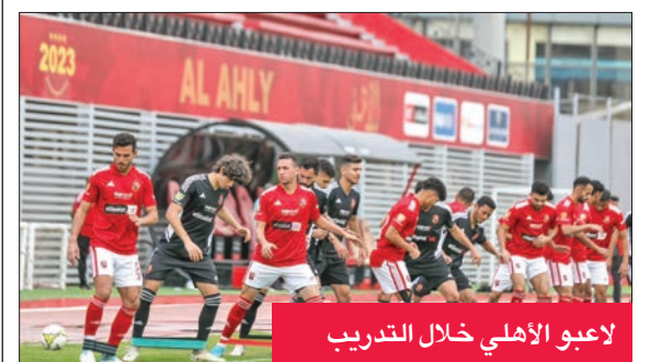
لاعبو الأهلي خلال التدريب