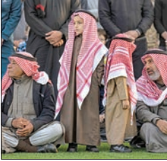
اجتماع رباعي في موسكو يبحث المصالحة السورية - التركية