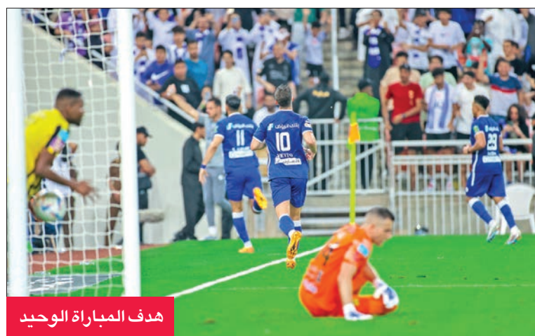
هدف المباراة الوحيد