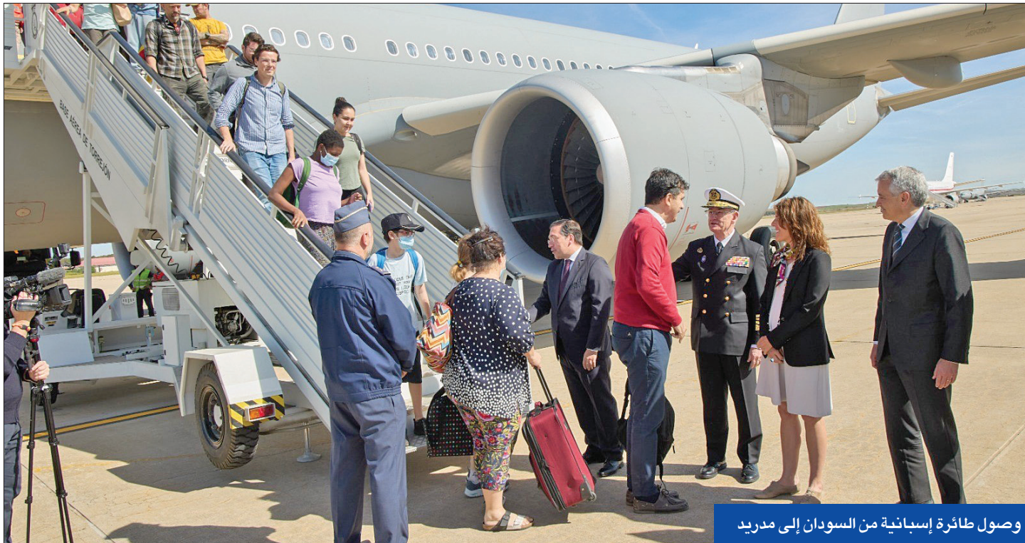
وصول طائرة إسبانية من السودان إلى مدريد

مع تقطع السبل بالاف الدبلوماسيين الأجانب وموظفي الإغاثة والطلاب وعائلاتهم، سابت دول العالم الزمن لإجلاء الآلاف من رعاياها من الخرطوم وضاعت عمليات إجلاء السفارات وإخلاء البعثات في عمليات معقدة أثارت مخاوف السودانيين من أن الساعات المقبلة ستشهد مواجهات دامية بين الجيش وقوات الدعم السريع. في غياب أي أفق لوقف المعارك الطاحنة المستمرة منذ 10 أيام بين الجيش السوداني بقيادة عبدالفتاح البرهان وزعيم قوات الدعم السريع محمد حمدان دقلو (حميدتي)، تسارعت أمس عمليات إجلاء الرعايا والدبلوماسيين الأجانب وإغلاق السفارات بالخرطوم، في وقت أرسلت الولايات المتحدة قطعاً بحرية للمساعدة إلى جانب الجسور الجوية والقوافل البرية. ومع استمرار أزيز الرصاص ودوي الانفجارات في الخرطوم ومدن أخرى، تمكنت عواصم غربية وإقليمية من فتح مسارات آمنة براً وبحراً وجواً لإخراج الرعايا الأجانب بضمناً الطرفين المتصارعين، البرهان وحميدتي. وغداً إصدار الرئيس الأمريكي أمراً بغلاق السفارة، حذر البيت الأبيض أمس من أن العنف في السودان في ازدياد والوضع اليوم أخطر مما كان عليه أمس، مشيراً إلى أنه بعد قطعاً بحرية للمساعدة في حال رغب الأميركيون في المغادرة.