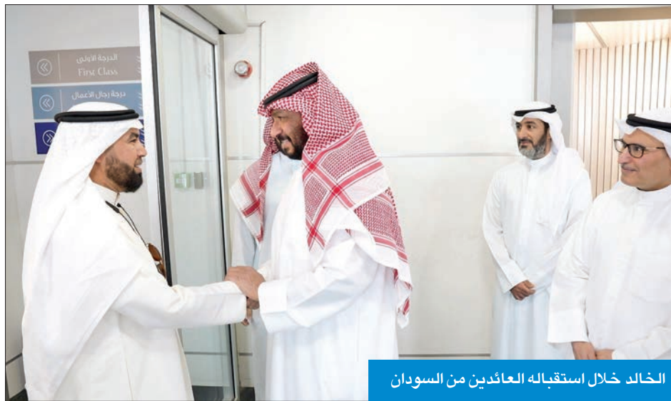
الخالد خلال استقباله العائدين من السودان

أكد نائب رئيس مجلس الوزراء وزير الداخلية وزير الدفاع بالوكالة الشيخ طلال الخالد حرص القيادة السياسية ممثلة بصاحب السمو أمير البلاد الشيخ نواف الأحمد وسمو ولي عهده الأمين الشيخ مشعل الأحمد ورئيس مجلس الوزراء سمو الشيخ أحمد نواف الأحمد، ومتابعاتهم الحثيثة للجهود المبذولة من وزارة الخارجية بقيادة الوزير الشيخ سالم الصباح وأعضاء سفارة الكويت لدى جمهورية السودان في عملية تأمين سلامة المواطنين السعوديين الراغبين في العودة إلى البلاد من السودان. جاء ذلك خلال استقباله ونائب وزير الخارجية السفير منصور العتيبي وعدد من كبار مسؤولي وزارة الخارجية، مساء أمس الأول، (25) مواطناً كويتياً قادمين من مطار جدة الدولي إلى البلاد، في إطار الخطة الطارئة التي نفذتها الخارجية، لإجلاء المواطنين الكويتيين العالقين جراء الاضطرابات المسلحة والتطورات الأمنية الحرجة التي يشهدها السودان. وأشاد الخالد بالجهود والتسهيلات التي قدمتها السعودية بقيادة خادم الحرمين الشريفين الملك سلمان بن عبدالعزيز وولي العهد رئيس مجلس الوزراء والحكومة السعودية صاحب السمو الملكي الأمير محمد بن سلمان التي أسهمت بدورها في نجاح عملية الإجراء لمواطني الدول الشقيقة والصديقة، مما يؤكد مكانة وقدرات المملكة على الصعيدين الإقليمي والدولي.