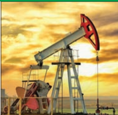
النفط يتراجع مع غموض التوقعات الاقتصادية العالمية