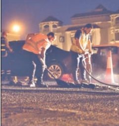
«الأشغال»: إصلاح حفر الطرق في 150 موقفاً