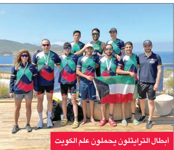
أبطال الترايثلون يحملون علم الكويت

جدا قبل المشاركة في بطولة إسبانيا، إحدى البطولات العالمية، والتي تشهد مشاركة أبطال العالم.