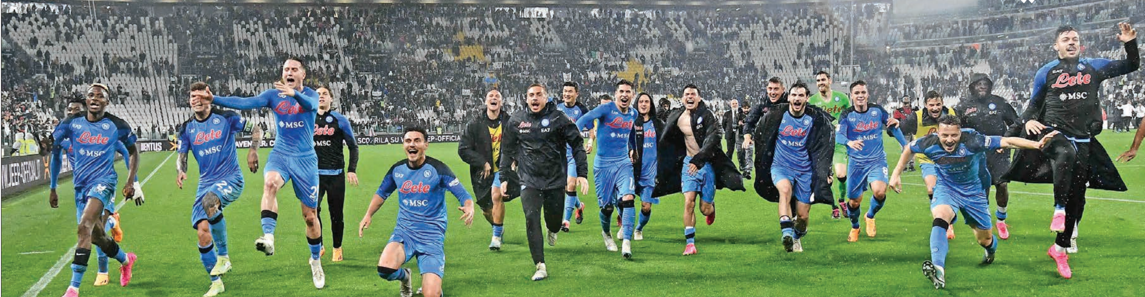
لاعبو نابولي يحتفلون بالفوز على يوفنتوس والاقتراب من اللقب

اقترب نابولي من الفوز بلقب الدوري الإيطالي لكرة القدم، بعد تغلبه على نظيره يوفنتوس 1-0.