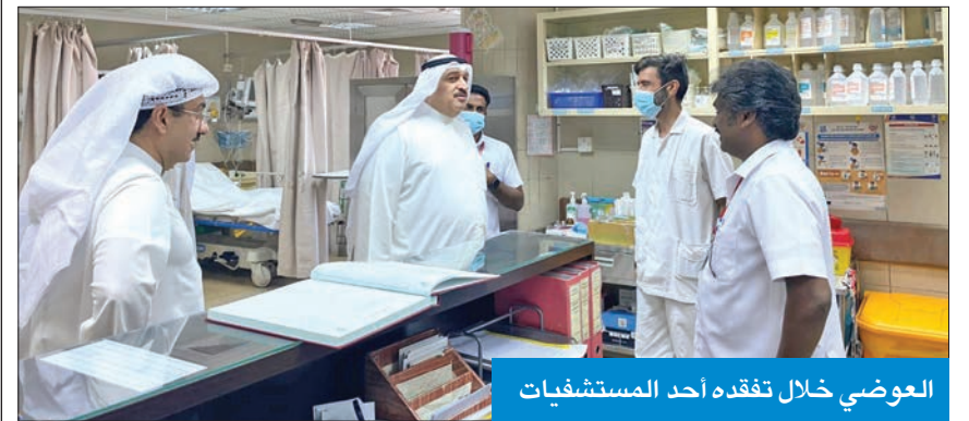
العوضي خلال تفقده أحد المستشفيات