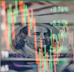
مخاوف حول إزالة الدولار من الاقتصاد العالمي