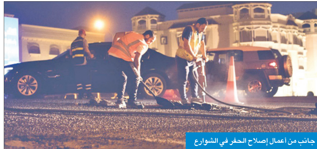
جانب من أعمال إصلاح الحفر في الشوارع