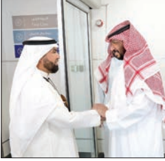
الخالد: القيادة حربية على عودة مواطنينا من السودان