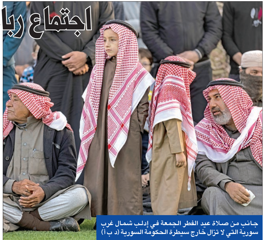
جانب من صلاة عيد الفطر الجمعة في إدلب شمال غرب سورية التي لا تزال خارج سيطرة الحكومة السورية

على وقع تغيرات دبلوماسية في خريطة المنطقة، مع استعادة العلاقات الدبلوماسية بين إيران والسعودية برعاية بكين، وانفتاح عربي متسارع تجاه دمشق، عززته الأسبوع الماضي زيارة أجهاما وزير الخارجية السعودي فيصل بن فرحان إلى دمشق، تستضيف العاصمة الروسية موسكو، اجتماعاً رباعياً بين وزراء دفاع ورؤساء استخبارات تركيا وروسيا وسورية وإيران، لبحث المصالحة التركية، السورية، بعد أن فشل اجتماع بين دبلوماسيين من الدول الأربع، في وقت سابق من الشهر الجاري، في ترتيب لقاء بين وزيرتي خارجية البلدين، وكشف وزير الدفاع التركي، خلوصي أكار، أمس، أن هدف الاجتماع وحل المشاكل العالقة عن طريق الحوار،