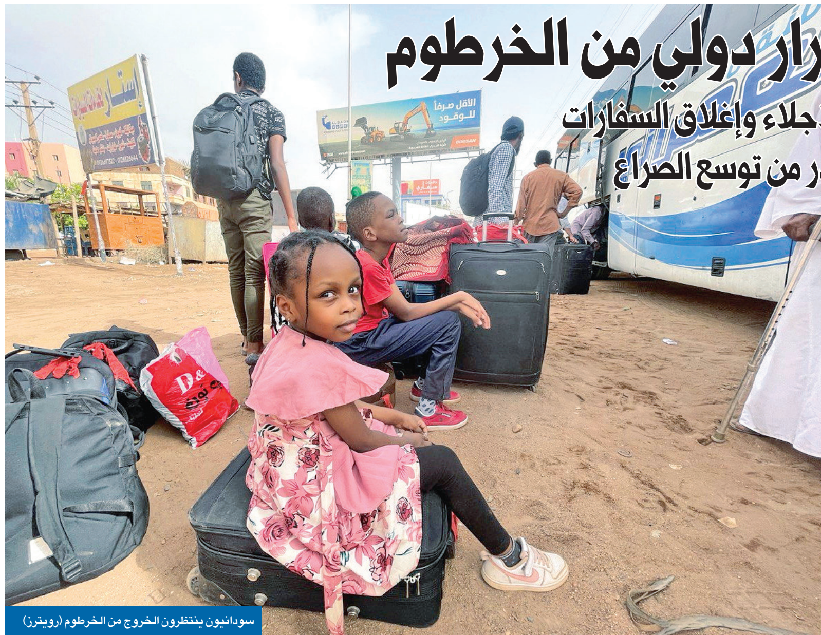
سودانيون ينتظرون الخروج من الخرطوم