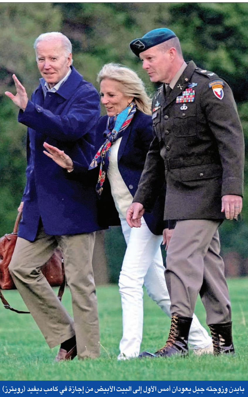
بايدن وزوجته جيل يعودان أمس الأول إلى البيت الأبيض من إجازة في كامب ديفيد

في عام 2020، كان بايدن قليل الظهور، إذ تسبب تفشي جائحة كوفيد - 19 في تعطيل أغلب جوانب الحياة بالولايات المتحدة، بما في ذلك حملة انتخابات الرئاسة التي وضعت في مواجهة الرئيس الجمهوري حينذاك دونالد ترامب. وتحدث ترامب خلال تجمعات انتخابية كبيرة، لكن بايدن أجرى أغلب أنشطة حملته عبر الإنترنت من قبو منزله في