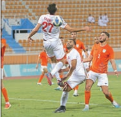
بونيكال: الدوري مقبل على جولات الحسم