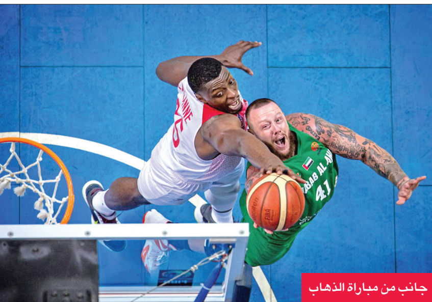
جانب من مباراة الذهب