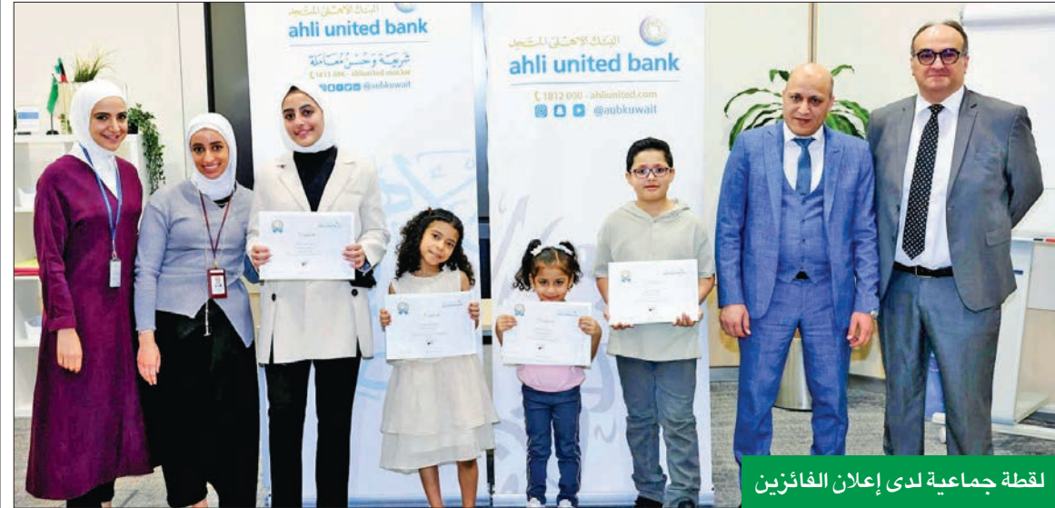
لقطة جماعية لدى إعلان الفائزين

حرص البنك على تشجيع أبناء موظفيه على حفظ وتلاوة القرآن الكريم، وفهم المعاني السامية التي يزر بها كتاب الله تعالى، ولا شك في أن أفضل الأوقات لحفظ القرآن وتلاوته هو شهر رمضان الكريم، فهو شهر القرآن الذي يملأ قلوب المؤمنين حبا وطمانينة بالطاعات والعبادات ويرتقي نفوسهم، وكذلك فإن تشجيع الأجيال الصاعدة على حفظ وتلاوة القرآن يباقن له أهمية كبرى في تنمية أجيال من المسلمين الصالحين الحافظين لكتاب الله والملمين بنعاليمه وأحكامه. وأضاف أمين: «قال رسول الله صلى الله عليه وسلم: خيركم من تعلم القرآن وعلمه. وعملا بهذا الحديث فإن التشجيع على تعلم القرآن الكريم وحفظه وتلاوته، ونشر القيم الدينية الصحيحة، يعد من أفضل الأنشطة التي يمكن إقامتها في شهر رمضان الفضيل الذي أنزل الله عز وجل فيه القرآن هدى للناس ورحمة».