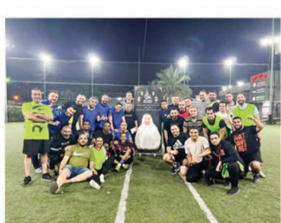
تتنافس، وكان اللاعبون يفرحون من زملائهم وأحبائهم.

وكانت المباراة النهائية للبطولة ذات أهمية خاصة، حيث كانت مخصصة لفهد الميلم، وكرس الفريق الفائز انتصاره لذكراه، واحتفل مجتمع المستشفى بإكماله بحياته وإرثه، وكان فهد شخصية محبوبة في مستشفى هادي، ومعروفًا بلطفه وحنانه وقيادته، ولقد أثر في حياة كل من عمل معه وكان مصدر إلهام للجميع.