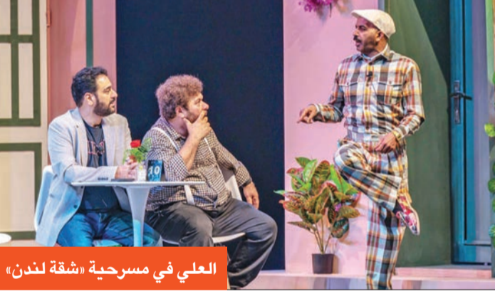
العلي في مسرحية «شقة لندن»

تستعد مدينة دبي للاحتفال بعيد الفطر السعيد خلال حملة «العيد في دبي»، التي تنظمها مؤسسة دبي للمهرجانات والتجربة، الذي يدفعها إلى طرح فكرة سفر الأسترلين إلى العاصمة البريطانية (لندن)، في رحلة تهدف إلى حل الخلافات، من خلال تهدئة أعصابهما، وإيجاد سبل لإحداث التالف بينهما. ولأن الأمور لم تسر كما جرى التخطيط لها، تتعدد الأحوال بحدوث جريمة بالشفقة التي يقيمون فيها، وتشكل الكثير من المواقف الكوميدية والدرامية التي تعطي المسرحية قدراً عالياً من الحماس والتشويق.