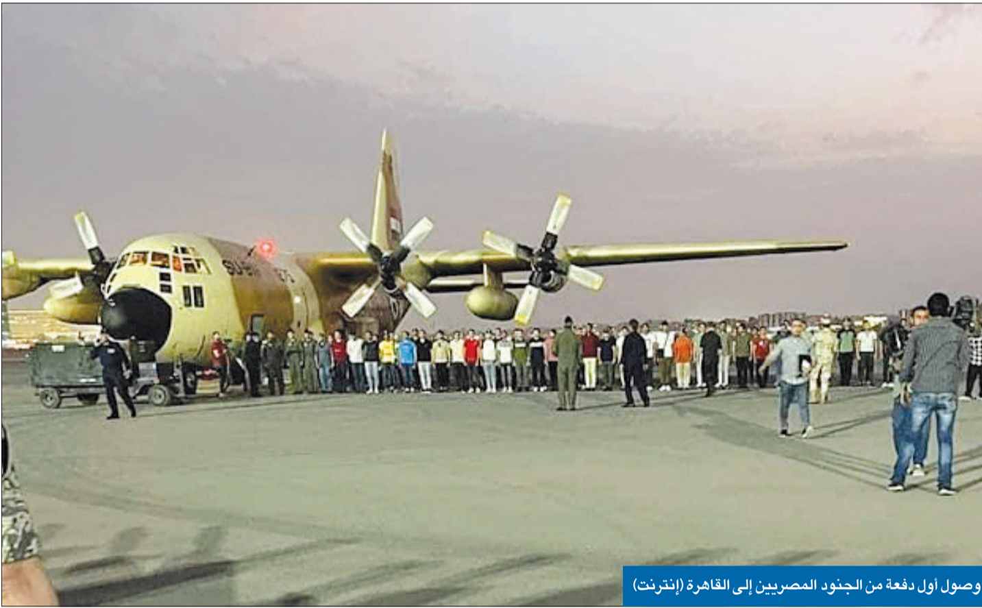
وصول أول دفعة من الجنود المصريين إلى القاهرة (إنترنت)

مخاوف من تمدد حرب البرهان وحيدتي إقليمياً... وواشنطن تلوح بالعقوبات