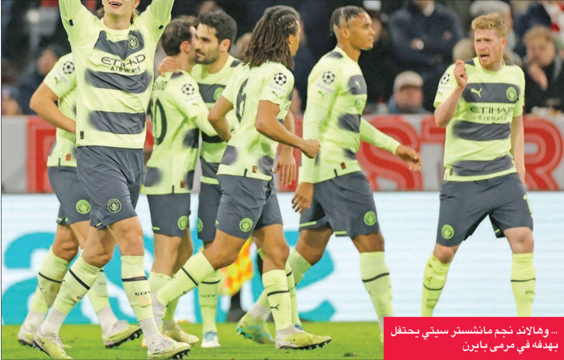
... وهالاند نجم مانشستر سيتي يحتفل بهدفه في مرعى بايرن