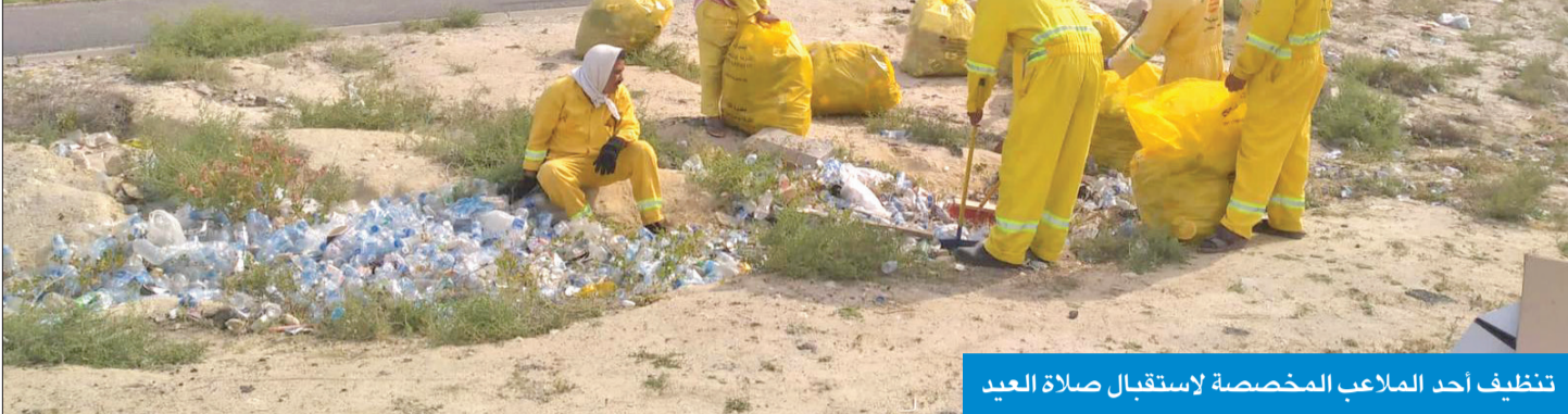
تنظيف أحد الملاعب المخصصة لاستقبال صلاة العيد

ساحة بجوار مسجد غشام البصمان، الدائري الخامس، التي سيجب توفير 300 عامل نظافة، مبيئة أن إدارة النظافة في محافظة مبارك الكبير اتّمت تجهيزاتها في تنظيف الأماكن المحيطة بالمساجد والساحات المخصصة لإقامة صلاة العيد، والتي سيتم توزيع 160 عامل نظافة لتأمين نظافتها.