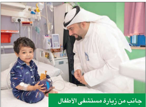
جانب من زيارة مستشفى الأطفال

وعلى غرار كل عام، شارك عشرات المتطوعين من موظفي بنك الكويت الوطني في برنامج شهر رمضان المبارك «افعل الخير في شهر الخير»، وذلك من خلال القيام بالزيارات والجولات الميدانية، وبأني ذلك انطلاقاً من حرص البنك على تنمية مفهوم التطوع لدى موظفيه، من خلال تعزيز ارتباطهم بالأعمال الإنسانية والنشاطات الاجتماعية التي ينظمها.