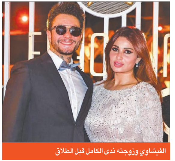
الفيشاوي وزوجته ندى الكامل قبل الطلاق

وفي بداية سبتمبر 2022، قررت محكمة الجيزة الابتدائية الحجز على أجر الفنان أحمد الفيشاوي، عن إحدى أفلامه "الرهبة" الجاري تصويره، آنذاك.