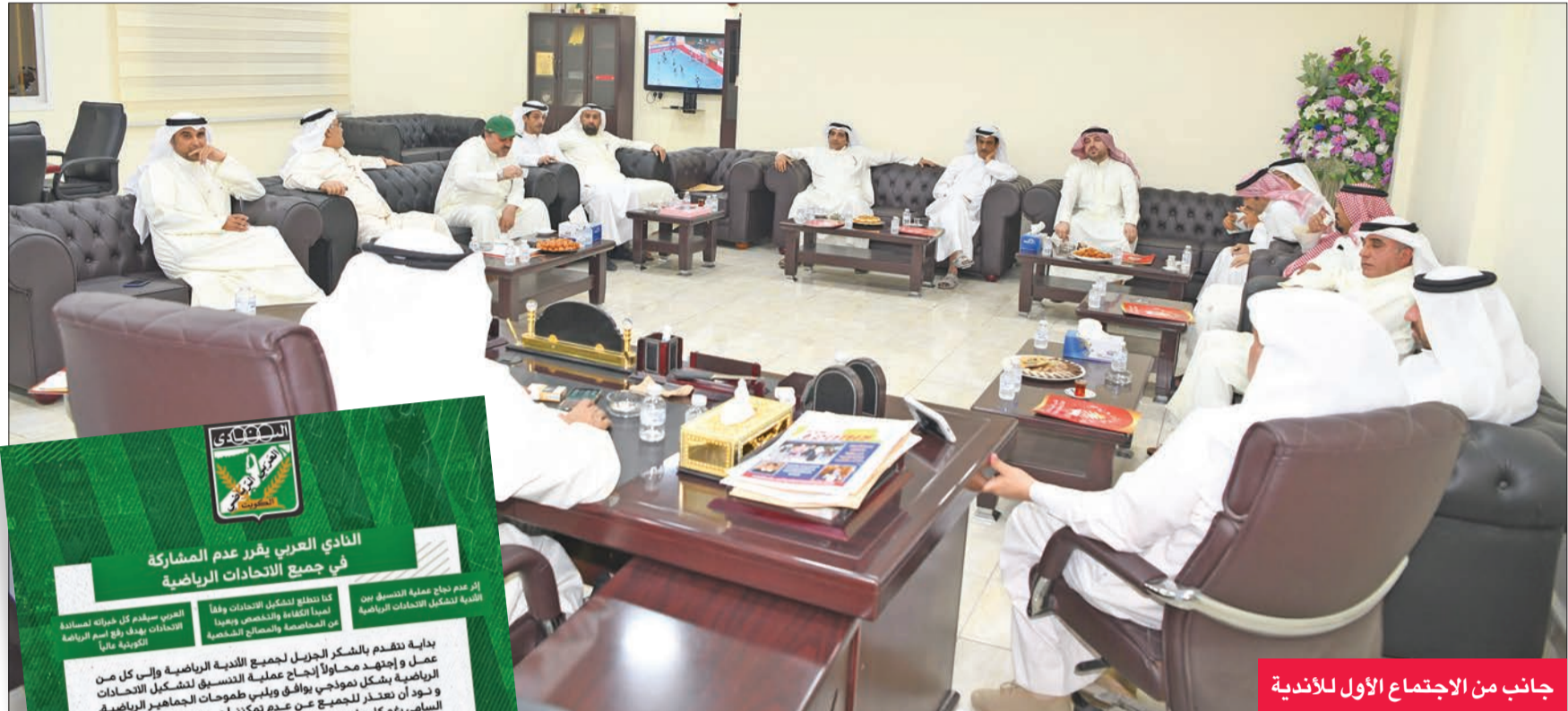
جانب من الاجتماع الأول للأندية

أكد عدم نجاحه في التنسيق بين الأندية واستمراره في الدعم