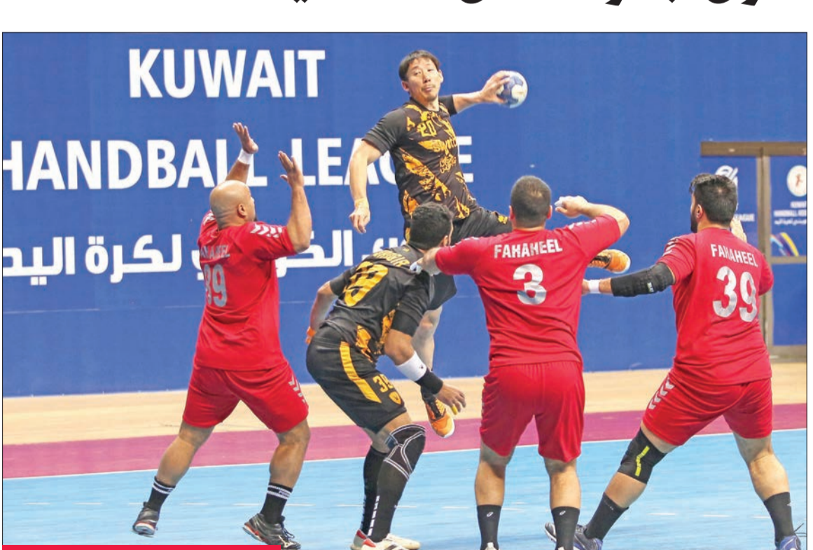
جانب من مباراة القادسية والفحيحيل

إلى ربع نهائي البطولة، فيما ودّع خيطان (الثالث بنقطتين)، والساحل (الرابع من دون رصيد)، منافسات البطولة. وسيلقي القادسية مع الصليبيخات في 3 مايو المقبل، فيما يلعب الفحيحيل مع الكويت في ربع نهائي البطولة.