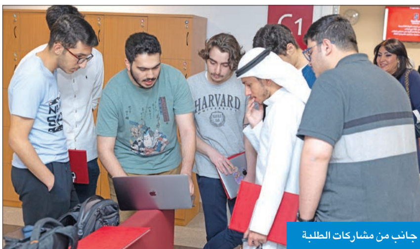
جانب من مشاركات الطلبة

الاستفادة من جميع المحاضرين، كما توجّه بالشكر إلى الفائزين على البرامج التعليمية الجامعية في مؤسسة الكويت للتقدم العلمي لإيمانهم الدائم بمقترحات الجامعة، والعمل معها يدا بيد لخدمة أبناء الوطن. بدورها، أكدت د. الموسى أن هذه المسابقة مأسسة المميز تبتّع مدى حرص كل من مؤسسة الكويت للتقدم العلمي وكلية الكويت للعلوم والتكنولوجيا على دفع عجلة التنمية من خلال الأفكار المتطورة وتحفيز الطاقات الشبابية للإبداع.