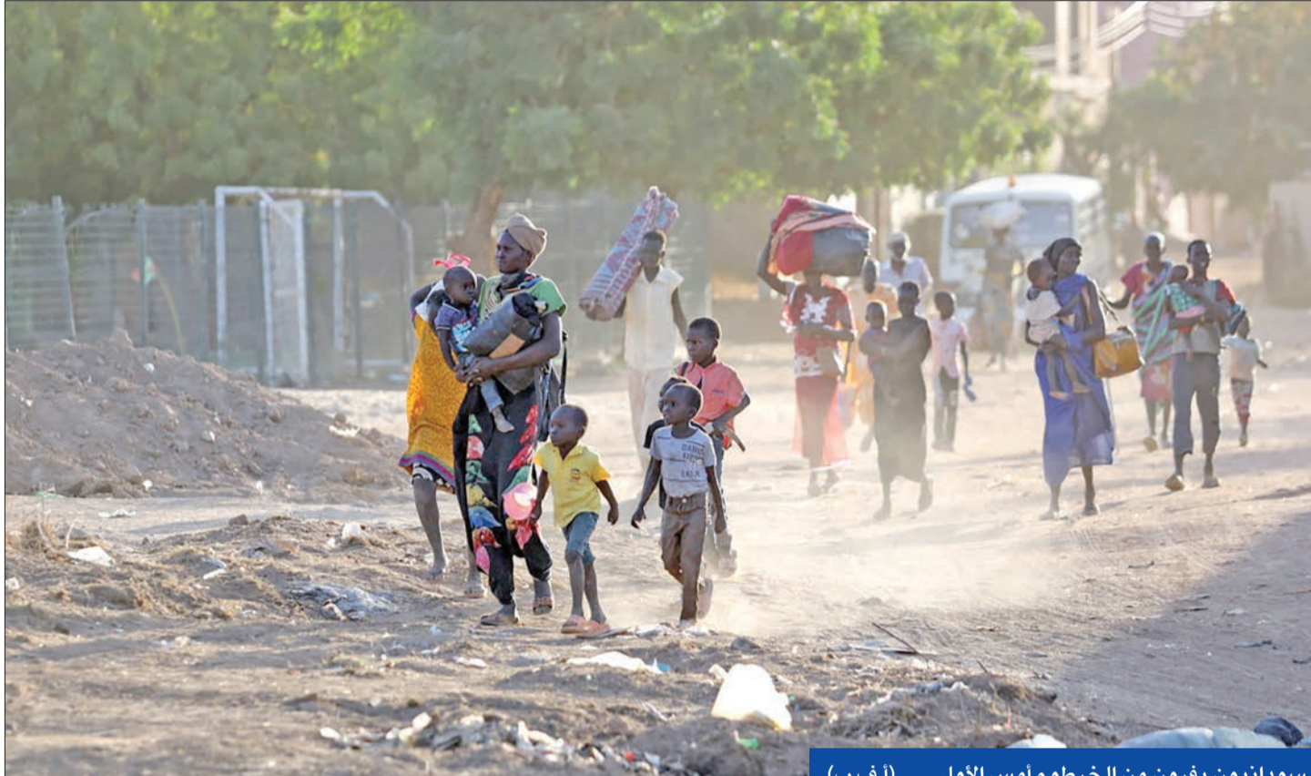
سودانيون يفرّون من الخرطوم أمس الأول

هدنة من قاندي الجيش وقوات الدعم السريع في نزاغهما على السلطة.