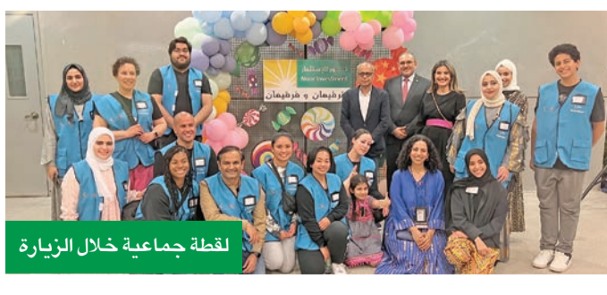
لقطة جماعية خلال الزيارة

التراثية لإدخال السرور والسعادة في قلوبهم، مما يساهم في رفع معنوياتهم خلال رحلة علاجهم، وأكدت أن حرص الشركة على إقامة حفل القرقيعان تابع من اعتزازها بالعادات والتقاليد الكويتية، ورغبةً في إحياء الموروث الشعبي مع فئات المجتمع المختلفة.