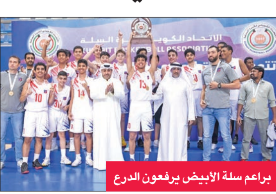
براعم سلة الأبيض يرفعون الدرع

تكريماً لاعب نادي النصر فريق الفريج بجافزتي هدف الدوري وهداف الريمايات الحرة، إضافة إلى لاعب نادي القرن