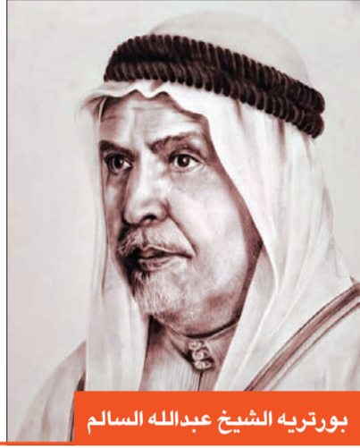
بورتريه الشيخ عبدالله السالم