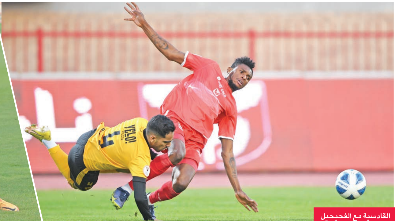
القادسية مع الفحيحيل