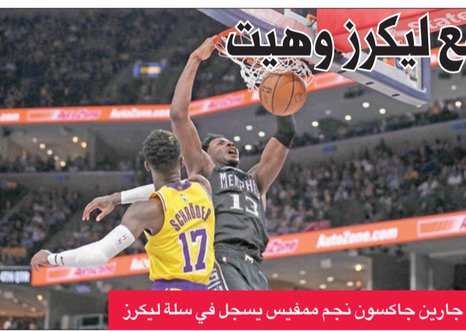
جارين جاكسون نجم ممفيس يسجل في سلة ليكرز

ووعدت إدارة الأهلي، برئاسة محمود الخطيب، بمنح اللاعبين مكافآت مالية مضاعفة في حالة تحظى الرجاء، وستنمّ زيادة تلك المكافآت أيضاً في حالة الصعود للدور نصف النهائي.