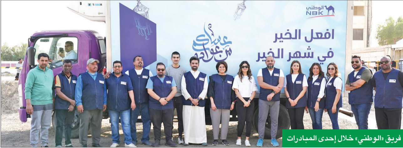
فريق «الوطني» خلال إحدى المبادرات

المطر: «افعل الخير في شهر الخير» حقق علامة فارقة هذا العام تجسدت بأهدافه التنموية