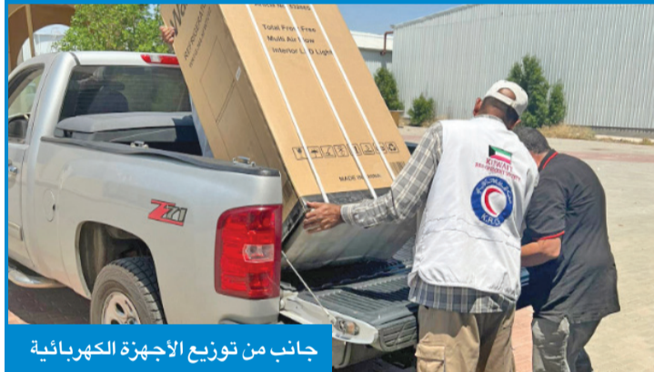
جانب من توزيع الأجهزة الكهربائية

معاني التراحم والتكاتف في المجتمع الكويتي، ويحظى بأهمية كبيرة من إدارة الجمعية باعتباره إحدى ثمرات التعاون مع شركائها في مجال العمل الخيري والإنساني. وأشاد العون بالجمعيات والمؤسسات الفاعلة في مجال العمل الإنساني، معرباً عن شكره لهم ولجميع المحسنين في الكويت من مواطنين ومقيمين على مساهماتهم في إنجاح برنامج المساعدات المحلية.