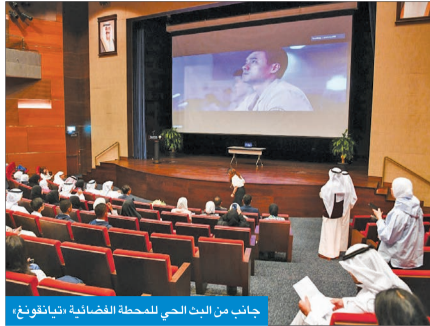
جانب من البث الحي للمحطة الفضائية «تيانقونغ»