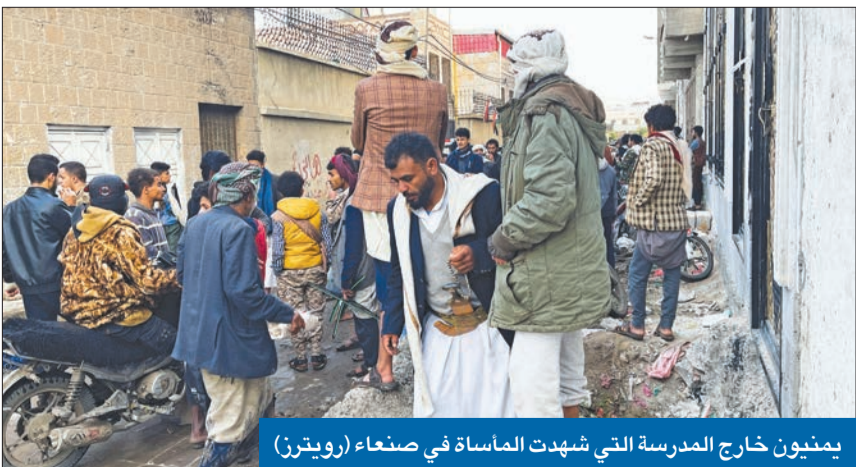
يمنيون خارج المدرسة التي شهدت الماساة في صنعاء

اتهامات للحوثيين بإطلاق النار لتفريق المحتشدين