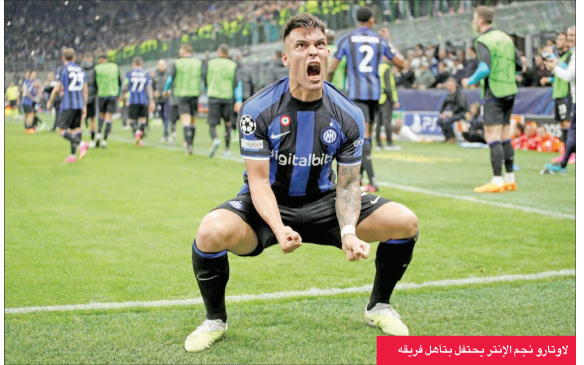
لاوتارو نجم الإنتر يحتفل بتأهله لفرقة

3-3 في الرمي الأخير. وكان إنتر عاد بفوز ثمين من أرض بنفيكا الأسبوع الماضي في لشبونة. وسجل نيكولو باربيرا (14) والارجنتيني لاوتارو مارتينيز (66) ومواطنه يواكيم كوربا (78) أهداف إنتر، وفريدريك اورسينيس (38) وانتونيو سيلفا (86) والكرواتي بينار موسى (5+90) أهداف بنفيكا. ويلتقي إنتر مع جاره في المدينة الواحدة ميلان في الدور نصف النهائي بعد أن تخطف الأخير مواطنه نابولي متصدراً الدوري المحلي بالفوز عليه 1-1 أصفر نهباً ثم تعادله معه 1-1 إياباً. خاص الفريقان المباراة على وقع خسارة في الدوري المحلي، حيث سقط إنتر أمام مونتسا صفرًا، وبنفيكا أمام تشافيس بالنتيجة ذاتها.