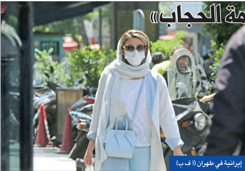
إيرانية في طهران

وامتلات الشوارع بنساء يتعدن تحدي الشرطة لاقتالهن وفي المقابل اكتفت الشرطة بإرسال رسائل نصية عبر الهواتف النقالة لعامة الناس وأصحاب السيارات مهددة إياهم بأنها سوف تقوم بحجز السيارات التي تنقل سيدات غير محجبات أو تقودها غير محجبات. وقامت الشرطة بإقالة ما يزيد على 2800 محل وحتى مجموعات تجارية وسياحية ومقاه ومطاعم بسبب