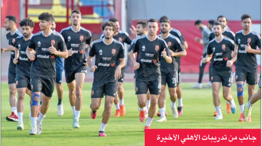
جانب من تدريبات الأهلي الأخيرة