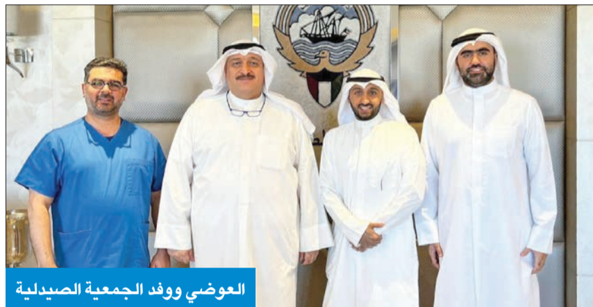
العوضي ووفد الجمعية الصيدلية

الخطوات التي قامت بها الوزارة في هذا الشأن، وتمن وزير العوضي الذي يقوم به الصيادلة، كونهم مكوناً رئيسياً في الجسد الطبي، مشيداً بدورهم الأساسي في تطوير المنظومة الصحية. ومن جانبه، ثمن مجلس إدارة الجمعية الدور الإيجابي لوزير الصحة في دعم سبل الارتقاء بالمهنة، وتمكين الصيدلي الكويتي، والتعاون البناء في شأن مسودة مشروع قانون تنظيم المهنة الجديد.