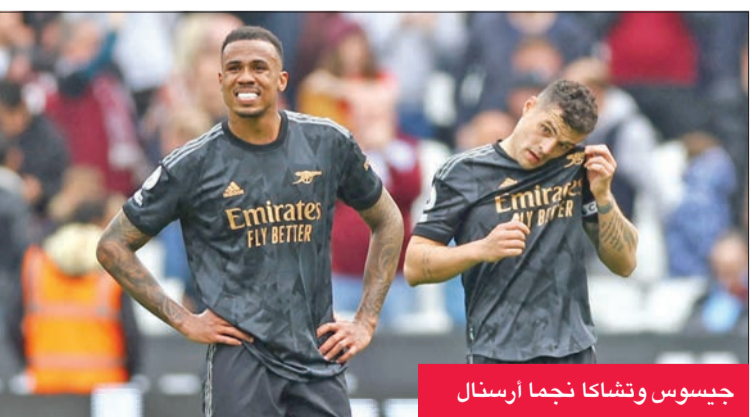
جيسوس وتشاكا نجما أرسنال

الرجوع من الإزمنة التي يمر بها الأخير. ليبرول يواجه توتنهام