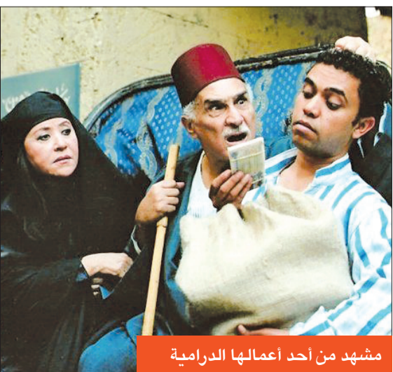
مشهد من أحد أعمالها الدرامية