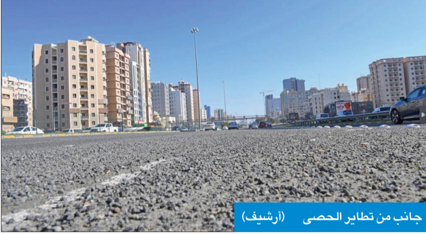
جانب من تطهير الحصى (أرشيف)

الطرق، وضبط الجودة، وقسم تاهيل المقاولين «إدارة الوثائق والعقود، قطاع الرقابة والتدقيق، وآخر من نفس الإدارة» عضواً ومقرراً.