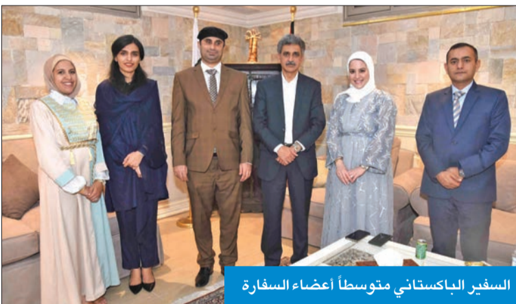
السفير الباكستاني متوسلاً أعضاء السفارة

كشف سفير باكستان لدى البلاد، مالك فاروق، أن العمل جارٍ على استقدام الدفعة الـ 20 من الأطباء والمرضين الكويتيين للعمل في القطاع الحكومي قبل بداية الصيف للعمل في المستشفيات الحكومية، لافتاً إلى وجود مستشفيات خاصة قريباً، موضحاً أن الكادر الطبي والتشريحي الباكستاني أثبت وجوده في أصعب الظروف، وكان لهم دور كبير وفعال أثناء جائحة كورونا. وفي تصريحات على هامش عشاء تكريمي أقامه في منزله لعدد من ممثلي وسائل الإعلام، بحضور جميع أعضاء السفارة، أوضح فاروق أن البلدين «قطعاً شوطاً كبيراً في تطوير علاقاتهما الثنائية، ونتطلع باكستان إلى تعزيز العلاقات مع الكويت في جميع المجالات ذات الاهتمام المشترك، وخصوصاً الصحة والعمالة وتكنولوجيا المعلومات والأغذية والأمن». وقال إن «العلاقات الكويتية - الباكستانية تاريخية ومستقرة ومتنامية»، مشيراً إلى دور بلاده الذي وصفه بـ «البارز» في تحرير الكويت بعد انضمامها إلى التحالف الدولي