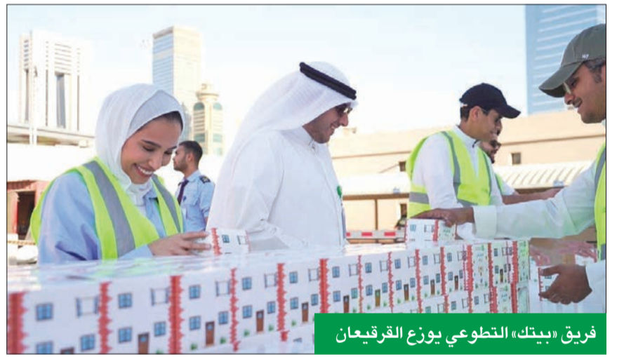
فريق «بيتك» التطوعي يوزع القرقيعان

ويتركز برنامج «تواصل بالخير في شهر الخير» على المبادرات المجتمعية المختلفة، ويضم فعاليات قرقيعان، وحملة إفطار الصائم، ومسابقة