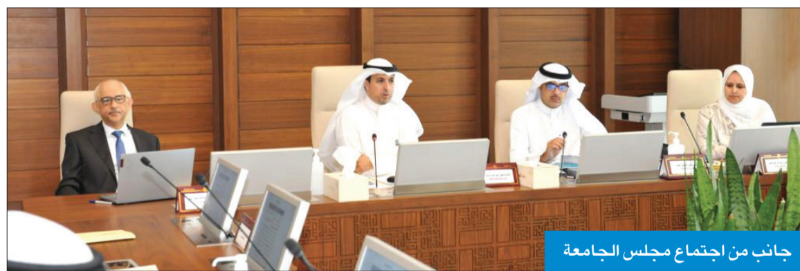
جانب من اجتماع مجلس الجامعة

الحقوق للعامين الجامعيين (2023/2024، 2024/2025)، والفصل الصيفي (2022/2023)، مضيفاً، كما وافق المجلس على مقترح زيادة عدد المقررات المطروحة للفصل الدراسي الصيفي بنسبة 20 بالمئة. ولغث إلى موافقة المجلس على الميزانية العمومية والحساب الختامي لمجلس النشر العلمي والمجلات