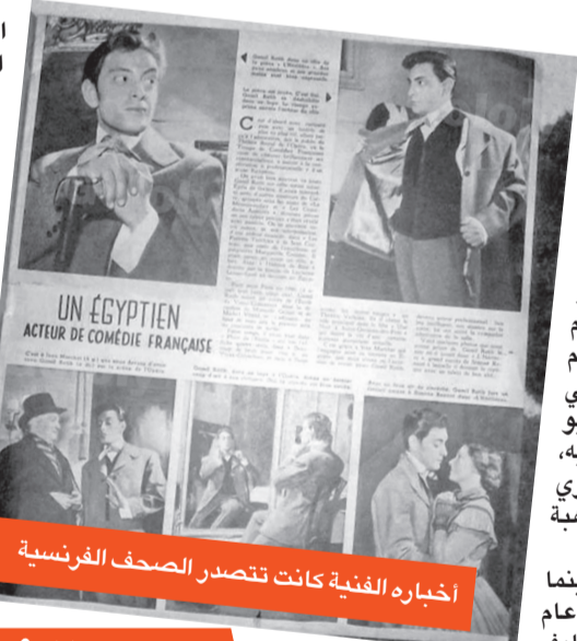
إخباره الفنية كانت تصدر الصحف الفرنسية