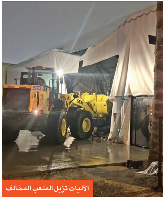
الآليات تزيل الملعب المخالف