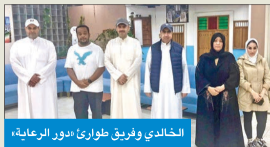
الخالدي وفريق طوارئ «دور الرعاية»

سريعاً وقت الحاجة، مضيفاً أنه كان «ثمة تنسيق متواصل بين الوزارة والجهات الحكومية الأخرى ذات العلاقة للتدخل العاجل، حال حدوث طارئ».