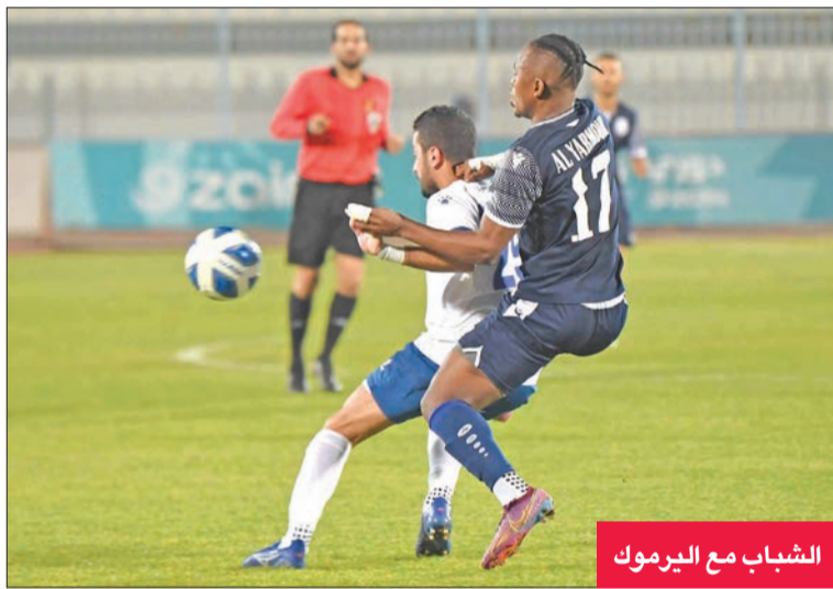
الشباب مع اليرموك

المشروع في التأهل للدوري الممتاز، مضيفاً أن كرة القدم لا تعرف المستحيل. وشدد على أنه لا بد من الفوز اليوم على برقان، لافتاً إلى أن اللاعبين عقدوا العزم على تحقيق النتيجة المأمولة.