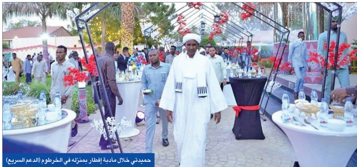
حميدتي خلال مائدة إفطار بمنزله في الخرطوم (الدعم السريع)

وفي مسهل الاجتماع الطارئ للقوى السياسية، حذر رئيس حزب الأمة القومي اللواء متقاعد فضل الله برمة ناصر من أن الوضع بين الطرفين بات خطيراً جداً، داعياً قادة الجيش والدعم السريع والأحزاب السياسية للاجتماع عاجل. واعتبر أن بيانات الاحتقان بين الجيش والدعم السريع وصلت «مرحلة ما قبل الطلقة الأولى»، ونهه إلى أن الوضع الأمني الراهن قريب من الانزلاق ولا يتحمل إجراءات روتينية. كذلك اعتبر أن الأوضاع تتطلب تجميد كل فعل أو قول عسكري، ودعا كل القوى السياسية إلى النأي عن إصدار أية بيانات أو دعم لطرف على حساب آخر.