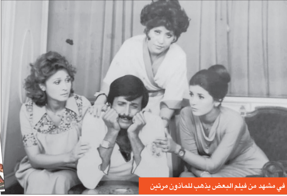
في مشهد من فيلم البعض يذهب للمأذون مرتين