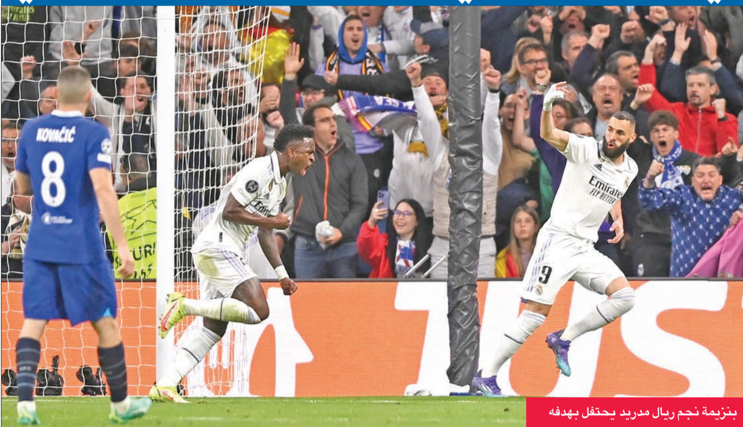
بنزيمة نجم ريال مدريد يحتفل بهدفه

أقرب ريال مدريد من بلوغ نصف نهائي دوري أبطال أوروبا، بعد تغلبه على تشلسي بهدفين دون مقابل، أمس الأول في ذهاب الدور ربع النهائي.