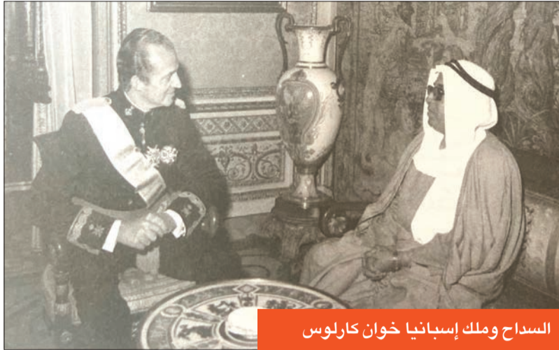
السداح وملك إسبانيا خوان كارلوس

والتحق والدي بالمدرسة المباركية في بداية افتتاحها، ودرس وتعلّم القراءة والكتابة وحفظ القرآن الكريم والخط من المعلمين الأطفال، وكان يحفظ الكثير من الشعر العربي والشعر العامي والأحداث النبوية، ومع مرور الأعوام والإيام، تغير وضعه الاقتصادي وخسر تجارته، فذهب للغوص مع سالم بوقمان، وعمل سبياً بالغوص مع المرحوم عبدالعزيز بوحميد الذي كان غواصاً، وذلك لمدة 27 عاماً، وبعد ذلك افتتح محلاً لمهنة بسيطة (خراز) بسوق الخرازين، موقعه حالياً موقف سيارات المباركية، وبعد هدمه تم تعويضه».