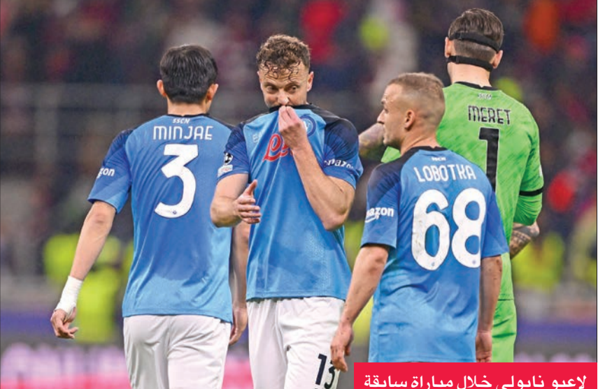
لاعبو نابولي خلال مباراة سابقة

ويغرد الفريق الجنوبي خارج السرب في الصدارة، حيث يتقدم بفارق 16 نقطة عن وليفه. وإذا قدر لنابولي التتويج بلقب كما هو متوقع فسيصبح ثاني فريق من خارج الثلاث الشمالي الكبير (يوفنتوس وإنتر ميلان) يفوز باللقب منذ روما عام 2001. لكن مستوى نابولي تراجع في الآونة الأخيرة، حيث متي بخسارة قاسية في عقده أمام ميلان برعاية نظيفة قبل أن يحقق فوزاً في الجولة الصعبة على ليشي 2-1 في الجولة السابقة، أما لاتسيو الثاني بقيادة مدربه المحنك ماوريسيو ساري، فحقق نتائج جيدة في الآونة الأخيرة، بفوزه في مبارياته الثلاث الأخيرة، بينها انتصاران على جاره روما وعلى يوفنتوس. ويخوض لاتسيو مباراة سهلة خارج ملعبه الجمعة أمام سبيستيا صاحب المركز السابع عشر، ويتقدم لاتسيو بفارق مريح