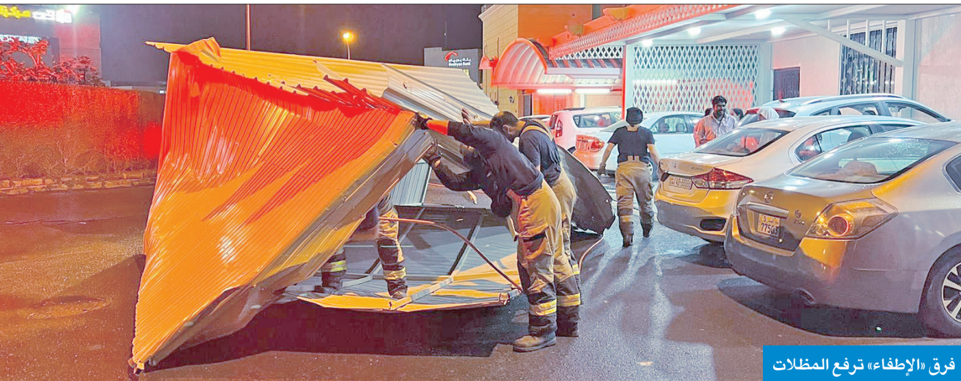
فرق «الإطفاء» ترفع المظلات

أعلنت قوة الإطفاء العام أنها استنفرت الإيام الماضية فرقتها تحسباً للأمطار بهدف القيام بدورها في حماية الأرواح، والمحافظة على الممتلكات، وبت الرسائل التوعوية جنباً إلى جنب بشكل متكامل مع بقية جهات الدولة. وذكر إدارة العلاقات العامة والإعلام بـ «الإطفاء»، أنه ورد عدة بلاغات إلى إدارة العمليات المركزية فجر أمس يفيد بوقوع حوادث سقوط أشجار ومظلات وخيام في مناطق مختلفة من البلاد. وأوضحته الإدارة أن إدارة العمليات المركزية وجهت مراكز الإطفاء إلى مواقع البلاغات، إذ تم التعامل معها جميعاً دون وقوع أي إصابات تذكر.