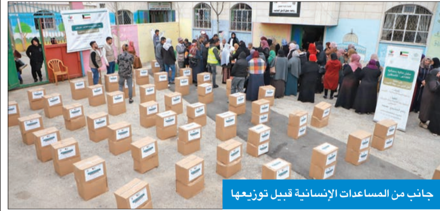
جانب من المساعدات الإنسانية قبيل توزيعها

تكثف الجمعيات الخيرية الكويتية تنفيذ مشاريعها الإنسانية في فلسطين خلال شهر رمضان المبارك، وبرزها توزيع الطرود الغذائية وإفطار الصائمين، لا سيما في المسجد الأقصى المبارك.