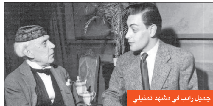
جميل راتب في مشهد تمثيلي

وبدأ جميل راتب مرحلة الانتشار في عام 1976،