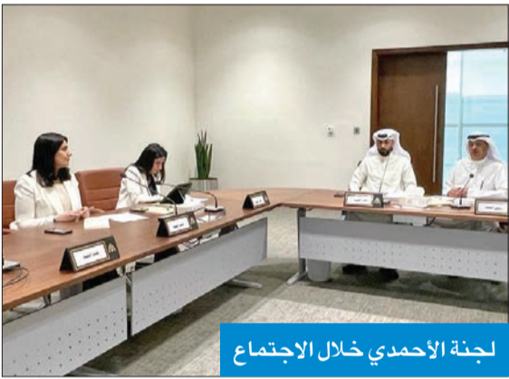
لجنة الأحمدى خلال الاجتماع