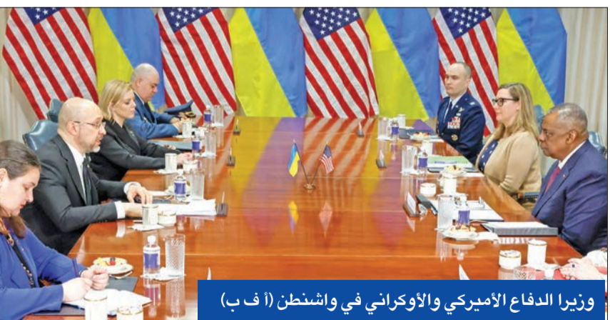
وزير الدفاع الأمريكي والأوكراني في واشنطن

ويبقى الأهم هو التطور السعودي- السوري ما بعد الملف اليمني، وهنا من غير المعلوم حتى الآن إذا ما كانت سورية مقابل اليمن وليس لبنان، على أن يبقى البلد الصغير موقلاً إلى تفاهم سعودي- إيراني مباشر، أم إذا كان هناك محاولة لدخول العنصر السوري كمؤثر.