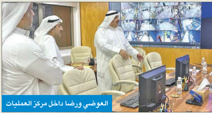
العوضي ورضا داخل مركز العمليات

وقالت وزارة الصحة، في بيان صحافي، إن الوزير استمع إلى شرح مفصل فيما يخص التدابير المتخذة من جانب قطاعات الوزارة، وسير العمل في أقسام الحوادث، وأوجه التنسيق مع فرق الطوارئ الطبية، وخطة انتشارها، ومستوى الجاهزية، والتكامل والتنسيق بين قطاعات الوزارة ومختلف الجهات المعنية في الدولة، من خلال قاعدة البيانات التي يضمنها المركز للتعامل مع أي طارئ بطريقة منهجية،