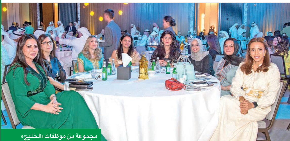
مجموعة من موظفات «الخليج»