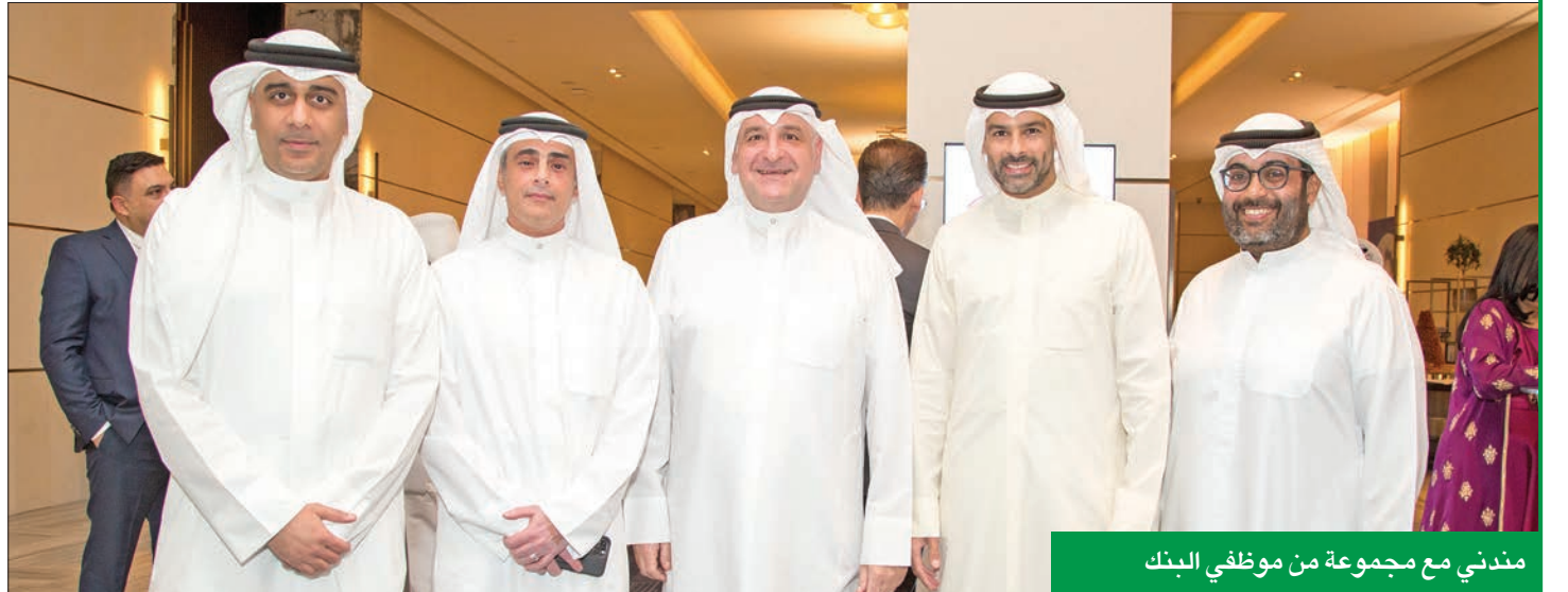
مندي مع مجموعة من موظفي البنك