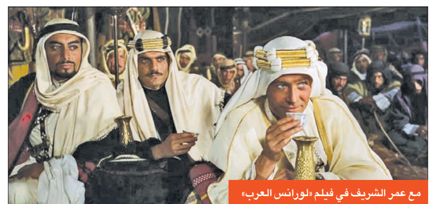
مع عمر الشريف في فيلم «الورانس العرب»