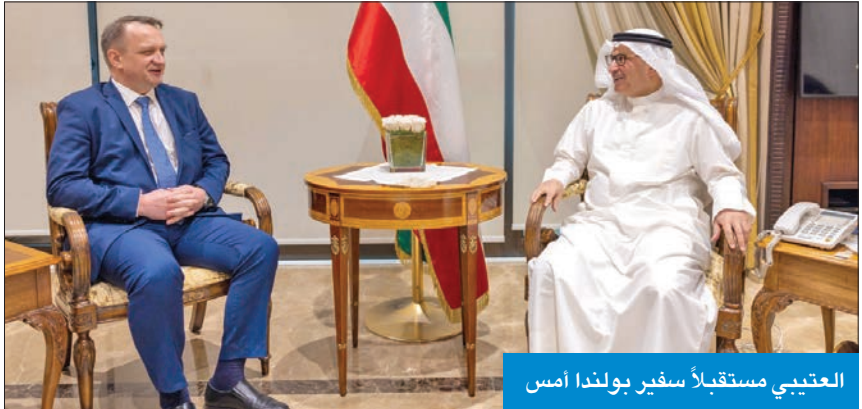
العتيبي يستقبل سفير بولندا أمس

استقبل نائب وزير الخارجية السفير منصور العتيبي، أمس، في ديوان عام الوزارة، سفير بولندا لدى الكويت بافيو ليهوفيش بمناسبة انتهاء فترة عمله سفيراً لبلاده لدى دولة الكويت.