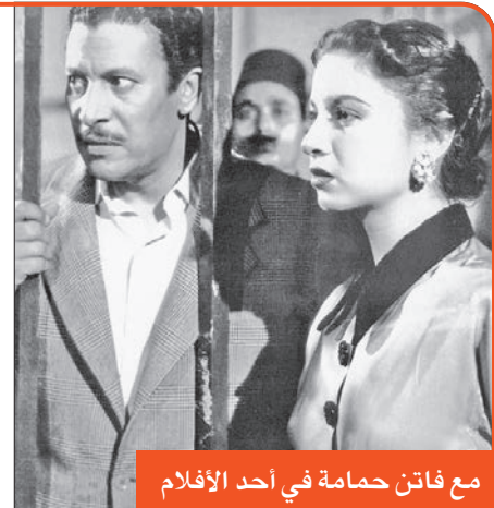
مع فاتن حمامة في أحد الأفلام

وأوشك الشاب أن يفقد الأمل في الوقوف أمام الكاميرا، لاسيما أن عمره تجاوز الخامسة والثلاثين، ولعبت المصادفة دورها مرة أخرى، وكان المخرج كامل الخلساني يجّهز لفيلم «السوق السوداء»، ويبحث عن شاب يتمتع بملامح مصرية، ووجد هذه المواصفات في عماد حمدي، فأسند إليه دور البطولة