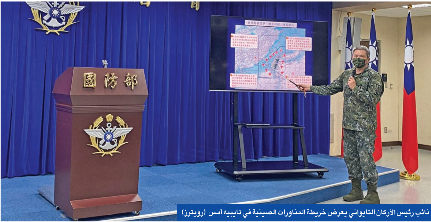
نائب رئيس الأركان التايواني يعرض خريطة المناورات الصينية في تايبيه أمس

بكين تستعرض عضلاتها وتفرض حظراً جويّاً شمال تايوان... وواشنطن لا تستبعد غزواً في 2027