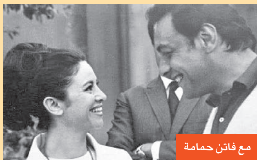
مع فاتن حمامة