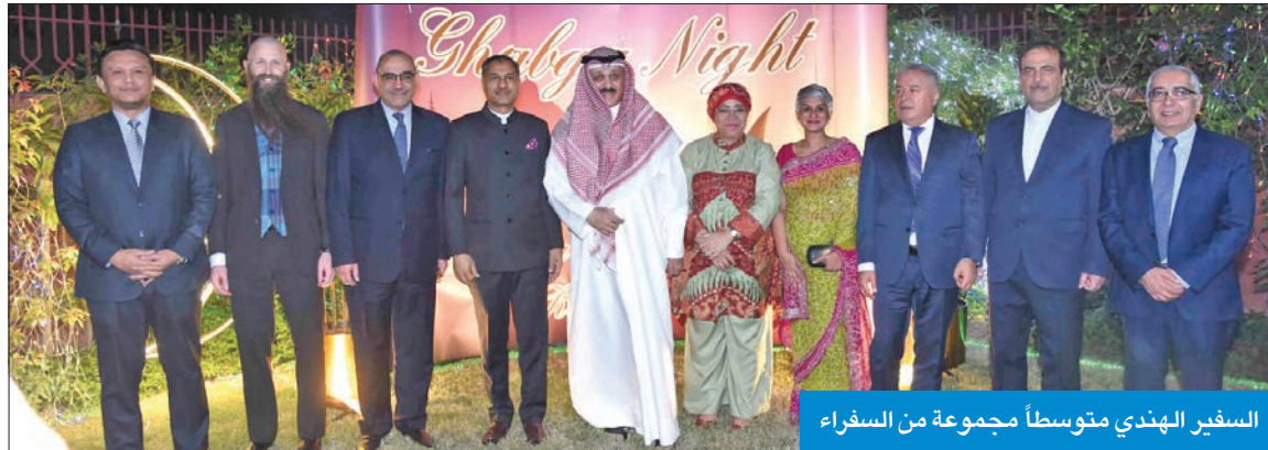
السفير الهندي متوسطاً مجموعة من السفراء