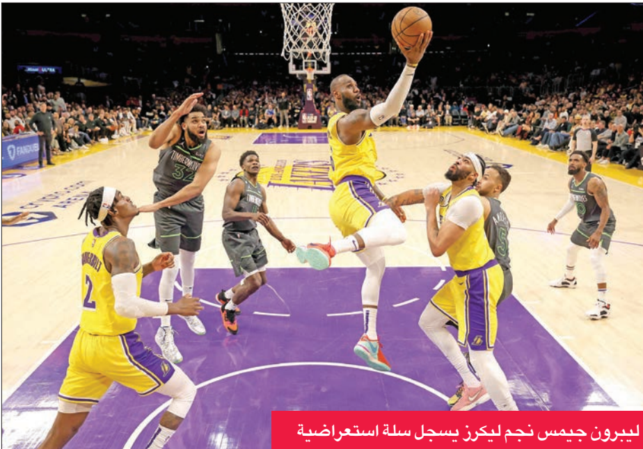
ليبرون جيمس نجم ليكرز يسجل سلة استعراضية

سجّل «الملك» ليبرون جيمس 30 نقطة وقاد لوس أنجلوس ليكرز لقلب تأخره أمام ضيفه مينيسوتا تمبرولوفز إلى فوز 108-102 بعد التمديد الثلاثاء، حجز له بطاقة التاهل نحو الأدوار الإقصائية بدوري كرة السلة الأميركي للمحترفين «إن بي إيه». وحسم ليكرز المركز السابع بالمنطقة الغربية، ليضرب موعداً مع ممفيس غريزلز ثاني المنطقة تسديدة ثلاثية بائسة. زرع ثلاث رميات حرة تحت ضغط رهيب فأرضاً تمديد الوقت (98-98). لكن ليكرز استجمع قواه في الشوط الإضافي الذي حسمه 4-10 مع ثلاثية ليلاباني روي هاتشيمورا وسلة لشوردر، لينتهي اللقاء بفوز ليكرز 103-98.