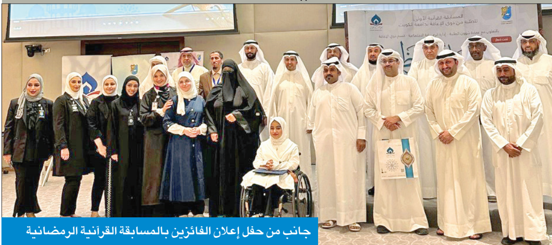
جانب من حفل إعلان الفائزين بالمسابقة القرآنية الرمضانية

وخصصت الفئة الثانية للطلبة ذوي الإعاقة الحركية والجسدية، وفازت بها طالبة وطالب في المستوى المتقدم، فيما حصل طالبان و4 طالبات على جائزة المستوى المبتدئ. وفي فئة الإعاقة السمعية، فاز 3 طلبة (طالبتان وطالب) في المستوى المتقدم، وطالب في المستوى المبتدئ. وأكد مدير جامعة الكويت بالإتابة د. فهد الديبس، في كلمة خلال الحفل الذي أقيم