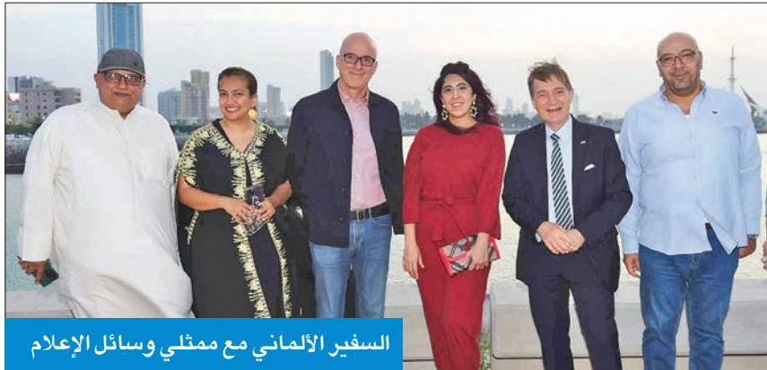
السفير الألماني مع ممثلي وسائل الإعلام

أعرب السفير الألماني في الكويت، هانز رينيتس، عن استعداد بلاده للمشاركة في خطط الحكومة الكويتية من أجل تنويع اقتصاد البلاد لمواجهة تحديات القرن الحادي والعشرين. وفي تصريحات صحافية على هامش عشاء تكريمي أقامه على شرف عدد من ممثلي وسائل الإعلام العربية والأجنبية، أكد رينيتس أن «الكويت وألمانيا تجمعهما علاقات دبلوماسية طويلة وممتازة»، مؤكداً «أننا سنحتفل معاً العام المقبل بالذكرى الـ 60 على بدء العلاقات الدبلوماسية بين البلدين»، مشدداً على حرص بلاده على «دعم وتعميق العلاقات الاقتصادية والتجارية، كذلك