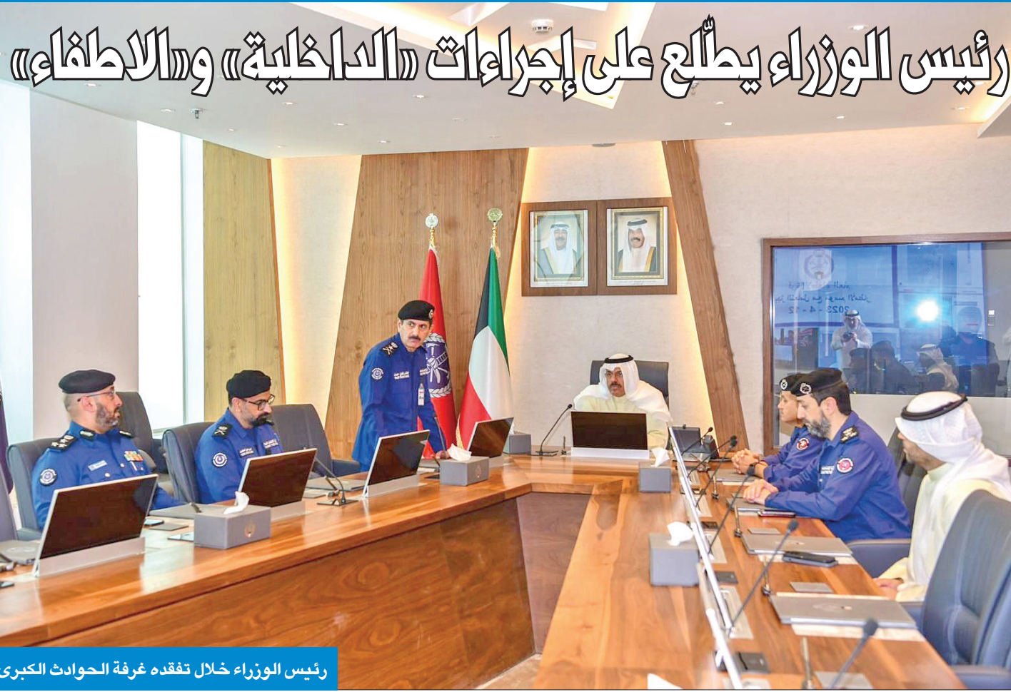
رئيس الوزراء خلال تفقده غرفة الحوادث الكبرى

«الأشغال»: إغلاق الأنفاق في حال ارتفاع المد البحري وتجمع المياه بها