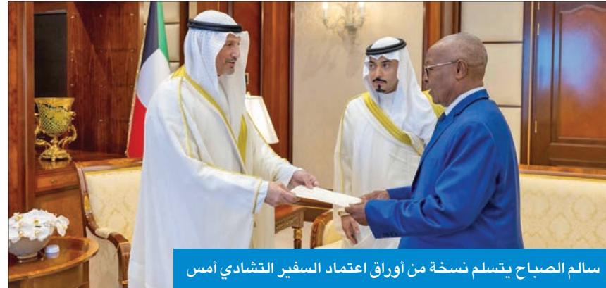
سالم الصباح يتسلم نسخة من أوراق اعتماد السفير التشادي أمس

تسلم وزير الخارجية الشيخ سالم الصباح نسخة من أوراق اعتماد سفير تشاد لدى الكويت طاهر النظيف خاطر، خلال اللقاء الذي تم أمس، في ديوان عام الوزارة. وتمنى وزير الخارجية للسفير الجديد التوفيق في مهام عمله، وللعلاقات الثنائية الوثيقة التي تجمع البلدين الصديقين المزيد من التقدم والازدهار، كما تناول اللقاء المستجدات على الساحة في تشاد.