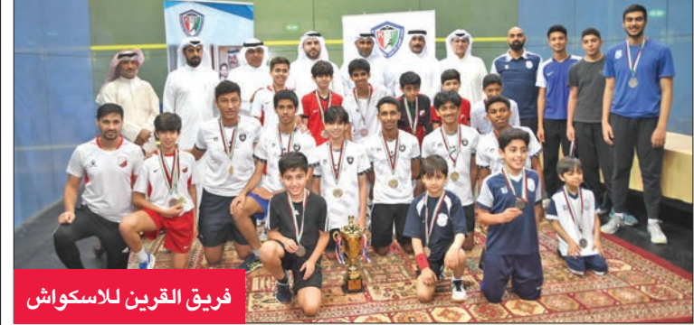
فريق القرنين لاسكواش

وفي نقاط كأس التفوق العام توج القرنين بطلاً، بالحصول على رقم قياسي بلغ 47 نقطة، وجاء خيطان ثانياً بـ 31 نقطة، في حين تساوى اليرموك والكويت في المركز الثالث بـ 15 نقطة. وعقب اللقاء الختامي، الذي أقيم على الملعب الزجاجي بمركز الشيخ سالم الصباح الدولي في جنوب السرعة، قام رئيس الاتحاد وليد الصمعي ونائب