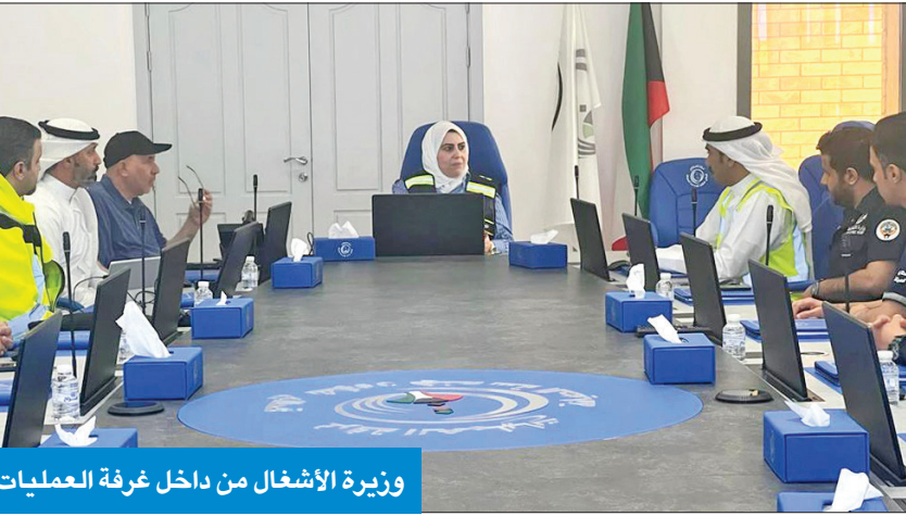
وزيرة الأشغال من داخل غرفة العمليات

اتباع الإرشادات الوقائية خلال الأمطار بعدم الخروج من المنزل إلا للضرورة والتأكد من سلامة التمديدات الكهربائية الخارجية