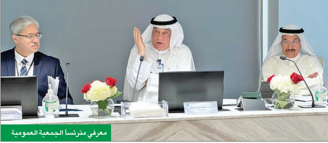
معرفي مترئسا للجمعية العمومية

«عمومية» الشركة تصادق على توزيع أرباح نقدية 3% وأسهم منحة 3%