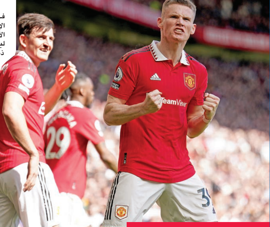
لاعبو مانشستر يونايتد خلال مباراة سابقة

يحل إشبيلية ضيفاً على يونايتد بقيادة خوسيه لويس منديليجان، ثالث مدرب له هذا الموسم، وهو في أسوأ حالاته خصوصاً محلياً، إذ يعاني من أجل البقاء في الدرجة الأولى باحتلاله المركز الثالث عشر بفارق خمس نقاط عن آخر