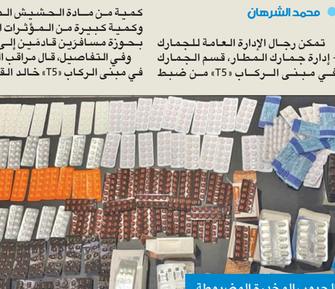
الحبوب المخدرة المضبوطة