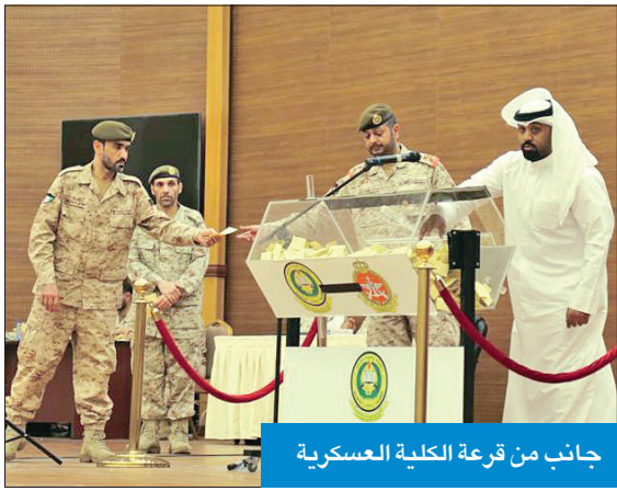
جانب من قرعة الكلية العسكرية

وكانت كلية علي الصباح العسكرية أعلنت مساء أمس الأول قبول 300 طالب ضابط، و100 طالب ضابط احتياط من أصل 3155 متقدماً للقرعة من جميع التخصصات من حملة الشهادات