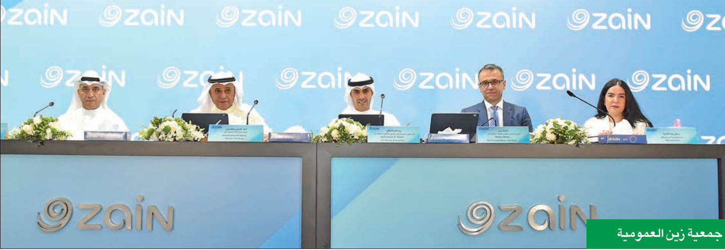
جمعية زين العمومية