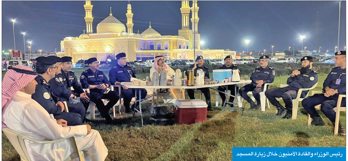
رئيس الوزراء والقادة الأمنيون خلال زيارة المسجد

قام رئيس مجلس الوزراء سمو الشيخ أحمد نواف الأحمد، ليل أمس الأول، بزيارة إلى مسجد بلال بن رباح في منطقة الصديق، اطلع سموه خلالها على سير عملية التأمين والنقاط الأمنية والإجراءات المتبعة من رجال وزارة الداخلية، بُغية