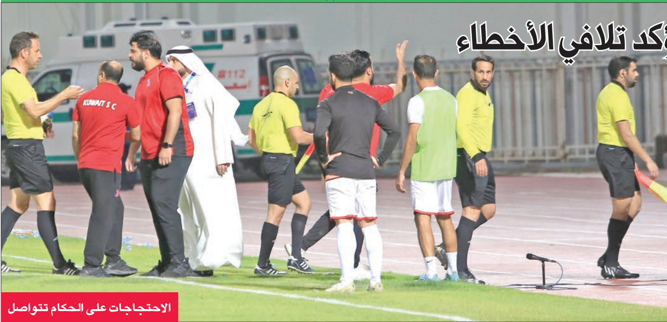
الاحتجاجات على الحكام تواصل