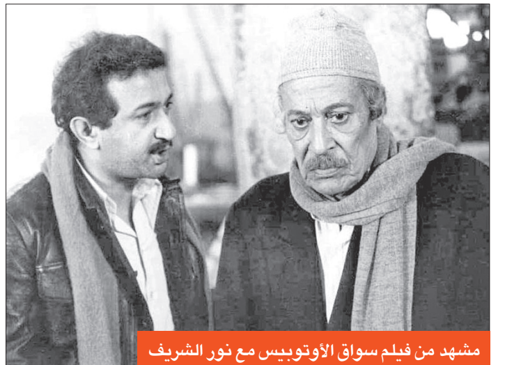
مشهد من فيلم سواق الأتوبيس مع نور الشريف

استمرت العلاقة الرومانسية بين الفنان عماد حمدي وزوجته الفنانة شادية فترة قصيرة، لكنها أثارت رسائل حب متبادلة بينهما، وتكثبت له «دلوعة الشاشية» في جواب غرامي: «يا عماد، إن قلبي اختارك من بين عشرات ممن طرّقوا بابي، وحاولوا أن يقتحموه، أما حيثيات الاختيار، فهي سر من أسرار عمري، لن أبوح به لوأحد، حتى لا تخطفك مني، ولن أبوح به لوأحد، حتى لا يقول: (مجنونة!)» وجاء رد النجم الرومانسي في إحدى الرسائل: «اخترت أن أقول (زوجتي شادية) فقط، لأنني لا أريد أن أقول زوجتي العزيزة، بكلمة العزيزة لا تكفي، ولأنني لا أريد أن أقول زوجتي