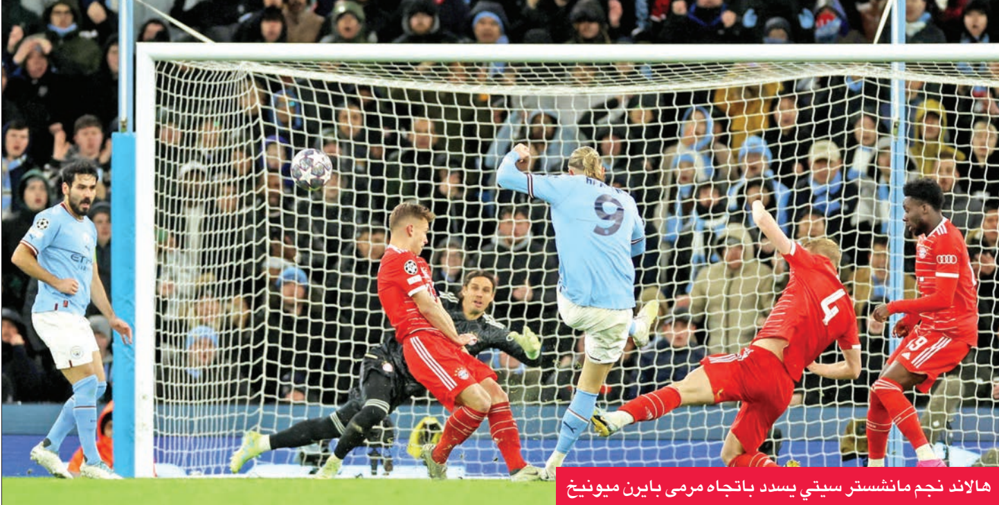
هالاند نجم مانشستر سيتي يسدد باتجاه مرمرى بايرن ميونخ

وضع مانشستر سيتي الإنكليزي قديماً في المربع الذهبي لدوري أبطال أوروبا بفوزه المثير على ضيفه بايرن ميونخ الألماني 3-صفر، أمس الأول في ذهاب دور الثمانية من البطولة القارية.