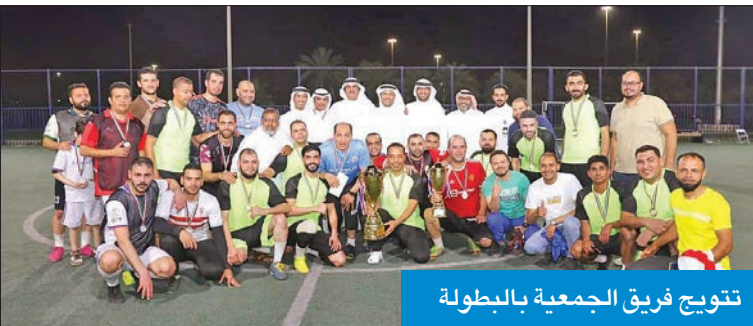
تتويج فريق الجمعية بالبطولة

وفي الختام تم تكريم الفائزين بالمركزين الأول والثاني وتسليم كأس البطولة والميداليات التذكارية لصاحب المركز الأول. كما تم تكريم إدارة جمعية مشرف على المشاركة الإيجابية في إنجاح البطولة.