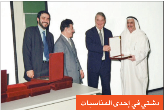
دشتي في إحدى المناسبات