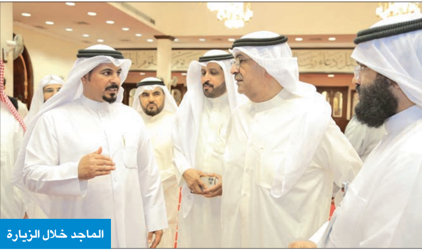
الماجد خلال الزيارة

قام وزير العدل وزير الأوقاف والشؤون الإسلامية وزير الدولة لشؤون النزاهة، عبدالعزيز الماجد، بجولة تفقدية في مسجد الراشد التابع لإدارة مساجد محافظة العاصمة بمنطقة الدبيلة، لاطمئنان على آلية سير العمل في استقبال