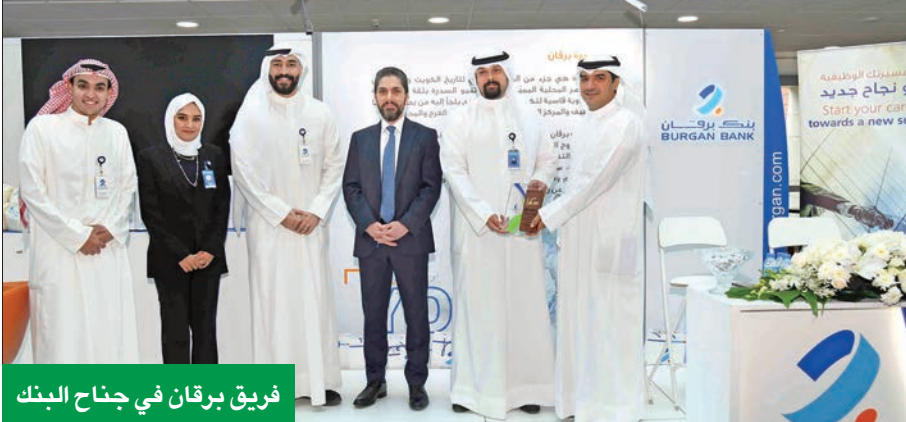
فريق بركان في جناح البنك

بنك بركان الزّاهم بترسيخ مكانته الرائدة في مجال تنمية رأس المال البشري في الكويت». وأضاف: «إننا مستمرون في مساعي الرامية إلى جذب واستقطاب الخريجين الموهوبين إلى القطاع المصرفي، لما يمثل من ركيزة أساسية للنظام المالي على وجه الخصوص. والاقتصاد المحلي، بشكل عام». ولفت إلى أن أكاديمية بنك بركان لحديثي التخرّج مبرنامج المواهب -رؤية- لهماد دور كبير في «تميزنا عن البنوك الأخرى، من حيث توفر الأسس الضرورية لارتقاء بقدرات جيل المستقبل من المصرفيين ذوي الخبرة لإنجاز المزيد، والذين سيكونون قادرين على مواكبة ونيرة التغيير السريع في القطاع المصرفي وغيره».