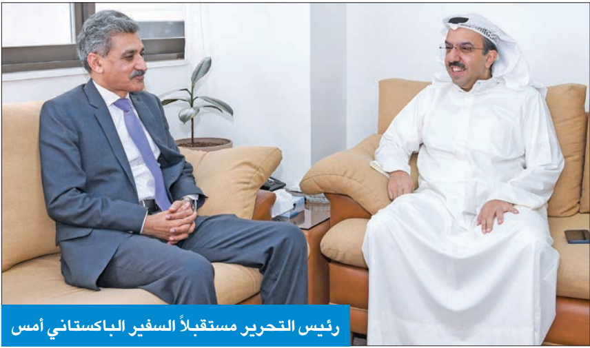
رئيس التحرير مستقبلاً السفير الباكستاني أمس