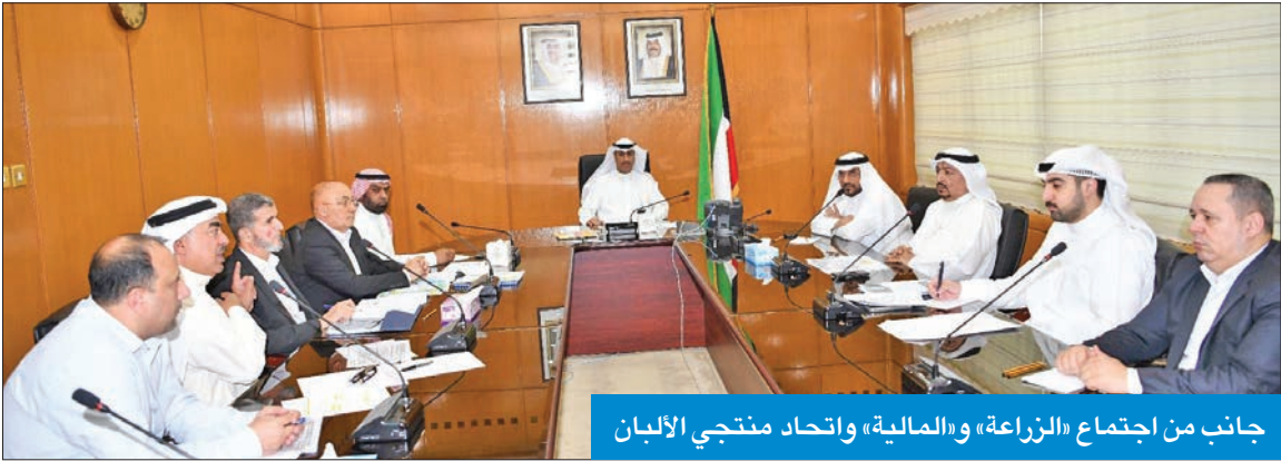
جانب من اجتماع «الزراعة» و«المالية» واتحاد منتجي الألبان

الحليب الطازج والمبستر والبيودر، وذلك بهدف الاستقرار والمحافظة على الأمن الغذائي، مما يستلزم الوقوف إلى جانبها.