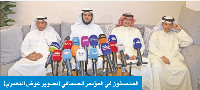
المتحدثون في المؤتمر الصحافي

هذا الوقت تريد أن تتركه الناس بالديموقراطية. اليوم الناس جزعت من إبطال مجالسها، والشرح الذي تم ليس بين الشعب ونوابه بل بين السلطة والشعب وهذا مؤشر خطير»، مؤكداً أن «رئيس الوزراء يحضر سياسياً، مستغرباً بقوله: أسبوع من الحكم، ما ردة فعل الحكومة، هي والعدم سواء، فلا يستحق أحمد نواف الأحمد ومن معه إدارة البلد.