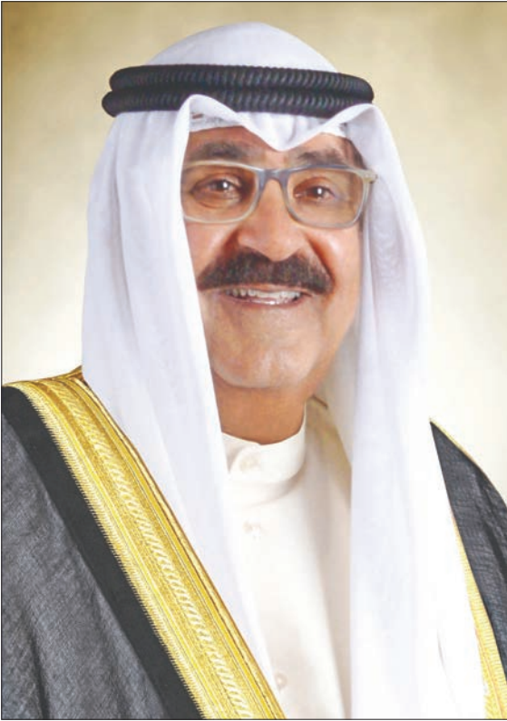
استقبل سمو ولي العهد الشيخ مشعل الأحمد بقرص بيان صباح أمس رئيس مجلس الأمة مرزوق الغانم.

دعت سفارة دولة الكويت في واشنطن المواطنين الكويتيين في جنوب الولايات المتحدة إلى اتباع توجيهات السلطات المحلية بشأن الإعصار الذي ضرب ولايتي «ميسيسيبي» و«الاباما» قبل يومين مخلّفاً 26 قتيلًا وعدداً كبيراً من الجرحى ودماراً واسعاً في البنية التحتية والممتلكات. وقالت في بيان، «تستعري السفارة في واشنطن انتباه المواطنين الكويتيين الموجودين في جنوب الولايات المتحدة إلى أخذ الحيطة والحذر واتخاذ التدابير اللازمة للتعامل مع الإعصار الذي ضرب ولايتي (ميسيسيبي) و«الاباما». وأعربت السفارة عن «تمنياتها لجميع المواطنين السلامة، مطمئنة إلى عدم وجود مواطنين كويتيين متضررين من جراء هذا الإعصار». وأكدت ضرورة وأهمية «اتباع التوجيهات الصادرة من السلطات المحلية لاسيما في المناطق التي تضررت من الإعصار». كما دعت «المواطنين للتواصل معها ومع القنصليات العامة عند الضرورة، على هواتف الطوارئ المخصصة لذلك.