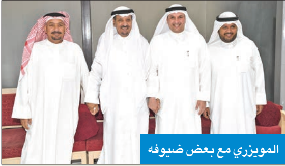
المويزري مع بعض ضيوفه