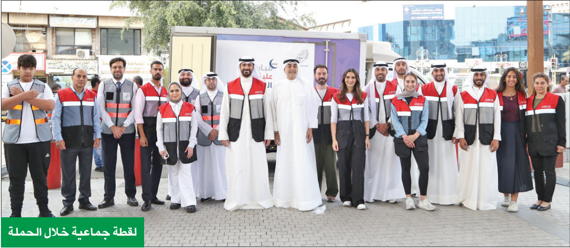
لقطة جماعية خلال الحملة

يمنح عملاءه حق اختيار كيفية ومكان إتمام معاملاتهم المصرفية، مع ضمان الاستمتاع بتجربة مصرفية سهلة وسريعة. وفي إطار دعمه لرؤية الكويت 2035 «كويت جديدة»، وحرصه على التعاون مع مختلف الأطراف لتحقيقها، يلتزم بنك الخليج بالعمل على إحداث تطورات قوية في مجال الاستدامة، على كل المستويات البيئية والاجتماعية والحوكمة، من خلال مبادرات الاستدامة المتنوعة، والمختارة بشكل استراتيجي داخل البنك وخارجه.