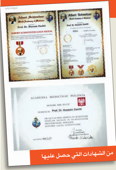
من الشهادات التي حصل عليها

ي - الرئيس المنتخب الدولي كلية الجراحين قسم الكويت منذ عام 1993. ك - عضو لجنة المناهج والتقييم منذ عام 1993. ل - هيئة تحرير مجلة الجمعية الطبية الكويتية منذ عام 1993. م - عضو لجنة فحص التوظيف بكلية الطب منذ عام 1993. ن - رئيس المكتب الاستشاري بكلية الطب منذ عام 1995. س - هيئة التحرير الاستشارية، مجلة التغذية سيراكوز نيويورك، الولايات المتحدة الأمريكية، 1995. ع - عضو هيئة التحرير، مجلة المبادئ والممارسات الطبية 2008 إلى 2010. ف - محرر المجلة الطبية الكويتية 2006 إلى 2010.