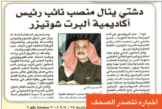
أخباره تنصدر الصحف