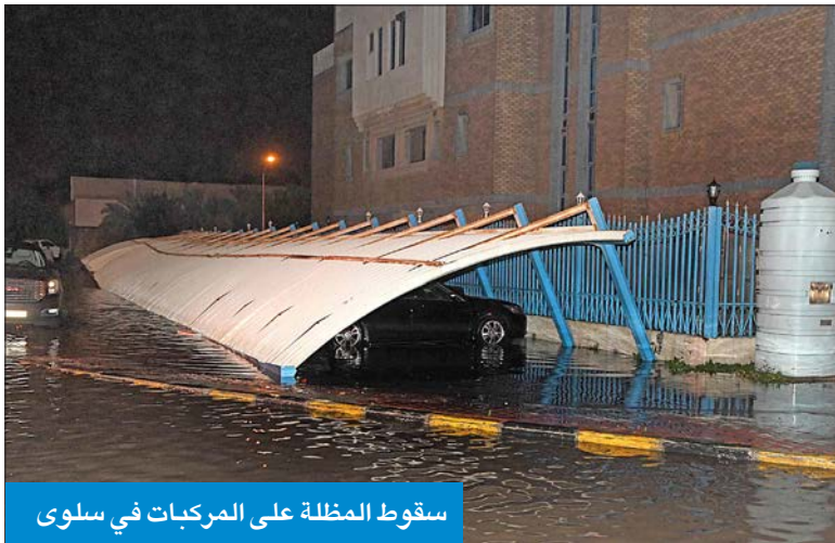
سقوط المظلة على المركبات في سلوى