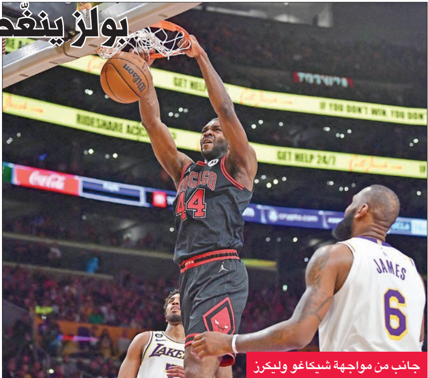
جانب من مواجهة شيكاغو وليكرز

وبدوره، ورغم تألق نجمه السلوفيني لوكا دونتشيتش صاحب 40 نقطة و12 متابعة، خسر دالاس مافريكس أمام تشارلوت هورنتس 104 - 110. ويحتل مافريكس المركز الحادي عشر في المنطقة الغربية التي تشهد منافسة شرسة على المراكز حيث لا تفصل سوى 3 انتصارات بين المركزين السادس والثاني عشر. وحقق بوسطن سلتيكس الذي غاب عن صفوفه جايوسون تاتوم للإصابة فوزاً كبيراً على سان أنتونيو سبيرز 137 - 93، بفضل المتألق جايلون براون صاحب 41 نقطة و13 متابعة. وتابع سلتيكس (52 فوزاً مقابل 23 هزيمة) ضغوطاته على ميلووكي باكس (53 - 21) في سباق الاستئثار بالمركز الأول في المنطقة الشرقية. وفاز أورلاندو ماجيك على بروكلين نتس 119 - 106، وخسر غولدن ستايت ووريوز أمام مينيسوتا تمبروولفز 96 - 99.