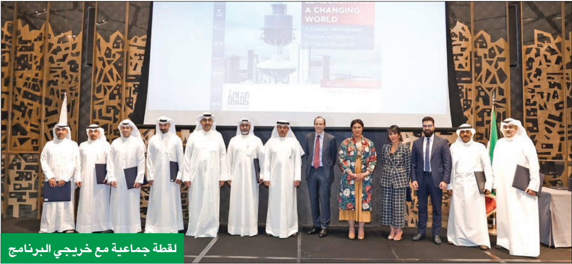
لقطة جماعية مع خريجي البرنامج

وأوضح أنه دائماً كان تطوير المديرين محور التركيز الرئيسي في البنك، إذ يعزّز نموذج التدريب الذي ينتهجه الوطني بالإضافة إلى البرامج التي يشارك بها موظفوه من القدرة على القيادة انطلاقاً من الرؤية المتسقة لكيفية فهمنا للقيادة وما نتوقعه من القاديين، كما يعكس الاحتياجات الفريدة من القيايين ويدعمه بحث علمي دقيق لتحديد المعرفة والمهارات التي تشكل جوهر القيادة الفعالة والشاملة لتلبية احتياجات الموظفين التدريبية. وأضاف أن البنك يؤمن بأن القادة هم العامل الحاسم في خلق المناخ والثقافة التي نسعى جاهدين من أجلها وهي ثقافة تسمح لموظفينا بتحقيق إمكاناتهم الكاملة والإزدهار، وإضافة إلى ذلك، توفر البرامج التدريبية الإمكانات التي يحتاجها قادة المستقبل كي يكونوا قادرين على التكيف وتحفيز الآخرين وتمكينهم وأن يكونوا حاسمين في أوقات عدم اليقين. وصممت برامج مبادرة (كفاءة) التي يتطلّبها القطاع المالي والمصرفي وطبيعتها، لتزويد الكوادر الوطنية بما يعزّز قدراتها ومعارفها التي تحكمها أهداف المبادرة المنتهجة عن الأهداف العامة لرؤية الكويت 2035. وتعد جامعة هارفارد إحدى أعرق الجامعات الأميركية وأفضلها عالمياً، إذ يتلقّى التعليم فيها نخبة من المجتمع الأميركي والعالم منذ عام 1636 ونحتل المرتبة الأولى على قائمة أفضل مئة جامعة في العالم.