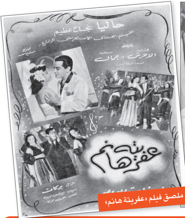
ملصق فيلم «عفريتة هانم»

وشعرت سامية بالغضب من الرجل، فقالت له إنها لا تحتاج لهذا السمك ولم تأكل منه شيئاً وأنه موجود بحالته، وعليه أن يأخذه، فأشار الرجل إلى أنه لن يأخذه بحجة أنه فسد، فسمعت الفراشة وقالت بغضب: "حتى لو فسد لن أعطيك فمته"، وهنا استدر الرجل عطفها وانهمرت دموعه، فرق قلبها رغم أنها تعرف أنها محاولة لايتزازها، وبالفعل منحته السمك ومعه بعض المال، وخرج الرجل راضياً وما إن نزل للشارع حتى سمعته ينادي: "السمك البحرى... السمك الطازة!"