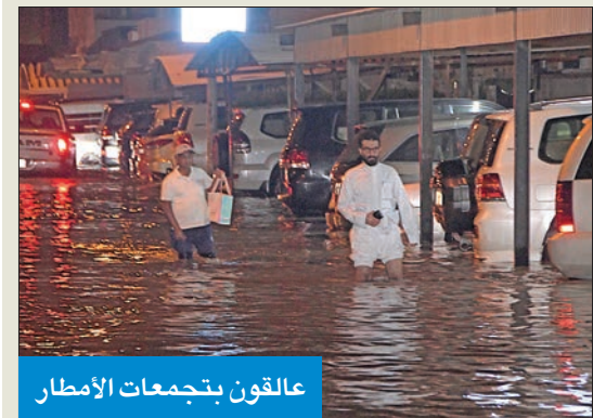
عالقون بتجمعات الأمطار

سجلت محطات الأرصاد الجوية وهواة الطقس كميات هطول الأمطار أمس الأول على البلاد، حيث جاءت الجابرية في المقدمة بـ 55.5 ملم، بينما صباح الأحمد في المركز الأخير بـ 2.4 ملم وكانت الكميات كالآتي: الجابرية: 55.5، وحطين: 55.1، والصدقي: 44.2، واليرموك: 40، والرابية: 36.5، والرميثية: 25، والنسيم: 24.6، والجهراء: 22.5، والمطلاع: 22، والأطراف: 21، والصبية: 18.8، والأبرق: 18.1، ومزرعة العبدلي: 15.7، والسالمية: 13.8، والصابرية: 12.5، والعبدلي: 10.9، واللياح: 10.2، وأبو الحصانية: 8.9، والعقيلة: 7.3، والقصور: 7.1، ومطار الكويت: 7، والأدعي: 5.8، والوفرة: 3.8، والخيران: 3.5، وأم الهيمان: 3، وميناء الأحمد: 2.6، وصباح الأحمد: 2.4.