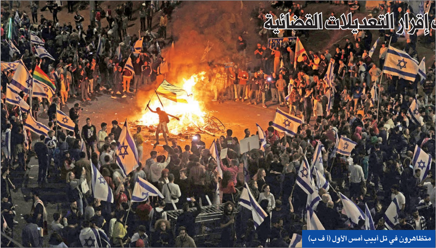
متظاهرون في تل أبيب أمس الأول

على وقع تعبئة تعتبر من الأكبر في تاريخ إسرائيل، احتدمت الخلافات وتحول تمسك الائتلاف الديني الحاكم، بقيادة بنيامين نتنياهو، بالقضائية، من خلاف سياسي إلى انقسام مجتمعي فوضوي ينذر بمواجهة خطيرة في الشارع بين اليسار واليمين المتطرف، خصوصاً في ظل تمدده إلى جميع الأجهزة الأمنية والمدينة الخدمية.