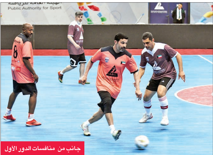
جانب من منافسات الدور الأول