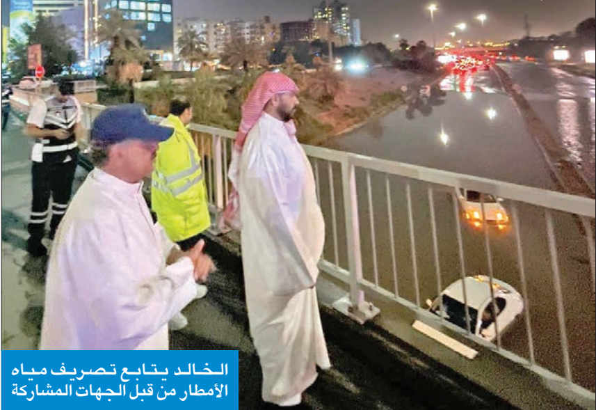
الخالد يتابع تصريف مياه الأمطار من قبل الجهات المشاركة

وشدد الخالد على التعامل مع جميع أماكن تجمعات المياه في أسرع وقت ممكن، مشيداً بالروح العالية، والتعاون المثمر بين جميع مؤسسات وهيئات الدولة في التعامل مع تداعيات الأمطار.