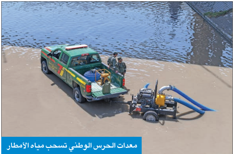
معدات الحرس الوطني تسحب مياه الأمطار