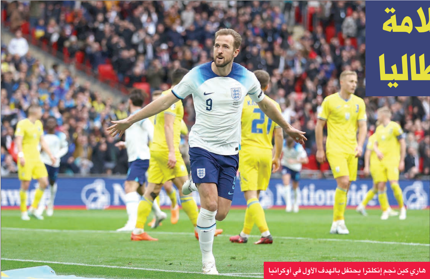
هاري كين نجم إنكلترا يحتفل بالهدف الأول في أوكرانيا

روناودو (38 عاماً) رصيده 122 في 198 مباراة، بتسجيله ثنائية خلال فوز منتخب بلاده الساحق على مضيفته لوكسمبورغ بسداسية نظيفة. وكان روناودو سجل ثنائية أيضاً في مرمى ليشتنشتاين في المباراة الأولى التي انتهت بفوز بلاده 4 - صفر الخميس، في لقاء حطم فيه الرقم القياسي في عدد المباريات الدولية قبل أن يعززه مساء الأحد برفعه إلى 198 مباراة.