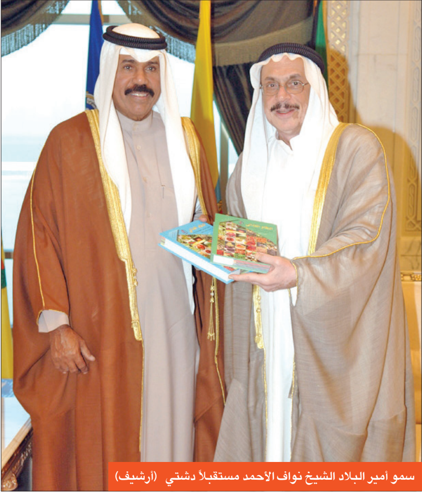
سمو أمير البلاد الشيخ نواف الأحمد مستقبلاً دشتي