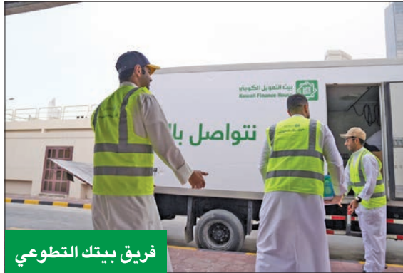
فريق بيتك التطوعي

ومشاركة الإفطار مع العديد من الجهات التي تؤدي واجبها أثناء موع الإفطار، وكذلك توزيع السلّة الغذائية «ماجلة رمضان»، وكسوة العيد على الأسر المتعففة، بالتعاون مع جمعية الهلال الأحمر الكويتي، في تأكيد جديد على ريادة «بيتك» في المسؤولية الاجتماعية، ودوره في المشاركة بمختلف المناسبات الاجتماعية.