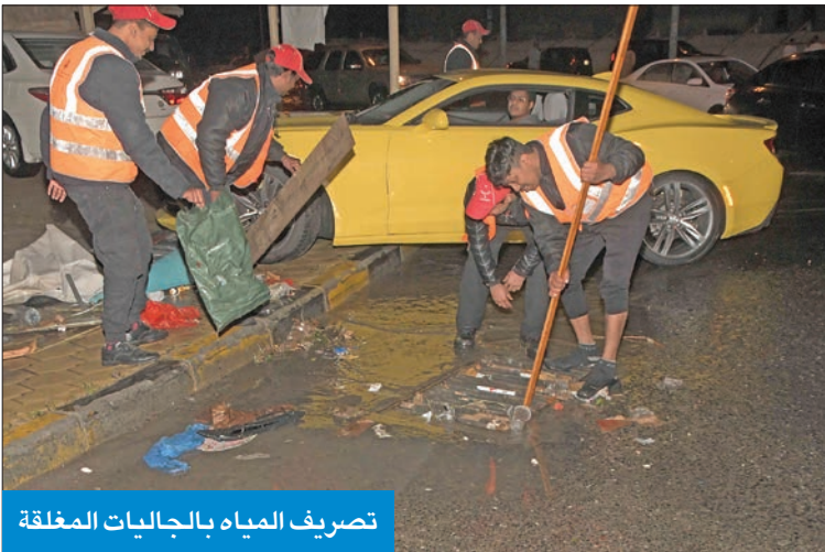
تصريف المياه بالجاليات المغلقة