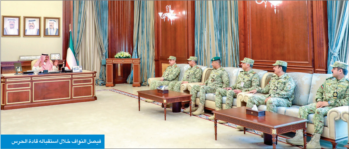
فيصل النواف خلال استقبله قادة الحرس استقبل نائب رئيس الحرس الوطني الشيخ فيصل نواف الأحمد، وكيل الحرس الوطني الفريق الركن مهندس هاشم الرفاعي، وكبار القادة والضباط، حيث هنامهم بشهر رمضان المبارك. وشكر نائب رئيس الحرس، الوكيل وكبار القادة على تهنئتهم، سائلا الله أن يعيد الشهر الفضيل على الكويت وجميع دول العالم بالخير والبركات، وأن يحفظ الكويت من كل مكروه في ظل قيادتها