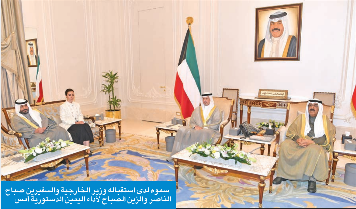
سموه لدى استقباله وزير الخارجية والسفيرين صباح الناصر والزين الصباح أداء اليمين الدستورية أمس