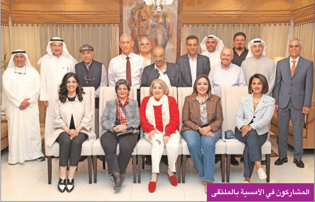
المشاركون في الأمسية بالملتقى

الكويت)، قالت د. الملا: «في عام 2015 جاء الكتاب الثاني عن الأقليات (المسيحيون في الكويت)، لكونهم يحتلون الرقم الأكبر مقارنة بفئات الأقليات الأخرى، وتواجدوا على أرض الكويت مع مرور البحارة البرتغاليين بالكويت، لاستقرارهم في البصرة عام 1795». ليقول عليان بعد ذلك: «عندما تم الشروع في إعداد مادة الكتاب، ووضع خطة عمل بعد قراءات متصلة بخصوص تاريخ المسيحيين والكنائس في الكويت، وجدنا الكثير من الأخطاء والتضارب بالروايات، عندها سلكتنا طريقين: الطريق الأول أن نرسلنا النزول إلى المبدان، والطريق الثاني الذي اتبعناه هو اعتماد منهج التاريخ المحايد، وإيراد الروايات والأحداث