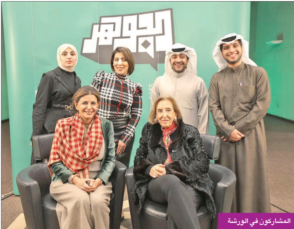
المشاركون في الورشة