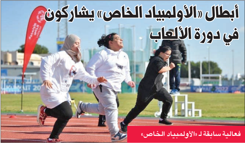
فعالية سابقة لـ «الأولمبياد الخاص»

يقفل في الساعة الثامنة من مساء اليوم باب التسجيل لبطولة المغفور له الشيخ صباح السالم الحمود السنوية للرماية التي ينظمها نادي الرماية الكويتي الرياضي وتطلق فعاليات الخميس 16 الجاري لمدة 3 أيام. وسيمت إجراء قرعة البطولة وتوزيع الجداول والمجموعات مساء غد، وتشتمل على مسابقات (السكيت، التراب، البندقية لمسافات 10 امتار و50 متراً – المسدس لمسافات 10م و25 متراً - رماية القوس والسهم الأولمبي والمركب). من جانبه، أشاد الأمين العام للاتحادين الكويتي والعربي عبيد العصيمي بالدعم الكبير الذي تلقاه الرماية الكويتية والرماة من الأب الروحي لهذه الرياضة ورئيس شرف النادي – رئيس الاتحاد الآسيوي للرماية - الشيخ سلمان الحمود الذي حرص هو وأسرته المغفور له صباح السالم الحمود على تنظيم هذه البطولة السنوية لتشجيع وتحفيز الرماة وخصوصاً الناشئين منهم على بذل الجهد في سبيل تنمية قدراتهم ليتمكنوا من تمثيل دولة الكويت ضمن المنتخبات الوطنية على أكمل وجه. وأشار العصيمي إلى أن بطولة هذا العام ستكون ختاماً لمسابقات الموسم المحلي لنادي الرماية الكويتي الرياضي.