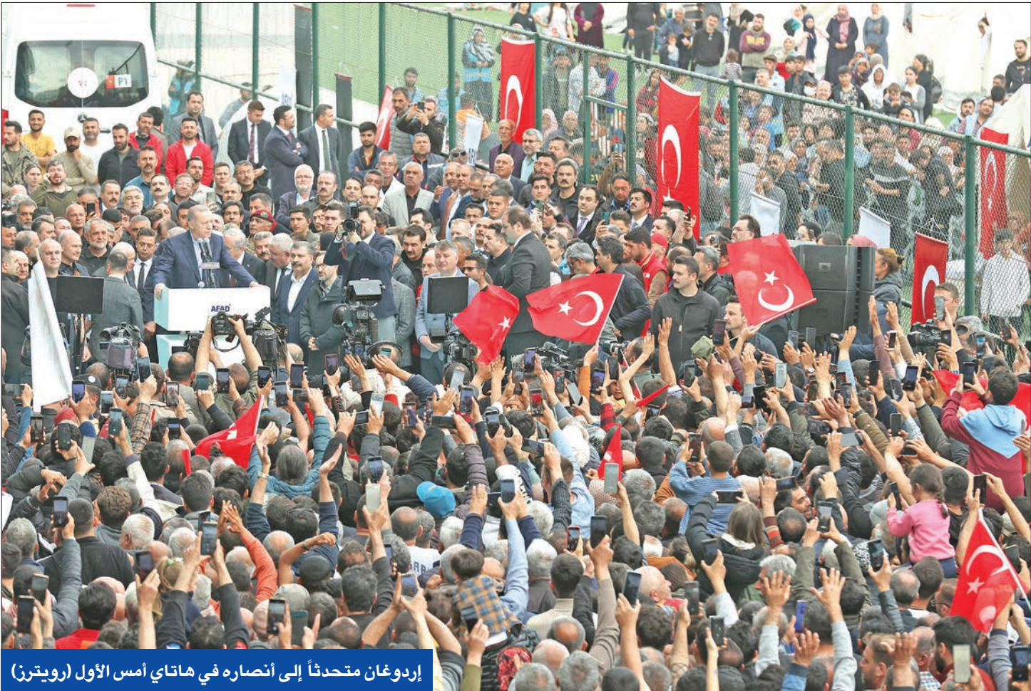
إردوغان متحدثاً إلى أنصاره في هاتاي أمس الأول

الأشخاص، وخلفت دماراً مادياً ضخماً في 11 ولاية تركية.