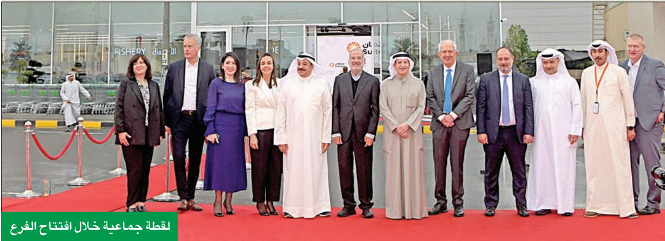
لقطة جماعية خلال افتتاح الفرع