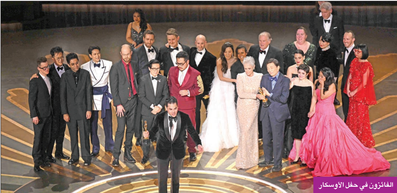
الفائزون في حفل الأوسكار

وحصدت شركة الإنتاج السينمائي المستقلة (إيه.24) التي صنعت فيلمي Everything Everywhere All at Once و«ذا ويل» تسع جوائز، وهو عدد جوائز أكبر من أي عدد نالته شركة إنتاج أخرى.