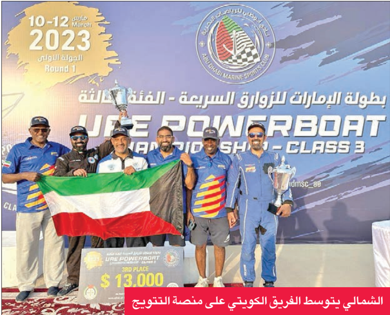
الشمالى يتوسط الفريق الكويتى على منصة التتويج

وتحقيق مركز متقدم وسط منافسة ساخنة ومثيرة.