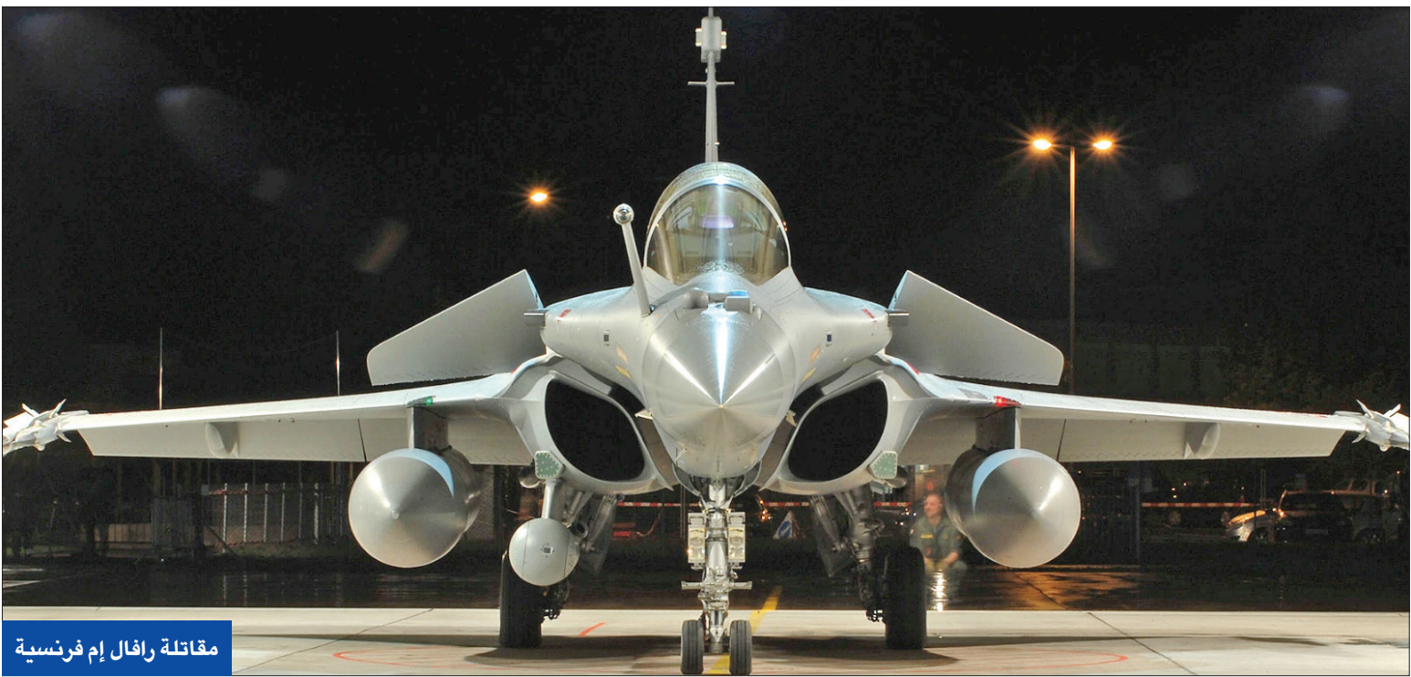
مقاتلة رافال إم فرنسية

وتمثل الولايات المتحدة 40 في المئة من صادرات الأسلحة العالمية. وعلى الرغم من أن انتقال الأسلحة على مستوى العالم تراجع 5.1 في المئة، حذر المعهد في 2022 من أن الترسانة النووية العالمية ستنمو على الأرجح خلال السنوات المقبلة.