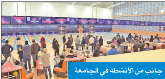
جانب من الأنشطة في الجامعة

للعب «البولينج» مع الموظفين وأسره، وتخلل الفعالية عدد من المسابقات التي عززت روح المنافسة والمرح بين الحضور. وذكرت أن الفعاليات شهدت حضوراً كثيفاً من الموظفين، حيث ساعدتهم على الاستمتاع