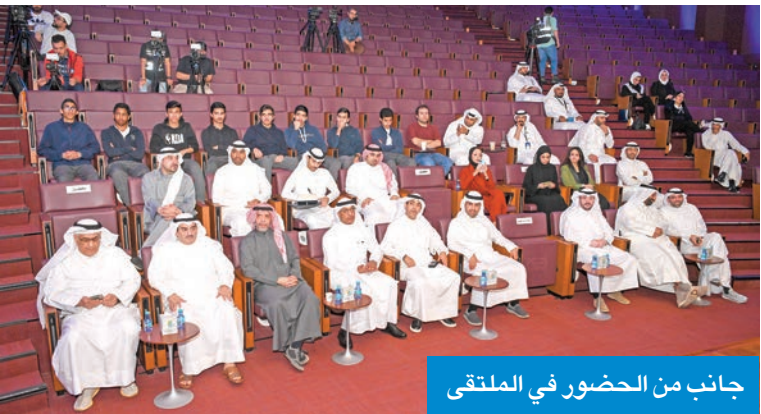
جانب من الحضور في الملتقى