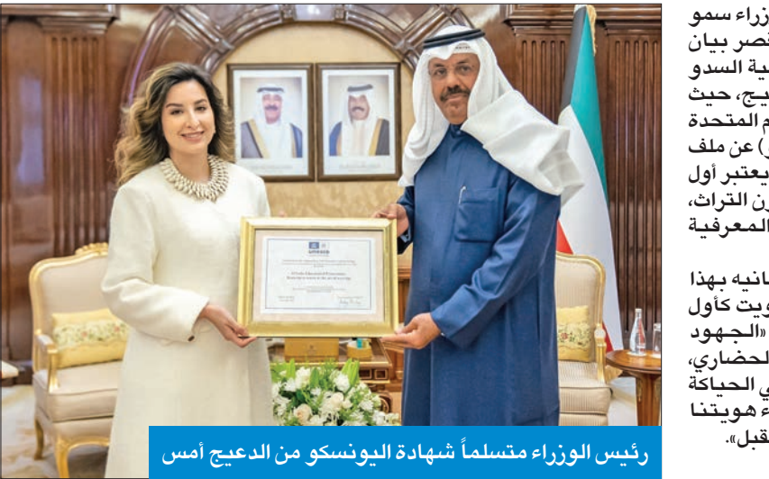
رئيس الوزراء متسلماً شهادة اليونسكو من الدعيج امس

استقبل رئيس مجلس الوزراء سمو الشيخ أحمد نواف الأحمد، في قصر بيان امس، رئيسة مجلس إدارة جمعية السدو الكويتية الشخبة بيبى الدعيج، حيث قدمت لسموه شهادة منظمة الأمم المتحدة للتربية والعلم والثقافة (يونسكو) عن ملف «أفضل ممارسات الصوت»، والذي يعتبر أول ملف عربي لأفضل ممارسة لصون التراث، وذلك من خلال نقل المهارات المعرفية لنسج السدو.