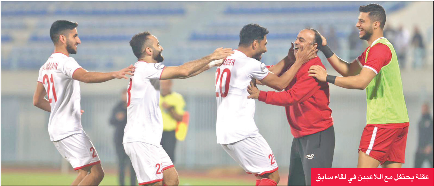
عقلة يحتفل مع اللاعبين في لقاء سابق

الكويت انتظم في معسكر مغلق... ودخول مجاني للجماهير