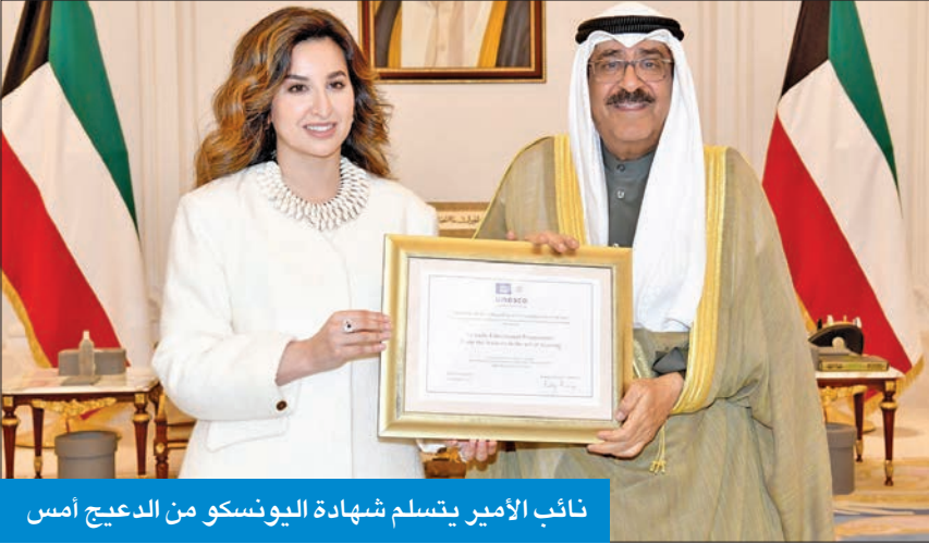
نائب الأمير يتسلم شهادة اليونسكو من الدعيج امس

وقد هناها سموه على هذا الإنجاز التراثي، مشيدا بما تقوم به جمعية السدو من عمل مخلص للمحافظة على التراث الكويتي الاصيل، وتمنى سموه