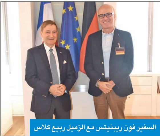
السفير فون ريبينيتس مع الزميل ربيع كلاس

اقتصادي متنوع ومزدهر». وأشار فون ريبينيتس إلى أن بلاده ستستضيف المؤتمر الدولي التاسع لنحوال الطاقة في برلين من 28 إلى 29 مارس الجاري تحت شعار «تحول الطاقة - تامين مستقبل أخضر»، وهي الفترة التي تسبق الدورة 28 لمؤتمر الأطراف في اتفاقية الأمم المتحدة الإطارية بشأن تغير المناخ، التي ستعقد في خريف هذا العام. من ناحية أخرى، وانطلاقاً من التعاون الاقتصادي الناجح بين الكويت وألمانيا، نخل، أمس، مكتب الصناعة والتجارة الألماني بالكويت (AHK)، بالتعاون مع السفارة الألمانية، ندوة تستمر يومين بدعم من الوزارة الألمانية الاتحادية للشؤون الاقتصادية والمناخ. ومن المقرر أن يجري الوفد