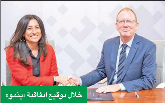
خلال توقيع اتفاقية «ينمو»

إطلاق مشروع مجمع ينمو إيست اللوجستي الضخم