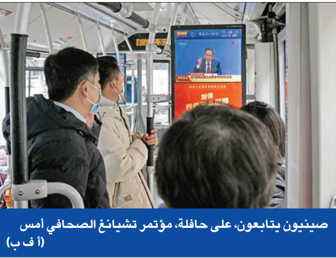
صينيون يتابعون، على حافلة، مؤتمر تشاينغ الصحافي أمس

الوقت كفيلاً بإحداث تقارب، ولا تخفي المصادر المتابعة أن المسألة تحتاج إلى مزيد من الوقت. الملف اللبناني كان حاضراً أيضاً في اجتماعات عقدها وزير الخارجية السعودية الأسبوع الفائت في باريس، وتحديداً مع وزيرة الخارجية الفرنسية كارترين كولونا، ومع المستشار في الرئاسة الفرنسية باتريك دوريل، وهو المكلف بإدارة الملف اللبناني، وحسبما تكشف مصادر متابعه فإن اللقاء كان واضحاً لجهة التشديد السعودي على الموقف من لبنان، ورفض مسألة المقايضة التي تطرحها باريس بين رئاسة الجمهورية ورئاسة الحكومة، وشدد وزير الخارجية السعودي على ضرورة التقارب بين اللبنانيين على ما ستكون فيه مصلحة عليا للبنان وليس مصلحة لأطراف سياسية.