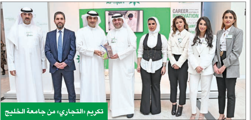
تكريم «التجاري» من جامعة الخليج

«يسعى (التجاري) دوماً إلى استقطاب ودعم المواهب الوطنية الشابة الطموحة والراغبة في العمل بالقطاع المصرفي، ويوفر فرص العمل المناسبة وفق تخصصاتهم الدراسية، ومساعدتهم على البدء في مسيرة حياتهم العملية، وتعريفهم بالقطاع المصرفي، الذي يعتبر ضمن الركائز الأساسية لاقتصاد الدولة» وأشار إلى أن «التجاري» يعتبر الشراكة مع الجامعات والمؤسسات التعليمية من الأمور المهمة في سياسته التوظيفية، ويسعى دائماً إلى تقديم الدعم والمساعدة والتدريب للخريجين الكويتيين، حيث يستهدف البنك بناء وإعداد جيل جديد من المصرفيين الشباب، إيماناً منه بأهمية الاستثمار في الشابّة البشري، والعمل في القطاع المصرفي، في إطار رسالة البنك الرامية إلى «بناء المستقبل معاً»، وتحقيقاً لمبادئ الاستدامة، وتمكين الشباب الكويتي الطموح من المساهمة في بناء المستقبل. وأضاف عبد الله أنه تسهلاً على الخريجين والراغبين في التقدم للعمل لدى البنك، وضمن رحلته نحو التحول الرقمي، أطلق «التجاري» نظام التقديم الذاتي، الذي يساهم على المتقدم تعبئة بياناته الشخصية، من خلال المصادقة مع برنامج هويتي الوطني.