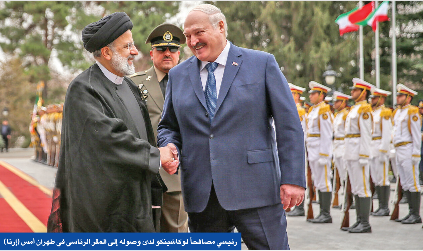
رئيسي مصافحاً لوكاشينكو لدى وصوله إلى المقر الرئاسي في طهران أمس (إرنا)

● بن فرحان: الاتفاق لا يعني حل كل الخلافات ● طهران ترفض تكذيب واشنطن لـ «تبادل سجناء» وشيك