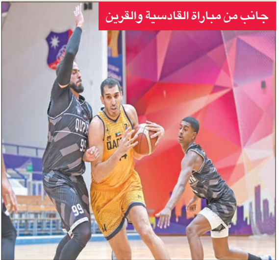
جانب من مباراة القادسية والقرين