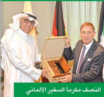
التصاف مكرم السفير الألماني

استقبلت غرفة تجارة وصناعة الكويت، امس، وفد المكتب الألماني للتجارة والصناعة AHK، بالتعاون مع سفارة جمهورية ألمانيا الاتحادية لدى الكويت برئاسة هانس كريستيان فريهر سفير ألمانيا، وترأس اللقاء مصعب النصف عضو مجلس الإدارة بحضور عدد من أصحاب الأعمال المهتمين من الشركات والجهات الكويتية. في بداية اللقاء، رحب النصف بالضيوف الكرام، مشيداً بالعلاقات التجارية بين دولة الكويت وألمانيا، مؤكداً أن الغرفة على أتم الاستعداد لتقديم كافة خدماتها للتوصل الى نتائج إيجابية بين البلدين الصديقين. وتطرق النصف الى أهمية دور القطاع الخاص في مجالات التنمية الاقتصادية وتعزيز التعاون التجاري من خلال استقطاب المشاريع الاستثمارية وعمل شركات ناجحة بين الجانبين الكويتي والألماني، حيث تعد ألمانيا من أهم الدول المصدرة الى الكويت، وبلغ حجم الواردات 1.4 مليار دولار عام 2021، إذ تحتل المركز السابع من بين الدول المصدرة الى الكويت.