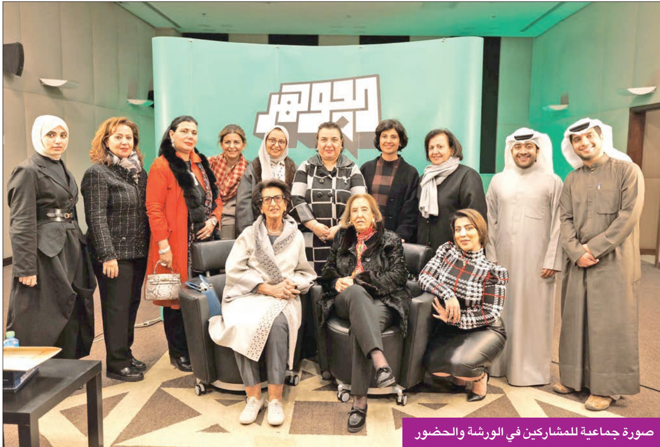
صورة جماعية للمشاركين في الورشة والحضور

والجزيرة العربية المخصصة لإجراء بحوث حول المرأة».