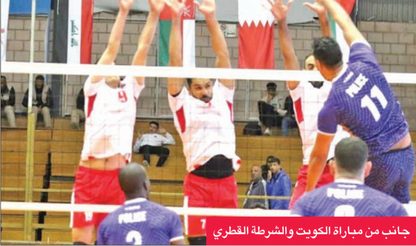
جانب من مباراة الكويت والشرطة القطري

والصيني ليو لدك حصون الفريق العماني الذي يامل تقديم عرض جيد لحصد نقاط الفوز.