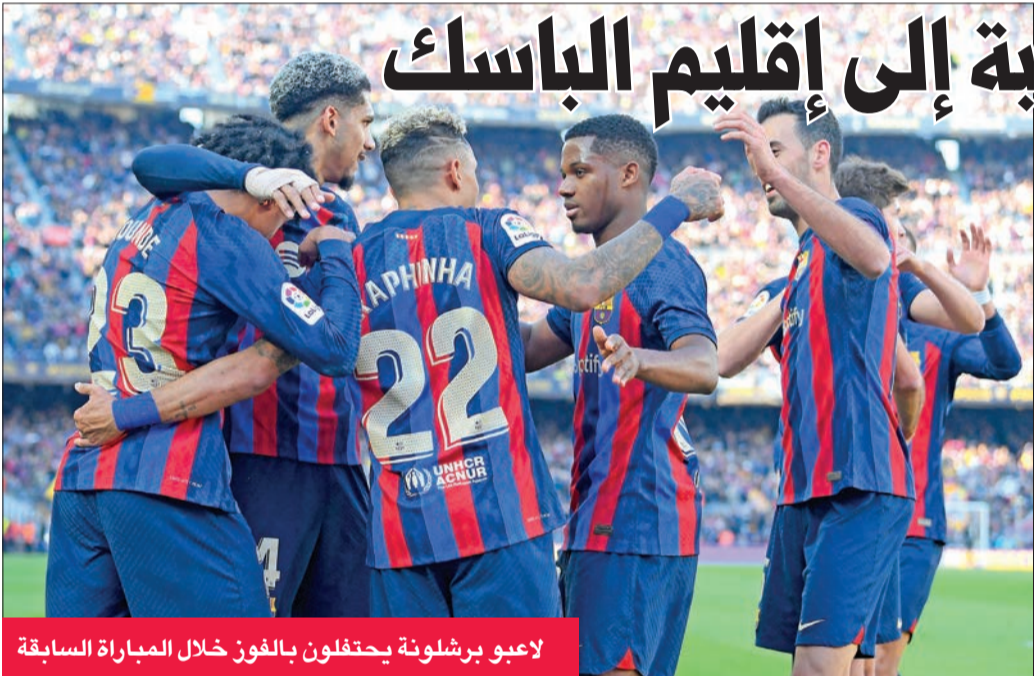
لاعبو برشلونة يحتفلون بالفوز خلال المباراة السابقة

رأى مدرب باريس سان جيرمان الفرنسي، كريستوف غالتييه، أنه يجب عدم التقليل من أهمية الفوز ببطولة الدوري المحلي لكرة القدم، وذلك بعد 3 أيام من أقصاء فريقه من دوري أبطال أوروبا على يد بايرن ميونخ الألماني. وقال غالتييه في مؤتمر صحفي، أمس الأول، «إذا قُدر لباريس سان جيرمان إحراز اللقب، فسكون الرقم 11 ولم يسبق لأي فريق أن حقق ذلك (بتساوي حالياً في الرقم القياسي مع سانت اتيان)، وبالتالي يجب عدم التقليل من أهمية الفوز بلقب الدوري الفرنسي».