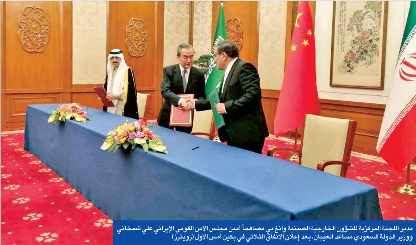
مدير اللجنة المركزي للشؤون الخارجية الصينية وانغ بي مصافحاً أمين مجلس الأمن القومي الإيراني علي شمخاني ووزير الدولة السعودي مساعد العبيان، بعد إعلان الاتفاق الثلاثي في بكين أمس الأول

مع تواصل ردود الفعل الدولية المرعبة باتفاق عودة العلاقات بين السعودية وإيران بعد 7 سنوات من القطيعة التي أعقبت اقتحام متشددين موالين للنظام الإيراني مبنى السفارة السعودية في طهران، ثارت تساؤلات حول ما تطرحه الخطوة المفاجئة، التي توسطت بها الصين، من تحديات بشأن نفوذ الولايات المتحدة على الصعيدين الإقليمي والدولي.