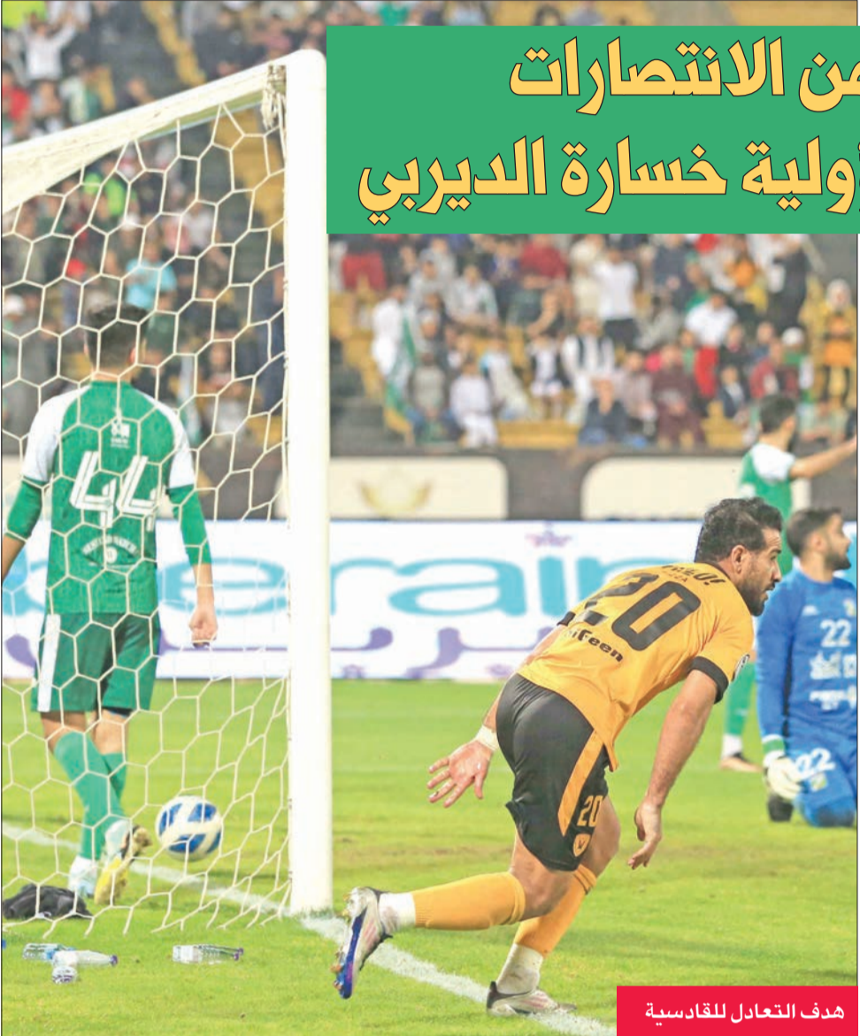
هدف التعادل للقادسية