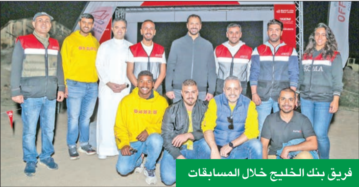
فريق بنك الخليج خلال المسابقات

«Bank Off Road Challenge» يسعدنا هذا النجاح الكبير الذي شهده فعاليات المسابقة سواء من الرياضيين أو الجمهور الذي تابع الفعاليات بشغف.