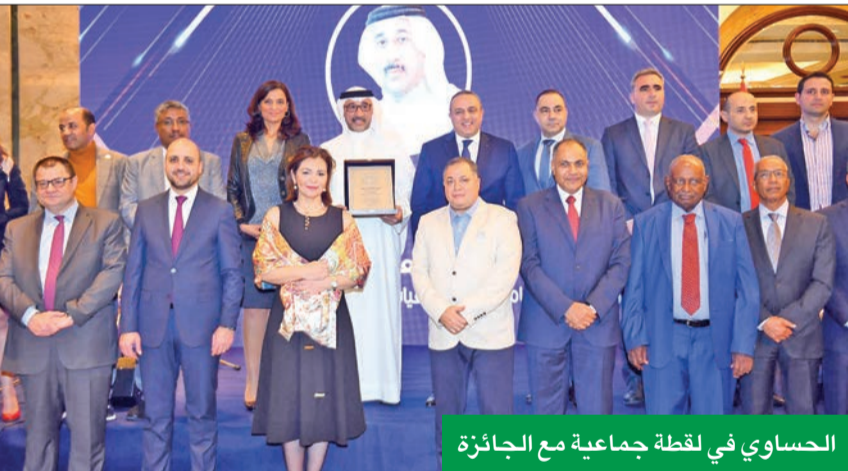
الحساوي في لقطة جماعية مع الجائزة

إنه خلال الأزمة المالية العالمية التي شهدتها في 2008 كان للبنوك الكويتية، بتوجيه من البنك المركزي، دور كبير في المحافظة على استقرار هذا القطاع. وأضاف أن «القطاع المصرفي الكويتي اليوم هو قطاع متنامٍ وناجح ولديه ربحية متميزة، ورغم الأزمات التي مررنا بها من جائحة كورونا وغيرها