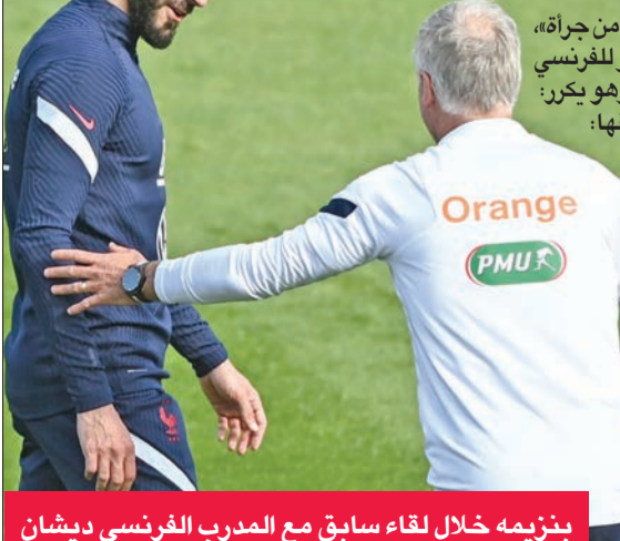
بنزيمة خلال لقاء سابق مع المدرب الفرنسي ديشان

لقطة لحديث ديشان علق عليها: «يا لها من جراحة» وأضاف إليها رمزاً لمهراج، كما نشر فيديو للفرنسي ريتشي الشهير على موقع سناب شات وهو يكرر: «كاذب، أنت كاذب»، وكتب بنزيمة فوقها: «ديديه المقدس... ليلة سعيدة». وهذه حلقة جديدة في العلاقة الملتهبة بين ديشان وبنزيمة في المنتخب الفرنسي. بنزيمة الذي أحرز مع فرنسا فقط لقب دوري الأمم الأوروبية عام 2021، وابتعد عن الزرق بين 2015 و2021 اضلوعه في فضيحة ابتزاز زميله السابق ماتيو فالوينا بشرط جنسي كلفة عقوبة السجن سنة مع وقف التنفيذ وتغريمه 75 ألف يورو.