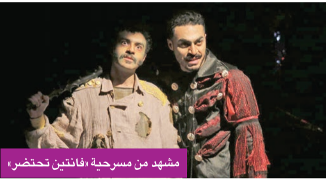
مشهد من مسرحية «فانتين تحضر»