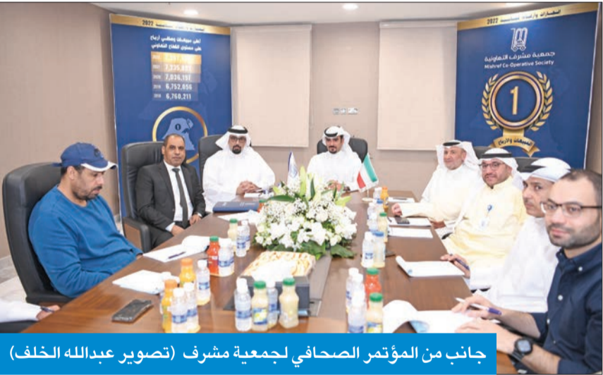
جانب من المؤتمر الصحافي لجمعية مشرف

الفضالة: «العمومية» 19 الجاري... وتوزيع 12% أرباحاً