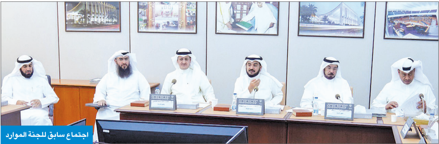
اجتماع سابق للجنة الموارد

للعمل حتى وقت انصرافهم منه وفقاً للآلية المتبعة بكل جهة لإثبات واقعة الحضور والانصراف، وعلى الإدارات الحكومية التي تقدم خدمات مباشرة للجمهور الإعلان عن ساعات العمل المخصصة لتقديم تلك الخدمات بحيث لا يقل مجموع تلك الساعات عن (7) ساعات عمل في اليوم. وتقوم كل وحدة إدارية بالتنسيق مع موظفيها بإدارة أوقات عملهم اليومي وتنظيمه بما لا يخل أو يؤثر في إنجاز أعمالهم ومهام وظائفهم وتقديم الخدمات للجمهور والمستفيدين بأسياسية وجودة أو ارتباطهم بمواعيد الاجتماعات أو الندوات أو ورش العمل أو البرامج التدريبية المقررة لهم. ويستمر العمل بساعات العمل الرسمية التي تتناسب مع الأعمال ذات الطبيعة الخاصة في الإدارات الحكومية وفقاً لما حدد بموجب القرارات الصادرة في ضوء تطبيق المادة (83) من نظام الخدمة المدنية. وتقوم الجهات المطبقة لنظام الدوام المرن بعد مضي (6) أشهر من تاريخ بدء تطبيق نظام العمل بالدوام المرن وبصفة دورية بموافقة ديوان الخدمة المدنية بتقرير حول تقييم هذا النظام وأثاره عموماً (الأثر الاقتصادي والإدارية والإجرائية) على الموظفين على وجه الخصوص.