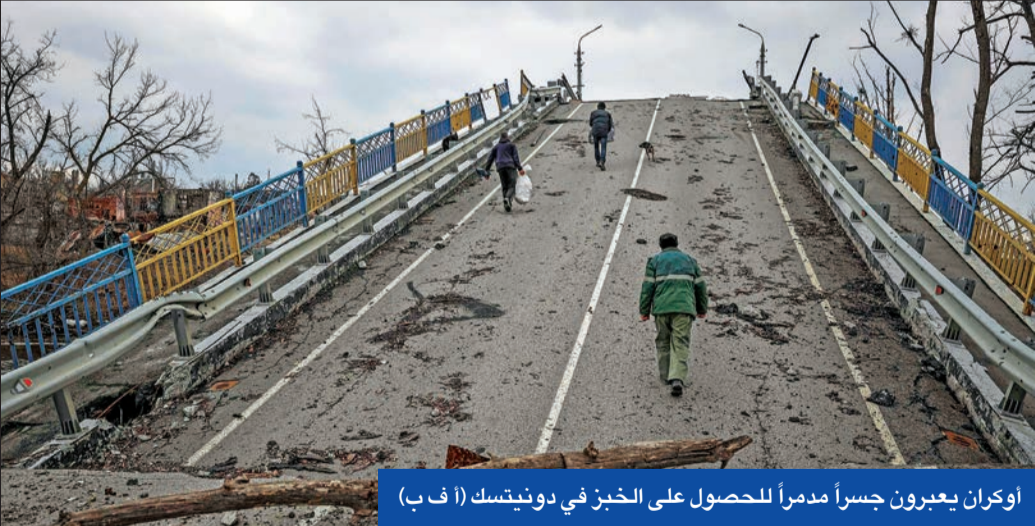
أوكرآن يعبرون جسراً مدمراً للحصول على الخبز في دونيتسك

كشف كبير مستشاري الرئاسة في أوكرانيا، ميخائلو بودولياك، عن تخضير الجيش لإطلاق هجوم الربيع المضاد «في غضون شهرين»، مبيناً أنه سيركز في المقام الأول على الاحتفاظ بالسيطرة على مدينة باخموت، التي سيطر على غربها والقوات الروسية على شرقها.