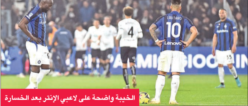
الخيبة واضحة على لاعبي الإنتر بعد الخسارة

السادسة عشرة من عمر الدوري الإيطالي لكرة القدم، من نهاية الوقت من رمية تماس، راوغ والتف على نفسه ثم أطلق كرة طائرة على مقربة من خط الرميات الحرة، ليسجل سلة الفوز قبل ثمانية وعشر من الثانية في سلة الفريق الزائر. والهب اللاعب الرقم 21 الجماهير، بحركة نادرة من عملاق بطول 2.13 مترين ويزن 127 كلغ، فقاد فيلادلفيا إلى فوزه الرابع توالياً في دوري «إن بي إيه»، على وقع هتاف الحاضرين لمحب «ولس فارغو سنتر»: «أم آفي بي! أم آفي بي!» أي أفضل لاعب في الدوري.