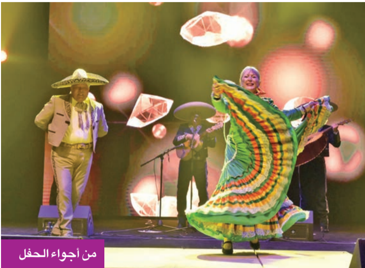
من أجواء الحفل