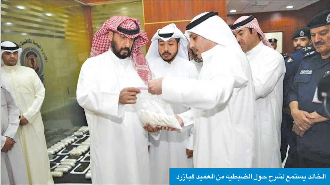
الخالد يستمع لشرح حول الضبطية من العميد قبازد

أشرف على ضبط 120 كيلو حشيش و36 ألف حبة كبتاغون وكيلو من الشبو