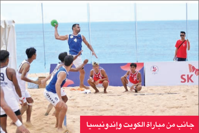
جانب من مباراة الكويت وإندونيسيا

في الحادية عشرة والنصف صباحاً «توقيت الكويت» مع منتخب عمان ضمن الجولة الثالثة للبطولة، التي ستشهد أيضاً إقامة أربع مباريات يلتقي فيها منتخب إندونيسيا مع هونغ كونغ، والصين مع فيتنام «المجموعة الخاتية» ويلعب في المجموعة الأولى كوريا الجنوبية مع الفلبين وقطر مع السعودية.