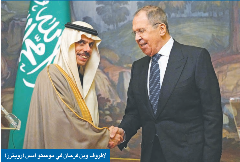
لافروف وبن فرحان في موسكو أمس