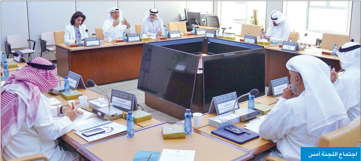
اجتماع اللجنة أمس

المطر: مدير الجامعة وعدنا بتشكيل لجنة تقصي حقائق الأحد المقبل