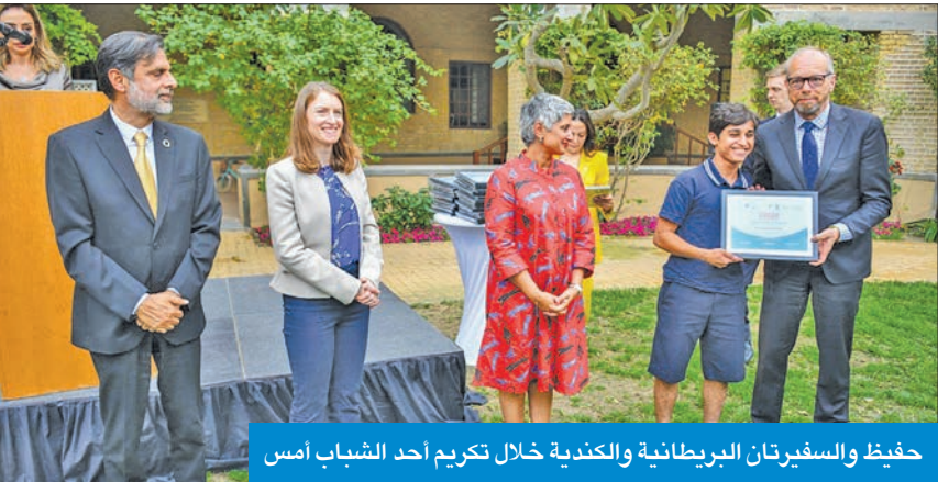
حفيظ والسفيرتان البريطانية والكندية خلال تكريم أحد الشباب أمس

أشاد دبلوماسيون معتمدون لدى الكويت بالنتائج المثمرة لبرنامج السفراء الشباب في تمكين المشاركين فيه من طلبة المدارس الثانوية في الكويت من الانخراط بالعمل على الركائز الرئيسية للمجال الدبلوماسي وبناء مهاراتهم ليصبحوا نشطاء وقادة في مجتمعهم. جاء ذلك في كلمات لهؤلاء الدبلوماسيين خلال حفل استضافته السفارة البريطانية لدى البلاد أمس، في ختام برنامج السفراء الشباب الذي استمر 4 أشهر، في عمل مشترك بين السفارتين البريطانية والكندية والأمم المتحدة لدى الكويت، وبشراكة مع طلبة من المدارس الثانوية الحكومية والخاصة وعدة هيئات ومنظمات دبلوماسية في البلاد. وأشاد المضيف المقيم للأمم المتحدة بالإنابة لدى الكويت، د. أسعد حفيظ، بالتعاون مع السفارتين البريطانية والكندية في هذا البرنامج، بهدف دعم السفارة الشباب في التعرف على مهارات القيادة وفن الدبلوماسية ليصبحوا «أبطالاً وثائقين» بأنفسهم وذوي دور فعال في المجالس الوطنية بين الجنسين في عالم أفضل بالنسبة إلينا جميعا، وأضاف حفيظ أن البرنامج