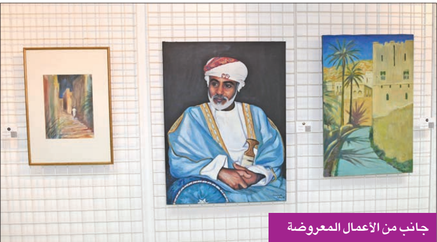
جانب من الأعمال المعروضة

في لوحاتها، حيث تظهر دائماً في خيها للطبيعة، وتاملها في عملها، وأيضاً حبها للسفر، واكتشاف الأشياء الجديدة، والإطلاع، والثقافة. واوضحت عاصم، لـ