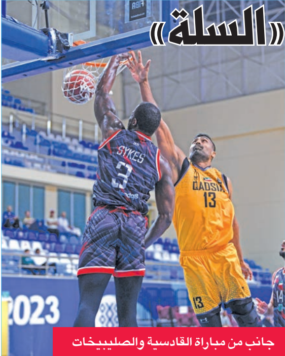
جانب من مباراة القادسية والصلبيخات