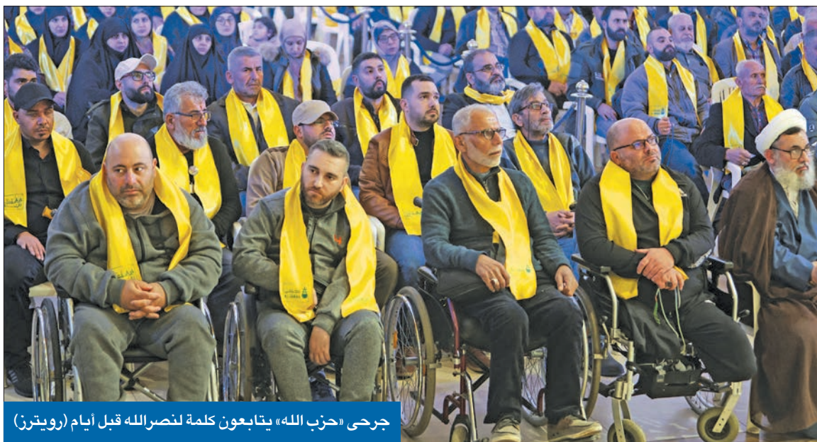
جرجى «حزب الله» يتابعون كلمة لنصرالله قبل أيام

الحزب «مخنوق» مالياً ويتوقع انتهاء المعركة بتسوية دولية ترفع عنه «الحصار الاقتصادي» ● طهران ترى أن المواجهة ستدفن الاتفاق النووي نهائياً وتفضل التركيز على إبعاد سورية عن العرب