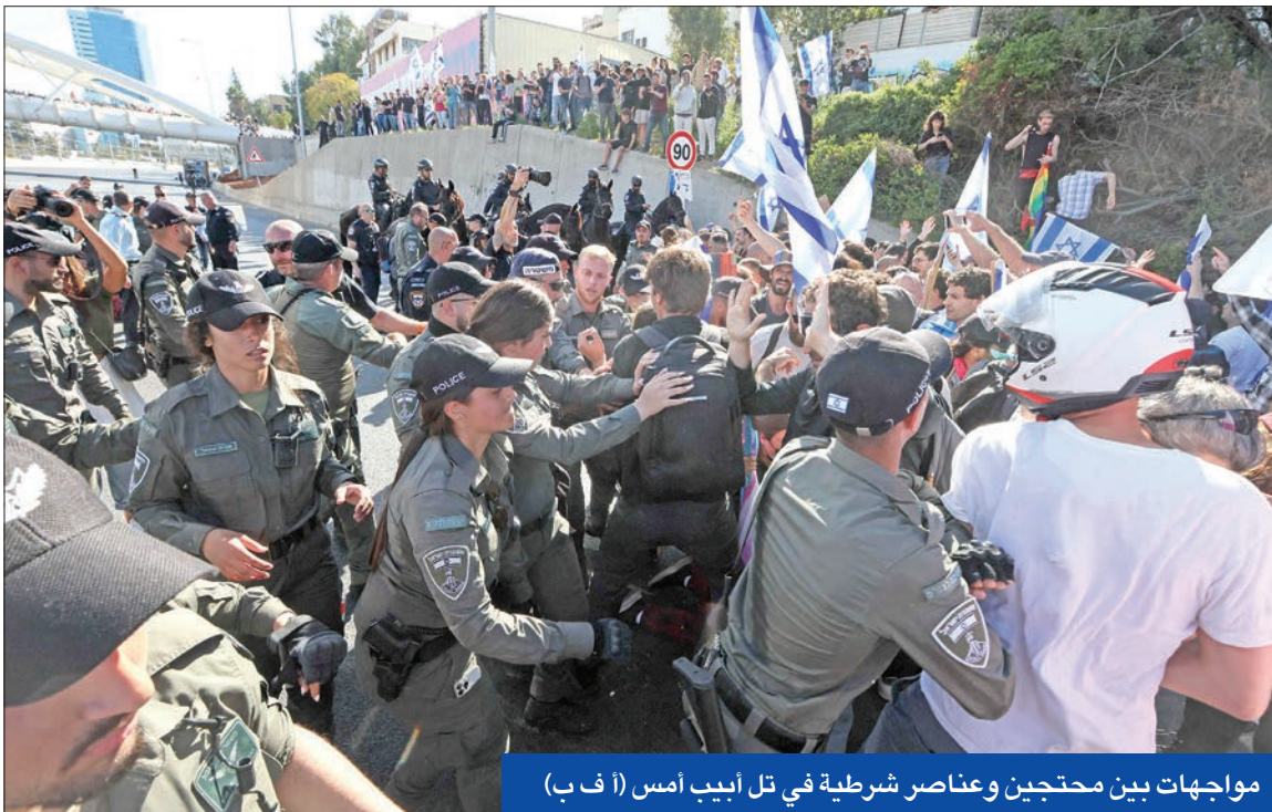
مواجهات بين محتجين وعناصر شرطية في تل أبيب أمس

وعلى وقع تصعيد المعارضة خطواتها ضد الحكومة الإسرائيلية، بحث أوستن مع نتنياهو عدة ملفات ساخنة في مقدمتها «التهديدات الإيرانية» والعنف المتصاعد في الأراضي الفلسطينية المحتلة وخطة الإصلاح القضائي. وبحسب بيان لوزارة الدفاع الأميركية «البنتاغون» أكد أوستن التزام