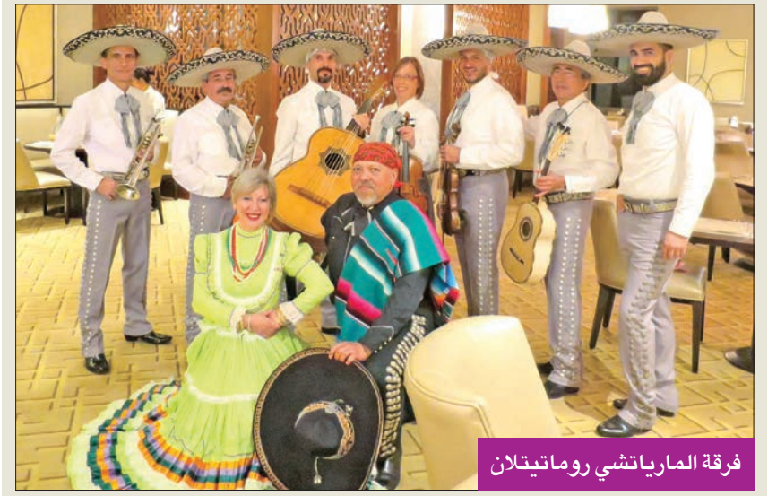
فرقة المارياتشي روماتيتلان

ووفقا لليونسكو، فإن المارياتشي تفسر الموسيقى التقليدية، وتعد عنصراً من عناصر الثقافة المكسيكية التي تنقل من خلالها القيم والتاريخ واللغات المختلفة، ولهذا حظيت بالتقدير كتراث غير ملموس للبشرية. أشار إلى أن فرقة المارياتشي روماتيتلان الموسيقية تلتمز بالحفاظ على الموسيقى الشعبية المكسيكية التقليدية ونشرها، فمُنذ إنشائها كانت الفرقة تتميز بالنشاط، ليس فقط كادوات تفسير لموسيقى المارياتشي، بل في البحث عن الأغاني التقليدية من هذا النوع المشهورة والشائعة في جميع أنحاء العالم. وبالإضافة إلى العروض في المهرجانات والأماكن الدولية الشهيرة تركز الفرقة الموسيقية على تعزيز الثقافة المكسيكية من خلال التعاون مع الجمعيات الإيطالية وغيرها من الجمعيات الأوروبية في القطاعين العام والخاص، حيث أدى هذا الجهد والعمل إلى حضور فرقة المارياتشي روماتيتلان في عدة جولات دولية في المكسيك وفرنسا، وسويسرا، واليونان، وسلوفينيا، وكرواتيا، وجمهورية التشيك، وقبرص، وأوكرانيا، وكذلك في الشرق الأوسط في العراق والجزائر والكويت.