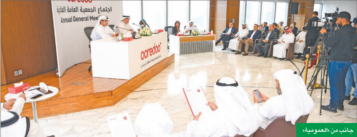
جانب من «العمومية»