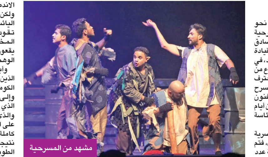
مشهد من المسرحية