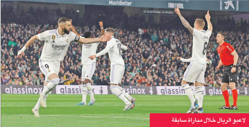
لاعبو الريال خلال مباراة سابقة

وتفتتح منافسات المرحلة الجمعة بمباراة قادش أمام خيتافي، وتشهد مساء السبت لقاء إلششي مع بلد الوليد، وسيلتا فيغو مع رايو فايكانو، وبلنسية مع أوساسونا.