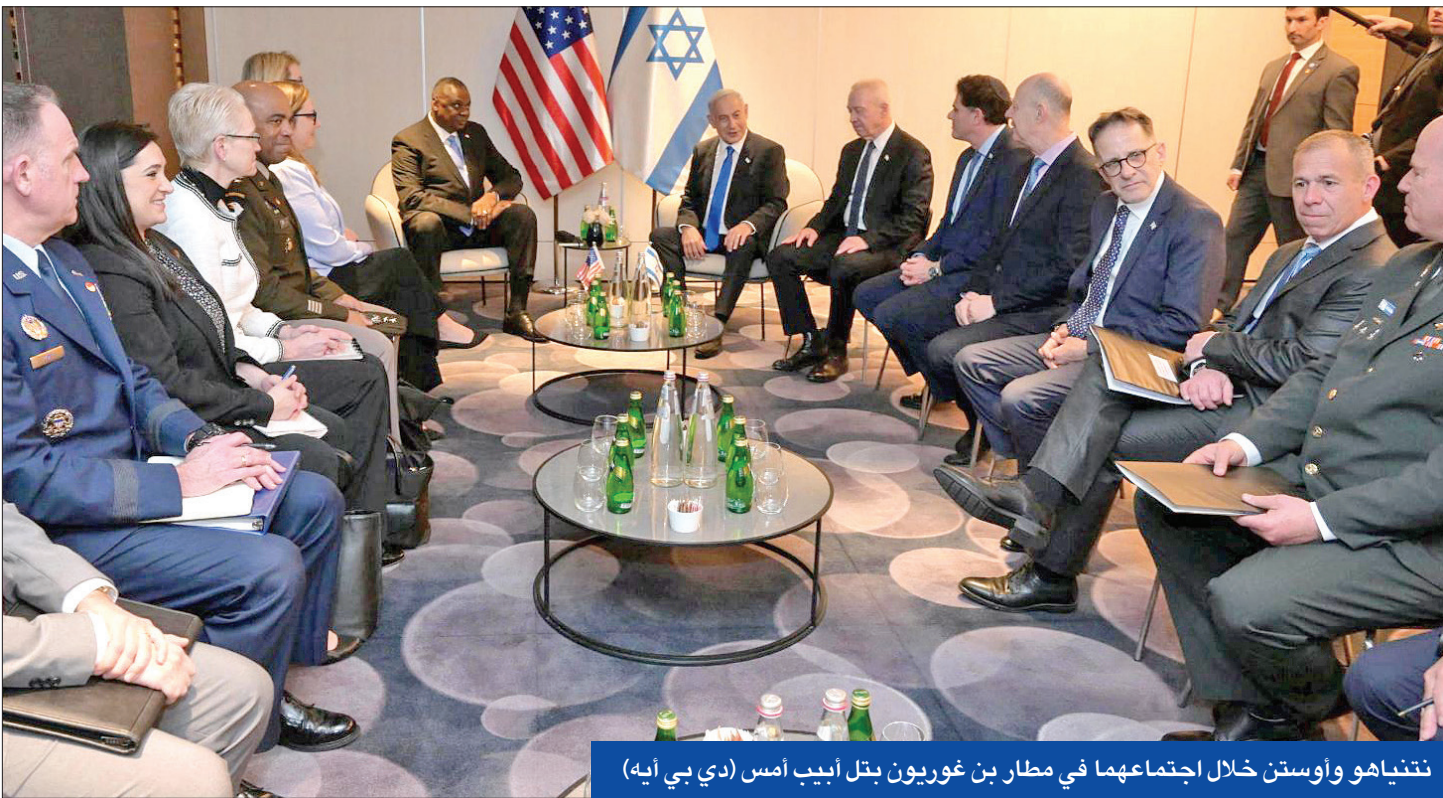
نتنياهو وأوستن خلال اجتماعهما في مطار بن غوريون بتل أبيب أمس (دي بي إيه)

قام بها مستوطنون وتسبب مقتل فلسطيني وإحراق عشرات المنازل.