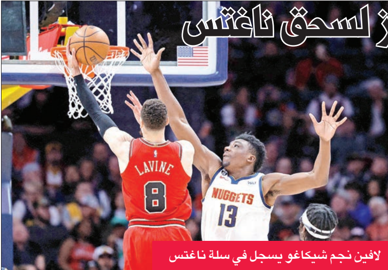
لافين نجم شيكاغو يسجل في سلة ناغتش

وفي نيور أورليانز، قاد سي جاي ماكولوم انتفاضة متاخرة لليبليكانز للفوز على دالاس مافريكس 113-106 في مباراة اكتفى فيها نجم الأخير السلوفيني لوكا دونتشيتش بـ15 نقطة.