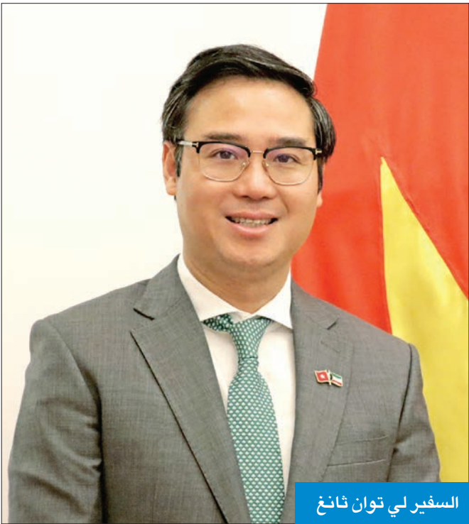
السفير لي توان ثانغ

جميع أنحاء البلاد، وعندما نستضيف مؤتمرات دولية فإننا على دراية بإعداد غرف الصلاة للرجال والنساء، كل على حدة، لذا أعتقد أن فيتنام ستكون وجهة جيدة للكويتيين. وبالنسبة للنفقات، فإن فيتنام أرخص نسبياً من دول أوروبا، وعندما نذهب إلى فيتنام ستخزوق طعام الشارع المحلي اللذيذ جداً والرخيص جداً، وقد زار العديد من الكويتيين فيتنام أخيراً، والتقيت بهم عند عودتهم وكانوا سعداء جداً من سفرهم. • هل الكويتي بحاجة إلى تأشيرة لدخول فيتنام، وكَم يبلغ عدد التأشيرات التي تصدرونها شهرياً؟ - نعم، الكويتي يحتاج إلى تأشيرة لدخول فيتنام، وبدءاً من بداية العام حتى الآن لدينا كل شهر ما بين 20 و30 تأشيرة تصدرها للكويتيين الراغبين في السياحة ولذين أظهروا اهتماماً بشراء البضائع من فيتنام وعقد اتفاقات تجارية مع شركات هناك، ويسعدنا في السفارة التدخل في حال وجود أي تأخير أو أي عوائق تواجه الكويتيين الراغبين في التجارة، مع العلم أن الاستثمار في فيتنام آمن جداً. وقوانينا تسمح للكويتي بامتلاك شقة وسيارة، لذلك أجد دعوتي لرجال الأعمال الكويتيين للاستثمار في فيتنام التي حققت العام الماضي استثمارات مباشرة بـ35 مليار دولار من جميع أنحاء العالم، وقبل ذلك بعام، أي في 2021، كان لدينا 20 ملياراً، وفي عام 2020، كان لدينا ما يقرب من 20 ملياراً، لذلك يمكننا أنؤكد للكويتيين أنه بإمكانهم أن يتقوا بالاستثمار في بلدي