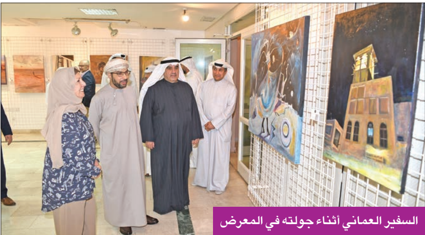
السفير العماني أثناء جولته في المعرض

وذكرت أنها ترسم في أي وقت، ومتى وجدت فكرة لوحة وأعجبت بها تقوم بصورها على الفور، لتقوم برسمها. وعن جديدها، كشفت أنها بصدد التفكير في إقامة معارض فنية في الفترة المقبلة.