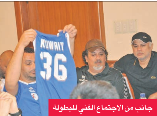
جانب من الاجتماع الفني للبطولة

بذلك، تصدر العربي المجموعة الأولى، بفارق الأهداف عن النجمة البحريني (الثاني)، ولكل منهما نقطتان، وظل السالمية وأهلي سداب من دون رصيد.