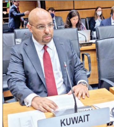
الفصام يلقي كلمة الكويت

وسينطوي على درجة كبيرة من عدم اليقين. وذكر أن تقرير الوكالة الأخير تطرق إلى استمرار تجاوز إيران الحد المسموح به لإنتاج اليورانيوم، والمنصوص عليه في الاتفاق النووي المبرم عام 2015. وأشار إلى أن مفتشي الوكالة عثروا على سلسلتي طراند مركزية كانت مترابطة بطريقة تختلف جوهرها عن معلومات التصميم التي أعلنتها طهران سابقاً، لافتاً إلى حاجة الوكالة إلى زيادة وثيرة وكثافة أنشطة التحقق في (محطة فوردو لتخصيب الوقود)، بعد العثور على جزيئات يورانيوم عالي التخصيب، وبنسبة نقاء تصل إلى 83.7 بالمئة.