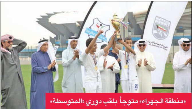
«منطقة الجهرء» متوجاً بلقب دوري «المتوسطة»

افتتح فريق نادي الكويت لكرة الطائرة مشواره في بطولة غرب آسيا الأولى للأندية لكرة الطائرة أمس بفوز صعب على نظيره الشرطة القطري بنتيجة ثلاثة أشواط مقابل شوطين (25-21، 25-21، 25-22، 25-22) في المباراة التي جمعت الفريقين ضمن الجولة الافتتاحية للدور التمهيدي للبطولة المقامة حالياً على صالة قصر الرياضة بالعاصمة الأردنية عمان، والتي شهدت أيضاً فوز دار كليب البحريني على شباب النني لباس الفلسطيني بثلاثة أشواط دو رد.