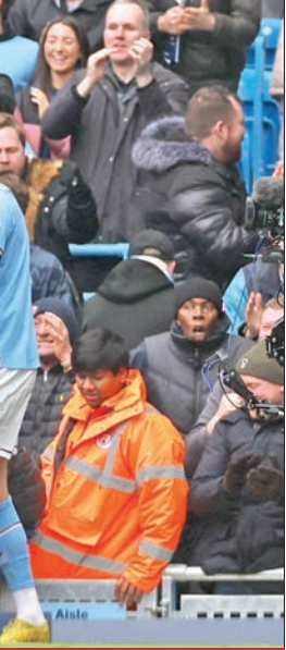
لاعبو مانشستر سيتي خلال مباراة سابقة

وكان المدرب جوسيب غوارديولا، قد أثنى على نجم الفريق فيل فودين الذي عاد لتقديم مستويات كبيرة خاصة في المباراة الماضية، حيث سجل هدفاً بمجهوج فردي على نيوكاسل. وعانى فودين (22 عاما) من أشهر قليلة صعبة عقب نهاية كأس العالم، حيث قدم أداء سيئاً بالإضافة لإصابته ومرضه.