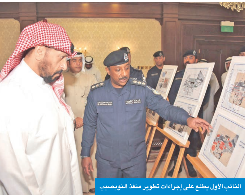
النائب الأول يطلع على إجراءات تطوير منفذ النويصيب

كما استمع لشرح من الإدارة العامة لتنظيم المعلومات عن الأنظمة التكنولوجية الحديثة التي سيتم العمل بها في المركز، وتوفير أجهزة آلية لتسهيل الإجراءات من خلال القراءة الآلية لوثائق السفر والتحقق من صحتها وتدقيق السمات الأمنية بها لضبط حالات التزوير، وتتم مطابقتها مع السمات الحيوية للمسافر من خلال تدقيق بصمات الأصابع والوجه وقزحية العين، والتحقق من قوائم الممنوعين المحلية والدولية قبل توثيق حركة السفر والتدقيق على المركبات أمنياً في المنافذ البرية.