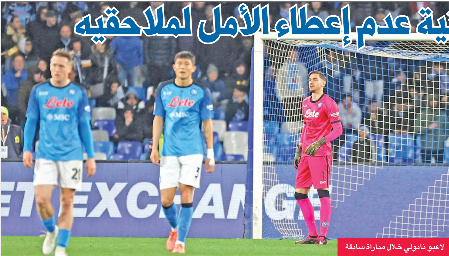
لاعبو نابولي خلال مباراة سابقة

يوفنتوس الأحد المقبل في الدوري، في مواجهة سنكر في الرابع من أبريل حين يلتقيان في ذهاب نصف نهائي مسابقة الكأس. أما لاتسيو المنتشي من فوزه على نابولي، فيحل ضيفا السبت على بولونيا مدركا أن أي هفوة قد تسقطه إلى المركز الخامس.