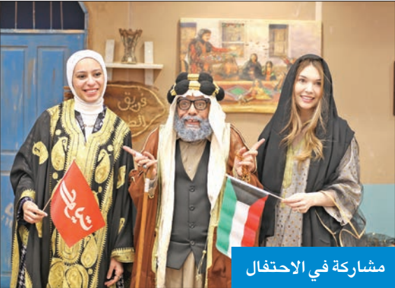
مشاركة في الاحتفال