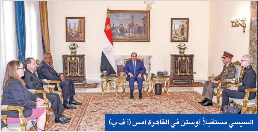
السياسي مستقبلاً أوستن في القاهرة أمس

فلسطين وسد النهضة حازران في «الوزاري العربي»