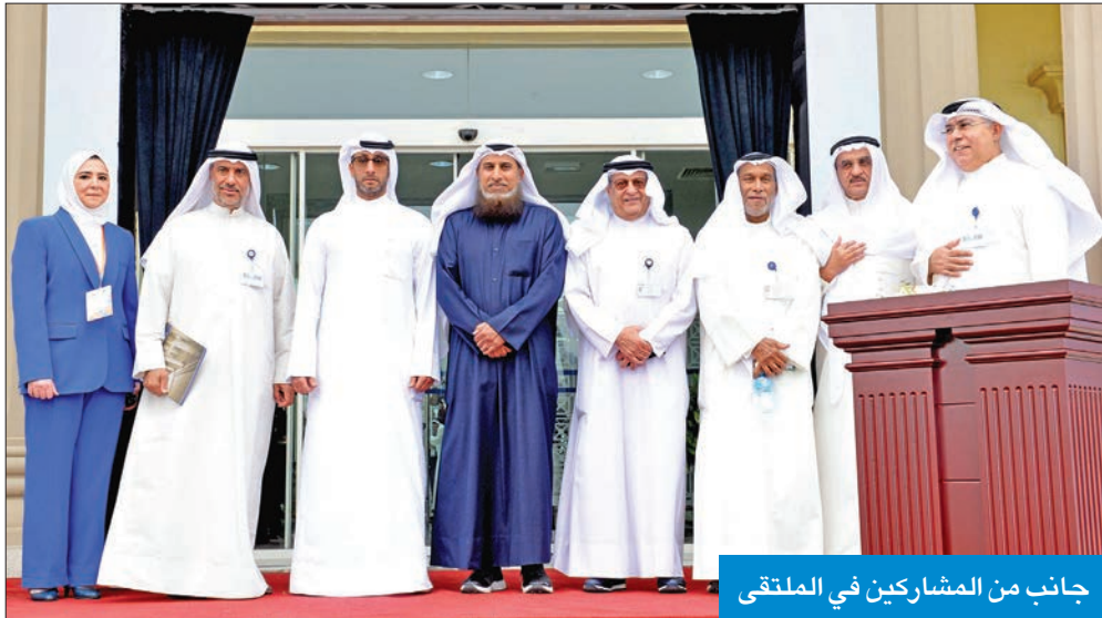
جانب من المشاركين في الملتقى

الغانم: «العدل» تأمل الخروج بتوصيات إيجابية في مجال الإدارة والقانون