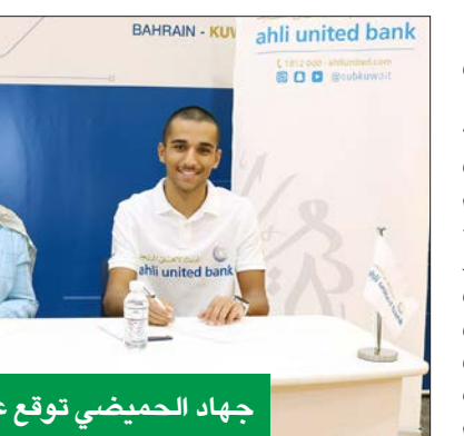
جهد الحمضي توقع عقد الرعاية مع الدعيج

شارك في مؤتمر «الكويت: نحو اقتصاد رقمي»، الذي نظّمته مجموعة ذا بزنس بير العالمية المتخصصة بالأخبار والأبحاث الاقتصادية، بالشراكة مع هيئة تشجيع الاستثمار المباشر في الكويت (KDIPA)، في فندق فور سيزون بالعاصمة الكويت.