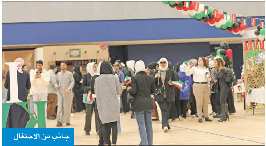
جانب من الاحتفال

وتتضمن الرؤية المستقبلية للكويت الأمل في أن يصبح شباب اليوم قادة ورواد الغد. وتذكر الجامعة دورها كصرح تعليمي متميز في تحقيق هذه الرؤية، وتفخر بتزويد طلبتها بتجربة تعليمية أصيلة تساعد، ليس فقط على المستوى الأكاديمي والمهني، بل تدعمهم لتطوير هوية وطنية فريدة.