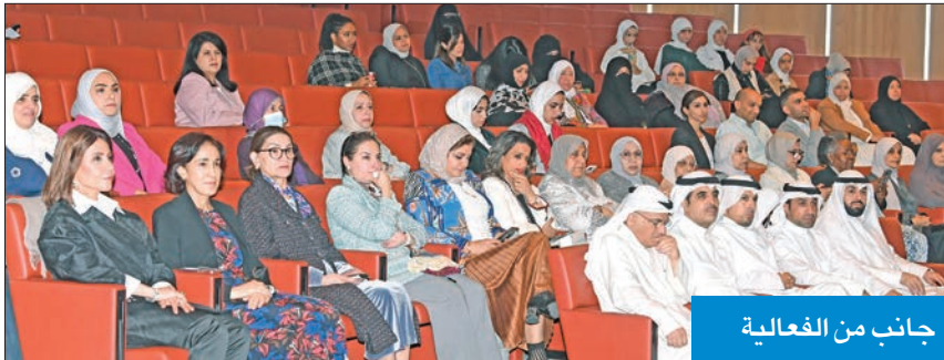
جانب من الفعالية

الدبيس: المرأة تميزت في المجالات العلمية بالكويت بنسبة 53.2%