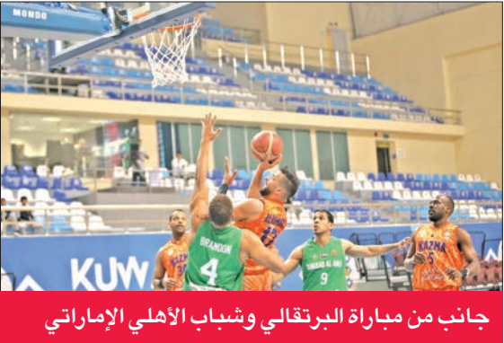
جانب من مباراة البرتغالي وشباب الأهلي الإماراتي