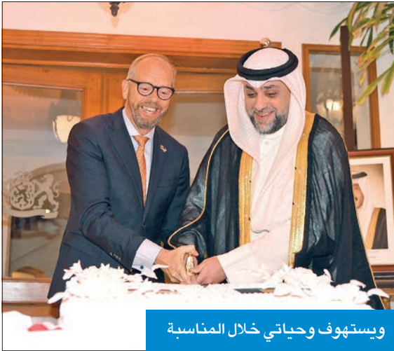
ويستوف وحياتي خلال المناسبة

وأشار إلى أن رحلات الخطوط الجوية الملكية الهولندية ستصبح قريباً رحلات مباشرة بين عاصمتي البلدين بشكل يومي بدلاً من ستة أيام بالأسبوع. لهذا فإنه من الحق أن نستنتج أن العلاقات بيننا تنمو من قمة إلى قمة أعلى».