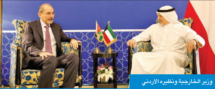
وزير الخارجية ونظيره الأردني

تمت مناقشة التطورات الراهنة على الساحتين الإقليمية والدولية، ومنها المستجدات الأخيرة للقضية الفلسطينية، والأحداث التي تشهدها الساحة السورية. كما التقى الصباح وزير الشؤون الخارجية والهجرة والتونسين بالخارج في تونس، نبيل عمار، وتم خلال اللقاء بحث العلاقات الثنائية بين البلدين، وتنسيق المواقف حيال المواضيع والقضايا المطروحة في الاجتماع الوزاري، وتعزيزاً لمسيرة العمل العربي المشترك. كما تم بحث المستجدات على الصعيدين الإقليمي والدولي، لاسيما التطورات الراهنة على الساحة في تونس.