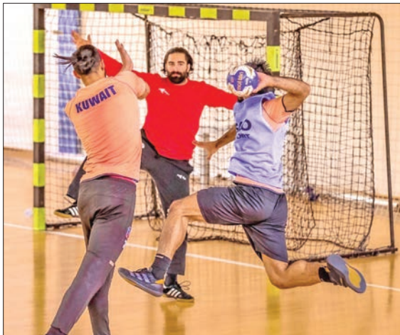
جانب من تدريبات نادي الكويت في معسكره بصربيا

بالمجموعة الثانية للبطولة الخليجية التاسعة والثلاثين للأندية أبطال الكؤوس، المقامة حالياً في البحرين. وتسبقها في الخامسة مساءً مباراة الصفا السعودي مع الشارقة الإماراتي ضمن نفس المجموعة.