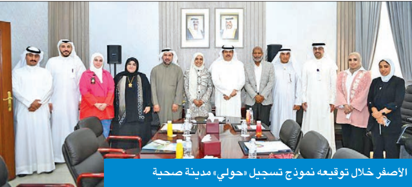
الأصفر خلال توقيعه نموذج تسجيل «حولي» مدينة صحية

أكد ضرورة تضافر الجهود لتطبيق جميع الاشتراطات المطلوبة