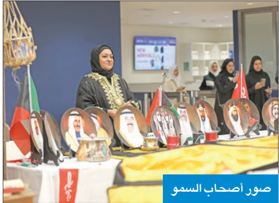
صور أصحاب السمو