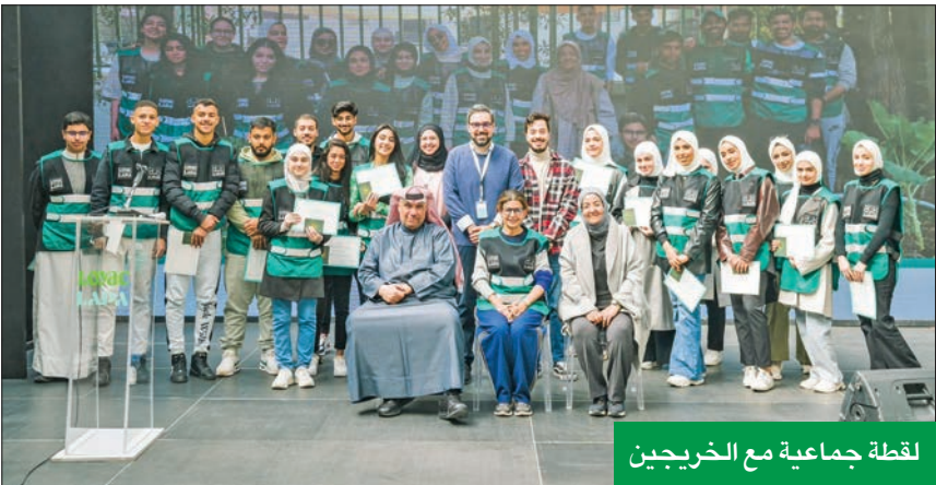
لقطة جماعية مع الخريجين