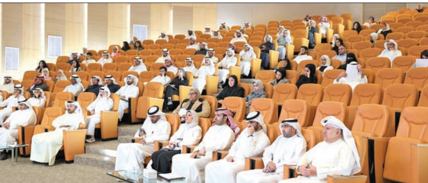
جانب من اليوم الوظيفي للقوى العاملة

الكهربائية 22 ميغاواط، وأسفر الحادث عن إصابة 4 موظفين. وأشارت الوزارة إلى أن الانفجار أدى إلى انقطاع التيار الكهربائي عن أجزاء من منطقة السالمية، وعلى الفور توجهت فرق الإطفاء العام ووزارة الداخلية وفرق الطوارئ التابعة للوزارة وقامت بإجراء اللازم. وبيئت أنه جارٍ الكشف على المحطة ونقلهم على الأساب التي أدت إلى وقوع الحادث، لافتة إلى أنه تم إعادة التيار بشكل تدريجي من الساعة 1:30 ظهراً وتمت إعادة المحطة إلى الخدمة في تمام الساعة 2:30 بعد الظهر.