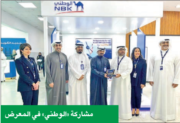
مشاركة «الوطني» في المعرض

بوفرها البنك، والتي تشمل برامج تدريبية احترافية تواكب المعايير العالمية وتساهم في صقل مهارات وكفاءات الشباب بما يضمن لهم تحقيق مستقبل وظيفي واعد ومسيرة مهنية مستدامة. وتسعى استراتيجية «الوطني» في التوظيف دائماً إلى جذب أفضل المواهب وتدريبهم وتنمية قدراتهم ومهاراتهم بأفضل البرامج، حتى يتمكنوا من بناء مسيرة مهنية ناجحة تساعدهم على تتبوء مناصب قيادية داخل البنك في المستقبل، وهو ما يجعل «الوطني» جهة العمل المفضلة في القطاع الخاص بين أوساط الكويتيين حديني التخرج، كما يتمتع البنك بأعلى معدلات الاحتفاظ بالموظفين الكويتيين.