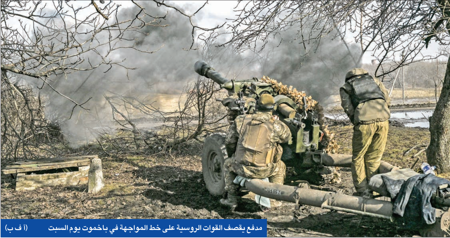
مدفع يقصف القوات الروسية على خط المواجهة في باخموت يوم السبت

برلين تدعو للتريث بعد نشر تحقيق يتهم جماعة روسية معارضة مرتبطة بأوكرانيا بتفجير «نورد ستريم»