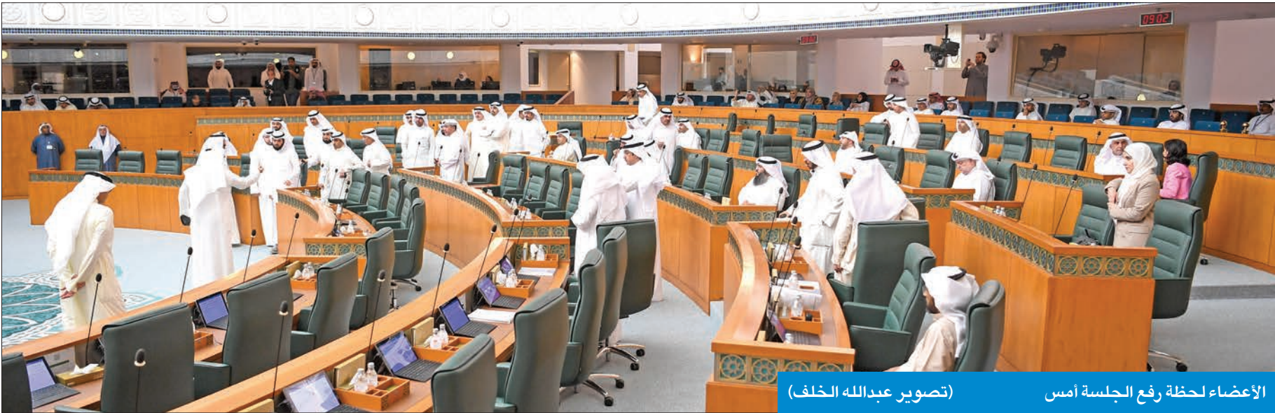
الأعضاء لحظة رفع الجلسة أمس

إما أن تحضرها أو استجواب رئيس الوزراء • السعدون رفع العادية والتكميلية: الحكومة اعتذرت رسمياً