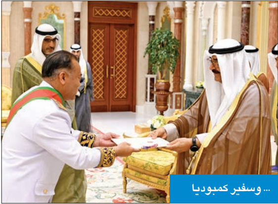
... وسفير كمبوديا