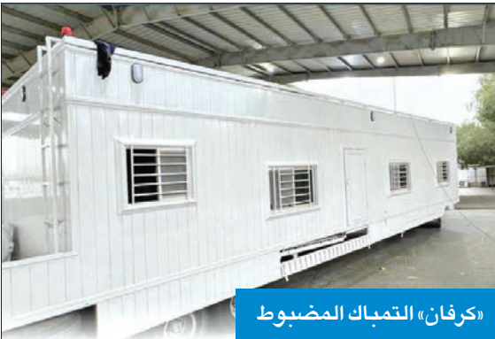
«كرفان» التباك المضبوط

الصادرة بهذا الشأن، تبعاً لتعليمات وزارتي التجارة والصحة، كانت مخبأة بطريقة احترافية، وتحتوي على 422 ألف حبة بوزن إجمالي 13 ألف كيلوغرام تقريباً، وعليه تم اتخاذ الإجراءات الجمركية اللازمة. وذكر الظفيري أن الإدارة العامة للجمارك تحذر كل