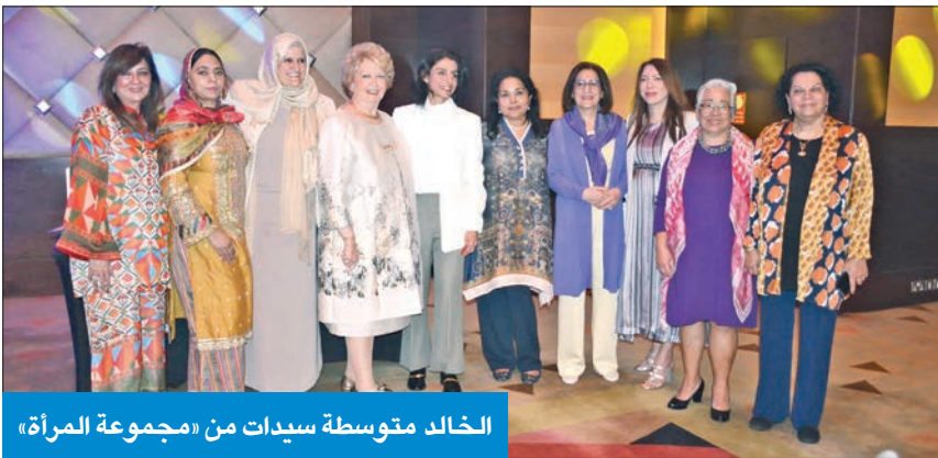
الخالدة متوسطة سيدات من «مجموعة المرأة»

احتفلت مجموعة المرأة الدولية باليوم العالمي للمرأة بحضور النائب عالية الخالد، ومشاركة سفيرة إندونيسيا لدى البلاد ليندا ماريانا، وسفيرة كندا عليا مواني، وسفيرة تركيا طوبى سونمز، وسفيرة أستراليا ميليسا كيلي، والقائمة بأعمال سفراء غيئات التعاونية نيرا دروخي، إضافة إلى السفراء الفلسطيني رامي طهبوب، والمصري أسماء شلتوت، والمكسيكي ميغيل إيسيدر، والإيطالي كارلو بالدوتشي، الذين قدموا الورود لعضوات «المرأة الدولية» والضيفات. وتضمن الحفل حلقة حوارية بعنوان «تمكين المرأة» إذ قدمت رئيسة المجموعة غادة شوقي، حرم السفير المصري لمحة عامة عن تاريخ وأهمية يوم المرأة العالمي. وإثناء حديثها عن «العوائق» في حياتها المهنية، أشارت