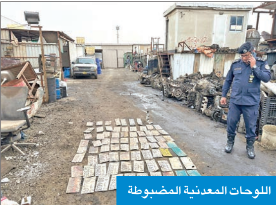
اللوحات المعدنية المضبوطة

يحتفظ بها في إحدى ورش السكراب، مما يعّد مخالفة مرورية وأمنية جسيمة، حيث إنّ هذه اللوحات يفترض أن تسلم لإدارة العامة للمرور في حال تسقيط المركبة أو «سكربتها»، ولا يجوز الاحتفاظ بها في ورش السكراب لأي سبب من الأسباب.