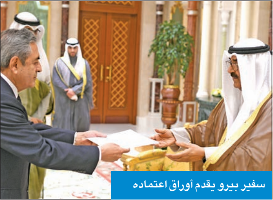
سفير بيرو يقدم أوراق اعتماد