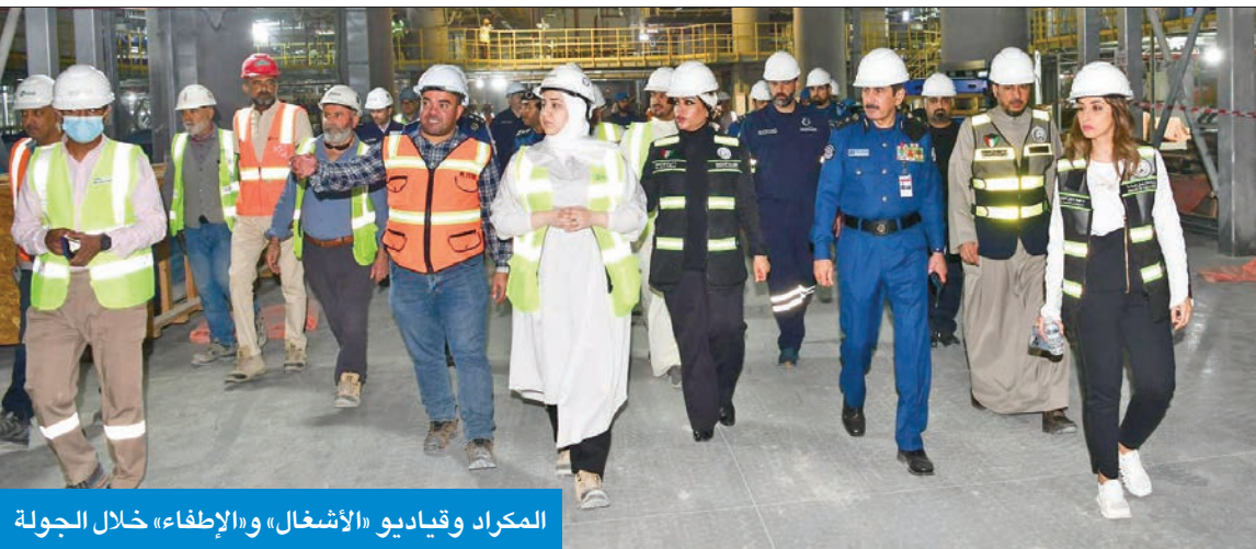
المكراد وقياديو «الأشغال» و«الإطفاء» خلال الجولة