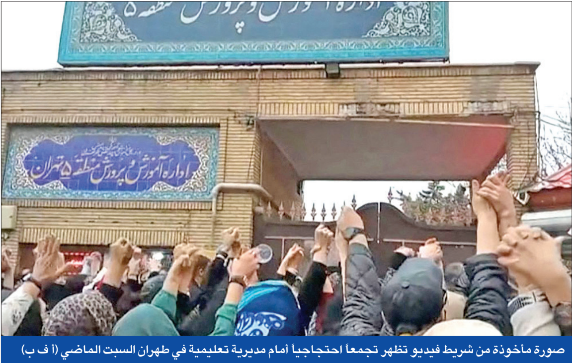
صورة مأخوذة من شريط فيديو تظهر تجمعاً احتجاجياً أمام مديرية تعليمية في طهران السبت الماضي

مع تواصل تسجيل مئات حالات التسمم التي تطول تلميذات بقلن إتهن بعاينين ضيقاً في التنفس وغثياناً من جزاء روائح أو غازات غير معروفة، وسط غموض بشأن الجهة التي تقف وراء الحوادث التي تصاعدت خلال الأسبوعين الماضيين، نزلت وقفات احتجاجية، أمس، في عشرات المدن الإيرانية، للمطالبة بتوفير الأمن في المدارس.