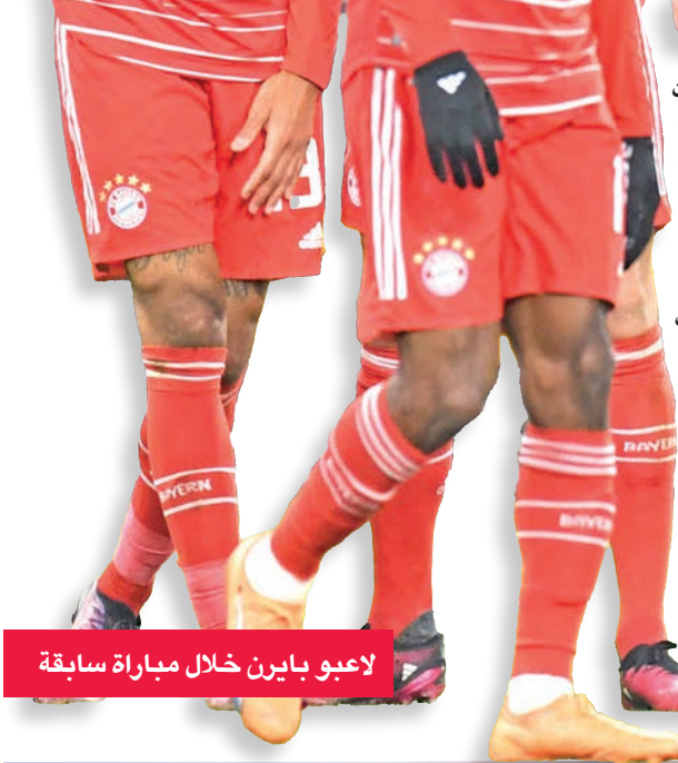
لاعبو بايرن خلال مباراة سابقة

توتنهام الذي يعيش موسماً متذبذباً. وغاب كونتي أربع مباريات عن توتنهام بعد خضوعه لجراحة استئصال المرارة في إيطاليا، بينها الخسارة أمام شيفيلد يونايتد من المستوى الثاني 1-0 في الدور الخامس من مسابقة الكأس. لم يحزن توتنهام أي لقب منذ 2008، وحتى قدوم مدرب من طراز كونتي لم ينجح حتى الآن في إعادته إلى سكة الألقاب. ويحتاج فريق شمال العاصمة لرفع معنوياته قبل لقاء الرء أمام ميلان الذي اقتنص فوزاً مهماً، بهدف مبرك لإسباني إبراهيم دياس في لقاء الذهاب على ملعب سان سيرو.