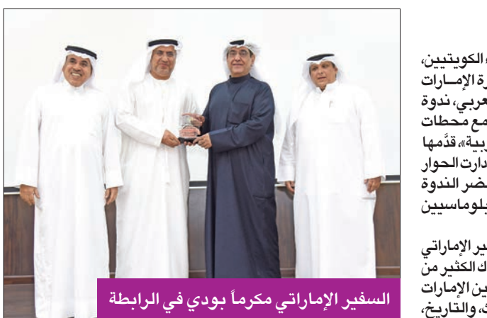
السمير الإماراتي مكرماً بودي في الرابطة

ومن المرتقب تكريم الفرق الفائزة بحفل الختام، والتي تنافس على 13 جائزة، بعد إلغاء جائزة أفضل عرض متناغم مع استحداث جائزة أفضل تأليف مسرحي، وهي جائزة مختلفة عن أفضل نص مسرحي شارك في المسابقة الرسمية، حيث إنه من المسموح أن يشارك بها من تتوافر فيه شروط المسابقة، سواء لديه نص مسرحي شارك في المهرجان أو لا.