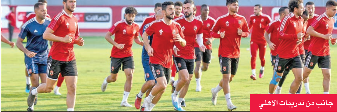
جانب من تدريبات الأهلي

فريق القطن الكامبروني في 17 مارس ضمن الجولة الخامسة.