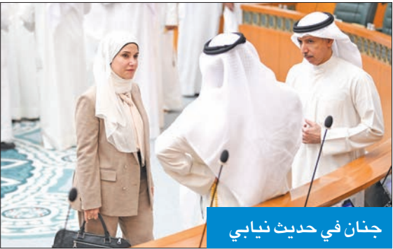
جنان في حديث نيابي

وجاء قرار رفعها وسط اعتراض عدد من النواب تقدمهم النائب د. عبد الكريم الكندري الذي قال موجهاً حديثه للسعدون: «علنا نقطة نظام حتى يعثر النواب عن رأيهم، ومع كل التقدير للعلم بو عبد العزيز، إلا أن قرار رفع