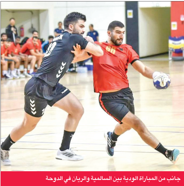
جانب من المباراة الودية بين السالمية والريان في الدوحة

والمنظم وفرض إيقاعه على مجريات اللقاء. في المقابل، سيسعى مدرب النجمة البحريني سيد فلاح هو الآخر لفرض أسلوبه على اللقاء والتصدي لقوة هجوم السماوي بالدفاع المتقدم لحصد أول نقطتين.