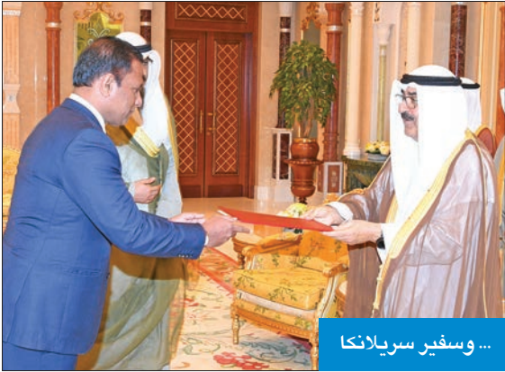
... وسفير سريلانكا