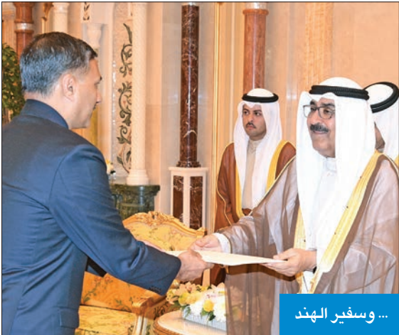
... وسفير الهند