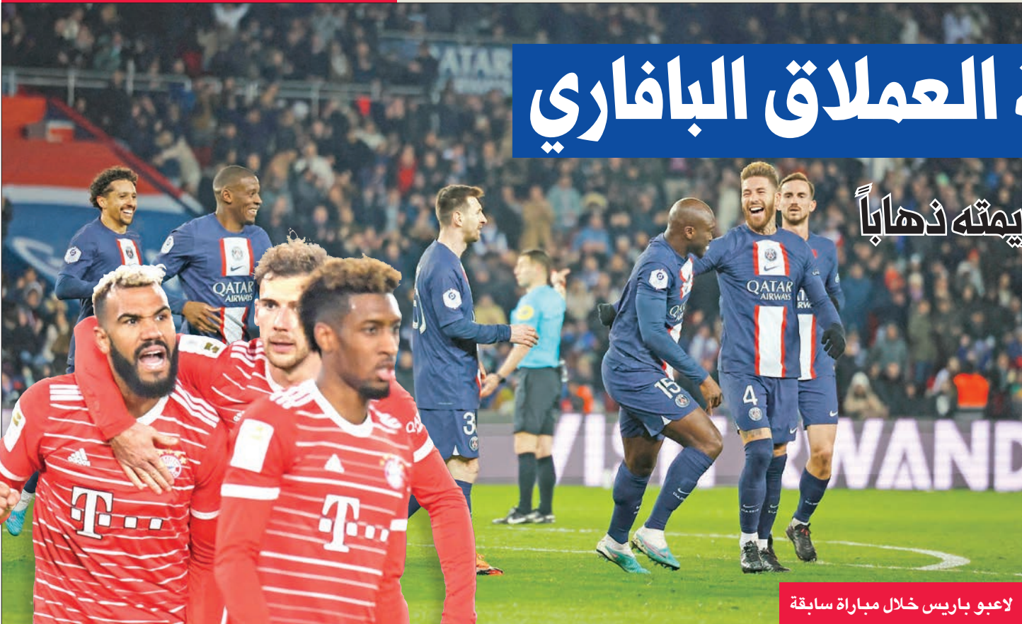
لاعبو باريس خلال مباراة سابقة