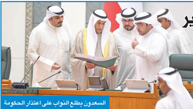
السعدون يطلع النواب على اعتذار الحكومة

صحة انعقاد الجلسات بحضور الحكومة، استناداً إلى نص المادة 97 التي تحدّد بشكل مباشر صحة انعقاد الجلسات، محذراً سمو رئيس مجلس الوزراء من مواجهة الاستجواب إذا قدم تشكيلاً حكومياً دون الطموح. ولفت إلى أن النواب سبق أن استجوبوا رئيس الوزراء السابق الشيخ صباح الخالد في موضوع اختيار الوزراء، مشدداً على أن الاحترام للدستور وإرادة الشعب أساس التعاون بين السلطتين. واعتبر السويط أن هروب الحكومة في جلسة 10 يناير 2023 وغيابها عن الجلسات التالية لا يتمّ عن تعاون أو احترام للدستور، مضيفاً أن الدستور الكويتي واضح ومواده محددة بـ 183 مادة من بينها مادة تتحدث بشكل مباشر عن صحة انعقاد الجلسات، وهي المادة 97 من الدستور. وطالب رئيس مجلس الأمة بالاحترام إلى الدستور، مؤكداً أن الرأي العام هو المعلم في كل وثيقة دستورية. وقال إن «الناس علّقوا آمالاً كبيرة على هذا المجلس، ولكن أي منصف يعلم أن الحكومة هي من تتحمل المسؤولية، وهي من غابت عن الجلسات وهربت من مواجهة الاقتراحات التي تقدّم بها النواب لترجمة البرنامج الإصلاحي». وأكد أنه «في جلسة 21 مارس إذا لم يأت رئيس الوزراء بحكومة تلتبي طموحات الشعب الكويتي فستقدم باستجوابه والنائب خالد العتيبي ومن يرغب من النواب في المشاركة في تقديمه» مؤكداً «لن نجامل أبداً كان على مستقبل الكويت، والتي لا تستحق هذا الانحدار التقيفي الذي تعيشه هذه الأيام».