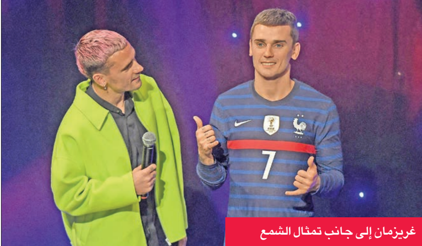
غريزمان إلى جانب تمثال الشمع

أهم المزارات السياحية، حيث يستقبل سنوياً نحو 700 ألف زائر.