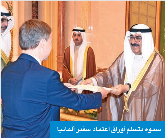
سموه يتسلم أوراق اعتماد سفير ألمانيا