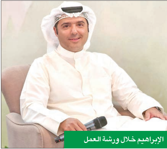
الإبراهيم خلال ورشة العمل

«بعضها اختار عدم زيادة الأسعار للحفاظ على الحصة السوقية»