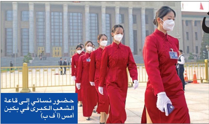
حضور نسائي إلى قاعة الشعب الكبرى في بكين أمس

تضع فيتو على فرنجية، بخلاف الموقف السعودي. وبعد إعلان أمين عام حزب الله حسن نصرالله تبني فرنجية، غرد البحاري قائلاً: «ظاهرة الشفاء الساكنين في الاستحقاقات الثنائية تقضي التامل لتكرارها نطقاً وإعراباً، وخالصة القول هنا: إذا التقى ساكنان فيتم التخلص من أولهما؛ إما حذفاً إذا كان معطلاً، أو بتحريك أحدهما إن كان الساكن صحيحاً». وهذه الآلية في إطلاق المواقف تستند إلى الدبلوماسية الرمزية، التي يتقنها البحاري ويمر من خلالها مواقف، ما بين النقاط والسطور وبطريقة بلاغية هادفة. بحسب ما تقول مصادر متابعه فإن المقصود بالفرنجية، هو وجوب حذف المرشح الذي ينطبق عليه ظرف العلة، وهنا المقصود بفرنجية والعلة ليست بشخصه بل بسبب موقعه السياسي وبسبب أن انتخابه سيؤدي إلى غلبة طرف على حساب الآخر وهذا أمر لن يكون في صالح لبنان، أما الساكن الثاني المقصود بالفرنجية فتشير المصادر إلى أن المقصود كان أن تبقى ملتزمة بهدف