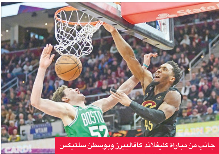
جانب من مباراة كليفلاند كافاليرز وبوسطن سلتيكس