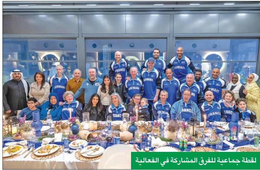
لقطة جماعية للفرق المشاركة في الفعالية

وتأتي رعاية stc تقديراً للمهرجان الضخم الذي أصبح الآن جزءاً لا يتجزأ من احتفالات البلاد بالأعياد الوطنية. وكجزء من الرعاية، امتلكت stc طائرتها الورقية الفريدة التي تم تصميمها بصورة إبداعية كسائر الطائرات الرئيسية الأخرى. كما نظمت stc في قريتها بالمهرجان مسابقات وأنشطة مع جوائز تم توزيعها في أجواء احتفالية على الحضور.