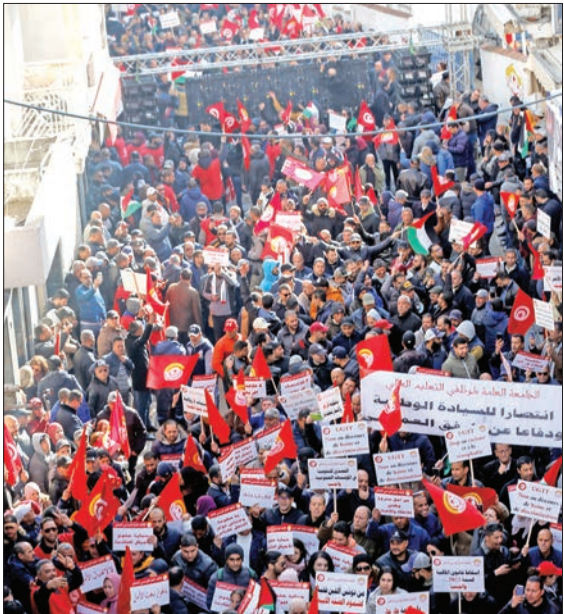
جانب من تظاهرة اتحاد الشغل في العاصمة التونسية أمس

تظاهر الآلاف من أنصار «الاتحاد العام التونسي للشغل» في العاصمة، أمس، تنديداً بـ«استهداف الحريات النقابية والعامّة»، في وقت انتقد نورالدين الطوبوي، الأمين العام للاتحاد النقابي النافذ، خطاب الرئيس التونسي قيس سعيد الأخير، الذي حذر فيه من مشاركة أجانب في التظاهرات، وتطرّقه إلى أحداث «الخميس الأسود» الدامية التي وقعت خلال تظاهرات للاتحاد في عام 1978.