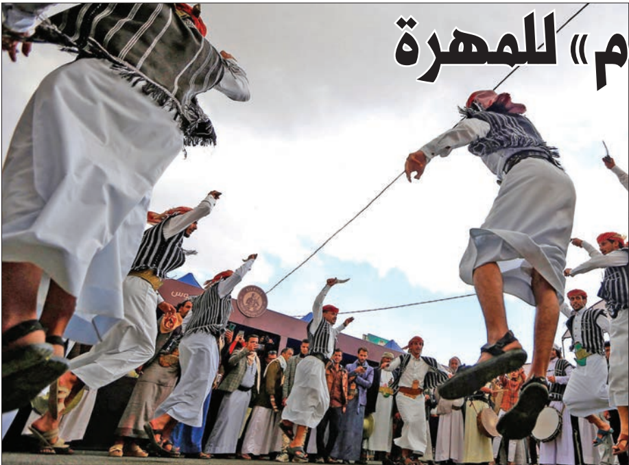
يمنون يؤدون رقصة تقليدية خلال مؤتمر تسويقي للبن المحلي في صنعاء بداية الشهر الجاري

اتهمت جماعة «أنصار الله» الحوثية اليمنية، أمس، الولايات المتحدة وبريطانيا بالسعي إلى «احتلال اليمن عبر التدفق المستمر لقواتها، وبناء قواعد عسكرية على الأراضي اليمنية، في محافظتي المهرة وحضرموت شرق اليمن، متوعدة بإرغام هذه القوات على المغادرة». وجاء ذلك خلال تعليق عضو المكتب السياسي للحوثيين علي القحوم على زيارة قائد القوات البحرية للقيادة الوسطى الأميركية (سنتكوم)، الذي يتولى كذلك قيادة الأسطول الخامس الأميركي في البحرين والقوات البحرية المشتركة، نائب الأدميرال براد كوبر، برفقة السفير الأميركي في اليمن ستيفن فاغن، إلى مدينة الغيضة، مركز محافظة المهرة اليمنية. وجاء في بيان لقيادة بحرية «سنتكوم» أن كوبر وفاغن ناقشا خلال زيارة الغيضة، الأربعاء الماضي، مع قادة من حفر السواحل اليمني، «جهود الأمن البحري الإقليمي والفرص المستقبلية لتعزيز التعاون البحري الثنائي والمتعدد الأطراف».