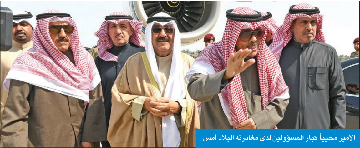
الأمير محبياً كبار المسؤولين لدى مغادرته البلاد أمس