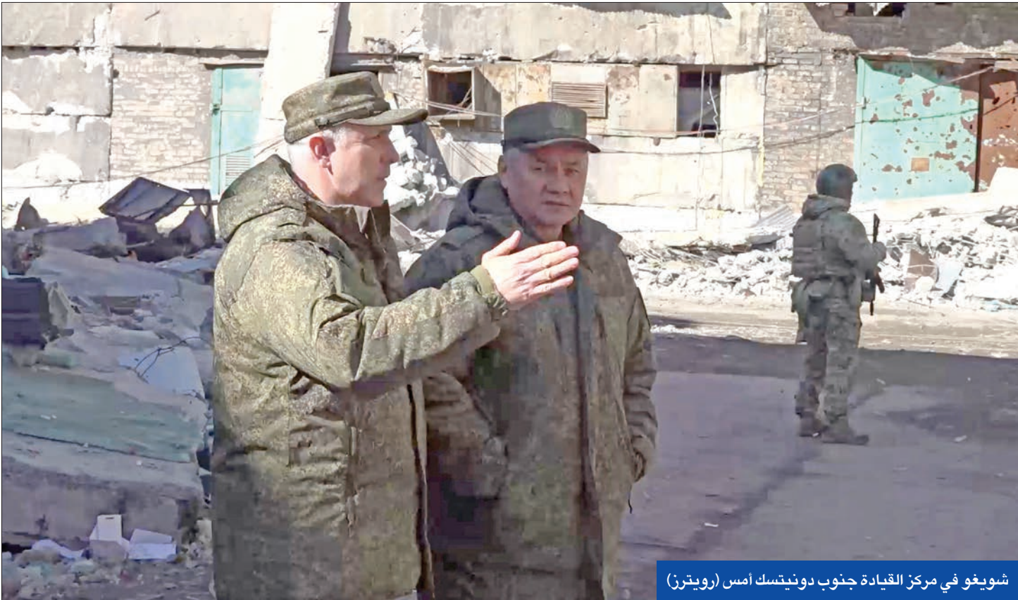
شويغو في مركز القيادة جنوب دونيتسك امس

مع وصول وزير الدفاع الروسي إلى دونيتسك، في زيارة مفاجئة، حققت مجموعة فاغنر المزيد من التقدم في مدينة باخموت، التي تشهد معارك شرسة مع القوات الأوكرانية، في وقت وجّهت الولايات المتحدة وألمانيا رسالة وحيدة وتحذير لروسيا والصين.