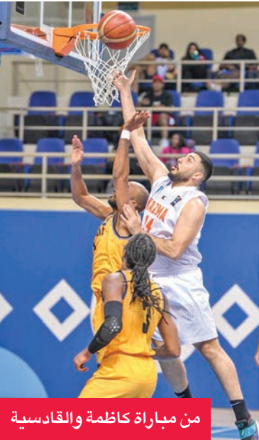
من مباراة كاظمة والقادسية

حقق الفريق الأول لكرة السلة بنادي كاظمة فوزاً مستحقاً على نظيره القادسية بنتيجة 83-73، في المباراة التي جمعت الفريقين أمس الأول على صالة الاتحاد، ضمن منافسات الجولة الثانية من الدور الثاني لبطولة الدوري العام لكرة السلة، وبذلك رفع كاظمة رصيده إلى 4 نقاط، والقادسية 3 نقاط.