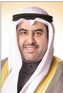
● جراح الناصر

أصدر وزير المالية وزير الدولة للشؤون الاقتصادية والاستثمار، عبدالوهاب الرشيد، قراراً بتعديل بعض أحكام قرار بتشكيل لجنة لاستثمار أموال المؤسسة العامة للتأمينات الاجتماعية وتحديد اختصاصاتها.