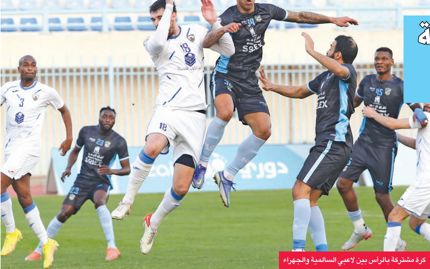
كرة مشتركة بالراس بين لاعبي السالمية والجهراء