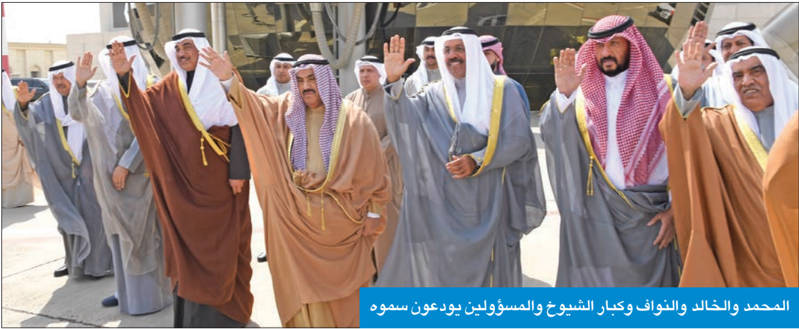
المحمد والخالد والنواف وكبار الشيوخ والمسؤولين يودعون سموه

صاحب السمو: انطلاق «كرو 6» للفضاء إنجاز تاريخي إماراتي وعربي يمثل فخراً واعتزازاً للجميع