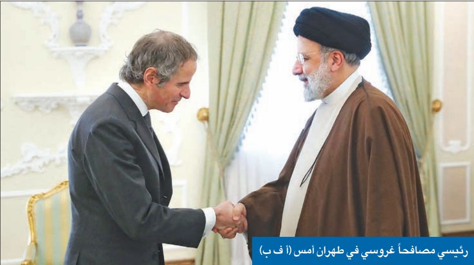
رئيسي مصافحاً غروسي في طهران أمس

أكد مصدر رفيع المستوى في وزارة الخارجية الإيرانية، لـ «الجديدة»، أنه تم تكليف جميع السفراء الإيرانيين في الدول المجاورة، بالاتصال مع حكومات الدول التي يقيمون فيها لإبلاغهم رسالة مفادها أن إيران تسعى إلى السلام مع كل دول الجوار، والتعاون من أجل ضمان الأمن الإقليمي، وهي تؤيد حل أي خلافات عبر السبل الدبلوماسية، وفي الوقت نفسه تحذر من أنه في حال سمحت أي دولة باستخدام أراضيها أو أجوائها أو مياهها الإقليمية لأي تحرك عدائي تجاهها من جانب إسرائيل أو الولايات المتحدة فستعتبر طهران هذا الأمر تصرفاً عدائياً مباشراً تجاهها من قبل هذه الدولة وسوف يترتب على ذلك رد إيراني مباشر. وأوضح المصدر أن طهران تنوي في الأيام المقبلة بعث رسالة إلى واشنطن عبر السفارة السويسرية التي تتولى رعاية المصالح الأميركية في طهران مفادها أن إيران تعتبر أن أي هجوم إسرائيلي من أي