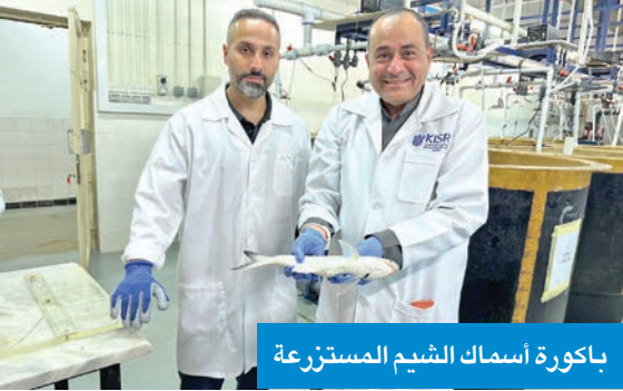
باكورة أسماك الشيم المستزعة