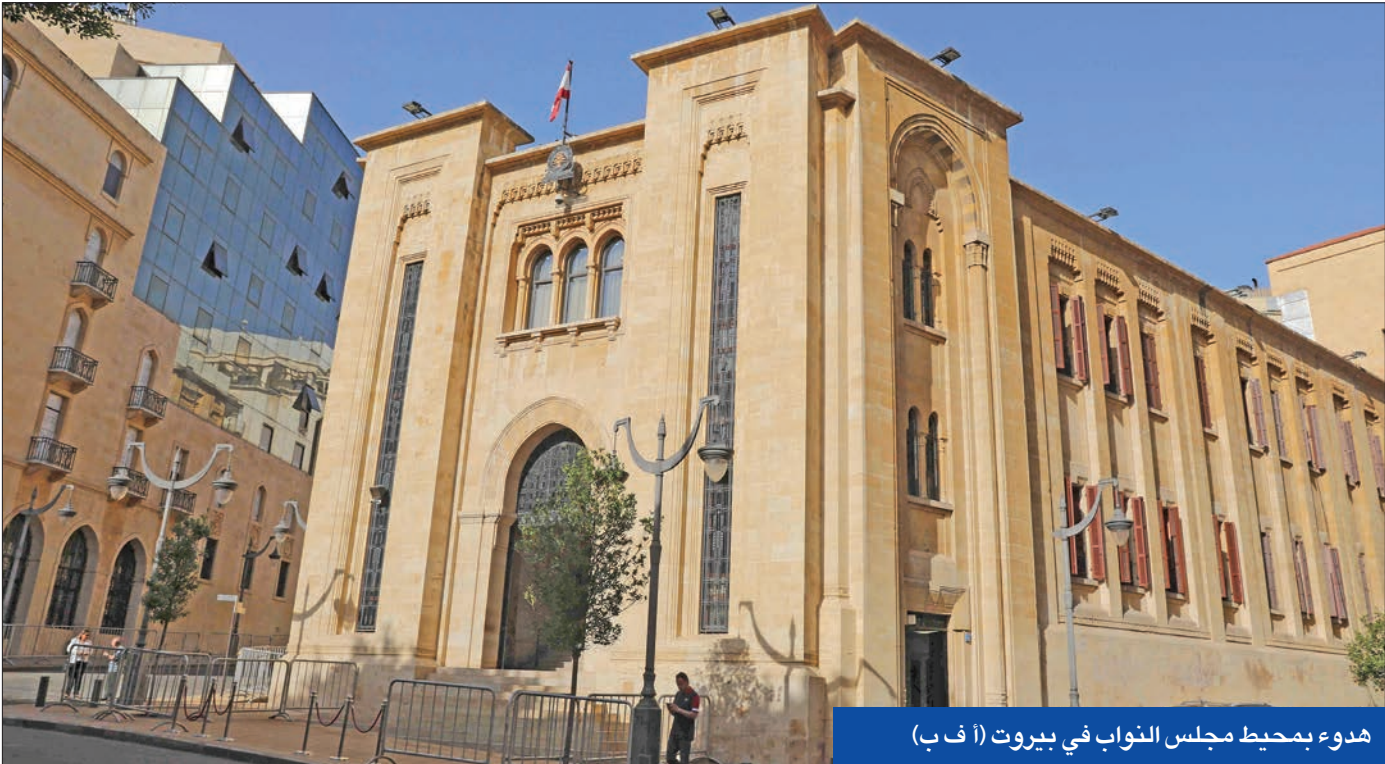
هدوء بمحيط مجلس النواب في بيروت

ارتفع منسوب التوتر السياسي إلى أعلى درجاته، بعد أن حفل رئيس مجلس النواب اللبناني نبيه بري الصراعات المارونية مسؤولية الفشل في انتخاب رئيس جديد للجمهورية، وهو ما ردت عليه القوى السياسية المسيحية باتهام «الثنائي الشيعي» الذي يجمع حركة أمل، التي يتزعمها بري، و«حزب الله»، بالسعي لفرض مرشحه للرئاسة من دون إقامة أي اعتبار للقوى الأخرى. ووسط انسداد كامل في أفق البحث عن نسوية أو عن اتفاق، حاولت «الجريدة» استمرازا آراء الكتل المختلفة حول رؤيتها للمرحلة المقبلة، وإمكانية تجنب المزيد من التصعيد، وما هي رؤية هذه الكتل للخروج من الأزمة.