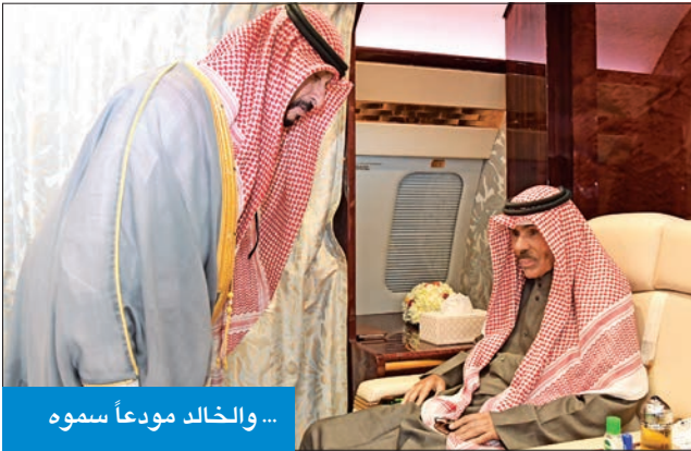
... والخالد مودعاً سموه

على سموهما موفور الصحة والعافية، وأن يحقق لدولة الإمارات وشعبها الشيق كل ما يتطلع إليه من تقدم وإزدهار في ظل القيادة الحكيمة لأخيه رئيس دولة الإمارات العربية المتحدة، من جهة أخرى، بعث سموه ببرقية تهنئة إلى رئيس بلغاريا الصديقة، رومين راديف، عَبرَ فيها سموه عن خالص تهانئه بمناسبة العيد الوطني لبلاده، متمنياً سموه له موفور الصحة والعافية، ولبلغاريا وشعبها الصديق كل التقدم والازدهار.