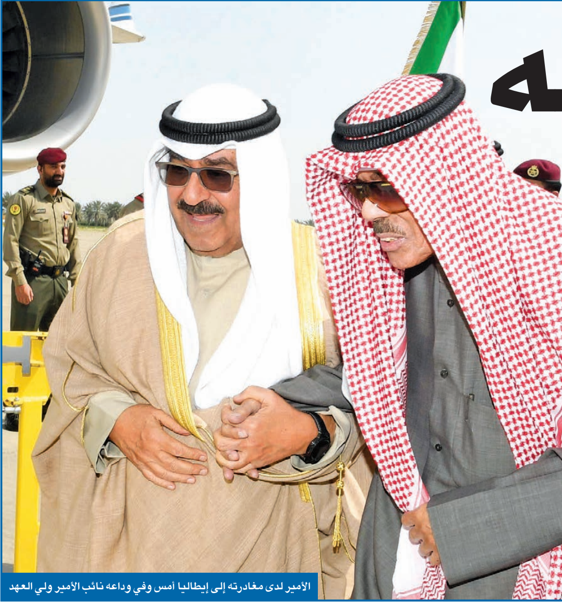
الأمير لدى مغادرته إلى إيطاليا أمس وفي وداعه نائب الأمير ولي العهد