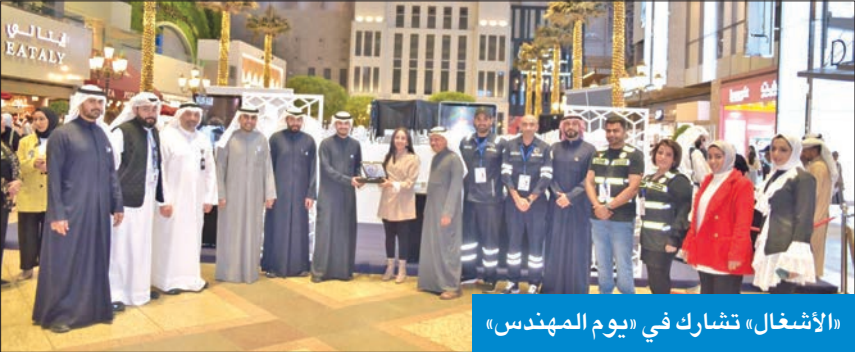
«الأشغال» تشارك في «يوم المهندس»