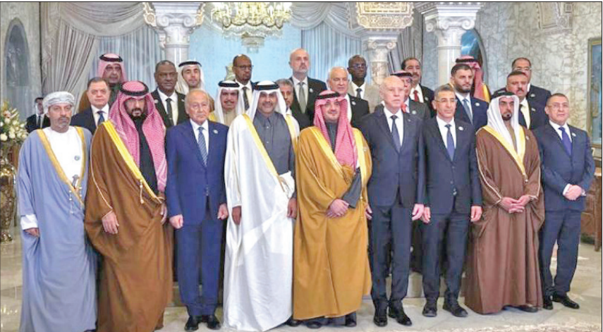
الرئيس التونسي والخالد ووزراء الداخلية العرب خلال أعمال الدورة الأربعين لمجلسهم