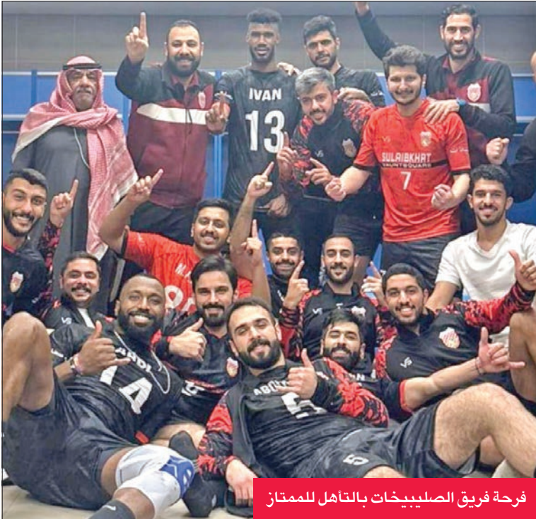
فرحة فريق الصليبيخات بالتأهل للممتاز

حسم الفريق الأول لكرة الطائرة بنادي الصليبيخات تأهله رسمياً للدوري الممتاز قبل جولة واحدة من نهاية منافسات دوري الدرجة الأولى، أمس الأول، إثر فوزه على البرموك بنتيجة 3 - صفر في المباراة التي جمعت الفريقين على صالة الاتحاد بجمع الشيخ سعد العبدالله ضمن الجولة الحادية عشرة التي شهدت أيضا فوز الشباب على التضامن بنتيجة 3 - 2.