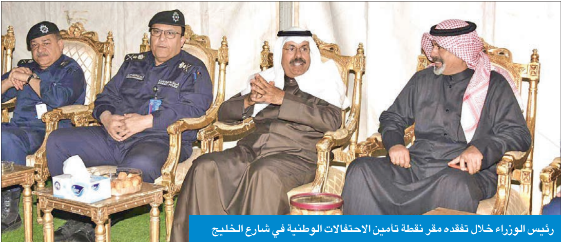
رئيس الوزراء خلال تفقده مقر نقطة تأمين الاحتفالات الوطنية في شارع الخليج

كاترينا ساكيلاروبولو، ضمنها خالص تعازيه وصادق مواساته بضحايا حادث تصادم قطارين في مدينة لاريسا وسط اليونان.