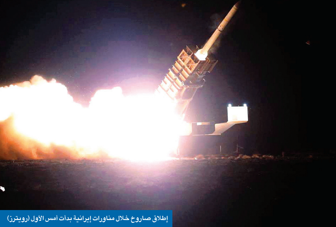
إطلاق صاروخ خلال مناورات إيرانية بدأت أمس الأول

● «البنتاغون» وضعت ميزانية طوارئ للحرب مع إيران وتحذر من إمكانية صنعها قنبلة ذرية في 12 يوماً