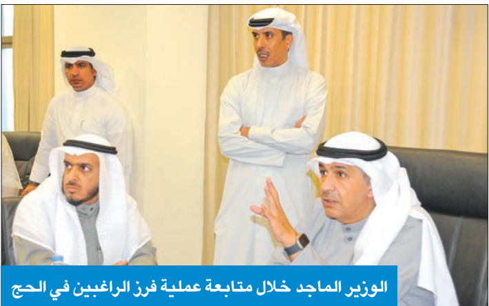
الوزير الماجد خلال متابعة عملية فرز الراغبين في الحج

وأشار إلى تقدم وزارة الأوقاف بطلب للجهات المختصة في المملكة العربية السعودية، لزيادة عدد حجاج الكويت، «وتقدمنا بطلب آخر للسماح بحج المقيمين بصورة غير قانونية (البدون)، ونتتظر موافقة الجهات المختصة على طلباتنا».