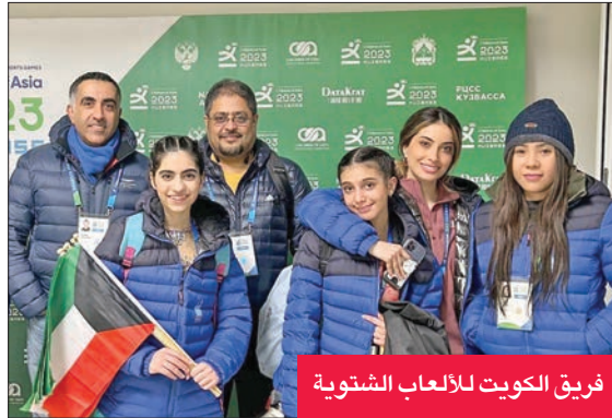
فريق الكويت للألعاب الشتوية