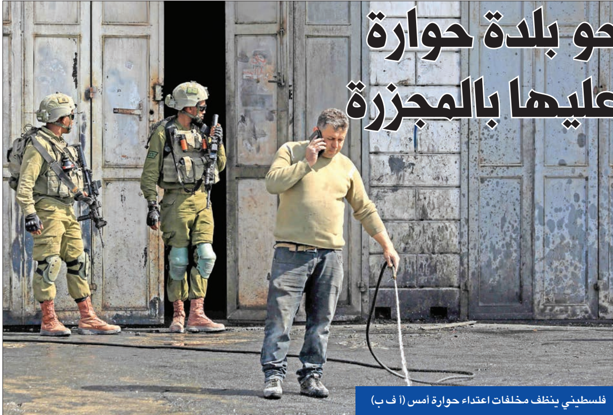
فلسطيني ينظف مخلفات اعتداء حوارة أمس

وأثارت الخطوة غضب وزير الأمن القومي إيتبار بن غفير، الذي اتهم المستشار بالانحياز