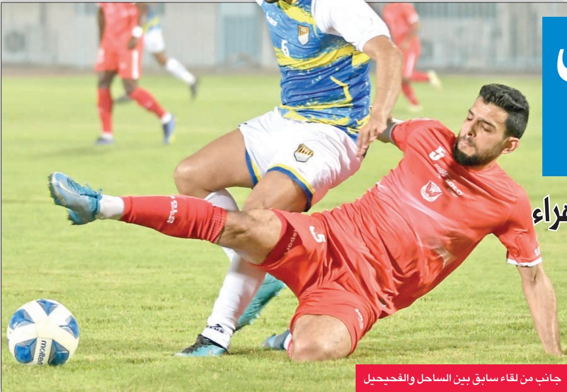
جانب من لقاء سابق بين الساحل والفحيحيل