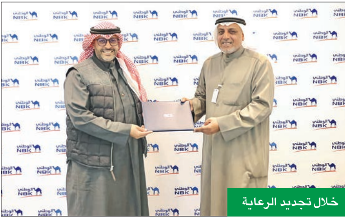
خلال تجديد الرعاية

يحرص بنك الكويت الوطني على دعم جميع المبادرات التي تساهم في تعزيز مفاهيم الاستدامة والحفاظ على البيئة. وفي هذا الإطار، أعلن البنك تجديد رعايته لفريق الغوص الكويتي للسنة الثانية على التوالي. ويهدف البنك من خلال هذه الرعاية إلى التوعية بأهمية الحفاظ على البيئة البحرية وشعابها المرجانية ومخاطر إلقاء المخلفات الضارة في البحر. من جانبه سيقوم فريق الغوص الكويتي بتأهيل وحماية البيئة البحرية، وتشجيع العمل التطوعي لخدمة البيئة البحرية، من خلال إعداد كوادر وطنية متخصصة بالعمليات البحرية وصيانة العلاقات المرجانية.