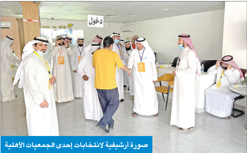
صورة أرشيفية لانتخابات إحدى الجمعيات الأهلية

وأشارت إلى أهمية تعاون الناخبين في الاطلاع على الجداول الانتخابية خلال فترة عرضها في كل لجنة لممارسة حقوقهم وواجباتهم في تثقية الجداول حتى تكون معبرة عن الواقع والتقدم بطلبات الاعتراض إن وجدت على القيد والتي ستعتبر نهائية بالنسبة إلى كل اسم لم يتقدم أحد بالاعتراض عليه.