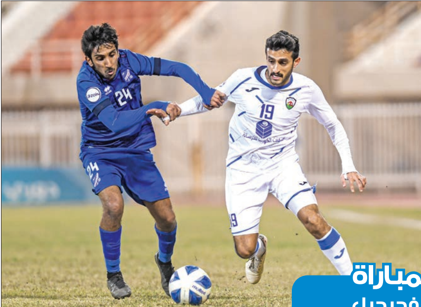
لقاء الجهراء والتضامن في الجولة 12