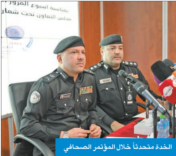
الخدة متحدثاً خلال المؤتمر الصحفي

واحد بالعمل في لجنة أسبوع المرور الخليجي، مضيفاً؛ سنعمل بكل طاقتنا دون كلل أو ملل، وعلى ضوء ذلك كان تركيز عملنا هو نشر التوعية المرورية، مما سيكون له الأثر البالغ في التقليل من انخفاض الحوادث المرورية وحفظ أرواح الناس. وبين الجلال أن اختيار الأمانة العامة بمجلس التعاون الخليجي شعار أسبوع المرور بحياتك أمانة، جاء متنوعاً في الشكل والمضمون، وعليه نكثف كل جهودنا من أجل توصيل رسالة كاملة من خلال جميع وسائل الإعلام المختلفة، فهم يتحملون جزءاً كبيراً من المسؤولية، نظراً لدورهم الكبير في إيصال المعلومات والمفاهيم الصحيحة إلى الجميع، وترسيخ الثقافة المرورية لدى مستخدمي الطريق، والابتعاد عن التصرفات الخاطئة التي تعرض للمساءلة.