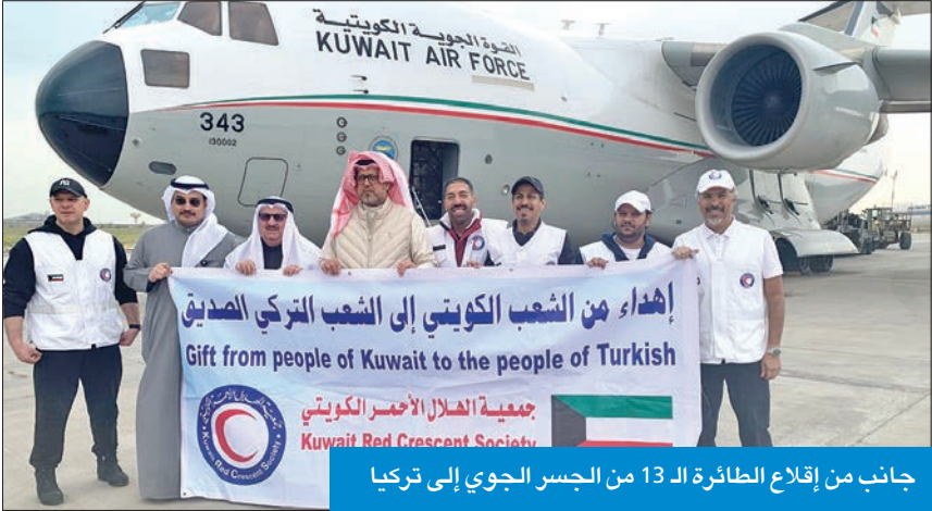
جانب من إقلاع الطائرة الـ 13 من الجسر الجوي إلى تركيا

مستوى الوعي البيئي بين كافة فئات المجتمع للحفاظ على الموارد الطبيعية والحد من تدهورها وتلوثها.