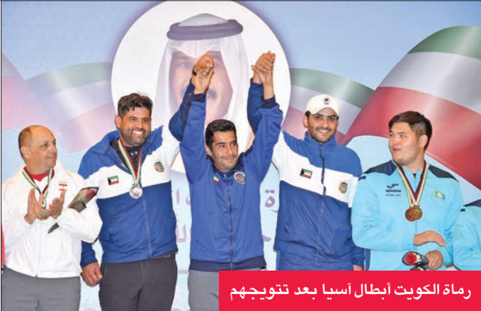
رماة الكويت أبطال اسيا بعد تتويجهم

وحول المنافسة في البطولة والطريق نحو الذهبية، قالت أن الصراع كان كبيراً والمنافسة صعبة جداً والتركيز كان حاضراً من اللحظة الأولى وحتى النهاية.