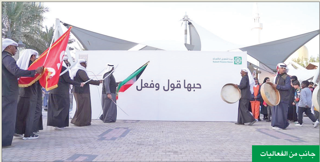
جانب من الفعاليات