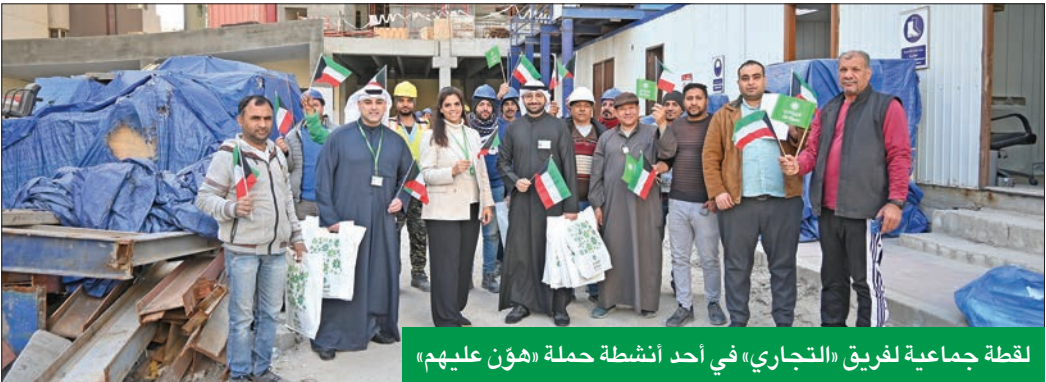
لقطة جماعية لفريق «التجاري» في أحد أنشطة حملة «هؤن عليهم»

الهدايا التذكارية وأعلام الكويت عليهم، احتفالاً بهذه المناسبة، وفي إطار فعاليات حملة «هؤن عليهم» الرامية إلى الاهتمام بفرحة عمال البناء والتنظيف وإدخال البهجة والسرور