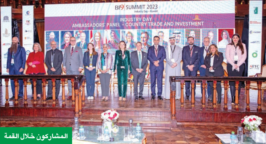
المشاركون خلال القمة

طنية الكويتية تحسين الكويت، وتحويل الدور مع نمو القطاع الخاص، خاص في الناتج المحلي تصميم في المسئمة. حديث عن خريطة طريق ات السابقة التي حققتها التغيرات والتحديات بسهولة ممارسة الأعمال إلى بعض المشاريع تم التعامل معها من قبل لرعاية السكنية، وهيئة طابع العام والخاص، بإشراف الكويتية، والشركة المكاملة.