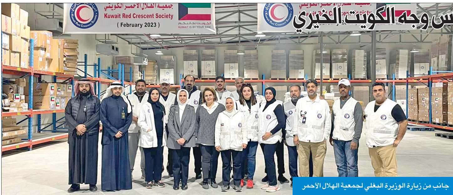
جانب من زيارة الوزيرة البغلي لجمعية الهلال الأحمر

حققت فرقة الكويت لإغاثة ومساعدة متضرري الزلزال المدمر في تركيا وسورية، التي جرت ضمن الحملة الوطنية (الكويت بجانبكم) أمس الأول، تبرعات بقيمة 20.7 مليون دينار (نحو 67.7 مليون دولار). وشارك في الحملة، التي أطلقتها وزارة الشؤون الاجتماعية والتنمية المجتمعية بالتعاون مع وزارتي الخارجية والإعلام نحو 129 ألف متبرع. وجاءت الحملة تنفيذاً للتوجيهات السامية من لدن القيادة السياسية وتكليف من مجلس الوزراء في إطار الدور الإنساني لدولة الكويت لمساعدة وإغاثة المتضررين من هذه الكارثة التي خلفت آلاف الضحايا والمصابين.