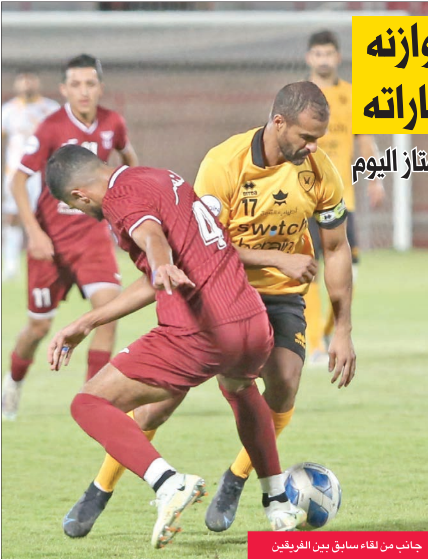
جانب من لقاء سابق بين الفريقين