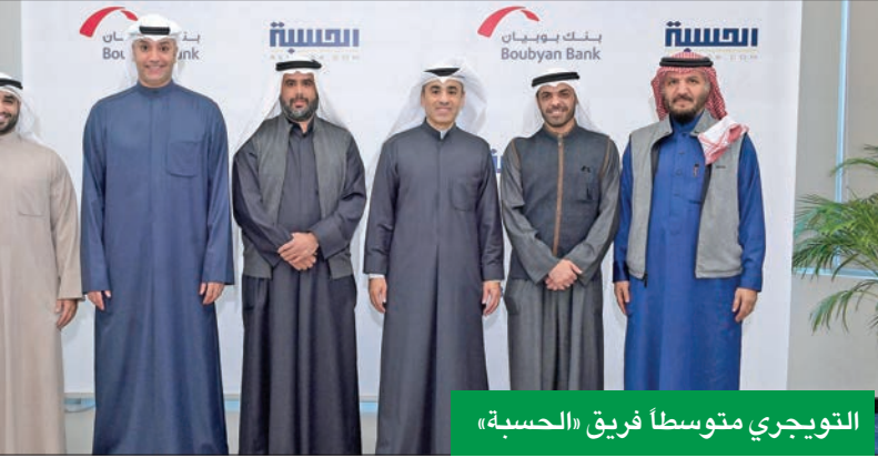
التويزري متوسطاً فريق «الحسبة»

إلى تمكين المستخدم من تصفية الصفقات وإعادة عرضها بما يتناسب ومتطلبات البحث وإعلانات بيع وشراء وتاجير العقارات وحسبة أقساط القروض العقارية. وأشار إلى أن التطبيق يتضمن أيضاً جميع الأخبار المتعلقة بالقطاع العقاري في الكويت، ومجموعة مختارة من المقالات ذات الصلة بقطاعي العقار والبناء، كما يتضمن تكلفة البناء التقديرية وتغطية المزايدات العقارية في الكويت، سواء التي تنظمها الجهات الحكومية أو شركات القطاع الخاص، مضيفاً أن شركة الحسبة تتطلع إلى إصدار تقارير عقارية ربع سنوية، بسبب غياب المعلومة والشفافية عن السوق العقاري.