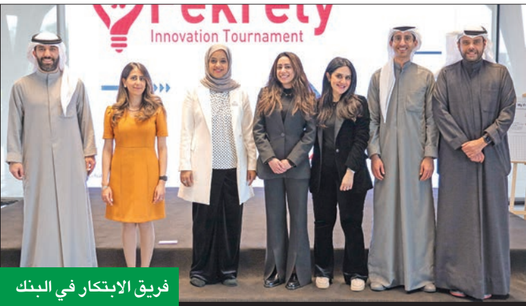
فريق الابتكار في البنك

التي تضع تجربة العملاء في مقدمة محاورها. وذكرت أن البنك يقود رحلة ناجحة للتحول الرقمي، من خلال توفير الحلول التكنولوجية للعملاء، وساهم في تطوير خدمات مبتكرة للبنك يسهل الوصول إليها. وأضافت: أن البنك يمتلك ثروة بشرية كبيرة، ومجموعة متميزة من المواهب والخبرات في مختلف المجالات، تنقسم بقدر عال من الكفاءة والمهنية، وعلينا الاستفادة من إمكانياتهم ومساعدتهم على إطلاق العنان لأفكارهم وابتكاراتهم. وبيّن أن كل المديرين في البنك حريصون على تشجيع فرق العمل تحت إدارتهم وتشجيعهم على تقديم أفكار مبتكرة، تساهم في تزويد العملاء بخدمات سهلة وبسيطة ومبتكرة، تطبيقاً لاستراتيجية 2025،