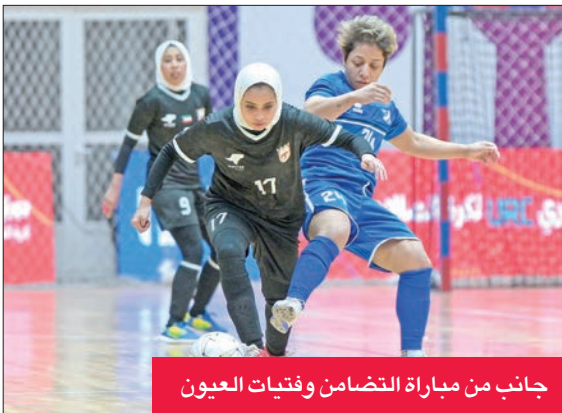
جانب من مباراة التضامن وفتيات العيون

وضع فريقا الفتاة والتضامن قدماً في المباراة النهائية لبطولة كأس الاتحاد لكرة قدم الصالات للسيدات، بعد تغلب فريق الفتاة على الكويت 3-4، والتضامن على فريق فتيات العيون 2-9 في الدور التمهيدي، الذي أقيم أمس الأول على صالة نادي الكويت. وستقام المواجهة الثانية بين الفرق الأربعة الأربعة المقبل على صالة نادي الفتاة، لحسم الفريقين المتاهلين، على أن تكون ركلات الترجيح حاسمة إذا ما فاز الفريقان المهزومان في المباراة الأولى، لحسم المتاهلين إلى المباراة النهائية، التي ستقام السبت المقبل على صالة نادي الكويت.