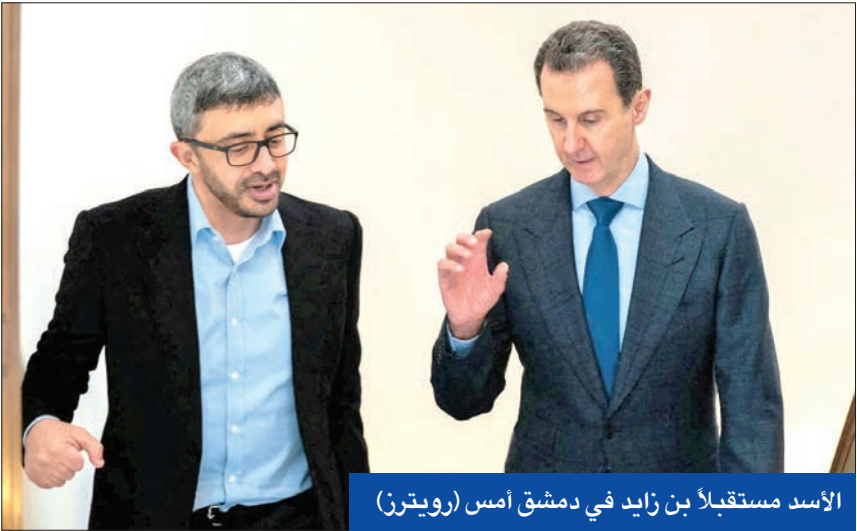
الأسد مستقبلاً بن زايد في دمشق أمس

● مقتل 11 في هجوم لـ «داعش» على جامعي «الفقع» وسط سورية