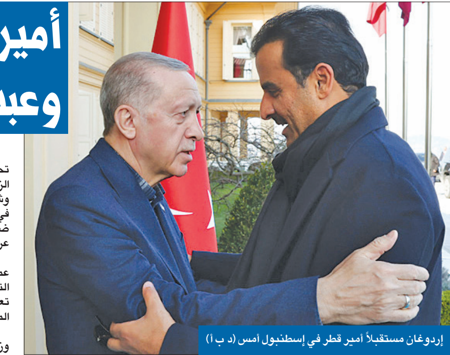
إردوغان مستقبلاً أمير قطر في إسطنبول أمس

جورع عاطف علمت «الجريدة» من مصادرهما، أن وزارة الشؤون الاجتماعية بصدد إصدار جملة قرارات تقضي بإلغاء تثبيت نحو 20 رئيس قسم في مختلف قطاعاتها، صدرت قراراتهم تزامناً مع قرار مجلس الوزراء وقف النقل والذب والإعارة، وشغل