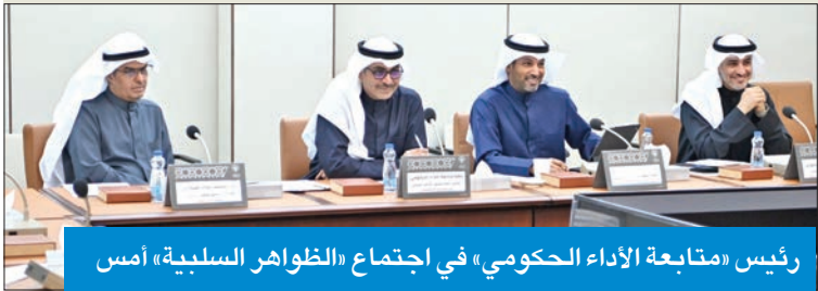
رئيس «متابعة الأداء الحكومي» في اجتماع «الظواهر السلبية» أمس

آخرين كذلك الترتيبات والقرارات الباراشوتية التي تصدر باستثناءات غير مبررة ولا منطقية وبغير وجه حق بترقية أناس على حساب آخرين أكفا وأقدم منهم. وأضاف هايف أن اللجنة طالبت جهاز متابعة الأداء الحكومة بأخذ توصياتها بعين الاعتبار وأن يرفع تقارير المتابعة ويعمل على تطوير أنظمة الدولة إدارياً بحيث لا تكون هناك ثغرات لاستثناءات أو ترصيات مما يحصل اليوم في هذه الفوضى.