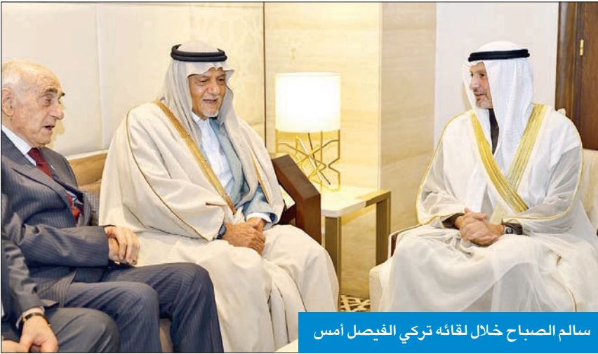
سالم الصباح خلال لقائه تركي الفيصل أمس

التقى وزير الخارجية الشيخ سالم الصباح أمس مع رئيس مجلس أمناء صندوق ووقفية القدس الأمير تركي الفيصل بن عبدالعزيز بحضور رئيس مجلس إدارة صندوق ووقفية القدس منيب المصري، على هامش مؤتمر القدس 2023 الذي عقد في مقر جامعة الدول العربية بمدينة القاهرة أمس. وتناول اللقاء التطورات الراهنة للقضية الفلسطينية والوضع القائم في القدس وسبل تعزيز صمود الشعب الفلسطيني الشقيق وتمكينه من مواجهة المعاناة الإنسانية التي يمر بها.