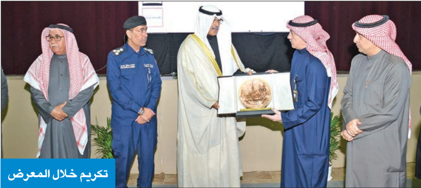
تكريم خلال المعرض

افتتح محافظ الاحمدي الشيخ فواز الخالد، صباح امس، معرض النوعية بأضرار المخدرات الذي نظمته منطقة الاحمدي التعليمية في مدرسة البصرة المتوسطة بنات بمنطقة فهد الاحمد، بحضور عدد من قيادات المحافظة بتقديمهم مدير عام مديرية أمن الاحمدي، ومدير الشؤون التعليمية بمنطقة الاحمدي التعليمية. وأكد محافظ الاحمدي، في كلمة له، أن المعرض يمثل امتداداً للجهود وأنشطة محافظة الاحمدي الحديثة لمواجهة أفة المخدرات التي تهدد مجتمعنا والمجتمعات العربية والعالم أجمع. وتضمن جهود الحكومة ممثلة في وزارة الداخلية