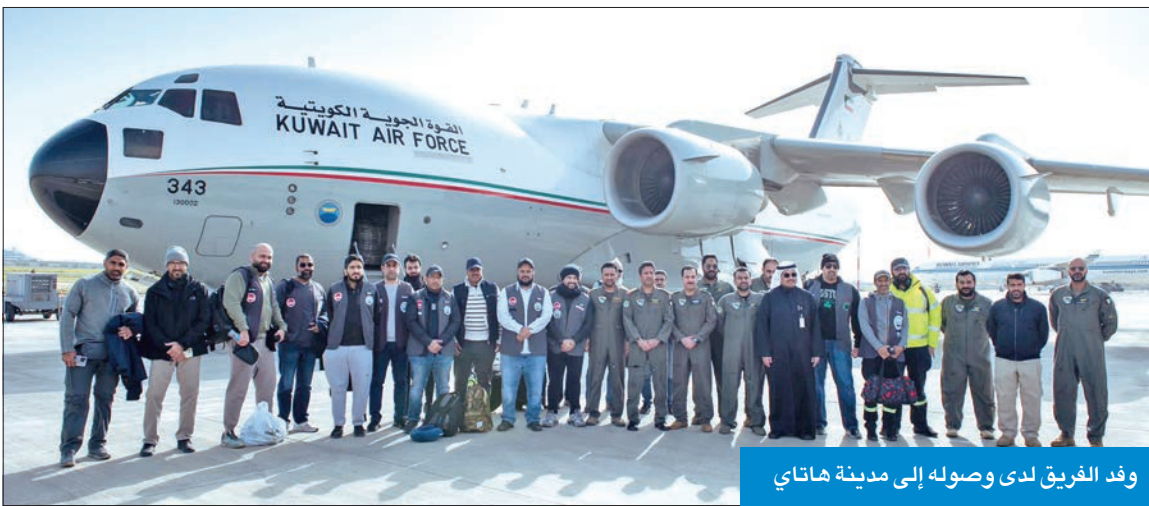
وفد الفريق لدى وصوله إلى مدينة هاتاي

الفريق يشمل تخصصات جراحات كسور العظام والحروق والطوارئ ومسعفين