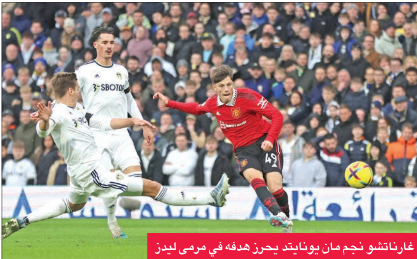
غارناتشو نجم مان يونايتد يحرز هدفه في مرمى ليدز

عشر (الرابع من القاع)، بفارق نقطة واحدة أمام مراكز الهبوط. ويأتي هذا الفوز، ليمنح مانشستر يونايتد دفعة معنوية جيدة، قبل لقاءه المهم مع مضيفه برشلونة الإسباني يوم الخميس القادم في ذهاب الدور المؤهل