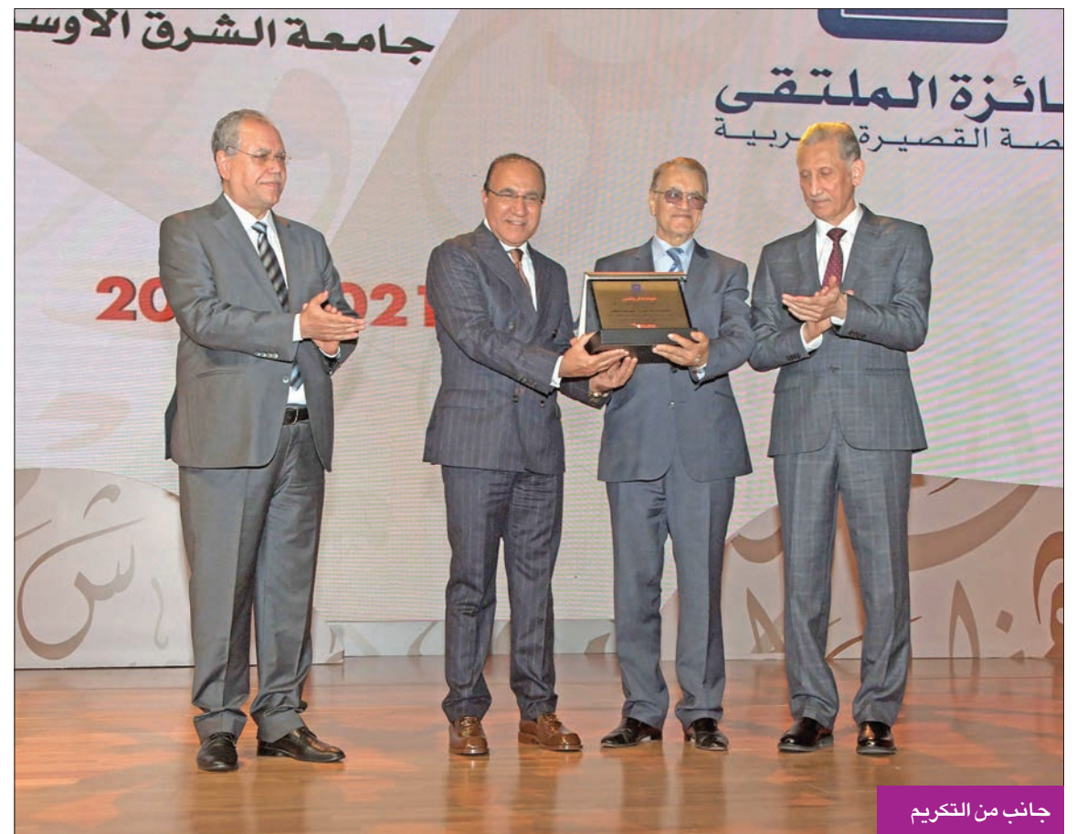
جانب من التكريم