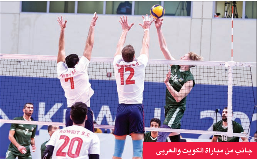
جانب من مباراة الكويت والعربي

في المباراة الأولى، اليوم، ستكون الفرصة سانحة أمام الكويت (الوصيف) لمواصلة سلسلة انتصاراته، والارتقاء إلى قمة الترتيب، على حساب برقان (السادس) والطامع ذلك في عرقلة تقدم «الأبيض»، والظهور بشكل جيد، رغم ابتعاده عن منافسة المربع الذهبي.