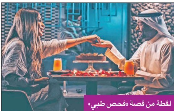
لقطة من قصة «فحص طبي»

إلى الخميس الساعة 3 بعد الظهر بتوقيت غرينتش، 6 مساءً بتوقيت السعودية، وعلى «شاهد» من دون اشتراك قبل الشاشة بـ 24 ساعة.