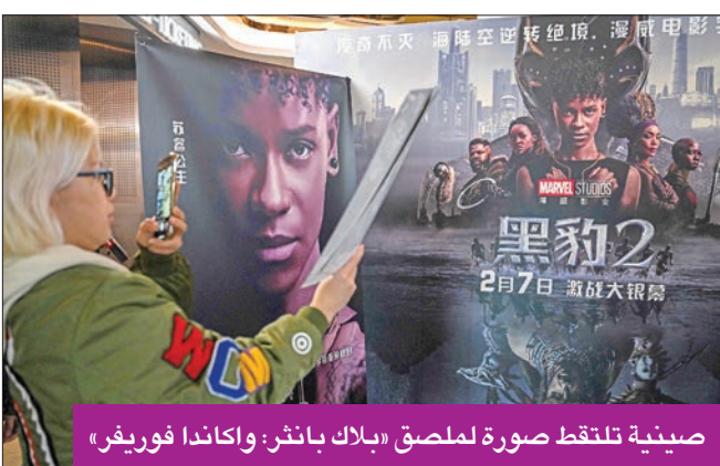
صينية تلتقط صورة لملصق «بلاك بانثر» واكاندا فوريفر»

بعد نحو أربع سنوات من الغياب، عادت أفلام مارفل إلى دور السينما في الصين، أمس الأول، مع بدء عرض فيلم «بلاك بانثر: واكاندا فوريفر». وقد غابت أفلام الأبطال الخارقين من عالم مارفل عن دور السينما الصينية منذ طرح فيلم «سبايدر مان: فار فروم هوم» في يوليو 2019. ولا تجيز السلطات الصينية سوى عرض بضعة عشرات من الأفلام الأجنبية في الصالات المحلية سنوياً.