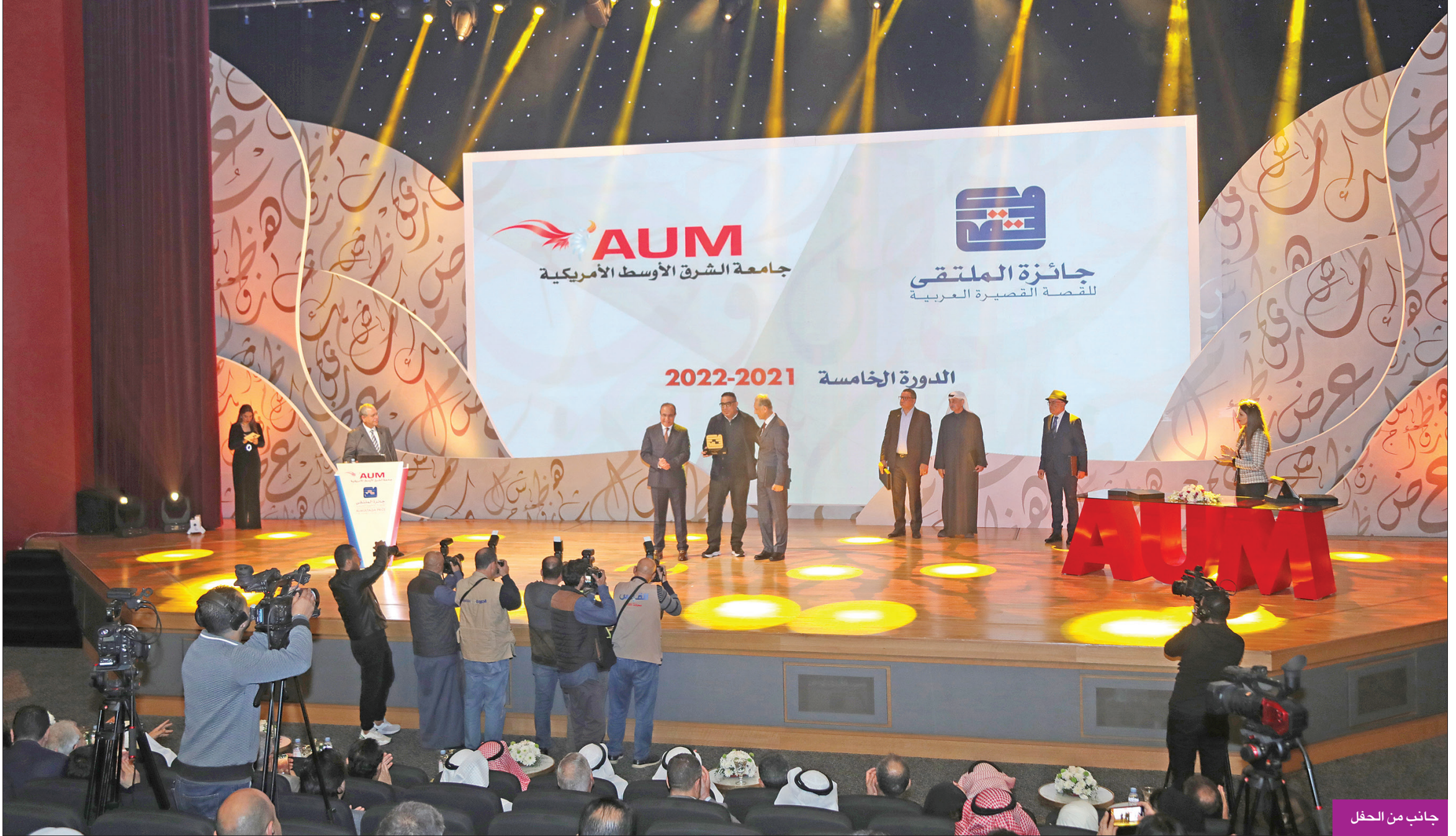
جانب من الحفل

وخيال خصب، وابتكر مواقف لم تخطر ببال، تدعو للتفكير والتأمل والاعتبار، وليس للاسترخاء والاستسلام والخدر. قصص تتحدى القارئ في وعيه، وتزعزع لديه أعراف التلقي التي رسخها فن القص التقليدي».