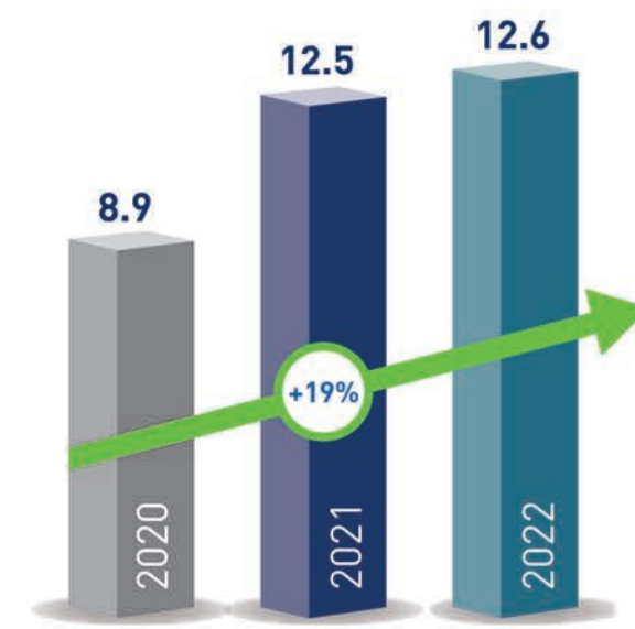
ربحية السهم (فلس)