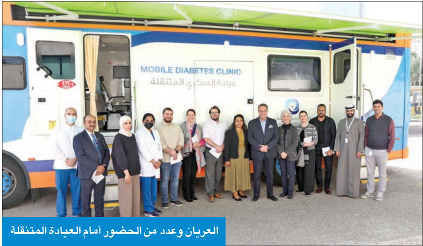
العريان وعدد من الحضور أمام العيادة المتنقلة

العريان: المعهد لا يألو جهداً في نشر الوعي بين شرائح المجتمع