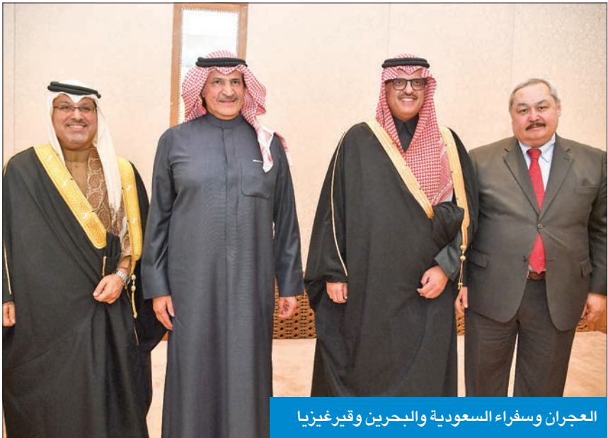
العجران وسفراء السعودية والبحرين وقيرغيزيا

عند الاستثمار في المشاريع الكبرى التي تطرحها المملكة،