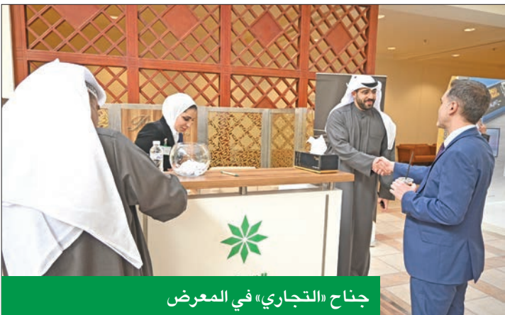
جناح «التجاري» في المعرض

على دراية، والهادفة إلى تثقيف عملاء البنوك بالجوانب المرتبطة بالحسابات المصرفية والتعامل مع البنوك.