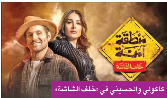
كاكولي والحسيني في «خلف الشاشة»