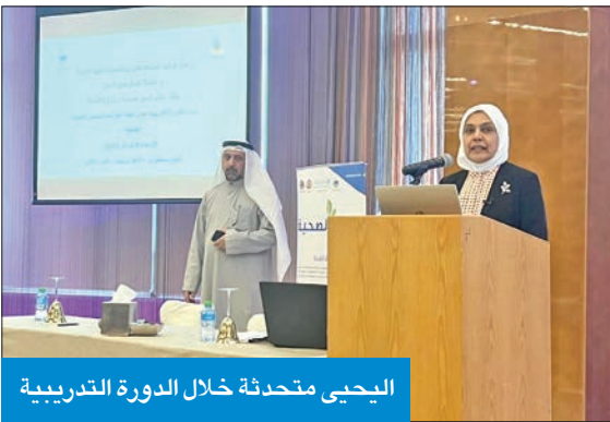
اليحيى متحدة خلال الدورة التدريبية

دورة تدريبية لإعداد المرتسم الصحي للمدينة