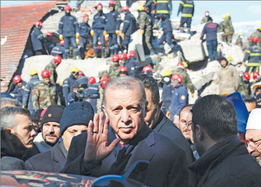
إردوغان خلال تفقده كهريمان مرعش مركز الزلزال بجنوب تركيا أمس

عمليات الإنقاذ تدخل مرحلة حرجة والاتحاد الأوروبي يفعل مساعدة سورية... وواشنطن تتعهد بعدم العرقلة