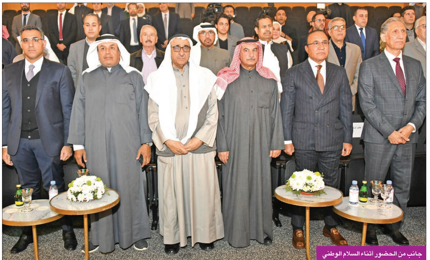
جانب من الحضور أثناء السلام الوطني