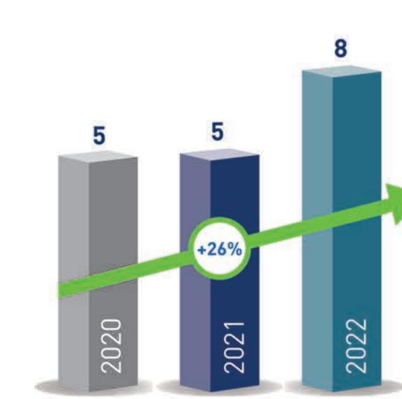
توزيعات الأرباح النقدية (فلس)