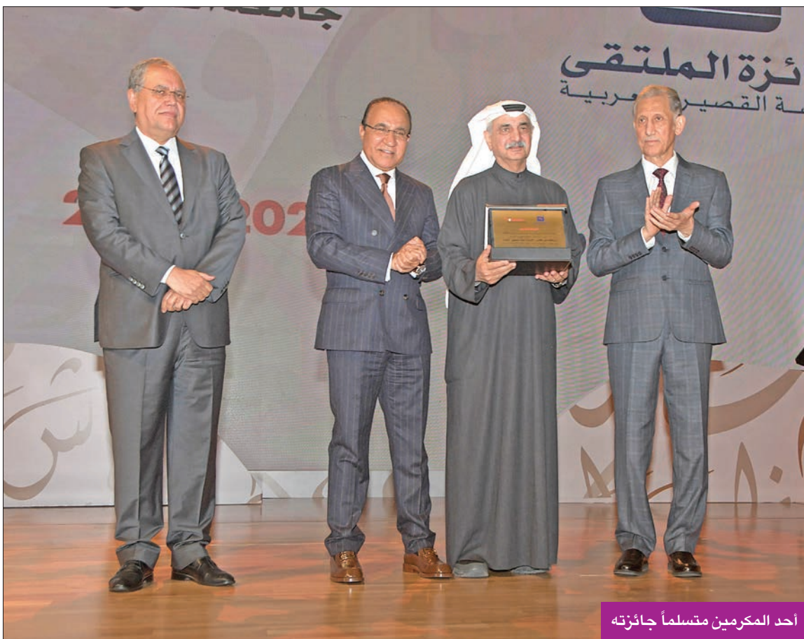
أحد المكرمين متسلماً جائزته

«منتدى الجوائز، يعمل على الارتقاء بالمسابقات العربية وتعزيز مكانتها لتطوير بيئة عربية محفزة للإبداع عزمي