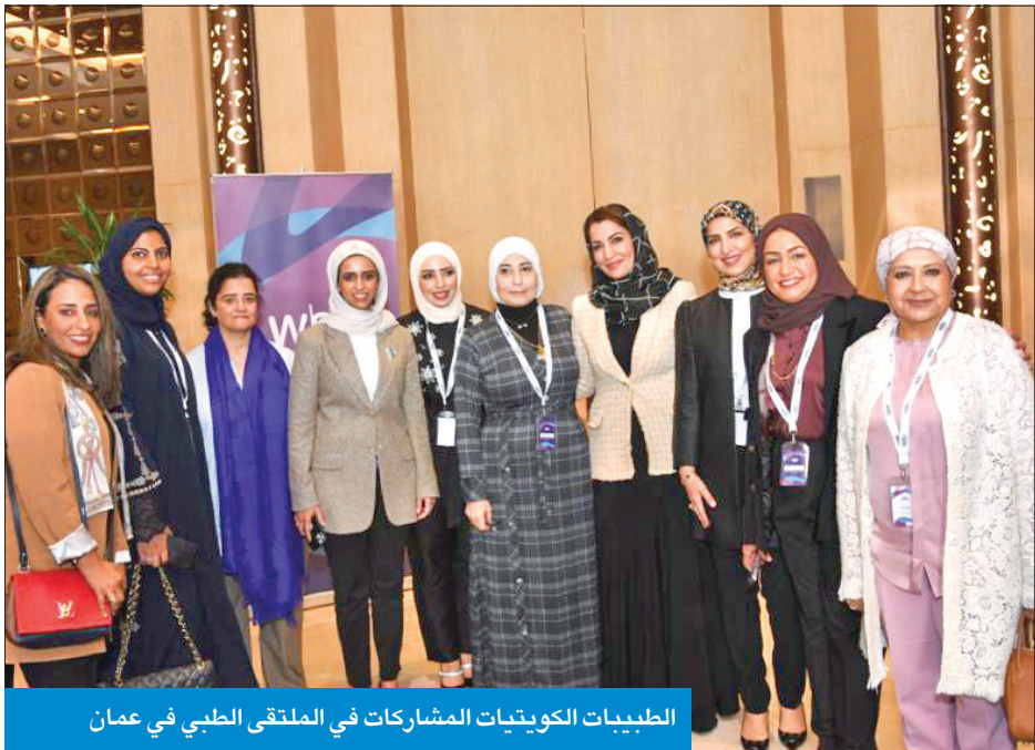
الطبيبات الكويتيات المشاركات في الملتقى الطبي في عمان

جراحات كويتيات يشاركن في الملتقى الخليجي الرابع بعمان