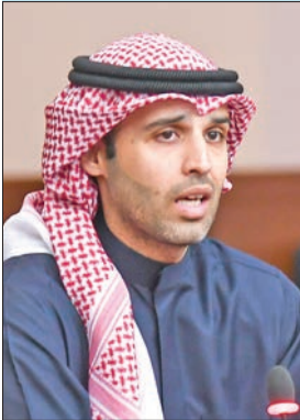
عبد الوهاب العيسى

في رواتب الموظفين الحاليين؟ وأين وصلت الحكومة في خططها الرامية إلى إصلاح هيكل الرواتب في الوظائف الحكومية؟ يرجى تزويدي بالخطوات الرسمية حتى الآن. وفي سؤاله لوزير الصحة ذكر: «وقوفاً على ضمان تقديم الرعاية الصحية في المرافق الصحية كافة، ولضمان نجاح الإدارة الطبية للدولة وتقديم الرعاية الطبية على أكمل وجه، نظراً لما يعانيه مرضى السرطان وأمراض الدم من صعوبات، هل تعاقدت مع عدد من الأطباء في مستشفى حسين مكي جمعة للأورام السرطانية ومستشفى بدرية الأحمد لمرضى الدم في العام الماضي؟ إذا كانت الإجابة الإيجابية يرجى تزويدي بعدد المتعاقد معهم، والإجراءات التي اتبعتها الوزارة في ذلك، مع تزويدي باسماء وشهادات الأطباء وجنسياتهم. وأضاف: هل أنهى عقد عدد من الكاترة ممن كانوا يعملون في مستشفى بدرية الأحمد لمرضى الدم بعد مضي أقل من سنة من توقيع عقودهم؟ إذا كانت الإجابة بالإيجاب