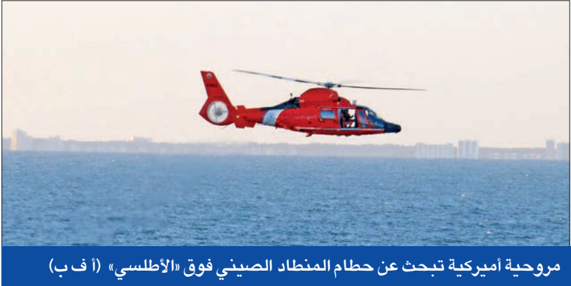
مروحية أميركية تبحث عن حطام المنطاد الصيني فوق «الأطلسي» (أ ف ب)

يعلمون أنه كان هناك «عشرات» المهام منذ عام 2018. وأضاف التقرير الذي أعده 3 من محرري الصحيفة أن الصينيين استفادوا من تقنية تفورها شركة صينية خاصة في إطار المساعي لإدماج الجانبين المدني والعسكري بالبلاد، وهو برنامج تقوم من خلاله الشركات الخاصة بتطوير التقنيات والقدرات التي يستخدمها جيش التحرير الشعبي. ونقل المحررون إلين ناكيشياما وشين هاريس ودان لاموت عن هؤلاء المسؤولين قولهم إن السنوات الأخيرة شهدت رصد ما لا يقل عن 4 منطاد فوق هاواي وفلوريدا وتكساس وغوام، بالإضافة إلى المنطاد الأخير الذي رصد الأسبوع الماضي. وذكروا أن 3 من هذه الحالات الأربع حدثت خلال إدارة الرئيس الأميركي السابق دونالد ترامب ولكن لم تصنف كمنطاد مراقبة صينية إلا في الوقت الحاضر.