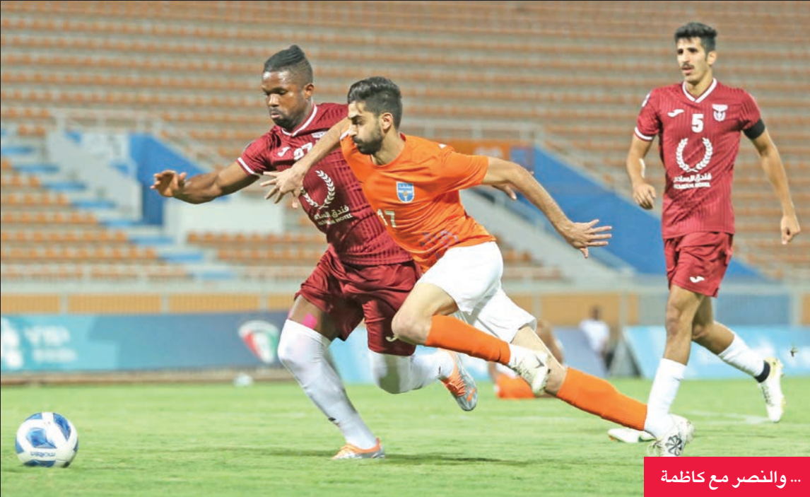
... والنصر مع كازمة