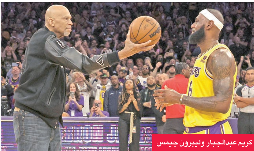
كريم عبد الجبار وليبرون جيمس

في المركز الثالث عشر، يواصل دنفر ناغتنس تعزيز صدارته للمنطقة الغربية بـ38 فوزاً في 55 مباراة، وذلك بعدما ثار من ضيفة مينيسوتا تمبروولفز باكتساحه 112-146، ليرد اعتباره من الأخير الذي أسقطه الأحد 98-128.