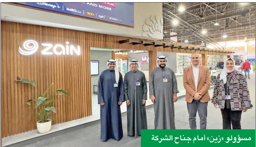
مسؤولو «زين» أمام جناح الشركة

أعلنت شركة زين رعايتها الاستراتيجية للنسخة الثالثة من معرض كويتك الدولي 2023، الحدث التكنولوجي الأكبر من نوعه في الكويت، والذي يُقام من 8 إلى 11 الجاري بأرض المعارض الدولية في مشرف، بوجود أكبر الشركات المحلية والعالمية من قطاعي التكنولوجيا والاتصالات والجهات الحكومية ومؤسسات الدولة المختلفة.