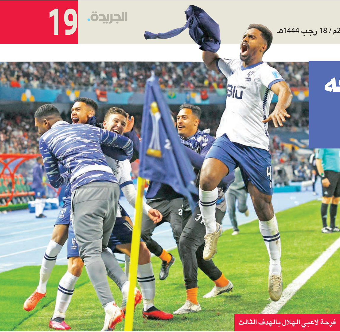
فرحة لاعبي الهلال بالهدف الثالث

أعلنت لاعبة التنس التونسية، المصنفة ثالثة عالمياً، أنس جابر، أمس الأربعاء، انسحابها من دورتي الدوحة ودي، بسبب «عملية جراحية بسيطة» من المقرر أن تخضع لها قريباً. وكتبت جابر في صفحتها على موقع فيسبوك، «من أجل العناية بصحتي، قرر فريقي الطبي إجراء عملية جراحية بسيطة بهدف العودة إلى الملاعب والحصول على نتائج جيدة». وأضافت أنها اضطرت إلى الانسحاب من البطولة ودي المقبلة في الدوحة وذلك نتيجة لذلك، مبينة أن القرار «يحبط قلبي، وأسفة للجماهير في الشرق الأوسط الذين كانوا ينتظرونني».