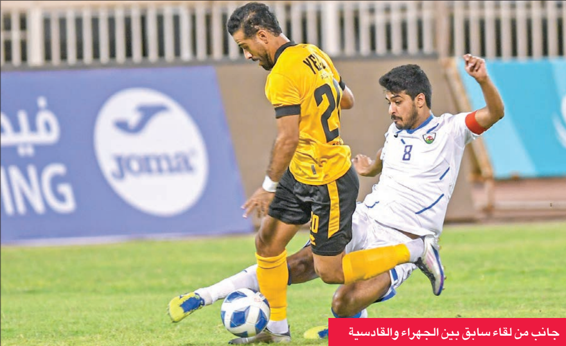
جانب من لقاء سابق بين الجھراء والقادسية