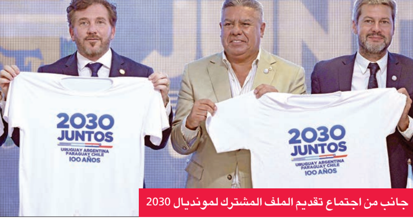
جانب من اجتماع تقديم الملف المشترك لمونديال 2030

يذكر أن عائلة غلايزر المالكة لنادي مانشستر يونايتد ترغب في بيعه مقابل 6 مليارات جنيه استرليني، بينما يسعى الصندوق الاستثماري القطري لضخ ملياري جنيه إضافية لتدعيم صفوف النادي وإعادة بناؤه ليعود إلى قمة الأندية العالمية.