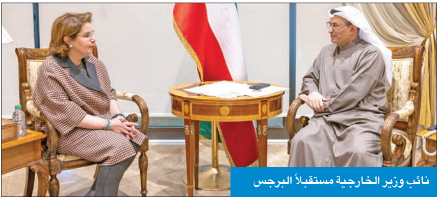
نائب وزير الخارجية مستقبلاً البرجس

في مجال آخر، التقى العتيبي سفير البحرين لدى الكويت صلاح الماكي، وتم خلال اللقاء بحث أوجه العلاقات الأخوية المتينة التي تربط البلدين الشقيقين.