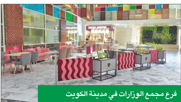
فرع مجمع الوزارات في مدينة الكويت

أما في قطر فقد افتتحت «صناعات الغانم» ثلاثة فروع جديدة في كل من برج بن الشيخ، وفي مجمع دوحة فستيفال سيتي النابض بالحياة، وداخل سوق الميرة المركزي.