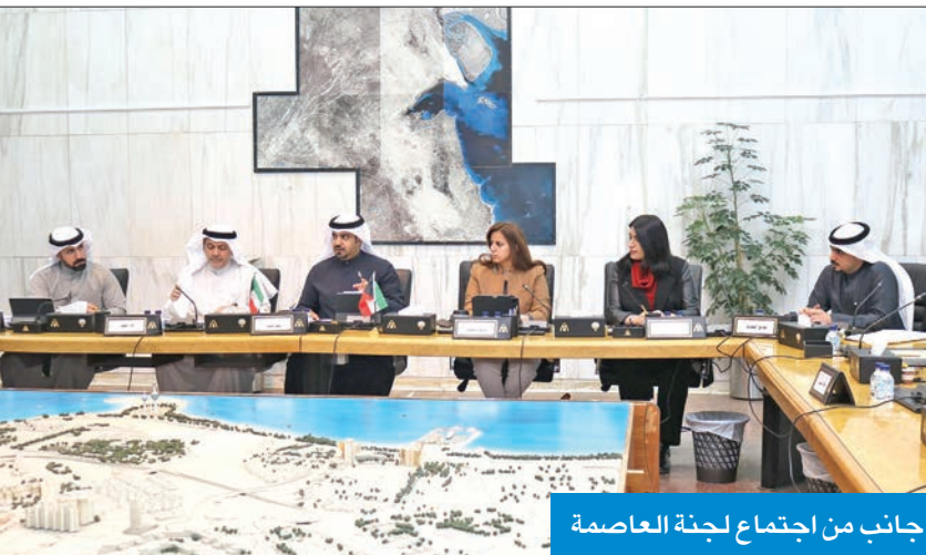
جانب من اجتماع لجنة العاصمة

العبد الجادر، على 4 طلبات لوزارة الكهرباء و الماء والطاقة المتجددة بشأن تخصيص مواقع محطة تحويل ثانوية في منطقتي العديلية (قطعتي 1 و3)، والروضة (قطعة 1)، فضلاً عن تغيير موقع محول غير قائم بمنطقة قرطبة (قطعة 1). كما وافقت اللجنة على