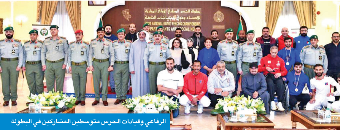
الرفاعي وقيادات الحرس متوسطين المشاركين في البطولة

● الرفاعي: الحرس تبرع بملاعب البطولة لنادي التحدي