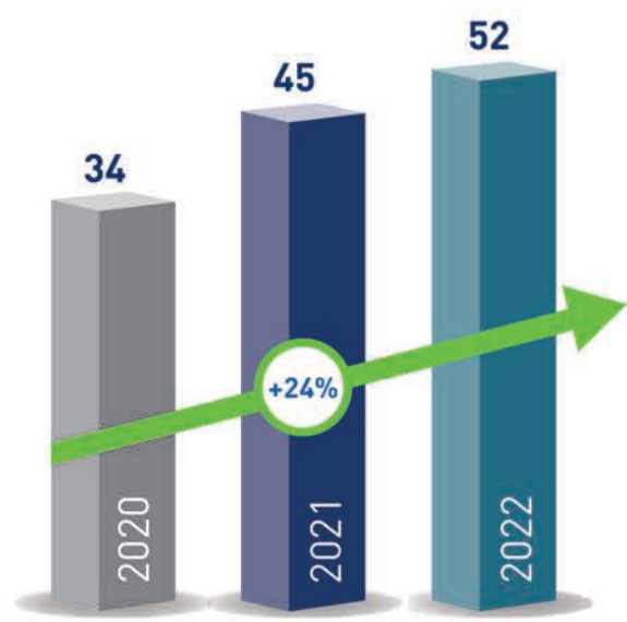
صافي الدخل (مليون دينار كويتي)