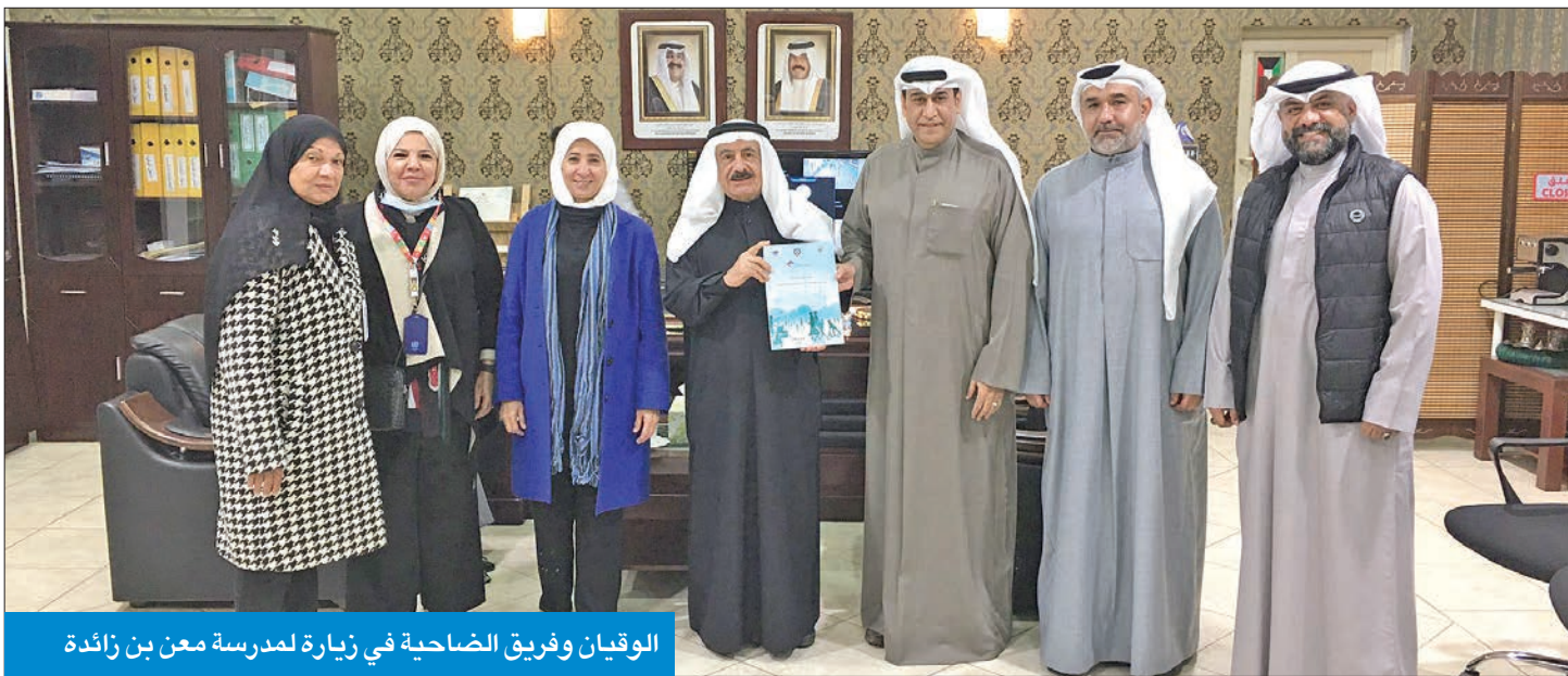
الوقيان وفريق الضاحية في زيارة لمدرسة معن بن زائدة

وبين أن الجولة جاءت أيضاً بهدف تسليم مرسوم المدينة الصحية لمديري ومديرات المدارس، للاطلاع عليه وتمكينهم من فهم المدينة الصحية، وكذلك دعوة المدارس إلى المشاركة في احتفالية العيد الوطني التي تنظمها المدينة الصحية الأحد المقبل بحديقة المنطقة قطعة 4، مؤكداً أن الوطن هو الحصن الدافئ الذي يحتضن أبناءه، ويشعرهم بالأمان والأمان والسلم.