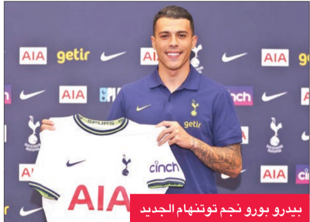
بيدرو بورو نجم توتنهام الجديد

وكان بنفيكا تعاقد مع فرنانديس، الذي يجيد القيام بعدة أدوار في خط الوسط، من ريفر بلايت الأرجنتيني في يوليو الماضي مقابل 10 ملايين يورو، في صفقة تمتد حتى عام 2027.