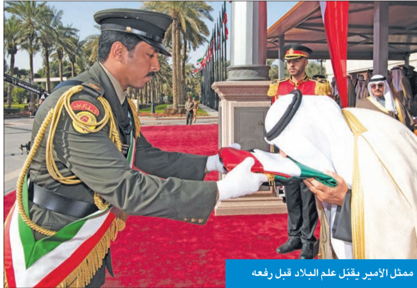
ممثل الأمير يقبل علم البلاد قبل رفعه