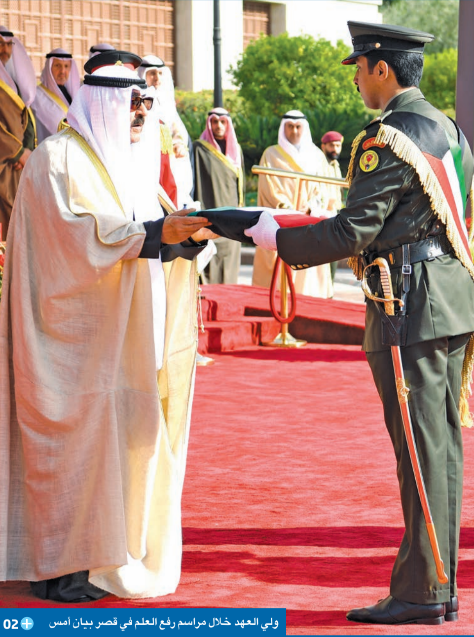
ولي العهد خلال مراسم رفع العلم في قصر بيان أمس

ولي العهد لصاحب السمو: أحاطكم الله برعايته لتحقيق مستقبل مزدهر لوطننا