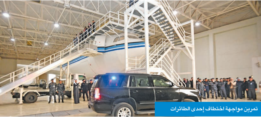
تمرين مواجهة اختطاف إحدى الطائرات