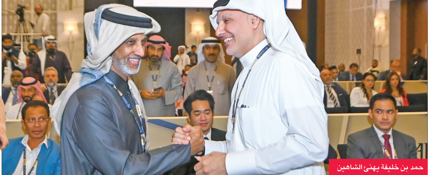
حمد بن خليفة يهنئ الشاهين

نيمبانج من نيبال (جنوب آسيا) والأسترالي كريست نيكو والتايلاندي سوميوث بومانمونج (آسيان) وفوك كاي شان أريك من هونغ كونغ (شرق آسيا).