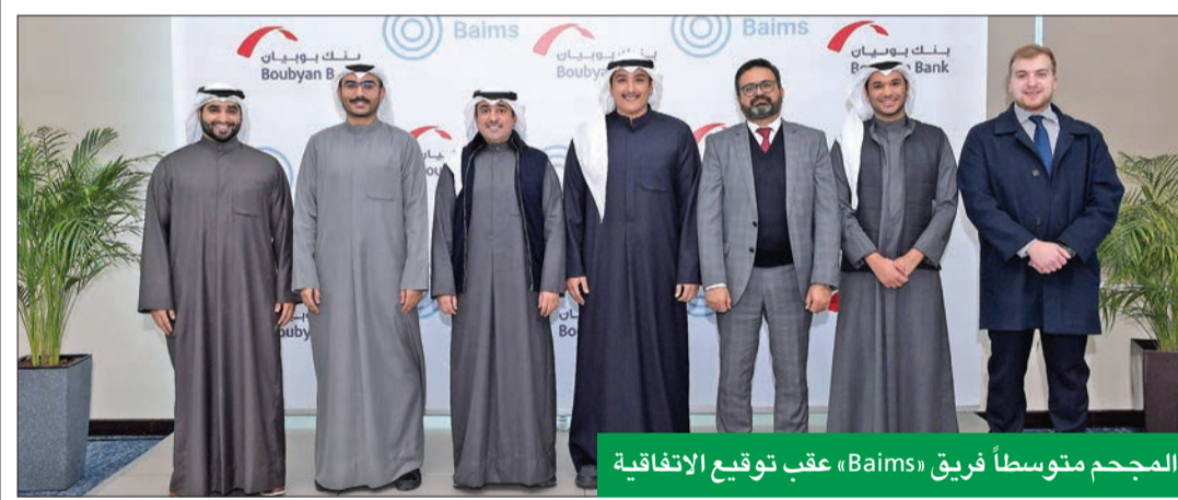
المجمع متوسطاً فريق «Baimz» عقب توقيع الاتفاقية

حازت شركة بيتك للتأمين التكافلي (بيتك تكافل) جائزة أفضل شركة تأمين تكافلي لعام 2022 على مستوى السوق المحلي بالكويت، من مجموعة Global Economics المرموقة، للعام الثاني على التوالي، تقديراً لمكانة الشركة في سوق التأمين محلياً، ونمو أعمالها وتنامي حصتها السوقية، وجهودها المتواصلة في ابتكار خدمات ومنتجات تأمينية جديدة، تعتمد في معظمها على وسائل التقنية الحديثة والتطور التكنولوجي عالي المستوى. ومثل الشركة في حفل توزيع الجوائز، الذي أقيم في دبي مؤخراً، اثنان من الكوادر الشبابية المتميزة من العاملين في الشركة، وقد تسلموا الجائزة، وشهدا تكريم الشركة خلال الحفل الذي ضم حضوراً واسعاً من مؤسسات وشركات كبرى من مختلف أنحاء العالم. وأشاد عضو مجلس الإدارة الرئيس التنفيذي في