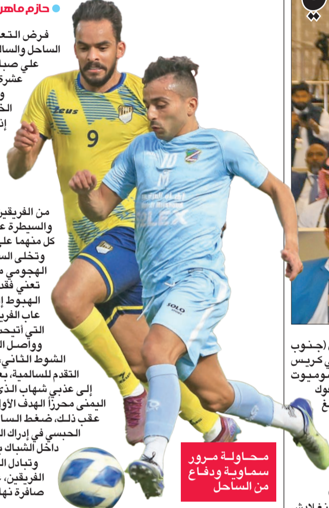
محاولة مرور سماوية ودفاع من الساحل

وتبادل الفريقان الهجمات الخطيرة على مرعى الفريقين، غير أنها لم تترجم إلى أهداف حتى صافرة نهاية المباراة 1-1.