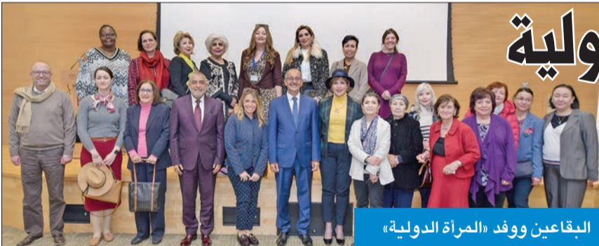
البقاعين ووفد «المرأة الدولية»

البقاعين: الزيارة فتحت آفاقاً للتعرف على التعليم في الكويت ومدى تطور الأجيال