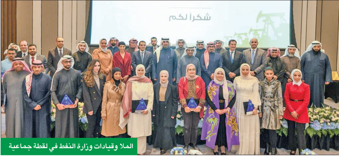
الملا وقيادات وزارة النفط في لقطة جماعية

«تنظيمها جامعة الكويت... وحريصون على توظيف الشباب الكويتيين»