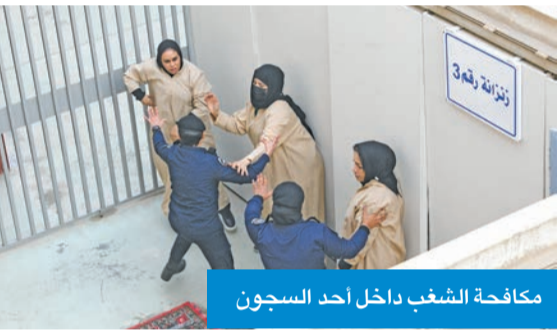
مكافحة الشغب داخل أحد السجون

في التعامل مع أعمال شغب داخل سجن النساء واختطاف طائرة واحتجاز رهائن وكذلك اختطاف طائرة والإعتداء على شخصية مهمة، وإعمال إرهابية داخل منطقة سكنية، إضافة إلى أعمال شغب تتحول إلى حدث مسلح واعتداء على عملية نقل سجناء وأخيراً أعمال شغب في منطقة مفتوحة. وفي ختام التمرين أصدر النائب الأول قراراً بمنح المشاركين فيه، وعددهم 1172 منتسباً إجازة مدة أسبوع.