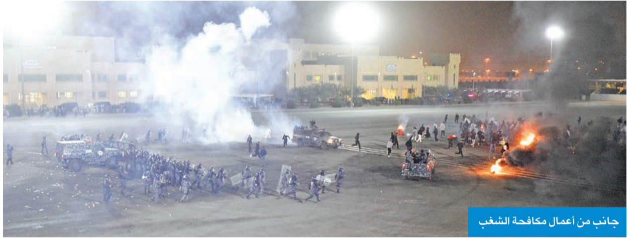
جانب من أعمال مكافحة الشغب