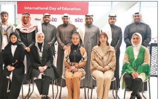
فريق العلاقات العامة في «stc» مع الأكاديميين المشاركين في الحلقة النقاشية

ضمن إطار شراكتها الاستراتيجية مع منصة «دورات»