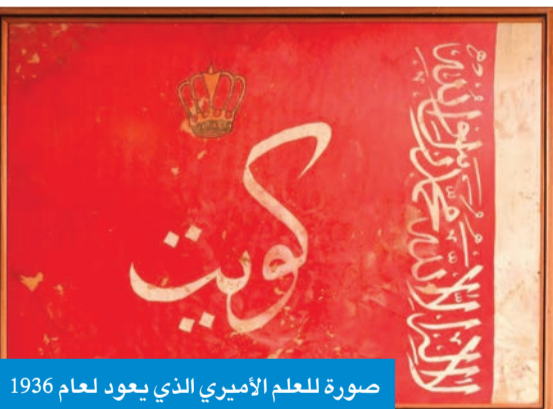
صورة للعلم الأميري الذي يعود لعام 1936