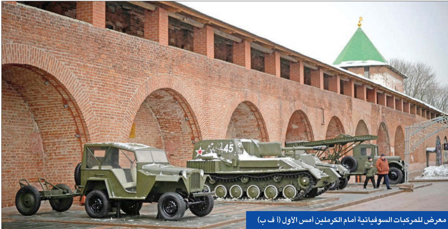
معرض للمركبات السوفياتية أمام الكرملين أمس الأول

● لندن: إطالة أمد الحرب لن يخدم سوى بوتين ● موسكو مهتمة بالتعاون مع واشنطن في «حظر النووي»