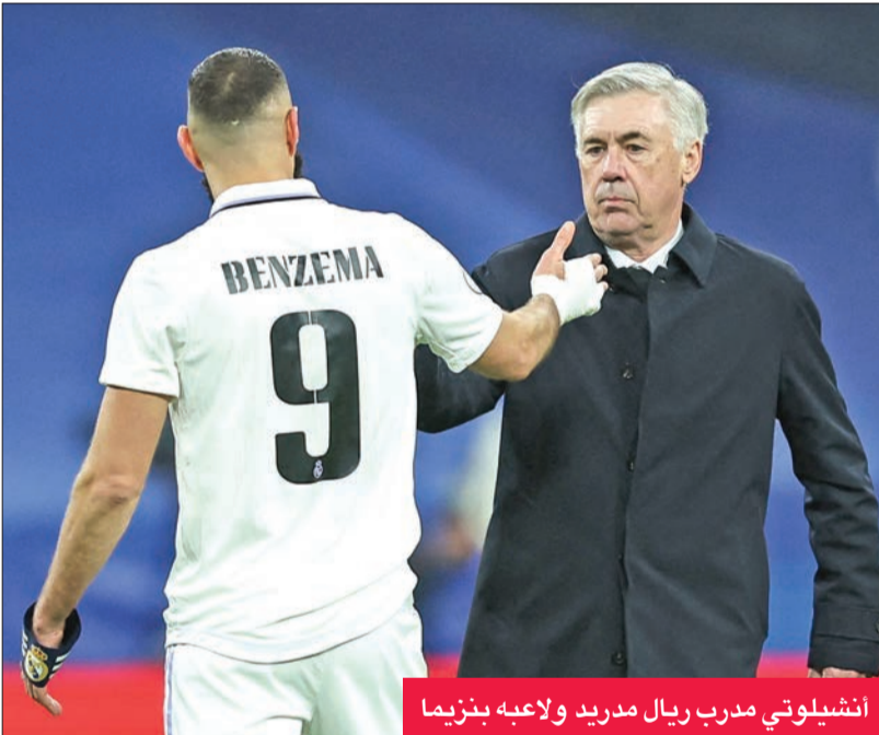
أنشيلوتي مدرب ريال مدريد ولاعبه بنزيما

على أتلتكو مدريد الرابع واللاحق به عقب خسارته المخيبة في عقر داره أمام رايو فايكانو صفر-1، من الدوري الإسباني لكرة القدم أمس الأول.