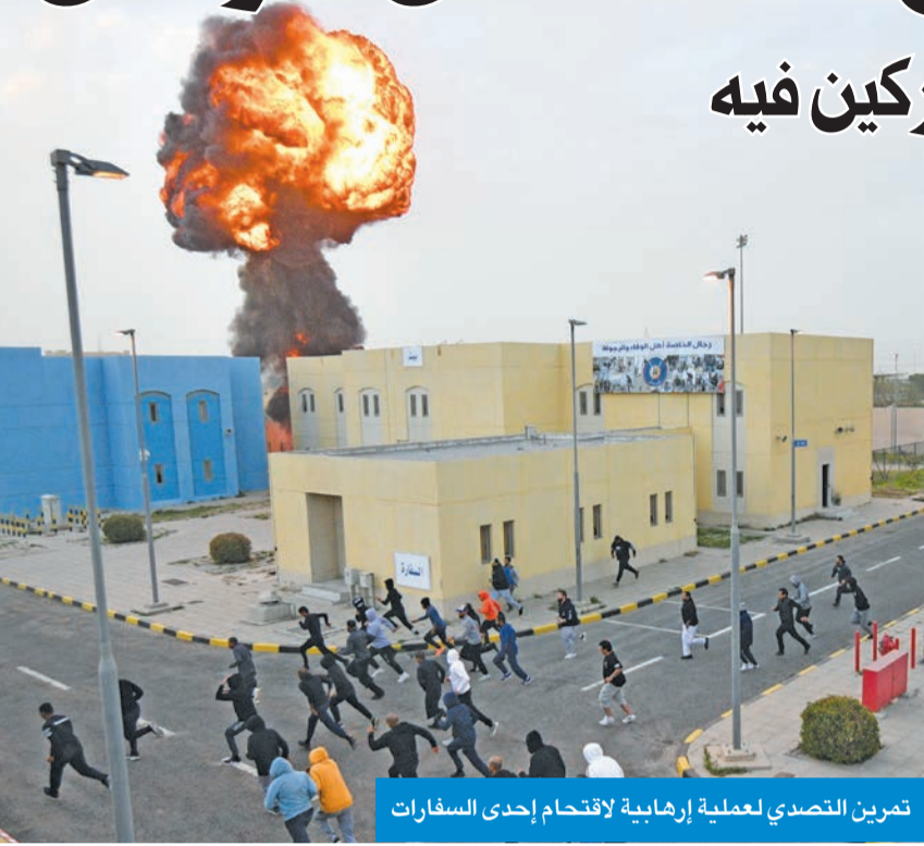
تمرين التصدي لعملية إرهابية لاقتحام إحدى السفارات

رعى ختام فعاليات تمرين «الردع الحاسم 6» وأشاد بجهود المشاركين فيه