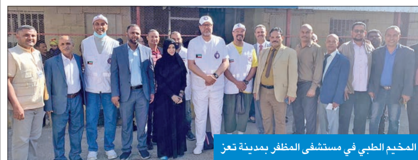
المخيم الطبي في مستشفى المظفر بمدينة تعز