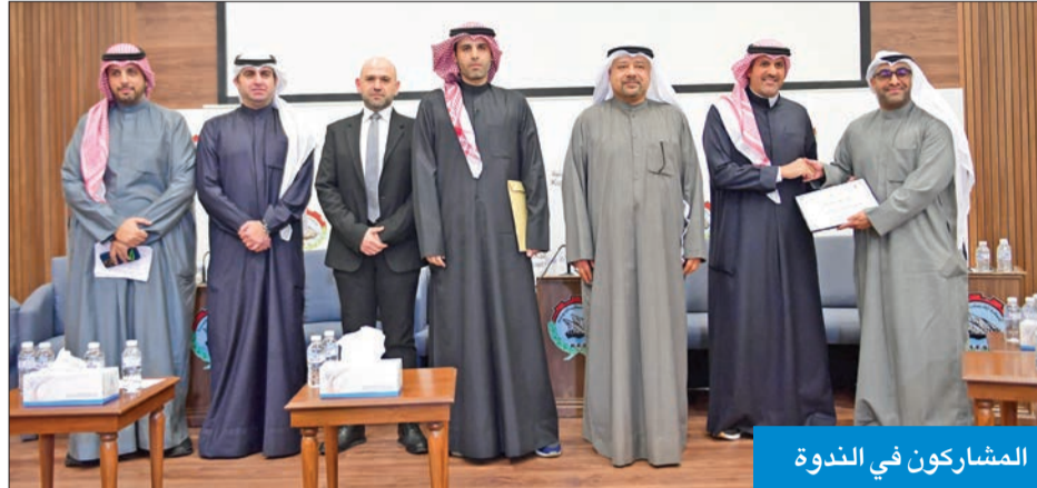
المشاركون في الندوة

خلال مشاركته في ندوة «التشريعات المستقبلية وخطة التنمية 2035»