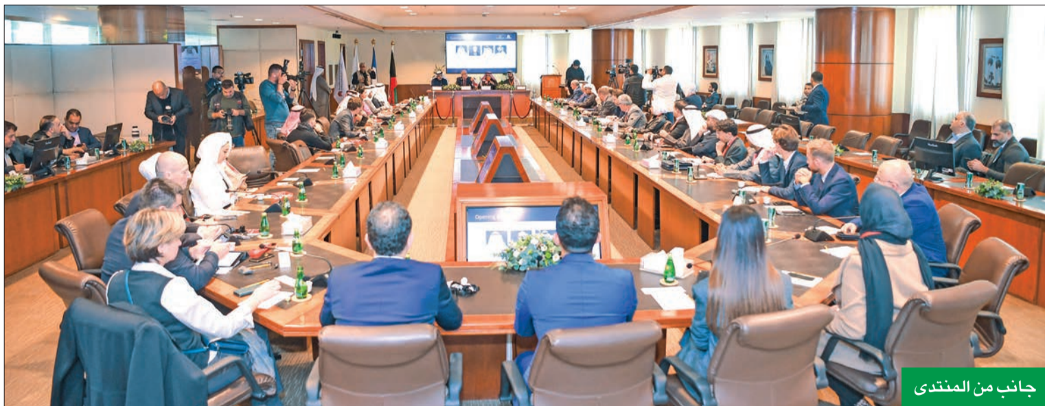
جانب من المنتدى