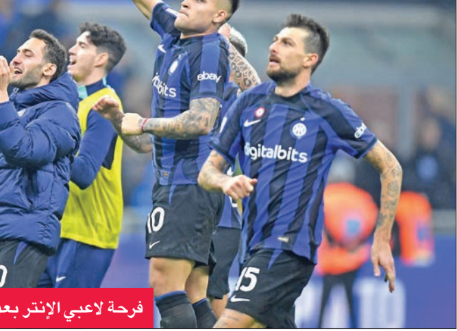
فرحة لاعبي إنتر بعد نهاية المباراة