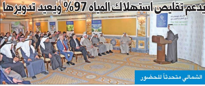
الشمالي متحدثاً للحضور

إضافة إلى عناصر التغذية اللازمة وإعادة تدوير المياه، وذكر أن نظام الزراعة الهوائية لا يتقيد بموسم