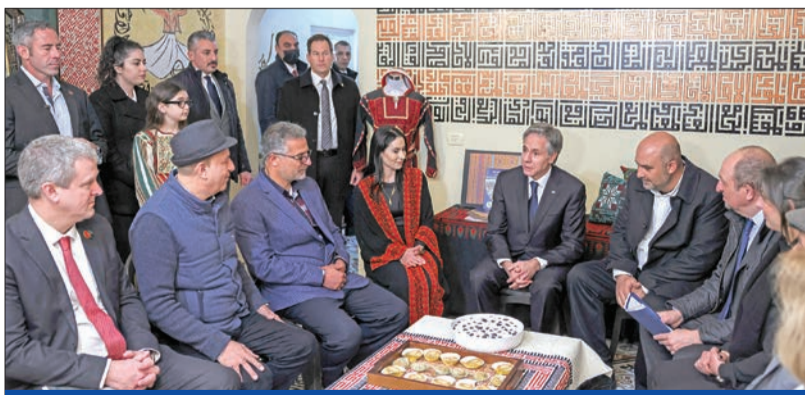
بليتنك يلتقي نشطاء بالجمع المدني الفلسطيني في رام الله أمس الأول

منذ عام 2007 بعد اشتباكات دامية سيطرت بنتيجتها «حماس» عسكرياً على قطاع غزة، وطردت حركة فتح منه. وفشلت كل محاولات المصالحة بين الحركتين خلال السنوات الماضية.