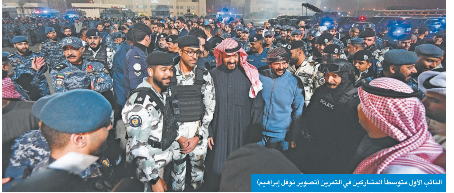
النائب الأول متوسلاً المشاركين في التمرين