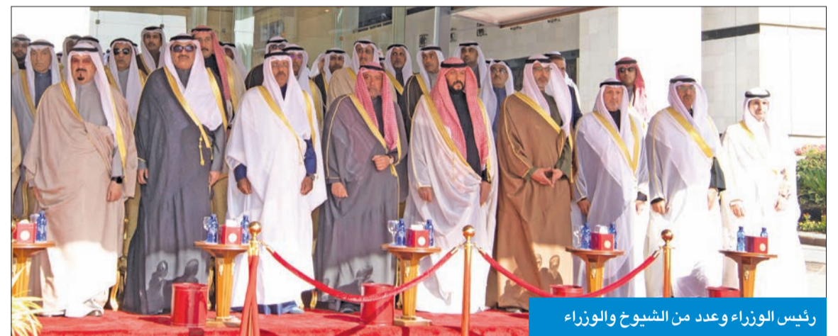
رئيس الوزراء وعدد من الشيوخ والوزراء