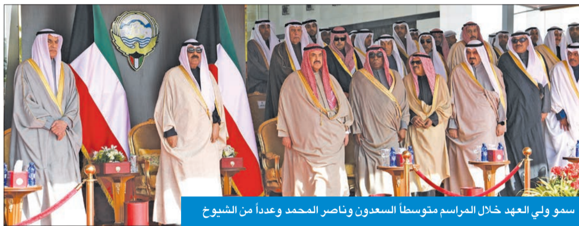
سمو ولي العهد خلال المراسم متوسلاً السعودون وناصر المحمد وعدداً من الشيوخ

بسموه، كما استقبل ممثل سموه بكل حفاوة وترحيب من منتسبي الجيش والشرطة والحرس الوطني، ثم قام ممثل سموه برفع علم الدولة، وتم عزف النشيد الوطني.