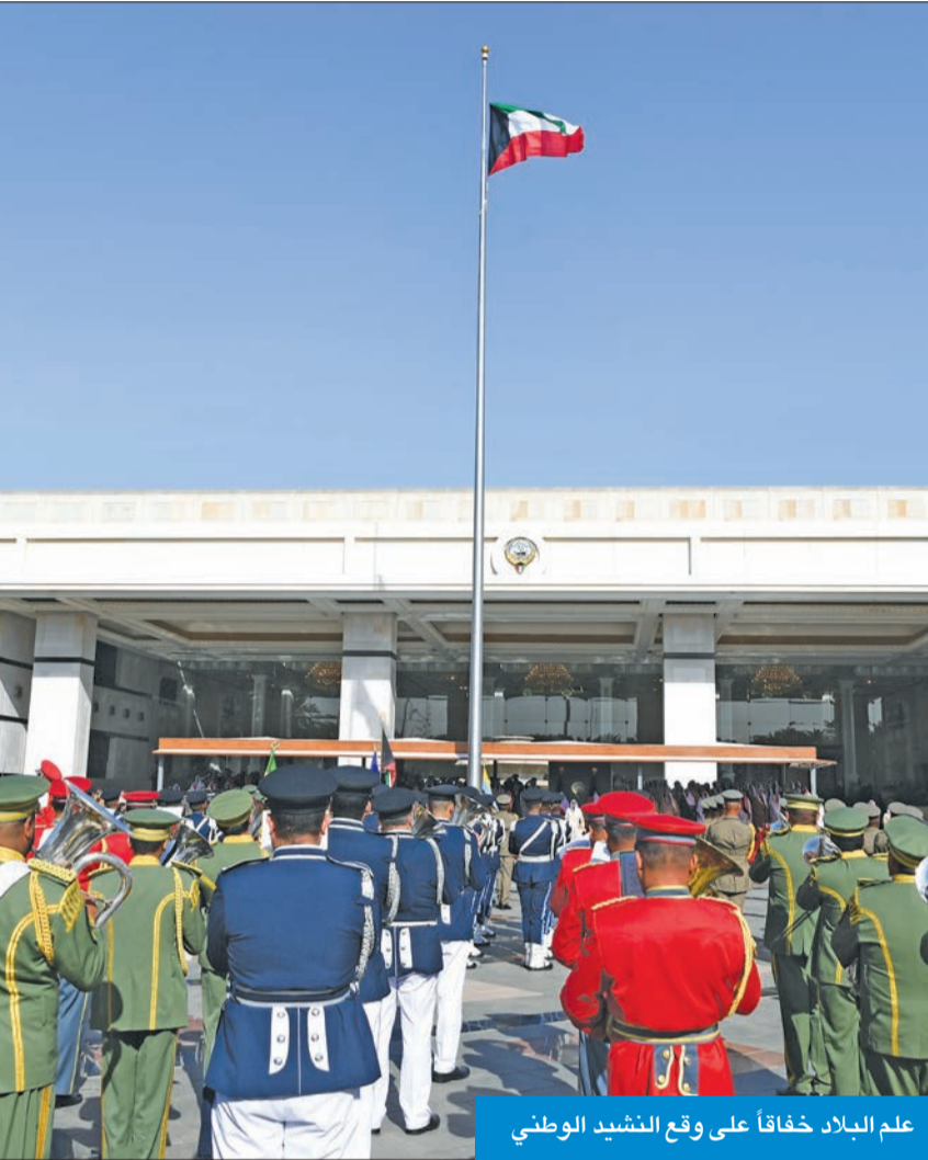
علم البلاد خفاقاً على وقع النشيد الوطني